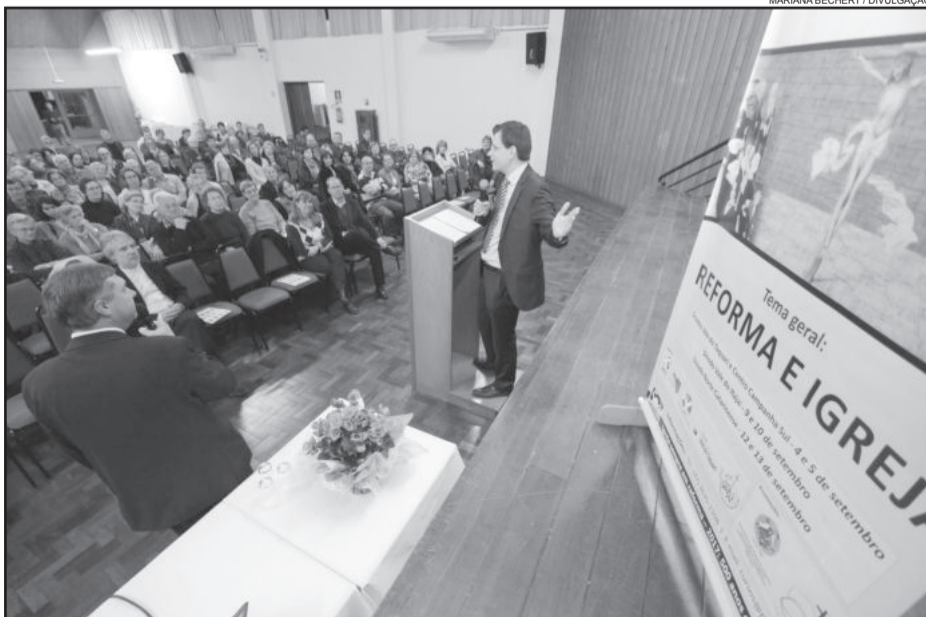
Cerca de 150 pessoas, representando as 59 comunidades do Sínodo Vale do Taquari, participaram do evento