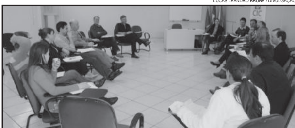
Reunião de planejamento da Festa de Maio

A Festa de Maio de 2014 é uma promoção da Administração Municipal de Teutônia, em parceria com a CIC Teutônia. Outros parceiros, apoiadores e patrocinadores serão engajados ao longo das tratativas. O lançamento está previsto para março e as próximas reuniões serão agendadas pela comissão.