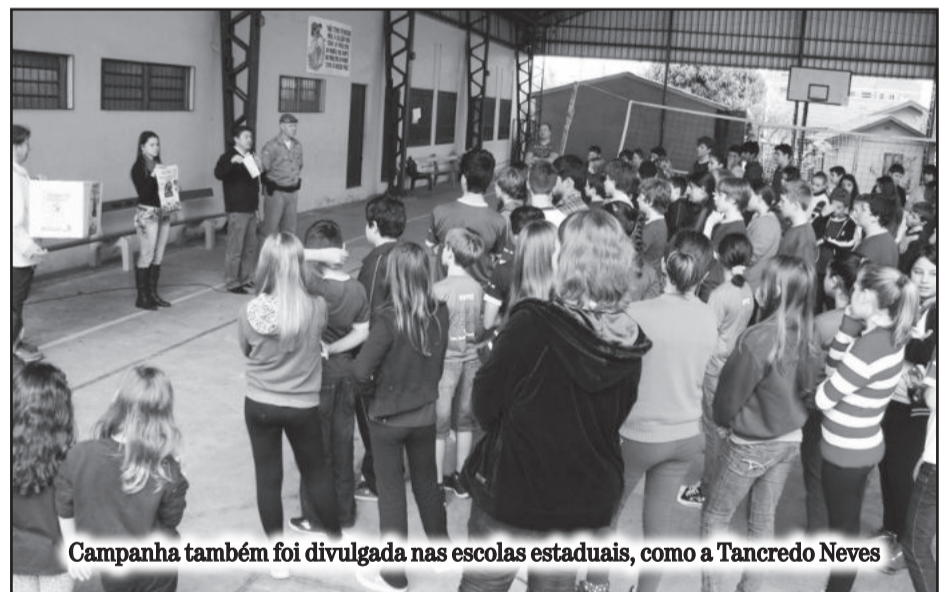
Campanha também foi divulgada nas escolas estaduais, como a Tancredo Neves