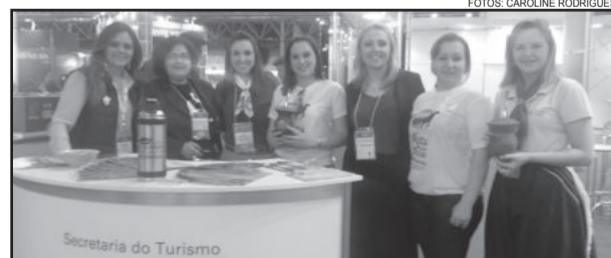
Representantes da Serra Gaúcha, Vale do Taquari, Cambará do Sul, Rota das Terras e Setur-RS na Abav

A 41ª Feira de Turismo das Américas - Abav 2013 segue até o domingo, dia 8.