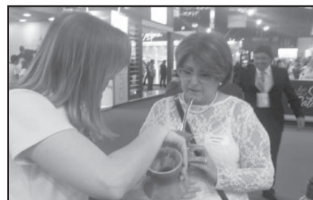
Visitantes conhecem mais sobre o chimarrão