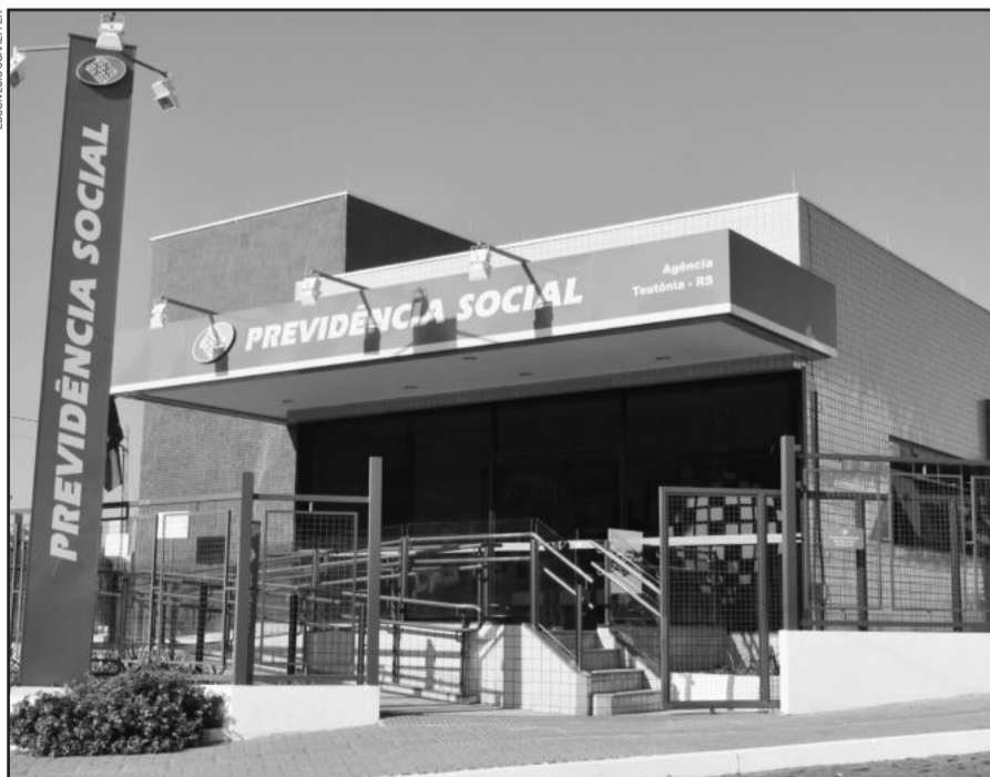
Nova agência será inaugurada segunda-feira, às 15 horas

Nesta segunda-feira, dia 9, será inaugurada a nova agência da Previdência Social em Teutônia. O ato solene inicia às 15 horas, nas novas dependências da agência, sita à Avenida 1 Norte, 315, esquina com a Rua 2 Leste, os fundos do Ministério Público, Bairro Centro Administrativo.