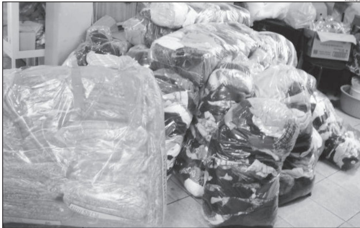
Defesa Civil doou mais de 1.600 itens

sistência Social. Interessados podem comparecer na sede do Cras de segunda à sexta-feira, no turno da tarde.