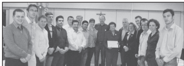
Câmara de Vereadores prestou homenagem para a Loja Rivin pelos 60 anos