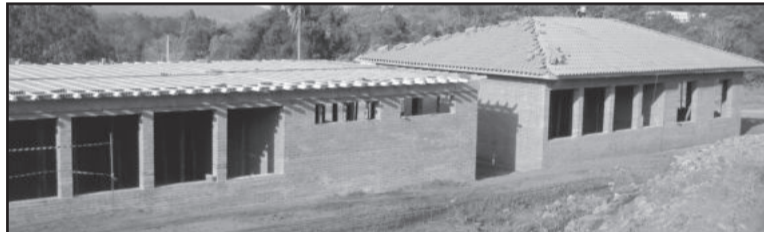
Obra deverá estar pronta em dezembro