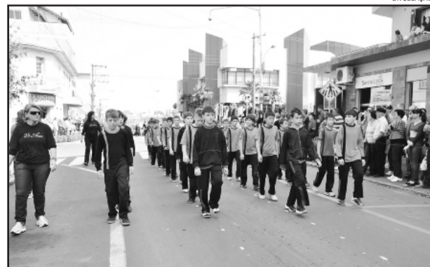
Desfile Cívico de Carlos Barbosa em 2012