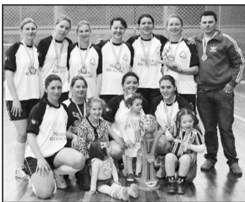
Equipe campeã feminina