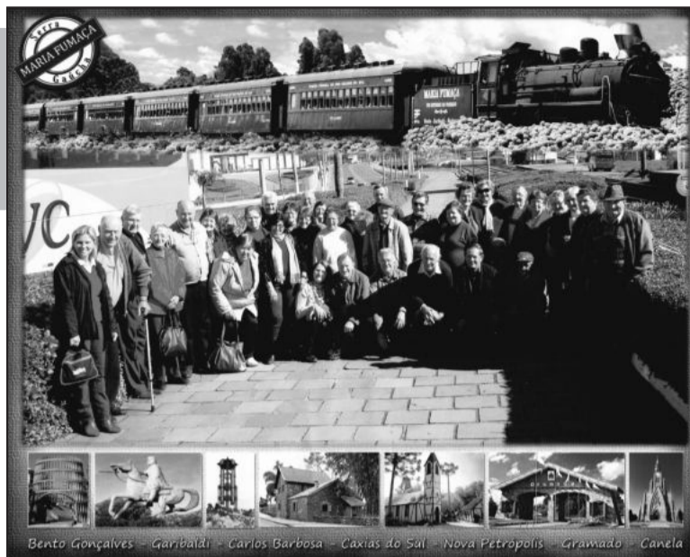
Viagem do grupo Amor Perfeito a Serra culminou com o tradicional passeio de Maria Fumaça

Foi um dia atípico para os integrantes do grupo, mas que não fugiu a essência dos tradicionais encontros da terceira idade, regados a muita festa e alegria.