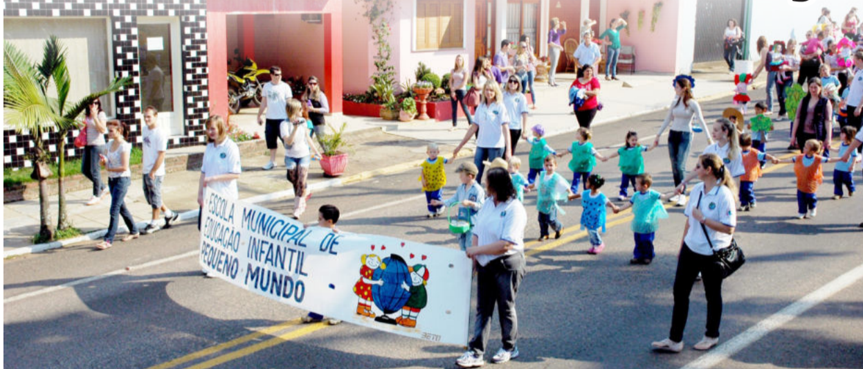
Escolas, Banda Marcial e entidades do município devem desfilarem pelas ruas da cidade

O Desfile Cívico em homenagem à Independência do Brasil ocorre hoje sábado, em Colinas. O evento é realizado pela Secretaria Municipal de Educação, Cultura, Desporto e Turismo. Participarão da atividade escolas, Banda Marcial e entidades do município.