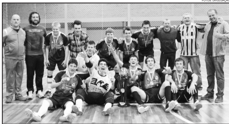
Equipe campeã masculino