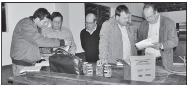
Parceria na produção de pepino é alternativa de renda para agricultores de Taquari