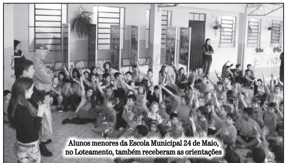
Alunos menores da Escola Municipal 24 de Maio, no Loteamento, também receberam as orientações