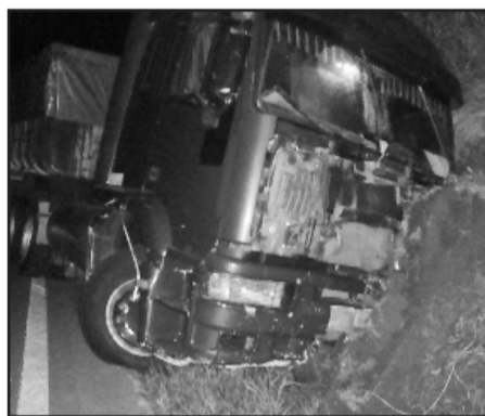
Carreta teve danos de grande monta na parte frontal

O Volvo/FH 520 era um rodotrem que estava com a AET vencida, e por tal motivo foi encaminhado ao depósito de Nova Santa Rita. Já o conjunto tracionado pelo Scania/R 580 era um carreta que como medida administrativa foi retida no pátio da PRF, para descanso do motorista. Ambos foram autuados por desrespeito à lei do descanso do motorista.