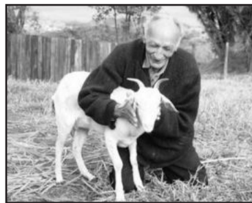
Casório está marcado para o dia 13 de outubro

O homem deixou claro o motivo da decisão de casar-se com a cabra Carmelita. "Ela é muito melhor que mulher porque só come capim, não faz compras