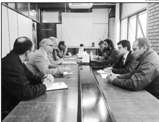
Quarta rodada de negociações teve bons resultados para metalúrgicos