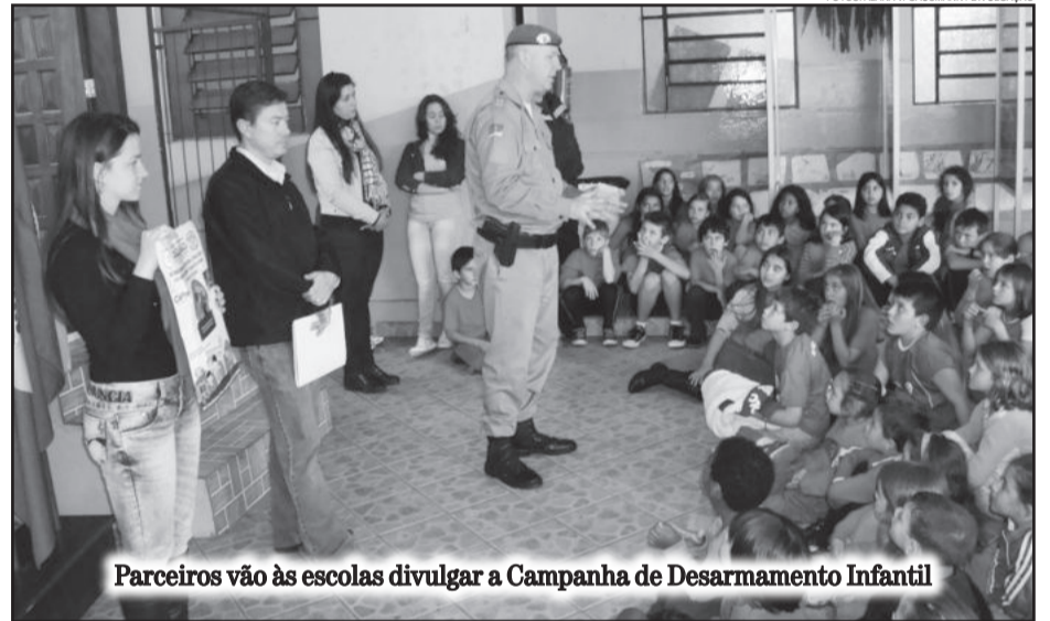
Parceiros vão às escolas divulgar a Campanha de Desarmamento Infantil