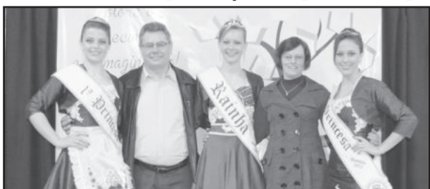
Soberanas com o prefeito e a primeira-dama no lançamento do novo traje oficial