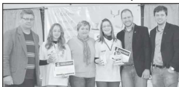
Vencedoras do Concurso de Oratória JCI