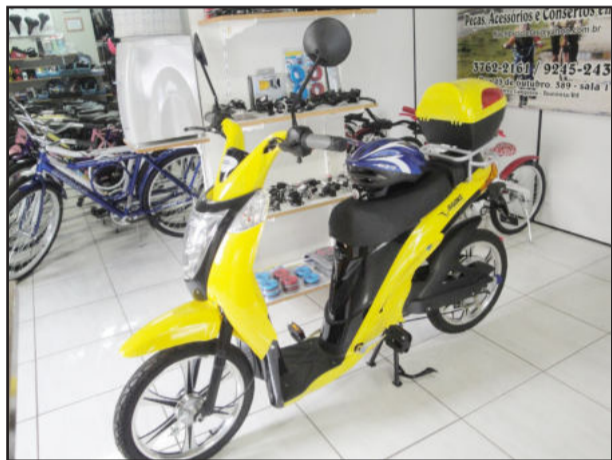
Bicicletas elétricas se enquadram no CTB e estão sujeitas a infrações

Os veículos são passíveis de cumprirem todas as regras de trânsito, sendo necessário que o condutor tenha Carteira Nacional de Habilitação. O veículo ainda deve possuir placa e portar todos os equipamentos obrigatórios. Caso isso não esteja ocorrendo, serão passíveis das