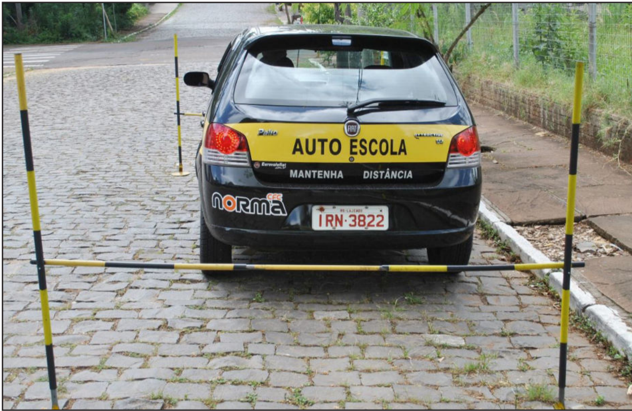
Aulas com o simulador deverão ser antes das aulas práticas de direção

A carga horária teórica obrigatória do curso de formação de motoristas amadores categoria B passará de 45 para 50 horas-aula. A lei foi publicada recentemente no Diário Oficial da União. A medida é uma resolução do Conselho Nacional de Trânsito (CONTRAN). Para a primeira habilitação, foram incluídas cinco horas-aula no simulador de direção. As autoescolas têm até 30 de junho de 2013 para se adequarem à nova grade.