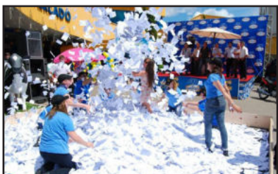
Mais de 2,3 milhões de cupons participaram do sorteio.