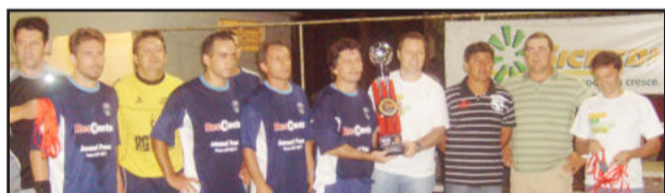
AJUPA/Amauri Pneus/Escritório Chagas, 2º lugar no Veterano