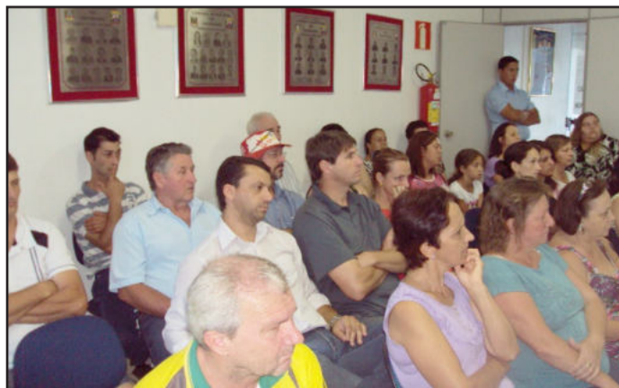
Público em grande número na primeira sessão do ano de 2013