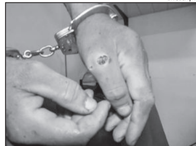
Suspeito foi preso na Capela de São Roque, no interior de Cotiporã, com três ferimentos provocados por arma de fogo, sendo um na cabeça, um no antebraço esquerdo e outro no polegar esquerdo

Ele negou qualquer participação no assalto e não explicou os ferimentos pelo corpo. Ele foi medicado e autuado em flagrante na Delegacia de Polícia de Cotiporã. Segundo o comando da BM há fortes indícios que ele seja um dos integrantes da quadrilha que participou do assalto. O suspeito está preso no Presídio Regional de Nova Prata.