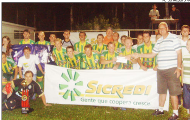
Posto da Dani/Imb. Líder/Trans. Tomasi, campeão no Força Livre

No Força Livre, apenas o Saidera/Milkparts, 2º colocado em 2012, se mantém na competição, e tem seu primeiro confronto nesta sexta, pela chave "A" da categoria. A categoria Feminino não esteve presente no Abertão da Languiru em 2012 e terá seu retorno neste ano, e as duas equipes que terão a honra de darem início aos jogos desta categoria são Só Alegria e Amigas da Mega/Mercado Guri. Lembrando que os jogos terão início às 19h30min desta sexta-feira, dia 11.