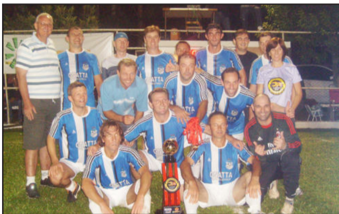
Los Gringos/Vinhos Bortolini/Vinhos Agostini, campeão no Veterano