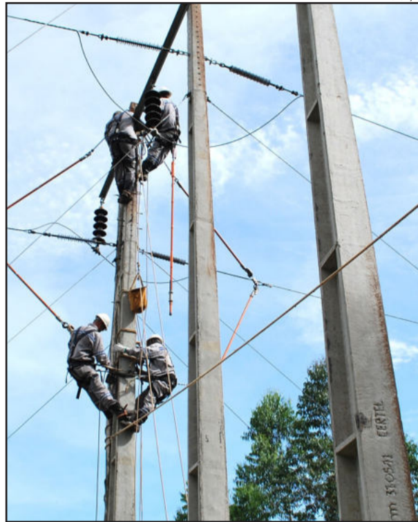
Modernização da rede entre Teutônia e São Pedro da Serra

O ano de 2012 foi de grandes investimentos para a Certel Energia, que conta com mais de 58 mil associados consumidores distribuídos em 47 municípios gaúchos. A cooperativa destinou uma cifra de R$ 17 milhões para a melhoria de seu sistema elétrico, elevando a confiabilidade das redes que conduzem este insumo tão importante para o desenvolvimento socioeconômico.