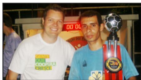
Saidera/Milkparts, 2º lugar no Força Livre