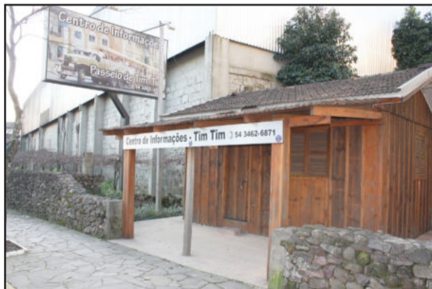
Secretaria está contratando estagiários para a função de atendimento ao turista de Garibaldi