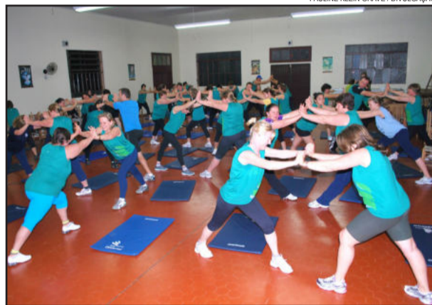
Atividade física é um dos ingredientes para o sucesso

A Certel Energia já abriu as inscrições para a 20ª edição do programa de reeducação alimentar Peso Leve. Neste primeiro semestre de 2013, o programa contemplará os municípios de Marques de Souza, Teutônia, Lajeado e Arroio do Meio. Em Marques de Souza, às segundas-feiras, das 18h30 às 20h30, na Sociedade União Centenária. Em Teutônia, às terças, das 18h30 às 20h30, no salão da Comunidade Católica Cristo Rei, no Bairro Languiru. Em Lajeado, às quartas, das 15h às 17h, no salão da Paróquia São Cristóvão. Em Arroio do Meio, às quartas, das 18h30 às 20h30, no Centro Cultural. Inscrições nas Lojas Certel dos quatro municípios, até o dia 15 de fevereiro. Cada grupo deve ter o mínimo de 50 inscritos.