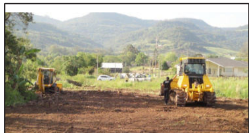
Abertura da rua Reinoldo Dahmer até rua Carlos Schroer Filho