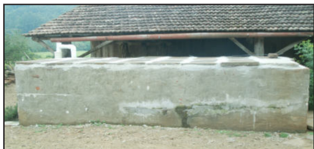
Cisterna é uma das formas de reutilizar a água