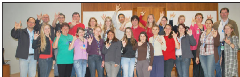
Na Certel, funcionários também se preocupam com a inclusão

la do Bairro Alesgut, o curso é voltado para os alunos ouvintes e surdos e comunidade escolar. Em Canabarro, as aulas são direcionadas à comunidade, aos pais e professores.