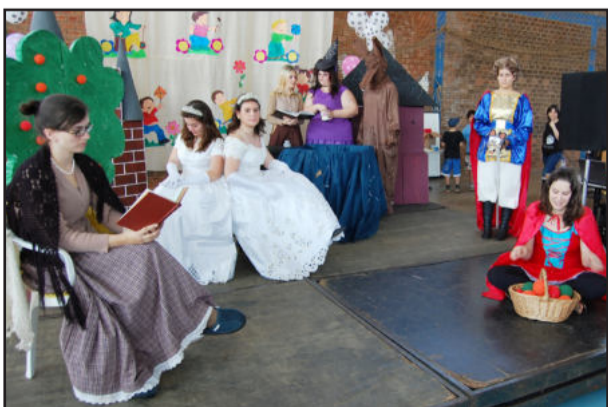
Mostra de Trabalhos iniciou quarta e foi até ontem