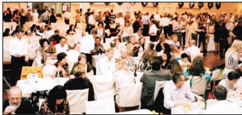
Pratos servidos são todos à base de peixe