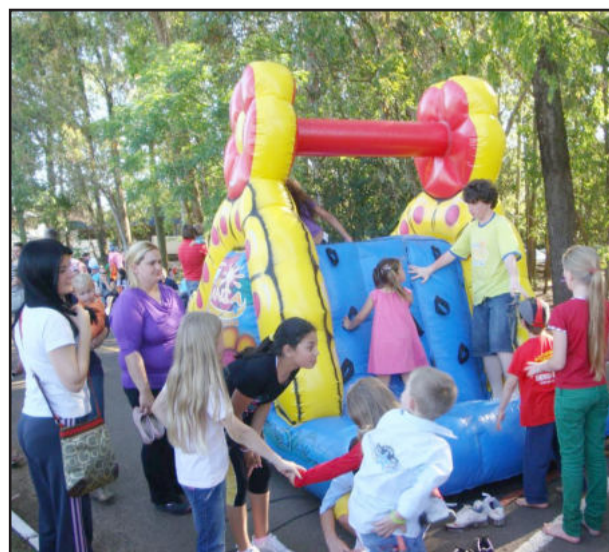
Programação para a criança no dia 12 de outubro