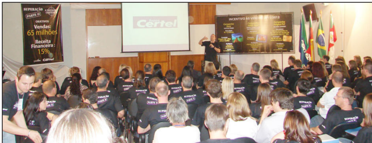
Mais de 100 pessoas e gerentes das Lojas Certel acompanharam a palestra

Ex-capitão do BOPE que inspirou o personagem do Capitão Nascimento no filme "Tropa de Elite", Paulo Storani, foi o palestrante da Convenção de Vendas da Certel