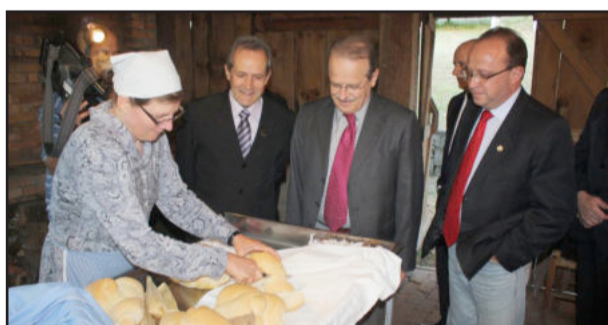
Visita ao memorial da Colonização Italiana