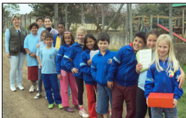
Alunos entregando material educativo aos moradores