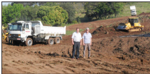
Abertura de loteamento