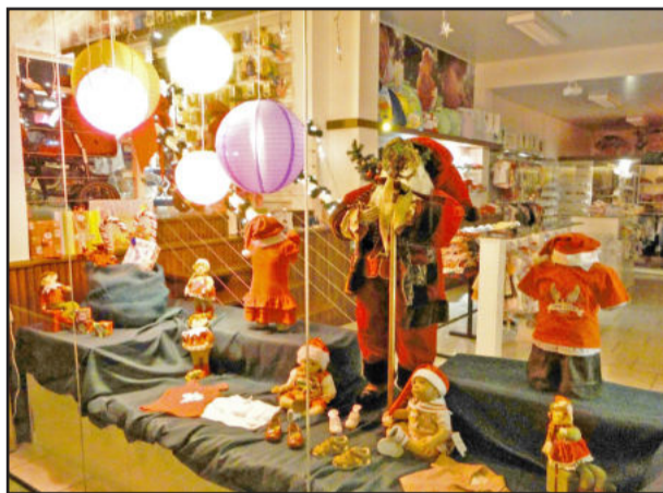
Infantine foi a ganhadora de 2010

O resultado do concurso será divulgado no dia 28 de dezembro, às 20h, juntamente com o sorteio da Campanha Nota Fiscal dá Prêmios 2011 - Teutônia Encanta, no Centro Administrativo Municipal. Serão premiadas as três melhores vitrines: 1º lugar um notebook, troféu,