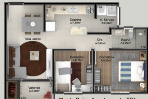
Planta Baixa Apartamento 201 Área Privativa de 56,26m²