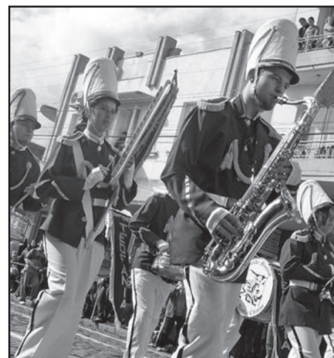
Banda do Teofânia participa hoje do 11º Encontro de Bandas de Garibaldi

A Banda Musical Professor Danilo Chisini foi convidada a participar de mais dois encontros, um em Sapiiranga, no dia 16 de outubro e outro em Cachoeira do Sul, no dia 29 do mesmo mês.