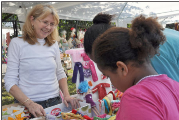
Brique dá aos artesãos oportunidade de incrementar a renda familiar

equipamentos de som para as apresentações. Em caso de mau tempo, os eventos serão transferidos para o próximo domingo, dia 15.