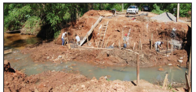
Ponte terá duas pistas e espaço exclusivo para travessia de pedestres