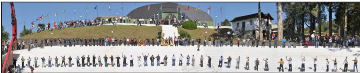
Ensaio para o sabrage já deu a dimensão da grandiosidade do evento

Com 30 anos de história, a Fenachamp 2011, espera receber em seus pavilhões um público de 70 mil pessoas. Ao participar da festa, o visitante poderá desfrutar e degustar os melhores espumantes produzidos na Terra do Champanha, além de poder apreciar a gastronomia típica italiana. E tudo isso acompanhado de grandes atrações e shows musicais.