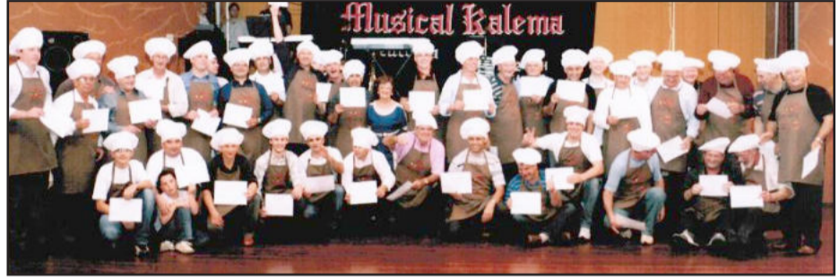
Gourmets que participaram em edição anterior

Neste ano, como nos anos anteriores, chefs de cozinha voluntários de Teutônia, da região e de Porto Alegre prepararão saborosos pratos da gastronomia nacional e internacional, para a 10ª edição do tradicional jantar Homens na Cozinha, ocasião em que demonstrarão, mais uma vez, grande solidariedade e generosidade