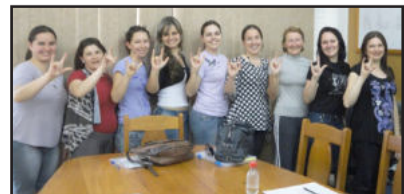
Servidores municipais realizam Curso de Libras

O Curso de Libras é realizado em quatro bairros do município: nas escolas municipais Teobaldo Closs, no bairro Canabarro aos sábados pela manhã, e Leopoldo Klepker, em terças-feiras pela manhã e sextas-feiras à tarde, no Bairro Alesgut. Há também uma turma na Prefeitura de Teutônia, em quintas-feiras, após o expediente, e outra na Certel em sextas-feiras pela manhã. Na esco-