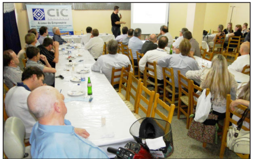
Evento ocorreu no Restaurante Paladar

Schmitz ainda explicou o papel do Comitê de Gerenciamento da Bacia Hidrográfica Taquari-Antas, que tem como objetivo articular as 119 unidades políticas que a entidade abrange na região. A instituição foi fundada em 1998 e possui área territorial de 26.268m 2 , com população aproximada de 1,2 milhão de habitantes. O Comitê é formado por 20 representa-