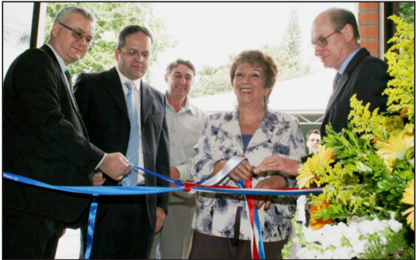
Autoridades fizeram o tradicional "corte da fita"

Os usuários terão acesso, além da farmácia básica, a medicamentos manipulados, homeopáticos e fitoterápicos, bem como ao serviço de seguimento farmacoterapêutico.