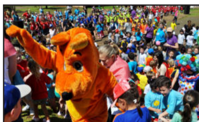
Show com o personagem Txutxucão empolgou a garotada

Piquenique, surpresas e muitas brincadeiras tornaram esta quinta-feira, dia 6, um dia muito especial para as cerca de 550 crianças, de 4 a 6 anos, estudantes das 23 Escolas Municipais de Educação Infantil (Emeis) do município. A 14ª edição do evento, ocorrida no Parque Histórico, contou com uma programação recheada de atividades, que tiveram início pela manhã. Entre elas, destacaram-se a procura da cesta para o piquenique, quando cada escola teve que buscar uma cesta identificada com o nome de seu educandário,