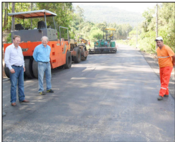
Obra na Transcitrus