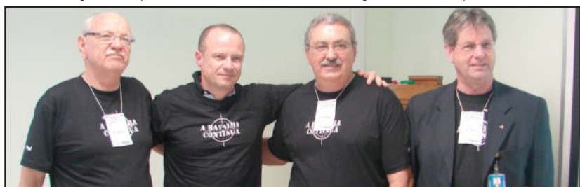
O palestrante com os parceiros da Certel

Ao finalizar, o ex-capitão do BOPE fala sobre a sua participação na Convenção de Vendas da Certel. "Superação é o que nos faz evoluir. A raça humana chegou até aqui, porque soube se adaptar às mudanças de cenário. Se a Certel tomou esta iniciativa que está sendo realizada aqui hoje, é porque querem ser mais do que já são hoje. As pessoas que vão me ouvir hoje vão ver que a Certel só vai ser mais se a consciência delas mudar", concluiu.