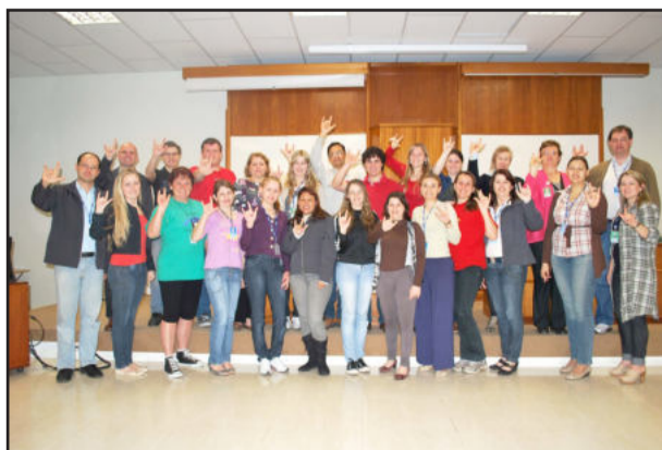
Colaboradores da Certel no curso interno de Libras