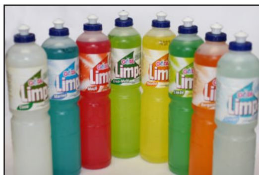
Linha completa de detergentes