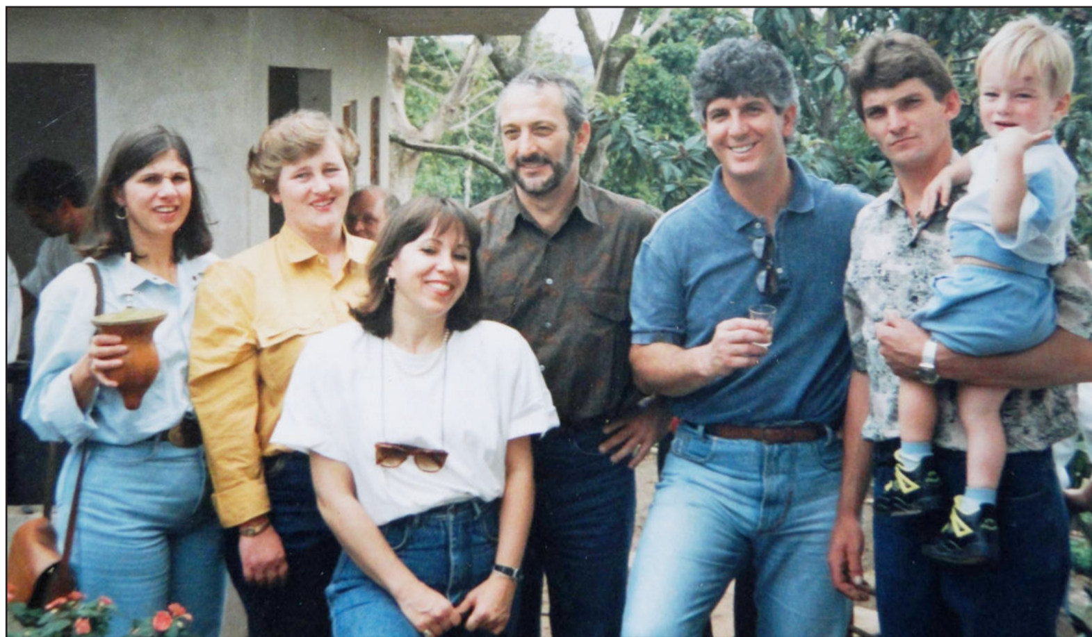
Ganhadora e família com equipe promotora do concurso nacional