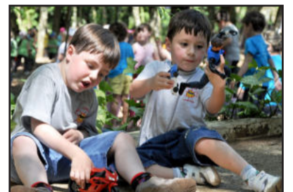
O evento proporcionou diversas brincadeiras às crianças