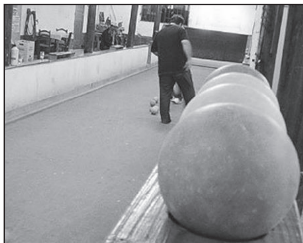
Carlos Barbosa recebe 8º Campeonato Mundial de Clubes de Bocha