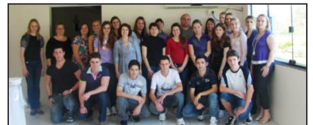
Servidores municipais tiveram curso de atendimento a clientes

O curso contou com dinâmicas, diálogos e vídeos, com o objetivo de desenvolver habilidades pessoais e profissionais, e a finalidade de personalizar e qualificar o atendimento aos clientes internos e externos. O público alvo se sentiu à vontade para participar e opinar sobre os assuntos destacados. Foram tratados os seguintes assuntos: tipos de clientes e como tratá-los, percepção e diferenças individuais, competência interpessoal e relação com os clientes, como deve ser a postura, a comunicação e a iniciativa.