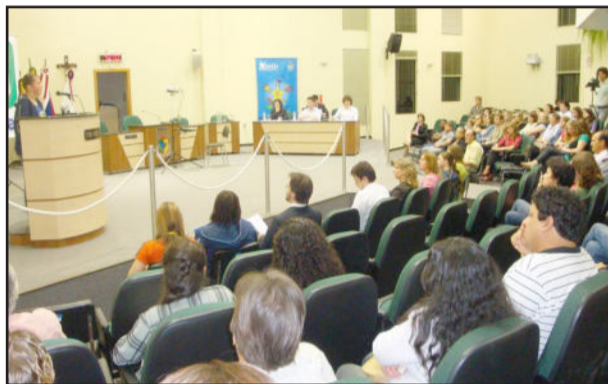
Concurso reuniu 16 finalistas na etapa municipal

A etapa Regional ocorre em Lajeado, no dia 4 de novembro, na Univates.