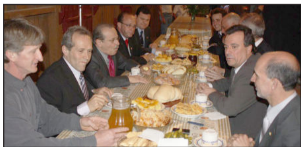
Degustação de Produtos Coloniais no Memorial da Colonização Italiana

o Passaporte, que concede entrada e estacionamento gratuitos em todos os dias do evento, ao valor de R$ 50,00. O horário de funcionamento, nas sextas, é das 18h às 24h, e aos sábados e domingos, das 11h às 24h. Para os moradores de Garibaldi, haverá transporte coletivo gratuito saindo do Terminal Central da Praça da Martini às 14h30min e às 20h.