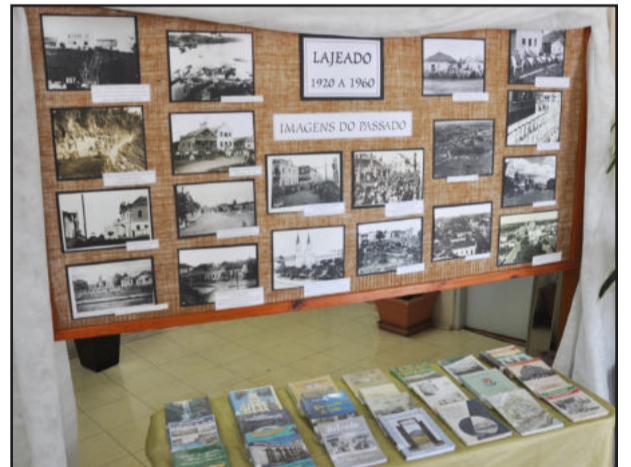
Exposição ficará na biblioteca até o fim de novembro

Já o titular da Secultur, Gerson Teixeira, solicita às pessoas que tiverem interesse em doar fotos antigas de Lajeado para entrar em contato pelo telefone 3982-1087. A exposição está no prédio da biblioteca, podendo ser visitada de segunda a quinta-feira, das 8h às 17h30min, nas sextas-feiras das 8h às 17h e, aos sábados, das 8h30min às 11h30min. Informações pelo telefone 3982-1086.