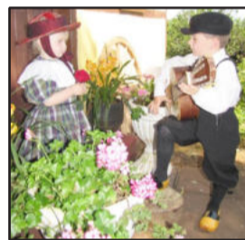
Novas gerações, o mesmo amor pela cultura westfaliana

As fotografias premiadas, assim como as demais, serão expostas na Prefeitura de Westfália, nos dias 17 de novembro a 24 de novembro. O 3º Concurso de Fotografias conta com outra novidade. Além da premiação das três fotografias, que serão selecionadas pelos jurados, o público poderá votar, escolhendo a fotografia de sua preferência, sendo a mais votada premiada. Para mais informações, os interessados poderão acessar o site oficial da Prefeitura, no qual o regulamento do concurso estará disponível.