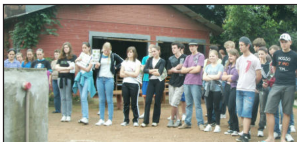
Público assistiu demonstração prática