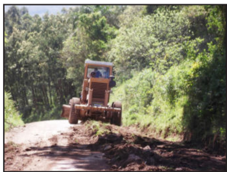
Recuperação de estradas começou por Santa Manoela

A Administração Municipal de Paverama, através da Secretaria de Obras, contratou uma motoniveladora (patrôla) para recuperar as estradas do interior do município. As atividades da máquina foram contratadas por um período de 30 dias, e começaram no dia 26 de setembro, na estrada geral de Santa Manoela. Os trabalhos se estendem às demais estradas do município.