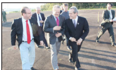
Recepção ao Governador no Aeroclube