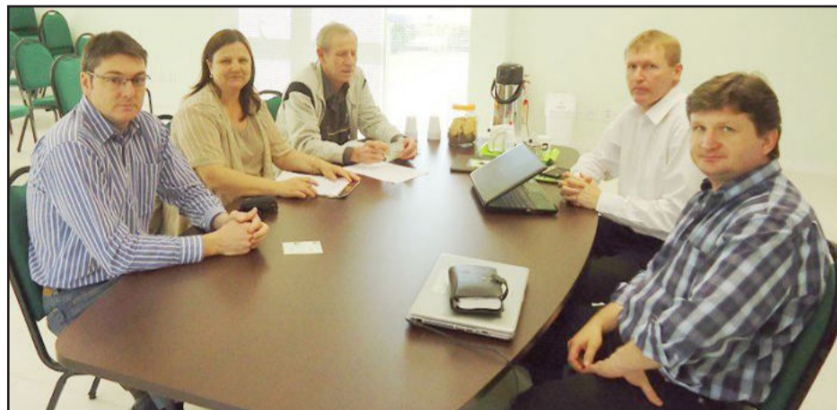
Secretaria da Fazenda realizou visita para a Nutrifarma