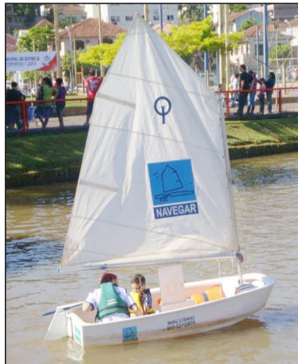
Brincando no Parque terá diversas atrações

Em caso de mau tempo o evento será transferido para o domingo, dia 16.