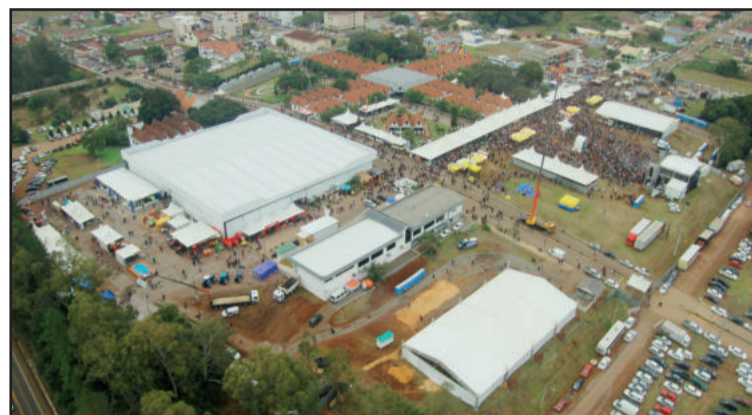
Em 2014, a Festa de Maio reuniu grande público no Centro Administrativo

maio em alusão aos 35 anos do município. Além de eventos culturais, exposição agropecuária e feira comercial, industrial e de serviços, a festa tem sete shows confirmados. Na quarta-feira, dia 25 de maio, o palco da Festa de Maio recebe Paulinho Mixaria e Shana Müller. Na quinta-feira, dia 26, as apresentações abrem com a Orquestra Municipal de Teutônia, e a partir das 20h show nacional com Amado Batista. A sexta-feira, dia 27, é dia de rock com a banda gaúcha Reação em Cadeia. No sábado, mais um show nacional anima o público; a partir das 23h a dupla Munhoz e Mariano sobe ao palco. Fechando a festa no domingo, dia 29, tem a Festa da Família da Popular FM, a partir das 13h30.