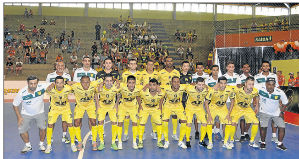
Assoeva, de Venâncio Aires