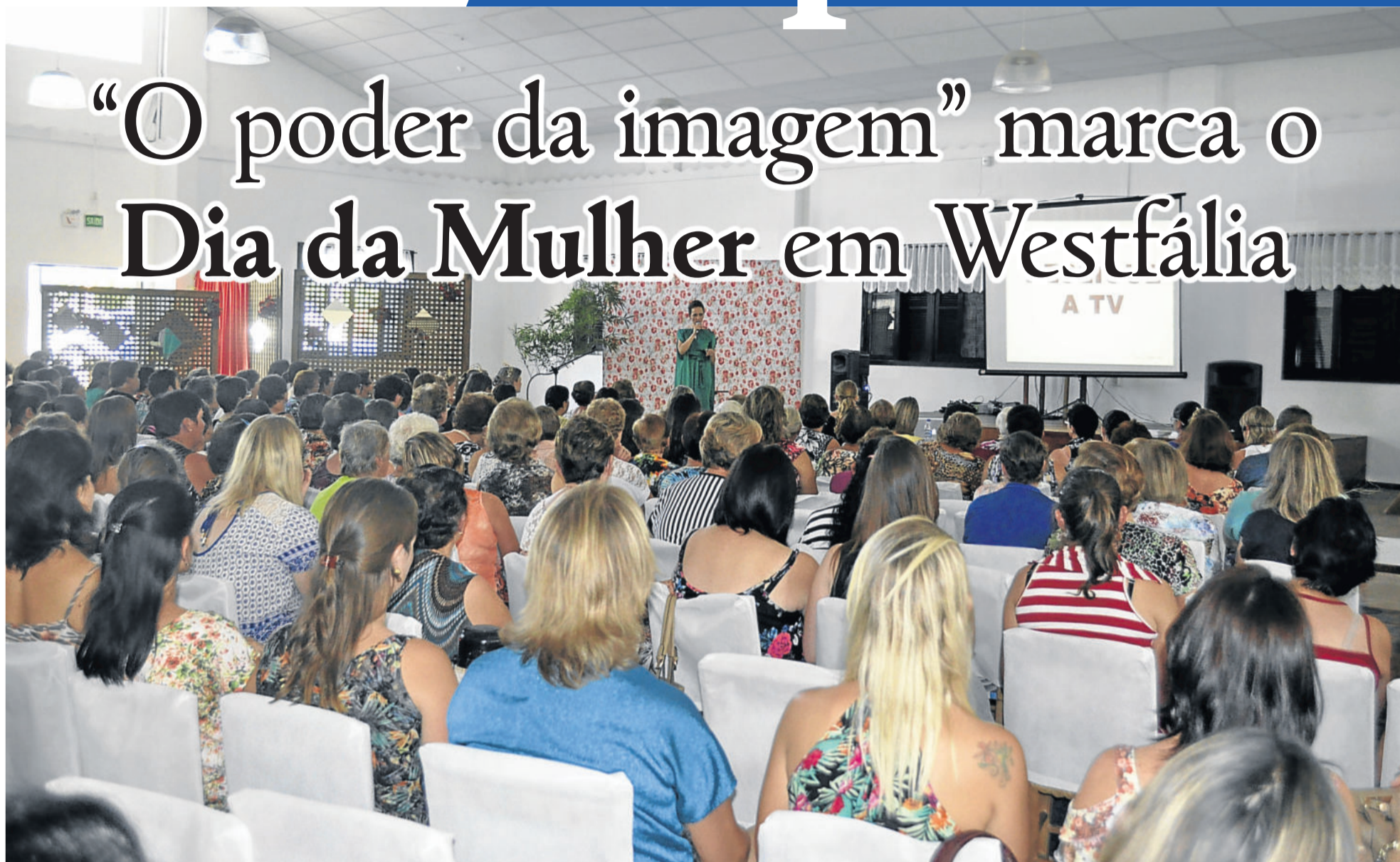
Dia da Mulher Westfaliana já é tradicional no Município. Tema deste ano foi “O poder da imagem para mulheres”. WESTFÁLIA > 2

FESTA DE MAIO SERÁ LANÇADA NA SEXTA-FEIRA