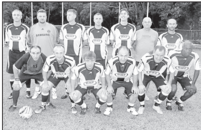
Ta' Lentos DMF tenta a vaga na final do Master

Na rodada da próxima sexta-feira, dia 11, as categorias Master, Veterano, Feminino, Sub-20 e Força Livre definem os seus finalistas. Rodada desta semana inicia às 19h30min, no campo 1 da Associação dos Funcionários da Cooperativa Languiru.