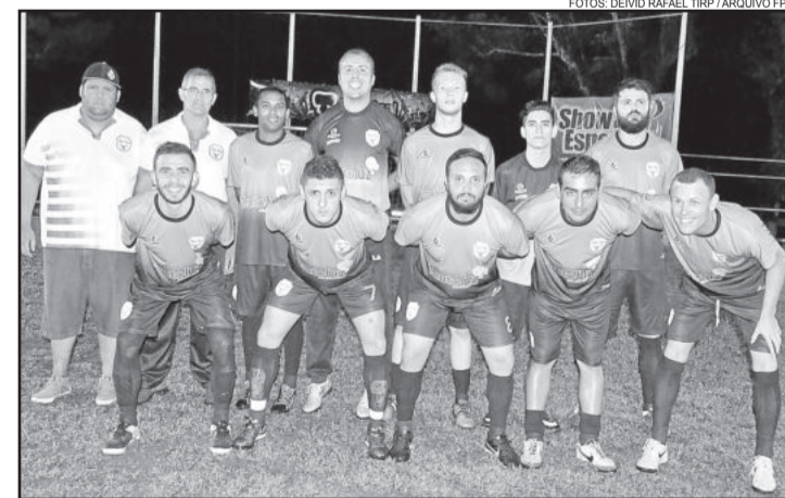
Kaxa Baxa tenta garantir a vaga na final no jogo da próxima sexta-feira