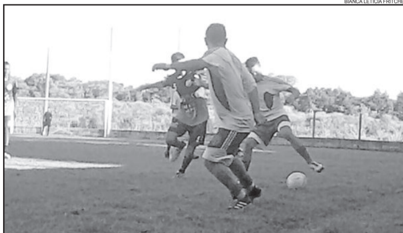
Juventude venceu o Atlético Gaúcho e divide a vice-liderança do grupo