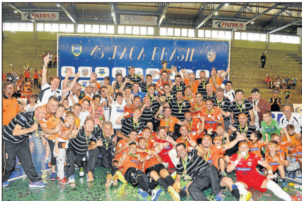
ACBF é tricampeã da Taça Brasil de Futsal