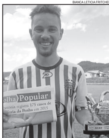
Pantera, do Atlético, foi o craque dos aspirantes