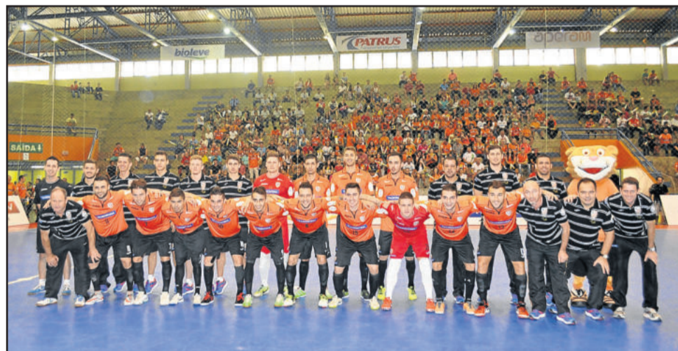
ACBF de Carlos Barbosa