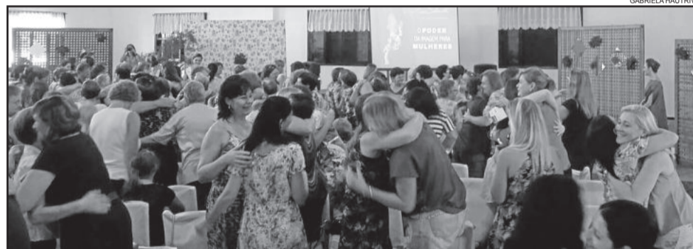
O evento começou com um abraço entre as mulheres