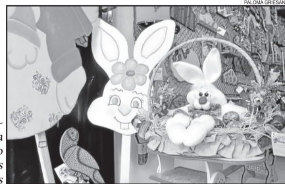
Peças com motivos de Páscoa já estão sendo comercializadas pelos artesãos