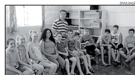
Projeto da Orquestra Sinfônica do IHU (OSIHU)

todas as sextas-feiras, no período da manhã para alunos da 2ª até 5ª séries. O período da tarde é frequentado por alunos das 6ª até 9ª séries.