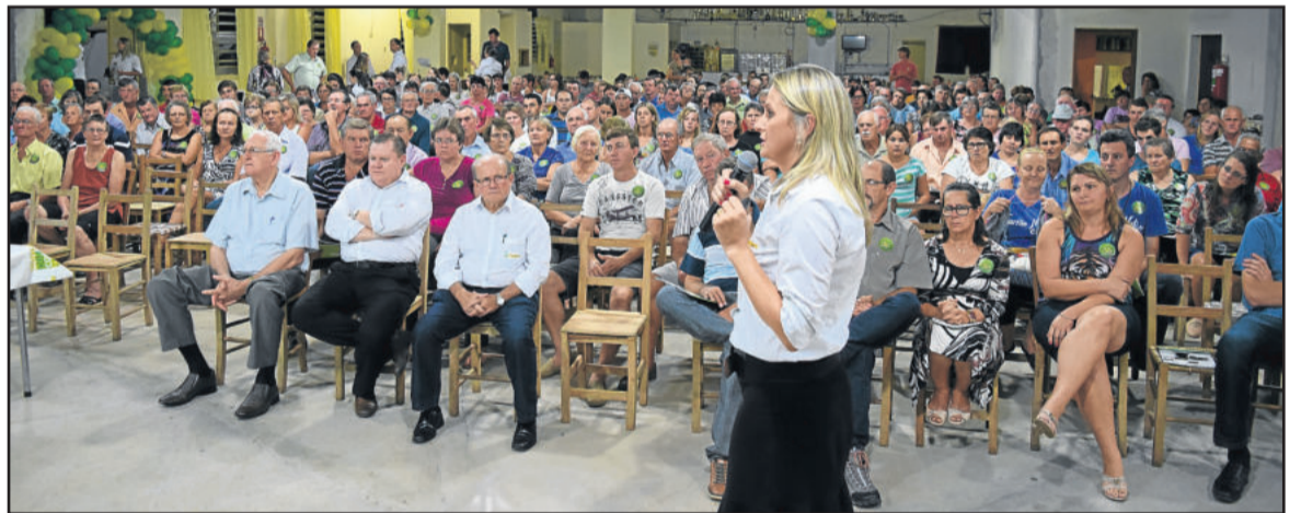
Colinas recebeu assembleia no dia 2 de março

As Assembleias deste ano são festivas junto às comunidades, pois marcam a comemoração dos 35 anos da Cooperativa, que acontece em 2016. Para esta data especial, a Sicredi Ouro Branco lança aos associados uma promoção intitulada Aniversário Premiado. Através da utilização de produtos e serviços, os associados poderão receber cupons para concorrer a dois carros 0km Chevrolet, um Cruze e um Onix, 19 Smart TVs 42" e 19 Home Theaters. A promoção inicia no dia 14 de março e encerra no dia 19 de agosto.