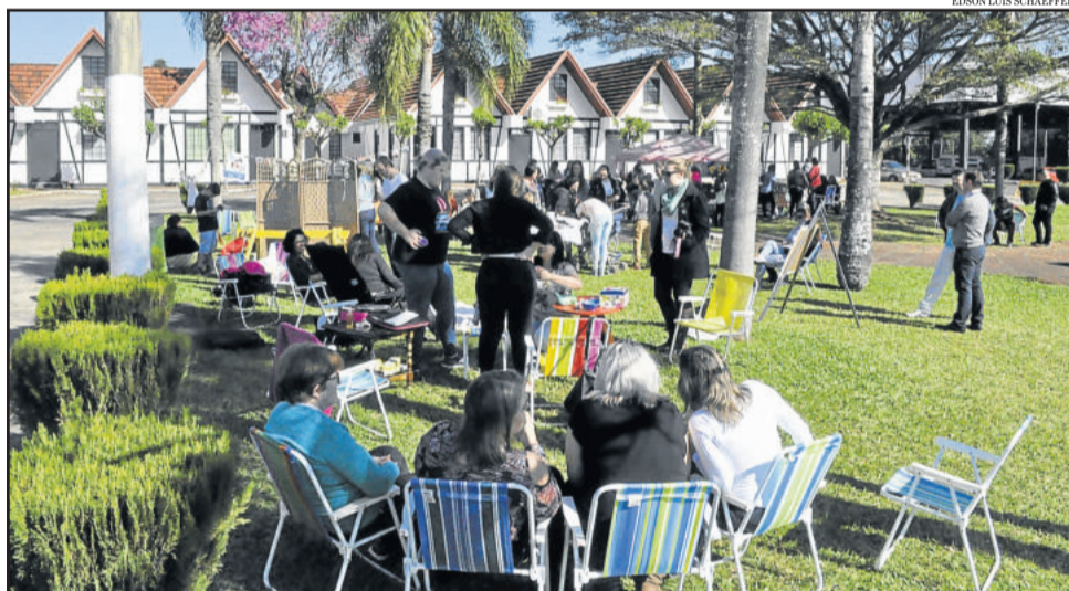
Evento reuniu mães e bebês no Centro Administrativo

A Organização Mundial de Saúde orienta que até os seis meses de idade, os bebês sejam alimentados exclusivamente no peito. Atualmente, 38% das crianças até essa idade são amamentadas apenas com leite materno. A expectativa é que este número chegue a 55% em 2025.