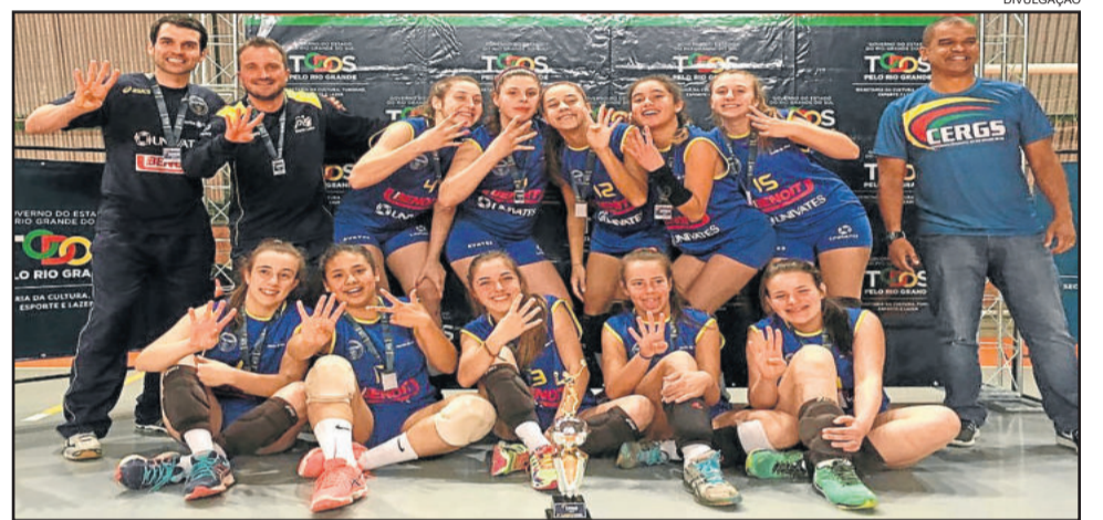
Titulo estadual marca retorno da Languiru/MartinLuther/Avates às competições do segundo semestre