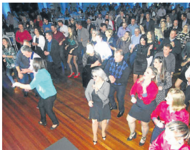
Público dançou até de madrugada

O 7º Jantar-Baile da CIC Teutônia contou com o patrocínio das cooperativas Languiru e Sicredi, além de Lajopisos, Raízes Empório e Arte e Terraplanagem e Concretos Brandão.