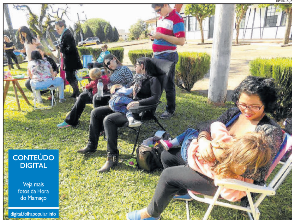
Hora do mamaço buscou incentivar o aleitamento materno