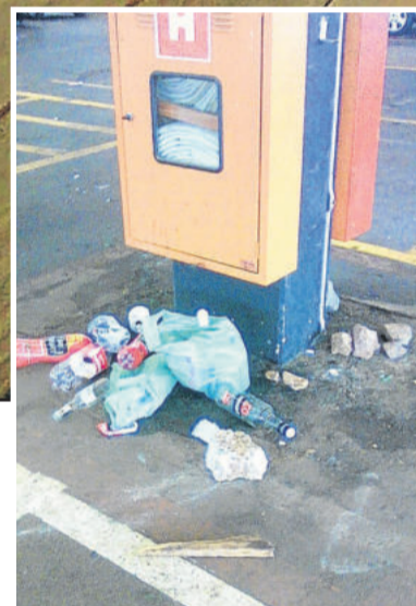
Situação já foi registrada outras vezes

ocorrendo. “Estamos fazendo a nossa parte, com a repressão dos delitos e patrulhamento na via pública”, explica. Para ele, é um problema que está começando a surgir e que precisa ser enfrentando.