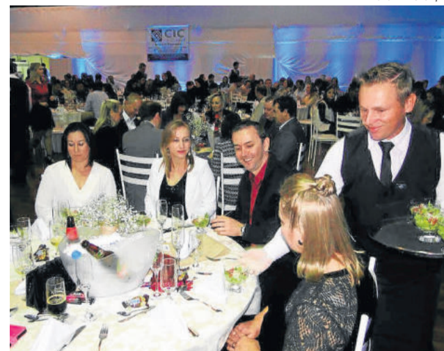
Jantar foi servido à francesa