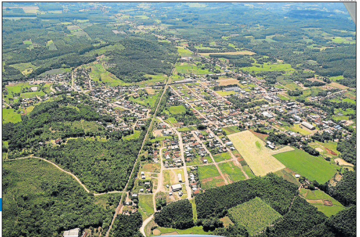
Município de Paverama conta com monitoramento feito pelo Consepro e BM