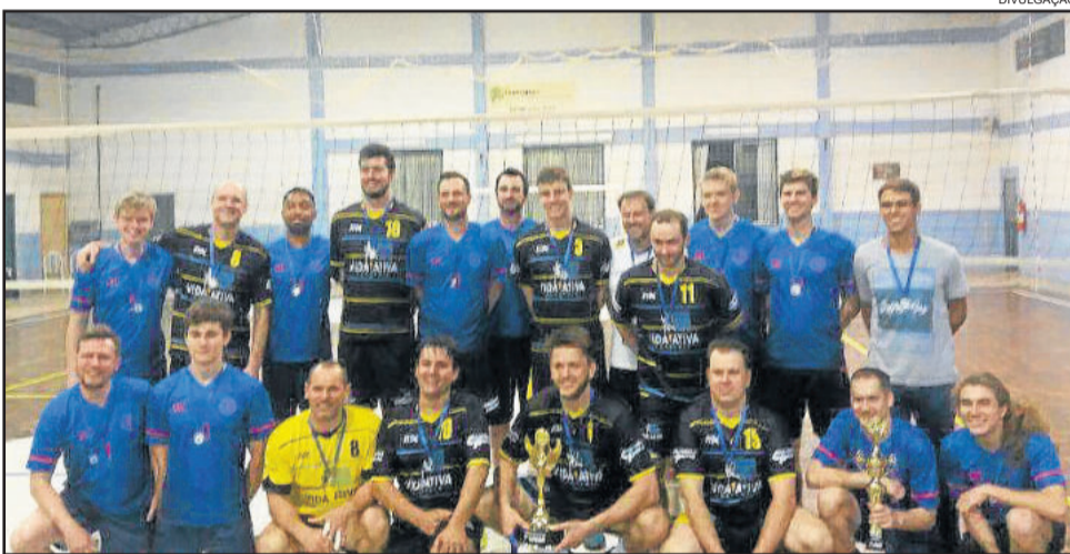
Time de Venâncio Aires (de preto) foi o campeão, o SVC de Ivoti (de azul) foi o vice