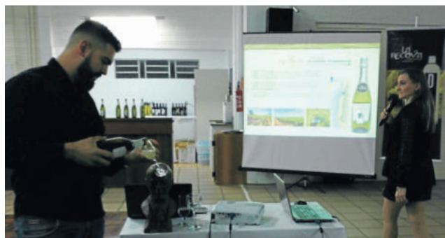
Enóloga fez apresentação das cartas durante a degustação