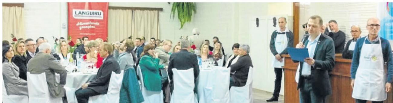
Presidente agradeceu pela participação de todos