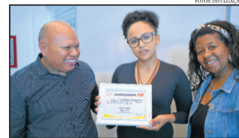
Samaritania (c) recebeu homenagem do partido