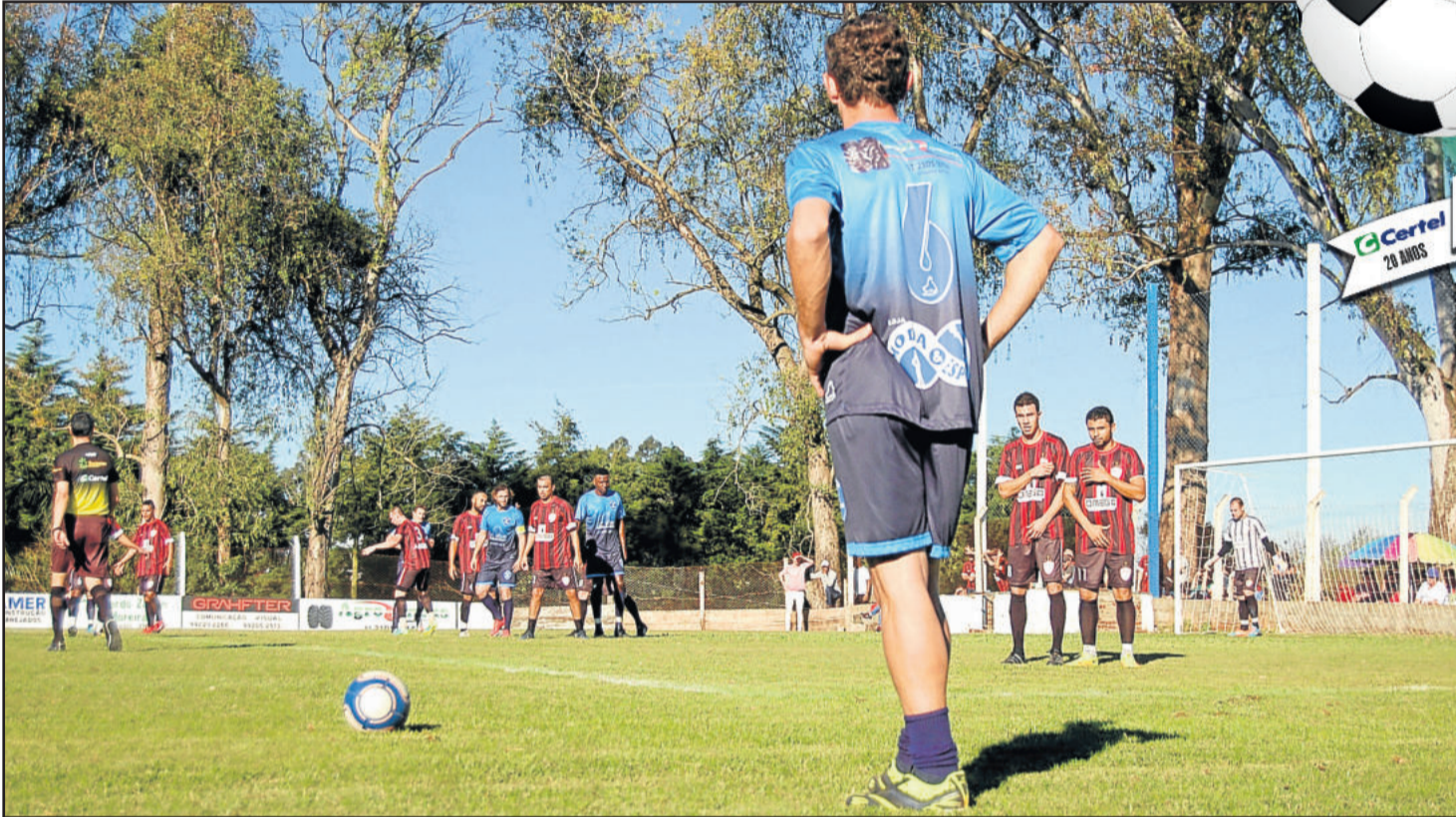
Jar del, do 25 de Julho, tenta marcar em cobrança de falta