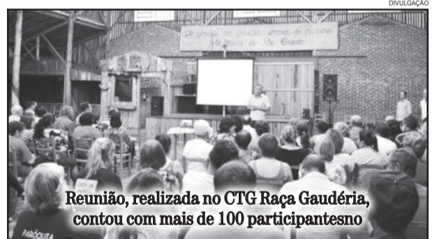
Reunião, realizada no CTG Raça Gaudéria, contou com mais de 100 participantes