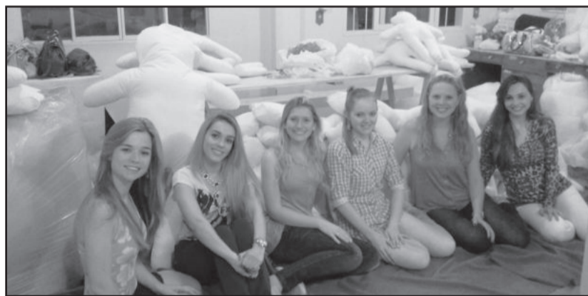
Candidatas a soberanas participaram de oficinas de Natal

de outubro, quando as candidatas receberam o cronograma de atividades de todo o concurso, junto ao auditório da CIC. Para o julgamento das candidatas inscritas será formada uma comissão especial, nomeada pelo Executivo. Para as vencedoras serão conferidos os seguintes prêmios no dia do concurso: R$ 500,00 para a rainha; R$ 300,00 para a primeira-princesa; e R$ 200,00 para a segunda-princesa.