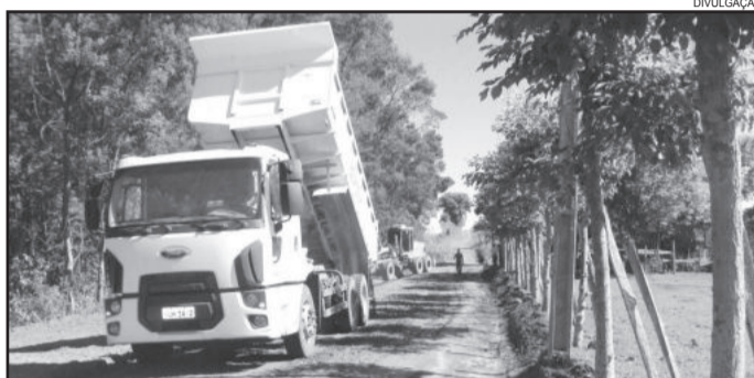
Secretaria de Obras trabalhou em várias frentes, como na Fazenda São José

da região, evitando desta forma o deslocamento de máquinas de um lado para o outro do município”, salienta o secretário.