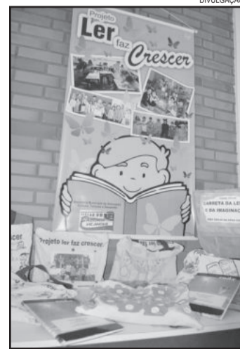
A sacola de leitura é entregue, semanalmente, para cada família