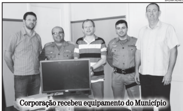
Corporação recebeu equipamento do Município