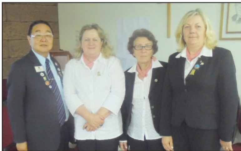
Lions Teutônia presente em curso