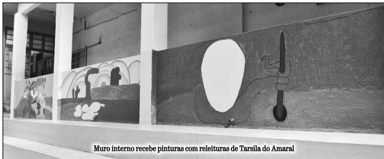
Muro interno recebe pinturas com releituras de Tarsila do Amaral

No ano passado, em projeto semelhante, os alunos das séries finais pintaram o muro externo com releituras das obras de Romero Britto. “A atividade envolve os alunos e dá vida nova à escola. E o mais gratificante é que eles gostam, se sentem felizes em contribuir com a escola”, destacam as coordenadoras.