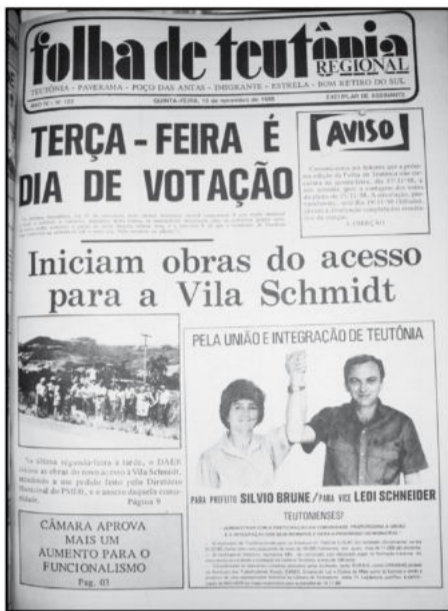
Ortografia mantida conforme edição da época