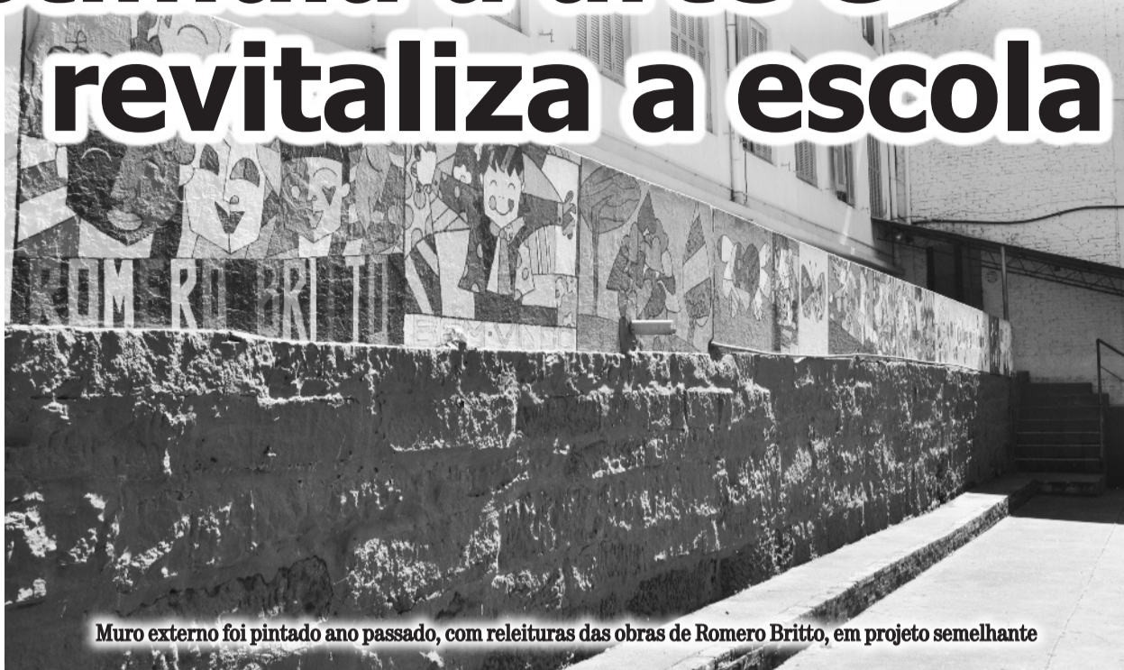
Muro externo foi pintado ano passado, com releituras das obras de Romero Britto, em projeto semelhante

A partir da seleção feita, foi a vez de os alunos pintarem as releituras das obras da artista no muro interno, onde está localizado o ginásio de esportes da escola. Agora, cabe aos alunos da 8ª série dar os últimos retoques.