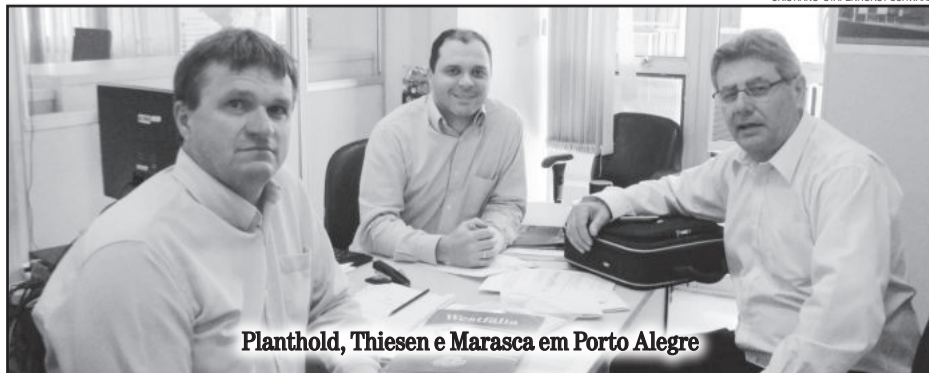
Planthold, Thiesen e Marasca em Porto Alegre