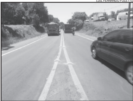
LUIZ FERNANDO FOLETTO

O trecho de 3,6 Km da ERS-130, no perímetro urbano de Lajeado, foi concluído nesta semana. Depois de ter recebido o recapeamento asfáltico no trajeto compreendido entre o viaduto da BR-386 e o entroncamento com a RSC-453, trevo que dá acesso ao município vizinho de Cruzeiro do Sul, a Compasul, empresa vencedora da licitação, realizou a pintura da pista e a colocação de tachões. O início das obras foi no dia 18 de outubro. A pista que apresentava muitos buracos no trajeto, agora tem boas condições de trafegabilidade. O valor da obra é de R$ 740 mil.