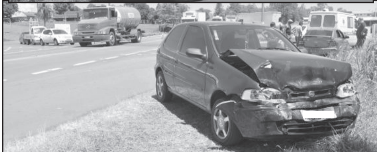
Acidente na tarde de ontem envolveu três veículos