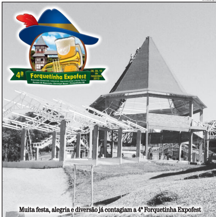
Muita festa, alegria e diversão já contagiam a 4ª Forquetinha Expofest

spark Christoph Bauer". Visitação aos estandes. Lustigen Kamaraden - circulando pelo parque