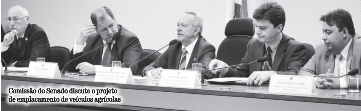
Comissão do Senado discute o projeto de emplacamento de veículos agrícolas