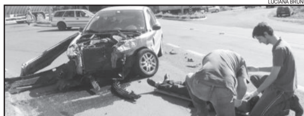
Acidente ocorreu no trevo de acesso ao Bairro Alesgut e Languiru

Três pessoas estavam dentro do veículo da Susepe: o condutor, uma agente e um prisioneiro. Às 17h30min, a Susepe já reconduziu o prisioneiro para o Presídio de Lajeado. O condutor do Peugeot, um homem de 52 anos, saiu ferido e foi levado ao Hospital Ouro Branco.