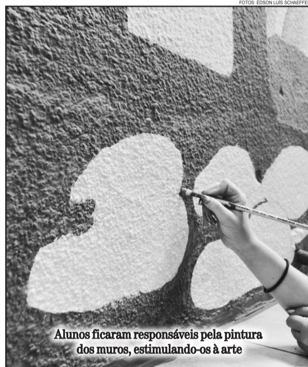
Alunos ficaram responsáveis pela pintura dos muros, estimulando-os à arte