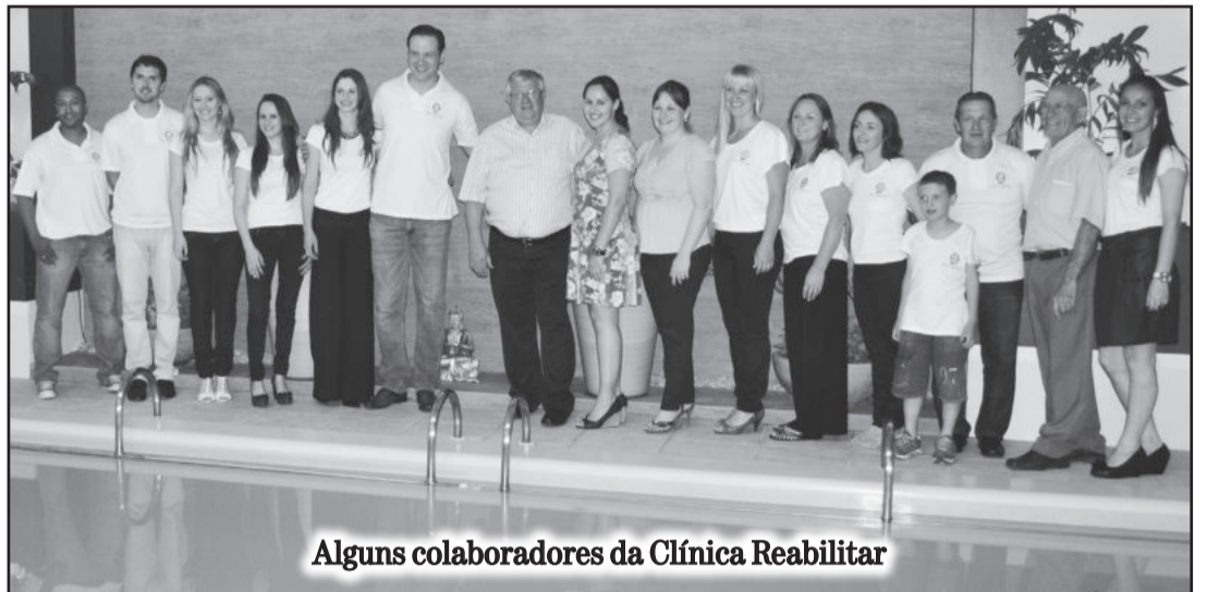
Alguns colaboradores da Clínica Reabilitar

Na noite de quinta-feira, pacientes, clientes, familiares, amigos e comunidade regional foram recepcionados com um coquetel e puderam conhecer as novas dependências, totalmente repaginadas. A Clínica localiza-se na rua 2 Norte, 1049, Centro Administrativo de Teutônia. O telefone de contato é 8130-9158.