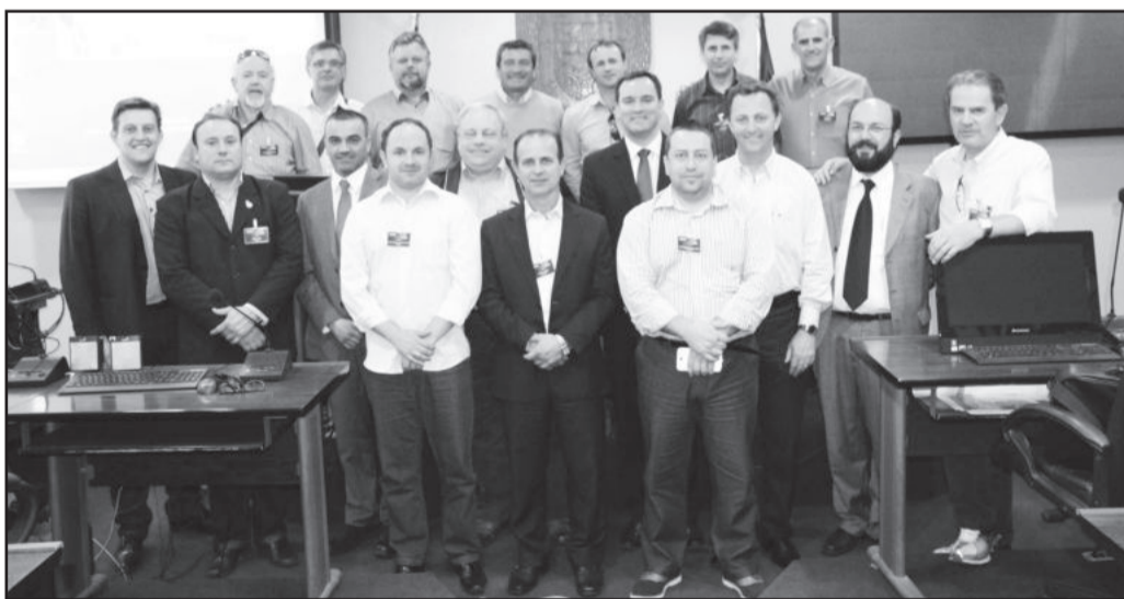
Comitiva de prefeitos que fazem parte da Associação dos Municípios da Encosta Superior do Nordeste (Amesne)