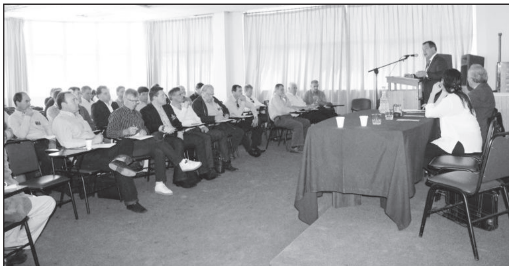
Durante o evento, foram debatidos assuntos sobre saúde, marcando o quinto dia da Missão Técnica ao Chile