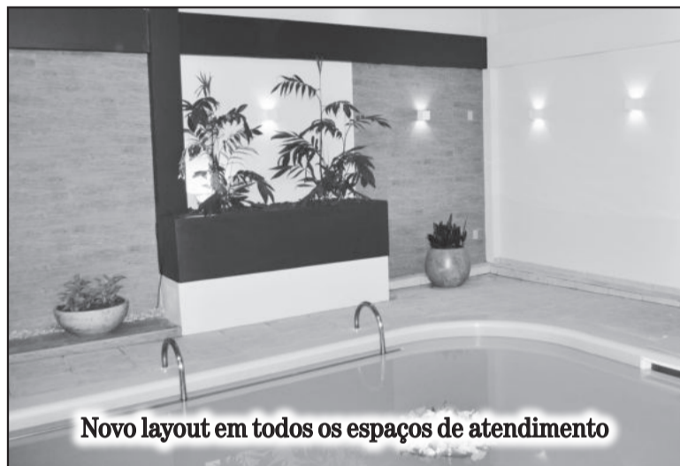
Novo layout em todos os espaços de atendimento