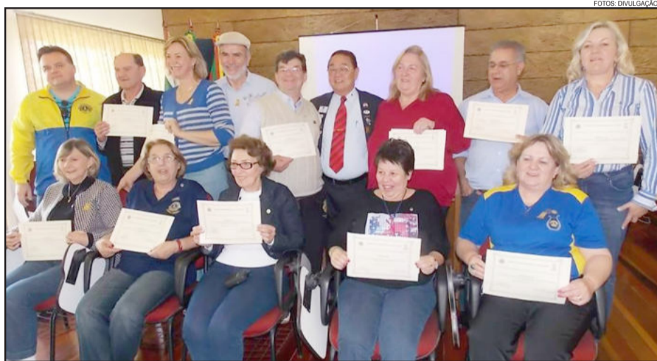
Grupo do Lions com os certificados