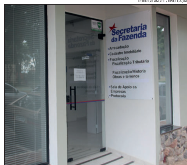
Fazenda prestará orientações sobre nova ferramenta de fiscalização

O evento é gratuito. Mais informações na Secretaria da Fazenda, pelo telefone (51) 3981-1149 ou e-mail fiscaliza8@estrela.rs.gov.br