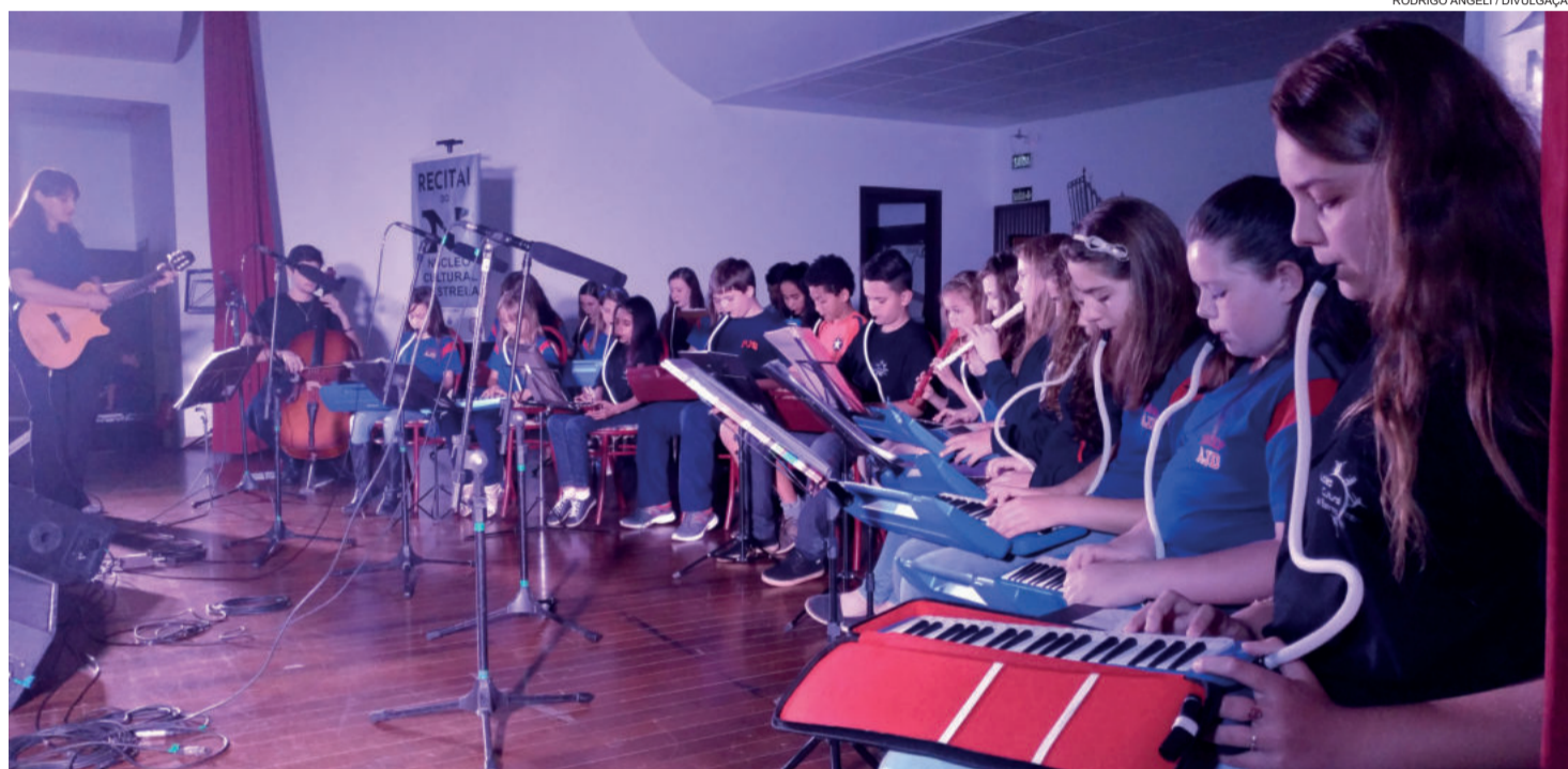
Grupo Escaletas encantou o público

Com entrada franca, não demorou muito para o salão social ficar tomado. O público acompanhou mais de dez apresentações, que ficaram ao cargo de alunos da orquestra do Núcleo Cultural; do Grupo de Acordeon e do Quarteto Fascínio; do Grupo Escaleta (formado por alunos do NC, da Escola Municipal de Ensino Fundamental Arnaldo José Diel, Emef Pedro Jorge Schmidt e