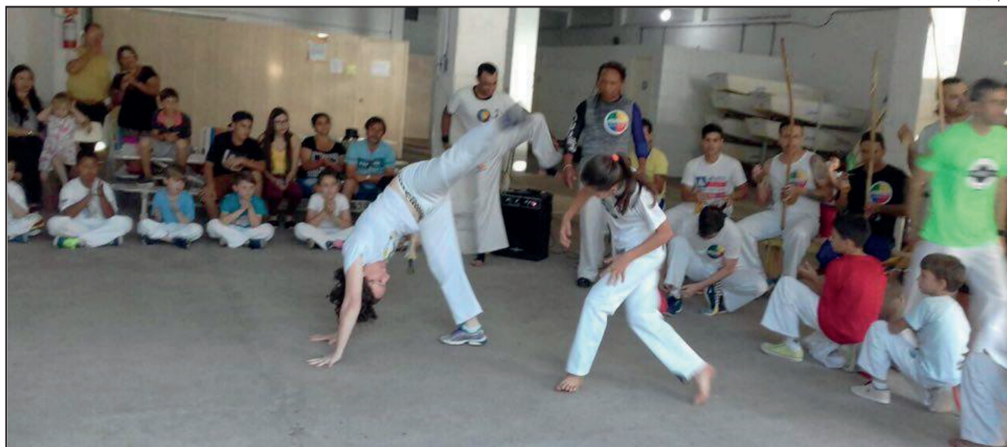
Alunos participaram do batizado e demais graduações