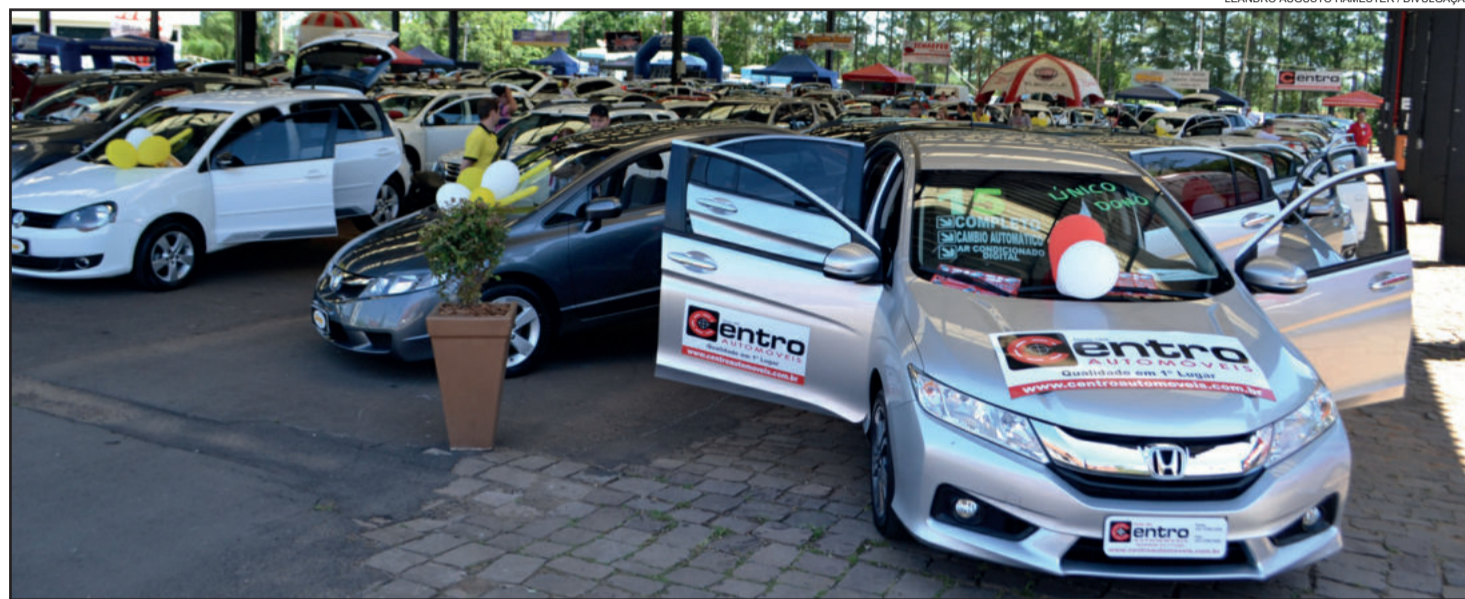
Variedade em marcas, modelos e ofertas num só lugar

A cada nova edição tem ocorrido o aumento na quantidade de veículos e valo-