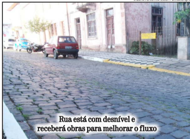
Rua está com desnível e receberá obras para melhorar o fluxo