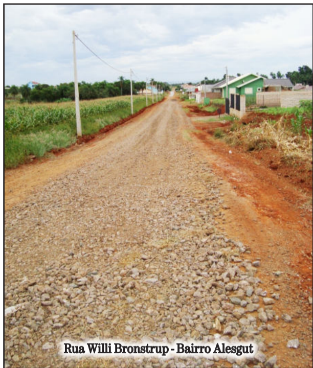
Rua Willi Bronstrup - Bairro Alesgut