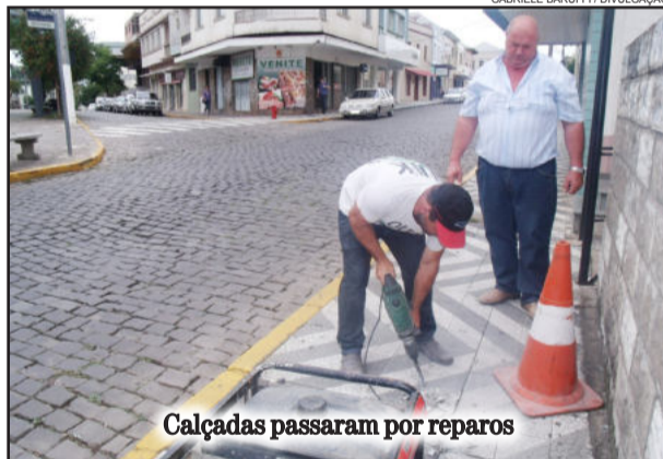
Calçadas passaram por reparos