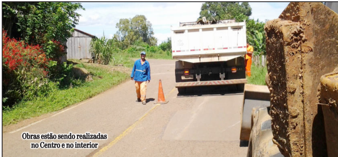
Obras estão sendo realizadas no Centro e no interior