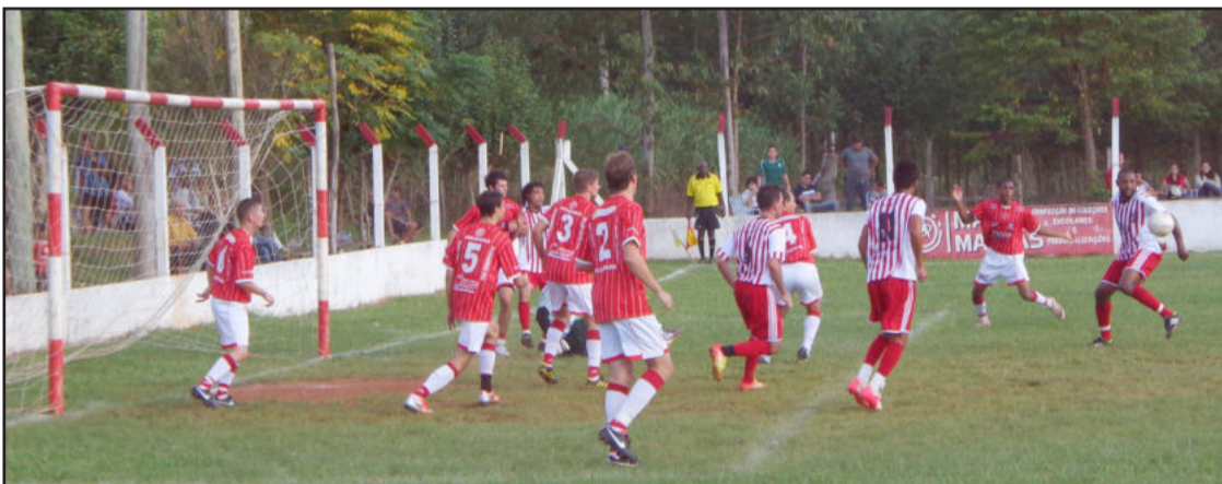
Atlético Gaúcho (camisa listrada) saiu vencendo por 3 a 0, porém não conseguiu segurar a vantagem