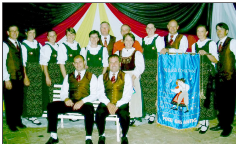
Musikfreunde, de Poço das Antas

chaftstanz, realizado no município de Sinimbu. Os grupos foram representados pelas categorias oficial. Essa foi a primeira apresentação e saída da categoria de Westfália no ano de 2013.