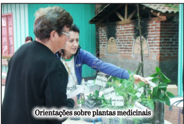
Orientações sobre plantas medicinais