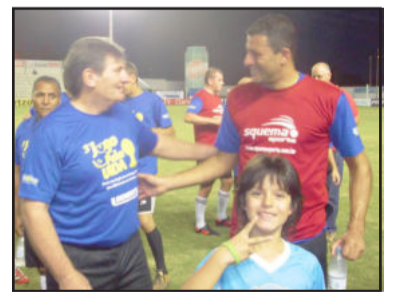
Chefe do Departamento de Trânsito de Lajeado e Washington