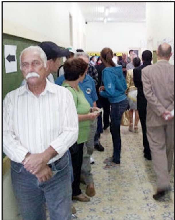
Eleição em Triunfo transcorreu com normalidade, graças ao trabalho preventivo de autoridades policiais e do judiciário

Nenhuma urna eletrônica precisou ser trocada ao longo dos trabalhos de votação.