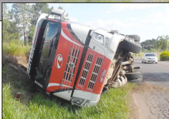
Carreta tombou, mas ficou fora da pista de rolamento

Funcionários do frigorífico Marfrig, que opera no município de Mato Leitão, responsável pela carga, falaram que não estavam autorizados a prestar informações sobre o acidente.