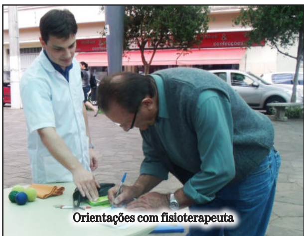
Orientações com fisioterapeuta