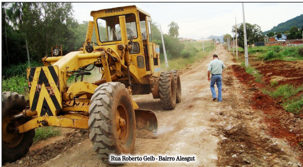
Rua Roberto Geib - Bairro Alesgut