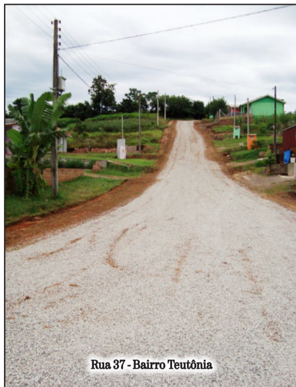
Rua 37 - Bairro Teutônia