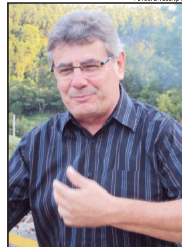
Prefeito Sérgio Marasca

Já o investimento do Município com a construção de quatro salas de aula e uma cobertura na escola municipal representa um investimento total de R$ 900 mil, sendo R$ 700 mil financiados pelo Badesul e aproximadamente R$ 200 mil em recursos