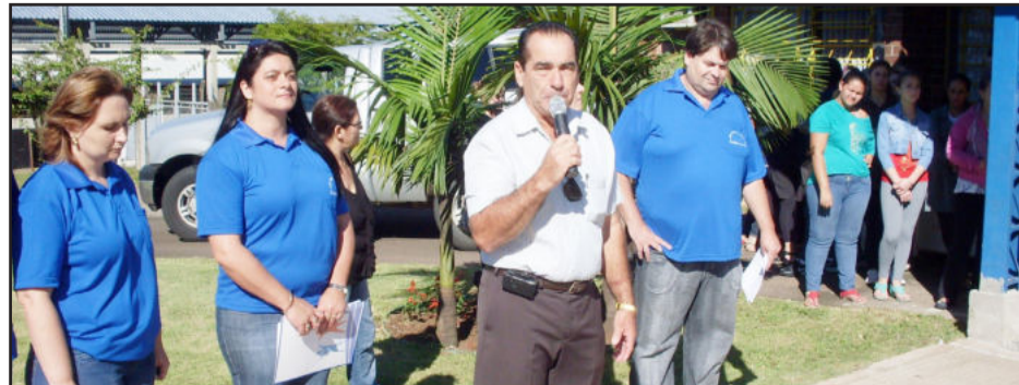
Prefeito e profissionais do Município na abertura do evento

A programação do último sábado teve a preocupação de trazer diferentes atrativos, com participação das escolas e oferecendo diversas oportunidades aos participantes. No intuito de trabalhar a autoestima e valorização das pessoas, também foram oferecidos cortes de cabelo e serviços de beleza. Tudo isso foi oferecido através de parcerias e sem custos à população.