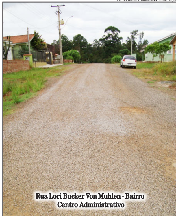
Rua Lori Bucker Von Muhlen - Bairro Centro Administrativo