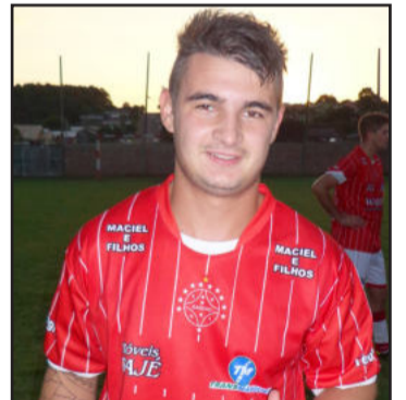
Wellington fez o gol da virada