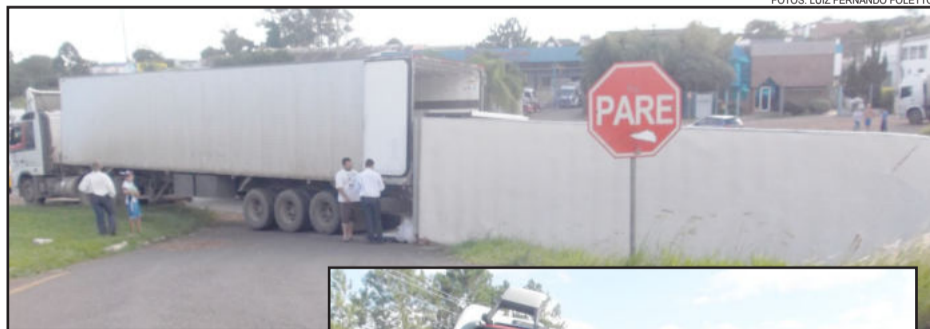
Carreta tombou por volta das 11h da manhã, mas carga foi baldeada só às 17h

O veículo ficou no local por aproximadamente 6 horas e somente por volta das 17h funcionários chegaram ao local para fazer o transbordo da carga.