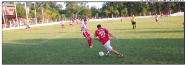
Gaúcho virou o jogo após sair em desvantagem no marcador