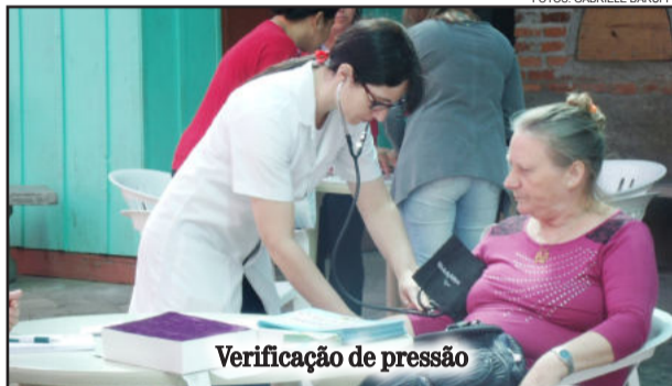
Verificação de pressão