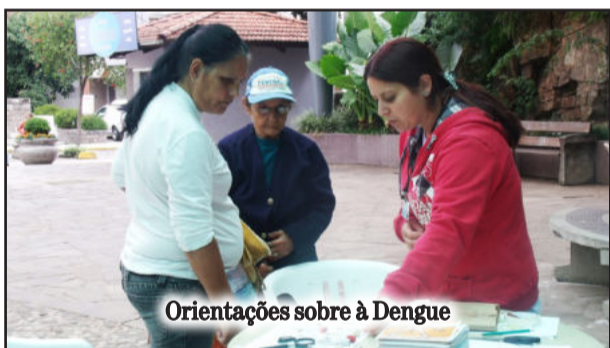
Orientações sobre à Dengue