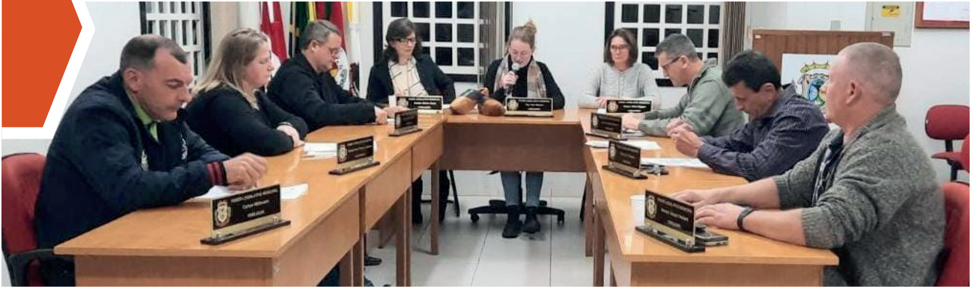
Sessão ocorreu nessa segunda-feira (14/8)