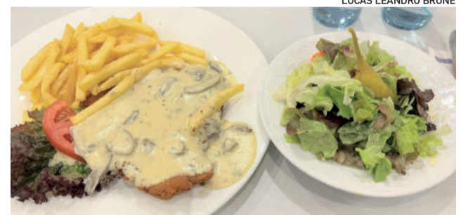
Schnitzel é bastante solicitado na Alemanha

É saboroso, sacia e agrada quase todos os gostos, especialmente para quem tem dúvidas na culinária germânica. Todo exagero, entretanto, não é recomendado. Os alemães até conhecem variações mais aproximadas, principalmente em cidades menores, porém o Schnitzel é o prato mais oferecido em restaurantes e bares.