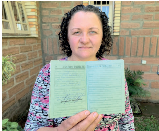
Antiga carteira de trabalho registra contrato pela empresa, feito em 2003