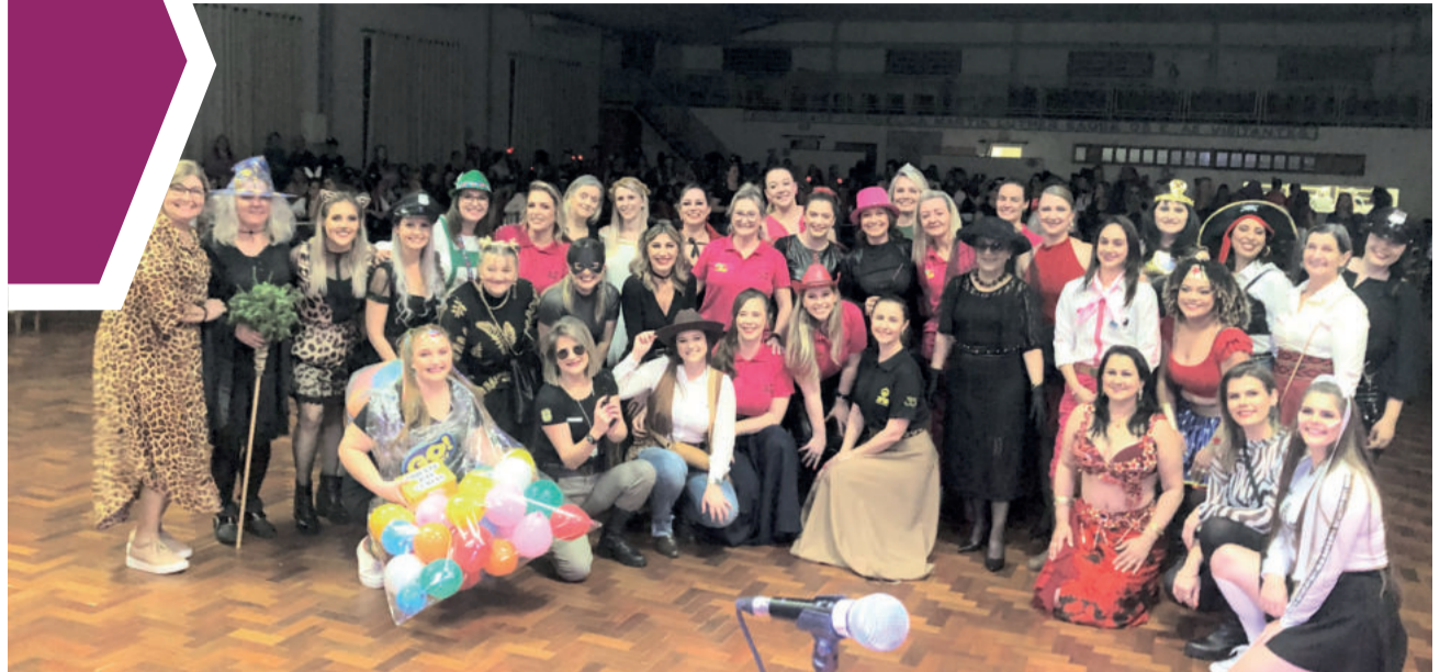
Gurias integrantes do Piquete das Gurias