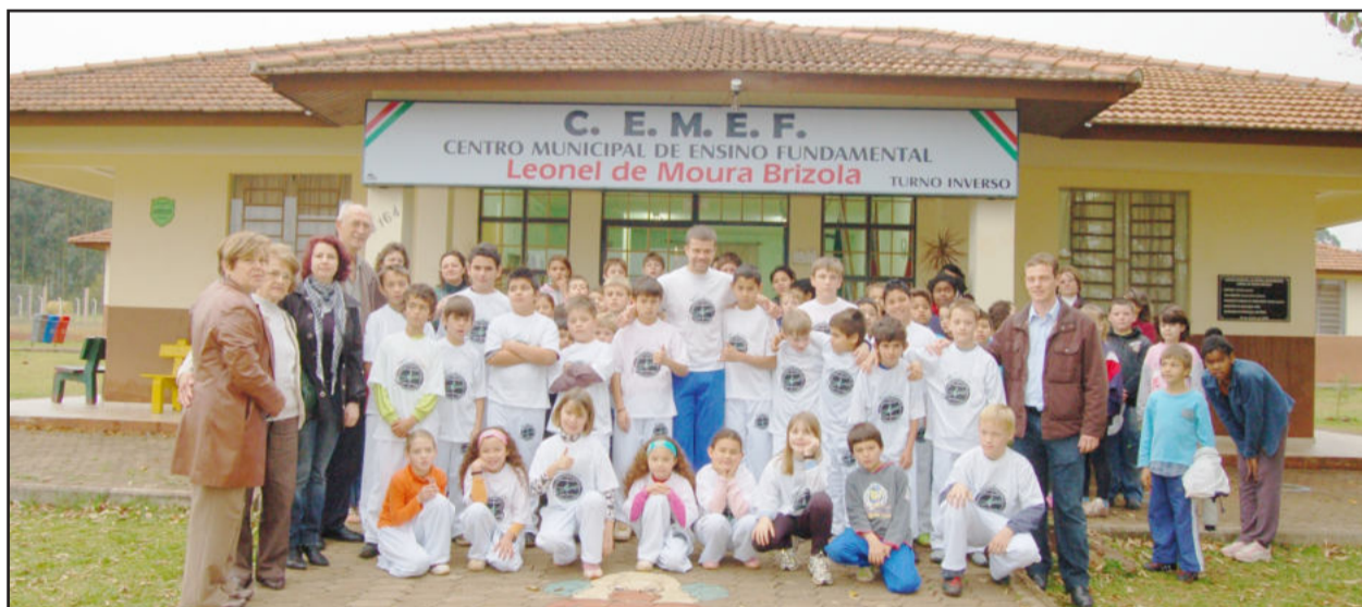
Entrega de uniformes para alunos de Capoeira do Cemef