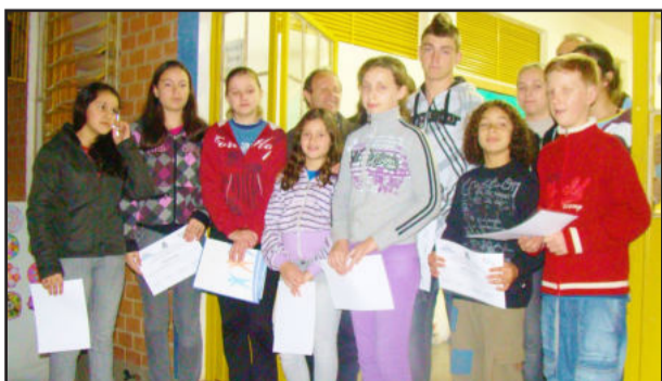
Nova diretoria do Grêmio Estudantil da Escola Edgar da Rosa Cardoso tomou posse