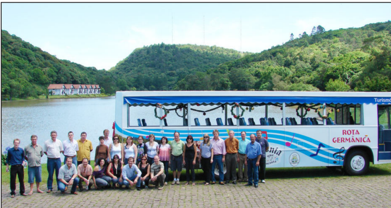
Grupos podem se organizar para os roteiros