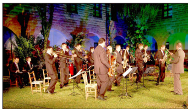
A Orquestra Municipal encerra a Feira do Livro de Imigrante

No sábado, dia 4, também no ginásio, a Feira do Livro e a mostra de trabalhos de alunos das escolas, iniciam às 8h30min e encerra às 12 horas. Às 9 horas, com a presença de autoridades, alunos, familiares e o público em geral, haverá a Sessão Cívico-Cultural, alusiva à Independência do Brasil, com apresentações artísticas das escolas municipais Ciranda de Sonhos, Pequeno Mundo, Arco-Íris, Ernesto Alves e Santo Antônio, e a Escola Estadual 25 de Maio. Às 11 horas, um show da Orquestra Municipal de Imigrante encerra de forma oficial a programação.