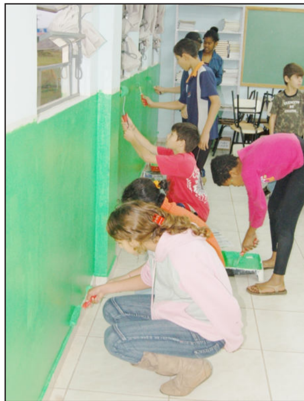
Alunos pintaram salas do Cemef