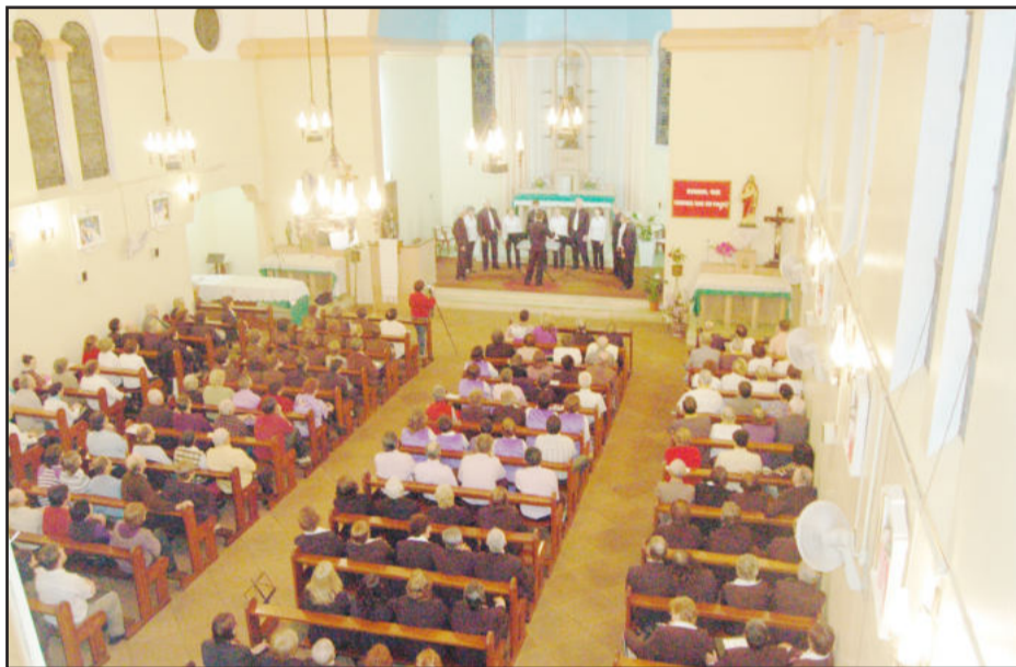
Igreja lotada para assistir ao Coral Vozes e seus convidados

Após duas horas de apresentações, seguiu a confraternização e alegria, no Centro Comunitário, onde aconteceu o baile de integração. A festa estava animada e os últimos saíram por volta das 2h30min da manhã.