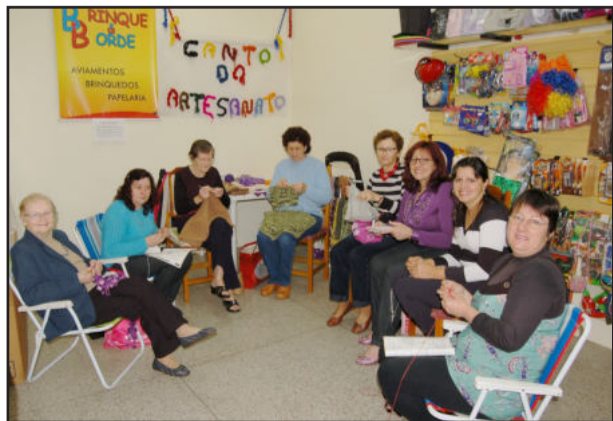
Curso gratuito na inauguração