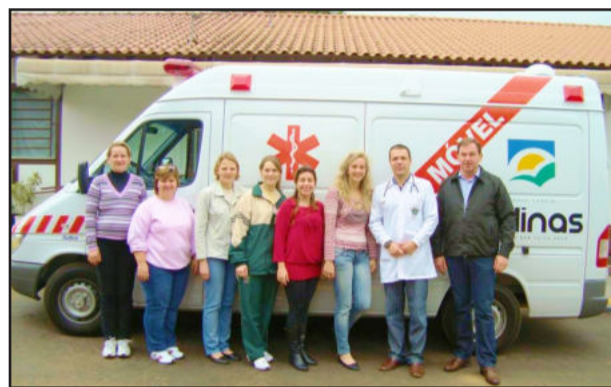
Entrega oficial do veículo à equipe de saúde