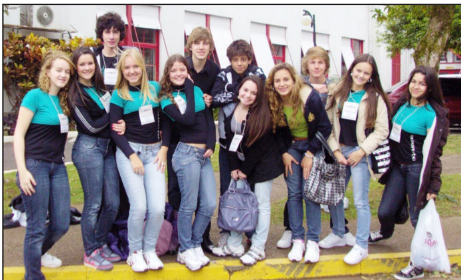
Expressart Grupo de Dança representou o Colégio Teutônia no 7º Endase