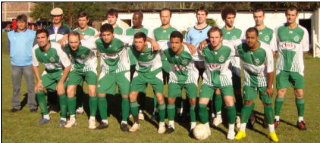
Juventude, campeão de Teutônia, foi derrotado pelo Poço das Antas por 2 a 0