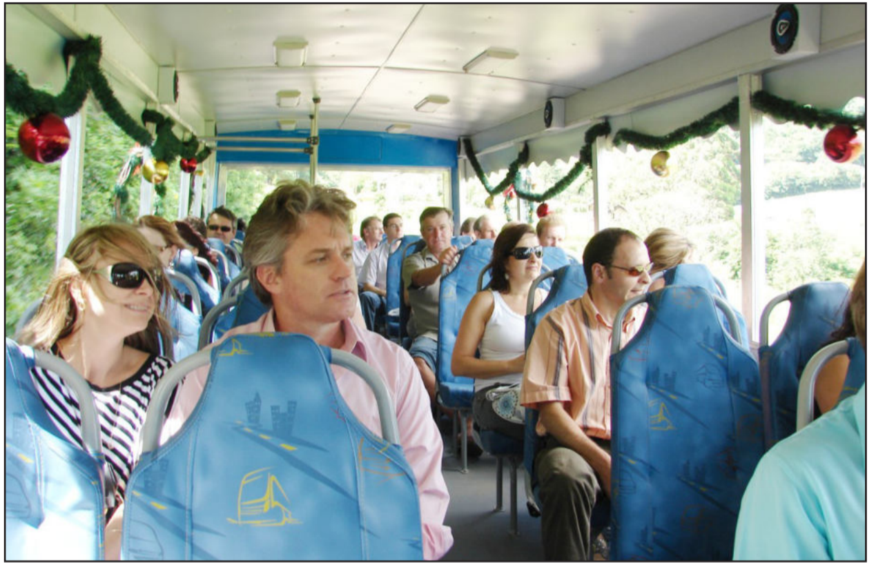
Turismóvel permite apreciar a paisagem

Os roteiros da Temporada de Turismo em Teutônia serão realizados duas vezes por mês. No segundo domingo de cada mês está previsto o Pacote