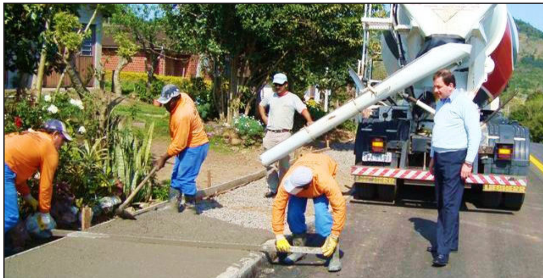
Prefeito acompanhou obras de infraestrutura da via

Nos últimos dias a equipe trabalhou fazendo calçada em determinado trecho, para garantir a segurança dos pedestres. O prefeito acompanhou a obra de perto.