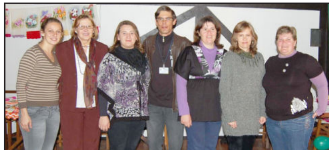
Equipe anfitriã e o novo presidente do Contuvat