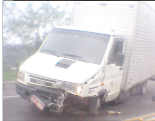
Veículos envolvidos no acidente