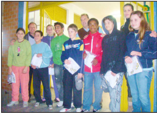
Parte dos alunos que tiveram 100% de frequência no semestre

A Administração Municipal de Fazenda Vilanova premiou na quinta-feira, dia 26, os alunos da Escola Edgar da Rosa Cardoso que obtiveram 100% de frequência no semestre. A ação faz parte do Projeto 100% Frequência, criado pela Secretaria de Educação do Município, para incentivar as crianças a irem todos os dias para a escola. Assim, no final de cada semestre, todas as crianças que tiveram 100% de frequência na escola recebem uma camiseta.