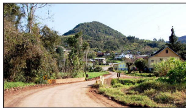
Daltro Filho receberá duas novas pontes