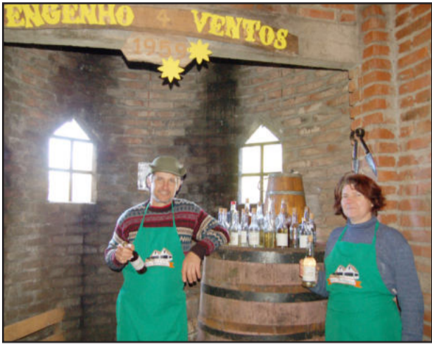
Bebidas destiladas são atração de um dos pontos turísticos

Oportunidades para teutonienses conhecerem a Rota Germânica com o Turismóvel