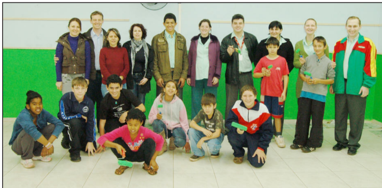
Alunos e equipe do Cemef com representantes da Quero-Quero