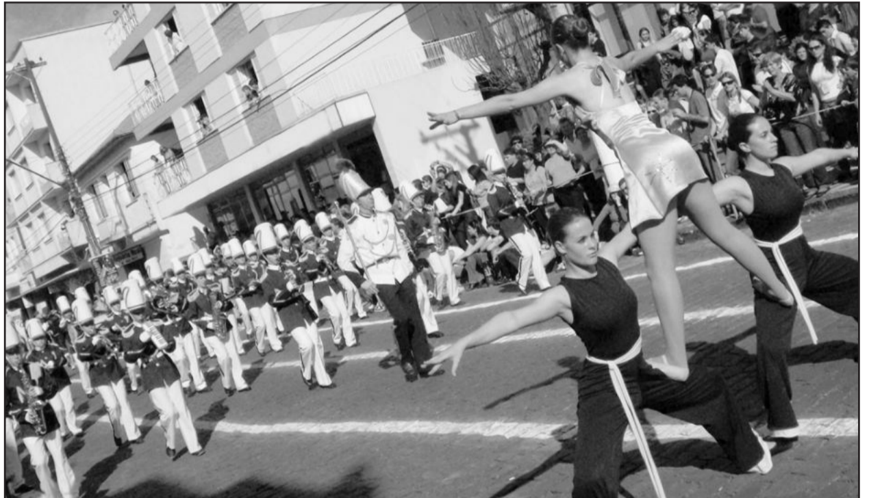
Banda Musical Professor Danilo Chesini do Instituto Estadual de Educação Professora Irmã Teofânia de Garibaldi é destaque dos desfiles cívicos de Garibaldi e Carlos Barbosa

A Semana da Pátria terá seu encerramento no dia 7 de Setembro, com o Desfile Cívico, que neste ano acontece à tarde, a partir das 14 horas. O trajeto do desfile será na Rua Rio Branco, a partir do cruzamento com a Walter Jobim, seguindo até o Calçadão e entrando pela Buarque de Macedo, até a Prefeitura. O palanque de autoridades estará localizado na esquina das ruas Maurício Cardoso e Rio Branco.