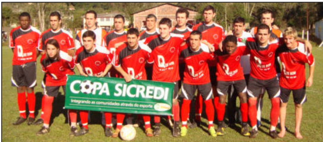
Aecosajo, campeã de Bom Retiro do Sul, perdeu para o Avante por 2 a 1