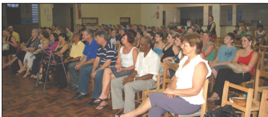
Público identificou-se com o conteúdo apresentado