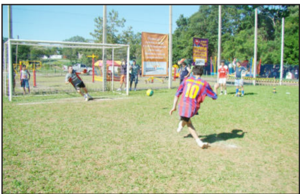
Torneio de pênaltis