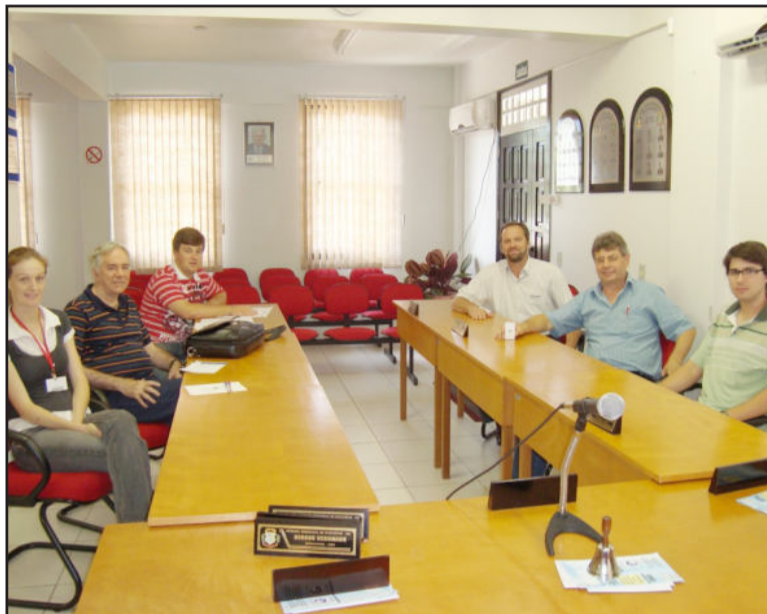
Encontro tratou de questões ambientais