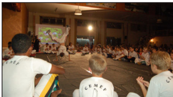
Apresentação de capoeira do Cemef