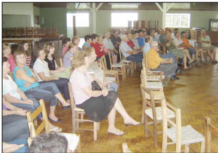
Assembléia foi realizada no sábado