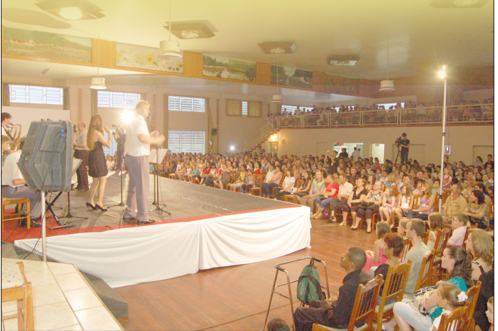
Cerca de mil pessoas assistiram ao Show Conexões 7, em Teutônia, em benefício do Centro Municipal de Ensino Fundamental, que atende alunos no turno inverso ao período escolar. Página 9