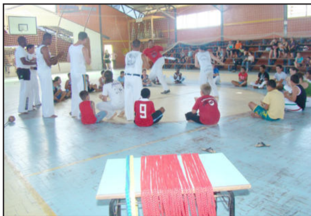
Alunos batizados em Capoeira