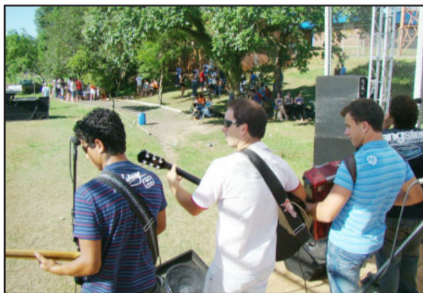
Banda Elyte animou o público