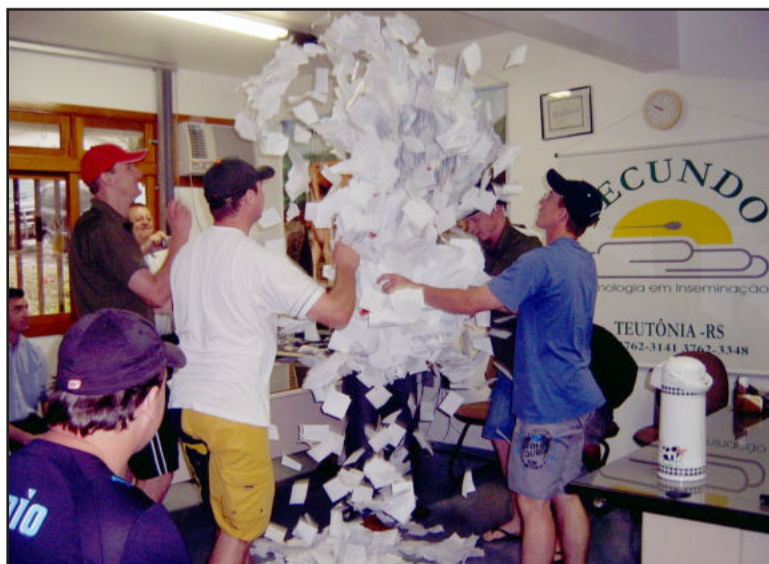
Sorteio foi realizado no sábado