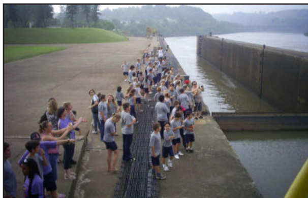
Barragem em Bom Retiro do Sul