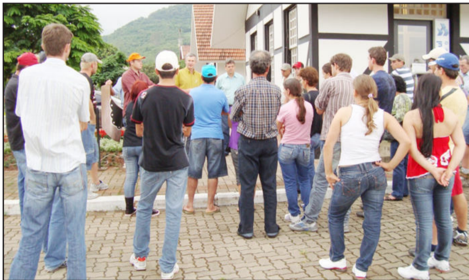
Grupo foi recebido na Prefeitura

Num próximo momento, o grupo de Teutônia e Westfália deverá visitar Arvorezinha com a finalidade de observar a realidade dos produtores naquele Município, onde o