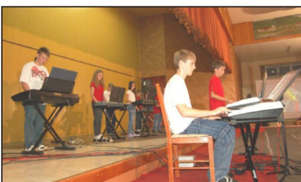
Centros Cultural 25 de Julho e São Pedro