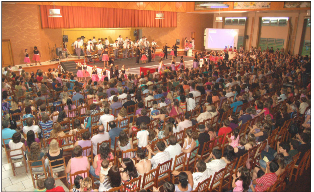
Público lotou as dependências da Associação

Um dos destaques foi a recém-criada Banda do Cemef, que representou a entidade beneficiada. A bandinha utiliza