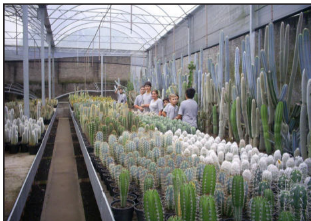
Cactário na cidade de Imigrante

No dia 13, a Escola Municipal de Ensino Fundamental José Bonifácio, de Costão, realizou sua viagem de estudos, visitando diversos pontos turísticos do Vale do Taquari.