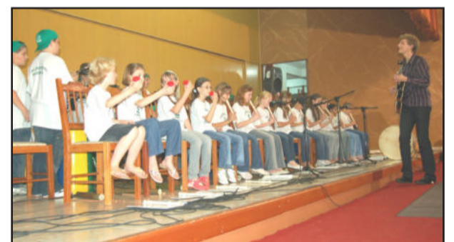
Orquestra Mirim de Travesseiro