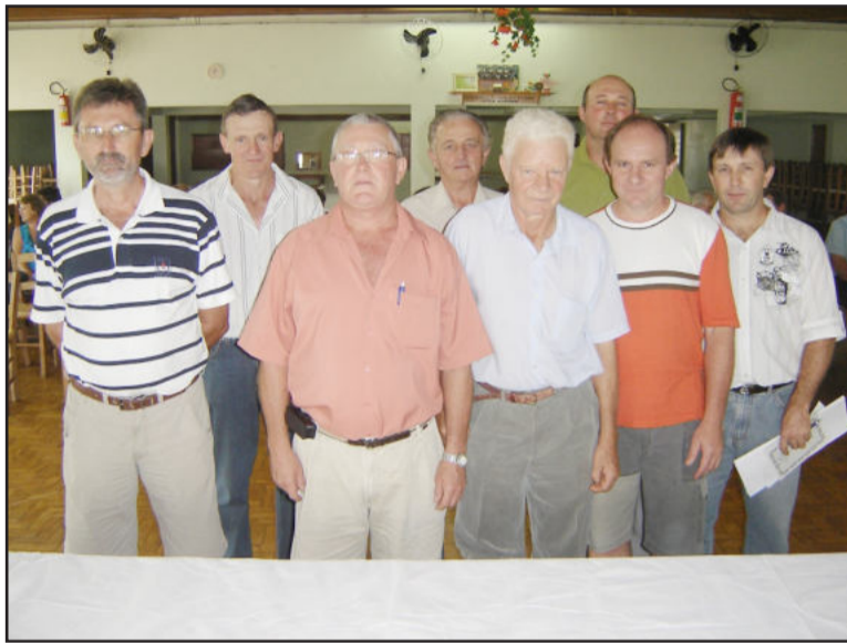
Integrantes da nova diretoria