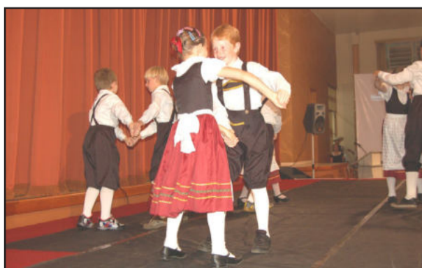
Crianças apresentaram danças alemãs