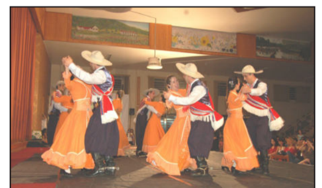
DTG do Ieceg com as danças gauchescas