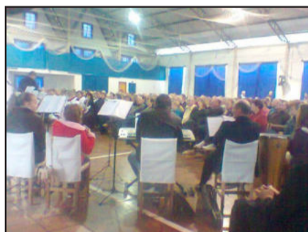
Coral das comunidades do município também estiveram presentes