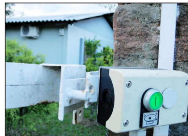
Já na campanha algumas diferenças básicas para as residências convencionais

Tudo está baseado em algoritmos (expressão familiar dos programadores de informática), uma fórmula complexa que utiliza uma série de variáveis de dados simultaneamente.