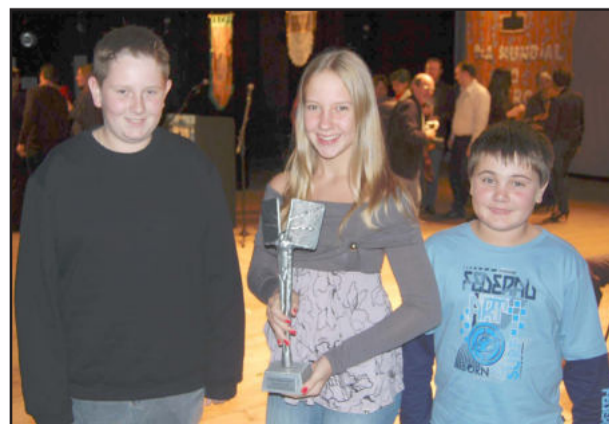
Alunos representantes do grupo Amigos da Leitura