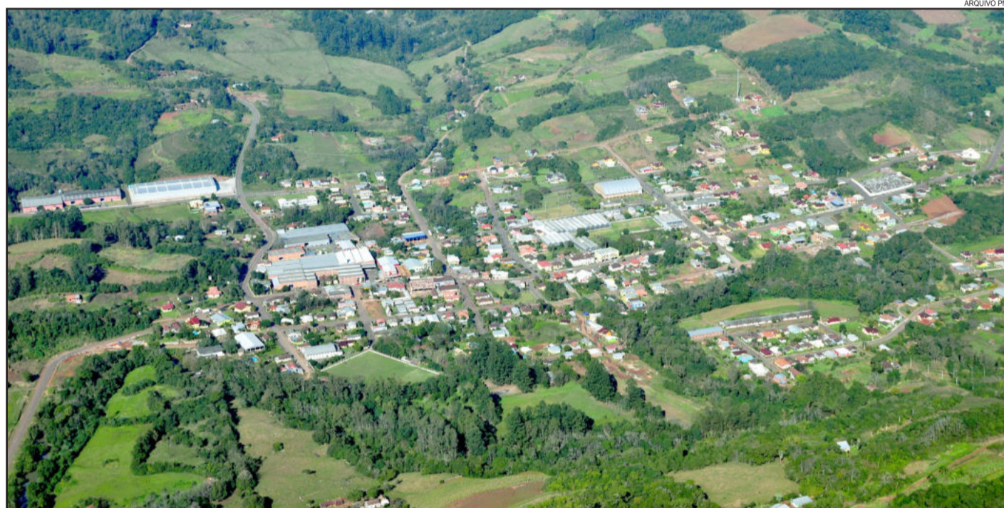
Aspecto aéreo da sede do município

- Quarta-Feira, dia 9 de maio, feriado Municipal.