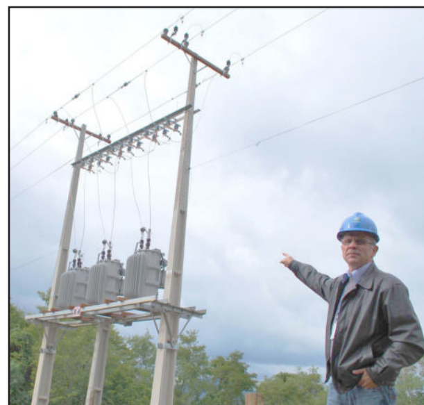
Banca de reguladores de tensão