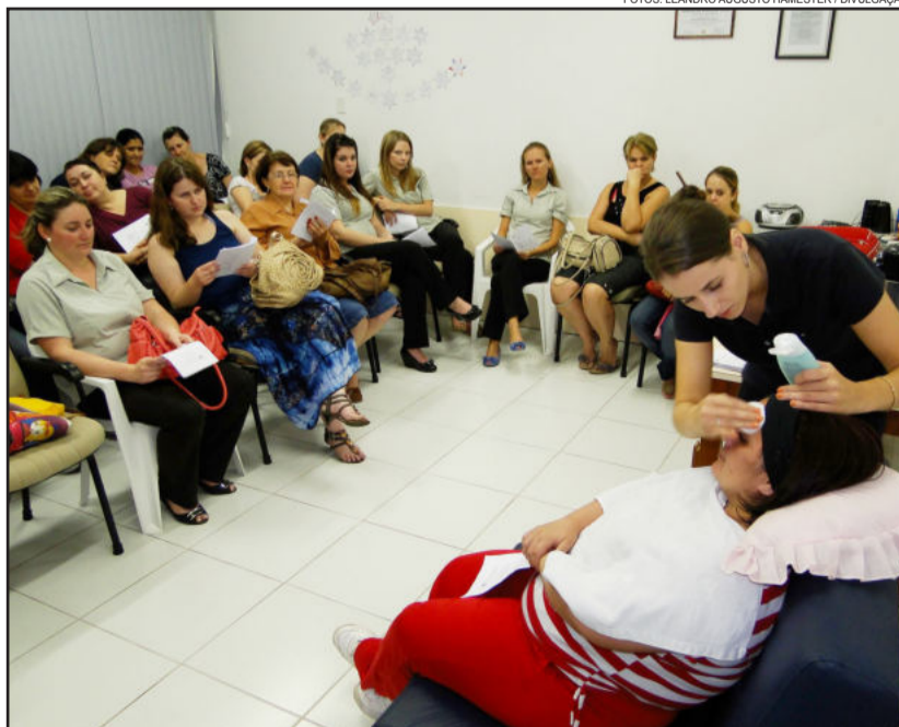
Segundo encontro do grupo contou com palestra e prática sobre maquiagem

O encerramento da ação Todos Magros do Projeto Bem Estar está agendado para o dia 19 de dezembro, momento de conferir a evolução de todos os participantes.