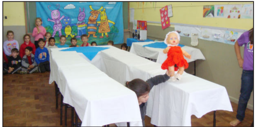
Teve até desfile dos brinquedos