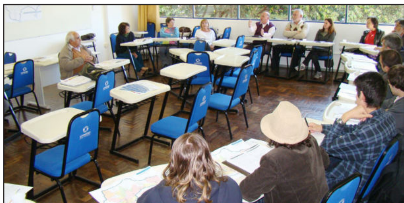
Divididos por categorias, membros do Comitê realizaram atividade prática de compatibilização dos usos da água na Bacia

A parte da tarde foi preenchida com atividade prática de planejamento. A exemplo da sistemática das consultas públicas, as categorias representadas no Comitê expressaram em mapas os seus desejos de usos da água na Bacia. Eles foram divididos em conjunto de usuários da água, representantes da população e do Governo, tendo como tarefa também justificar suas ideias. O resultado da atividade serve de apoio ao processo de consultas públicas, com o objetivo de compatibilizar os usos sugeridos.