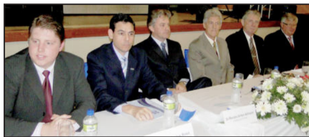
Mesa principal da solenidade de posse da nova diretoria da CIC