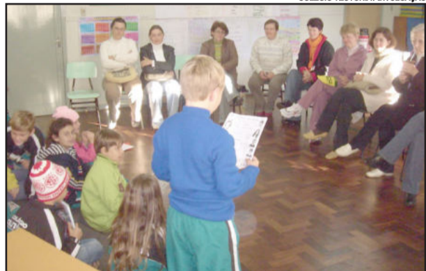
Projeto Mamãe na Escola conta como diversas atividades no início do mês de maio