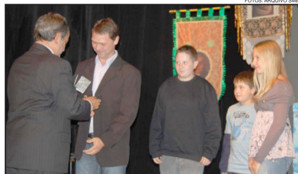
Imigrante recebe mais uma distinção estadual