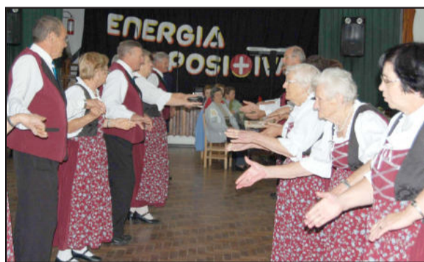
A dança proporciona energia positiva