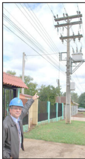
Religadores automáticos garantem atendimento rápido