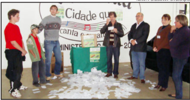
Realizado o segundo sorteio da Campanha Quero Prêmios o Ano Inteiro

Para participar da campanha, basta o consumidor exigir a Nota Fiscal na hora da compra. A cada R$ 100,00 em compras com notas ou cupons fiscais no comércio, o consumidor troca por uma cautela na sala 14 do Centro Administrativo para concorrer aos prêmios. No caso das notas de produtor rural, é necessário acumular R$ 200,00 para efetuar a troca por uma cautela. O objetivo da campanha é estimular a compra no comércio de Teutônia o ano inteiro.