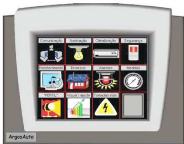
Tela principal do sistema central

Quanto ao valor do investimento para uma automação completa, este fica em torno de 30% do valor da obra. Por outro lado o cliente pode automatizar só o básico, ou mesmo investir em sistemas isolados, como áudio distribuído, câmeras de vigilância inteligentes, aspiração central de pó e home theater. “Os níveis de automação é que vão refletir o valor do investimento”, conclui Fiegenbaum.