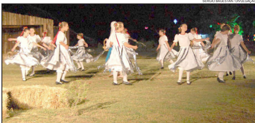
Grupo de Danças Sonnenlicht, categoria infanto-juvenil

- 13 horas, início das apresentações dos grupos de danças.