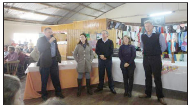
Evento em Sinimbu teve a presença do Grupo Vida Alegre de Linha Germano

convidar a todos para o próximo evento municipal, a realizar-se no dia 12 de junho, o Baile dos Namorados e a Festa de São João da Terceira Idade. O evento será no Centro Comunitário Martin Luther de Languiru, com início às 13 horas.