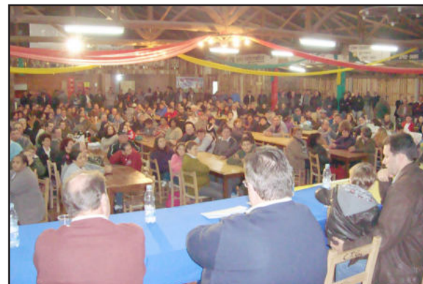
Oposição de Teutônia está mobilizada e reuniu cerca de 500 pessoas na noite de sexta

Por último, pediu cuidado às pessoas para não aceitarem convite para trabalhar na Prefeitura agora, "pois algumas pessoas do PDT já foram e o fim será o dia 7 de outubro".