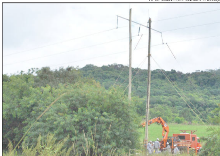
Substituição de postes de madeira por concreto