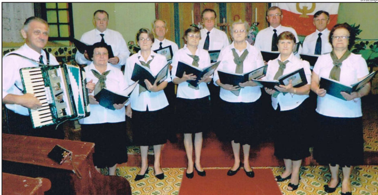
Picada Mólke também recebeu pavimentação

A diretoria era formada por apenas duas pessoas: presidente e secretário, escolhidos anualmente entre os sócios ativos, através do voto secreto. O presidente tinha a obrigação de convocar e dirigir as reuniões e assembleias. O secretário, além de redigir as atas, assim como todas as outras correspondências, cuidava da caixa do dinheiro e fazia os pagamentos. As reuniões ordinárias aconteciam a cada três meses e o regente do coro era contratado com a anuência da maioria dos associados. A única forma de entrar na sociedade se dava pela ballotage (eleição por escrutínio majoritário). O candidato, que deveria ter uma diretriz de vida e moral apropriada, apresentava-se à diretoria e, na reunião ordinária seguinte, era submetido à votação. O membro aceito, assim como os outros, tinha o dever de manter em dia as mensalidades. O atraso de seis pagamentos implicava na demissão do inadimplente.