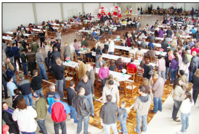
Estrutura do ginásio impressiona pela qualidade

Sua estrutura física compreende 11 salas de aula, sendo que seis estão no prédio novo. O quadro funcional é formado por 37 profissionais. Em 2012 já são 430 alunos. Agora, é uma escola de Ensino Fundamental completo, atendendo crianças desde a Educação Infantil até a 8ª Série/9º Ano. Hoje é uma escola bem estruturada e os alunos sabem que depende de cada um continuar buscando conhecimentos a fim de atingir os objetivos desejados.