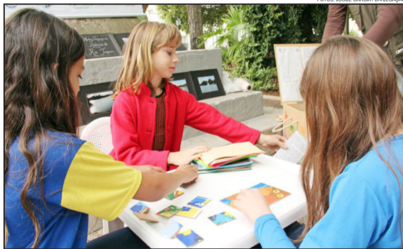
Alunos tiveram contato com diversos materiais educativos