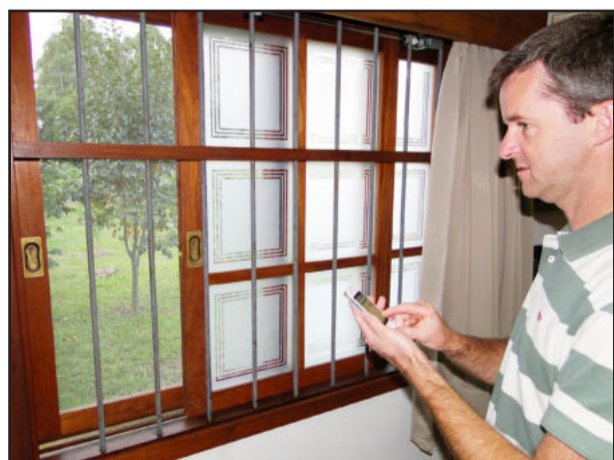
Pelo iPhone, janelas e cortinas podem ser abertas ou fechadas à distância

O aparato tecnológico envolve quem estiver por ali, com a grande maioria dos equipamentos não apresentando diferenças visíveis dos que encontramos em qualquer loja. Sobre isso, o cientista de Teutônia logo se adianta: “Aqui os equipamentos estão bastante à mostra, justamente para que as pessoas enxerguem o que está acontecendo. Mas nos projetos que os clientes adquirem tudo está discretamente escondido, seja num móvel, no gesso ou na própria parede”.