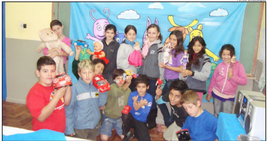
Alunos do 4º ano se entusiasmaram com a Festa dos Brinquedos

Os alunos do 4º ano da Escola Municipal Guilherme Sommer, da Vila Popular, Teutônia, trabalham atividades diferenciadas com base em leituras. A partir da história que falava sobre uma festa de bonecas, a turma se motivou a organizar uma festa de bonecas e carrinhos na escola, a Festa dos Brinquedos. Cada aluno ficou responsável por enfeitar sua boneca ou carrinho explorando a própria criatividade.