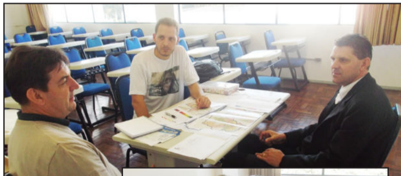
Alguns grupos tiveram poucos participantes

O prazo para o Comitê concluir essa fase é outubro desse ano. Porém, diretoria e membros querem postergar o limite para dezembro, para avaliar com mais rigor as decisões que precisam ser tomadas. O pedido será encaminhado ao Governo do Estado. Esse foi um dos assuntos do cronograma de atividades do Comitê discutido na reunião em Lajeado. O próximo encontro do Comitê está marcado para o dia 25 de maio, na Câmara de Vereadores de Triunfo.