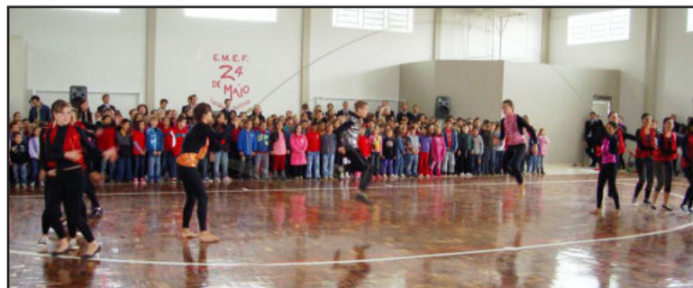
Crianças fizeram belas e emocionantes apresentações