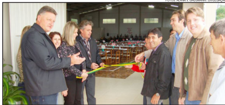
Desenlace da fita inaugural

Altmann ainda citou inúmeros investimentos realizados durante os 3 anos e 4 meses de governo, co-