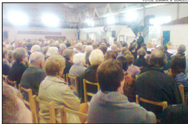
Centenas de pessoas participaram do Encontro das Paróquias de Teutônia