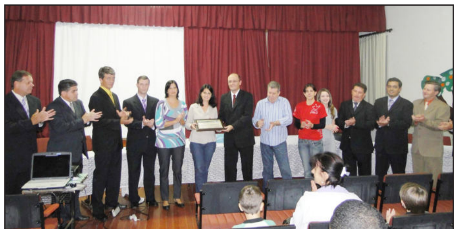
O homenageador com os vereadores