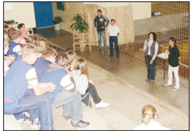
Orientações aos estudantes

A Secretaria Municipal de Saúde realizou, nas últimas semanas, um ciclo de palestras junto às escolas de Teutônia, com o propósito de difundir orientações e formas de prevenção sobre diferentes doenças. Os profissionais do grupo de Vigilância em Saúde reuniram estudantes de quinta a oitava séries do Ensino Fundamental e alunos do