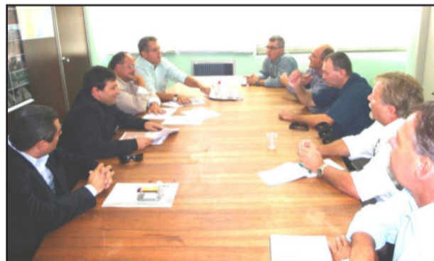
Encontro na Superintendência Regional do Dnit do Estado do Rio Grande do Sul, em Porto Alegre, definiu obra de túneis sob a BR-386

Interligação: Ruas Cel. Brito (Bairro dos Estados) e João Lino Braun (Bairro Boa União)