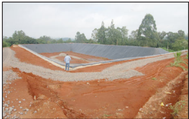
Célula deve garantir armazenamento por 20 anos