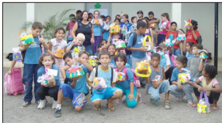
Estudantes receberam cestas de doces na Páscoa