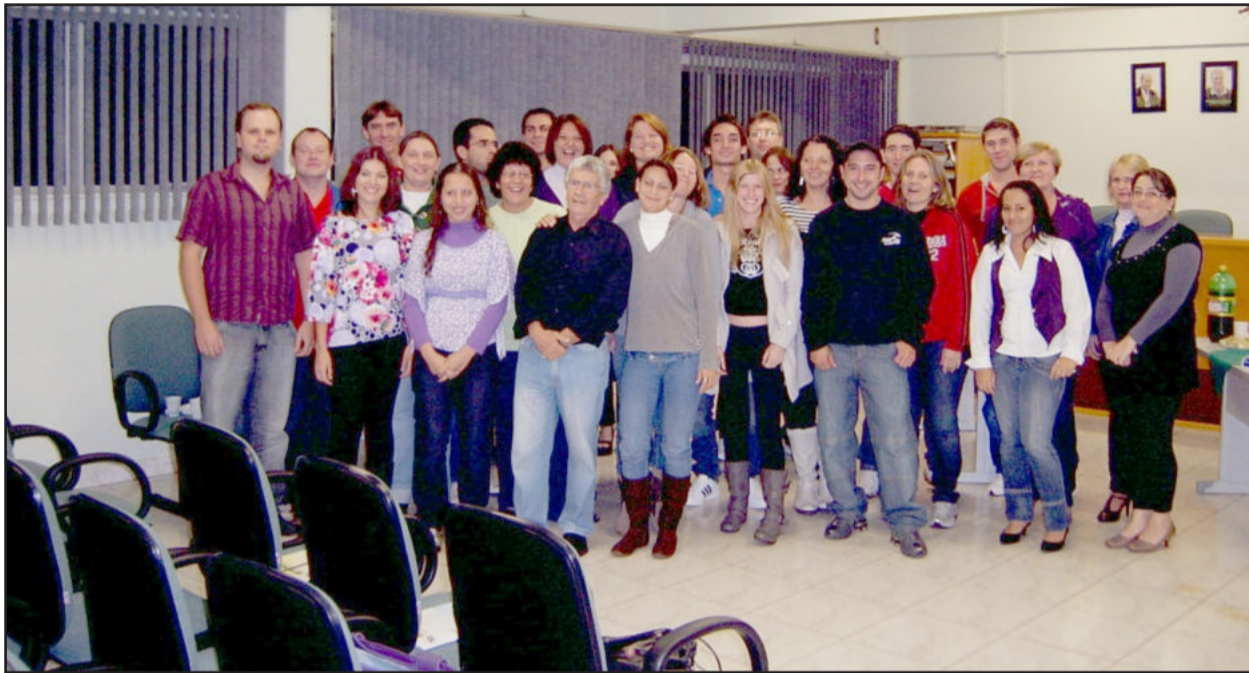
Primeira turma de Relações humanas, chefia e Liderança

A formatura da primeira turma do curso de Relações Humanas, Chefia e Liderança - Chefias e a sua postura, oferecido pelo Sindicato dos Trabalhadores nas Indústrias Calçadistas de Teutônia (Sitalte) em parceria com diversas empresas do Município, ocorreu na noite desta quinta-feira, dia 8, na sede da entidade sindical, no Bairro Canabarro. O curso, que foi realizado no período de 5 a 8 de abril, teve como objetivo o aperfeiçoamento dos colaboradores das indústrias calçadistas em cargos de chefia.