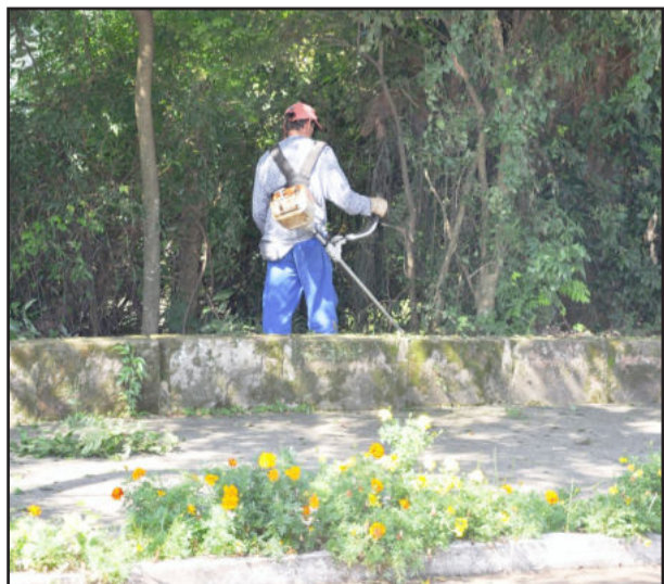
Vegetação baixa foi podada