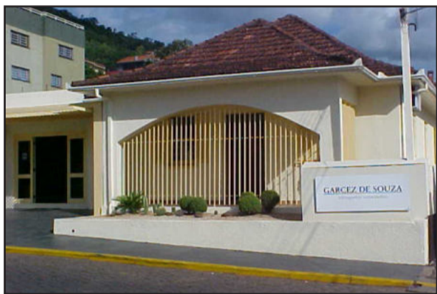
Escritório está localizado no bairro Languiru

A assessoria faz o acompanhamento das sessões legislativas e fica à disposição para esclarecer as dúvidas dos vereadores nos procedimentos que realizam, evitando assim falhas no processo administrativo, visando sempre o trabalho correto em prol do bem-estar da comunidade.