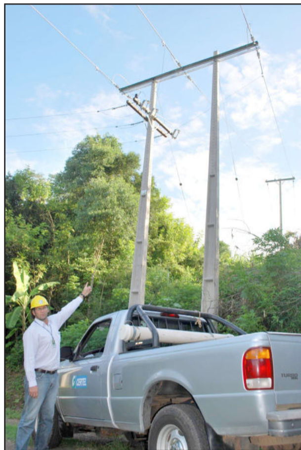
Responsável pelas redes elétricas, Neurilene Krai mostra algumas das melhorias implementadas

A energia elétrica distribuída em Westfália e na área rural de Imigrante, Boa Vista do Sul e Coronel Pilar, teve sua capacidade de fornecimento ampliada. Em torno de 1,2 mil consumidores foram beneficiados. Com um investimento de R$ 190 mil, a Cooperativa de Distribuição de Energia Teutônia (Certel Energia) concluiu em março uma reforma na rede elétrica que abastece estas comunidades, com substituição de postes e condutores.