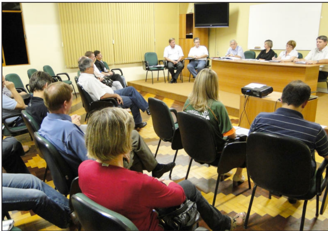
Encontro reuniu diretorias, colaboradores e representantes de parceiros da Fundação Agrícola Teutônia e do Colégio Teutônia.

No dia 29 de março a Fundação Agrícola Teutônia (FAT), entidade mantenedora do Colégio Teutônia, realizou reunião geral ordinária dos conselhos Executivo, Deliberativo e Fiscal. A pauta do encontro destacou relatório de atividades de 2009 do educandário, balanço de resultados e patrimonial, plano de ação do Colégio Teutônia e granja para 2010 e 2011 e orçamento para o exercício de 2010.