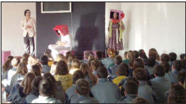
Esquete do grupo Hora Vaga