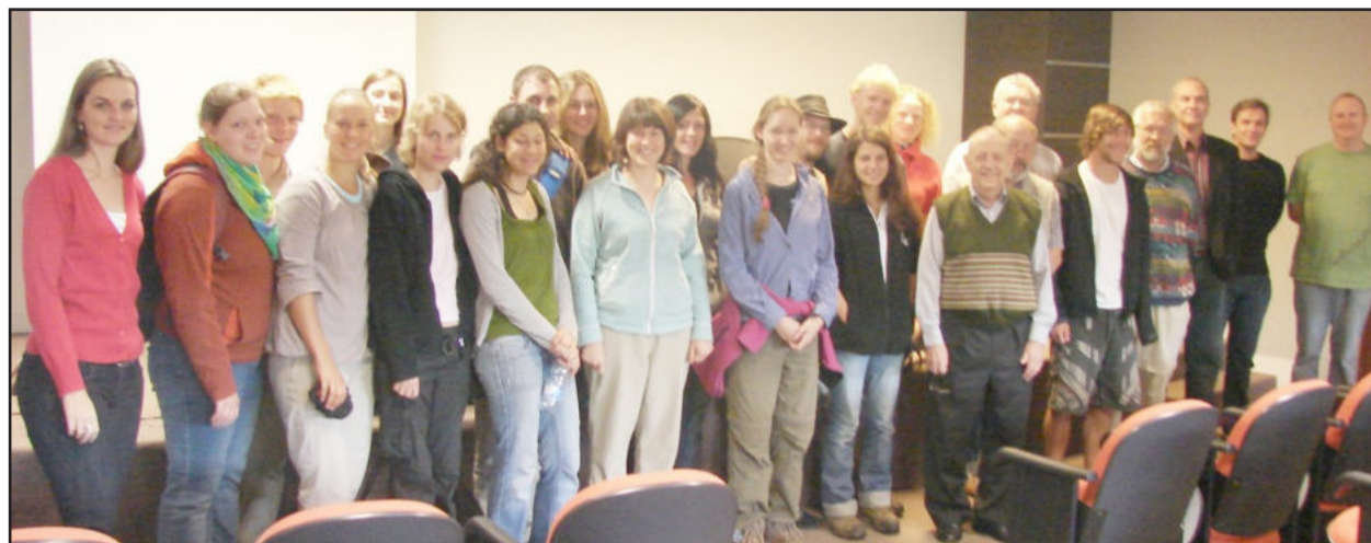
Grupo da Alemanha esteve na Univates

A Univates recebeu, na manhã desta quinta-feira, dia 8, a visita de 17 estudantes universitários e dois professores da Alemanha, a maioria proveniente da universidade de Tübingen, com a qual a Univates possui convênio de intercâmbio. Os acadêmicos, alunos dos cursos de Biologia e Geoecologia, estão em viagem de estudos pelo Brasil desde o dia 21 de fevereiro.