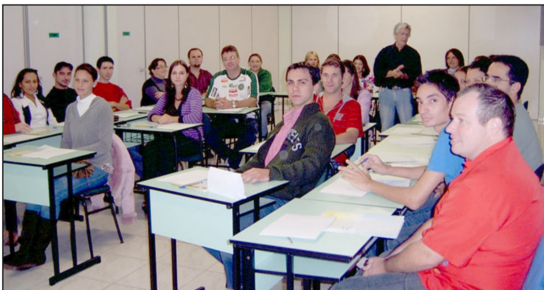
Na última aula, foram entregues os certificados.

O Setor de Engenharia da Prefeitura de Teutônia comunica que foi adiado o prazo para a regularização e a aprovação de projetos novos que contenham janelas ou aberturas a menos de 1,50 metro da divisa. O novo prazo vai até o dia 31 de dezembro de 2010. A partir de 1º de janeiro de 2011 não serão mais protocolados projetos novos ou regularizações com autorizações de vizinhos. Quem não regularizou ou aprovou o projeto até o final de 2010 terá que se adequar ao recuo de 1,50 metro.