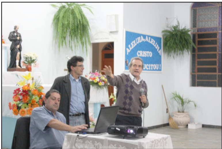
Prefeito e equipe presente nas reuniões

Nesta semana ainda foram realizadas reuniões na Escola Madre Felicidade e na Escola Visconde de Cairú, sempre a partir das 19h. Mais informações através do telefone (54) 3462-8206.