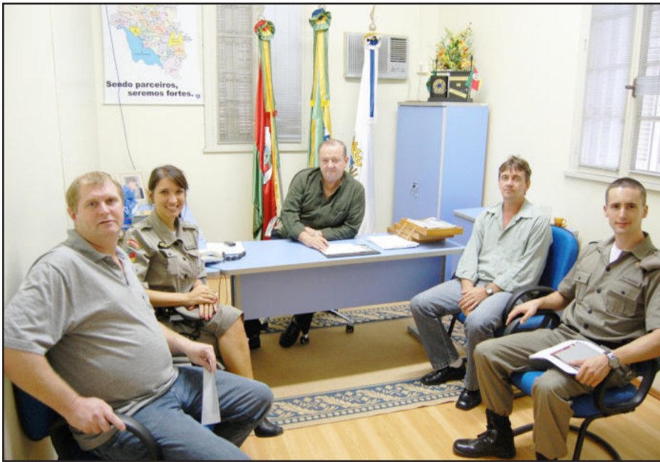
Reunião definiu ações da BM