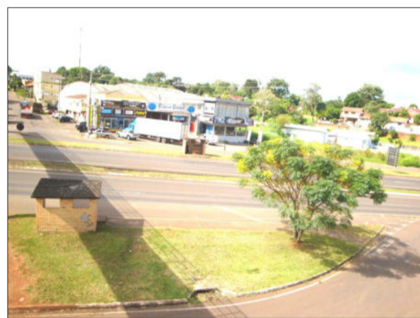
Obra deverá interligar as ruas Coronel Brito e João Lino Braun através de túneis metálicos