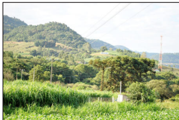
Reforma amplia a capacidade de fornecimento para Westfália, Imigrante, Boa Vista do Sul e Coronel Pilar

A reforma incluiu a substituição de 5,3 quilômetros de rede trifásica de alta tensão, além de 57 postes e quatro transformadores. "Ao longo deste ano, a cooperativa realizará novos investimentos para oferecer uma energia elétrica cada vez mais confiável aos seus mais de 50 mil associados", relata Oliveira.