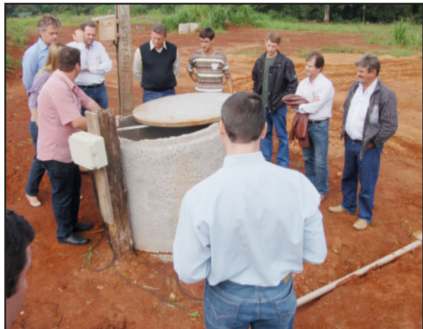
Poços de inspeção também foram construídos, conforme exigência da Fepam

Obra pode garantir 20 anos de depósito de resíduos com segurança e qualidade