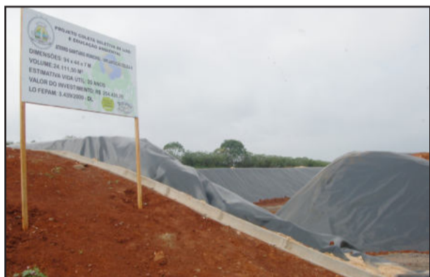
Investimento superou os R$ 254 mil