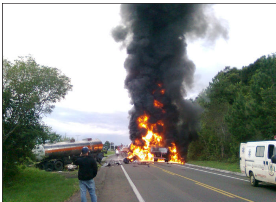
Fogo assustou quem estava no local do acidente