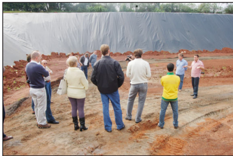
Segunda das 29 ações foi lançada nesta semana

A construção da segunda vala respeitou as exigências legais da Fepam, com Licença de Operação reconquistada em