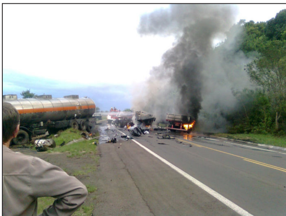
Trânsito ficou bloqueado por quatro horas

> Foragido é capturado - Um jovem venâncio-aiense foi detido, na manhã desta quinta-feira, dia 9, em Lajeado. Ele tem 28 anos e foi preso pela Brigada Militar por volta das 10h30min, quando pilotava uma moto Honda, com placas de Venâncio Aires. O jovem é foragido da Justiça e responderá também a processo por estar de posse de veículo furtado. O outro elemento que estava na carona da moto conseguiu fugir para matagais e não foi localizado. O jovem foi encaminhado para o presídio regional de Lajeado.