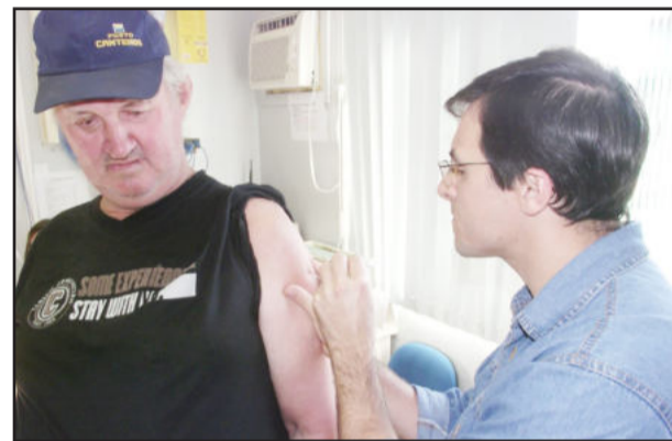
Procura pela vacina contra a gripe está pequena em Paverama