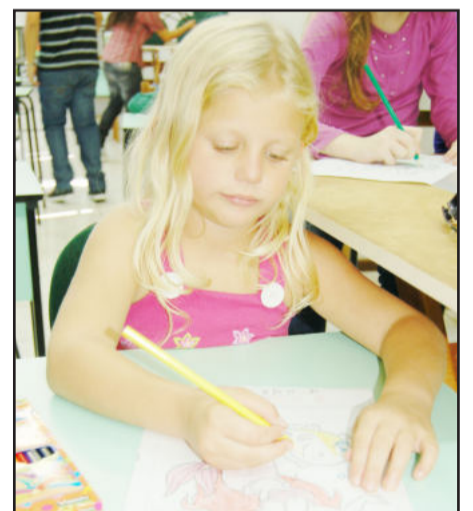
Desenho foi outra atividade para as crianças