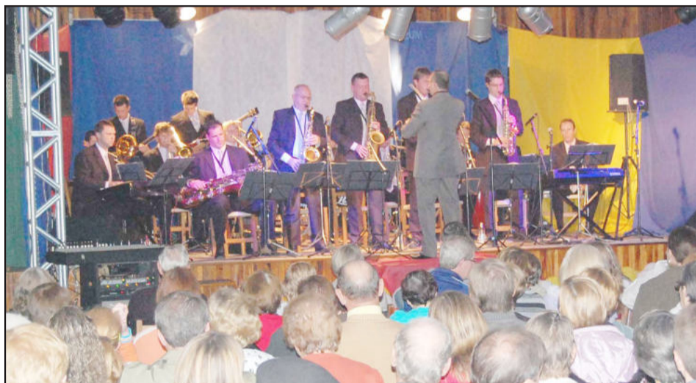
Excelente público prestigiou o show da Orquestra

Com o lançamento do livro está iniciada a pré-produção do primeiro curta-metragem de Imigrante. Se você quiser participar do filme, tem entre 16 e 40 anos, mande e-mail para contato@emiliospeck.com.br. A primeira seleção será nos dias 18 e 19 de junho, em Imigrante.