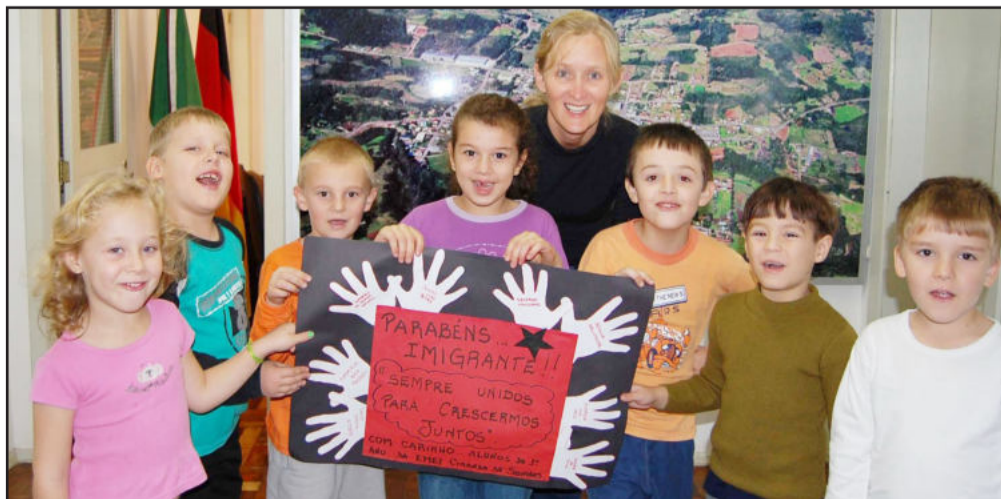
Alunos deixaram uma bela mensagem

Deixaram um cartaz com uma bonita mensagem: “Parabéns Imigrante! Sempre unidos para crescermos juntos”. Com carinho: alunos do 1º ano da EMEI Ciranda de Sonhos.