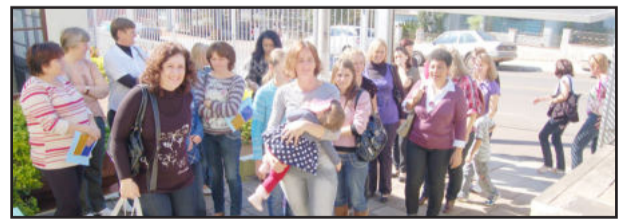
Mães e filhos foram recepcionadas ao som da banda