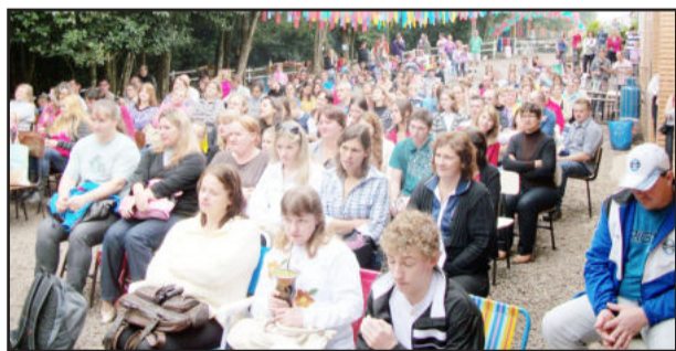
Muitos pais e moradores do bairro estiveram presentes