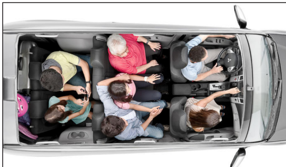
Espaço interno para 7 pessoas