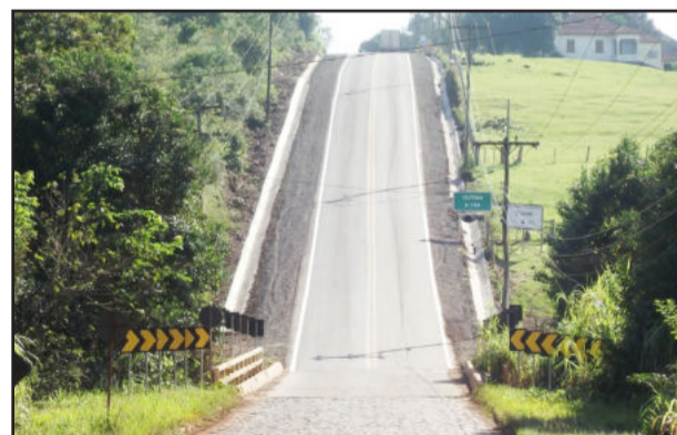
Melhorias na Transvale

Outra melhoria providenciada é a colocação de leivas de grama no acostamento e a conclusão do acostamento com brita. Tudo isso, além de embelezar e dar dinâmica ao trânsito, é de suma importância para pessoas que transitam na rodovia, para a comodidade e a segurança dos motoristas.