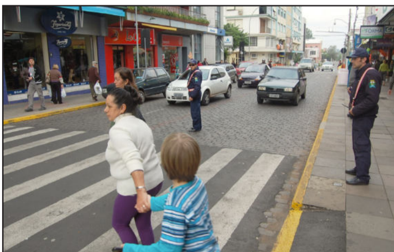
Trabalho de conscientização no trânsito é constante em Lajeado