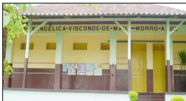
Escola Visconde de Mauá, em Morro Azul, é uma das contempladas com o Programa Escola Ativa

Na próxima semana será realizado o primeiro encontro de estudo entre o professor tutor e os professores que atuam nas escolas de campo de Paverama para dar início às atividades do Programa Escola Ativa.