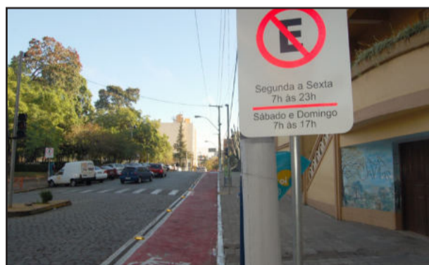
Ciclovia em Lajeado tem horários para estacionar

No trecho entre o prédio principal do colégio e o ginásio fica proibido o estacionamento dos veículos sobre a faixa de ciclovia no horário das 7h às 23h, de segunda a sexta-feira. Aos sábados e domingos, a restrição vale para o horário das 7h às 17h. Já na área localizada em frente à propriedade dos Irmãos Maristas, que se estende desde a divisa com o colégio até a Rua Oswaldo Aranha, a proibição de estacionamento sobre a faixa de ciclovia fica restrita ao horário das 7h às 19h, de segunda a sexta-feira, e das 7h às 17h, em sábados e domingos.