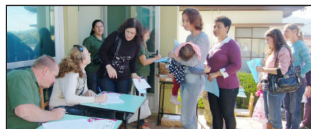
Mães recebem certificado de participação na palestra