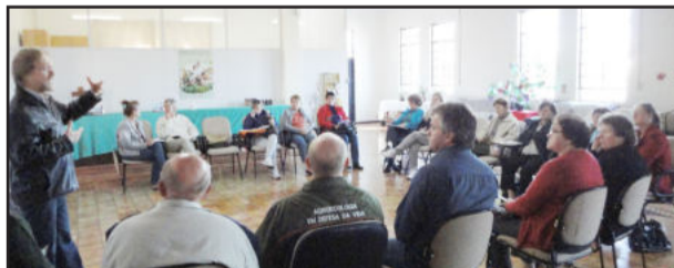
Parceria entre CAPA e Prefeitura é pioneiro na região