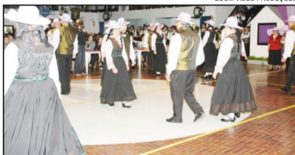
ZOOM VIDEO PRODUÇÕES

Após o pronunciamento do vice-prefeito, um casal representante de cada grupo recebeu do anfitrião uma lembrança. Para finalizar com chave de ouro as apresentações, comemorar os 20 anos do grupo e o 10º Teutobier und Tanzfest, os integrantes do Teutotanzgruppe apresentaram o novo traje, que teve o patrocínio da Certel, além dos recursos obtidos pela Lei de Incentivo a Cultura (LIC). O grupo também agradece aos 31 apoiadores do evento. Após as apresentações, a festa continuou com a banda Hórus.