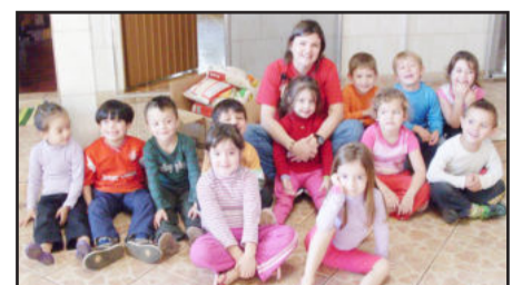
Creche Dente de Leite