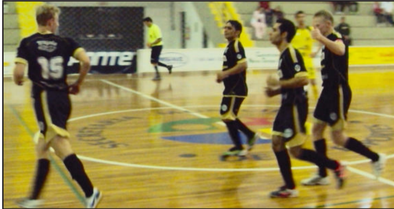
Atletas comemoram vitória conquistada nos últimos minutos