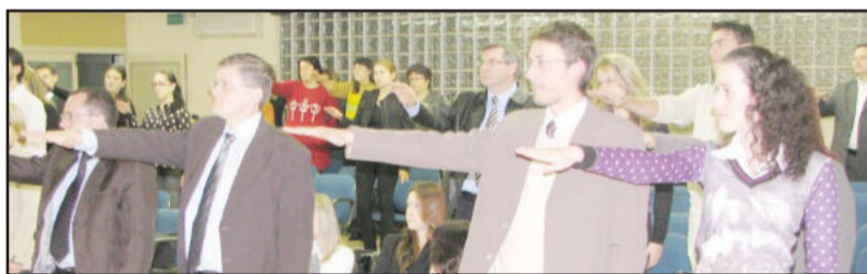
Advogados reafirmaram o juramento