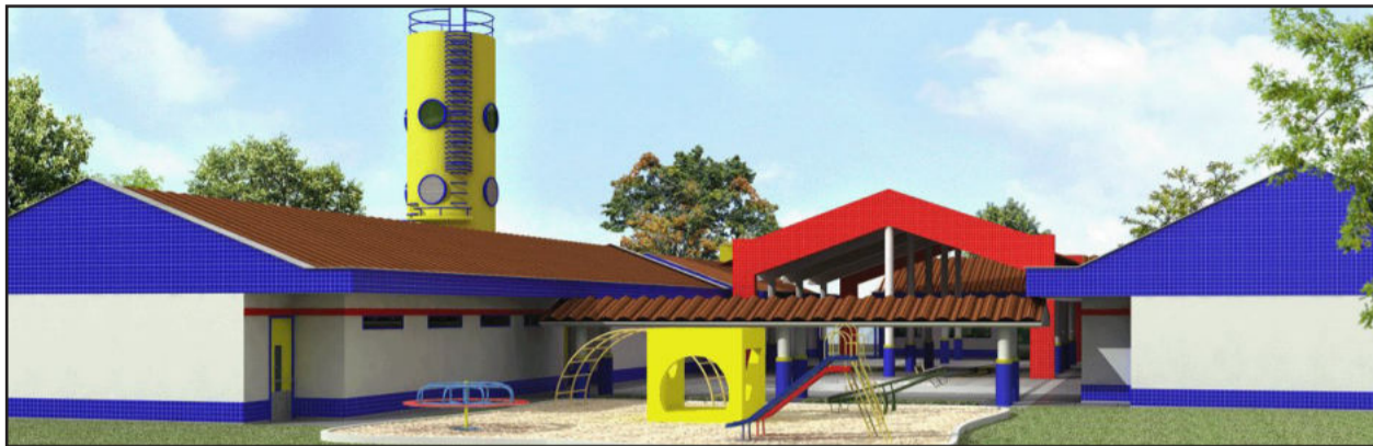
Modelo da futura Escola Infantil segue padrão do governo federal

A Secretaria Municipal de Obras trabalha intensamente na conclusão da terraplenagem para a construção da futura Escola Municipal de Educação Infantil (EMEI) Pró-Infância, que ficará localizada na Rua 05 de Março, próximo ao CTG Estância do Siqueira. Os trabalhos seguem, inclusive, nos finais de semana para agilizar as obras. A construção está licitada em R$ 1.420.793,61 e a conclusão programada para 10 meses. A Construtora C. A. Kappes começou as obras no dia 2 de maio.