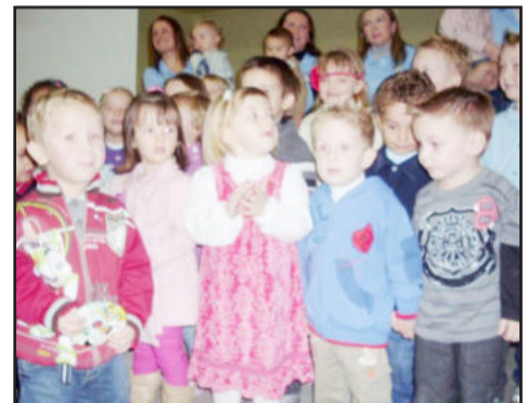
Homenagem às mães