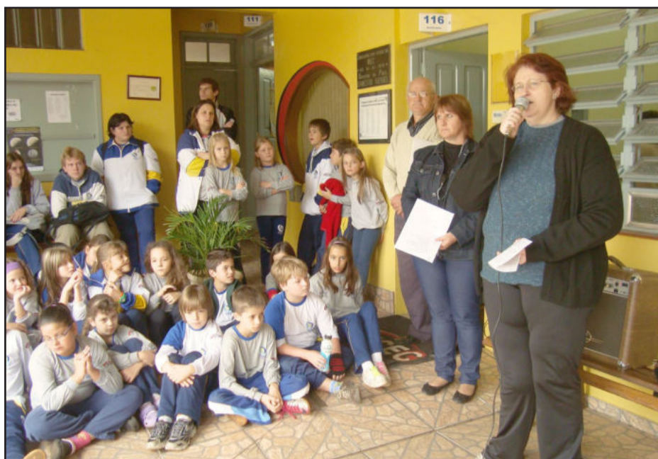
Ieceg lançou projeto para preservação ambiental

Busca-se desencadear um processo de conscientização, mas, mais do que isso, uma mudança de postura da comunidade. Em um momento onde o planeta parece começar a reagir contra a degradação humana, o Ieceg busca contribuir, fazendo a sua parte, para que possamos dar de presente as futuras gerações um planeta habitável.