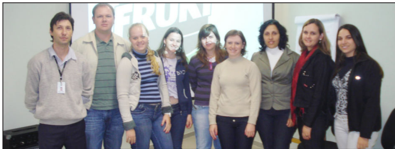
Formação encerrou com visita técnica à empresa Fruki

Preparar futuros gerentes para a condução do processo de implantação e manutenção da Gestão pela Qualidade nas organizações e ensinar a lidar com a mudança organizacional, considerando aspectos comportamentais, motivacionais, metodológicos e práticos para que seja gerenciada a melhoria contínua e aplicados os fundamentos da Gestão pela Qualidade à rotina. Esses foram os principais objetivos da "Oficina Gerencial para a Qualidade", promoção da CIC Teutônia e FORS Desenvolvimento Organizacional.