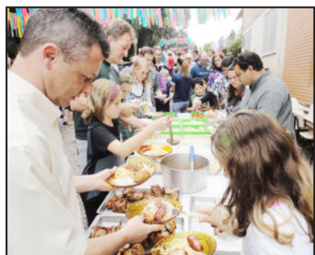
Almoço preparado pelos pais é muito aguardado e saboreado