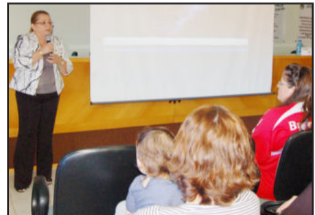
Palestrante falou sobre Mulher e Trabalho