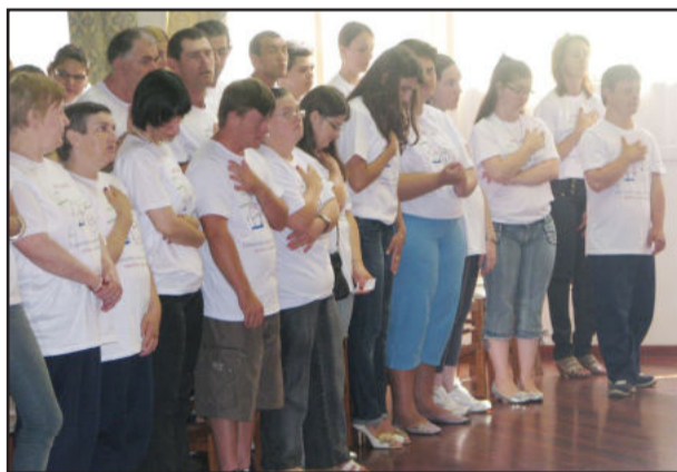
Alunos durante os festejos de 40 anos da escola

Mãos que acolhem e apoiam o ser humano, representado na flor da margarida, o símbolo da Apae é, hoje, a mostra clara da solidariedade, da inclusão social. A escola atende a 135 alunos das cidades de Garibaldi, Boa Vista do Sul e Coronel Pilar.