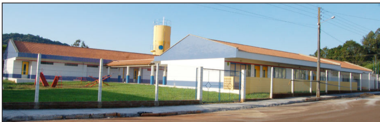
EMEI Sonho de Criança funcionará em prédio construído no Bairro Canabarro

Esta será mais um importante evento durante o mês de aniversário de 30 anos de Teutônia, a ser comemorado no dia 24 de maio. A programação oficial será de 24 a 29 de maio, com a Festa de Maio.