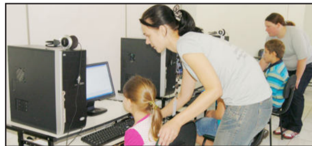
Crianças tiveram aula de informática durante a palestra