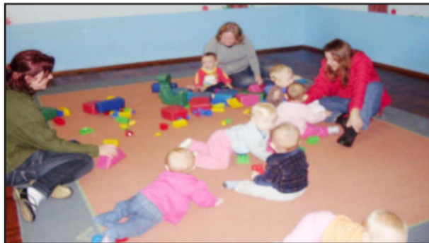
Brincando com seus filhos