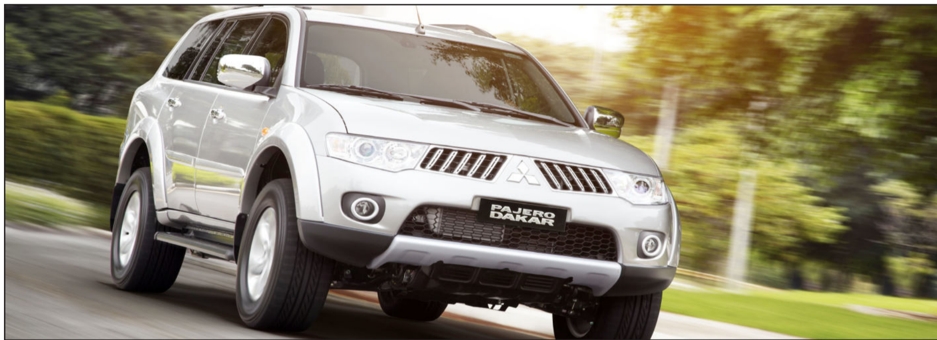
Pajero Dakar: utilitário esportivo ganha padrão HPE, de um veículo completo com itens de série exclusivos

O Mitsubishi Pajero Dakar 2012, agora produzido na fábrica de Catalão (GO), chega às concessionárias a partir de abril. A sigla HPE (High Performance Equipment) foi incorporada ao modelo 2012, reforçando que o Pajero Dakar é um veículo completo com grande diferencial no mercado e proporciona mais segurança e conforto ao motorista e passageiros.