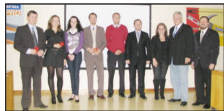
Advogados que receberam carteirinhas, coordenador das subseções e presidente da OAB