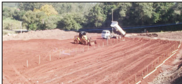
Terraplanagem para a futura escola está em fase de execução

O projeto consiste em uma sala para a secretaria, duas salas onde alojarão as crianças, playground coberto e um anfiteatro para apresentações artísticas, conforme projeto do Ministério da Educação.