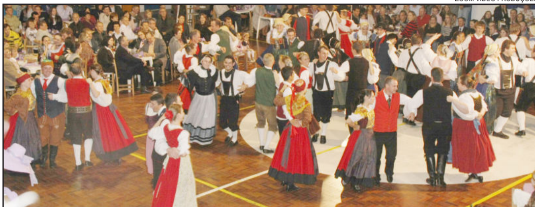
ZOOM VIDEO PRODUÇÕES