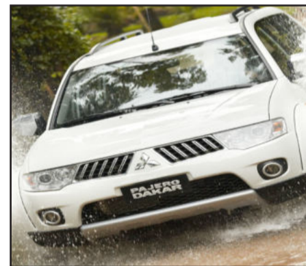
Tração nas quatro rodas

O veículo mede 4.695 mm de comprimento, 1.815 mm de largura, 1.840 mm de altura com rack e entre-eixos de 2.800 mm, resultando em um excelente espaço interno.