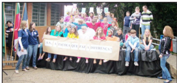
Apresentações dos alunos foi muito elogiada pelos pais

O objetivo maior da Festa da Família da EMEF Alfredo Schneider foi alcançado, conforme avaliação da equipe diretiva, “pois tivemos a participação de um número expressivo de pessoas da comunidade escolar e moradores do bairro. A integração e a diversão que marcaram o dia são a prova maior da importância que as instituições escolares ainda têm em suas comunidades e, por isso, eventos assim devem ter continuidade”.