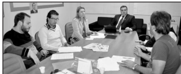
CTP de planejamento Urbano vai apresentar relatório sobre proposta de alteração de Lei

Os integrantes da CTP analisaram vários pontos da proposta, assim como sua interação com demais legislações ambientais vigentes. De acordo com os profissionais, a legislação deve preservar o meio ambiente e, ao mesmo tempo, propiciar a instalação de empresas que adequem-se a critérios previamente definidos.