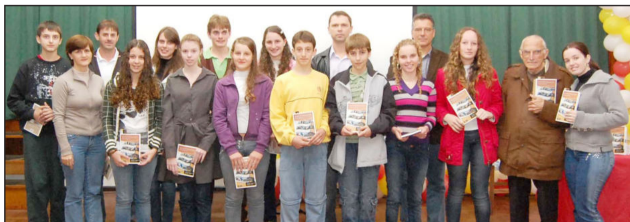
Alunos participantes e homenageados