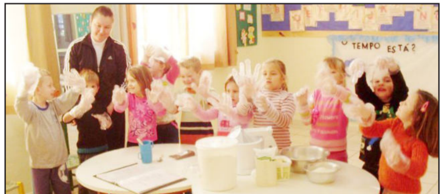
Culinária com as mães