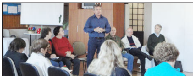
Prefeito (em pé) destacou relevância do convênio

Os Grupos de Saúde Comunitária fazem parte de um programa do Sínodo Vale do Taquari da IECLB e do Centro de Apoio ao Pequeno Agricultor (CAPA). Através de convênio pioneiro na região, firmado com a Prefeitura de Teutônia, o CAPA desenvolve diversas atividades, entre as quais estão: assessoria técnica em agroecologia para a formação de hortas, orientação para grupos no preparo e uso correto de plantas medicinais, cuidados com a alimentação e saúde.