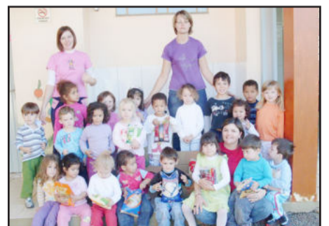
Creche Meu Cantinho