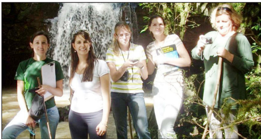
Profissionais fizeram levantamento da situação ambiental nas comunidades de Garibaldi

Assim, o novo Plano Ambiental possibilitará a implantação de políticas ambientais para a correção, controle e monitoramento de atividades potencialmente causadoras de degradação ambiental, e para projetos de manejo e educação ambiental.