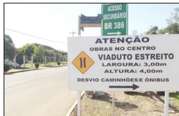
Desvio do trânsito no Centro para obras da nova passagem pela ferrovia

getas e alargamento da via serão necessárias para o movimento que terá durante o período da construção do viaduto.