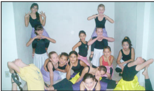
CEMEF turma infantil: coreografia Agita Hê

- em Canudos do Vale/RS, homenageando a Arte e os Especiais, com CEMEF e APAE.