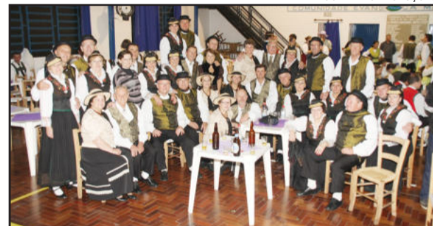
ZOOM VIDEO PRODUÇÕES