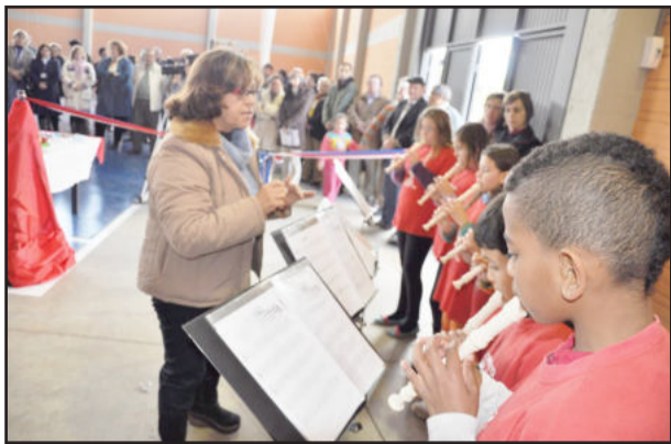
Alunos da oficina de flauta do Projeto Vida Moinhos mostraram seu talento musical