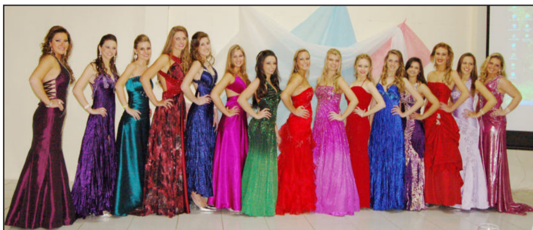
As 15 candidatas estavam muito bonitas