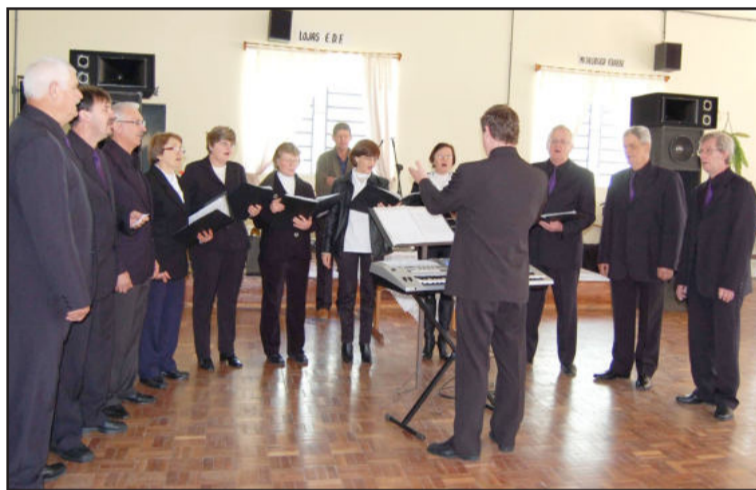
Coral Vozes será o anfitrião no dia 28