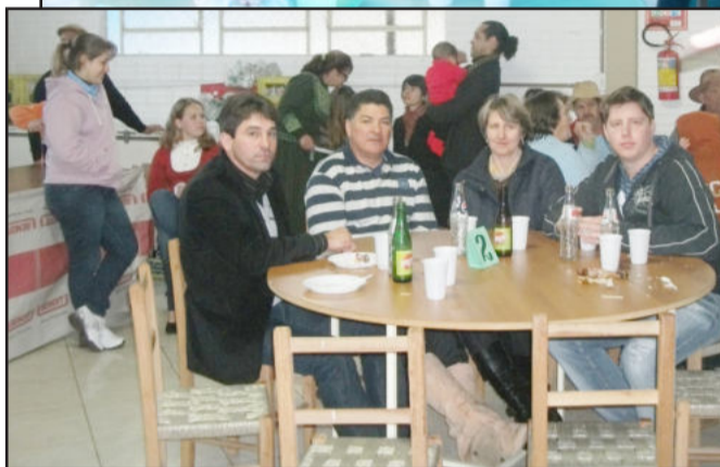
Presença de lideranças no evento