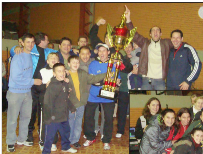
Funerária Costa (no alto em laranja) conquistou o título no Força Livre.