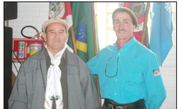
Patrão (d) e vice do Querência Amada