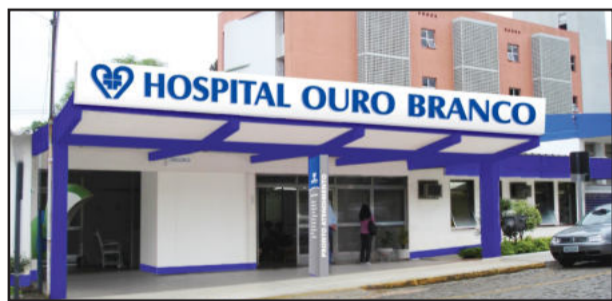
Hospital Ouro Branco

A governadora do Estado Yeda Crusius autorizou, na quarta-feira, dia 4, o repasse de R$ 100 mil ao Hospital Ouro Branco, de Teutônia, para a conclusão da área física da Central de Material Esterilizado. O convênio firmado com a Associação Beneficente Ouro Branco, mantenedora do hospital, e a Secretaria Estadual da Saúde, tem o objetivo de proporcionar um ganho de eficiência, aumentando a qualidade do atendimento oferecido pela instituição aos pacientes do Sistema Único de Saúde (SUS).