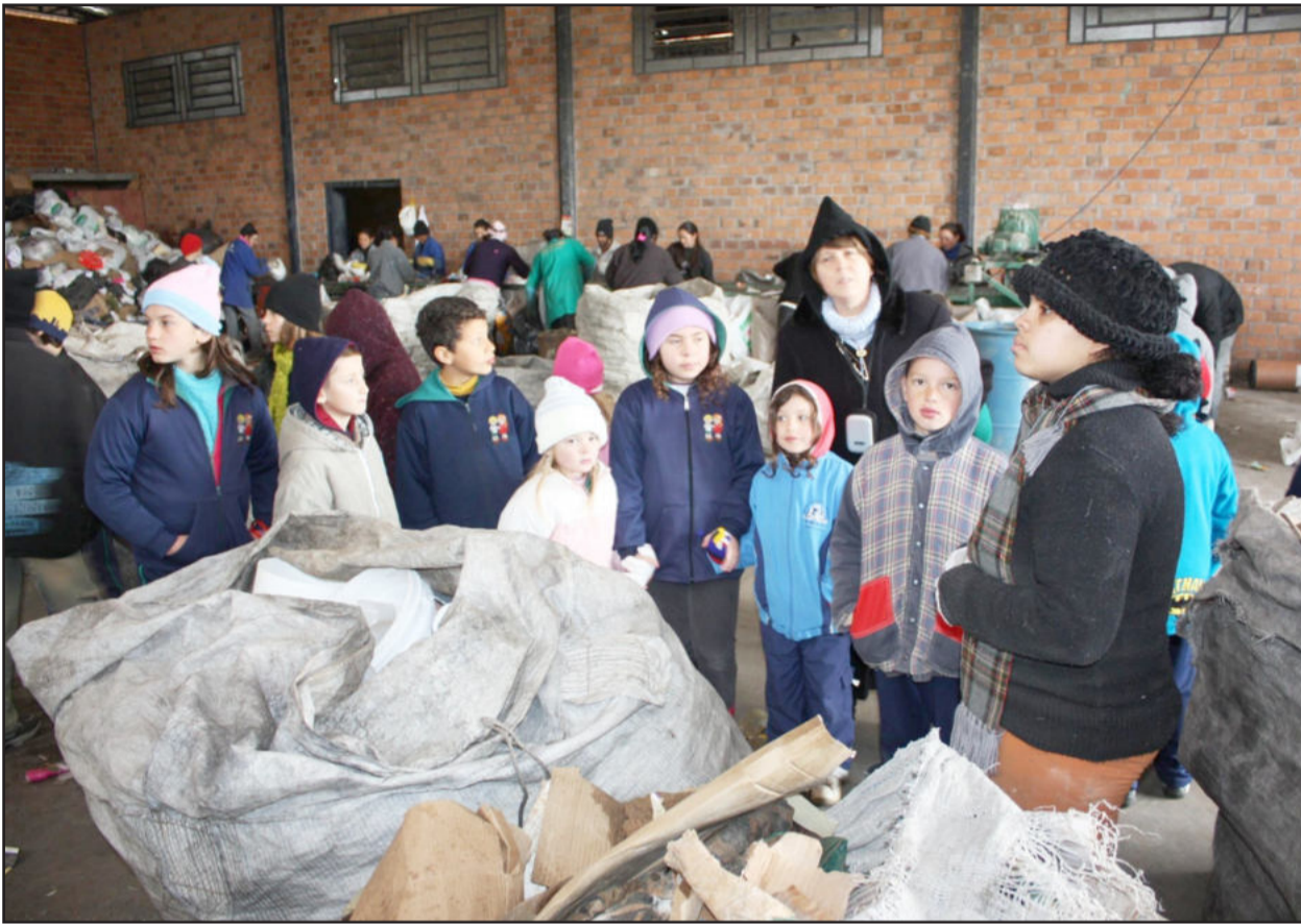
Estudantes em visita na Cocomreg