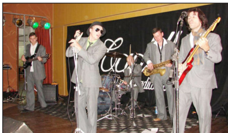
Banda Cadillac recordou músicas dos anos 50, 60 e 70

Demonstrando a lisura e a transparência do concurso, a comissão organizadora disponibiliza a nota total de cada candidata em cada um dos três pontos principais (Cultural, Vídeo e Passarela). A consulta pode ser feita pessoalmente na Secretaria Municipal de Cultura e Turismo.