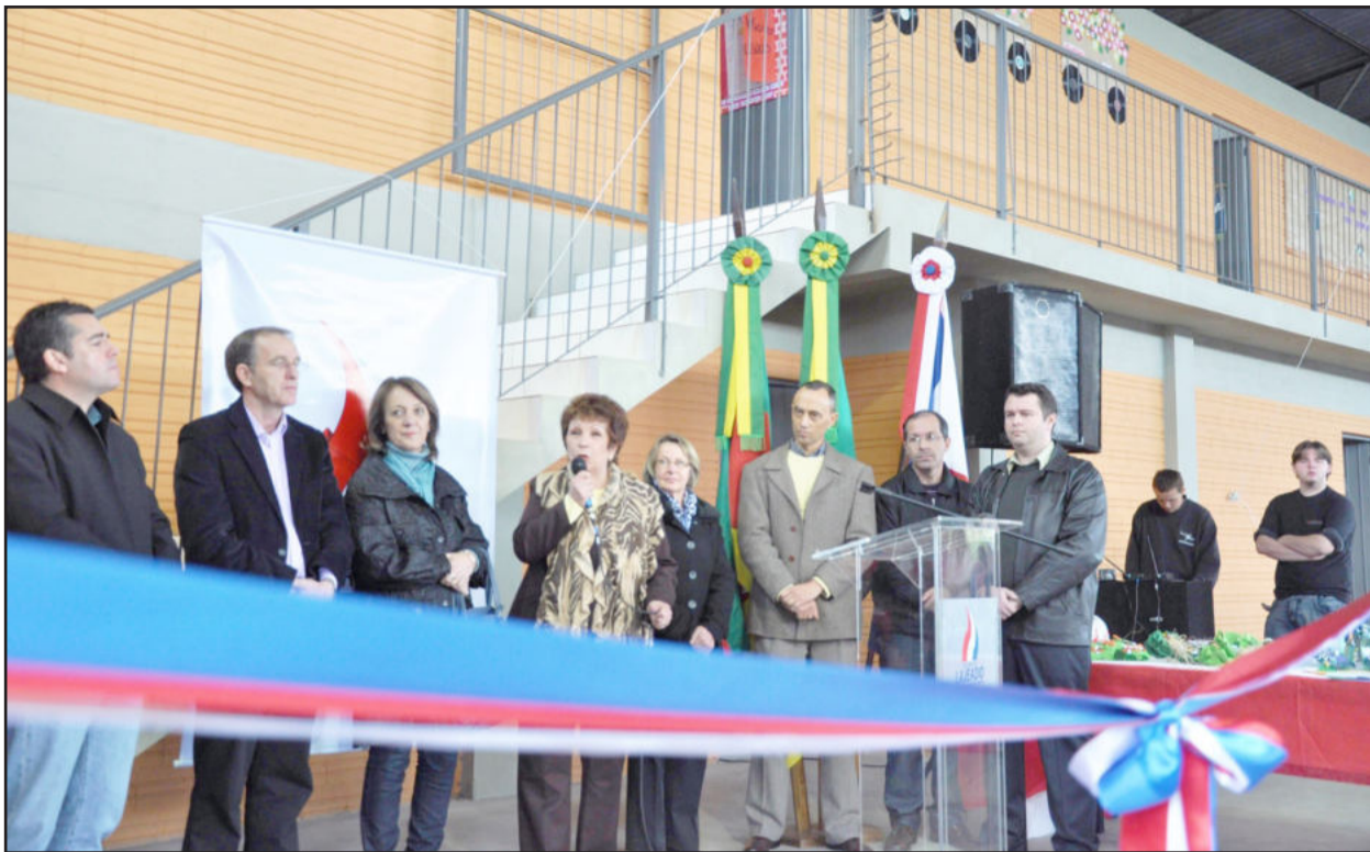
Prefeita exaltou o investimento nesta obra pelo bem-estar da comunidade