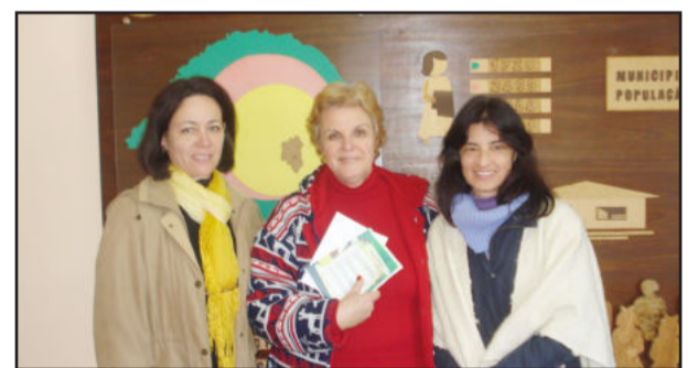
Familiares fizeram a entrega dos exemplares na 3ª CRE