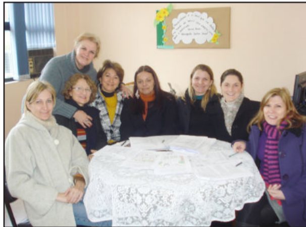
Comissão da 3ª CRE na avaliação dos trabalhos

A 3ª CRE parabeniza a todas as escolas participantes deste concurso na etapa de Coordenadoria!