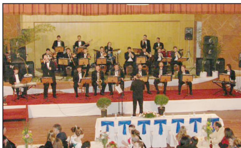
Orquestra Municipal novamente deu um show a parte na abertura do evento