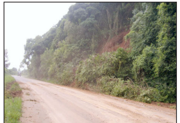
Desmoronamento foi na rodovia de acesso ao Município