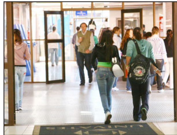
Pedidos no Setor de Atendimento ao Aluno

A Univates está com inscrições abertas para transferências (internas ou externas), reingressos e ingressos mediante diploma de curso superior. Pedidos podem ser efetuados no Setor de Atendimento ao Aluno, Prédio 9, ou na Secretaria do câmpus de Encantado.