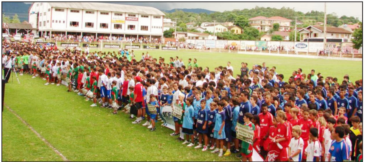
Abertura contou com o desfile das equipes no estádio da SER Gaúcho

Nesta segunda-feira, dia 10, mais 61 jogos completam a primeira rodada. Para terça e quarta-feira estão marcados cerca de 60 jogos por dia, a serem disputados em 10 praças esportivas de clubes amadores da cidade. Na quinta-feira, dia 13, inicia a fase eliminatória, culminando com as finais,