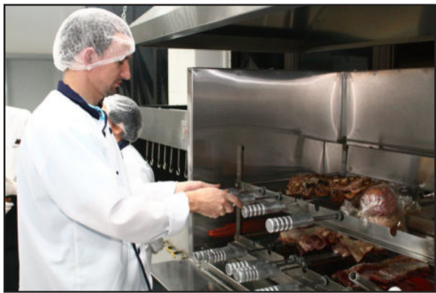
Curso é referência internacional de restaurantes e churrascarias

Estão abertas, até o dia 24 de fevereiro, as inscrições para o Curso de Gastronomia Gaúcha da Univates. A atividade, que visa a formar profissionais com conhecimentos na culinária do Rio Grande do Sul, focando os principais aspectos da cultura e prestação de serviços em churrascarias e restaurantes, será dividida em duas turmas. A primeira, que terá aulas às segundas, terças e quartas-feiras, inicia no dia 28 de fevereiro. Já a segunda, que ocorre às sextas-feiras, inicia no dia 11 de março.