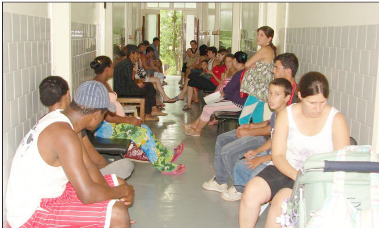
Procura por atendimentos no CAS neste início de ano continua intensa

População avalia positivamente serviços prestados na Saúde