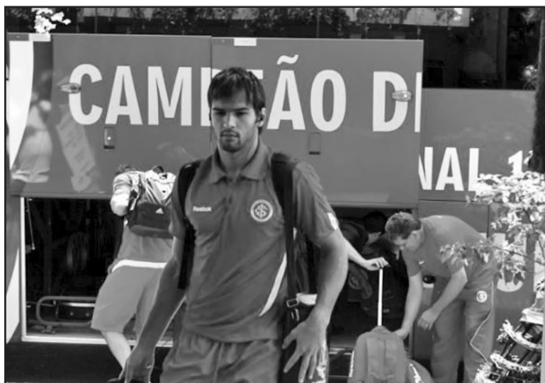
Passagem dos jogadores foi discreta

Na tarde de domingo, dia 9, a equipe venceu o amistoso contra o São José de Porto Alegre pelo pla-