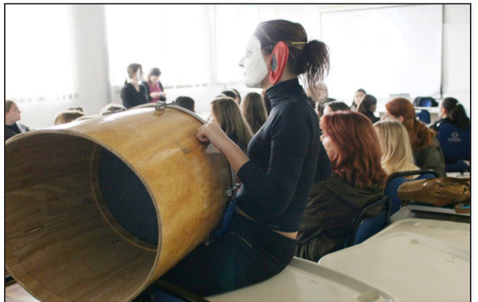
Intervenção visa a instigar novas formas de comunicar e trabalhar com o pensamento