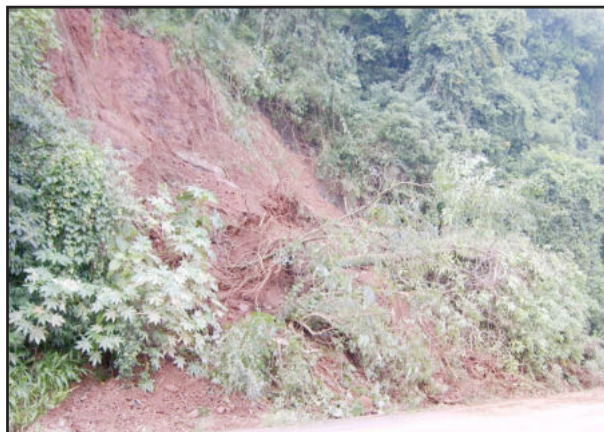
Barranco e árvores levados pela água

Pedras e árvores interromperam a pista por cerca de 2 horas, na noite de domingo. As máquinas da Prefeitura começaram a efetuar a limpeza logo após o desmoronamento. Os trabalhos estavam previstos para serem terminados na tarde desta segunda-feira, assim que a terra secasse. Em Linha Herval e 11 de Novembro ocorreram estragos nas valetas e bueiros entupidos, que também foram limpos nesta segunda.