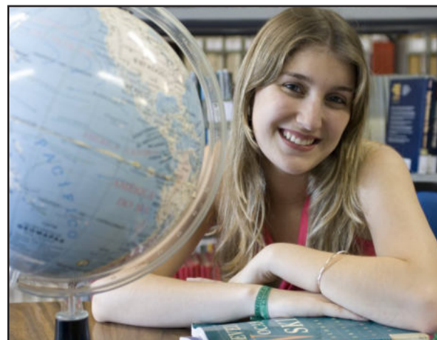
Cursos possuem diversos níveis de aprendizado

Inscrições podem ser efetuadas pelo site www.univates.br/cursosdeextensao ou na Secretaria de Extensão e Pós-Graduação, sala 110 do Prédio 1. Mais informações podem ser obtidas pelo telefone (51) 3714-7011 ou pelo e-mail interlinguas@univates.br .