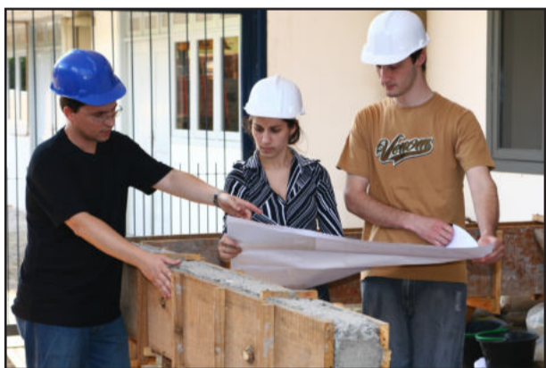
Técnico em Segurança é um dos cursos

Estão abertas, na Univates, as inscrições para os Cursos Técnicos. São nove opções oferecidas somente no campus de Lajeado: Edificações, Enfermagem, Informática, Nutrição e Dietética, Química, Saúde Bucal, Segurança do Trabalho, Telecomunicações e Vendas. Para ingressar, o aluno não precisa ter o Ensino Médio completo, passar por processo seletivo ou pagar taxa de inscrição. As vagas são preenchidas de acordo com a ordem de matrícula.