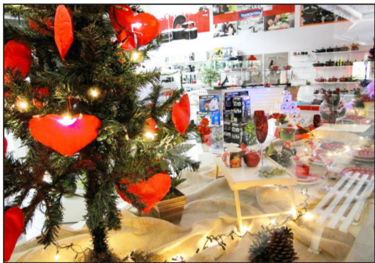
Agrocenter ornamentou três vitrines com temas distintos, com espaço, inclusive, para a dupla Grenal

A edição 2010 do concurso Mais Bela Vitrine Natalina de Teutônia, organizada pela vice-presidência do Comércio da CIC Teutônia, foi a primeira que contou com a participação da empresa Agrocenter Languiru. E logo na estreia, a empresa que integra o ramo de segmentos e atividades da Cooperativa Languiru, conquistou o 3º lugar.