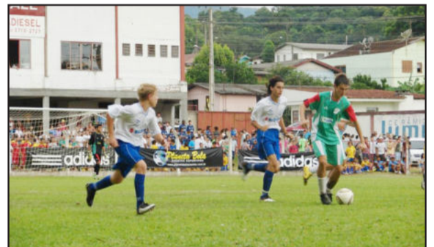
Juventus 95 estreou com goleada de 8 a 0 sobre o Tupy de Santa Catarina