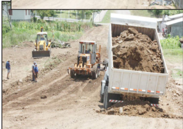
Rua está sendo preparada