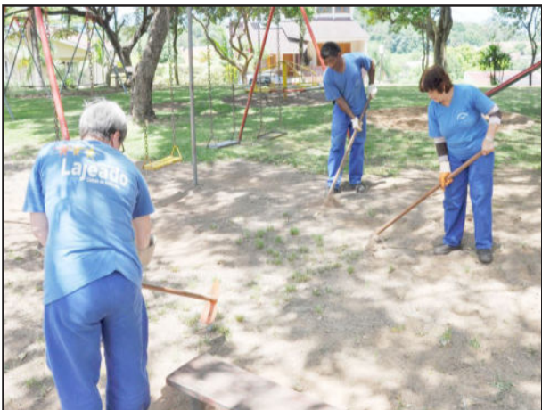
Praça Viva Vida recebeu capina e teve os inços retirados

brinquedos destinados às crianças; pinturas nos bancos, bem como reformas e pintura padronizada com a cor salmão nas muretas danificadas. Além disso, na Praça Viva Vida foi feita a capina e retirada dos inços. De acordo com o secretário, gradativamente e de forma rotineira o município faz a revitalização e manutenção de todas as praças do município, bem como os parques e demais espaços de lazer existentes.