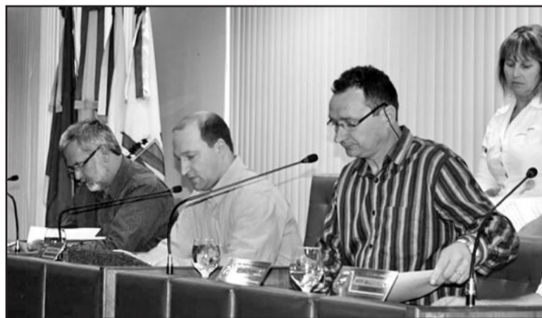
Mesa diretora Câmara de Vereadores de Bento Gonçalves

Vice-prefeito - Salário atual: R$ 8.095,33. A partir de