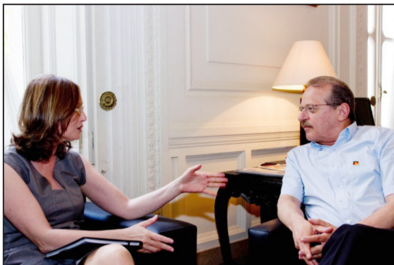
O governador Tarso Genro, em audiência com a ministra da Secretaria de Direitos Humanos da Presidência da República, Maria do Rosário

A ministra destacou a apresentação de um plano para o reforço dos Conselhos Tutelares e Conselhos de Direitos nas cidades e regiões onde é forte a violência e a exploração sexual de crianças e adolescentes. “O governador Tarso Genro me pediu atenção especial às pessoas com deficiência, especialmente aqueles que