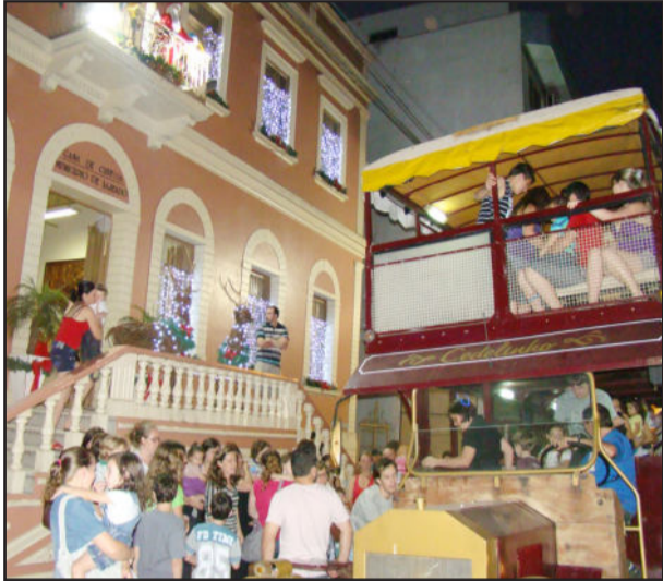
Saída para os passeios foi em frente à Casa de Cultura

Cedelinho: 85% mais pessoas circularam no período de Natal