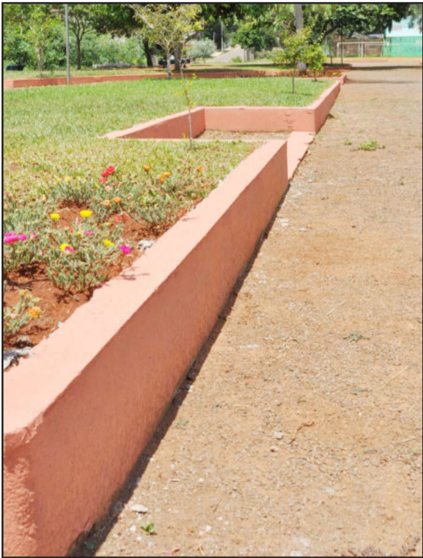
Muretas das praças estão sendo pintadas na cor salmão, como no Bairro Campestre