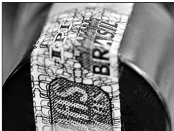
Selo é exigência federal