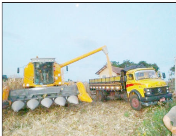
Sementes de milho são fornecidas pelo sistema “troca-troca”

Mais informações são possíveis pelo telefone (51) 3981-1055.