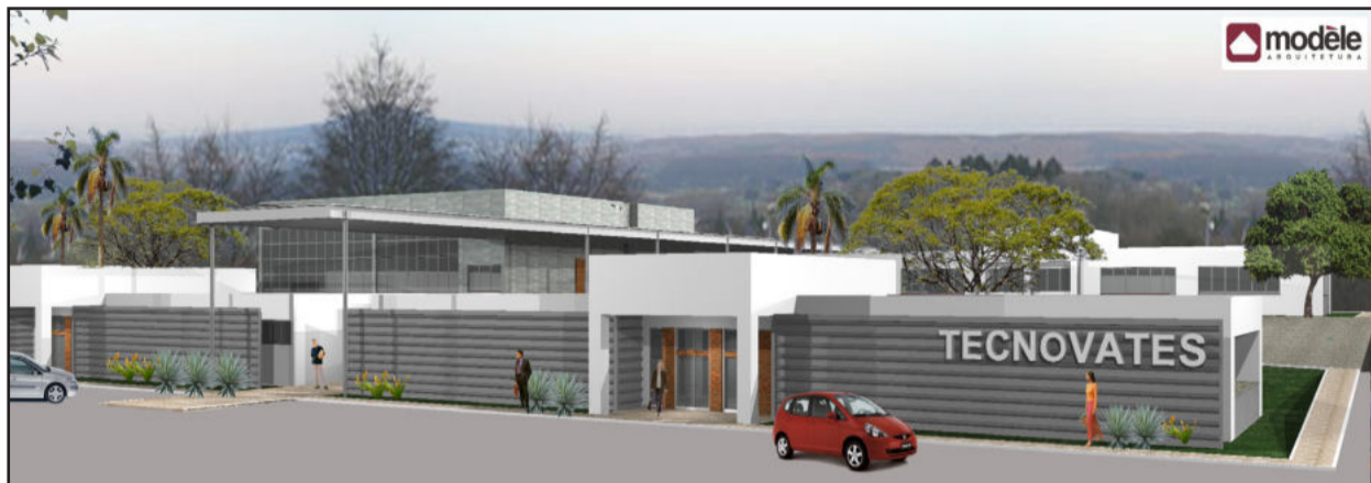
Projeto das futuras instalações do Tecnovates/Univates

Foram aprovados, pelo Ministério da Ciência e Tecnologia (MCT) e pela Secretaria de Ciência e Tecnologia (SCT) do Rio Grande do Sul, os projetos do Parque Tecnológico Tecnovates, que será implantado no câmpus da Univates de Lajeado. Os projetos agora seguem as tramitações burocráticas para assinatura de convênios, contratos, empenho dos valores e liberação, que devem ocorrer, conforme cronograma, de 2011 a 2013.