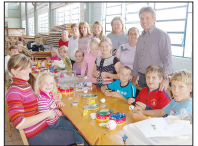
CRAS itinerante proporcionou aprendizado de trabalhos artesanais a adultos e crianças