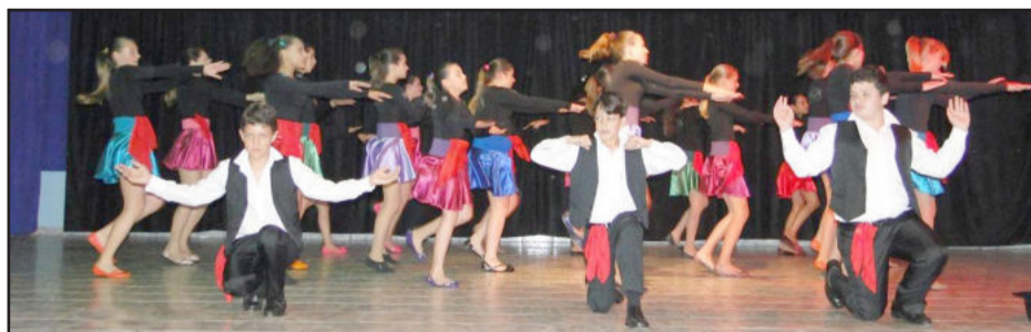
Grupo de Danças Argos