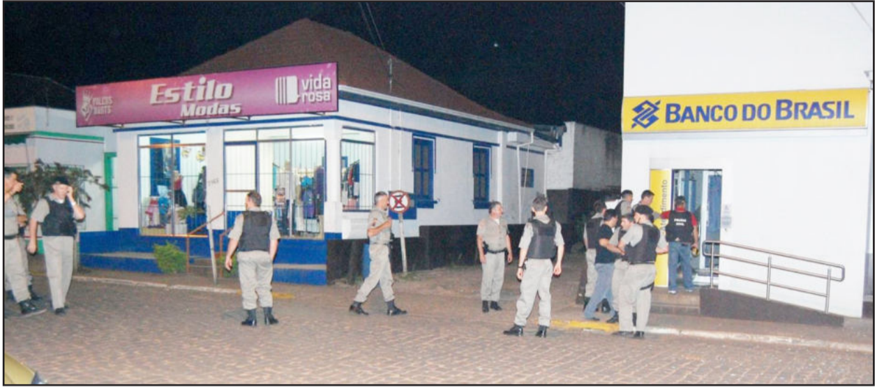
Após o assalto, intensa movimentação de policiais no local