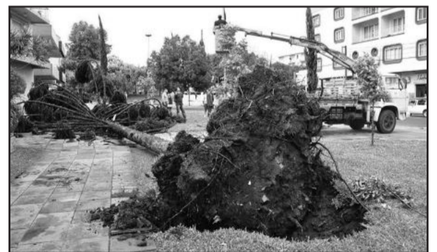
Força do vento derrubou árvores grandes

Em nenhuma das ocorrências da região há registro de feridos.