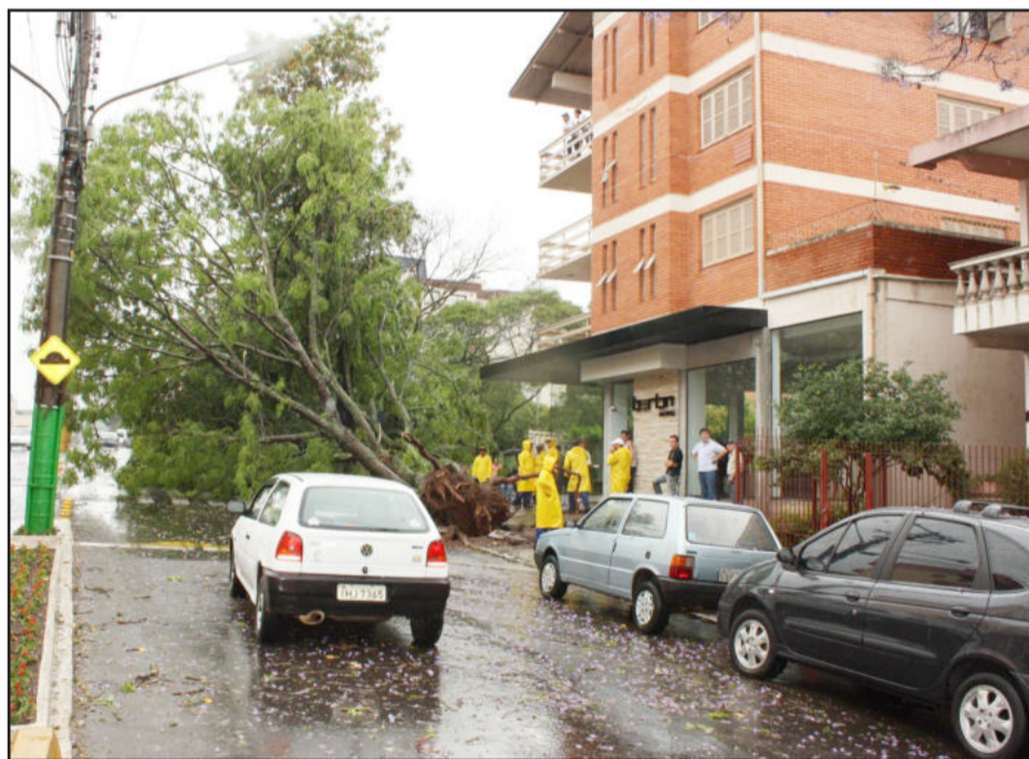
Em Garibaldi houve queda de árvores e destelhamentos

Temporal causa estragos na Serra e no Vale do Taquari Páginas 2 e 11