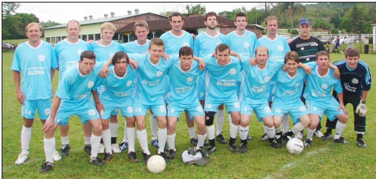
Juventude ainda não somou pontos

A competição é organizada pela Liga Estrelense de Futebol Amador (Lefa), em parceria com a Prefeitura de Estrela, por meio da Secretaria Municipal de Esportes e Lazer (Smel).