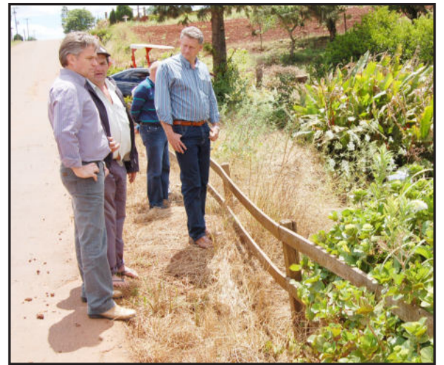
Com produtores rurais, prefeito acompanhou melhorias a serem realizadas

A proposta do projeto "Encontros Comunitários" é aproximar a administração municipal da população do interior e dos bairros, ouvindo as sugestões e as necessidades de cada localidade. Além disso, também é objetivo fazer a prestação de contas transparente das ações, mostrar como é a gestão dos recursos e serviços públicos, mostrar onde se aplica o dinheiro dos impostos e tornar a comunidade parceira da Administração para promover melhorias para o Município.