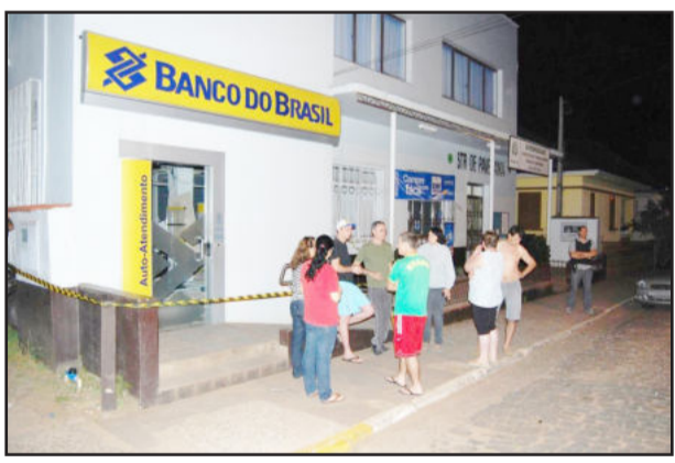
Episódio agitou a madrugada dos moradores