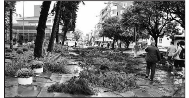
Vento derrubou árvores em Carlos Barbosa

Chuva e vento forte causaram transtornos em cidades da Serra na tarde desta terça-feira, dia 9, por volta das 14h. Em Carlos Barbosa, houve destelhamento de pelo menos 30 casas, além de danos no hospital e em uma creche e quedas de árvores. O Corpo de Bombeiros Voluntários registrou mais de 50 pedidos de socorro.