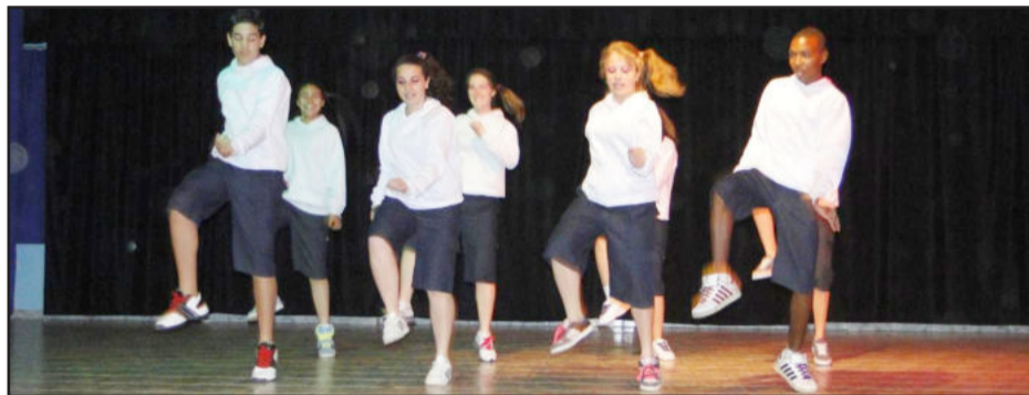
Grupo de Dança Corpo e Movimento