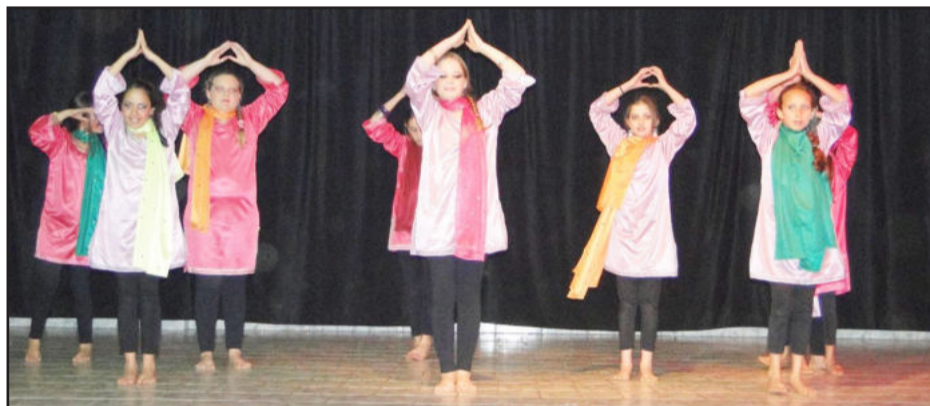
Escola 24 de Maio