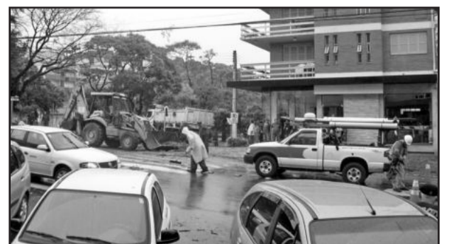
Bombeiros tiveram bastante trabalho