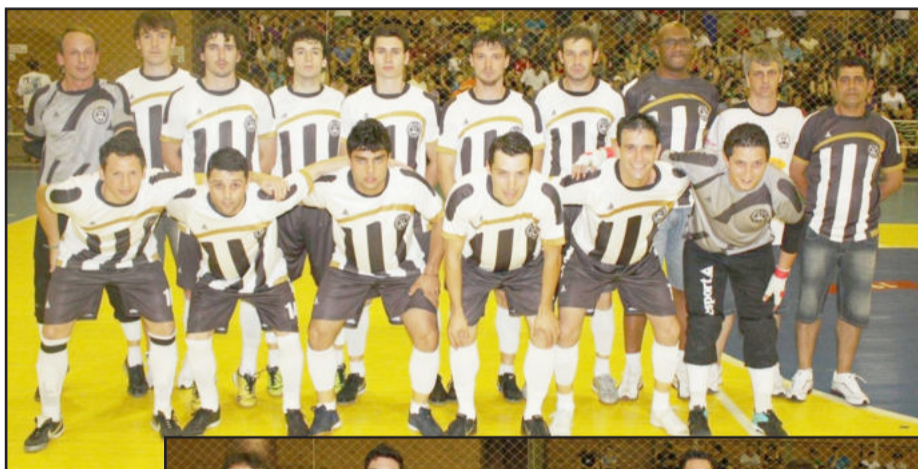
Udinese joga pelo empate

As duas partidas de volta serão realizadas amanhã, sexta-feira, dia 12, a partir das 20 horas, no Ginásio Municipal de Esportes em Garibaldi.