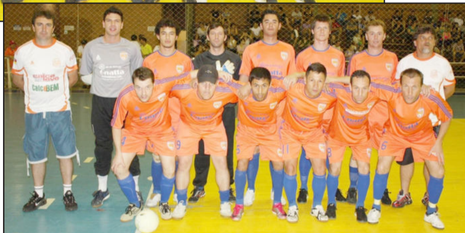
Gnatta/Los Gringos também está perto da final