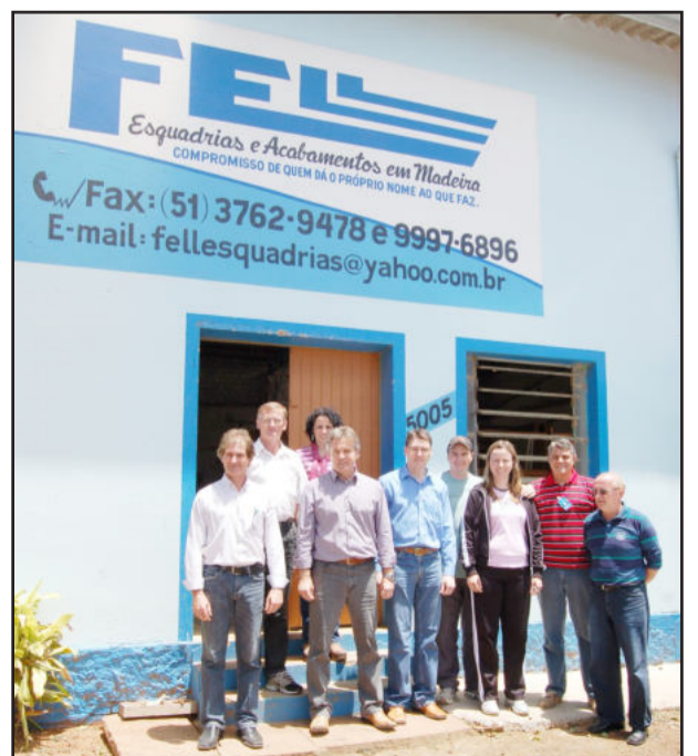
Defronte à Fell Esquadrias