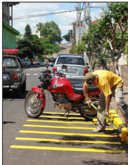
Estacionamento para motos foi implantado no Bairro Languiru