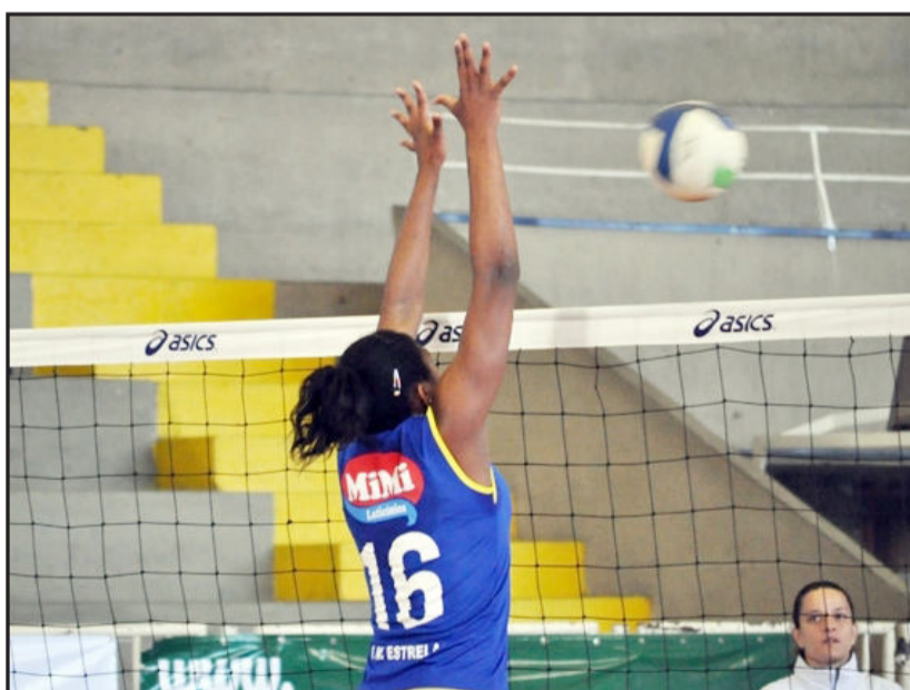
Bloqueio foi o fundamento de destaque nas últimas vitórias