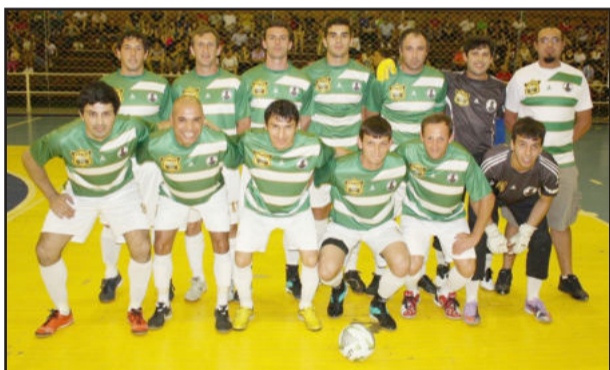
Los Godines precisa vencer duas vezes