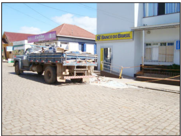
Remoção dos destroços iniciou ontem