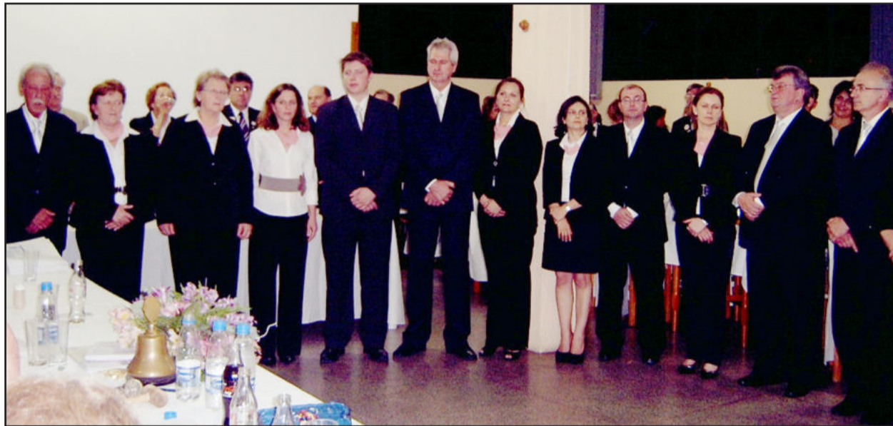
Oa 29 associados receberam o botom que simboliza a sua integração ao clube

O Município de Teutônia conta com mais uma organização de serviços voluntários. Trata-se o Lions Club, que foi fundado na noite desta segunda-feira, dia 8. O evento, realizado no restaurante Paladar, foi prestigiado por 140 pessoas de vários clubes, além de autoridades.