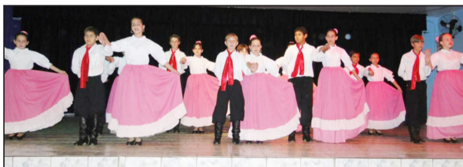
Escola Prof. Guilherme Sommer