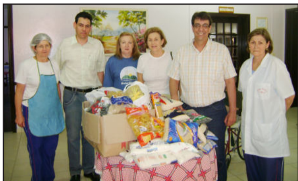
Entrega dos donativos no Lar dos Idosos

O Rotary, por sua vez, repassou os donativos arrecadados, cerca de 60 quilos de alimentos e roupas, ao Lar dos Idosos Opa Haus, o qual o Rotary tem auxiliado frequentemente, possibilitando a realização de ampliações, entre outras melhorias.