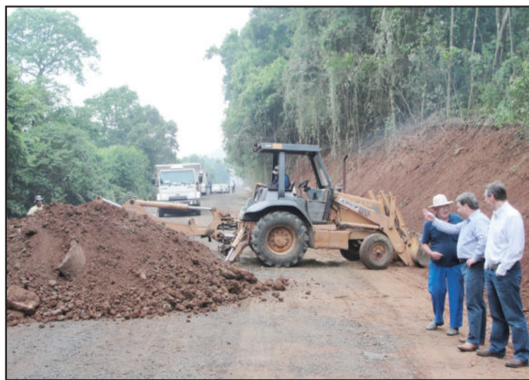
Reidel (c) verificou andamento das obras

O prefeito destaca a expectativa de liberação de novas verbas federais. "Recebi diversas ligações de Brasília durante esta semana agradecendo a votação. Maratá foi o segundo