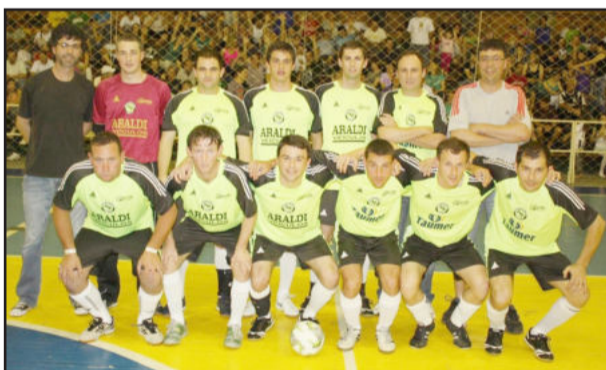
ACF também precisará de duplo esforço