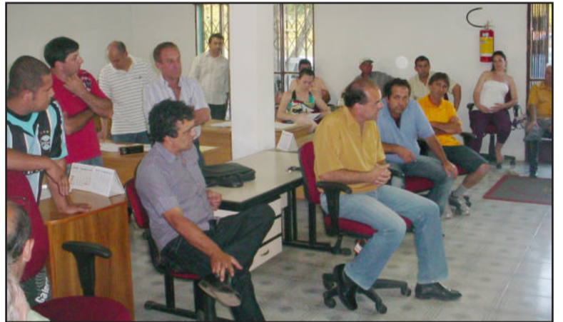
Vereadores, empresários e representantes do Executivo