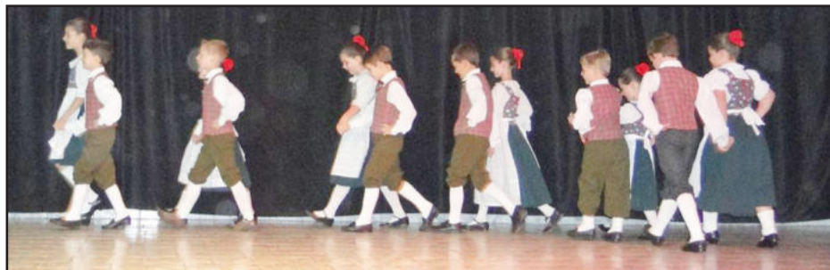
Grupo de Danças Folclóricas Origens