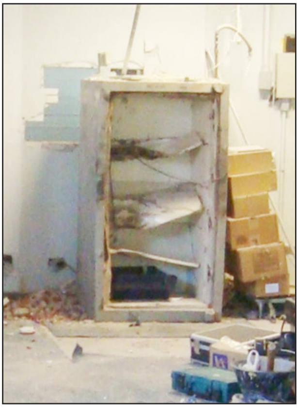
Cofre foi detonado