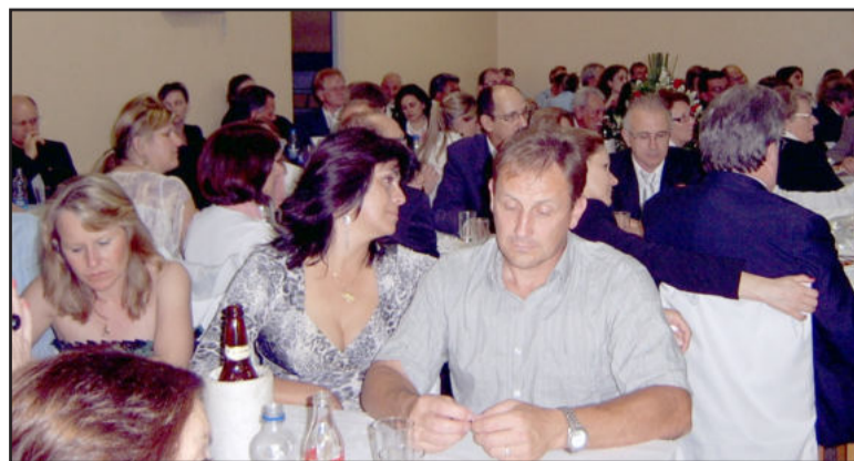
Cerca de 140 pessoas presentes ao evento