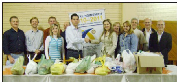
Parceria realizada com fins sociais