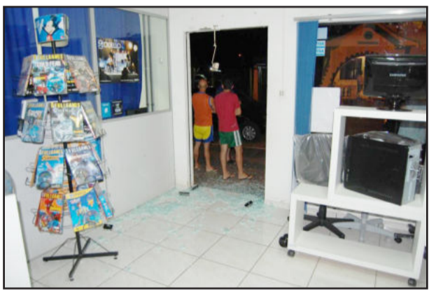
Loja de informática também foi atingida