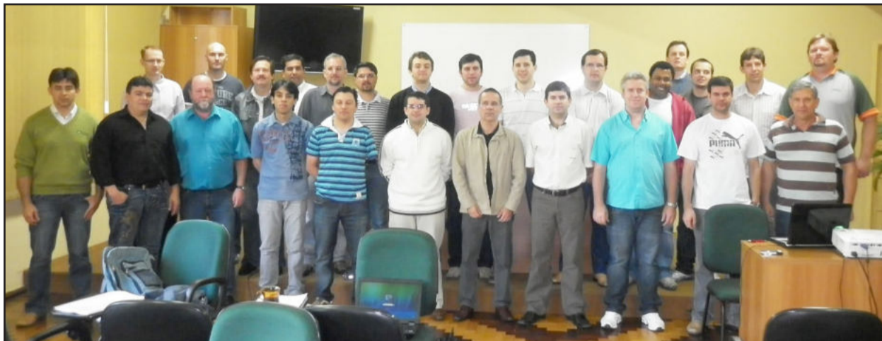
Formação realizada no Colégio Teutônia teve a participação de 25 engenheiros e eletrotécnicos

No mês de outubro, o Colégio Teutônia, por meio de seu Centro de Eletricidade, realizou o curso inédito Planejamento da Distribuição (PDD), que teve 80 horas de formação. A realização do curso teve a parceria da Federação das Cooperativas de Energia, Telefonia e Desenvolvimento Rural do Rio Grande do Sul (Fecoergs) e contou com a participação de 25 engenheiros e eletrotécnicos de cooperativas de eletrificação, como Coopersul (Bagé), Certaja (Taquari), Certel (Teutônia), Celetro (Cachoeira do Sul), Coprel (Ibirubá), Cerfox (Fontoura Xavier), Cermissões (Caibaté), Certhil (Três de Maio), Cooper-