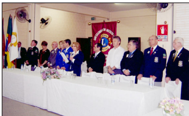
Lideranças do Lions prestigiaram a posse