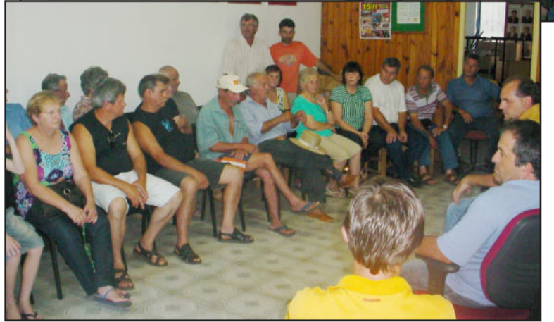
Presença da população na sessão da Câmara