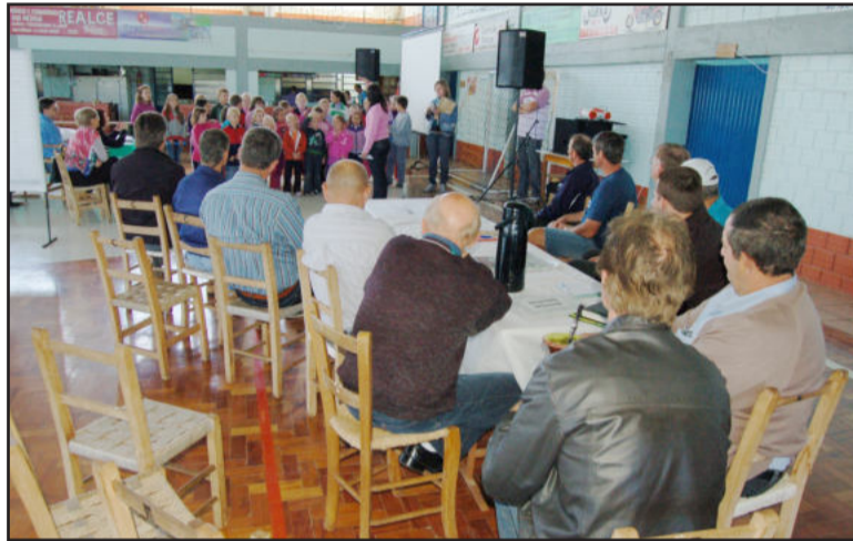
Estudantes mostraram qualidade musical