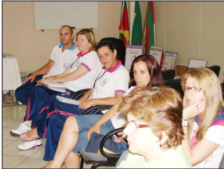
Equipe do PIM de Teutônia recebeu comitivas junto ao auditório da CIC

Em Teutônia, o Programa Primeira Infância Melhor (PIM) foi implantado de forma experimental em 2008. A atu-