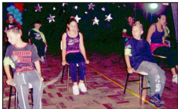
Magia com a dança do hip-hop