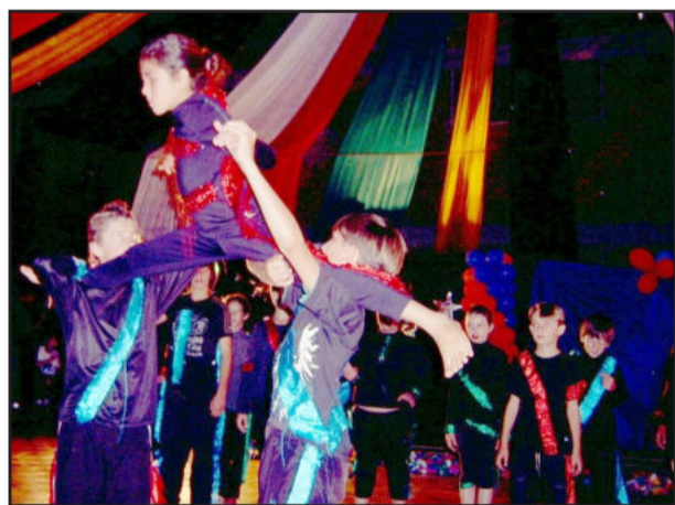
Espectáculo ressaltou a união