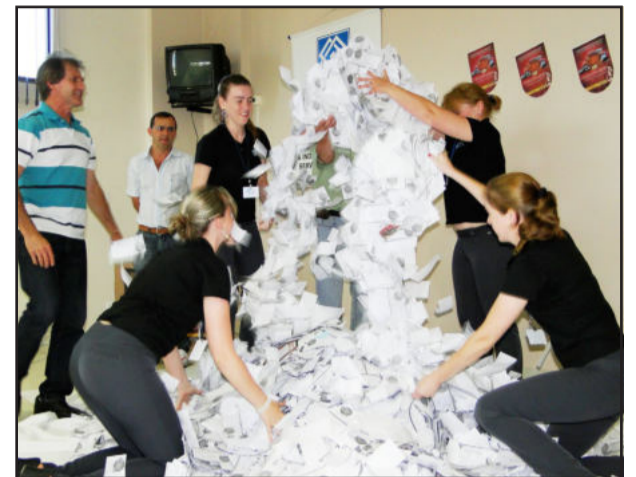
Sorteio foi nesta quinta-feira

Nesta quinta-feira, dia 09, ocorreu o penúltimo sorteio da Campanha Nota Fiscal dá Prêmios - Natal de Prêmios Teutônia, promoção da Prefeitura de Teutônia e realização da Câmara de Indústria e Comércio (CIC). Em sorteio realizado no auditório da CIC, acompanhado por representantes da comunidade, da administração municipal, da Câmara de Vereadores, da imprensa, do comércio e da CIC, foram sorteados um notebook e dois vale-compras no valor de R$ 200,00 cada.