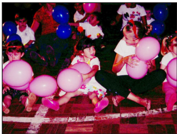
Pureza com a música e coreografia Aprendiz