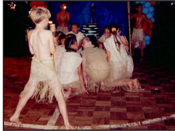
Pérola Negra representando energia