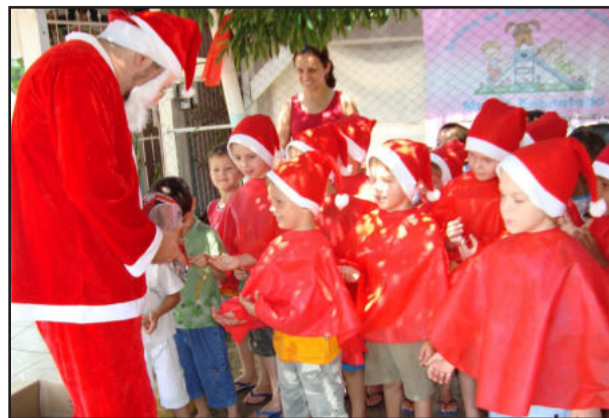
Papai Noel atenderá às crianças

Haverá desfile de modas da coleção verão 2011. Numa promoção da Revista Radar e parceria das lojas Casarão Verde, Infantine, Sara Confecções, Loja Márcia, Setor de