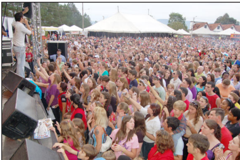
Milhares de pessoas são esperadas para os shows

O Natal do Povo está chegando. É amanhã, dia 12, no Centro Administrativo Municipal de Teutônia. A partir das 13h haverá feira de artesanato em prol da Liga Feminina de Combate ao Câncer, exposição de veículos, desfile de modas da coleção verão 2011, mateada da Ervateira Ximango, som automotivo Áudio Bass, brinquedos infláveis Guenta Coração (de graça), praça de alimentação, chegada do Papai Noel, com muitos presentes. Será um dia histórico, pois o Papai Noel chegará de uma forma jamais vista na região. Também terá fogos de artifício da Eco Caça e Pesca e no palco do Natal do Povo o Show da Família da Rádio Popular FM, com muitas atrações.