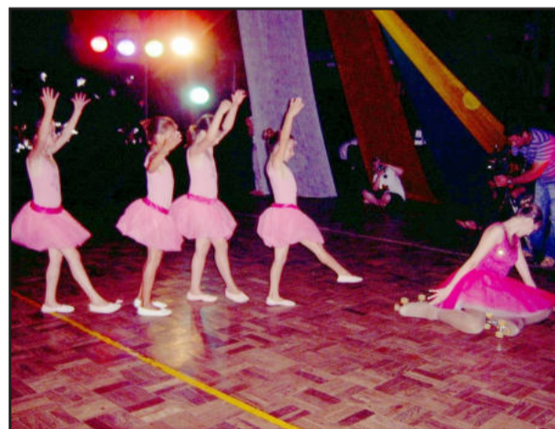
Leveza com a bailarina