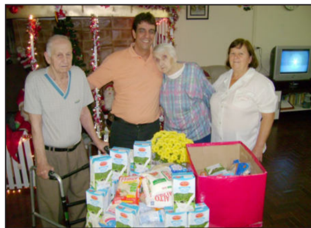
Donativos vão para entidades

Vestuário da Languiru, Angélica Modas e Paludo. Confira as tendências da moda verão 2011 no palco e passarela do Natal do Povo.