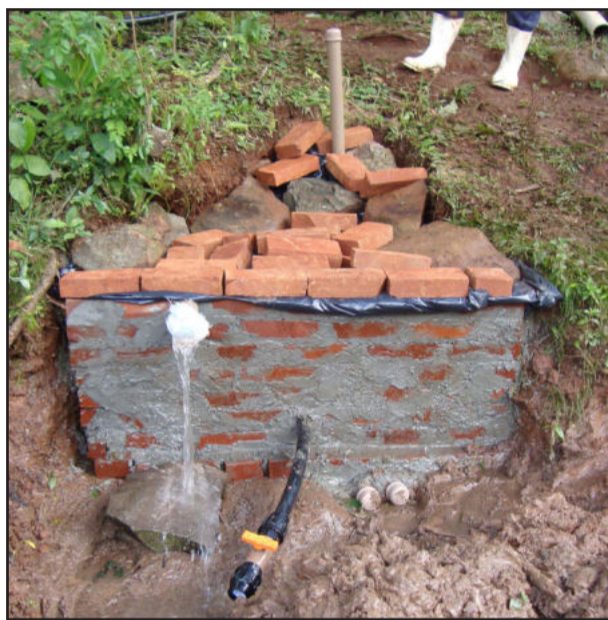
Trabalho profissional na proteção da fonte

Colaboração: equipe do escritório municipal da Emater-RS/Ascar de Imigrante.