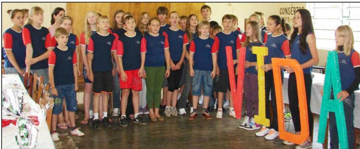
Apresentação dos alunos enfocando o tema Vida