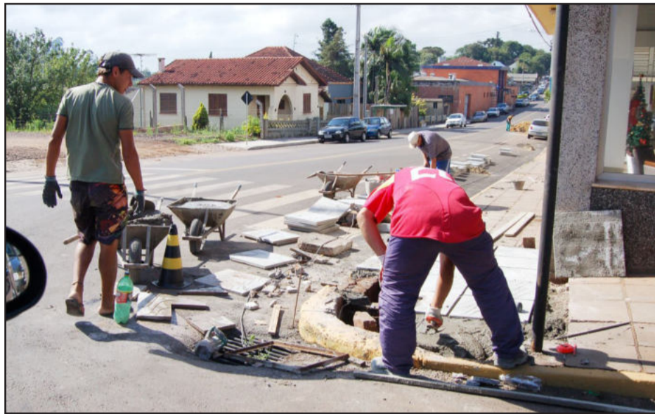
Construção da calçada na Rua Carlos Arnt, em Canabarro

Ainda está em fase de execução parte da obra de revitalização e modernização da Rua Carlos Arnt, no Bairro Canabarro, em Teutônia. A empresa vencedora da licitação já realizou o capeamento de três trechos da rua, e agora executa a substituição da calçada de passeio dos dois lados. Esta reformulação do passeio público nos dois lados, com adaptação de rampa para deficientes físicos, assim como o sistema de capeamento são exigências da Gidur (órgão técnico da Caixa Econômica Federal) para liberar os recursos.