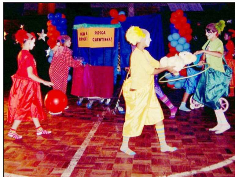
Circo - Respeito (Educação Infantil e primeiro ano B)