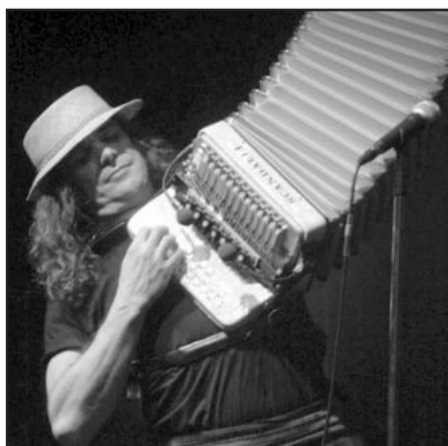
Show de Renato Borghetti

Diversos shows especiais prometem atrair grande público. Uma das principais atrações subiu ao palco nesta mesma noite: o cantor Renato Borghetti. Os clássicos da música gaúcha foram acompanhados pelo grande público presente.