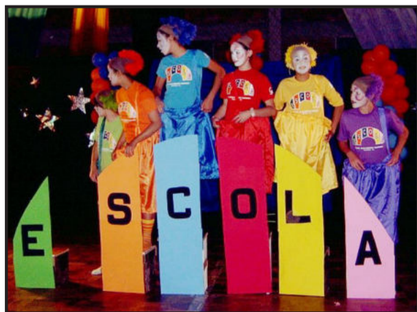
União em torno da escola