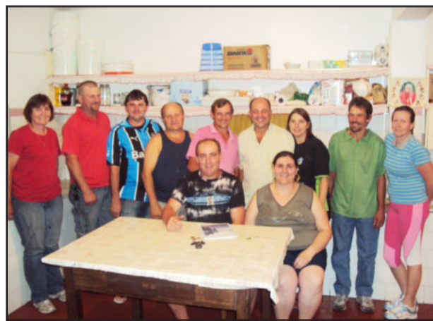
Diretoria da Sascpa

A diretoria da Sociedade de Assistência Social e Cultural de Poço das Antas (Sascpa) esteve reunida na noite desta quinta-feira, dia 09, na sua sede social, para ultimar os detalhes do Kerbfest 2011 da entidade, que acontece nos dias 22 e 25 de janeiro de 2011. Considerado o maior Kerb do Estado, o evento já possui suas atrações confirmadas. Depois de dois anos ausente, a orquestra Os Montanari, de Blumenau (Santa Catarina), volta para animar a festa nas duas noites. Na noite de