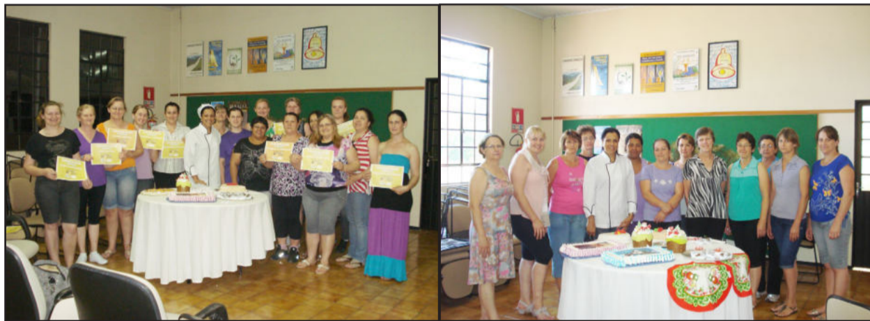
Formatura do curso