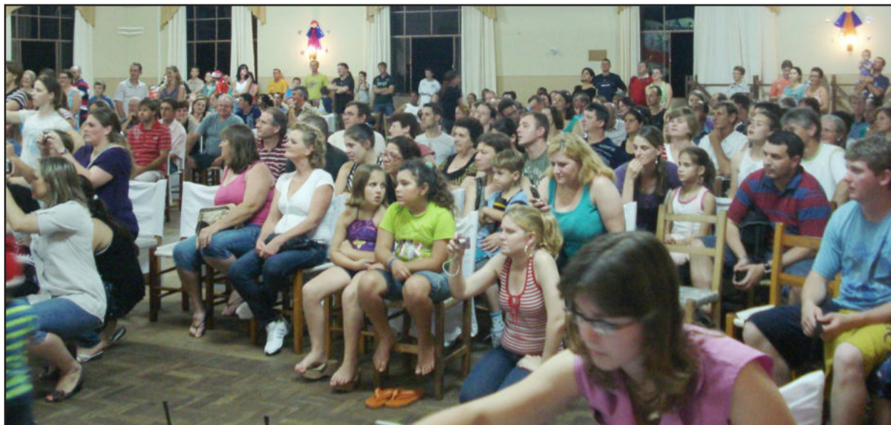
Comunidade escolar prestigiou o evento

A Escola de Educação Infantil Azaléia, do Bairro Teutônia, promoveu, na noite desta quarta-feira, dia 08, sua tradicional festa de final de ano, a chamada Festa de Natal da Azaléia. O evento foi realizado no Grêmio Cultural e Recreativo Teutoniense e contou com a presença de alunos, pais, professores, autoridades e comunidade em geral. Em torno de 500 pessoas prestigiaram as apresentações dos alunos, que encantaram e emocionaram os pais e familiares das crianças.