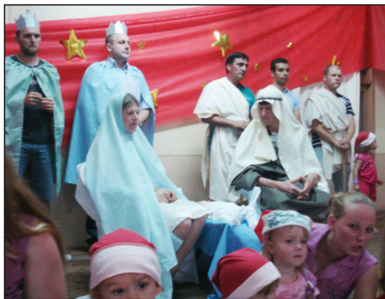
Pais foram atores de encenação

Após as apresentações aconteceu o momento mais esperado pela criança: a chegada do Papai Noel. Aliás, esse ano, as crianças tiveram uma surpresa: dois papais noéis chegaram para alegrar a petizada e distribuir presentes. Todas as crianças aproveitaram a oportunidade para tirar fotos. Algumas delas entregaram cartas aos "noéis".