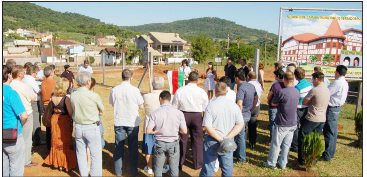
Lançamento da pedra fundamental da construção da sede própria da Câmara de Vereadores

Às 17h desta quinta-feira, dia 09, o Poder Legislativo de Teutônia realizou a solenidade de lançamento da pedra fundamental para a construção da primeira etapa da sede própria. O evento foi realizado junto ao canteiro de obras, com a presença dos vereadores, do Executivo, do Ministério Público, de presidentes de partidos políticos, da Câmara de Indústria, Comércio e Serviços (CIC) de Teutônia, da empresa responsável pela obra, presidentes de cooperativas, engenheiros, arquitetos, entre outras lideranças.