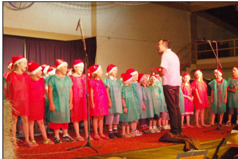
Alunos da Escola Bento Gonçalves se apresentaram na abertura