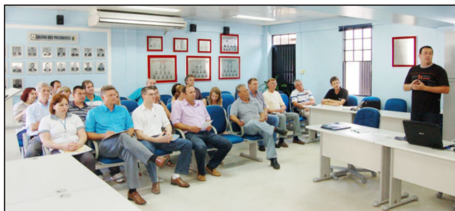
Reunião da comissão organizadora da Festa de Maio