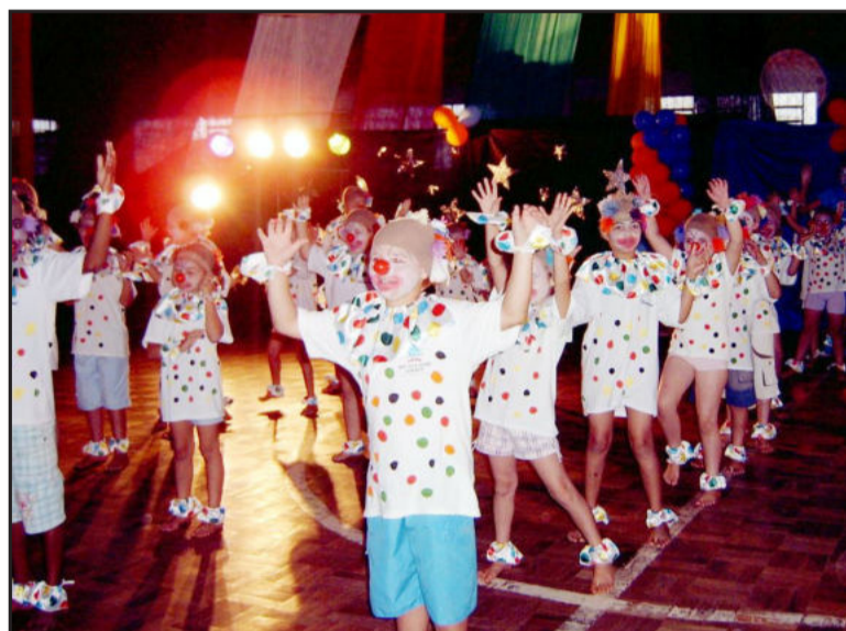
Alegria representada pela coreografia Piruetas

A resposta do público para todo este espetáculo foi de casa cheia, muitas risadas e aplausos após cada apresentação. A organização e decoração fez, literalmente, os espectadores entrarem no mundo do circo e voltarem a ser crianças.