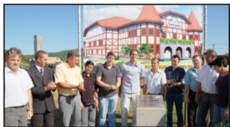
Lançada pedra fundamental da sede própria da Câmara de Vereadores de Teutônia Página 8