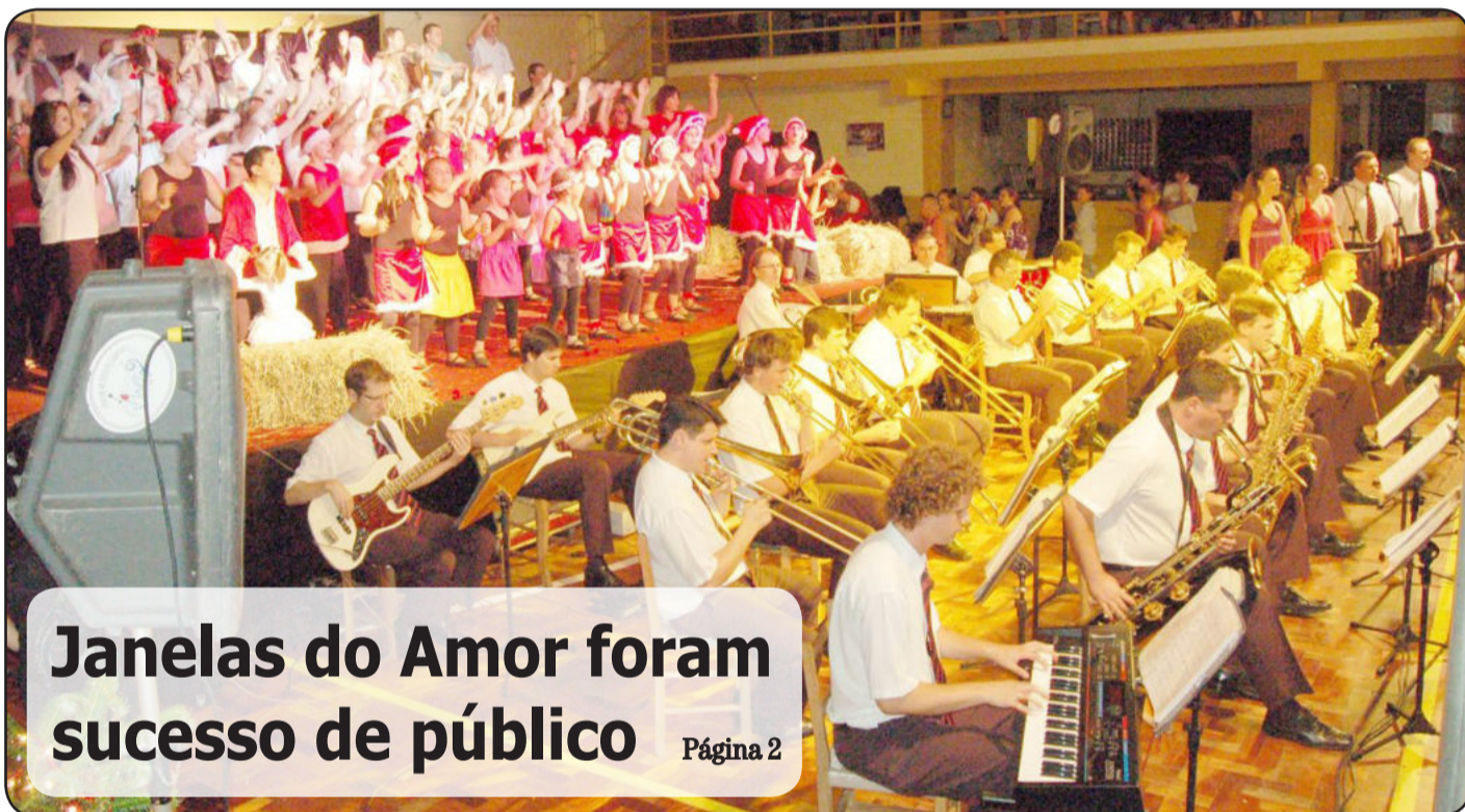
Janelas do Amor foram sucesso de público Página 2

Tudo pronto para o Natal do Povo, amanhã à tarde, no Centro Administrativo Municipal de Teutônia, com atrações para toda a família. Veja todos os detalhes desse show de solidariedade na página 5 e no caderno Inclusive