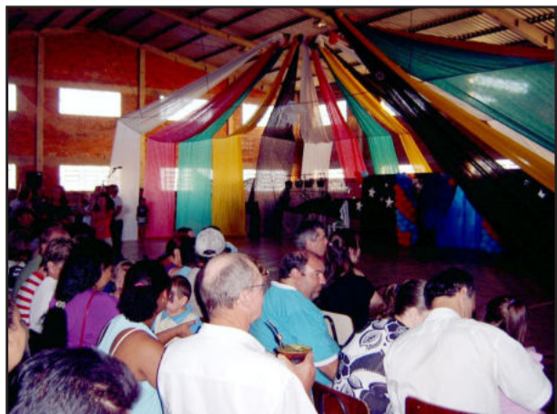
Grande público prestigiou o Circo de Natal

Alegria do circo para celebrar a magia do Natal. Foi esta mistura diferente e original que deu vida ao grande espetáculo "Circo de Natal", realizado pela Escola Municipal de Ensino Fundamental Professor Guilherme Sommer, na noite desta quinta-feira, dia 9 de dezembro, na Vila Popular. Participaram da apresentação, que ocorreu no ginásio do educadário, todas as crianças da educação infantil até a 4ª série, além de alguns alunos de 5ª a 8ª séries, somando cerca de 300 artistas.