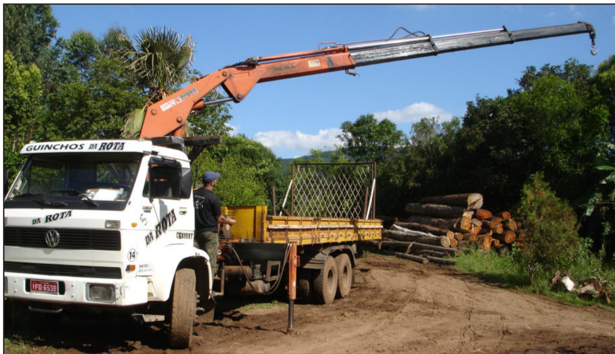
Guincho tem alcance 16,5 metros de altura

O Município de Teutônia conta agora com mais uma nova opção local em caminhões guincho. A Guinchos Dickel, localizada em Boa Vista Fundos, próximo à sociedade, adquiriu recentemente um moderno veículo, preparado para atender diversos tipos de serviços, como remoção e transporte de cargas especiais, para empresas que necessitem deste tipo de atendimento especializado, sendo uma das principais empresas a prestar este tipo de trabalho, pois anteriormente era necessário buscar fora. “É um dos primeiros caminhões que está a serviço de Teu-