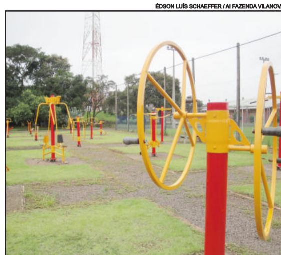
Academia ao ar livre passou por melhorias e já está à disposição da comunidade

Fazenda Vilanova foi pioneira na instalação da academia de ginástica ao ar livre, em agosto de 2008. Quinze aparelhos de ginástica como elíptico mecânico, abdominal duplo, torre de escala, remador, extensão lombar e barra giratória estão à disposição da comunidade, junto ao Parque. Ainda este ano, novas academias deverão ser instaladas em diversos locais do município.