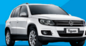
Nova Tiguan 2.0 Turbo 200cv 2012