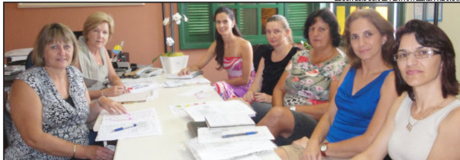
Reunião com as diretoras e a Secretaria de Educação marcou a abertura do ano letivo 2012

EDSON LUIS SCHAEFFER / A1 FAZENDA VILANOVA