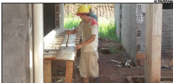
Obras foram retomadas nesta semana

Na manhã desta quarta-feira, dia 08 de fevereiro, foram retomadas as obras da EMEI Pro-Infância. Devido ao atraso da liberação de parte da verba, a obra havia sido paralisada e teve seu reinício e, conforme Administração Municipal, a obra terá continuidade até o seu final. A EMEI receberá as crianças das EMEI Casa da Criança, do Centro, e Arco-Íris, do Morro Bonito. A futura EMEI Pró-Infância poderá abrigar até 240 crianças com idade entre 0 e 5 anos.