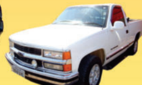
SILVERADO DLX 1997, turbo diesel, dir hidr, vidr. elét. (JY08499) de R$ 36.500,00 por R$ 33.500,00