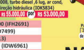
RANGER XL 4x4 2008, turbo diesel, 6 lug, ar cond, direção hidráulica (I0K5834) de R$ 55.000,00 por R$ 53.000,00