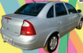
CORSA SEDAN 1.0 2003, (ILE0426) de R$ 23.500,00 por R$ 19.900,00