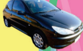
PEUGEOT 206 1.4 2008, 2P ar cond., (IOL1740) de R$ 24.500,00 por R$ 22.900,00