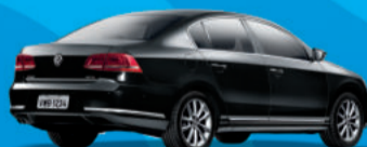
Novo Passat 2.0 Turbo DSG 211cv 2012

Todas as versões com super bônus e taxa a partir de 0%a.m.