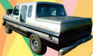
F 1000 CABINE DUPLA 1987, diesel 7 lu., (IDN2029) de R$ 27.500,00 por R$ 24.500,00