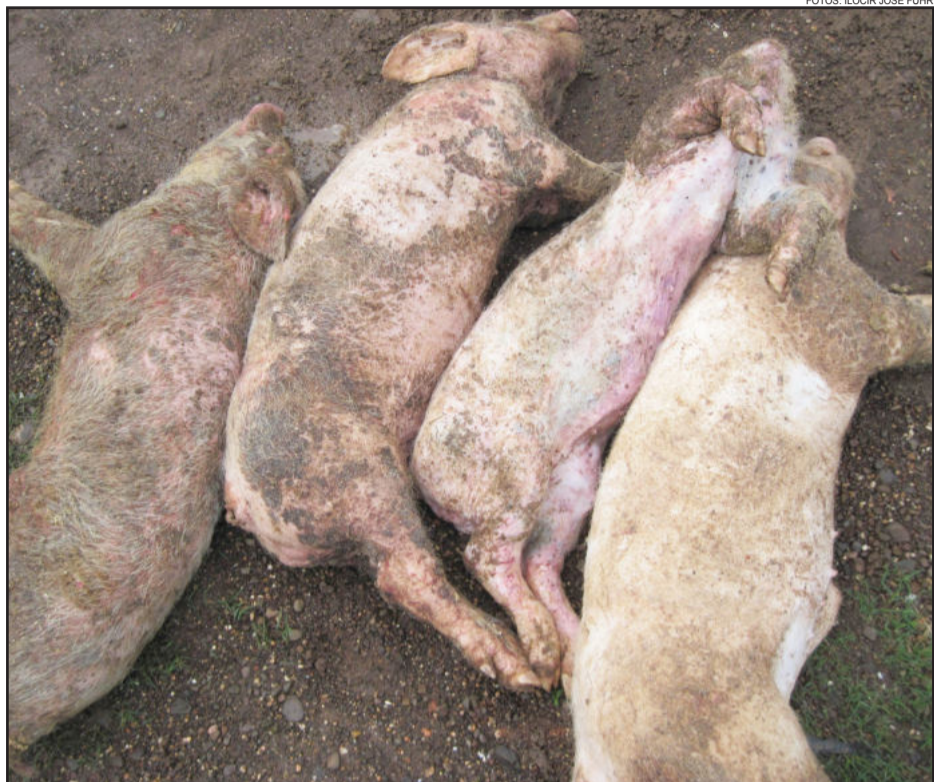
Suínos morrem por falta de alimento