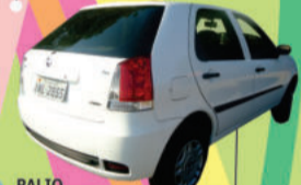
PALIO 2007, 4P, (INL2855) de R$ 23.500,00 por R$ 19.900,00