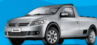
Nova Saveiro 1.6 2012