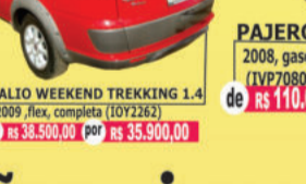
PALIO WEEKEND TREKKING 1.4 2009, flex, completa (I0Y2262) de R$ 38.500,00 por R$ 35.900,00