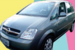
MERIVA MAXX FLEX 1.8 2008, completa, (IOM3745) de R$ 39.500,00 por R$ 36.500,00