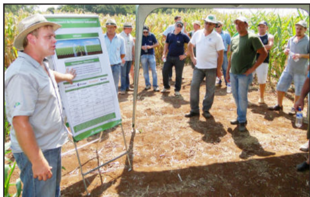
Pioneer apresentou sementes de milho com diferentes tecnologias e formas de plantio

A Pacifil apresentou a bolsa para grãos e silagem, produzida por um processo de coextrusão em três camadas, bicolor e com alta carga de estabilizantes anti-UV. O material utilizado resulta em filme resistente a impacto, rasgamento e estiramento. Entre as vantagens para silagem estão redução da mão-de-obra, preservação da qualidade nutricional da silagem, redução de perdas, aumento da digestibilidade e palatabilidade do alimento, diminuição das perdas no momento do trato e possibilidade de adaptação do tamanho da bolsa de acordo com a propriedade.