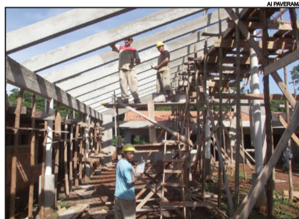
Prédio toma forma para atender cerca de 240 crianças