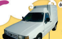
FIORINO FURGÃO IE 1996, (IEV9317) de R$ 14.000,00 por R$ 12.500,00