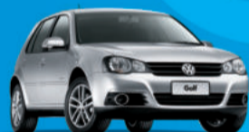
Golf Sportline 1.6 Limited Edition 2012

Novo Fox 1.6 2012 Completo A partir R$ 39.390,