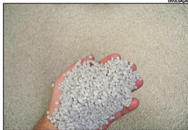
Matéria-prima provém de grandes redes de roupas