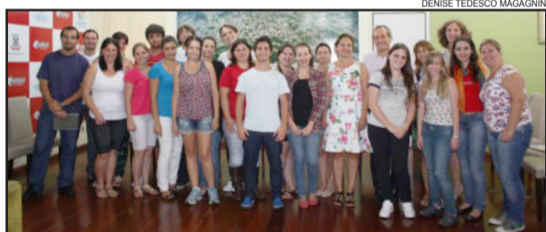
Prefeito, equipe da SMEC e universitários

Uma das principais novidades ficou por conta das empresas que prestarão os serviços de transporte. No dia 15 de fevereiro será realizada uma Tomada de Preços, quando as empresas interessadas deverão apresentar, em um envelope lacrado, as suas propostas para cada rota. As informações sobre os roteiros devem ser obtidas diretamente com as associações. No encontro desta terça, foi formada uma comissão com cinco presidentes de associações, além de representantes da Prefeitura, a qual será responsável por avaliar e analisar as propostas apresentadas. As empresas que apresentarem o menor preço e atenderem à todas as exigências serão declaradas vencedoras. Mais informações e contato das associações de estudantes podem ser obtidas no Setor de Transporte Escolar, pelo telefone 3462-8278, ou transporteescolar@garibaldi.rs.gov.br. A entrega do cadastro semestral acontece no dia 24 de março, na sede da UGE, das 8h às 12h.