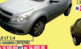
AGILE LT 1.4 2011 completo (IR18708) de R$ 36.500,00 por R$ 34.000,00