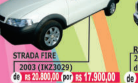
STRADA FIRE 2003 (IKZ3029) de R$ 20.800,00 por R$ 17.900,00