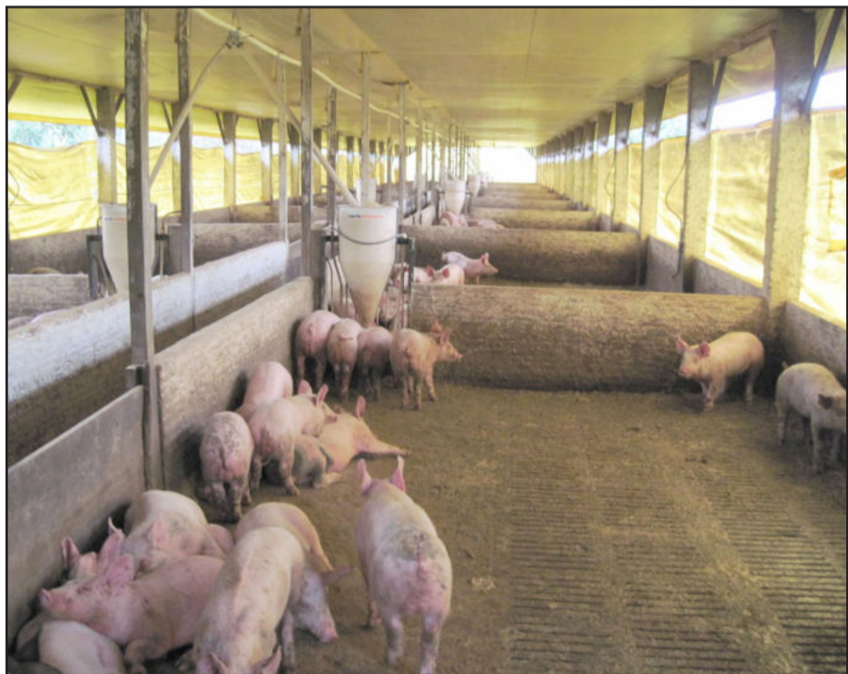
Propriedade dos Schulte localiza-se na Linha Geraldo, interior de Estrela