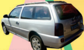
PARATI 1.8 1998, completa, (LB4348) de R$ 17.000,00 por R$ 14.900,00