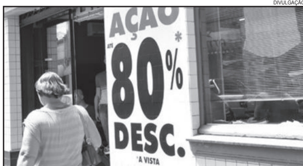
Menos de uma semana para aproveitar as promoções do Liquida Garibaldi

Os consumidores garibaldenses têm menos de uma semana para aproveitar descontos de até 80% nas lojas que estão participando do Liquida Garibaldi 2012. A promo-