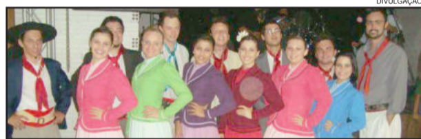
Invernada adulta do CTG Querência do Tio Pedro

Interessados em participar das invernadas podem obter informações adicionais com o patrão Bilhar pelo telefone 9933-0440. O CTG completará 18 anos em abril deste ano e possui mais de 100 associados.