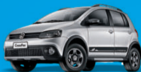
Novo CrossFox 1.6 2012 Completo

A partir R$ 30.490, ou completo por apenas R$ 33.990, Taxa 0,49%a.m.