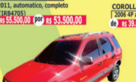
VECTRA HATCH GTX FLEX 2011, automatico, completo (IRB4705) de R$ 55.500,00 por R$ 53.500,00