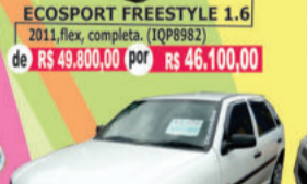
ECOSPORT FREESTYLE 1.6 2011, flex, completa, (IQP8982) de R$ 49.800,00 por R$ 46.100,00