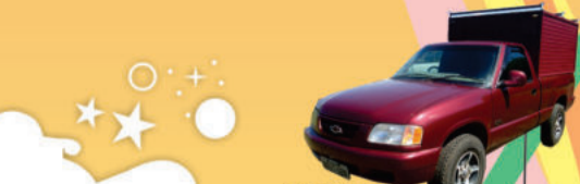
S10 PICK UP 1996, gasolina e GNV (BSU7100) de R$ 20.500,00 por R$ 16.500,00