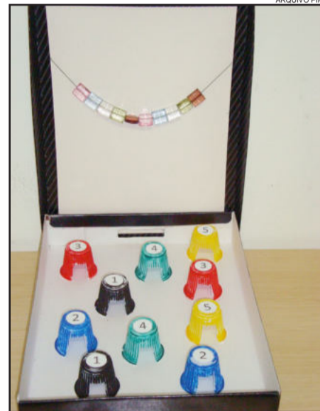
Brincando com Números