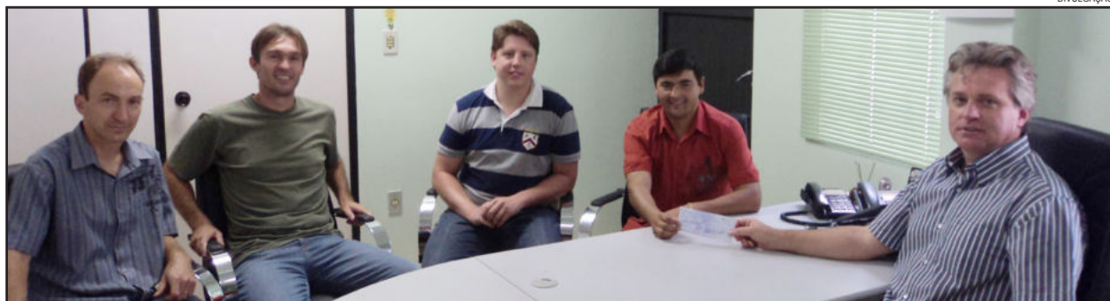
Vereadores devolveram recursos ao Executivo

houve a devolução de mais de R$ 500 mil ao longo do ano de 2011 para investimentos na Secretaria de Saúde. Ressalta-se que a Câmara de Vereadores de Teutônia é a 5ª mais enxuta do Estado e a 1ª colocada no Vale do Taquari.