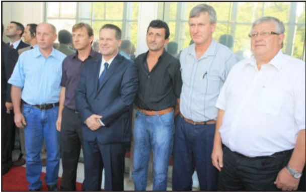
Comitiva de Westfália também prestigiou a posse de Postal