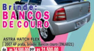
ASTRA HATCH FLEX 2007 4P prata, brinde: Bancos couro (I1L6021) de R$ 34.500,00 por R$ 31.500,00