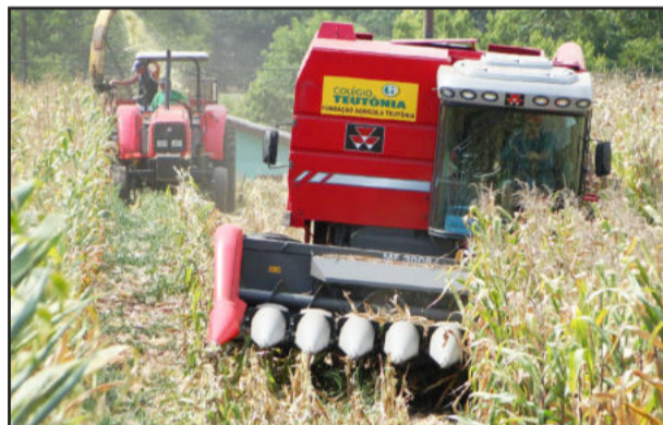
Colheita e pesagem permitiu melhor avaliação custo-benefício das variedades de grãos