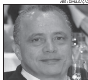
Enólogo é encontrado morto em tanque de fermentação de uva de vinícola

O corpo foi velado e sepultado às 11 horas de ontem no Cemitério Municipal de Caxias. Ele deixa esposa e duas filhas.