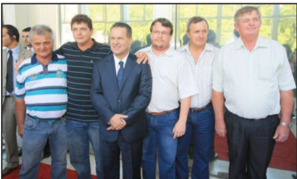
Integrantes do PMDB de Imigrante prestigiaram a posse de Postal