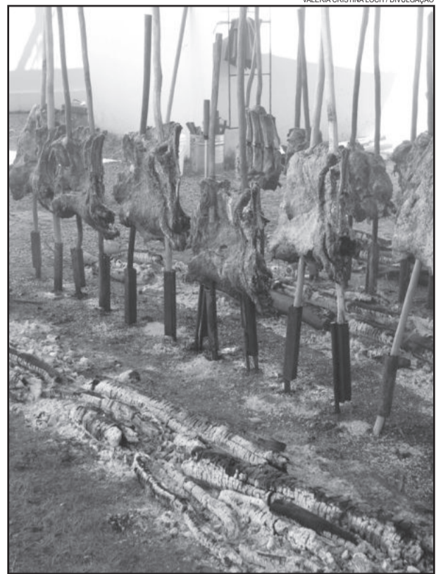
Costelão realizado em 2011

A promoção do evento é da Associação Fim de Carreira de Garibaldi, que completou em janeiro, 31 anos de existência. Composta por um quadro social de 45