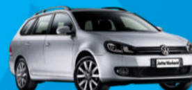
Nova Jetta Variant 2012