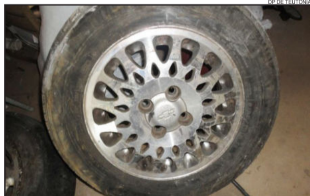
Rodados apreendidos estão à disposição para reconhecimento