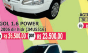
GOL 1.6 POWER 2006 dir hidr (IMU5516) de R$ 26.500,00 por R$ 23.500,00