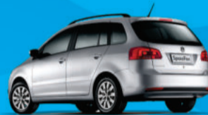
Nova SpaceFox 1.6 2012 Completa