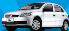
Novo Gol 1.0 4 portas 2012

A partir R$ 27.990, ou completo por apenas R$ 31.780,