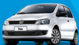
Novo Fox 1.0 2012

A partir R$ 30.590, Direção Hidráulica + Pacote Trend por apenas R$ 990,