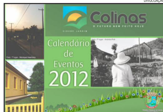
Calendário 2012 capa

Além de toda a programação dos Eventos da Cidade Jardim, o calendário ilustra fotos do último Concurso Fotográfico, destacando a beleza de Colinas.