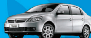
Voyage 1.0 2012

A partir R$ 27.990, ou completo por apenas R$ 31.780,