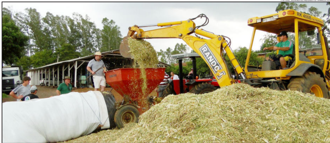
Silagem com uso de bolsa plástica foi apresentada pela Pacifil

Na quinta-feira, dia 2, o Colégio Teutônia realizou tarde de campo, com a parceria de Pioneer Sementes e Pacifil Brasil. Tendo por local a granja do educandário, a programação contou com a participação de 53 pessoas, entre produtores rurais e profissionais do setor agrícola, em especial da Cooperativa Languiru e parceiros.