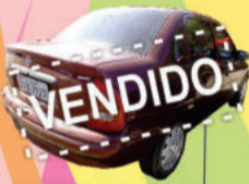
CORSA SEDAN SUPER 1999 ar qte, vidr. elét. des tras. (IIX7927)