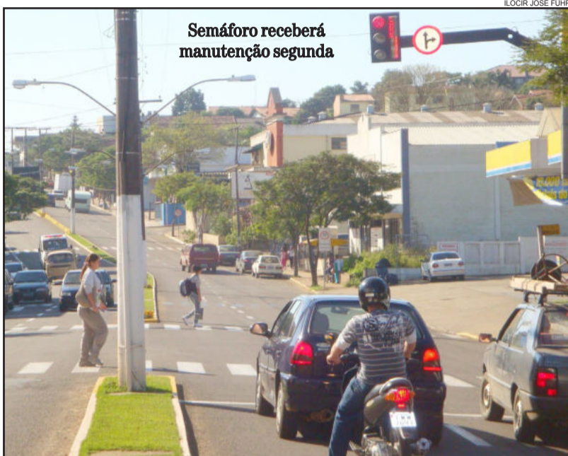
FERIADO DE CARNAVAL