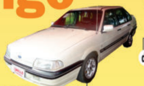
VECTRA GLS 1996, completo, (IEH2700) de R$ 16.500,00 por R$ 13.500,00