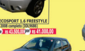
ECOSPORT 1.6 FREESTYLE 2008 completo (I0L9686) de R$ 43.500,00 por R$ 41.000,00