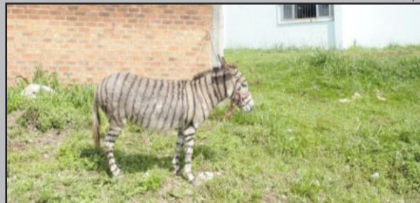
Falsa zebra era mantida amarrada ao ar livre debaixo de chuva e sol quente

Um fato inusitado comoveu uma comunidade de Caxias do Sul: uma mula, pintada pelo dono com listras de tinta preta, era mantida amarrada por mais de uma semana ao lado de um posto de saúde da cidade. O proprietário da falsa zebra seria natural de Farroupilha e vagava com a mula pelos bairros de Caxias do Sul para fazer fotos de moradores ao lado do pobre animal. O caso foi denunciado por indícios de maus tratos e mistura de brita fina à ração do animal. O homem, proprietário da mula, foi advertido pela Brigada Militar e caso seja denunciado novamente, poderá responder a processo.