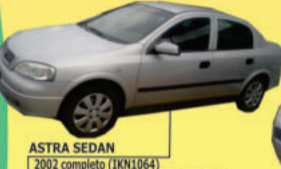
ASTRA SEDAN 2002 completo (IKN1064) de R$ 25.000,00 por R$ 23.800,00