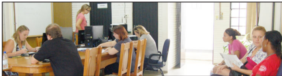
Procura tem sido intensa para se inscrever ao concurso público de Teutônia

Há vagas e cadastro de reserva para 37 diferentes cargos