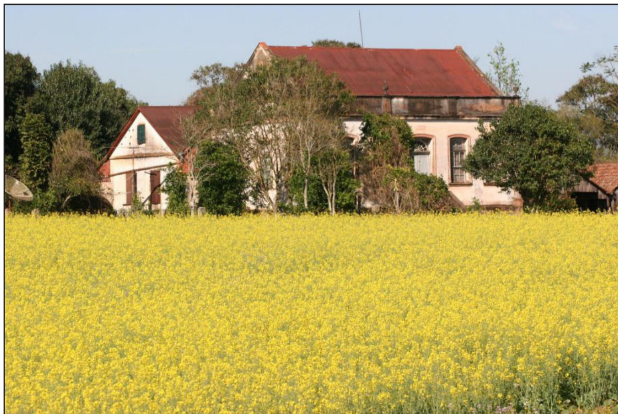
Economia e rusticidade é tema desta foto de Colinas