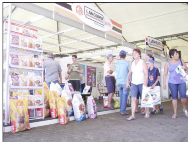
Estande da Languiru

A Expoagro Afubra, maior feira do Brasil voltada à agricultura familiar, foi realizada na semana passada, em Rio Pardo, com público recorde de 55 mil pessoas. Promovida pela Associação dos Fumicultores do Brasil (Afubra), a feira possibilitou que mais de 300 expositores mostrassem os seus produtos e serviços para os visitantes. Entre esses expositores estava a Cooperativa Languiru que aproveitou a oportunidade para divulgar os seus produtos e fazer contatos com consumidores em potencial. No estande da Languiru foi apresentada a linha de cortes de aves e frangos inteiros, além dos tradicionais produtos da marca MiMi como iogurtes, doce-de-leite, leite UHT em sachet, bebidas lácteas, entre outros.