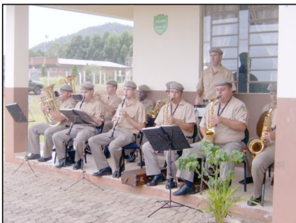
Banda da BM de Montenegro

Dentre as atividades realizadas estiveram a apresentação da banda da Brigada Militar de Montenegro; apresentação de um dos cães treinados no canil da Brigada Militar de Arroio do Meio; brincadeiras na cidade do trânsito, proporcionada pela Polícia Rodoviária Estadual de Santa Cruz do Sul em parceria com a de Teutônia. Além de assistir ao teatro de fantoches do projeto "Ciranda Policial" de Teutônia, com a peça "Kaka e Batata - Cuidados no trânsito".