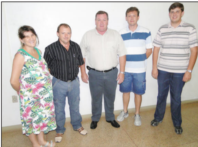
Diretoria executiva e funcionários da Comatra

sal da cooperativa, além dos maiores parceiros, que mais utilizam o serviço de frete com os seus associados, entre os quais estão Languiru, Perdigão, Certel, entre outros.