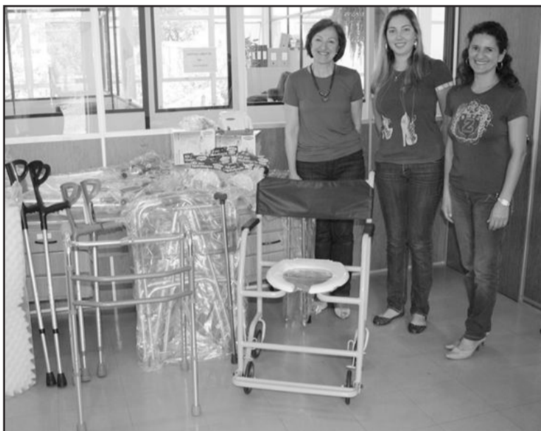
Equipamentos foram entregues ao MAB

O ato também marcou a entrega de quatro quilos de leite em pó arrecadados durante a Jornada Pedagógica 2010 para o MAB. Os leites foram doados por estudantes que participaram da jornada como forma de contribuição à entidade.