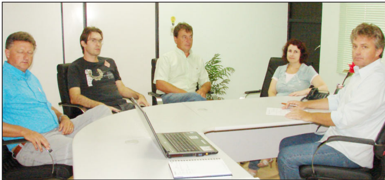
Administração municipal definiu progressão em reunião realizada com a presença do Legislativo e da Associação de Professores Municipais

Administração municipal projeta ano com conquistas, obras e realizações históricas