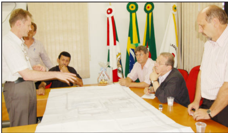
Em Westfália, Languiru apresentou projeto do frigorífico de suínos e relevância da obra que interliga com a Transcitrus

O pré-candidato do PT acrescentou também, que buscará alianças com outros partidos para lançar sua candidatura. “Fui escolhido por unanimidade pelo partido, estamos muito unidos e isso é muito importante”, comentou ele.