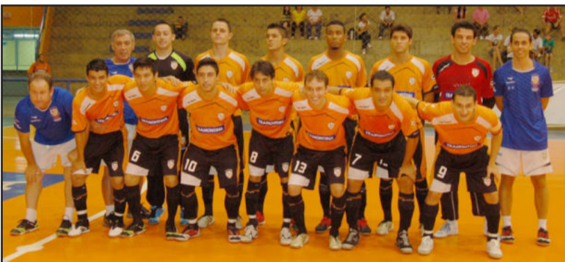
Equipe principal da ACBF vem a Teutônia

primeiro acontece no dia 18 de março, na cidade catarinense, e no dia 26 é a vez da laranja mecânica receber a equipe em Carlos Barbosa.