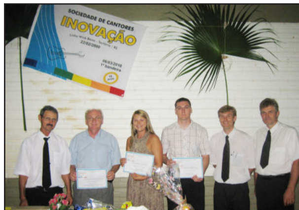
Apresentação da 1ª bandeira do Coral

O grupo de canto conta atualmente com 23 cantores e realiza ensaios semanais, com trabalho coordenado pelo