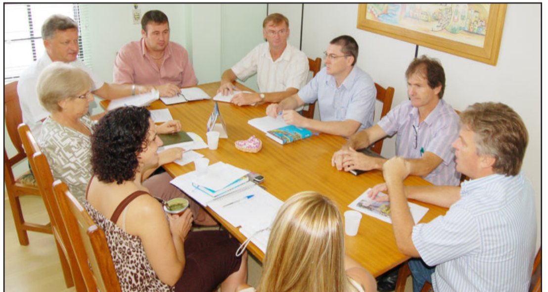
Administração municipal projeta ano de conquistas, obras e realizações históricas para assinalar a passagem dos 29 anos de Teutônia. Página 6