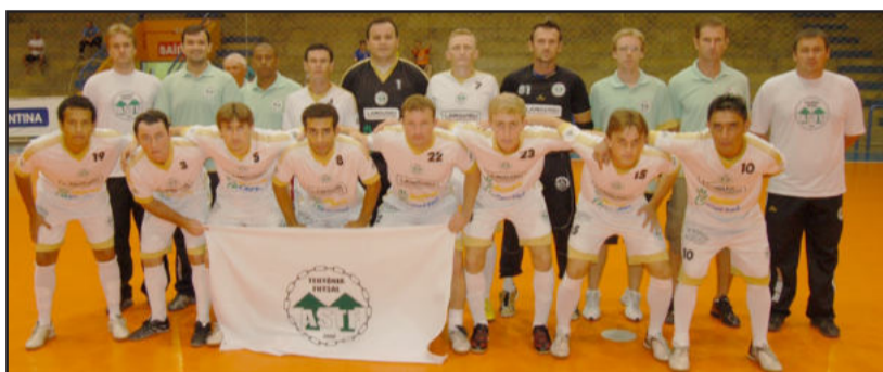
ASTF faz segundo amistoso

Antes da estreia na Liga Nacional de Futsal 2010, o time principal da ACBF terá mais dois amistosos frente a equipe da Unisul, de Tubarão/SC. O