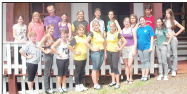
Representados 15 municípios da região