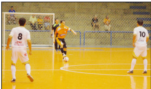
Equipes utilizam amistoso como preparação para as competições oficiais do ano

Ingressos: Estudantes R$ 2,00; antecipado R$ 3,00; e no local R$ 5,00.