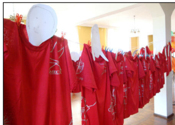
Varal de rostos