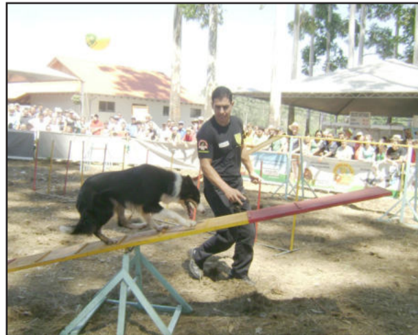
Adestramento de cães

Sempre procurando inovar quando se fala de divulgação, as Rações Languiru, em conjunto com a Pousada do Au-au, de Encantado, e Canil da Brigada Militar, de Arroio do Meio, organizaram uma das maiores atrações da décima edição da Expoagro Afubra. Num cercado localizado dentro do parque de exposições, foi realizado o show de adestramento de cães. Na ocasião, soldados da Brigada Militar de Arroio do Meio e adestradores da Pousada do Au-au apresentaram várias técnicas de adestramento básico de obediência e técnicas avançadas de ações de ataque e defesa. Encenações de abordagens à miliantes e situações de cerco, fizeram o público vibrar e se espantar com a agilidade, inteligência e audácia mostrados por cães como Rotweiller, Pastor Belga e Pittbull em situações que enfocavam o combate ao crime.