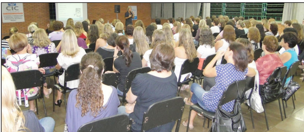
Mulheres de todas as idades participaram da palestra

Para celebrar o Dia Internacional da Mulher, nesta segunda-feira, dia 8, a Câmara de Indústria e Comércio (CIC), em parceria com Câmara de Dirigentes Lojistas (CDL) de Porto Alegre, promoveu a palestra “As diferenças entre homens e mulheres - estas diferenças é que nos unem”. O evento, realizado no Centro Social do Sesi, reuniu mais de 100 mulheres e teve por objetivo promover uma reflexão sobre as diferenças entre homens e mulheres e a importância do trabalho conjunto para agregar qualidade na vida profissional, pessoal e social, tornando as relações mais harmoniosas e produtivas.