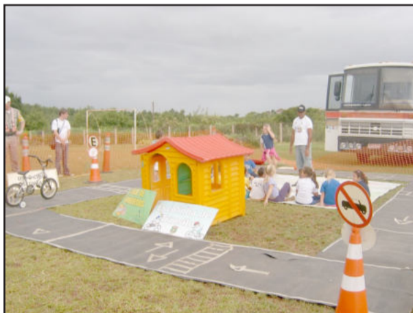
Cidade do Trânsito

Cidadã queremos desmistificar esta polícia apenas repressora e da qual muitas pessoas têm medo", ressaltou ela. A major ainda pontuou que este será um trabalho contínuo e de longo prazo que trará resultados positivos.