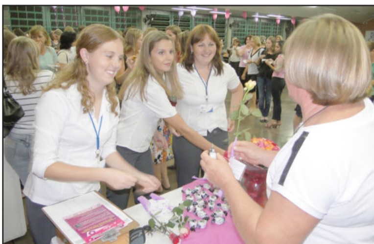
Mulheres receberam rosas e bombons

Para ela, é importante entender que o mundo mudou muito, que houve uma grande mudança cultural ao longo dos anos, e todos precisamos nos reciclar. “Homens devem trabalhar o seu lado feminino e mulheres o seu lado masculino para que cada um possa entender melhor o universo do outro. São estas diferenças que nos unem e não é necessária toda esta disputa, esta competitividade exagerada”, concluiu, conquistando os aplausos do público. A noite ainda teve o sorteio de brindes fornecidos por empresas associadas à CIC, apresentação de uma linha de tratamento de beleza facial e coquetel de confraternização.