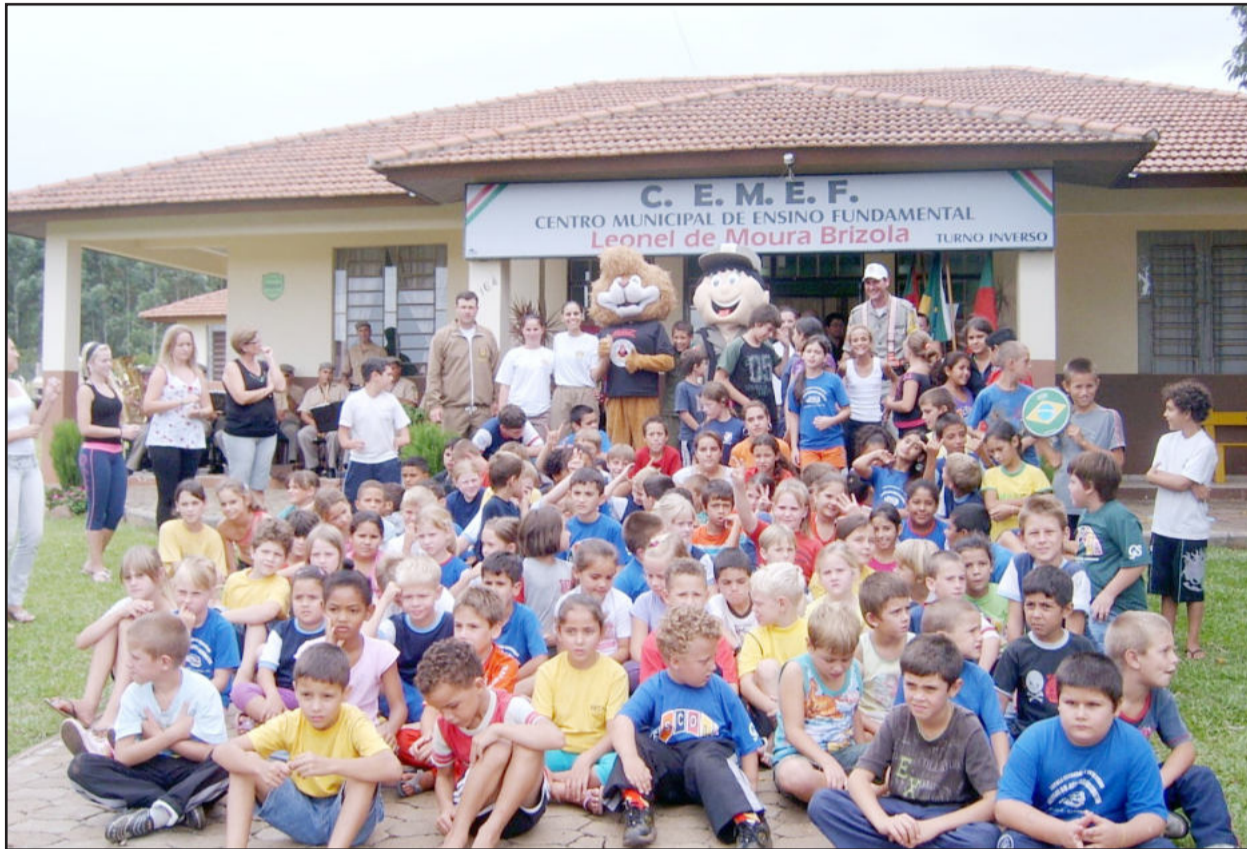
Crianças e autoridades que participaram da solenidade

O início da tarde desta terça-feira, dia 9, foi diferente para os alunos de diversas escolas de Teutônia que freqüentam o turno inverso no Centro Municipal de Ensino Fundamental (Cemef) Leonel de Moura Brizola. As crianças participaram de atividades diferenciadas proporcionadas pela Brigada Militar (BM) na "Operação volta às aulas".