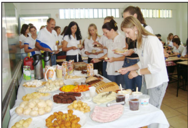
Café da manhã entre colaboradores

Na manhã de sábado, dia 6, professores e colaboradores do Instituto de Educação Cenequista General Canabarro (Ieceg) estiveram reunidos para um café da manhã. A iniciativa foi em reconhecimento do Ieceg pelo excelente início de ano que todos tiveram e também teve como objetivo a ampliação da integração de todos os colaboradores do educandário. Na oca-