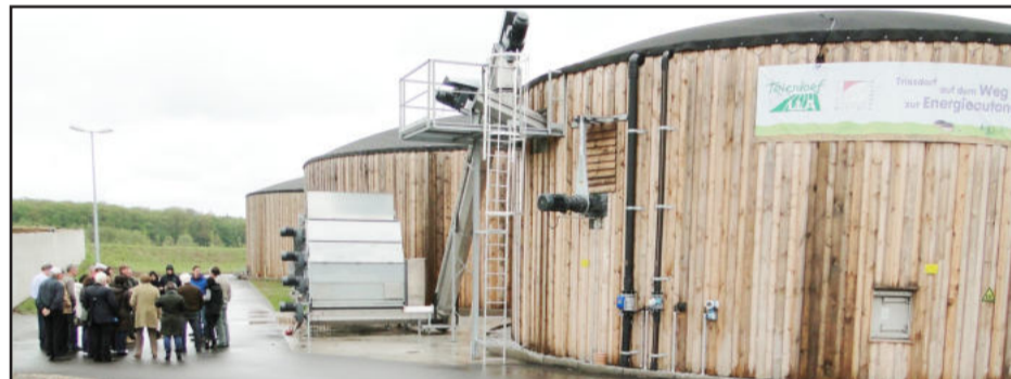
O grupo em visita ao biodigestor