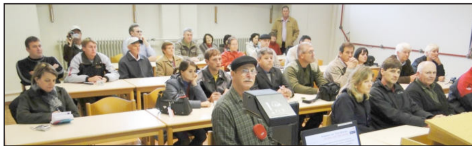
O grupo da região em uma palestra técnica na escola de Triesdorf

A Alemanha, conforme o Fundo Monetário Internacional (FMI), é a quinta potência econômica mundial e uma das suas grandes características é o desenvolvimento tecnológico através da pesquisa em todas as áreas. A cadeia produtiva do agronegócio sempre teve um grande destaque na economia alemã pela sua grande produtividade e qualidade. Tudo isto resulta da profissionalização e da formação do agricultor nas escolas técnicas e da implementação de tecnologias modernas. Em viagem à Alemanha, desde a semana passada, o grupo de agricultores e técnicos da área do Vale do Taquari, além de Santa Catarina e São Paulo, conferiu esta realidade em visita à escola superior Landwirtschaftliche Lehranstalten Triesdorf, em Weidenbach.