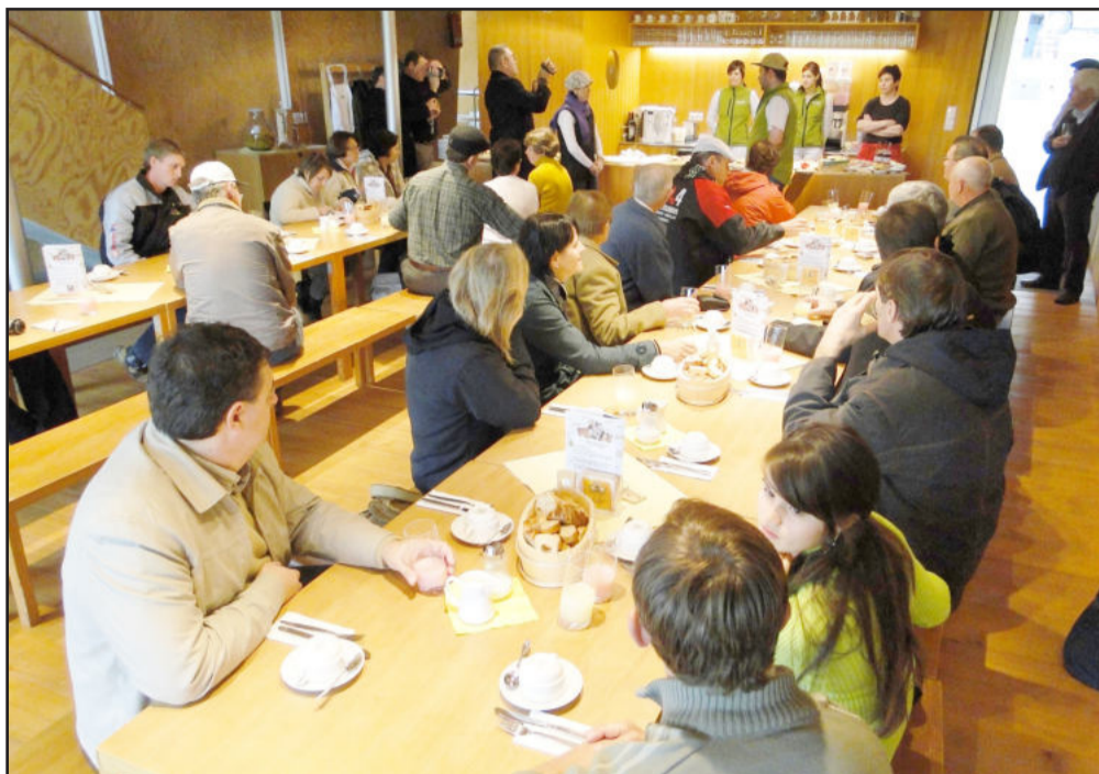
O grupo degustando os diferentes tipos de queijos