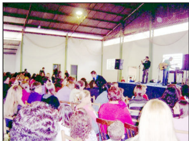
Show sertanejo agradou o público