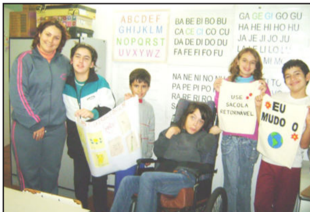
Alunos da Apae apresentam resultado do trabalho

Além do presente, as crianças deixaram a seguinte mensagem: