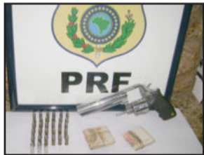
Arma e dinheiro apreendidos