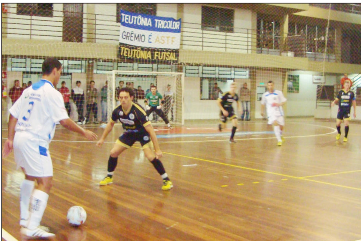
Na noite de sábado, ASTF precisou de paciência para vencer Cachoeirinha por 2 a 0