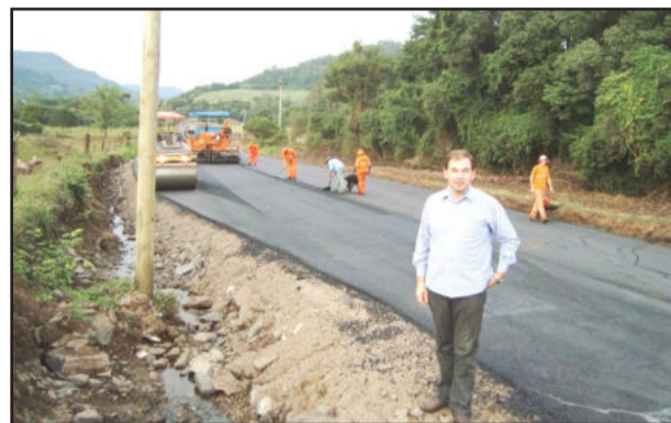
Keller conferiu andamento das obras asfaltamento no trecho a partir do posto de saúde, passando pelo acesso ao Loteamento Popular e área industrial.

O trabalho está sendo realizado em três pontos diferentes. A pavimentação na RST 025, entre Colinas e Imigrante, está em fase final. A conclusão ocorreu na semana passada, faltando agora apenas a sinalização. Na RS 129, trecho em direção a Roca Sales, que já teve parte do trecho asfaltado, segue uma segunda etapa de asfaltamento, com a pavimentação de mais um pedaço da rodovia. Na semana passada iniciou a preparação da base para receber a camada asfáltica. No Centro de Colinas, a rua Olavo Bilac também recebe