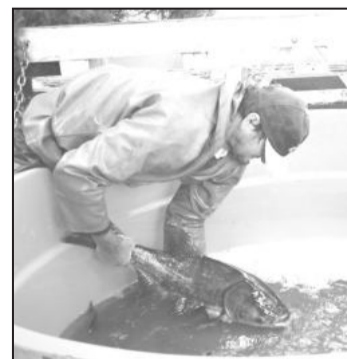
Feira mensal aumenta consumo de peixe no município

A realização mensal da feira estimula também que os produtores invistam na cultura do peixe e façam com que a piscicultura figure como uma fonte de renda nas propriedades. A ideia é transformar a criação de peixes em uma alternativa para complementar a renda das famílias do interior do Município. "Queremos estimular o consumo de peixe, mudar o hábito alimentar do barbosense e percebemos que a procura está crescendo gradativamente. Mas, temos um objetivo maior, de transformar a piscicultura