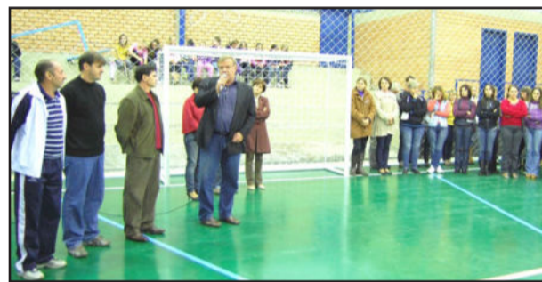
Altmann destacou o investimento em Educação