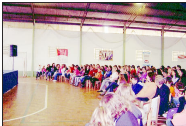
Cerca de 1.200 pessoas prestigiaram o evento

Para encerrar a tarde, ainda foi promovido um desfile de modas, no qual as trabalhadoras do setor foram as modelos. As coleções apresentadas foram das fábricas Piccadilly, Beira-Rio, Paquetá, Tamuli, El Shadai e da loja Sol e Cor. As roupas foram fornecidas pela Trilha da Moda, Adriana Modas, Casarão Verde e Rivin.