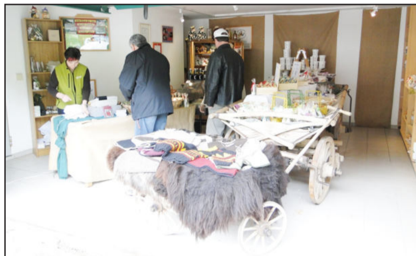
A venda direta dos cosméticos e artesanato aos turistas

A propriedade de Metzler tem 17 hectares, 15 vacas leiteiras e 35 cabras. A produção de leite é de 400 a