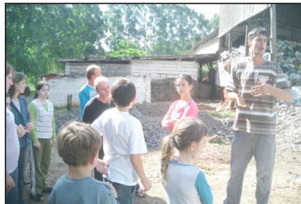
Visita ao aterro sanitário