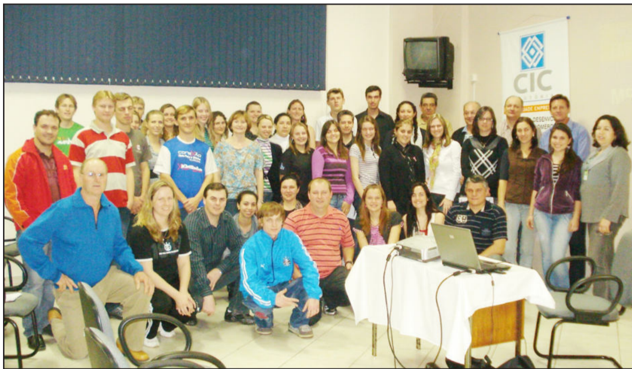
Palestra gratuita ocorreu no auditório da CIC

Com o objetivo de apresentar uma das mais poderosas ferramentas de incentivo às compras no varejo, formando um conjunto de técnicas responsáveis pela informação e apresentação destacada dos produtos, suas principais características e utilizações, a Câmara de Indústria e Comércio (CIC) de Teutônia e o Sebrae/RS promoveram a palestra "Merchandising - detalhes que valem ouro".