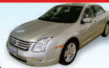
Fusion SEL 2.3 2008 prata, ABS, air bag, couro, [ION2600]