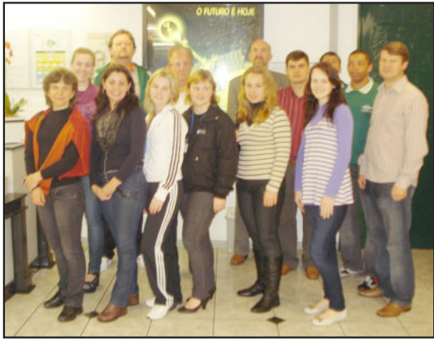
Visita técnica da CIC foi acompanhada por 16 pessoas

No dia 2 de setembro a Câmara de Indústria e Comércio (CIC) de Teutônia promoveu visita técnica à empresa Brasilata, unidade de Estrela. A Brasilata foi pioneira ao adotar as técnicas industriais japonesas, em 1985, além de ter sido a primeira a introduzir o sistema "kanban" no fornecimento de latas litografadas, em 1992. Sua estratégia competitiva consiste em produzir com alta qualidade e pontualidade na entrega, atuando em sincronia com as necessidades dos clientes. A programação contou com vídeo institucional, apresentação do fechamento plus e visitação à fábrica, acompanhada por 16 pessoas.