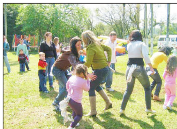
Gincana foi o ponto alto do encontro