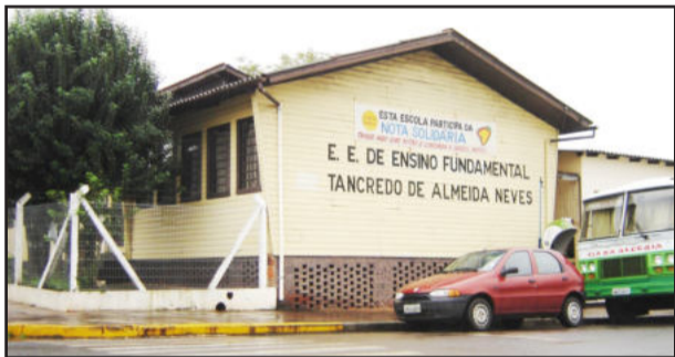
Escola Estadual Tancredo Neves

A Escola Estadual Tancredo de Almeida Neves, do Bairro Languiru, realiza amanhã, domingo, dia 12, a festa em homenagem aos 24 anos do educandário. O evento será no pavilhão da Comunidade Católica Cristo Rei de Languiru, com início às 10 horas, com hora cívica e apresentações dos alunos. Ao meio-dia haverá almoço e à tarde, atrações como música ao vivo e brinquedos infláveis para as crianças.