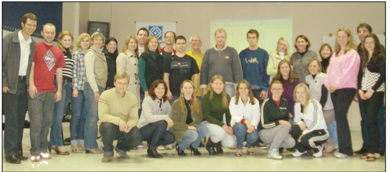
Curso "Fluxo de caixa e orçamento financeiro" teve 28 participantes