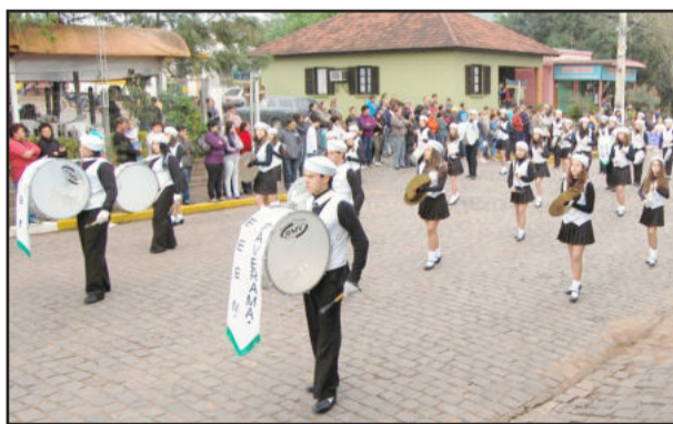
Banda Marcial deu ritmo ao desfile