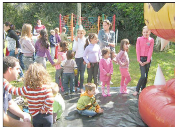
Crianças divertiram-se com os brinquedos infláveis