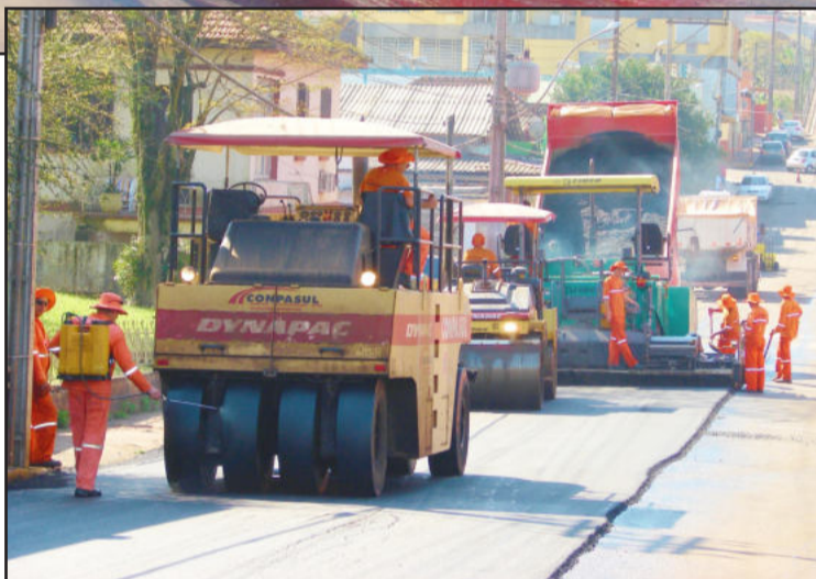
Obras de asfaltamento da Rua Carlos Arnt