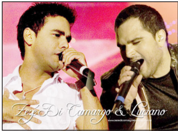
Zezé di Camargo e Luciano