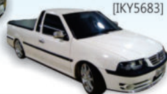
Saveiro 1.6 2003 branca, DH/VE/TE/som RD 17" [IKY5683]