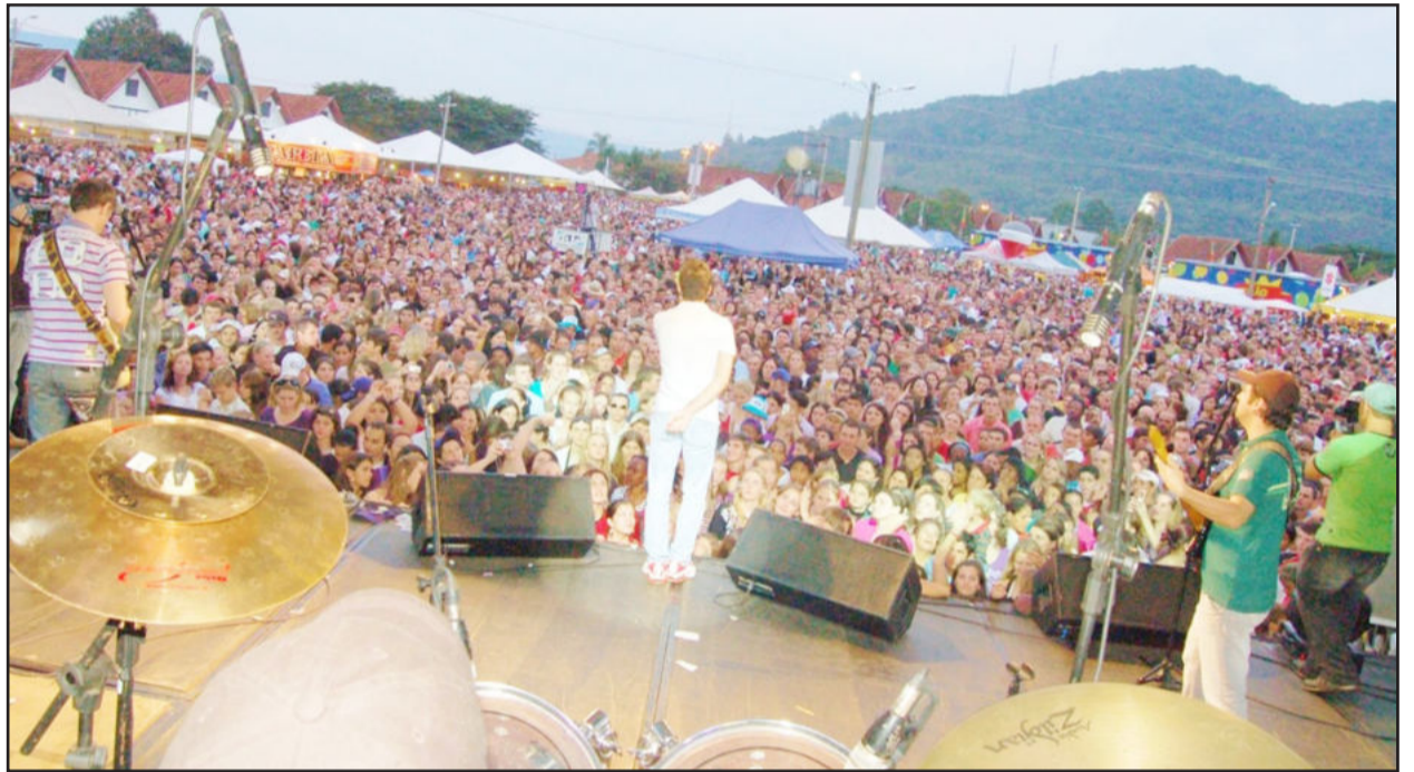
Show da Família em Teutônia no ano de 2009

Jota Quest, Zezé di Camargo e Luciano e Show da Família estão confirmados