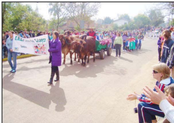
Escolas mostraram sua criatividade