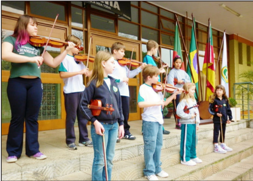
Apresentações artísticas dos alunos integraram programação cívica