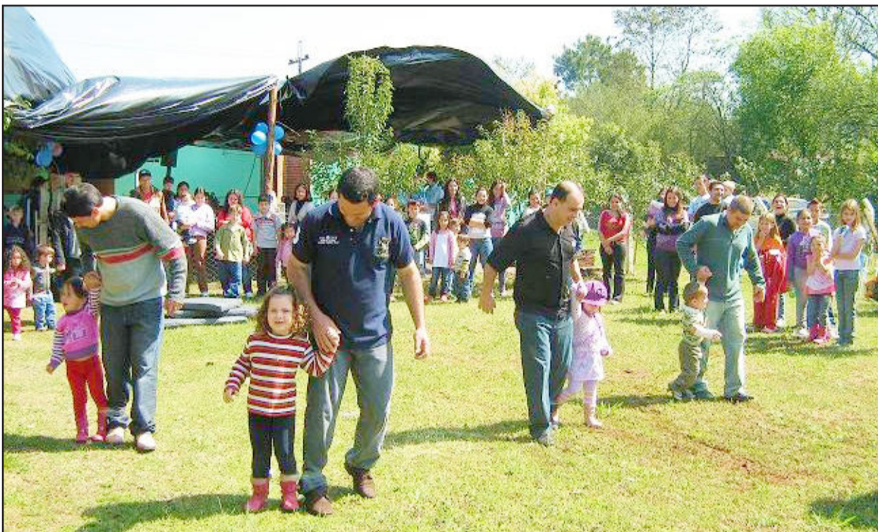
Diversão durante a gincana, com a participação dos pais

A importância da participação dos pais na Escola, na educação e no aprendizado de seus filhos, foi reforçada, de forma evidente, em evento realizado na Escola de Educação Infantil Dente de Leite, de Canabarro. Era visível a expressão de alegria no rosto de cada criança, pela felicidade de poder compartilhar um dia com a família dentro da Escola.