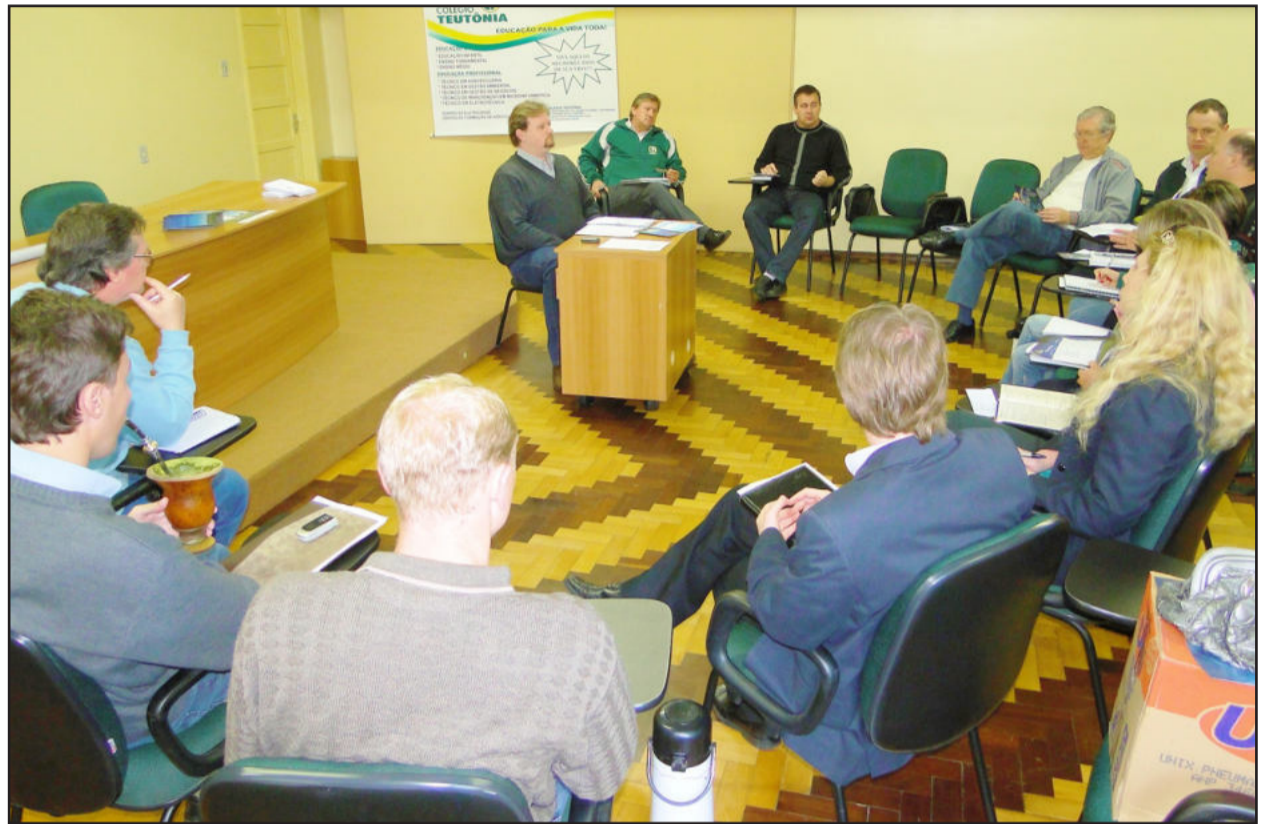
Comissão organizadora esteve reunida no dia 9 de setembro para tratar dos últimos detalhes do evento

Na terceira quarta-feira do mês de setembro o Rio Grande do Sul comemora o Dia Estadual do Leite, instituído pela Assembléia Legislativa no dia 25 de outubro de 2005. O objetivo da deferência é destacar a importância do alimento para a população e incentivar o consumo da bebida entre os gaúchos, que possui alta concentração de cálcio, essencial para a formação dos ossos, vitaminas e minerais.