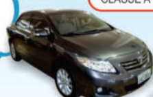
Corolla SE-G 2009 cinza, ABS, air bag, couro [JAC0851]

Quer vender seu carro? A Cia do Carro vende pra você.