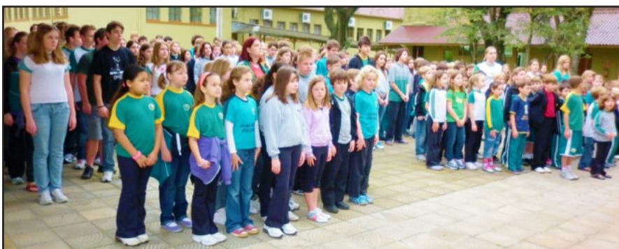
Hora cívica com Hino Nacional Brasileiro e Hino à Independência