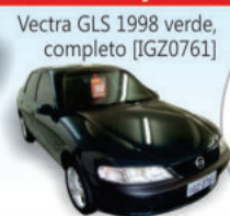
Vectra GLS 1998 verde, completo [IGZ0761]

Acompanhe o Mês de Aniversário cheio de Surpresas!