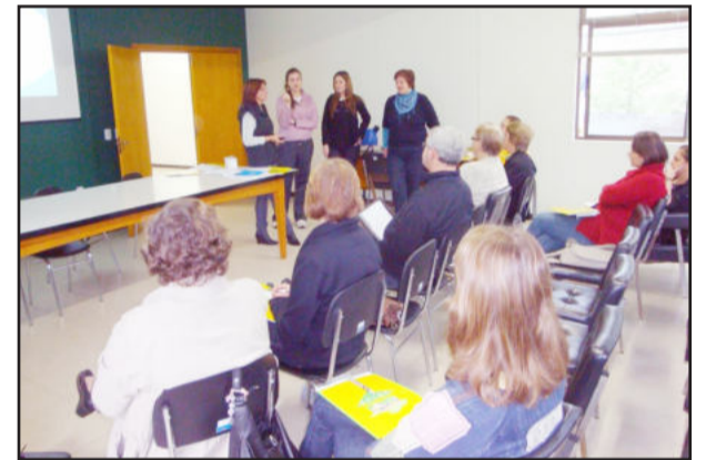
Conselheiros realizaram capacitação na Câmara de Vereadores