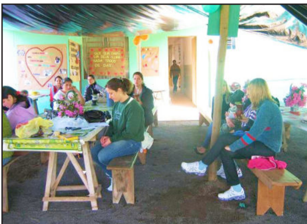
Almoço de integração na escola