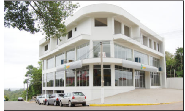
Unidade de atendimento do Sicredi em Nova Santa Rita

Em seu discurso, o presidente Silvo Landmeier enalteceu as potencialidades do Município onde iniciaram as atividades da sexta unidade de atendimento inaugurada durante sua gestão. "Nesta terra, que tem o merecido título de Capital Gaúcha do