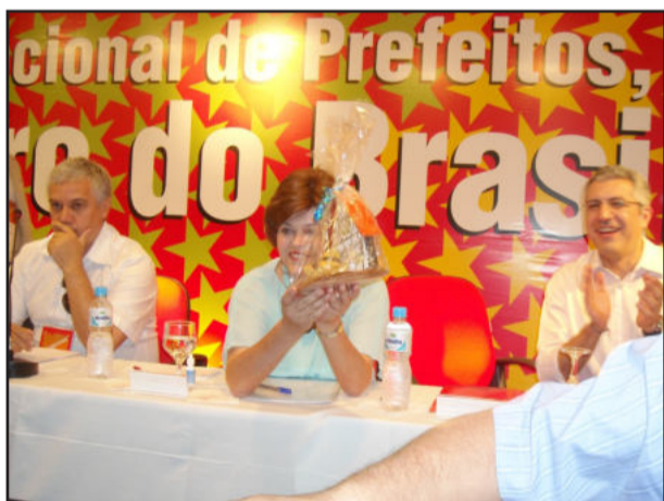
Dilma (c) também recebeu lembrança