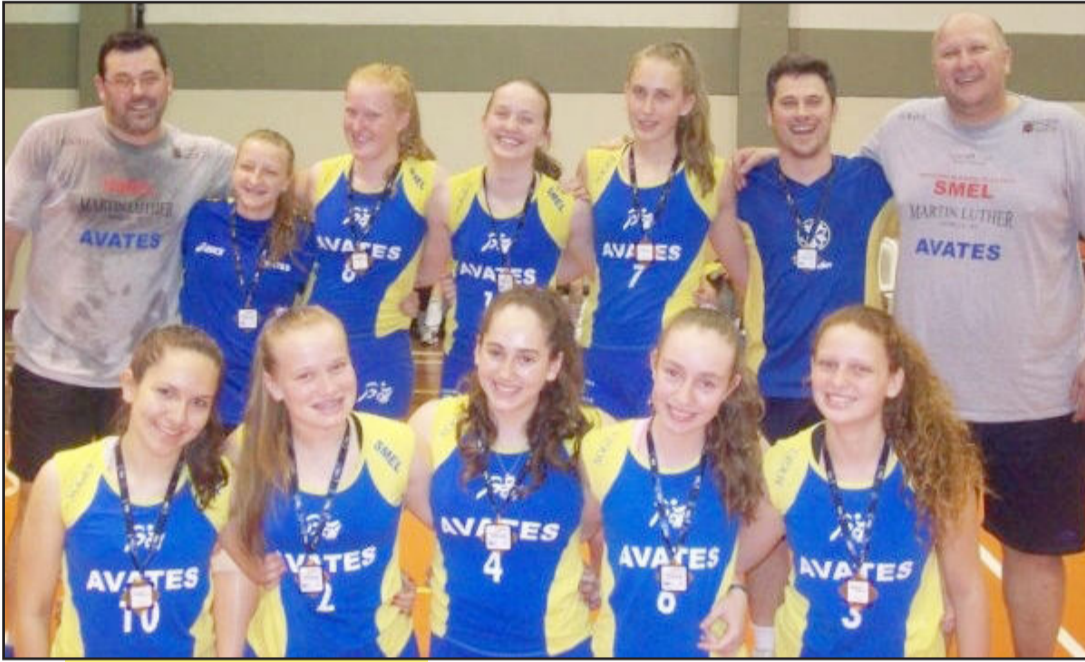
Equipe Infantil do Colégio Martin Luther, campeã nacional da ONASE, agora busca um título internacional