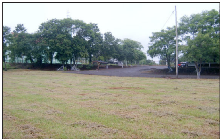
Espaço para o Show da Família

Na parte da tarde, a partir das 13 horas, ocorre o Show da Família, com a presença da Banda Mercosul, Grupo Momentus, Tchê Guri, Safira, Portal da Serra, Toque de Mágica e Brilha Som. Além dos DJ's Maurinho do Freqüência Máxima e Eskeminha da Omega Sound. O encerramento da Expowink 2009 e lançamento da edição 2011 está programada para às 20 horas.