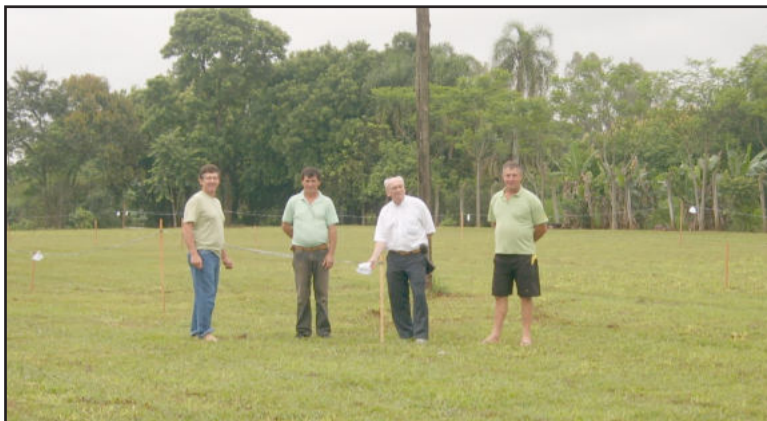
Espaço de exposição externa com identificações já colocadas

Embora a previsão do tempo é instável para a data, a