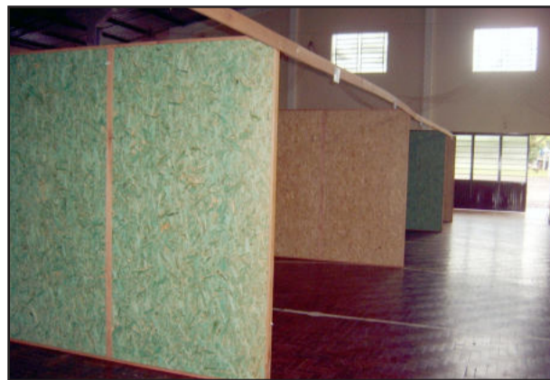
Montagem dos estandes, ontem