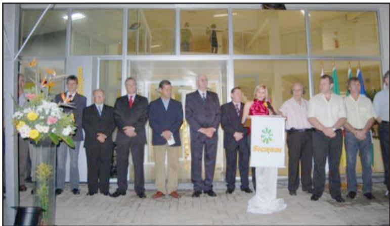
Autoridades prestigiaram a inauguração

Na sexta-feira passada, dia 6 de novembro, a Sicredi Ouro Branco RS inaugurou sua 15ª unidade de atendimento. E o município de Nova Santa Rita foi escolhido para receber este modelo alternativo de instituição financeira, uma cooperativa de crédito.