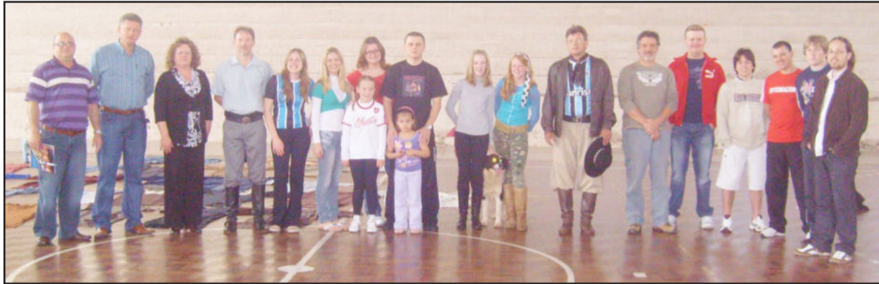
Administração municipal com dirigentes e atores da peça teatral

“Natividade: a luz entre os homens” será encenada dia 4 de dezembro