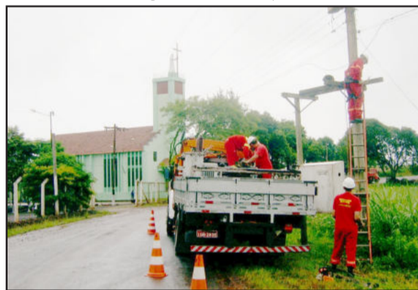
Instalação de energia elétrica

15 horas, no palco 2. Na noite, o grupo Balanço do Tchê faz apresentação no palco 1, às 21 horas. O fechamento dos pavilhões e encerramento das atividades no sábado acontece às 22 horas.