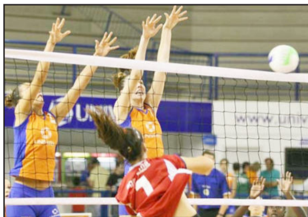
Equipe enfrentou maratona de jogos fora

O jogo será frente ao Grêmio Náutico União, de Porto Alegre, no Complexo Esportivo da Univates.