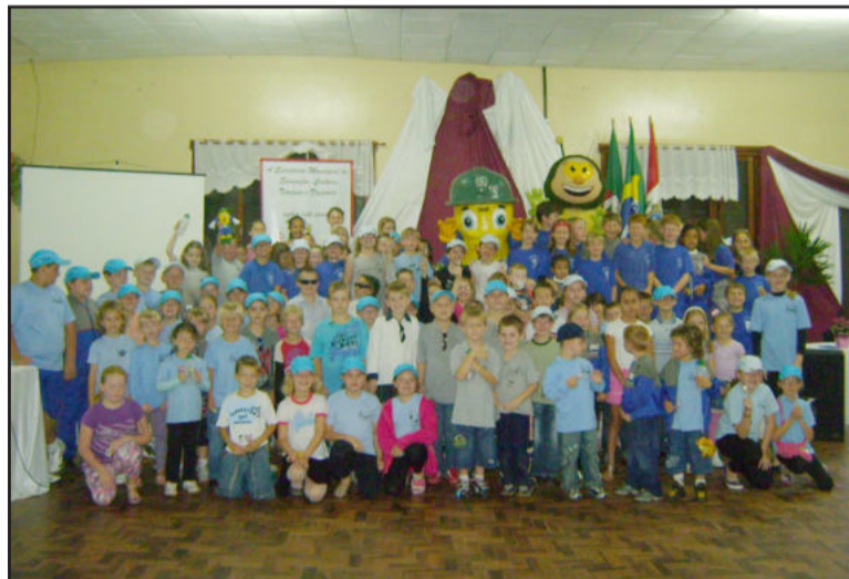
Crianças e mascotes participaram da feira