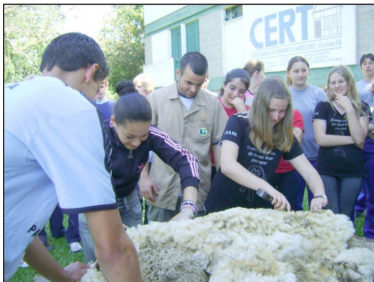
Alunos acompanharam rotina de curso técnico

Durante o evento, os visitantes puderam conhecer um pouco mais sobre o cotidiano das aulas nos cursos técnicos em Agropecuária, Meio Ambiente, Administração, Microinformática e Eletrotécnica.