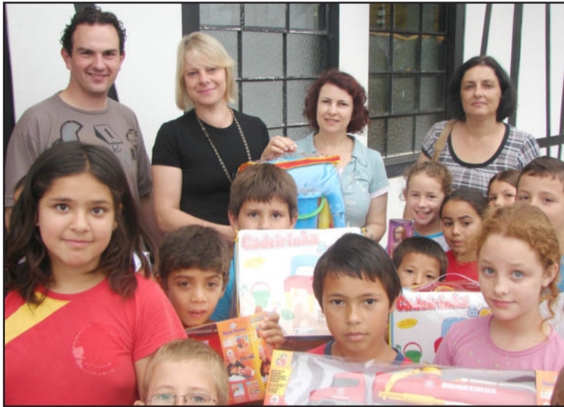
Inara entregando brinquedos aos alunos

Um dos diretores da empresa afirmou que a indústria viu a oportunidade de alguém usar estes brinquedos. “Queremos fazer o bem. Nós queremos fazer a ação. Vocês professores saberão melhor do que ninguém des-