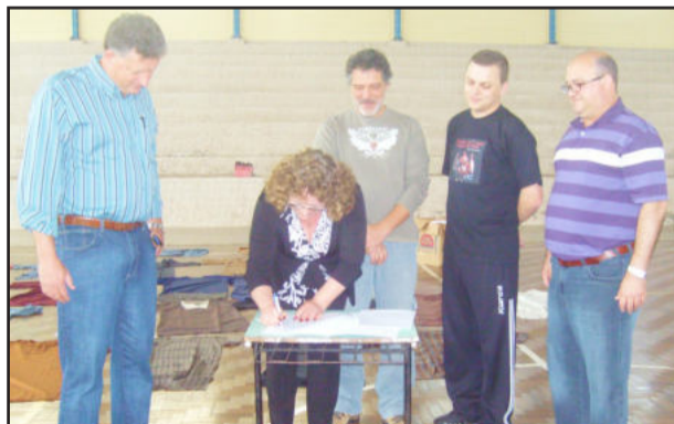
Assinatura de contrato para o espetáculo natalino