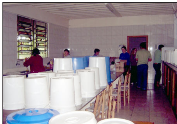
Comunidade envolvida na preparação

No sábado, dia 14, a programação inicia às 7 horas, com alvorada festiva de fogos, seguida da abertura da Expowink para a visitação. Uma roda de Chimarrão será proporcionada em frente ao Pavilhão Principal às 9 horas. O tradicional almoço começará a ser servido às 11h30min. Na parte da tarde, a Banda Desejo faz a festa a partir das