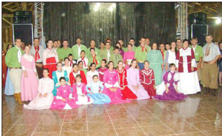
Piquete Relincho de Potro forma mais uma turma do curso de danças

A patronagem do Piquete Relincho de Potro, de Fazenda Vilanova, promove fandango de encerramento do curso de danças, que será realizado no dia 5 de dezembro, no galpão da entidade. O evento inicia às 21h com janta, seguida de fandango animado pelo grupo Os Buenachos, de Santa Cruz do Sul. Será a segunda turma a concluir o curso de danças do Piquete Relincho de Potro. No ano passado, no baile de inauguração do galpão da entidade, ocorreu a formatura de 24 casais.