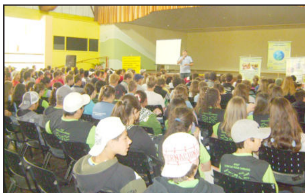
Alunos foram recebidos no auditório central do Colégio Teutônia