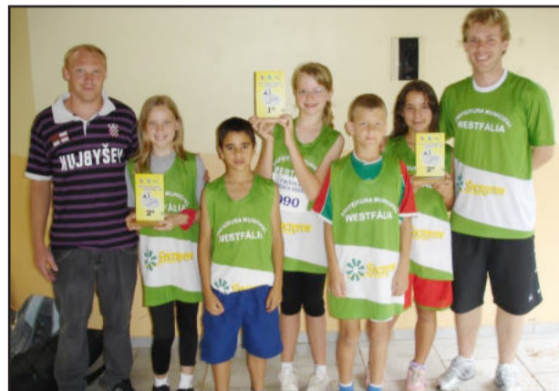
Atletas de Westfália tiveram bons resultados