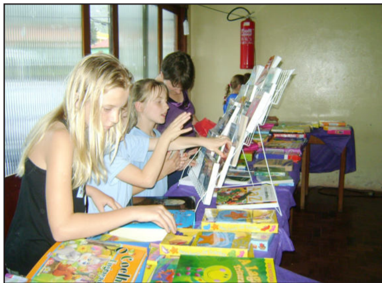
Alunos conferindo a feira de livros