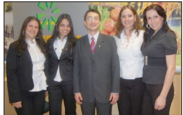
Equipe de colaboradores da unidade de Nova Santa Rita

Melão, o Sicredi deseja fazer história; queremos ser reconhecidos pelo povo trabalhador de Nova Santa Rita como a instituição financeira desta comunidade. Todas as riquezas que encontramos nesta região nos fazem crer que temos muito trabalho pela frente. E isso nos deixa felizes, pois temos certeza que poderemos financiar o sonho e o trabalho diário de muitas pessoas, seja no cultivo de melão, da melancia, da mandioca, de verduras ou de arroz; seja no comércio, na indústria ou nos mais diversos ramos de atividades", afirmou.