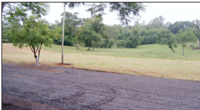
Colocação de brita

expectativa é positiva por parte dos organizadores. “Os últimos detalhes estão sendo organizados com muito carinho. O público pode vir tranquilo, porque se chover tem espaço para se abrigar e se fizer muito calor tem muita sombra”, enfatizou Guilherme Blume. Ele acrescenta que o evento será sucesso, a exemplo das edições anteriores.