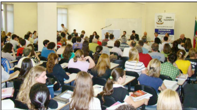
Moradores prestigiaram a sessão