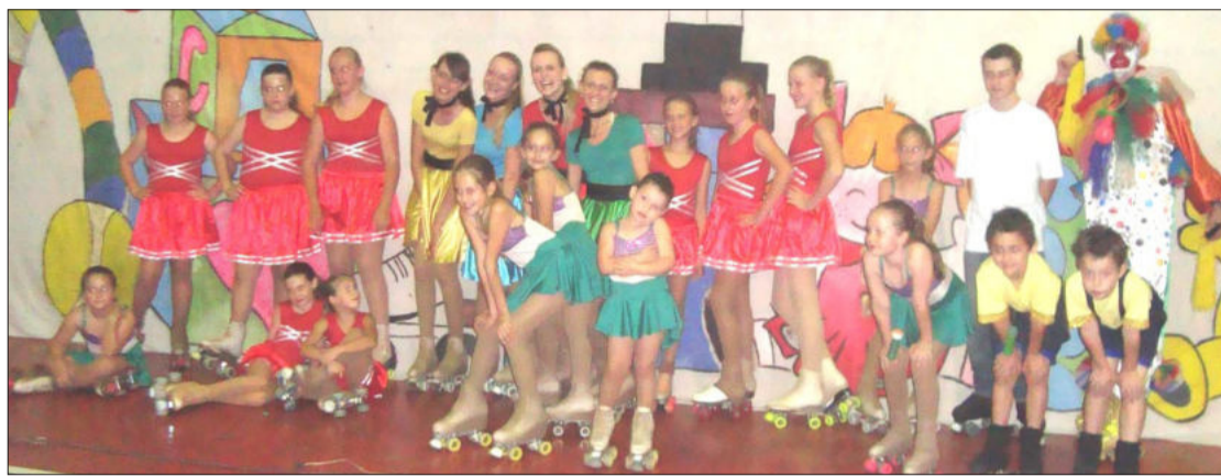
Grupo Deslizart encantou com a arte de andar sobre patins

O ginásio esportivo municipal de Imigrante recebeu bom público na noite do último sábado, dia 5, que prestigiou e aplaudiu o show de patinação organizado pelo Deslizart.