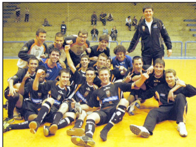
Equipe Infanto-Juvenil da ACBF é bicampeã da Copa Nordeste de Futsal

Além do título da equipe Infanto-Juvenil, as equipes de base da ACBF conquistaram, no mês de dezembro, a Copa RBS TV na categoria Juvenil (Sub-20) e o vice-campeonato do Nordeste, na categoria Infantil (Sub-15).