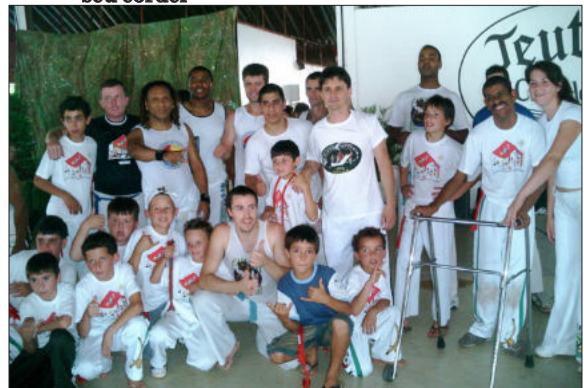
Grupo do Cemef e professores convidados