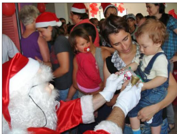
Crianças carentes receberão visita do Papai Noel

Faltando quinze dias para o Natal os preparativos para a segunda edição da Festa de Natal do Marmitt já começaram. O evento que ocorrerá na próxima sexta-feira, dia 18, às 13h30min, na Escola Municipal de Educação Infantil Criança Feliz, numa promoção da Prefeitura de Estrela, por meio da Secretaria Municipal da Saúde e Assistência Social, através da Estratégia de Saúde da Família de Moinhos, com a participação de empresas, instituições, ONG's, entidades religiosas e sede comunitária.