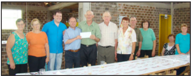
Entrega do auxílio em Nova Westfália

Três grupos da melhor idade de Fazenda Vilanova foram contemplados com uma subvenção financeira da administração municipal, no valor de R$ 2 mil cada. De acordo com projeto de lei aprovado pela Câmara de Vereadores, os auxílios foram encaminhados para a Associação Cultural Vilanovense, entidade coordenadora das oficinas esportivas e culturais do Município, e repassados aos beneficiados.