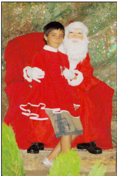
Papai Noel recebe pedidos

Segunda-feira - Recital do Centro Cultural 25 de Julho, com apresentações de professores e alunos e exposição de obras de arte, na Associação Pró Desenvolvimento de Languiru, início às 19h30min.