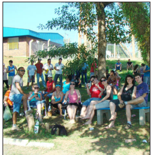
Parque municipal é o ponto de encontro nos finais de semana

O objetivo do Departamento de Esportes do Município é disponibilizar as quadras de futebol e vôlei, pista de caminhadas, academia ao ar livre e os ambientes naturais do Parque Municipal aos moradores para a prática de diversas modalidades esportivas e de lazer.