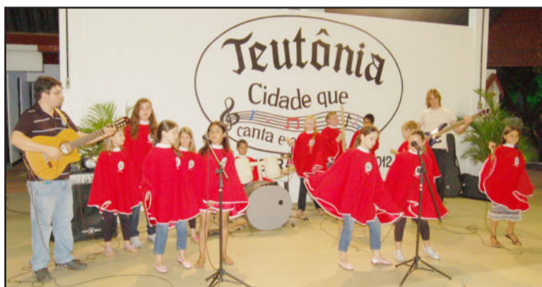
Apresentação de alunos do Cemef