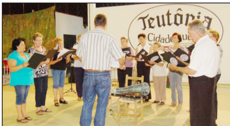
Apresentação do Coral da Melhor Idade