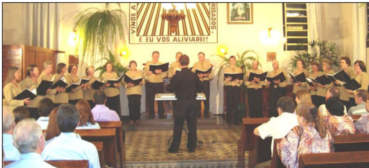
Coral Municipal de Colinas realizando sua apresentação na Igreja

O 8º Festival de Corais de Colinas foi realizado no último sábado, dia 5, na Igreja Evangélica Cristo. Seis corais estiveram presentes, abrilhantando a noite com suas vozes afinadas. O evento faz parte da programação do "Natal Luz e Vida 2009 de Colinas" e contou com a participação de corais de Colinas, São Leopoldo, Brochier, Pareci Novo, Imigrante e Capitão.