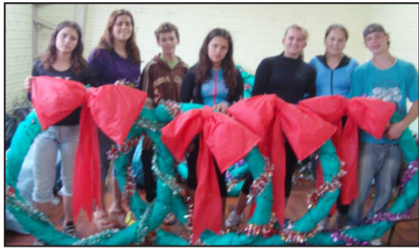
Alunos do Pró-Jovem confeccionaram enfeites