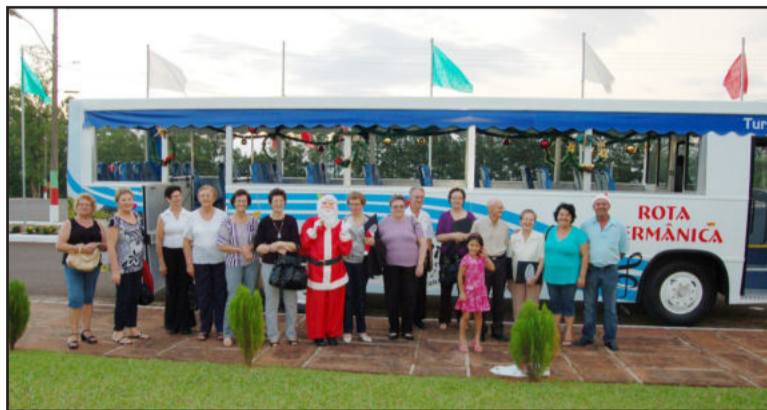
Passeios com o Turismóvel