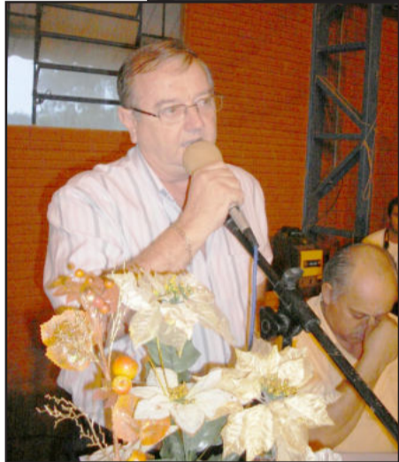
Prefeito Elemar Rui Dickel