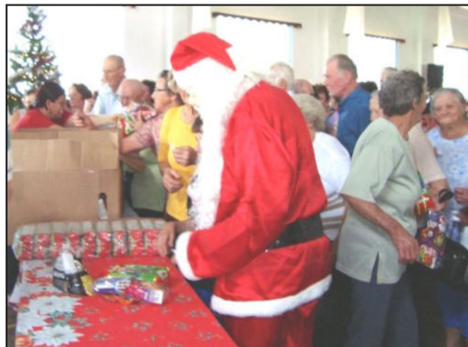
Papai Noel distribuiu presentes aos idosos

O evento aconteceu no dia 3 de dezembro no Centro Comunitário de Colinas e faz parte da Programação Natal Luz e Vida de Colinas.