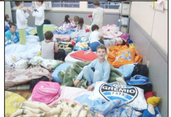
Alunos "acamparam" na escola

No dia 4, aconteceu a tradicional Noite do Pijama para os alunos da Educação Infantil do Instituto de Educação Cenequista General Canabarro (Ieceg). Cerca de 150 alunos do Nível A e B, Turno Inverso da Educação Infantil, primeiro, segundo e terceiro anos participaram da atividade que é uma das mais esperadas pelos alunos ao longo do ano letivo. Esse evento costuma ocorrer em outubro que é o mês das crianças, mas neste ano devido à gripe A foi transferido para dezembro, já entrando no clima de final de ano e férias que se aproximam.