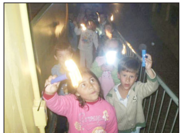
Passeio com lanternas

Segundo as professoras, a Noite do Pijama gera uma expectativa muito grande nos alunos logo no início do ano. "Sabemos que alguns pais ficam ansiosos pelo fato de algumas crianças nunca terem dormido sem sua companhia. É algo normal, mas que precisa ser superado, pois no final, este momento é muito gratificante, servindo para o amadurecimento de cada criança. Neste ano a participação dos alunos chegou a praticamente cem por cento", revelaram as professoras.