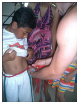
Aluno recebendo seu cordel