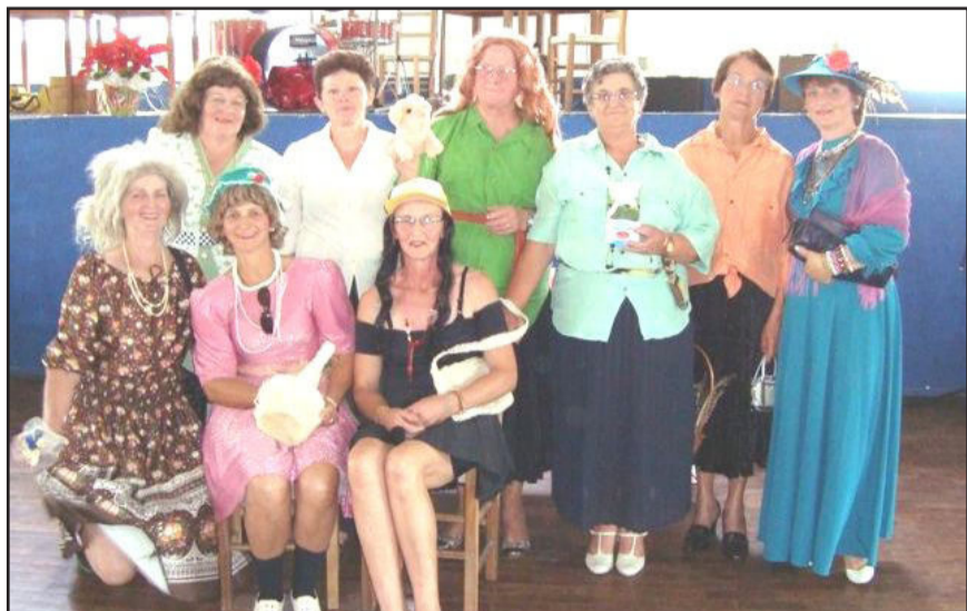
Apresentação de teatro divertiu os idosos