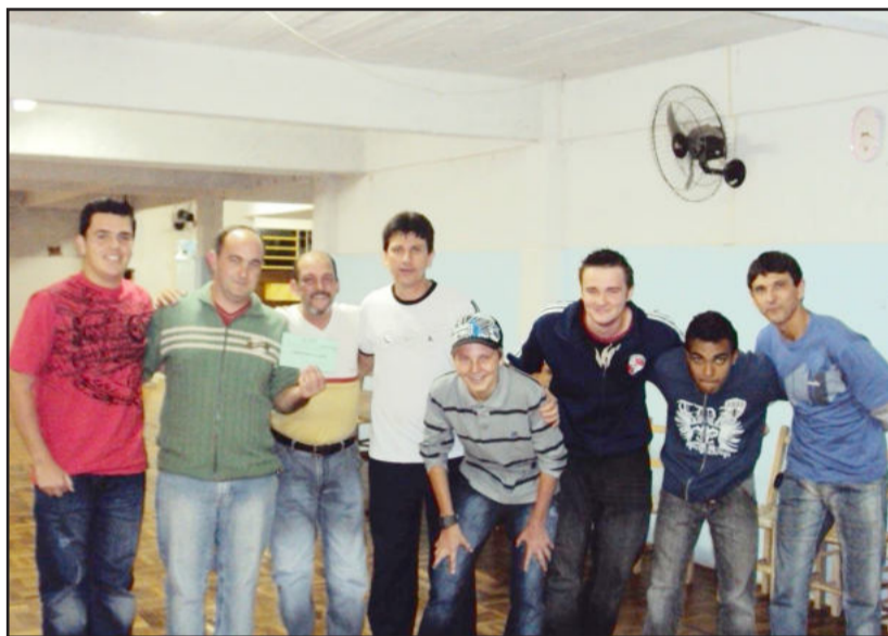
Equipe do Bairro Boa União, campeã na categoria Sub-15 de futsal