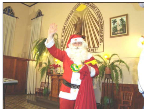
Papai Noel já recebeu as chaves da cidade do prefeito

A organização garante que as apresentações surpreenderão o público. A administração municipal colocará ônibus à disposição da comunidade, conforme o transporte escolar, com saída às 19h30min, fazendo o roteiro como de costume.