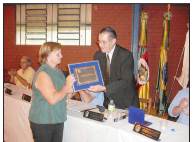
Homenagem ao Clube de Mães