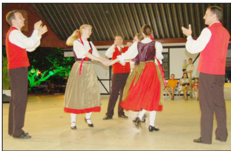
Danças da Associação Artística Teutônia