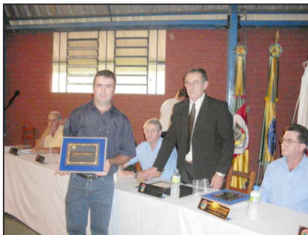
Homenagem à Sociedade União