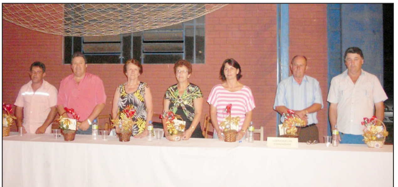
Lideranças da comunidade foram homenageadas