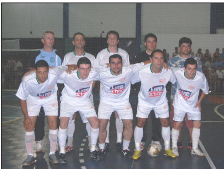
O time Beck Parts teve a maior folga do placar na noite