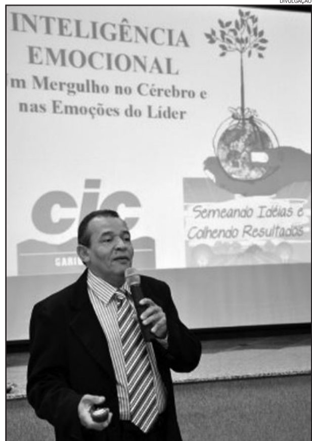
Pessoas que não aceitam mudanças ficam presas a preconceitos, diz consultor na Quarta Empreendedora