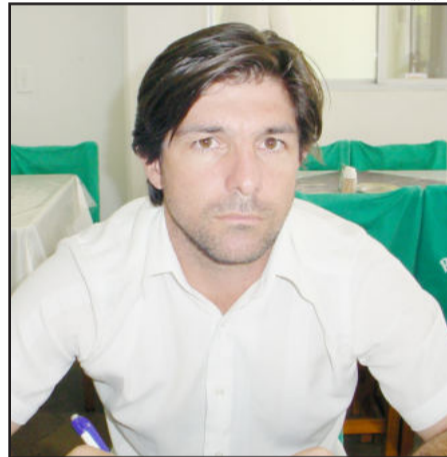
Hannecker comenta que atletas serão contratados