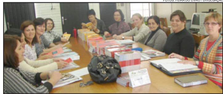
Professores, coordenações e direções estão motivadas com a Feira do Livro

No sábado, dia 26, manhã e tarde, o público poderá visitar a Feira, haverá brinquedos infláveis para as crianças, além de diversas apresen-