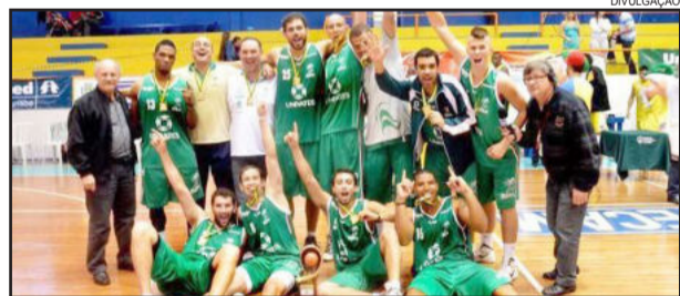
Univates Bira conquistou a vaga na Super Copa ao tornar-se campeão da Copa Sul

XV de Piracicaba Assembleia Paranaense Univates/Florestal Alimentos/Bira Planalto