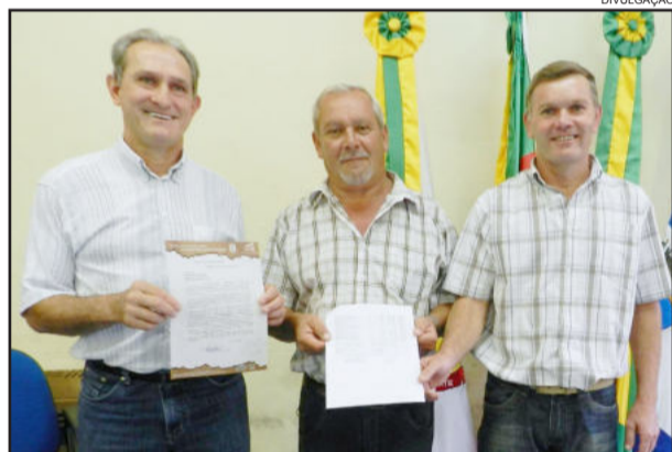
Resultado da feira também foi apresentado ao vice-presidente do Legislativo (c)