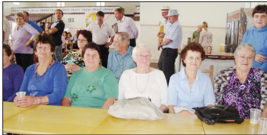
Grupo Viva-Viva marcou presença