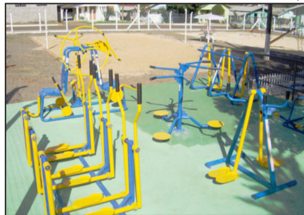
Área da Rua Edvino Schaeffer