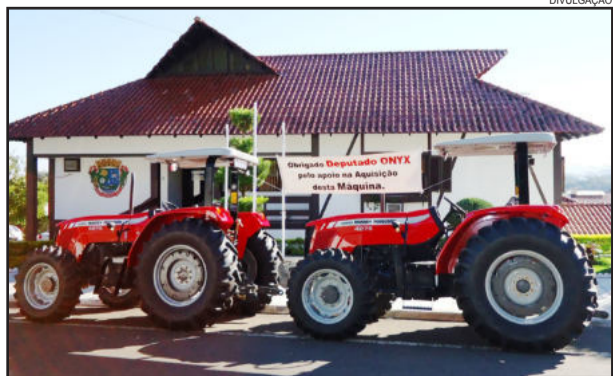
Tratores agrícolas chegaram a Colinas