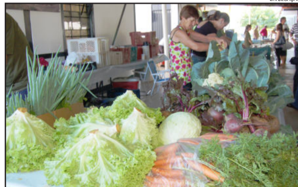
Feira de Agricultura Familiar permite que o produtor venda diretamente ao consumidor