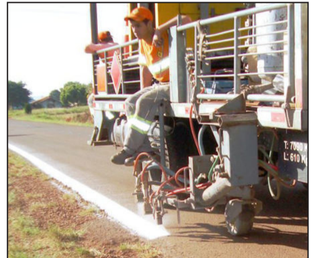
Começou a pintura da sinalização dos asfaltos do interior de Teutônia