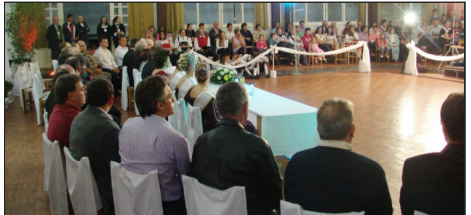
Grande público prestigiou a solenidade de abertura, assim como autoridades municipais, regionais e estaduais estiveram presentes