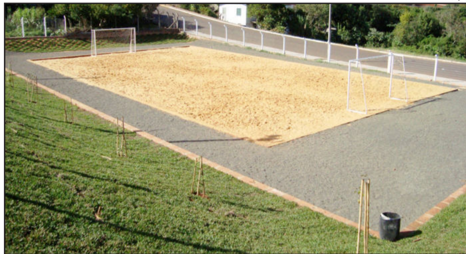
Campo de areia é cercado por uma pista de caminhada e gramado

A Administração Municipal de Teutônia entrega neste domingo, dia 13 de maio, a partir das 15 horas, mais uma importante obra para a comunidade. Será a Área de Lazer Três Amigos, que se localiza entre as ruas Helmuth Heemann e Arno Feldens, no Bairro Canabarro. Além das atrações do próprio local, haverá brinquedos infláveis e mateada com a Ervateira Ximango. A comunidade é convidada a prestigiar, trazendo sua cadeira, cuia e muita alegria.