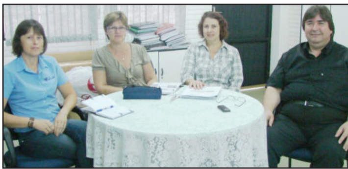
Livrarias Wessel e Armazém participarão da Feira do Livro de Teutônia