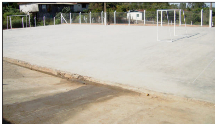
Cancha em concreto polido permite atividades como futsal e vôlei

Além das academias, os locais também receberam campos de futebol sete e de areia, quadras de vôlei, 12 playgrounds para as crianças, locais para caminhadas, entre outros. E a cidade também tem uma adesão muito grande ao futebol de campo, e através do incentivo do poder público foram reabertos 12 clubes de futebol que estavam inativos, o que passou a proporcionar momentos de lazer às famílias, que acompanham as atividades esportivas, além aproximar os jovens das atividades físicas.