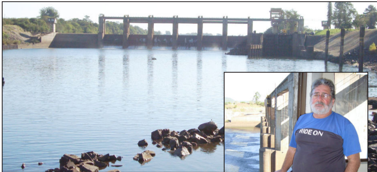
Barragem eclusa de Bom Retiro do Sul está com seu funcionamento limitado