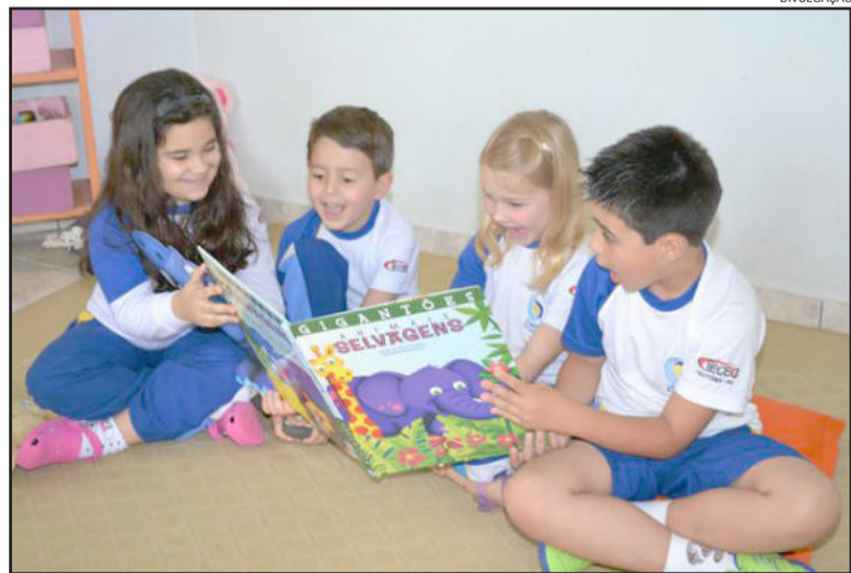
Leitura é estimulada desde a mais tenra idade no IECEG