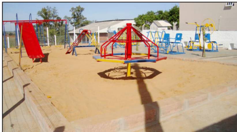
Local conta com parque infantil e academia ao ar livre