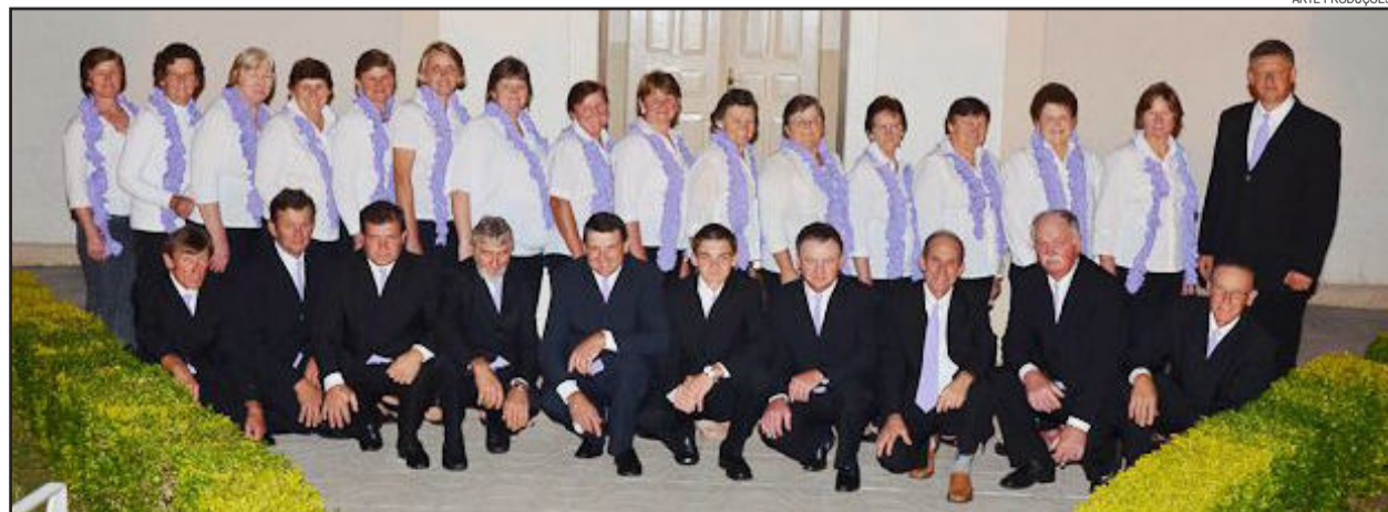
Coro Misto de Linha Clara