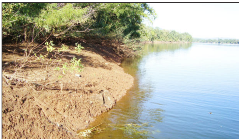
Nível do Rio Taquari está baixo e compromete a navegação de grandes embarcações

Silva recorda que já passou por várias enchentes do Taquari, como a de 1990, quando o rio aumentou 19,76 metros e a de 2011, quando subiu 19,75 metros. No entanto, ele nunca viu o nível tão baixo como agora. Ele pensa que construções de usinas e outras barragens ajudaram na diminuição das águas do Rio Taquari.