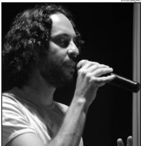
Depois da polêmica, patrono de evento literário fala sobre cachê polêmico, anda de skate e distribui autógrafos

A Feira do Livro vai até o dia 20. Os horários de visitação são de segunda a sexta, das 9h às 21h, aos sábados, das 9h às 20h, e aos domingos, das 13h às 20h.