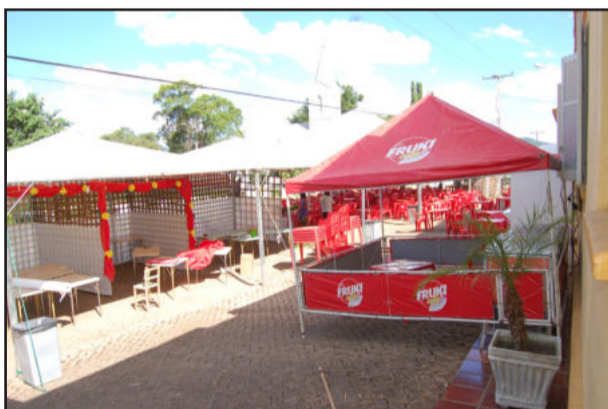
Praça de alimentação e artesanato