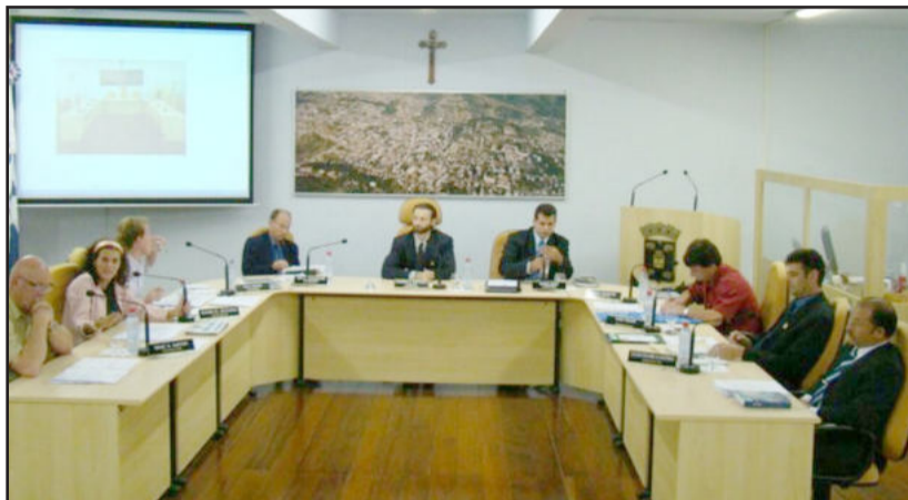
Sessão da Câmara inicia às 18h30min

N a sessão ordinária da Câmara de Vereadores, programada para a segunda-feira, dia 15, com início às 18h30min, consta na ordem do dia, para discussão e votação, projeto de lei do Executivo que autoriza abrir crédito especial de até R$ 70 mil. O recurso será aplicado na pavimentação do pátio do Parque da Fenachamp. Outros quatro projetos do Legislativo estarão em pauta: autorizando doação de bens móveis e equipamentos ao Executivo; oferecendo nova redação a artigo de lei, tratando sobre a implantação de postos de combustíveis. De autoria do vereador Moisés Nekel (PMDB), consta que os novos estabelecimentos deverão oferecer área de estacionamento adequada para caminhões, lavagem e lubrificação, borracharia, restaurante, loja de