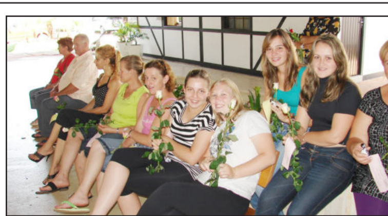
Mulheres foram homenageadas com rosas