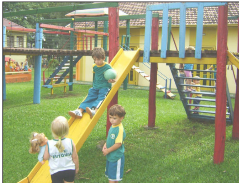
Crianças têm excelente adaptação

Com o objetivo de disponibilizar aos alunos um espaço coberto para a prática de jogos educativos e lúdicos fora da sala de atividades pedagógicas, além de servir como espaço alternativo em dias de condições climáticas adversas, o Colégio Teutônia está em fase final de construção do novo