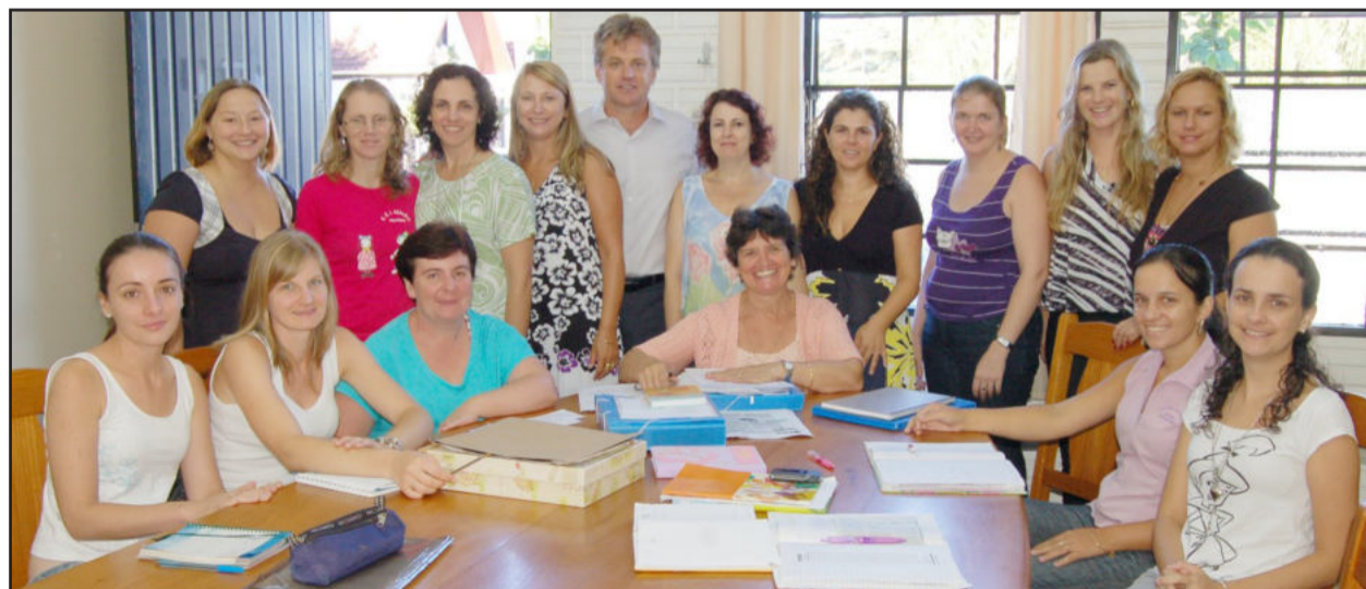
Programa Sorria Teutônia está de volta, também para a Educação Infantil