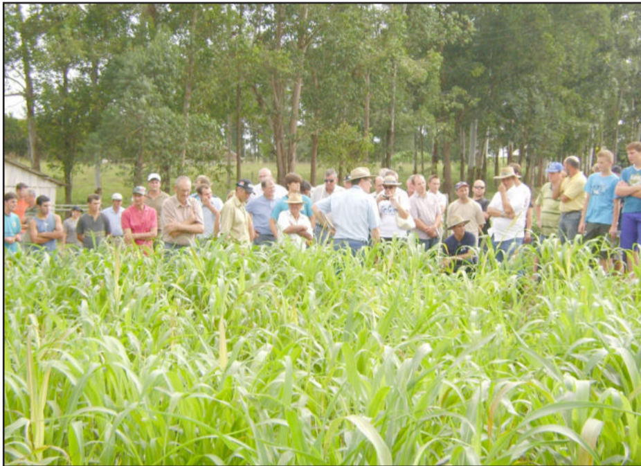
Tarde de Campo contou com a participação de 75 pessoas

O próximo projeto a ser trabalhado será a implantação de cultivares de inverno, testando o sistema de rotação de culturas.