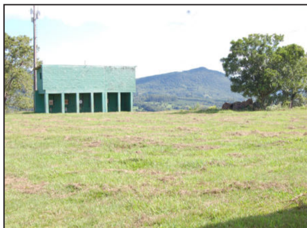
Estande de tiro ao alvo