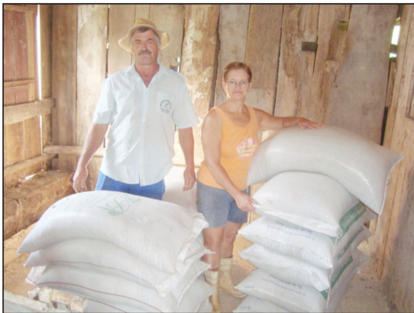
Município auxilia produtores na aquisição de aveia e azevém para pastagens de inverno