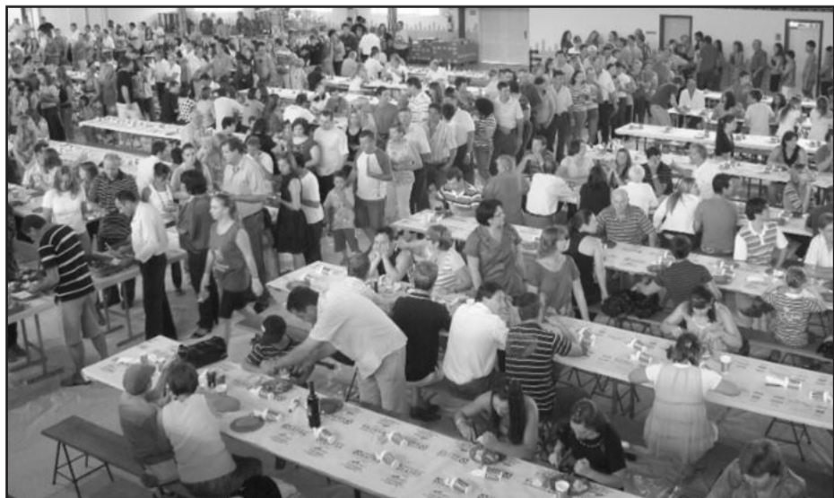
Costelão beneficente à Apae reuniu 800 pessoas

o qual foi repassado à Apae de Garibaldi para a quitação do pagamento de um terreno adquirido no ano passado, para futura ampliação das instalações da Escola Especial Bem-Me-Quer. Os organizadores do evento e a direção da Apae de Garibaldi agradecem novamente a colaboração da comunidade neste evento.