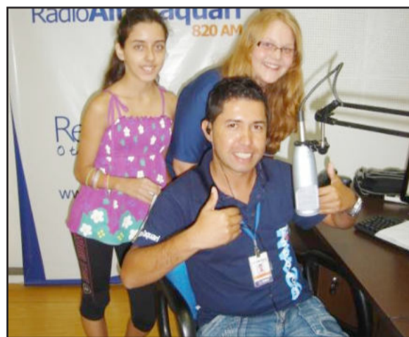
Alunos apresentaram redações

Neste sábado, dia 13, a Escola Municipal de Ensino Fundamental Odilo Afonso Thomé, localizada no Bairro Imigrantes, estará comemorando seu jubileu de prata.