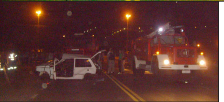
Acidente foi na noite de quinta-feira