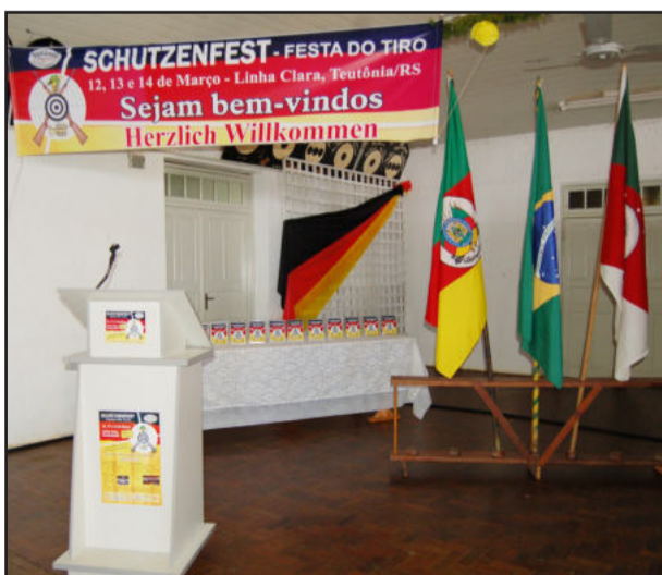
Boas-vindas e bandeiras