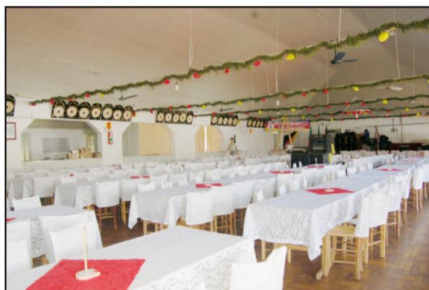
Refeitório para almoço de amanhã