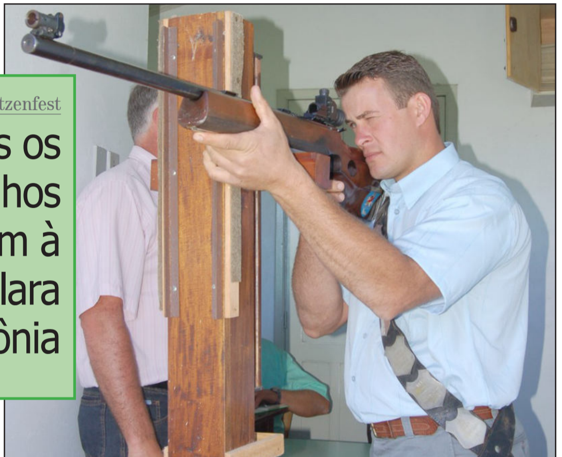
Festa do Tiro ao Alvo começou ontem, segue hoje e encerra amanhã