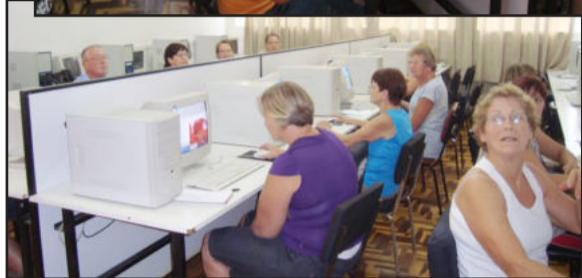
Aulas de informática no Ieceg

Começaram nessa quarta-feira, dia 10, as aulas de informática para a terceira idade no Instituto de Educação Cenequista General Canabarro (Ieceg). A expectativa entre os alunos era grande. Motivados, afirmam de descobrir o mundo da informática, que cada vez se inova mais rápido, os alunos ocuparam o laboratório de informática do instituto para estudar.