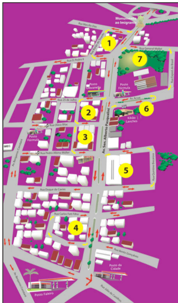
Confira o mapa que exemplifica as mudanças que irão ocorrer no trânsito de Lajeado