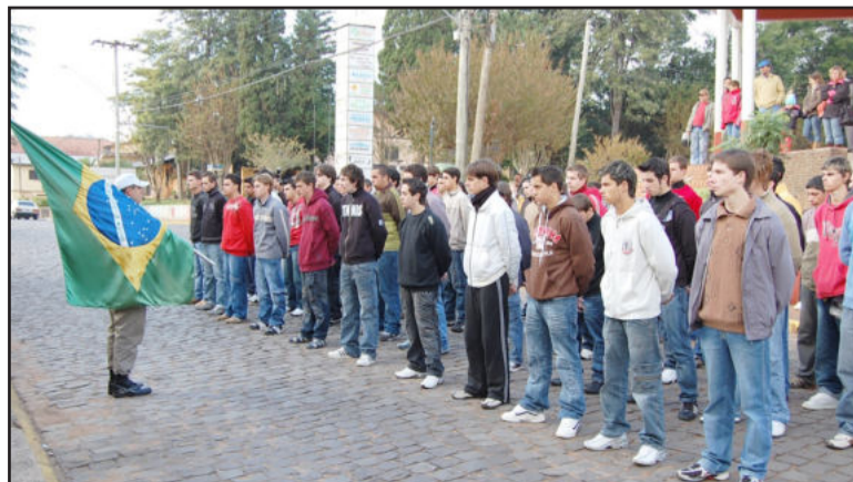
Alistamento é para nascidos em 1992