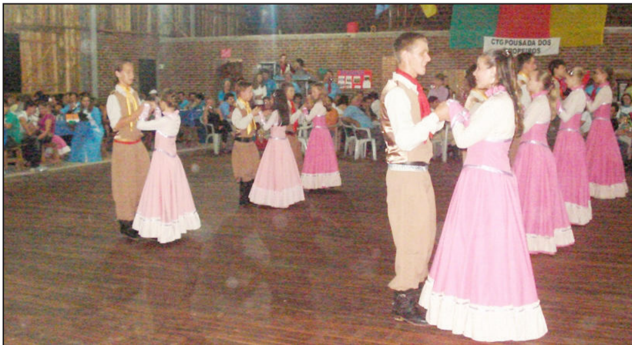
Apresentação da Invernada Juvenil do CTG Pousada dos Tropeiros

Este foi o segundo fandango realizado pelo CTG Pousada dos Tropeiros em sua sede própria. O novo galpão foi construído no ano passado em parceria com a administração municipal. A patronagem convida ainda para o 2º Rodeio Artístico Estadual que será realizado no dia 24 de outubro, integrando a programação da Expofaz 2010.