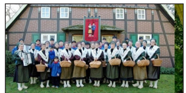
Grupo alemão Kab Laggenbeck

Dia 26 de março, a partir das 20h30min, a Univates recebe o grupo de danças alemãs Kab Laggenbeck. A apresentação ocorre no segundo andar do Centro de Convivência - Prédio 9. Além da dança com sapato de pau, haverá música ao vivo. O grupo veio ao Brasil por meio de intercâmbio com o Centro de Apoio a Pesquisas e Encontros Familiares (Capef), sediado em Teutônia.