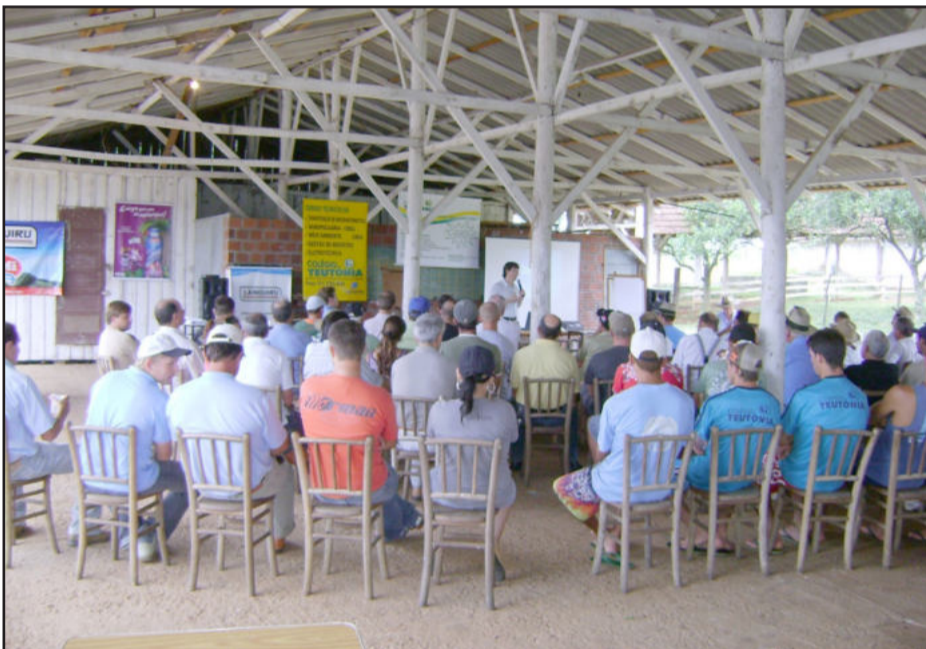
Palestra da Embrapa destacou "Integração lavoura e pecuária"