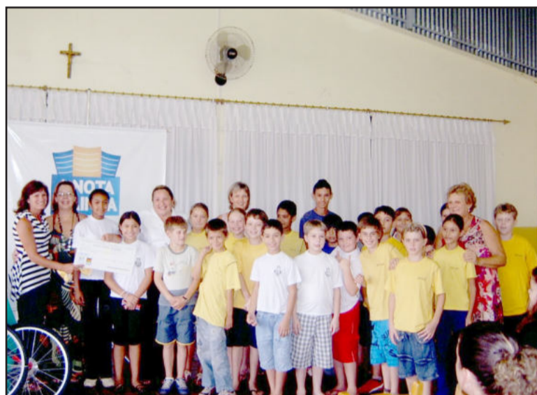
Alunos e professores da Escola Tancredo Neves