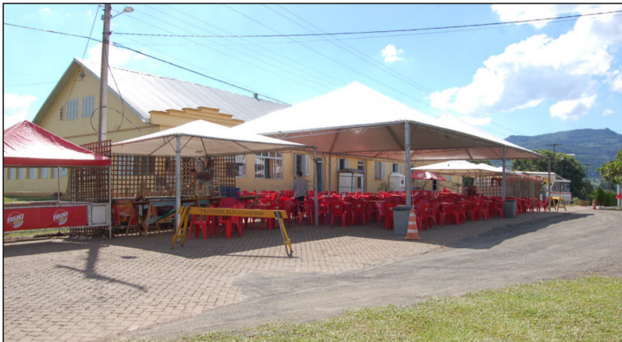
Comunidade está preparada para receber expressivo público