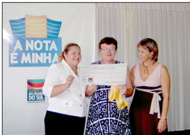
Representantes da Escola Gomes Freire de Andrade