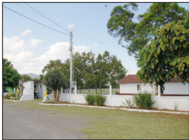
Espaço para brinquedos e jogos