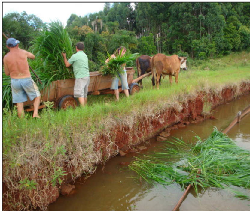
Todas as manhã os peixes são tratados com pasto

Vivo no bairro das Indústrias, ambas iniciando às 7 horas.