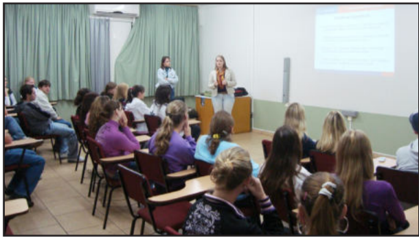
Cursos visam a formação profissional

O Instituto de Educação Cenequista General Canabarro (Iceceg) marcou o início do ano 2010 como um incremento significativo em seus cursos técnicos. Visando a inclusão de alunos em todas as áreas de gestão empresarial, o Iceceg é destaque na formação destes profissionais no Vale do Taquari. A novidade para o ano foi o Curso de Recursos Humanos. Além disso, foram quatro turmas que ingressaram no Módulo 1. Esse módulo é também chamado de Núcleo Comum, pois são turmas que ainda não optaram por um curso específico e estão no primeiro ano dos técnicos. Eles fazem esse módulo, justamente, por apresentar disciplinas que serão comuns dentro dos seis cursos técnicos disponíveis no Iceceg.