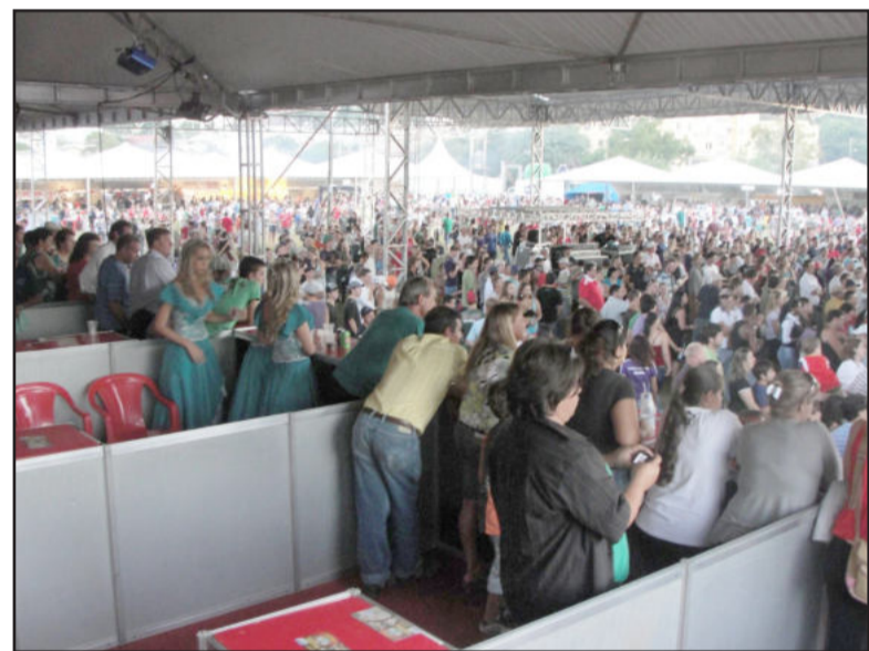
Expressivo público consagrou o evento

tronomia típica a base de aipim, onde as pessoas também faziam fila para experimentar os pratos que podiam ser consumidos no local ou levados para casa, tudo com a coordenação da Emater que também proporcionou pontos de venda de hortifrutigranjeiros, artesanato, sabonetes e outros produtos a base de plantas.