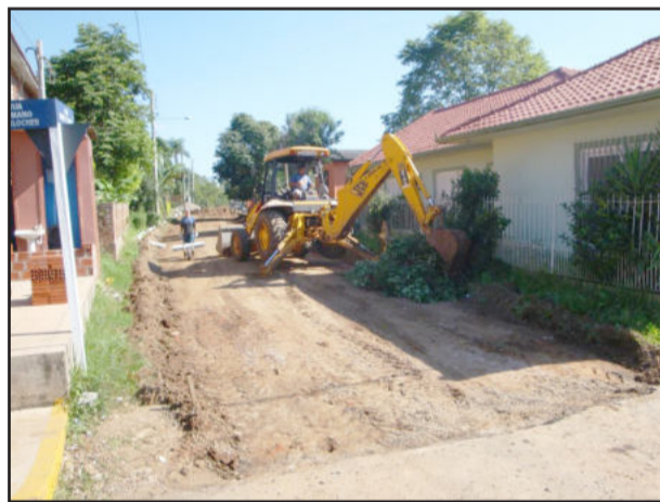
Rua Isabel Schuh em obras