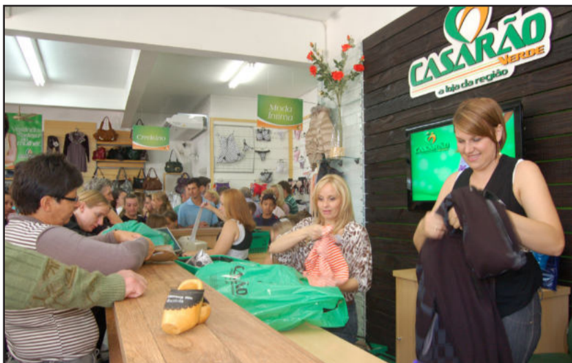
Ambiente interno foi totalmente remodelado

No interior da loja, os espaços foram reestudados, com definição e sinalização clara dos produtos e setores da loja: ala infantil, a seção masculina, espaço feminino, setor