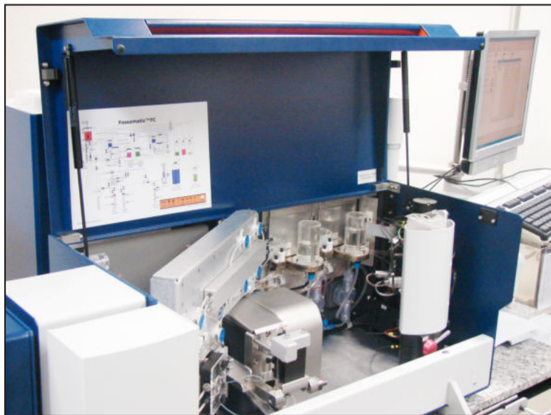
Laboratório tem equipamentos de última geração

O laboratório, que atenderá mais de 180 municípios dos vales do Taquari, Rio Pardo, Paranhana e do Caí, além de Região Metropolitana, Litoral Norte e Serra, oferece análises de proteína, gordura, sólidos totais, sólidos não gordurosos e lactose, Contagem de Células Somáticas (CCS), Contagem Total