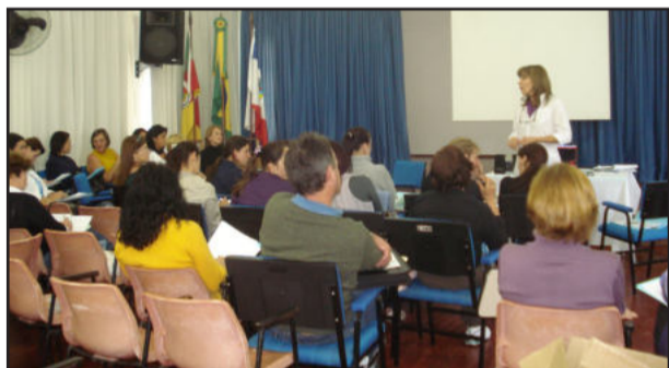
Encontro ocorreu no IEEEM em Estrela