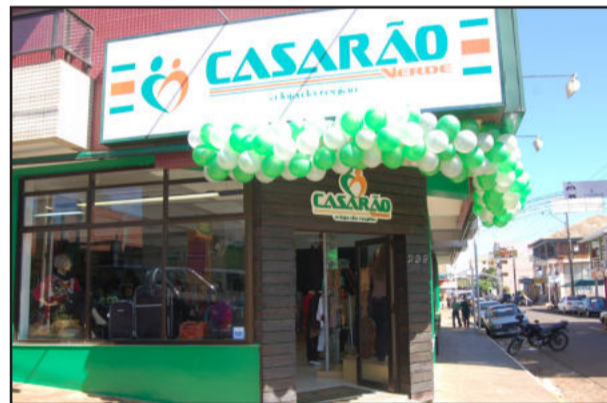
Nova fachada da loja Casarão Verde