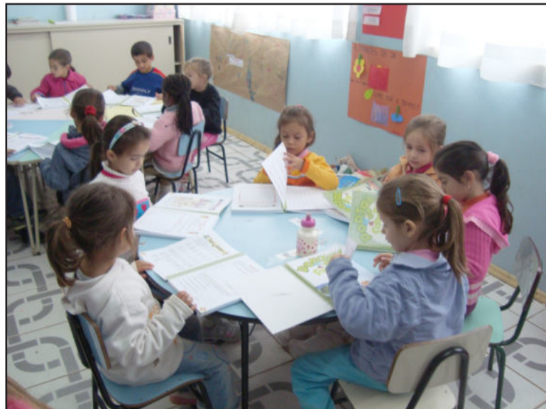
Alunos fazem atividades com caderno