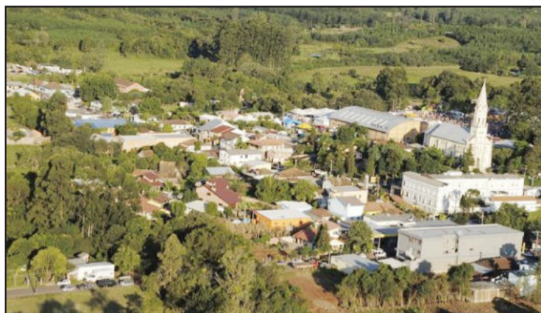
Paverama completa hoje 22 anos de emancipação

O processo de licitação para asfaltamento da EGP 02, principal ligação de Paverama com Teutônia e demais municípios da região, já está em andamento. Propostas de duas empresas