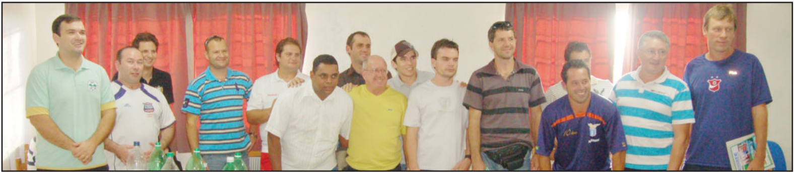
Gauchão de Futsal - 2ª Divisão