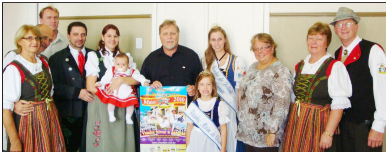
Comitiva do Chucrute em visita ao Executivo

O lançamento oficial do Festival do Chucrute está programado para o dia 23, no salão na Oase, com início às 20 horas.