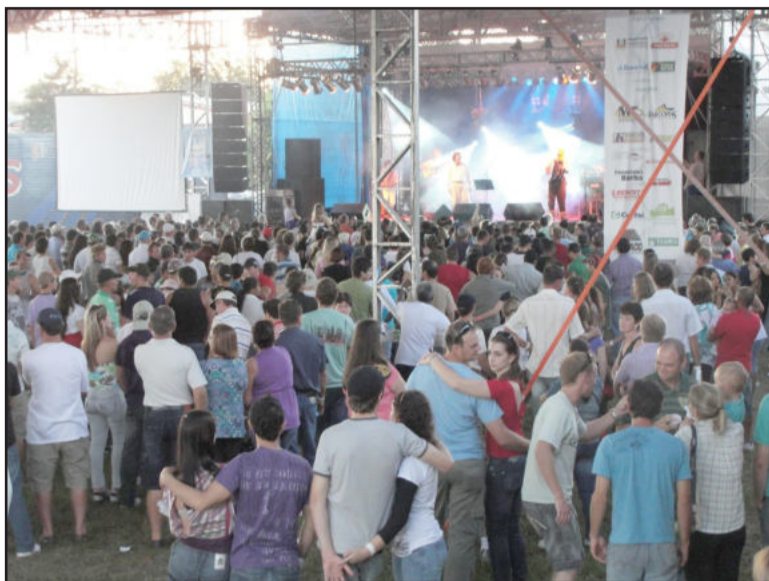
Shows também atraíram o público

Depois de quatro dias de tempo bom, a Expocruzeiro 2010 e a 4ª Festa do Aipim, encerraram neste domingo, dia 11, com um público recorde, consagrando-se como uma das maiores feiras regionais. Cerca de 30 mil pessoas estiveram na feira, desde a abertura na quinta-feira à noite. O movimento foi tanto que no final da tarde de domingo, ainda havia fila na entrada principal. Em função disso, a comissão organizadora resolveu prorrogar o fechamento dos estandes em uma hora, afim de dar tempo aos visitantes para conhecerem todas as atrações. Além disso, houve uma ampliação na programação de shows, que passaram das 20h. Dos 184 expositores participantes desta edição do evento, 90% classificaram a feira como ótima, em uma pesquisa de opinião realizada pela comissão organizadora. Entre os quesitos avaliados estavam organização e estimativa de negócios entre os setores da indústria e comércio. Além disso, havia exposição de bovinos, suínos, caprinos, eqüinos, aves e pequenos animais. Exposição de carros, lanchas, parque de diversões e gas-