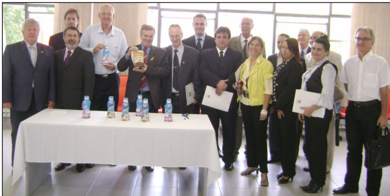
Lideranças degustaram produtos da Lactícínios da Languiru

A redução da idade média do associado da Cooperativa Languiru também foi mencionada por Kreimeier. Para ele, “o jovem se sente motivado à permanecer na propriedade por causa dos investimentos que estão sendo realizados no fomento de suínos, leite e aves”.