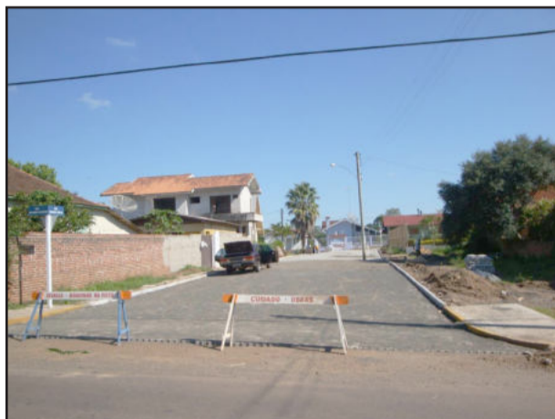
Rua Cristina Müller está concluída

Em continuidade a revitalização da Rua Germano Haslocher e adjacentes, no Bairro Oriental, Prefeitura de Estrela, por meio da Secretaria de Desenvolvimento Urbano, está pavimentando as ruas Cristina Müller e Isabel Schuh. Estão sendo utilizados blocos de concreto, numa área total de 1.416 metros quadrados, sendo 666 metros quadrados na Rua Cristina Müller e 750 metros quadrados, na Rua Isabel Schuh, com investimento total de R$ 69.977,70.