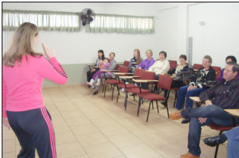
Palestra para os participantes