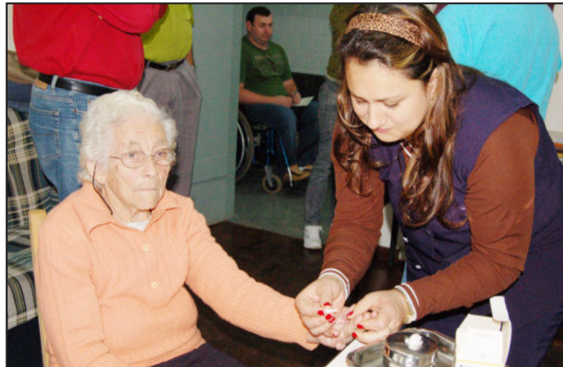
Profissionais monitoram a saúde com exames