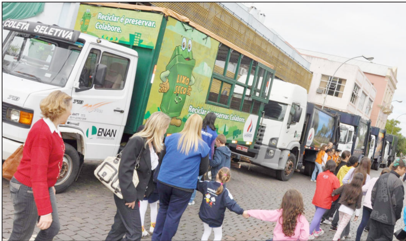
Caminhões da coleta de resíduos domésticos receberam mensagens pela preservação