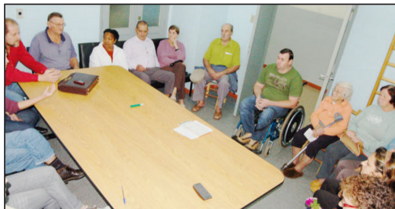
Orientações para uma vida melhor e mais saudável