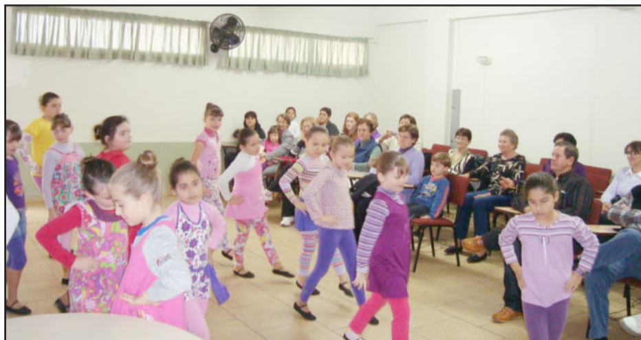
Alunos apresentaram dança aos participantes