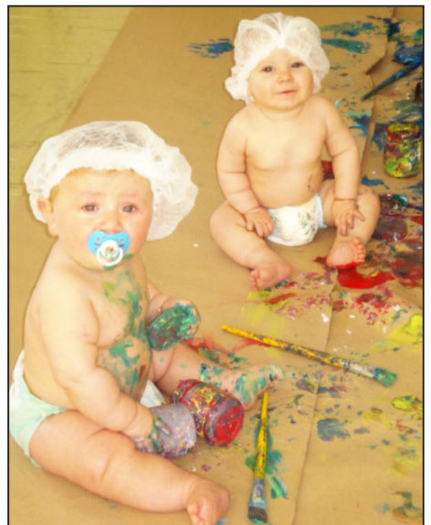
Pequenos do bercário da Escola Pequeno Mundo

Estão em andamento as obras de pavimentação asfáltica da Rua Olavo Bilac, no Centro de Colinas.