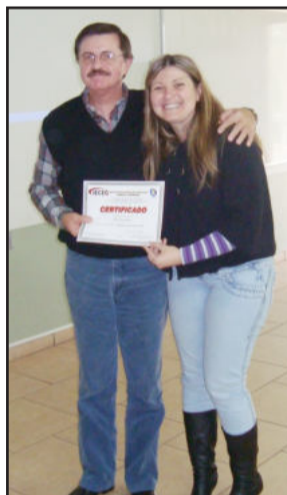
Entrega de certificado