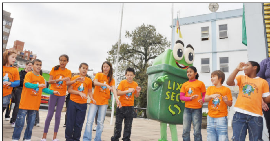
Alunos do Centro Educacional Marista Irmão Emílio cantaram jingle no lançamento