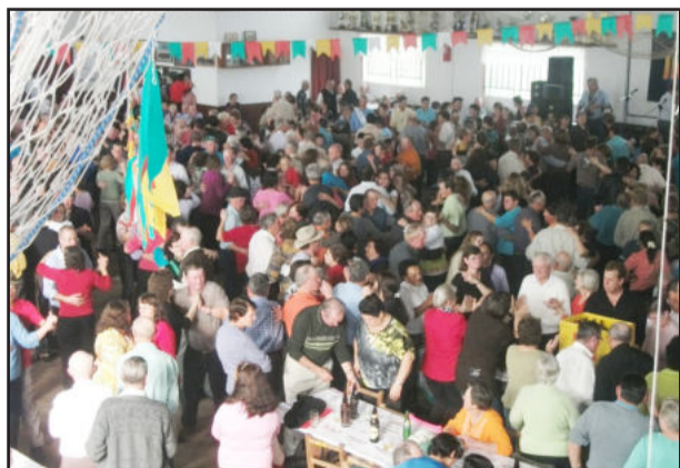
Evento teve grande público