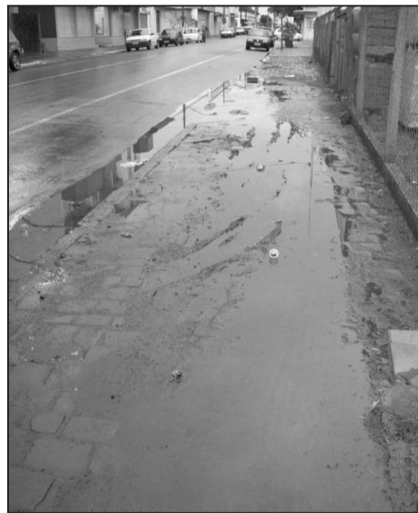
Rua General Osório. O risco de acidentes se acentua nos dias de chuva

Um mês depois da publicação de imagens que mostravam as más condições em trechos do passeio público na região central de Garibaldi, acontece o que se previa. Uma professora aposentada sofreu, na última sexta-feira, dia 9, uma queda devido ao desnível da calçada. A professora relatou que por sorte não teve nenhuma fratura, mas que os hematomas incomodarão por bastante tempo. "Tive que ser levada ao hospital", afirmou a mulher que preferiu não ter seu nome divulgado.