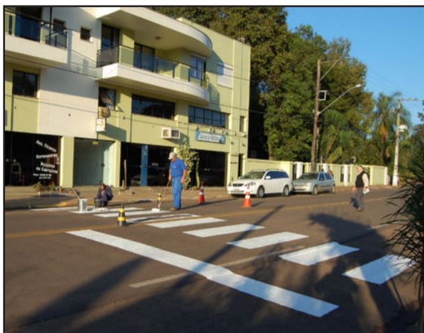
Repintura nas faixas de segurança

Na Seca Baixa, em frente à empresa Hollmann, também foi pintada uma faixa de segurança. “Esperamos que os motoristas diminuam a velocidade e respeitem cada vez mais as faixas de segurança”, ressaltou o secretário.