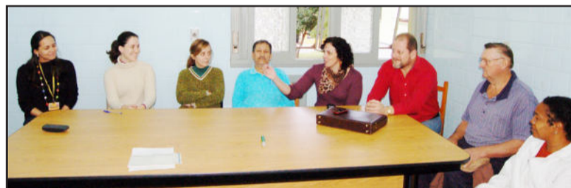
Trabalho em grupo, com conversas e orientação

rem o hábito de rir bastante e dar pelo menos oito abraços por dia. “Nós precisamos disso e esquecemos de fazer coisas que fazíamos quando éramos crianças. Isto vai dar mais anos e mais qualidade de vida”, concluiu.