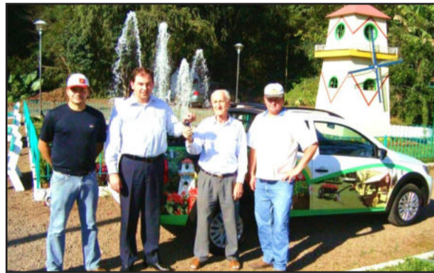
Município recebe veículo novo

O Município de Colinas é reconhecido oficialmente como “A Cidade-Jardim” do Estado do Rio Grande do Sul através da Lei Estadual nº 13.390, de 11 de março de 2010.