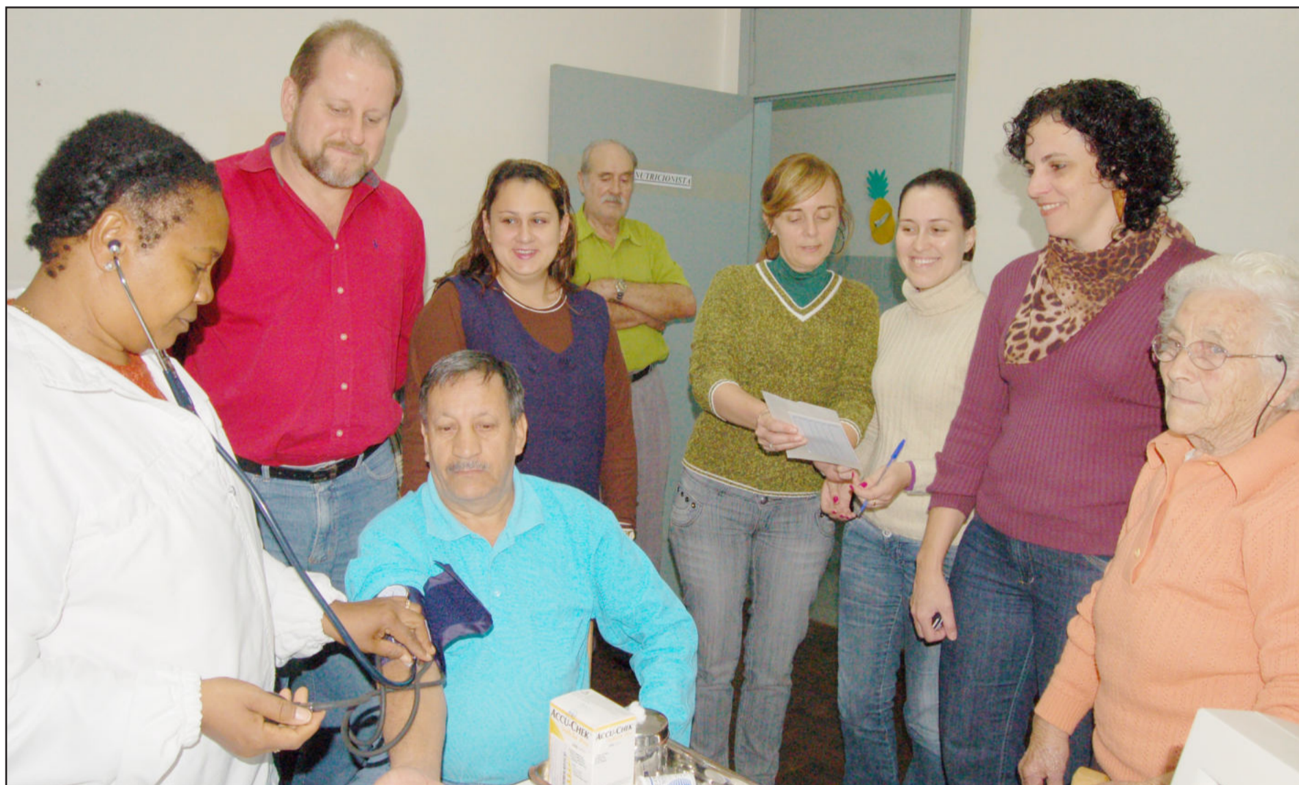
Novo trabalho com hipertensos e diabéticos tem o objetivo de proporcionar mais saúde. Página 2

Lajeado reforça coleta seletiva com campanha de conscientização