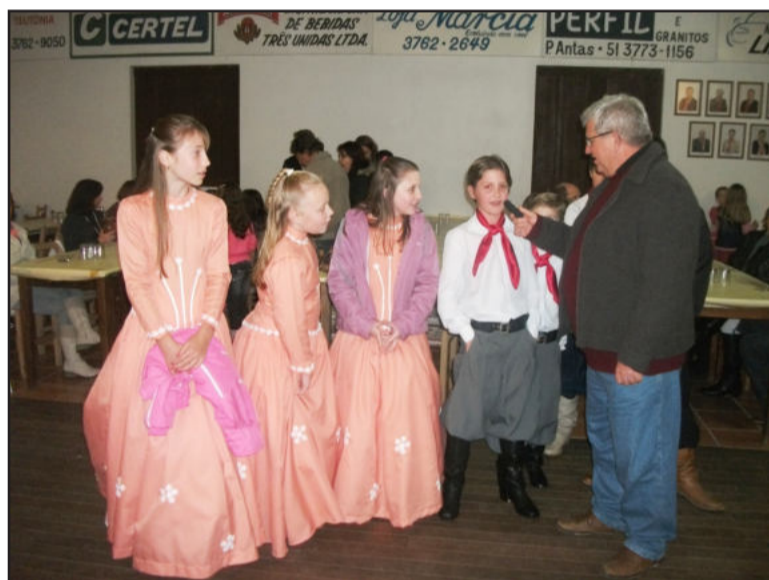
Famil (d), da Popular, entrevista a invernada artística mirim