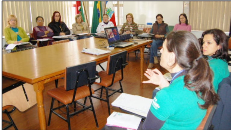
Reunião foi para dar início à organização de ações para a Semana da Família

Na Semana da Família 2010, o Pais Presentes já definiu a realização da palestra "Convivência Familiar", para pais e filhos adolescentes, marcada para dia 12 de agosto, das 19h30min às 21h, no Pavilhão 4 do Parque do Imigrante, destinada às escolas do Ensino Fundamental. No mesmo lugar, acontece no dia 14 de agosto, a oficina "A importância do brincar, pais e filhos no desenvolvimento in-