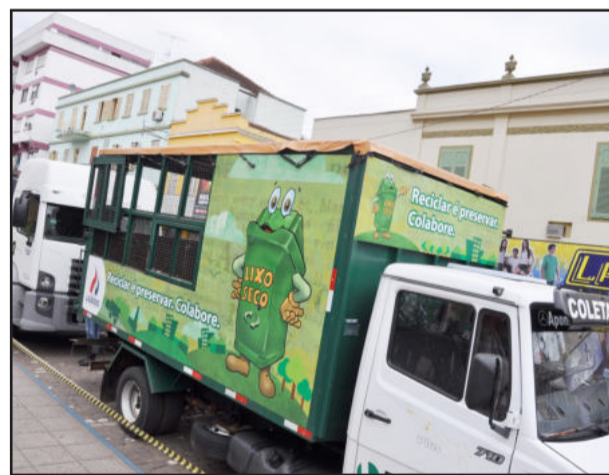
Mensagens chamam atenção no veículo da Coleta Seletiva de Lajeado