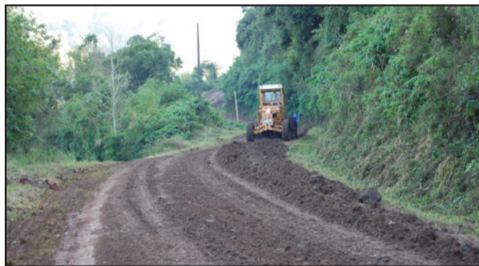
Recuperação de estrada na Linha Garibaldi

A Secretaria Municipal de Obras de Imigrante, nos últimos quinze dias, realizou serviços de recuperação de estradas, em duas importantes localidades do interior: em Linha Rechts e na Linha Garibaldi, desde o Bairro Daltro Filho até a divisa com Roca Sales. Além da limpeza das laterais das vias, foi realizado ensaibramento e colocação de brita.