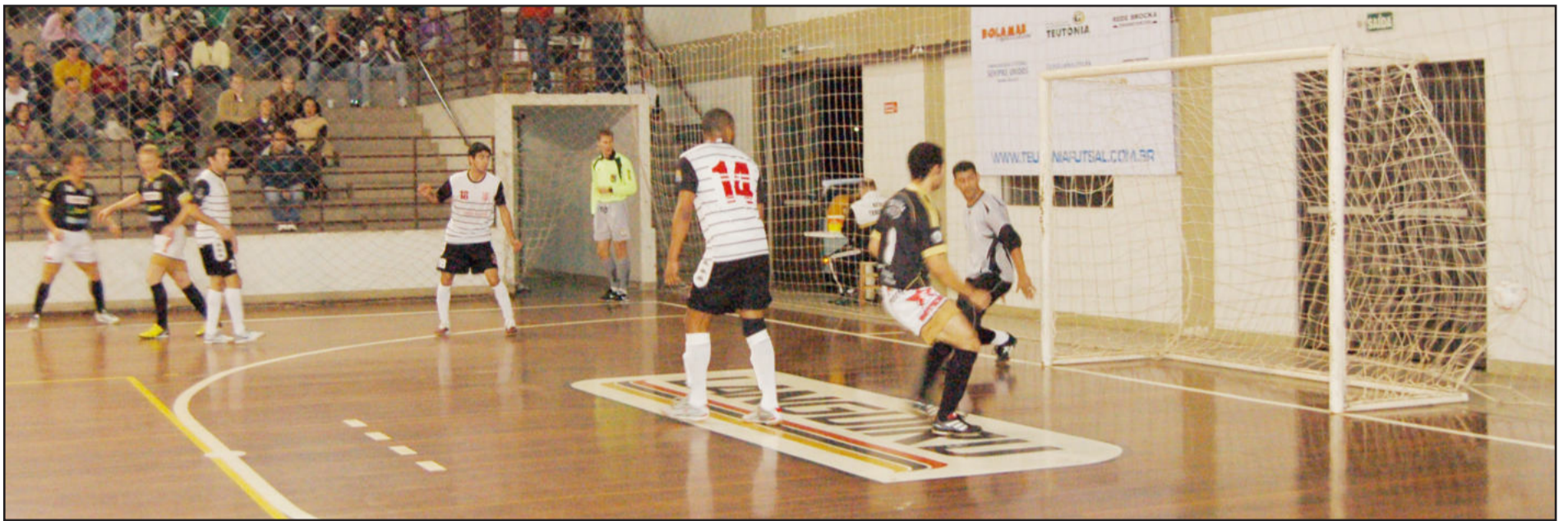
Peixe abriu o marcador em jogada ensaiada de lateral