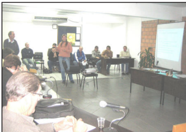
Explicação aos vereadores