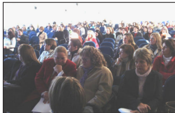
Professores reunidos ontem

No dia 29 de agosto, a coordenadora da 3ª CRE participará do encontro da Asmevat - Associação dos Secretários Municipais de Educação do Vale do Taquari, para avaliar a situação e discutir questões como elaboração de um calendário de recuperação de dias letivos e a garantia do transporte escolar para as escolas do Estado que fazem uso do mesmo.