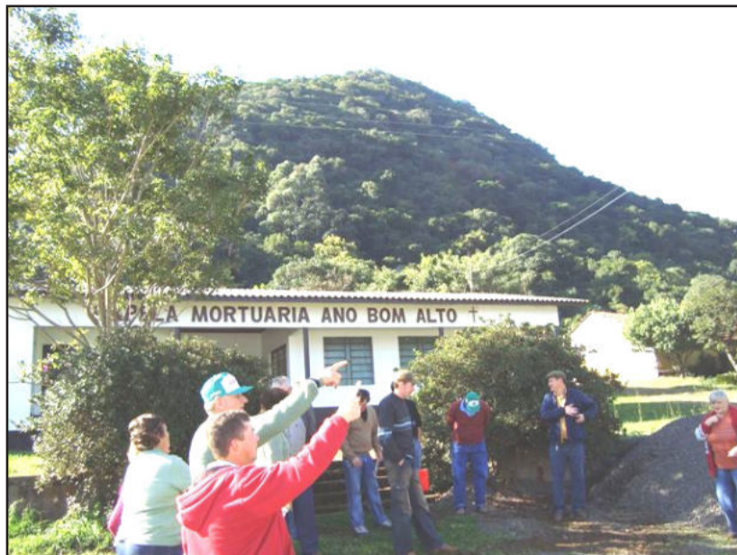
Mata nativa na Linha Ano Bom Alto

No decorrer das visitas foram observados os aspectos econômicos, sociais e ambientais, anotando-se as principais atividades existentes, as tecnologias utilizadas, os aspectos de infra-estrutura comunitária, a situação dos mananciais de água, da conservação do solo, dos dejetos animais, da