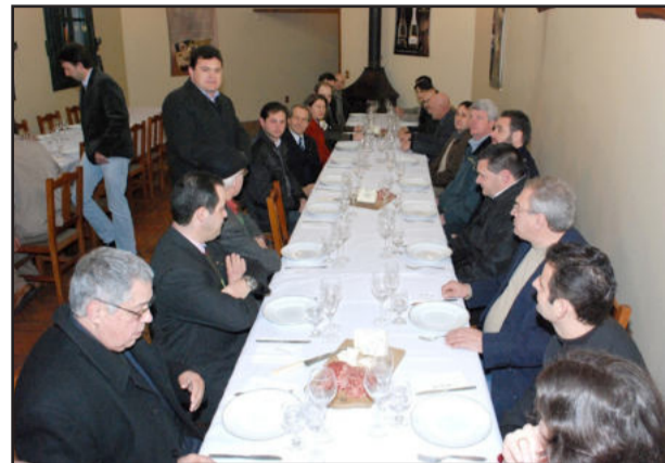
Vinícola recepcionou convidados