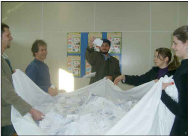
Sorteio foi ontem à tarde na CIC