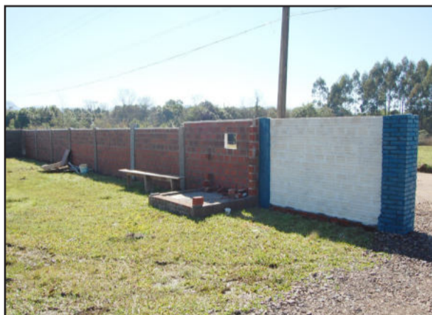
Novo acesso é pela rua lateral

Os investimentos no patrimônio parece que refletiram e deram resultado também dentro de campo, pois na estreia da Copa Sicredi Assine, o Cruzeiro venceu ao 11 Amigos por 1 a 0, gol anotado por Marcos Borges (Quinho).