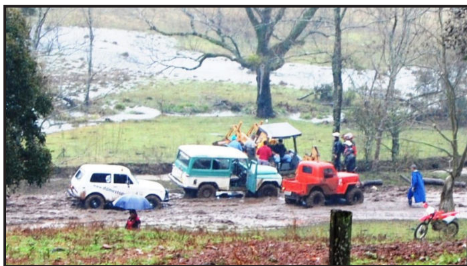
Jipeiros na Trilha do Porco no Rolete, em Paverama. Página 10