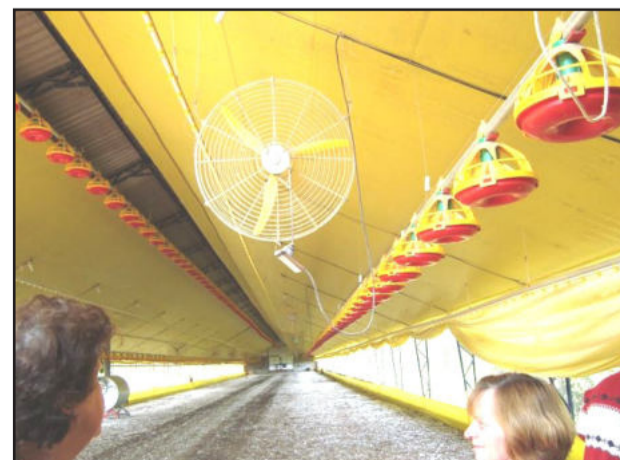
Novo aviário em Linha Ano Bom