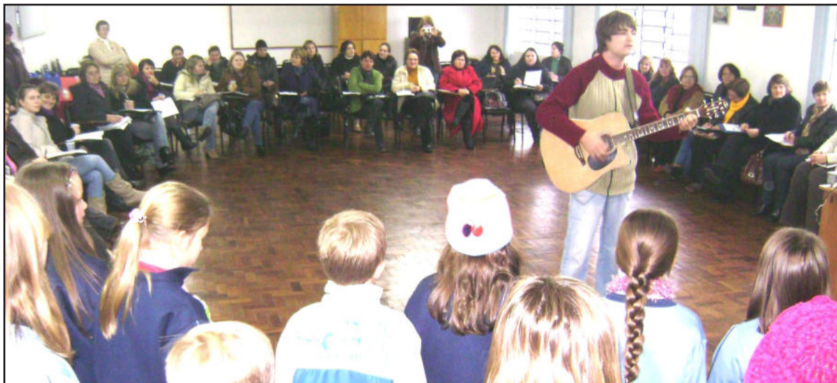
Encontro em Imigrante teve momento cultural

pelo grande número de participantes, os quais foram recebidos com um momento cultural: Coral Municipal Infanto-Juvenil, dramatização e contação de histórias, organizadas por alunos e professores da rede municipal de Imigrante.