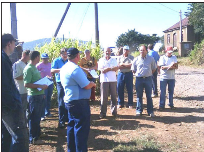
Novas propriedades em Linha Santo Antônio

O Conselho Municipal de Desenvolvimento Rural de Colinas - Comcol - convida aos conselheiros e lideranças das comunidades rurais e dos grupos de jovens e mulheres, para participarem da última etapa do Curso de Capacitação de Conselheiros e Lideranças - Módulo IV - que será realizada no próximo dia 19 de agosto (quarta-feira). O curso será realizado na sede da Oase e terá início às 8h45min, estendendo-se até 16 horas. É muito importante a presença de todos pois na oportunidade serão debatidas as informações obtidas durante a "Leitura de Paisagem" e após será iniciado o planejamento das atividades. A confirmação da presença pode ser feita junto ao Escritório Municipal da Emater/RS-Ascar.