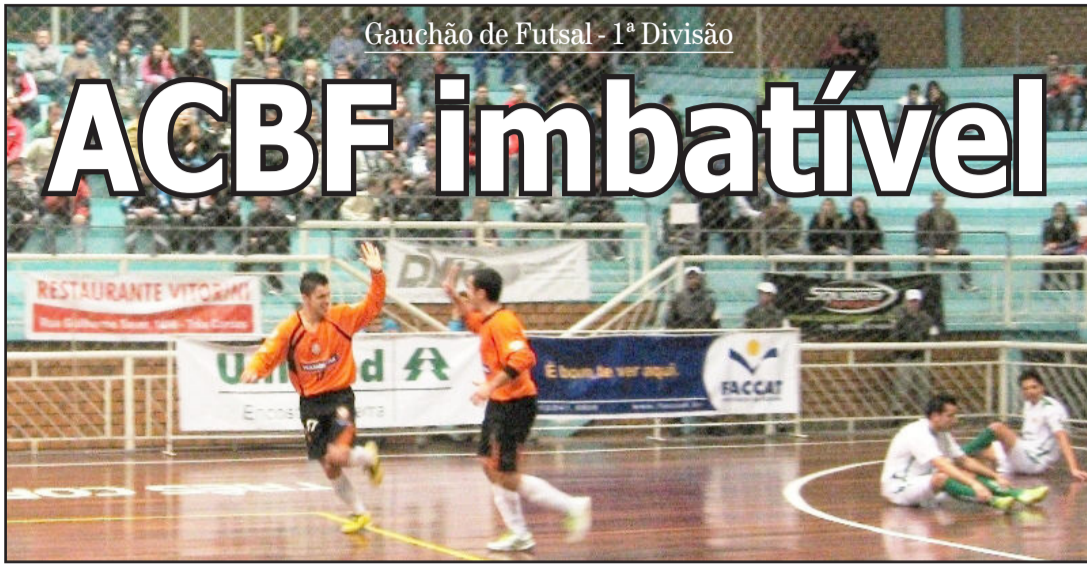
Gauchão de Futsal - 1ª Divisão