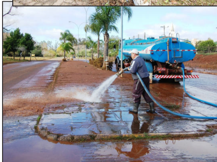
Limpeza no Parque dos Dick e nas ruas