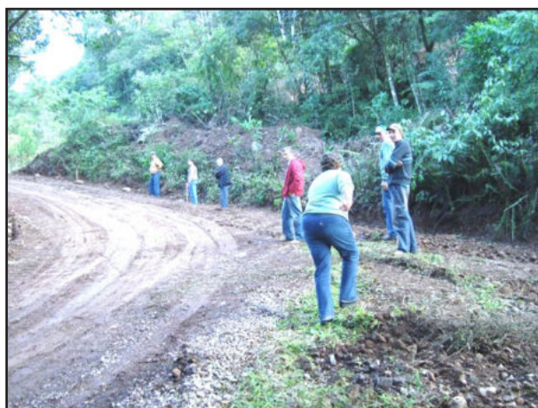
Estradas no meio rural