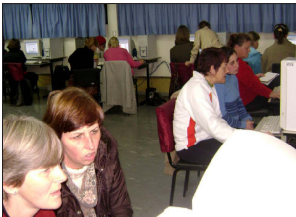
Capacitação em Informática para educador

É uma forma interessante de capitalizar a inserção de todos os professores na proposta de Informática Educativa do Município de Imigrante, que mantém todos os alunos, a partir dos 4 anos, em aulas semanais de Informática, desde o ano de 1996.