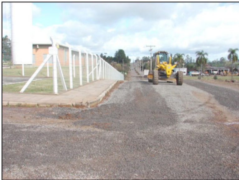
Brita na rua lateral da Beira Rio

Após o fim-de-semana de intensa chuva, a Secretaria de Obras realizou uma ação emergencial na tarde desta segunda-feira, dia 10, para amenizar a situação na Rua Osvaldo Dienstmann, no Bairro Canabarro, que dá acesso a Calçados Beira Rio. A colocação de brita melhora as condições da via neste período pós-chuva, pois o local é de intenso fluxo de veículos e de pedestres, trabalhadores da indústria. O secretário de Obras, Hércio von Mühlen, informa que este foi o início da etapa de melhorias em ruas não pavimentadas nos bairros do Município. “Vamos realizar os reparos conforme a disponibilidade de material, de acordo com o cronograma de atividades e as condições climáticas”, salientou. Além disso, as máquinas realizam a abertura de bueiros e o nivelamento de alguns trechos.