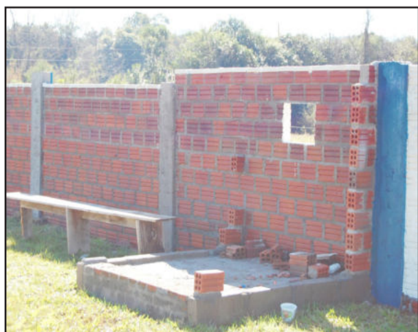
Local para cobrar ingressos