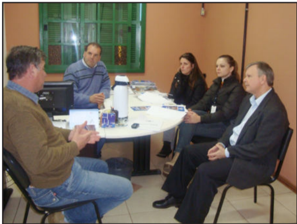
Encontro definiu detalhes do curso

Uma parceria entre administração municipal e o Sebrae vai oferecer cursos de capacitação a agricultores de Fazenda Vilanova. O treinamento tem objetivo de auxiliar o produtor rural na transformação de sua propriedade numa pequena agroindústria. As inscrições para a primeira turma, com 30 vagas, estão abertas na Secretaria Municipal da Agricultura, Indústria e Comércio e na Emater. Serão 13 encontros e as aulas têm início previsto para a primeira semana de setembro.