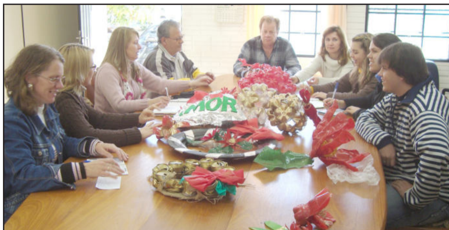
Reunião para preparar oficinas de enfeites natalinos

O Gabinete da Primeira-Dama, o departamento de Assistência Social (vinculado à Saúde) e a Secretaria de Cultura lançaram a campanha de coleta de garrafas tipo pet para a elaboração de enfeites natalinos com material reciclável. Estes enfeites natalinos serão confeccionados nas oficinas do Centro de Referência de Assistência Social (CRAS) para depois serem usadas na ornamentação natalina.