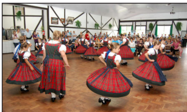
Grupo infantil fez bela apresentação