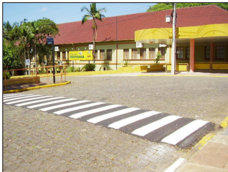
Faixa de segurança na Rua Pastor Hasenack defronte ao Colégio Teutônia

Outro local que recebeu a atenção da equipe de campo foi na Rua Pastor Hasenack, na esquina com a Rua Daltro Filho, próximo à Praça da Comunidade Paz. No local também foram implantadas faixas de segurança para garantir a travessia de pedestres. O grupo de trabalho também aproveitou o tempo bom da semana passada para reforçar a sinalização em outras ruas do Bairro Teutônia.