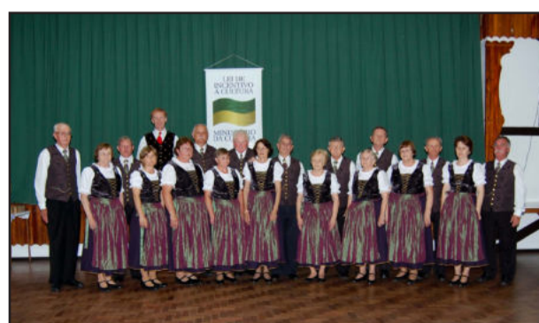
Grupo Sonnenlicht “Coroas” apresentou novo traje