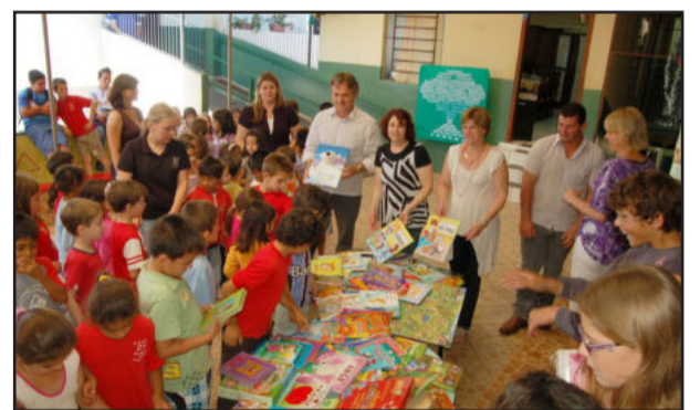
Entrega de novos livros para a Escola 24 de Maio