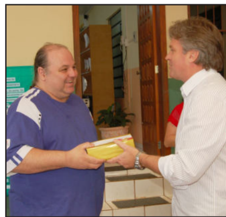
Entrega de presentes aos professores