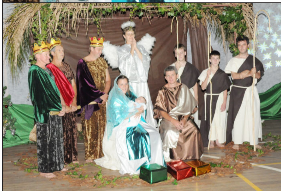
Belo espetáculo de Natal apresentado pela comunidade

A exemplo dos anos anteriores, ao final do evento, a presença indispensável do Papai Noel ocorreu para fazer a festa das crianças do Município. Neste ano, ele veio acompanhado. Na verdade, a comemoração foi em dose dupla. Para a felicidade dos baixinhos, dois Papai Noéis junto com sua Mamãe Noel distribuíram presentes. Uma forma de deixar a todos a mensagem de que Natal é sinônimo de amor, alegria e família.