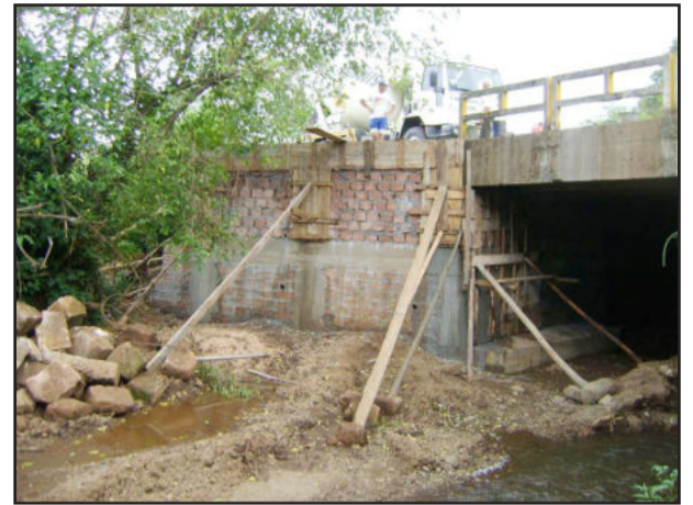
Estrutura da ponte do Arroio Schmidt estava bastante comprometida

Atuando em várias localidades do interior e nos bairros, a administração de Teutônia, através da Secretaria de Obras, Viação e Transportes, procura atender a todas as comunidades do Município, dentro das possibilidades, através da prestação de vários serviços. Nos últimos meses observou-se um grande aumento nos atendimentos prestados pela pasta aos munícipes, tamanha as necessidades em função das chuvas mais intensas dos últimos três meses, que danificaram estradas no interior e acessos às propriedades, além de estruturas de pontes.