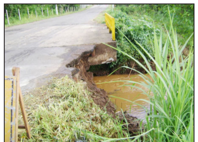
Chuvas intensas levaram parte da cabeceira da ponte

No local houve a implantação de muro de contenção, utilizando pedra de areia e concretagem de vigas e pilares para sustentar o leito da estrada e evitar a erosão com a ação da água. Esta é uma medida já adotada visando a obra de revitalização da Estrada da Várzea.