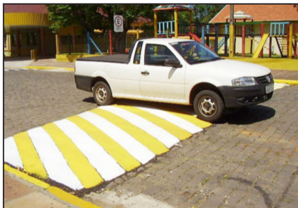
Melhorias no trânsito no Bairro Teutônia