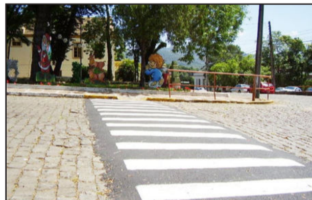
Faixa de segurança na Rua Pastor Hasenack defronte à praça