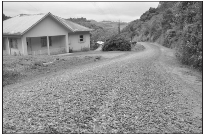
Melhoria das estradas avança no interior

Na Subprefeitura de Santo Antônio de Castro, as máquinas realizaram o patrolamento nas estradas gerais da comunidade de São Sebastião sentido Santo Antônio de Castro e acessos às propriedades. Já as máquinas da Subprefeitura de Arcoverde seguem o patrolamento nas estradas secun-