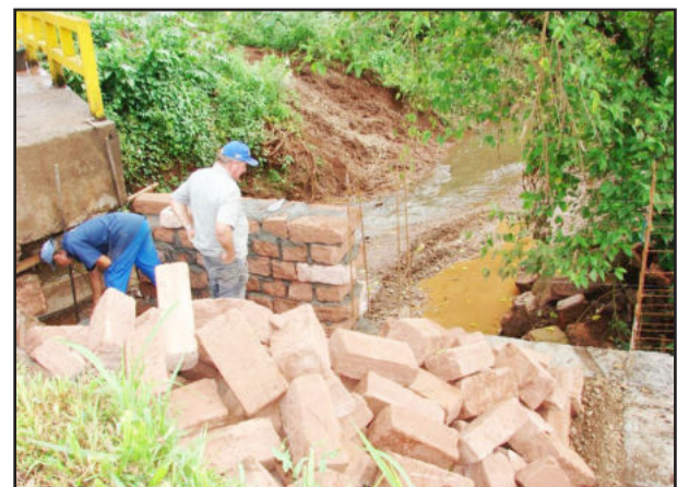
Dentre os materiais utilizados na reforma estão 500 pedras de areia