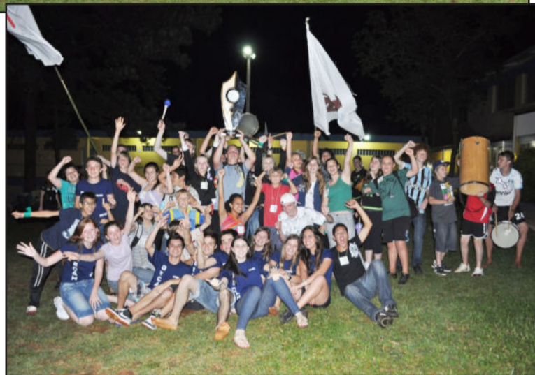
Três equipes participaram da gincana