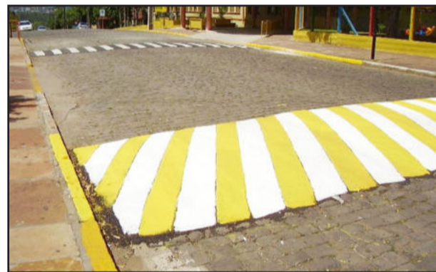
Quebra-mola (em destaque) e faixa de segurança na Rua Asido Dreyer defronte ao Colégio Teutônia