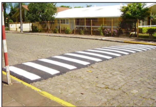
Faixa de segurança na Rua Ernesto Ahlert