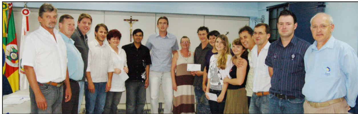
Vereadores prestaram homenagem aos alunos Nota 10 do Rotary Club

N a sessão de quinta-feira, dia 9, os vereadores de Teutônia realizaram uma homenagem aos Alunos Nota 10 escolhidos pelo Rotary Club de Teutônia. No intervalo da sessão, entregaram homenagens a todos. Antes disso, no espaço da tribuna, cinco vereadores falaram sobre a importância dessa premiação.