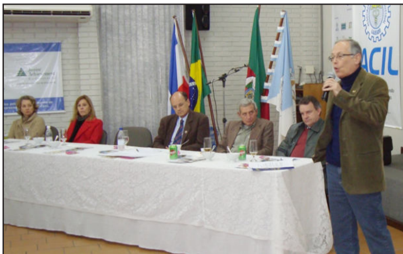
Lima destaque para o poder da tecnologia no setor da construção civil

O CREA-RS possui 42 inspetorias atuando no estado, além de cinco postos de atendimento e 17 representa-