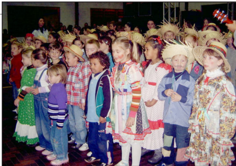
Turma da tarde cantou músicas tradicionais