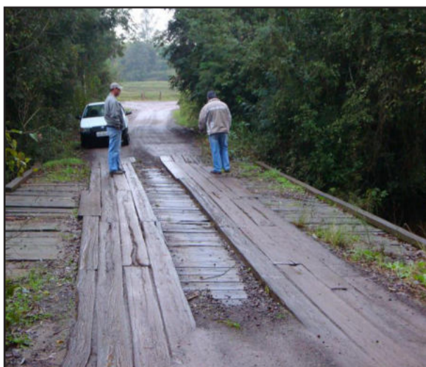
Ponte sobre o Arroio Estrela será demolida