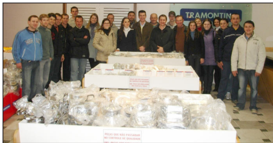
Grupo da Apeme na Tramontina Farroupilha

A unidade Farroupilha da Tramontina fabrica painéis, talheres e baixelas de aço inox com fundo triplo da Tramontina. As painéis, com duas camadas de aço inox intercaladas com uma de alumínio, permitem o cozimento mais uniforme dos alimentos, maior economia de gás e muito mais