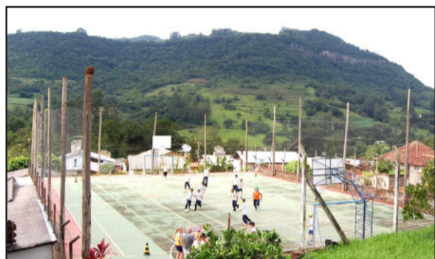
Quadra da escola receberá cobertura