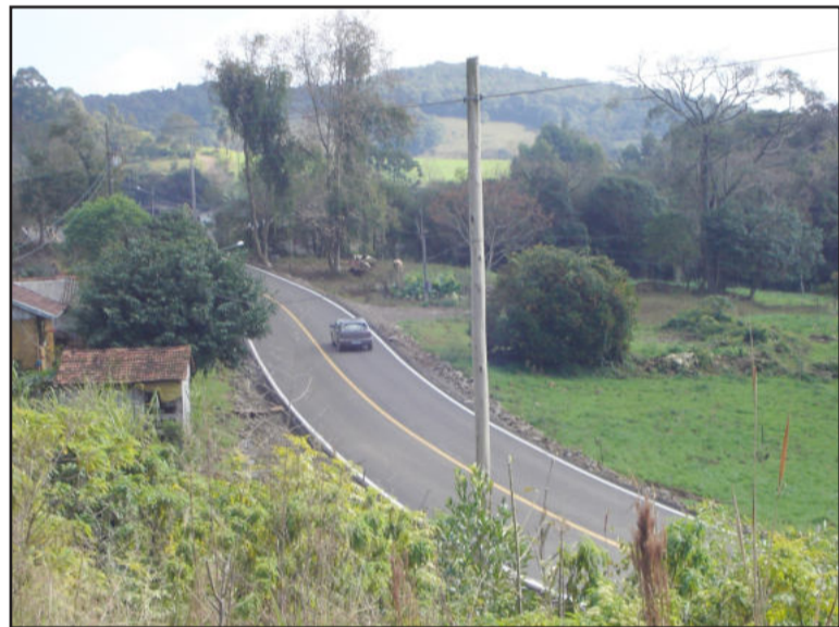
Estrada liga Berlim Fundos à Rota do Sol