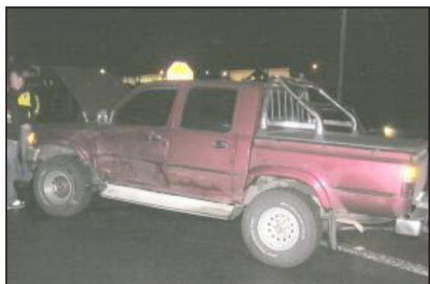
Caminhonete envolvida no acidente

Uma colisão na noite de sábado, dia 11, por volta de 18h, entre dois carros, provocou ferimentos leves em uma pessoa e deixou o trânsito parado nos dois sentidos da RSC 470, no trevo de acesso à cidade. O veículo Doblo Fiat, placas INW 4184 de Novo Hamburgo, subia a rodovia quando, ao passar pelo trevo, foi atingido pela camionete Toyota, placas MBK 2666 de Esteio.