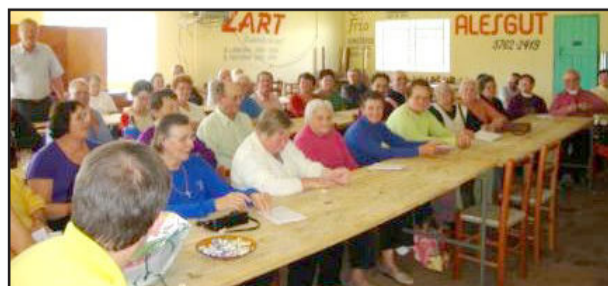
Educação Fiscal em Linha Clara