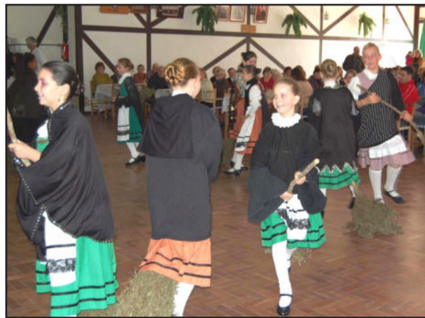
Grupo Sonnenlicht apresentou a "dança da vassoura"