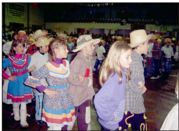
Apresentação de danças pelos alunos

A Valecross misturou vantagens especiais para você!