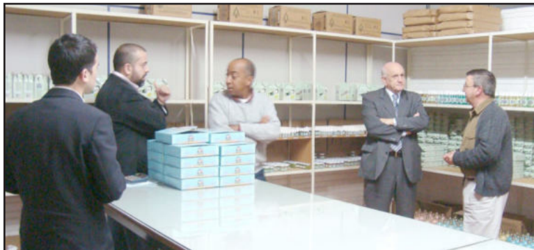
Em visita à Bella Luna Aromas