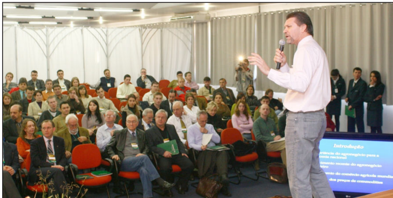
No ano passado, mais de 150 pessoas acompanharam o evento

Com o objetivo de destacar a vocação cooperativista do Estado e propiciar a troca de experiências no setor, a Unimed Vales do Taquari e Rio Pardo (Unimed VTRP) promove nesta quinta-feira, dia 16, em Lajeado, o 3º Fórum de Cooperativismo. Segundo dados da Organização das Cooperativas Brasileiras (OCB), no ano passado havia 7.682 cooperativas no país, sendo 894 delas no Rio Grande do Sul - o equivalente a 12%. Todas as gaúchas foram convidadas a participar do evento.