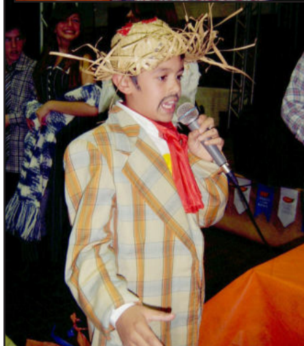
Destaque para os trovadores