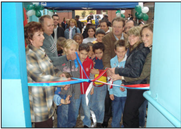
EMEF Santo André, inauguração da ampliação

Após o corte da fita, autoridades e comunidade puderam conferir as novas dependências e participar da Festa de Inverno, onde alunos, professores e comunidade participaram das atrações típicas de São João.