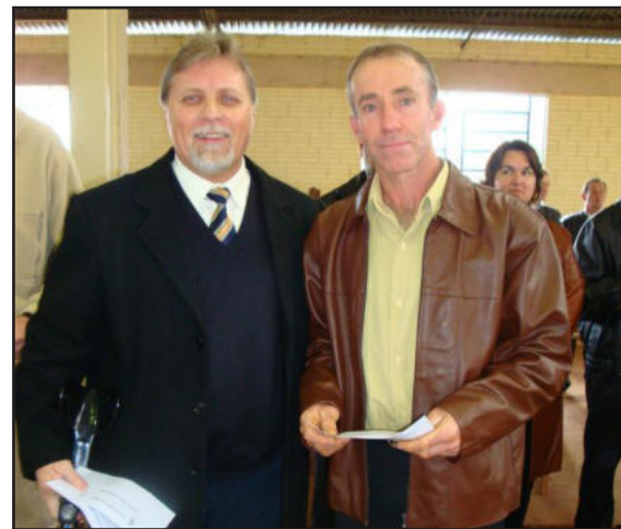
Entrega do auxílio ao presidente da Sociedade Esperança

Os 23 corais beneficiados são: Sociedade de Cantores Esperança; Cora de Sonharas de Beija-Flor; Coro de OASE de Linha Wolf; Coro Misto da Comunidade Evangélica de Estrela; Coral Santa Cecília de Linha Wink; Coral Amizade Caridade do Bairro das Indústrias; Sociedade de Cantores de Costão (homens); Sociedade de Cantores Boa União; Sociedade de Homens Concórdia de Linha Gerando; Sociedade Santa Cecília de Linha Lenz; Sociedade Santa Cecília de Linha São José; Sociedade de Cantores Auxiliadora; Sociedade Santa Cecília de São João do Bom Retiro; Sociedade Santa Cecília de Linha Delfina; Sociedade Santa Cecília da Comunidade Católica de Estrela; Sociedade de Cantores Santa Cecília de Glória; Sociedade Santa Cecília de Linha São Jacó; Sociedade de Cantores Liederkranz Linha Gerando; Sociedade de Cantores da Comunidade Católica de São Luiz; Coral da Oase da Comunidade Evangélica de Estrela; Coral Amigos do Canto e Coral Fiori Dei Piani.