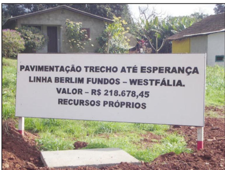
Obra executada com recursos próprios

que o Marasca entrou na administração de Westfália tivemos duas obras muito importantes: esse asfalto e a internet. O asfalto já tinha sido prometido e agora chegou. Para a população de Linha Berlim Fundos é muito bom”.