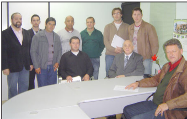
Em visita ao Executivo e Legislativo