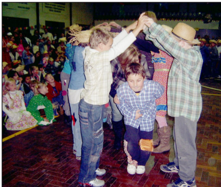
Quadrilha para festejar o "casório"