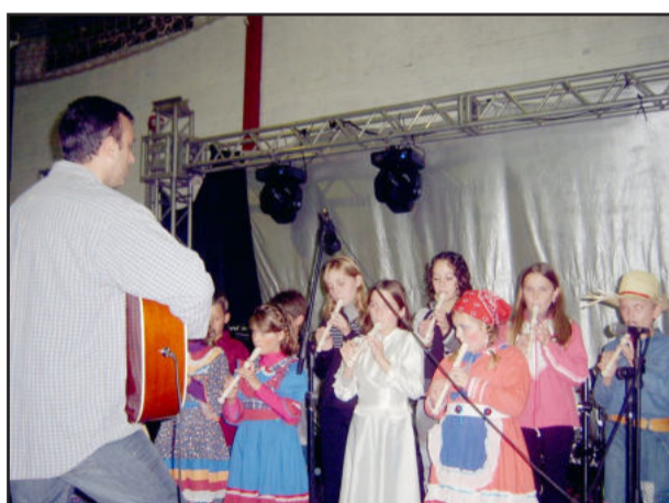
Apresentação do grupo de flautas