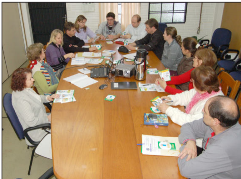
Equipe da Educação Fiscal reunida com professores

“A educação fiscal envolve o conhecimento sobre a natureza do Estado e dos serviços que ele presta. Envolve o conhecimento de como o Estado faz para obter recursos para custear estes serviços. A educação fiscal envolve a conscientização do cidadão sobre os seus direitos de cobrar