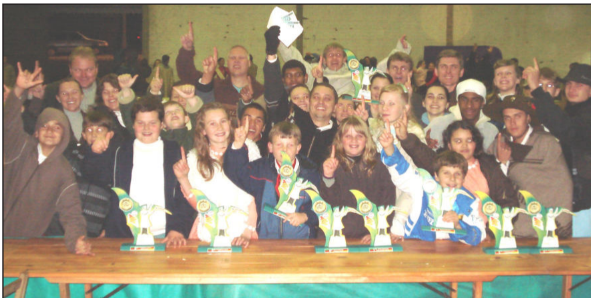
CTG Rincão das Coxilhas comemorando o título