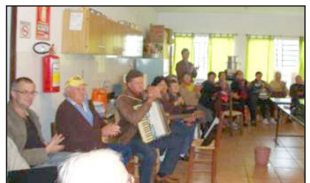
Educação Fiscal em São Jacó