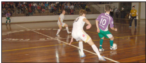
Bento Gonçalves mostrou qualidade e impôs dificuldades em Teutônia

A atuação de Martins gerou irritação no torcedor teuto-niense, que vaiou quando não marcava faltas claras e riu de lances normais assinalados como falta a favor de Teutônia. Na segunda etapa, a dupla de árbitros teve uma atuação bem melhor do que no primeiro tempo.