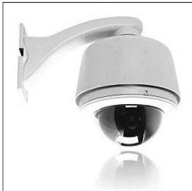
Câmeras de monitoramento oferecem informações precisas para garantir a segurança na cidade

A administração municipal de Carlos Barbosa e a Associação da Indústria, Comércio e Serviços (ACI) assinaram o contrato de comodato de quatro câmeras de monitoramento adquiridas pela ACI. Hoje estão instaladas 14 câmeras na cidade que farão o videomonitoramento de pontos estratégicos e estão em fase de ajustes. Os equipamentos têm alcance de 600 metros, com identificação precisa de até 150 metros. A abrangência é de 360 graus, podendo ser transferida do giro automático ao manual com o uso de um joystick, permitindo aproximação e foco no ponto preciso do fato.