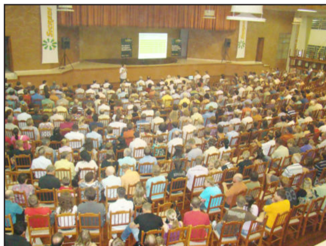
Grande número de associados participou da Pré-Assembleia