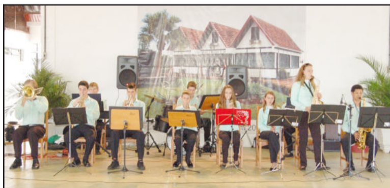
Conjunto instrumental 25 de Julho é formado por alunos das oficinas de música

O Centro Cultural 25 de Julho de Teutônia informa aos interessados em frequentarem as oficinas de música, língua alemã, pintura e capoeira que as matrículas devem ser feitas até no máximo no fim do mês de fevereiro, em horário de expediente, na sede do Centro Cultural, na Rua Major Bandeira, Bairro Languiru. Mais informações pelo telefone 3762-1033, com Gilmar.