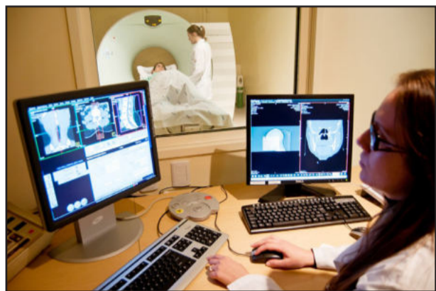
Tomografia computadorizada do HBB é referência na região

Os constantes investimentos na modernização e no aprimoramento das atividades desenvolvidas no Hospital Bruno Born (HBB), de Lajeado, visam o melhor acompanhamento aos seus pacientes. Do diagnóstico ao atendimento especializado, o HBB e sua crescente qualificação em tecnologias e profissionais, objetivam a projeção de um futuro repleto de saúde para toda a população da região e interior do Estado. Ao promover a saúde, oferecendo um atendimento que se estende durante todo o ciclo de vida de seus pacientes, o hospital reafirma suas diretrizes voltadas ao constante aprimoramento de seus recursos físicos, técnicos e humanos.