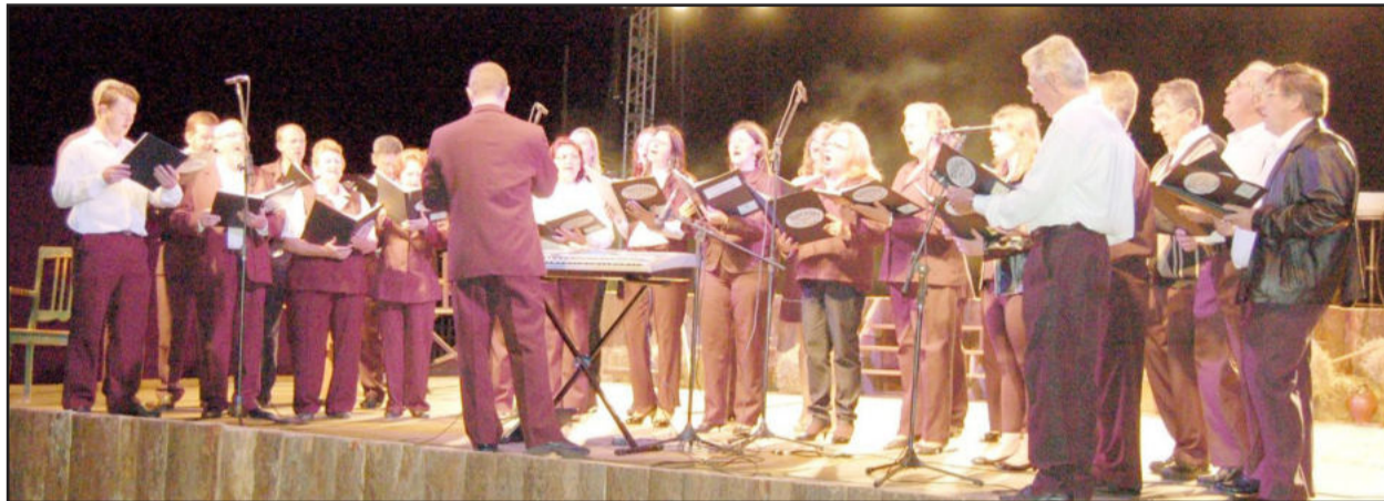
Coral Municipal realiza diversas apresentações ao longo do ano

Os ensaios do Coral Municipal de Teutônia reiniciam na próxima quarta-feira, dia 23 de fevereiro, às 19h30min, na sede do Sínodo Vale do Taquari, junto ao Centro Administrativo Municipal. Além dos cantores que já participam do Coral Municipal,