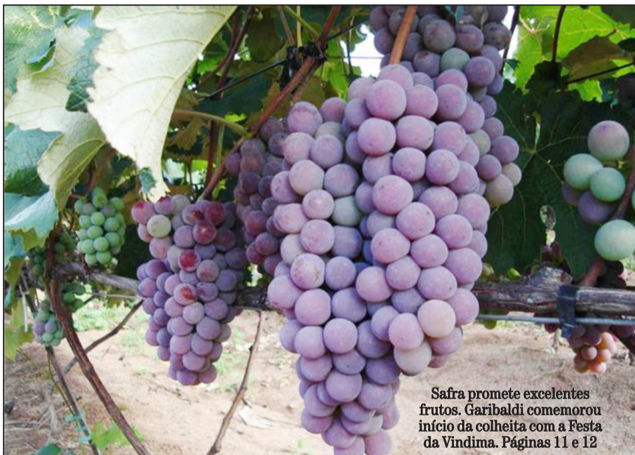
Safra promete excelentes frutos. Garibaldi comemorou início da colheita com a Festa da Vindima. Páginas 11 e 12