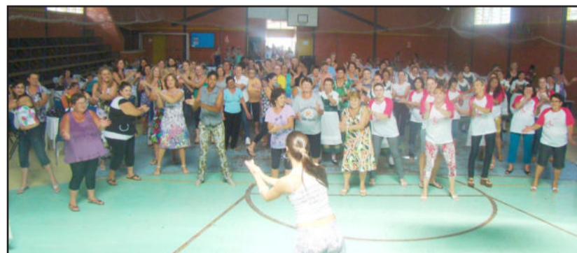
Em 2010, um significativo número de mulheres participou do Só Para Elas

Na quarta-feira, dia 9, a comissão organizadora do evento se reuniu para traçar o planejamento