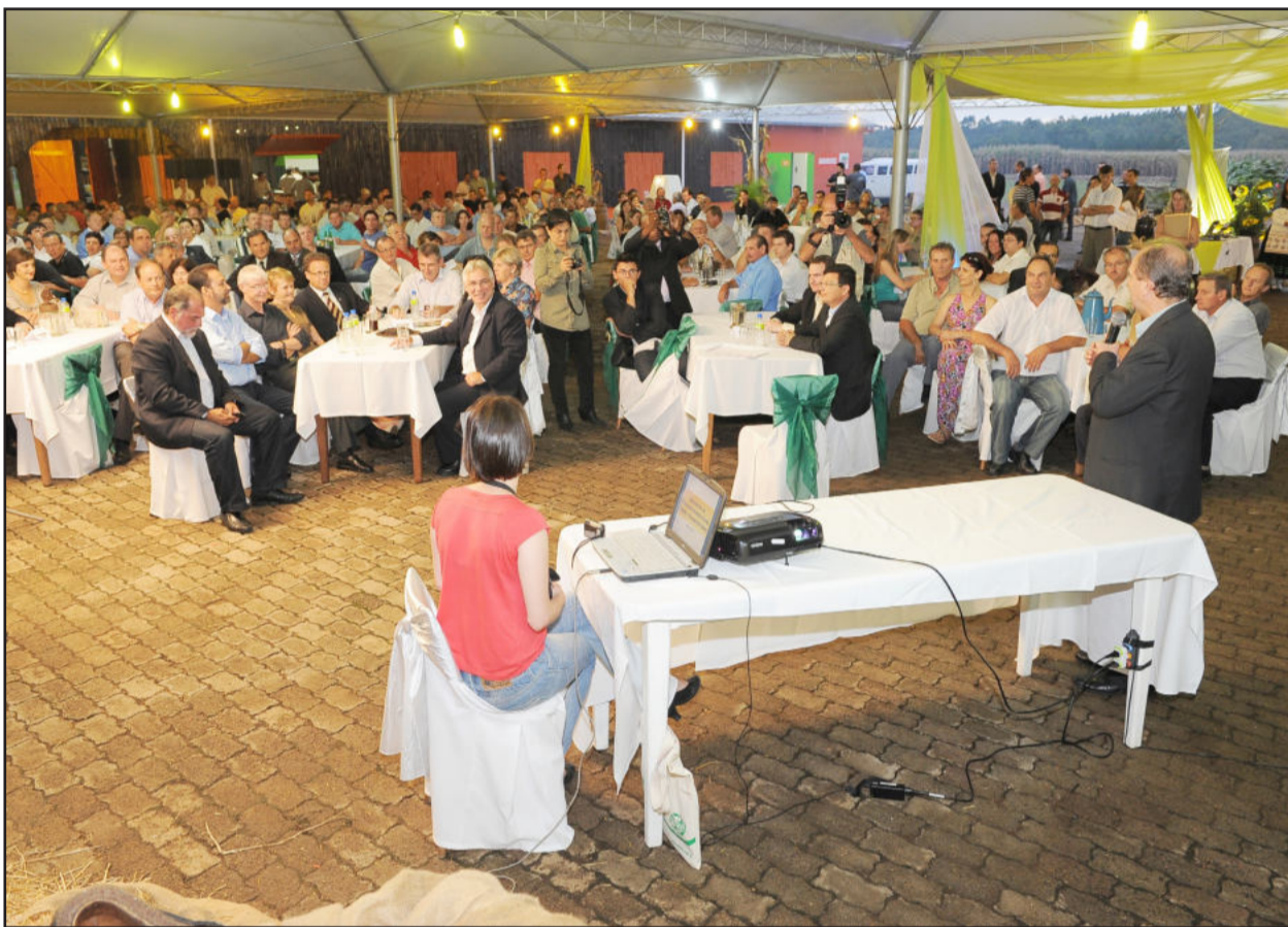
Lançamento da Expoagro Afubra contou com representantes de 100 municípios dos vales

Encontro reuniu autoridades e lideranças do setor agropecuário de cerca 100 municípios dos vales do Rio Pardo e Taquari