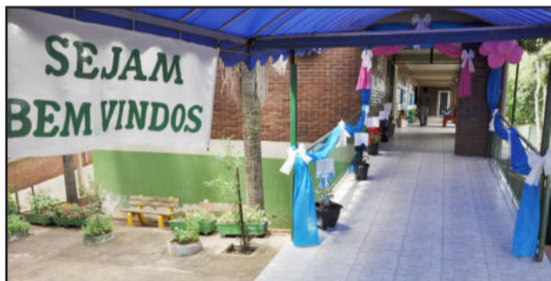
Faixa de Boas Vindas e decoração especial para os professores