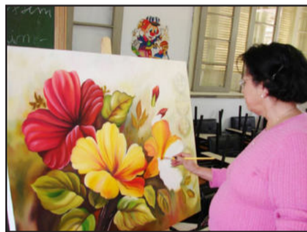
Flores são uma das fontes de inspiração pintadas em telas nas oficinas de pintura

O Centro Cultural 25 de Julho de Teutônia informa aos interessados em frequentarem as oficinas de música, língua alemã, pintura e capoeira que as matrículas devem ser feitas até no máximo no fim do mês de fevereiro, em horário de expediente, na sede do Centro Cultural, na Rua Major Bandeira, Bairro Languiru. Mais informações pelo telefone 3762-1033, com Gilmar.