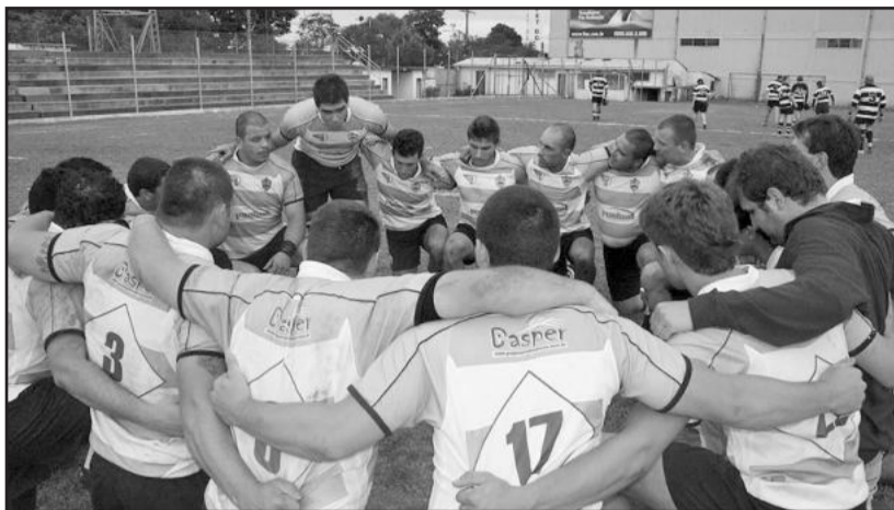
Farrapos, equipe de Rugby de Bento Gonçalves