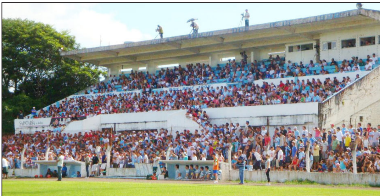
Estádio Florestal lotou, mas resultado do Lajeadense frustrou torcedores. Parte deles vaiou os atletas