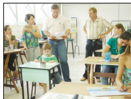
Oficina de Desenho Artístico conta com parceria entre Síticalte e Centro Cultural 25 de Julho