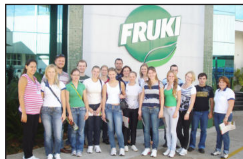
Visita técnica à empresa do ramo de bebidas com sede em Lajeado encerrou formação iniciada no mês de janeiro

No encerramento, o grupo participou de visita técnica à Fruki, de Lajeado, oportunidade em que puderam conhecer um pouco mais sobre a utilização de ferramentas da qualidade no processo de gestão da empresa do ramo de bebidas. Dividido em oito módulos, o curso ofereceu aos participantes noções fundamentais sobre gestão, cultura, mudança de paradigmas, ferramentas, planejamento, processos, rotinas e cases de sucesso.