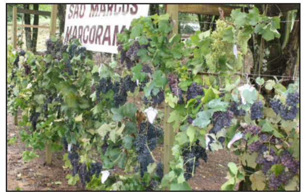
Exposição de uvas