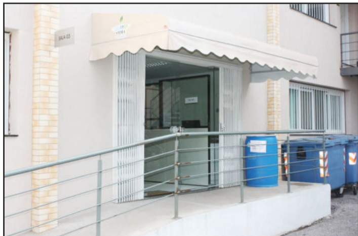
Sede da Secretaria de Meio Ambiente de Garibaldi

A Secretaria Municipal de Meio Ambiente de Garibaldi divulgou o balanço de algumas das atividades realizadas em 2010, e conforme levantamento da pasta, foram emitidas 607 licenças ambientais no ano passado, abrangendo Licenças Pré-vias, de Instalação, Operação, Licenças Únicas, Autorização para Manejo de Vegetação e Declarações de Isenção.