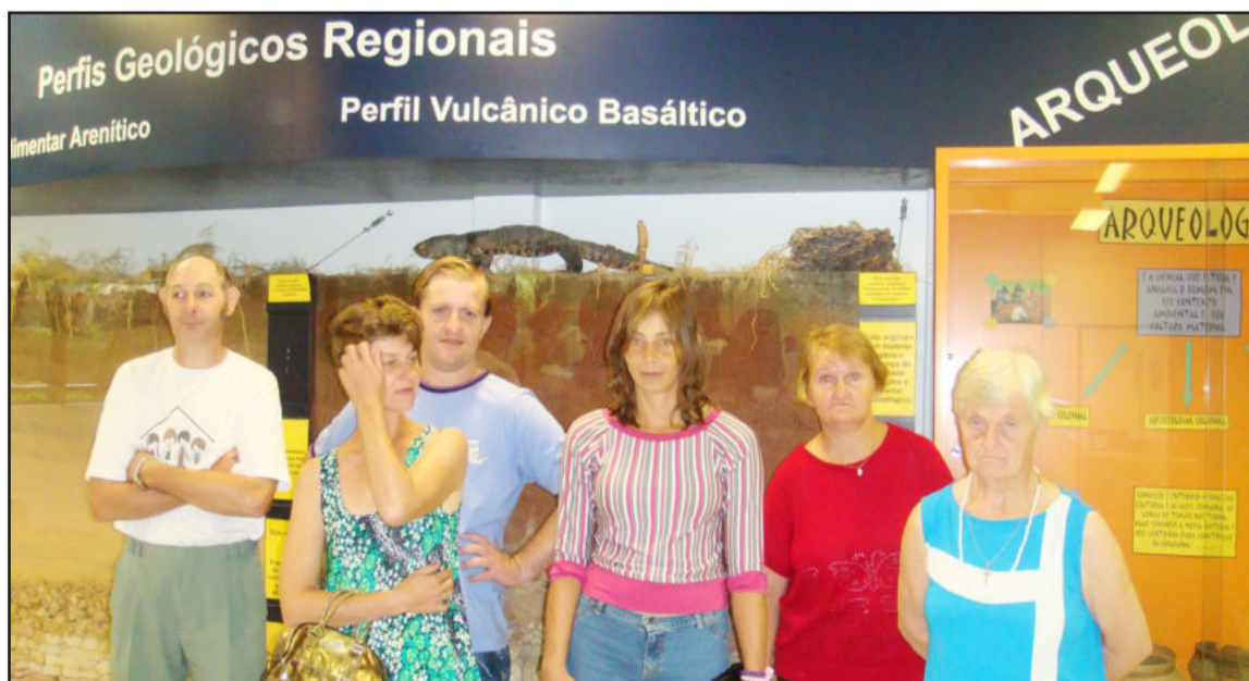
Grupo Renascer em visita a Univates

Vale ressaltar que o CRAS de Imigrante, mantém uma programação específica com Pessoas com Deficiência (PCDs), que formam o Grupo Renascer. Os acompanhamentos são constantes e os encontros habituais ocorrem em todas as quartas-feiras.