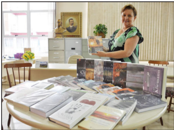
Mais de cem novos livros foram adquiridos pela Biblioteca Municipal