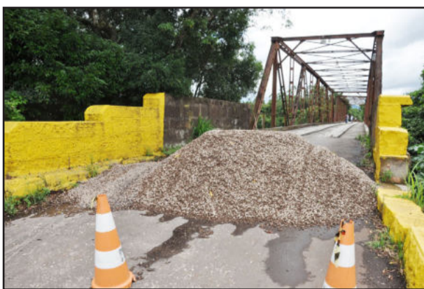
Ponte está interdita para o tráfego de quaisquer veículos