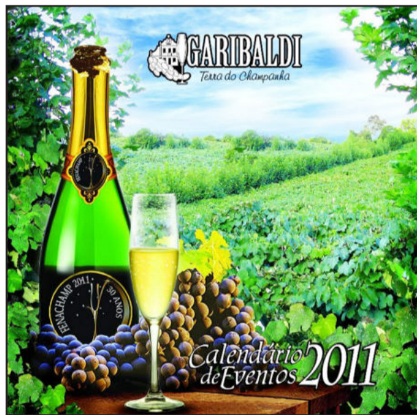
Capa do Calendário de Eventos 2011

Dentre os eventos previstos para esse ano, destaque para a Fenachamp, de 06 a 30 de outubro, que comemora os 30 anos da maior festa do município; o Carnaval de Rua, no dia 05 de março; o 2º Rodeio Crioulo Nacional, de 24 a 27 de março; o 25º Festival Colonial Italiano, dias 04 e 05 de junho; o Natal Borbulhante, a Festa dos Motoristas e a Virada Borbulhante, entre outras atrações. O Calendário de Eventos, em seu formato impresso, está sendo distribuído para entidades, órgãos públicos e comércio. Ele também pode ser retirado na Secretaria Municipal de Turismo. Além disso, está disponível online, no site da Prefeitura: www.garibaldi.rs.gov.br , na seção "Calendário de Eventos". Mais informações pelo telefone (54) 3462-8235.