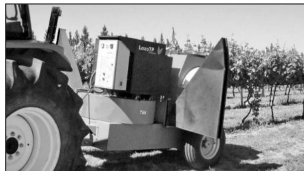
A tecnologia TPC (Thermal Pest Control), ou seja, controle térmico de doenças e pragas, por exemplo, é um processo de imunização

A tecnologia TPC surgiu de uma experiência doméstica. Em 1999, o agricultor chileno Florencio Lazo testava equipamentos capazes de inibir as geadas que prejudicavam a produtividade de suas lavouras no Chile. Entretanto, ao fa-