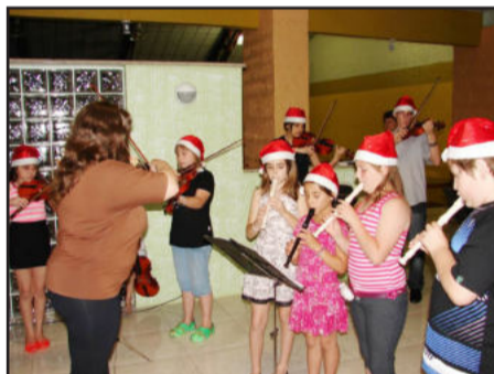
Alunos do Centro Cultural 25 de Julho fazem bonitas apresentações