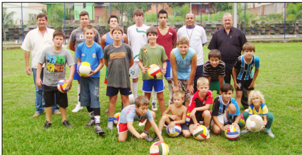
Prefeito e secretário prestigiaram reabertura dos trabalhos do Projeto Esporte é Vida