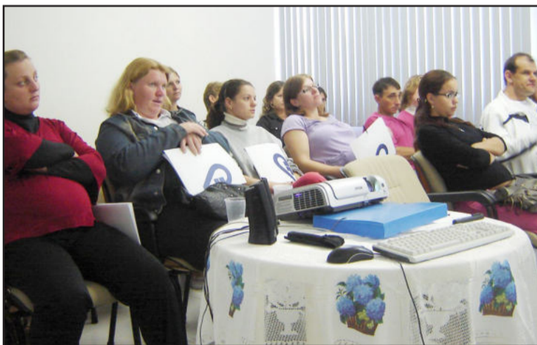
Curso gratuito oferece 20 vagas e também está aberto a participação dos futuros pais

Nos meses de março e abril, o Hospital Ouro Branco, de Teutônia, realiza mais uma edição do seu "Curso de Apoio e Orientação a Gestantes". O trabalho conta com o envolvimento de profissionais que atuam junto ao HOB, como psicóloga, dentista, nutricionista, enfermeira, fonoaudióloga e médicos (pediatra, anestesista e gineco-obstetras), além da coordenação do Serviço de Internações do hospital e de professor de Educação Física.