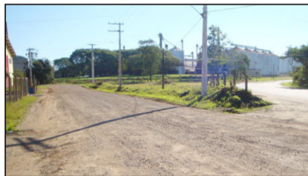
Local receberá pavimentação asfáltica

De acordo com o prefeito de Estrela, Celso Brönstrup, a obra terá investimento aproximado de R$ 167 mil, numa área de 1.997 m 2 . “Queremos proporcionar uma melhor mobilidade para os moradores e empresas que estão instaladas no local, ampliando e melhorando as vias de acesso ao bairro das Indústrias”, ressalta.