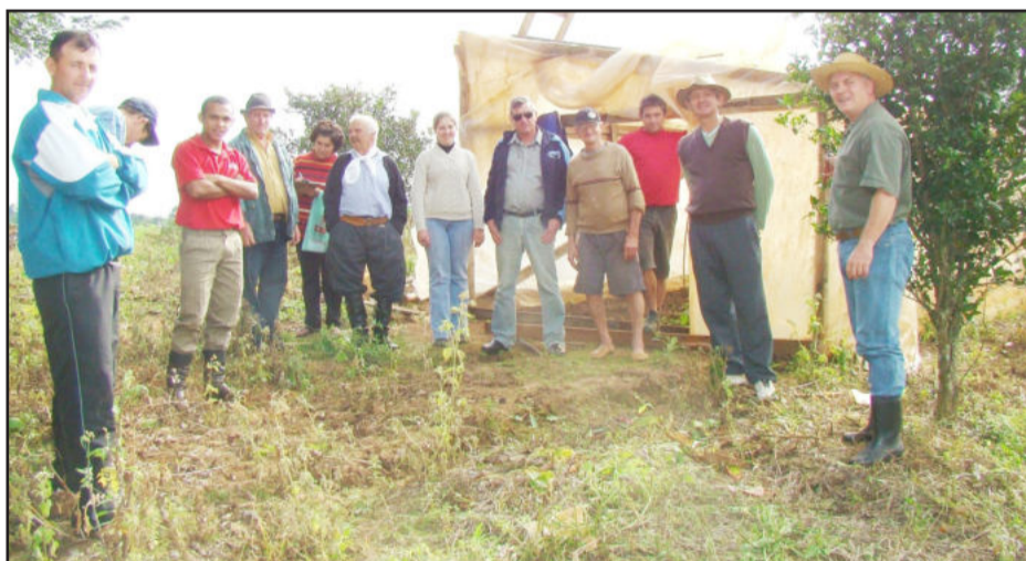
Palestra e troca de experiências sobre plantas frutíferas

A administração também promove a distribuição de mudas frutíferas aos agricultores, através de parceria com um viveiro e por meio de encomendas previamente realizadas na Secretaria. Na última semana, os plantadores que haviam efetuado pedidos, retiraram suas mudas para o plantio. Esta foi a primeira etapa de fornecimento de mudas frutíferas do ano.