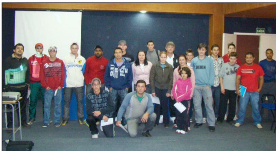
Representantes das equipes reuniram-se para definir detalhes da competição