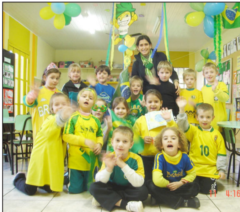
Torcida agora é pelo Brasil em 2014