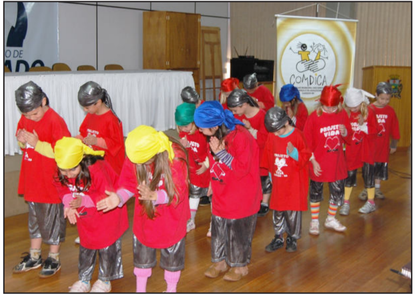
Alunos do Projeto Vida Campestre apresentaram dança de rua

O promotor Fachinetto falou aos conselheiros e representantes das entidades sociais sobre os avanços do ECA nesses 20 anos e desafios para a efetivação das políticas públicas de proteção integral à criança e ao adolescente. Ele questionou os presentes sobre como cada um vê o ECA; o que cada um pode identificar como ECA; o que o ECA emplacou e o que torna de diferente para a vida das pessoas; o que o ECA impõe. "Queremos reconhecer o que avançou e