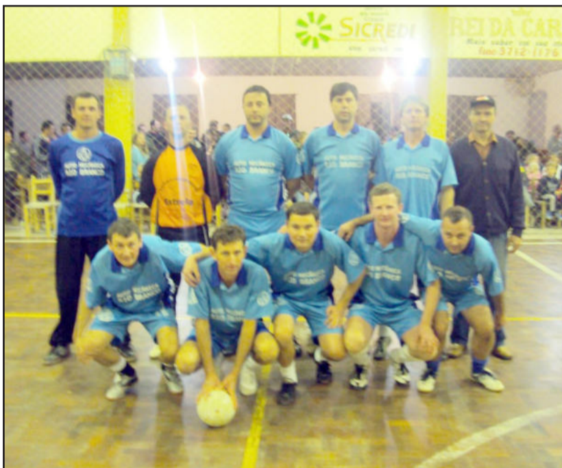
Equipe de Futsal da Lenz, categoria Máster

os resultados e os confrontos deste sábado, dia 17: