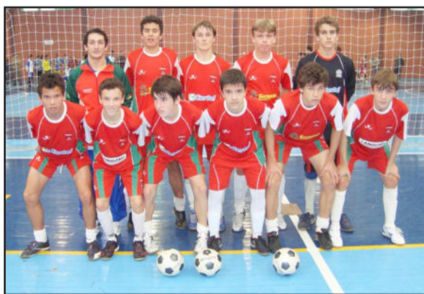
Juventus Verde 96 venceu por 6 a 4 e está na final da Ouro

Categoria 99 - A Juventus Branco não deu chances ao adversário e confirmou sua vaga na final da Série Prata com uma vitória de 6 a 3 sobre o Estre-