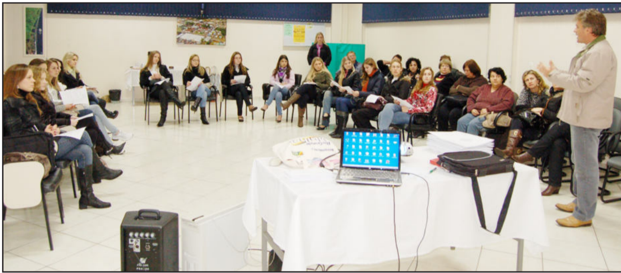
Prefeito Renato Altmann desejou boa sorte à todas

As 15 candidatas que concorrem aos títulos de soberanas de Teutônia foram reunidas pela administração municipal no fim da tarde desta segunda-feira, dia 12, no auditório da Câmara de Indústria, Comércio e Serviços (CIC), para dar início às atividades do concurso de escolha da Rainha de Teutônia. Estão previstos mais três encontros até a definição das novas soberanas, que serão conhecidas no dia 6 de agosto, em evento programado para a Associação Pró-Desenvolvimento de Languiru.