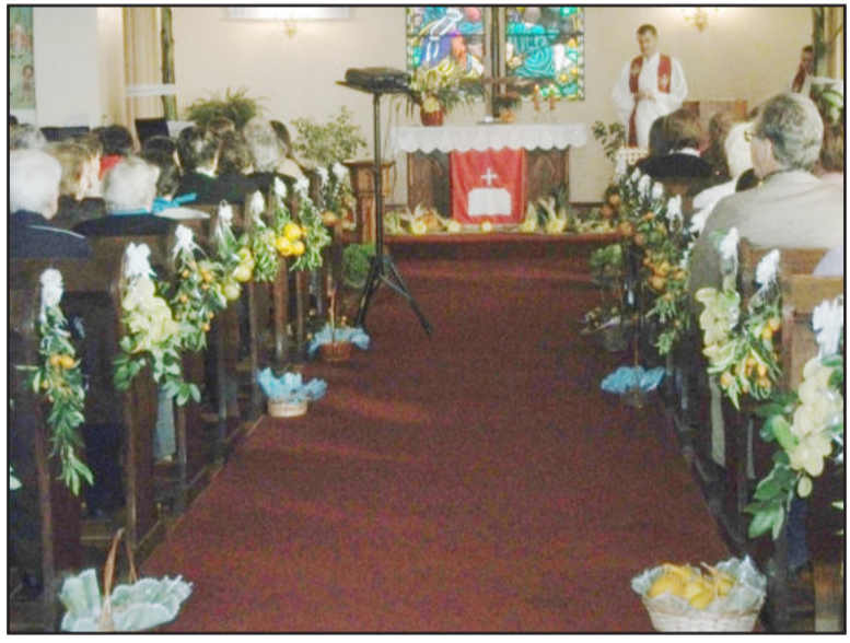
Culto na Comunidade Evangélica Redentor