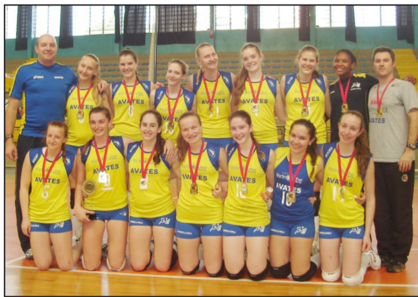
Equipe infanto campeã da Copa Rio Grande do Sul

A final reservava muitas emoções, principalmente para a equipe da Languiru/CML/Avates/PM Estrela, que se impôs frente ao adversário, dominou a partida nos três sets, venceu por 3x0