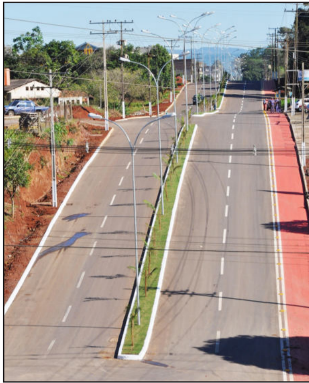
Primeiro trecho inaugura amanhã