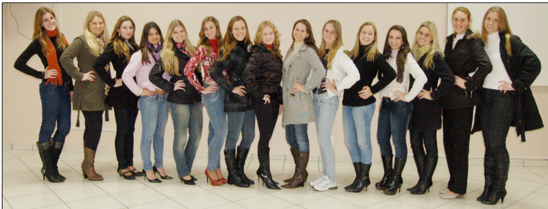
As 15 candidatas que concorrem à Rainha de Teutônia tiveram o primeiro encontro nesta semana para o início da série de três avaliações. Página 5