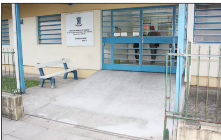
Rampa de acesso para cadeirantes