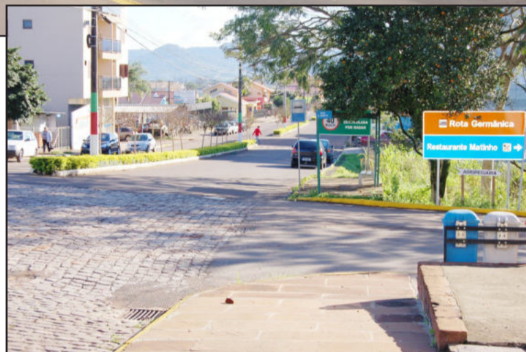
Placas indicam rotas de turismo