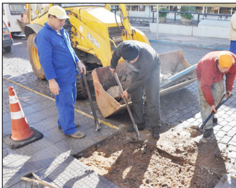
Obras no Centro para melhorar deslocamento