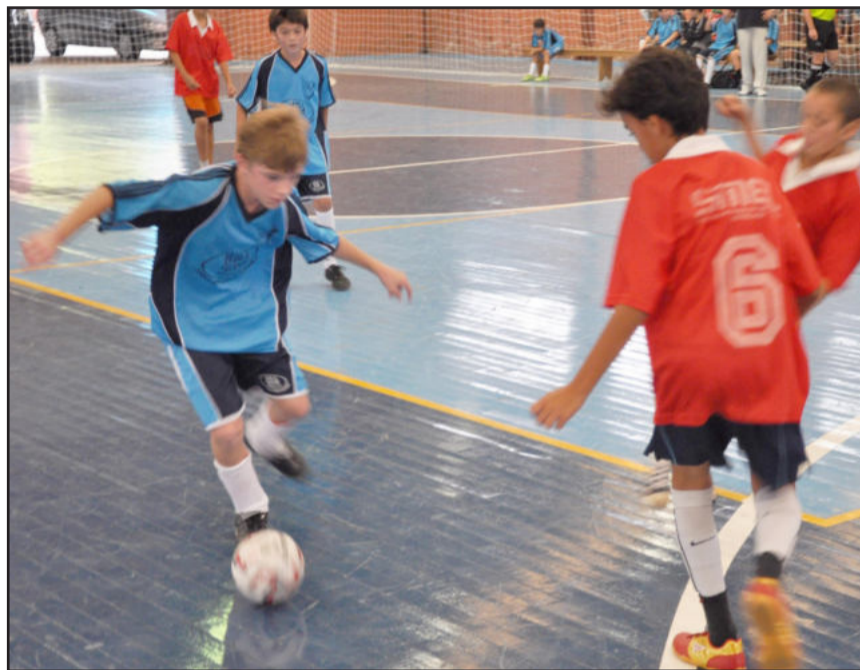
Juventus Verde 96 venceu por 6 a 4 e está na final da Ouro

Em 2010, a competição envolveu 3.000 atletas, oriundos das cidades de Lajeado, Estrela, Roca Sales, Santa Cruz do Sul, Venâncio Aires, Arroio do