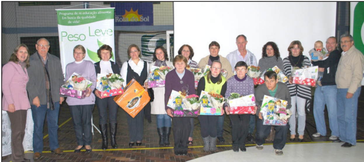
Participantes que eliminaram mais de dez quilos

A eliminação de 676 quilos de peso corporal em 20 semanas foi comemorada na noite desta segunda-feira, dia 12, por moradores de Salvador do Sul, Lajeado, Arroio do Meio e Teutônia, que participaram da 14ª edição do programa de re-educação alimentar Peso Leve, desenvolvido pela Cooperativa de Distribuição de Energia Teutônia (Certel Energia). Mesmo a noite fria não impediu que os grupos se deslocassem até a Associação Atlética Certel, em Teutônia, onde puderam demonstrar sua euforia pelos benefícios conquistados através de muita persistência.