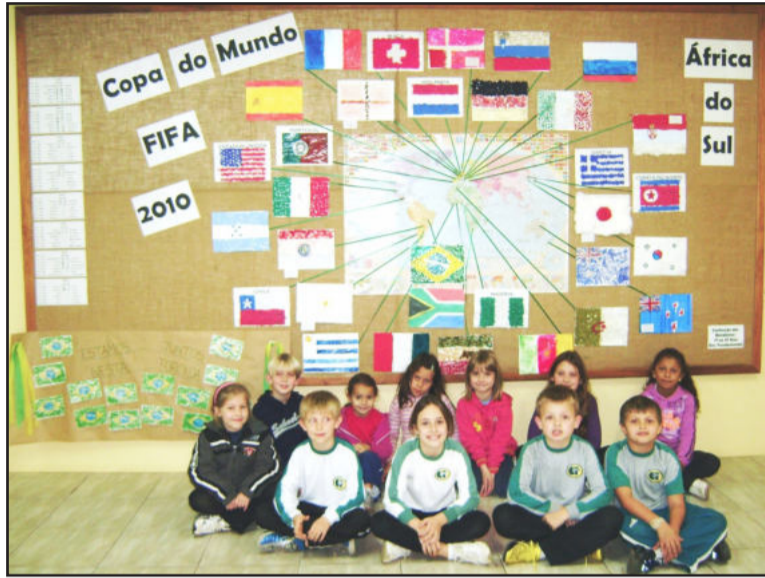
Jogos motivaram pesquisa sobre os países

As salas de aula e corredores foram decoradas pelas crianças com motivos especiais e, a cada partida do Brasil, a expectativa era grande. Quem circulou pela escola durante o período pode apreciar um lindo painel, confeccionado pelos alunos sobre os países participantes.