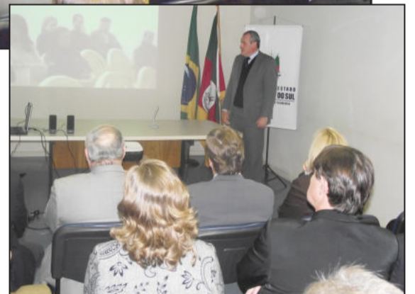
Projeto foi apresentado em Porto Alegre