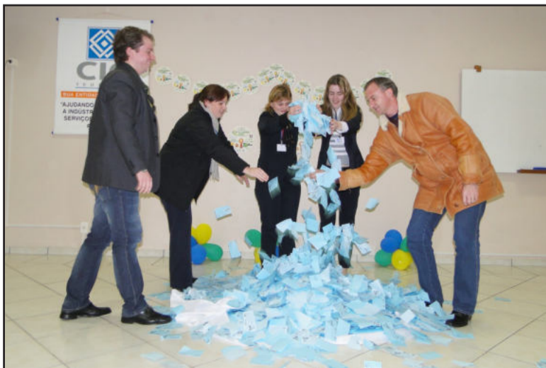
Sorteio foi nesta terça-feira

Se o desempenho do Brasil não agradou na Copa do Mundo 2010, pelo menos um teutoniense e um poço-antense têm motivos especiais para comemorar. Os dois foram contemplados no sorteio da Campanha Copa do Mundo 2010, promoção da vice-presidência do Comércio da Câmara de Indústria e Comércio (CIC) de Teutônia, que teve seu último sorteio realizado na tarde desta terça-feira, dia 13.