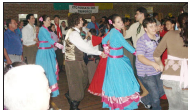
Fandango com grande público

O fandango realizado pelo CTG Pousada dos Tropeiros, de Fazenda Vilanova, no início deste mês, foi um sucesso. Desta vez, a festa foi para o encerramento do curso de danças de salão. O evento contou com a presença de diversas autoridades, entre elas o prefeito, secretários municipais e vereadores. As entidades com maior número de integrantes foram premiadas: primeiro lugar, a comunidade de Pinhal; segundo lugar, o CTG Raça Gaudéria; e em terceiro lugar a comunidade e futebol de veteranos de Santana.