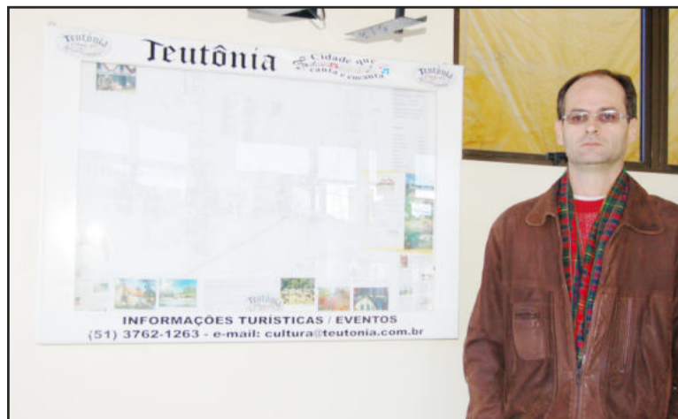
Clóvis: divulgar o bom nome de Teutônia