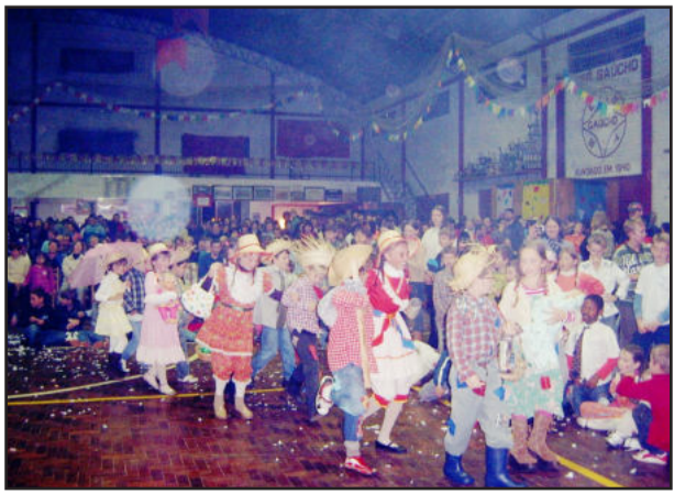
Desfile dos casais caipira