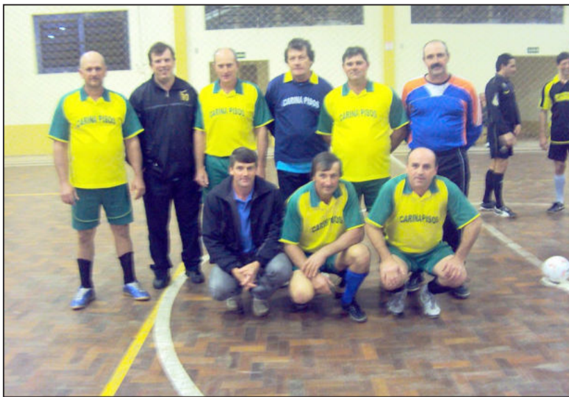
Equipe de Futsal da Geraldo na categoria Sênior

No sábado, dia 10, ocorreu os jogos do segundo turno das quartas-de-final da Bocha, que definiu os semifinalistas do campeonato. Confira