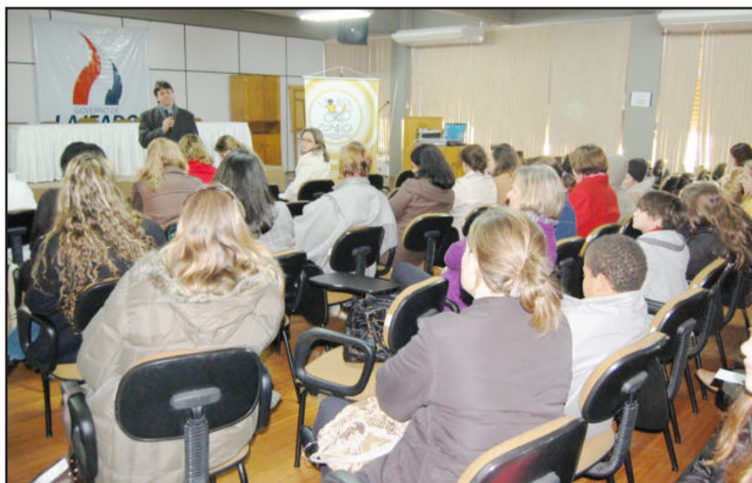
Promotor palestrou sobre o ECA

O Estatuto da Criança e do Adolescente (ECA) foi instituído pela Lei 8.069 no dia 13 de julho de 1990, regulamentando os direitos das crianças e dos adolescentes inspirado pelas diretrizes fornecidas pela Constituição Federal de 1988, internalizando uma série de normativas internacionais. O ECA existe para todas as crianças, adolescentes e jovens, mas principalmente para filhos de famílias pobres, que são os mais vulneráveis e mais precisam da ação do Estado e das leis.