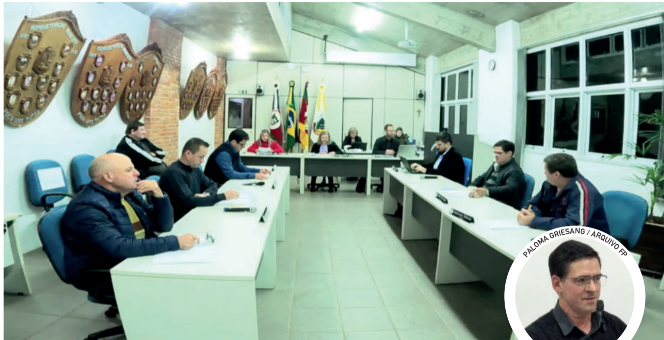
Vereadores se reuniram em sessão na segunda-feira (14/8)