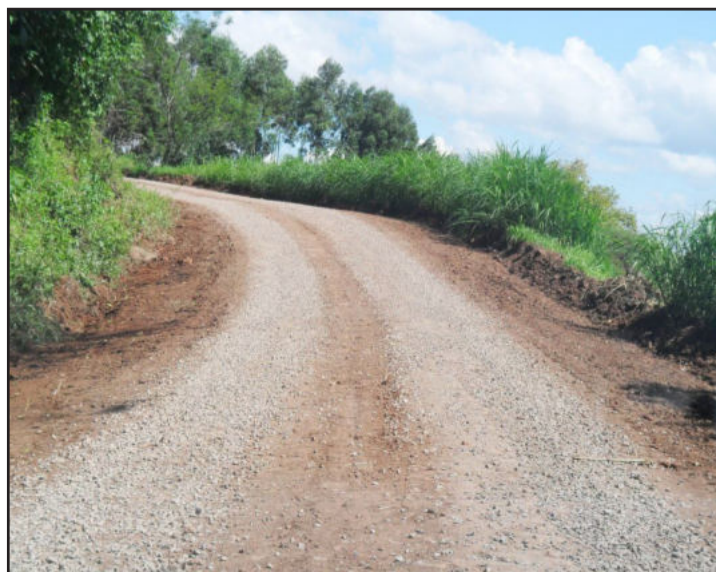
Recuperação de estradas