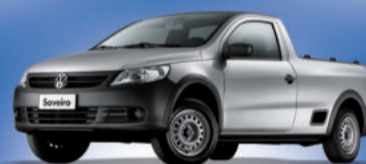
Nova Saveiro CS 1.6 VHT Totalflex, modelo 2012 A partir de 31.790,

Faça revisões em seu veículo regularmente.