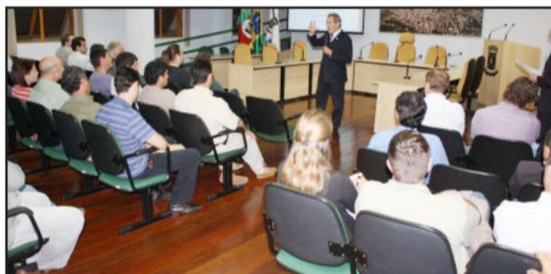
Em audiência pública, Garibaldi debateu alternativas para a bacia de captação da barragem

Após a apresentação da lei, a Prefeitura abriu espaço para questionamentos dos presentes. Diversas alterações na proposta de lei foram apresentadas e anotadas para serem incorporadas ao projeto. Agora, o próximo passo é ajustar os pontos que geraram dúvidas e apresentar as modificações às entidades. A ideia da Prefeitura é encaminhar o projeto para a Câmara Municipal de Vereadores assim que todas as alterações forem feitas e aprovadas pelos órgãos e grupos envolvidos.