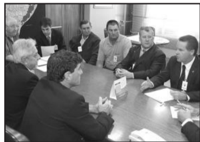
Prefeitos pedem asfaltamento da Transpolentona ao DAER