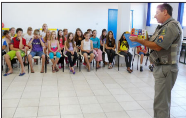
Operação volta às aulas

Inspetoria Veterinária - O Posto de Inspetoria Veterinária de Poço das Antas avisa a todos os proprietários de bovinos que os mesmos deverão fazer o cadastro de seus animais até o dia 29 de abril, no Posto veterinário de Poço das Antas. Quem não o fizer estará sujeito à multa.