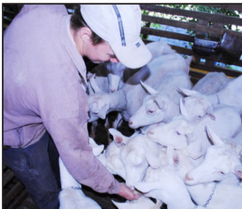
Imagem Jovem da terra, de Roberta Moraes Jungblut, ficou com a 2ª posição