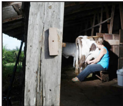
Foto Amnestia Lacto III, de Luiz Carlos Morn Konzen, recebeu o 1º lugar

Momento histórico na trajetória da empresa