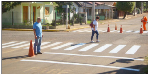
Faixas de segurança foram repintadas no bairro das Indústrias