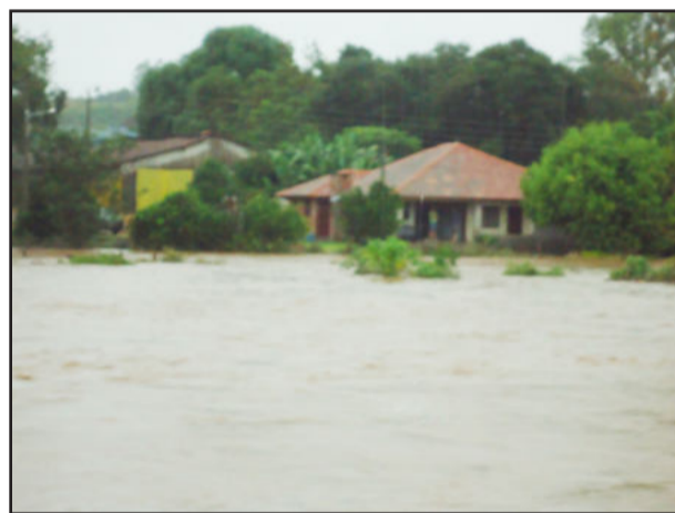
Água deixou residências isoladas