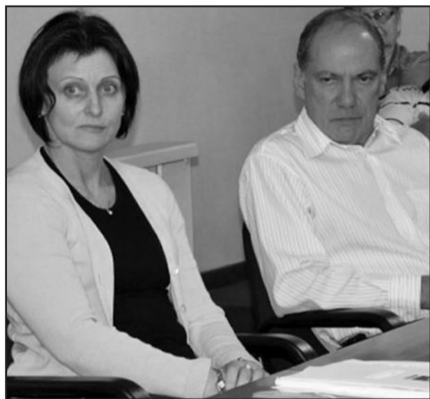
Nova diretoria da Apae apresentou-se ao Legislativo barbosense

O presidente da Apae falou da satisfação em retornar à Câmara, especialmente para falar de uma instituição tão querida no município e que este ano celebra 30 anos de existência. "A Apae está desenvolvendo um plano para a comemoração dos 30 anos. Seguramente vamos contar com a colaboração e apoio dos vereadores de Carlos Barbosa, queremos comemorar junto com a comunidade essa data tão importante", disse.