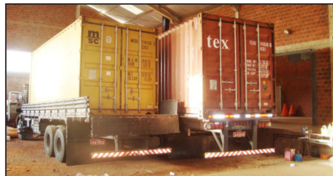
Momento histórico na trajetória da empresa