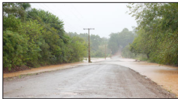
Estrada de Linha Ribeiro teve trânsito interrompido por causa da enchente do Arroio Posses