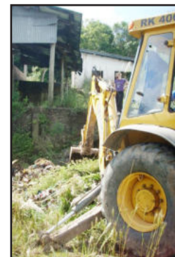
Estrutura está desativada desde 2002