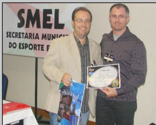
Zappaz (d) apresentou o Findel, muito elogiado pelos participantes do Mercocidades