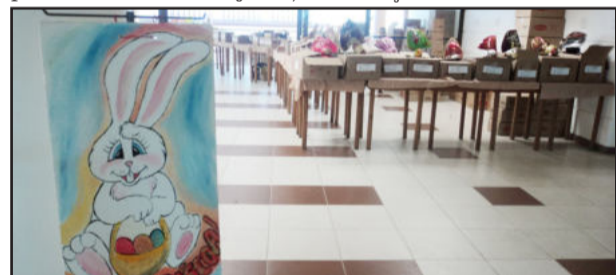
Diversidade de produtos na Feira de Páscoa

Numa iniciativa da Associação dos Funcionários do Hospital Bruno Born de Lajeado, a instituição realiza até o dia 20