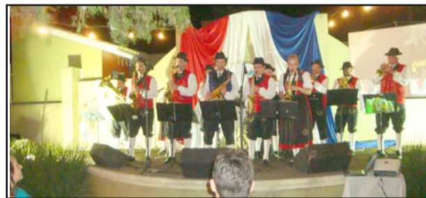
Banda de Estrela