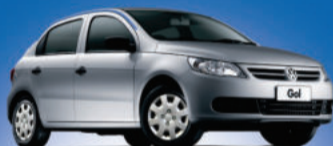
Novo Gol 1.0 VHT Totalflex, 2 portas, modelo 2012 Preço Nota Fiscal de Fábrica