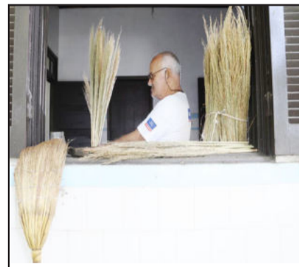
Palha mole, sujeira fina II, imagem de Luiz Carlos Morn Konzen, conquistou a Menção Honrosa