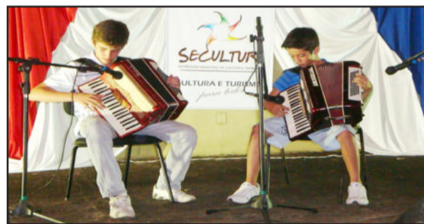
Alunos do Núcleo de Cultura apresentaram dueto de gaitas