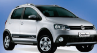
Novo CrossFox 1.6 VHT Totalflex, modelo 2012 (Completo) A partir de 49.990,