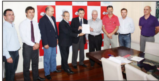
Prefeitura, Corsan e Tramontina celebram revitalização do Passeio da Barragem

O projeto contempla uma reforma completa no passeio. Os bancos e pontes serão trocados, assim como a pinguela. Também serão instaladas novas lixeiras e cada espécie de árvore estará identificada com uma placa. No parte final do passeio, também será construído um parque infantil.