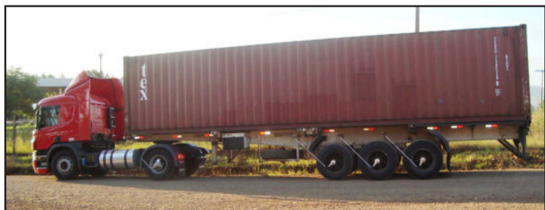
Caminhão levando a primeira carga