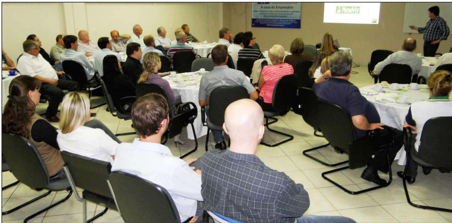
Café da manhã qualificando a gestão contou com a participação de cerca de 50 pessoas

Diretor comercial e presidente da empresa no Brasil palestram em café da manhã empresarial na CIC Teutônia