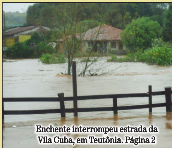
Enchente interrompeu estrada da Vila Cuba, em Teutônia. Página 2