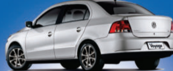
Novo Voyage 1.0 VHT Totalflex, modelo 2012 29.990, ou entrada + parcelas de 449,00,