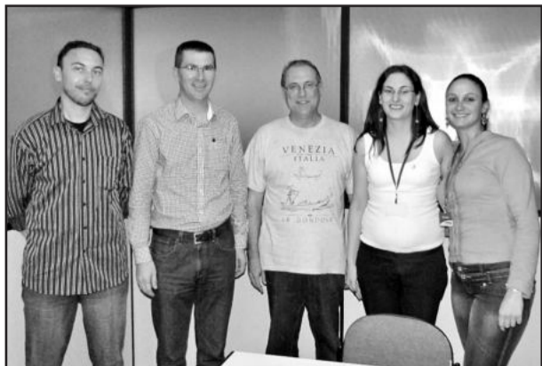
APEME dá continuidade ao Projeto Inovando para Crescer

As visitas são realizadas quinzenalmente pelo presidente da entidade, cada vez para um setor diferente. A próxima agenda de visitas será dia 27 de abril, desta vez para os profissionais liberais. Já no dia 03 de maio será realizado o primeiro Café da Manhã de integração dos novos associados que ingressaram na entidade em 2011. Mais informações podem ser obtidas na Apeme, pelo fone (54) 3462-2755 ou pelo site www.apeme.com.br .