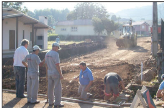
Obras de pavimentação estão em andamento em Westfália