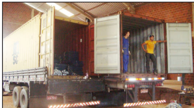
Empresa tem sede e indústria em Teutônia