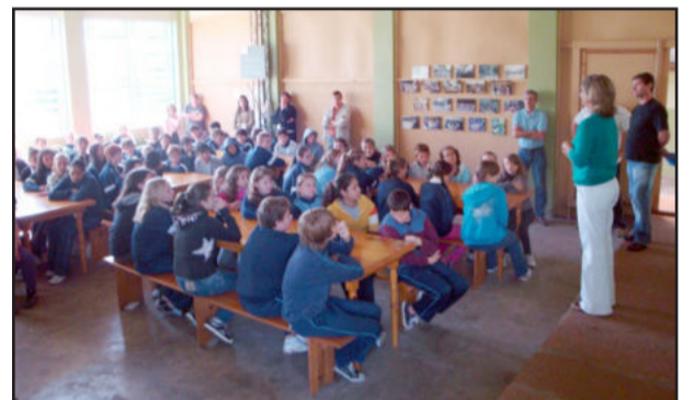
Alunos escutam orientações sobre o uso do transporte escolar