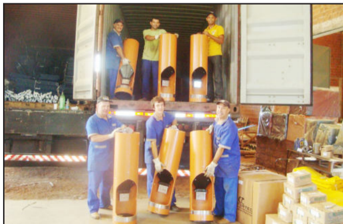
O carregamento da mercadoria aconteceu na empresa