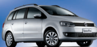
Nova SpaceFox 1.6 VHT Totalflex, modelo 2011 (Completa) A partir de 49.990, IPVA Grátis ou ent. + parcela de 629,00,