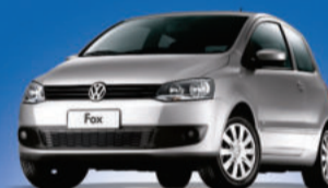
Novo Fox 1.0 VHT Totalflex, modelo 2012 (Dir. Hidráulica) A partir de 30.690,