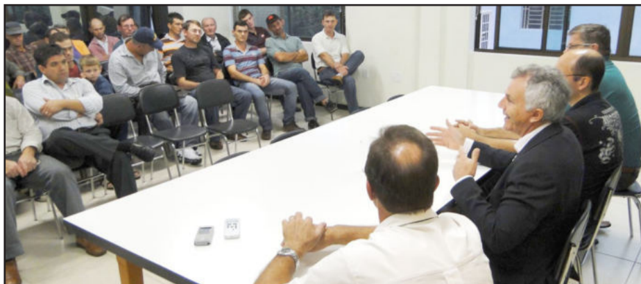
Produtores de Estrela se mobilizaram em reunião na Câmara de Vereadores

M ais de 1,5 mil agricultores do Vale do Taquari participarão de um protesto em frente à fábrica de cortes da Doux-Frangosul, em Montenegro. Será nesta terça-feira, dia 19 de abril, às 9 horas, o movimento que reivindica o pagamento imediato dos atrasados está sendo organizado pela Federação dos Trabalhadores na Agricultura do Rio Grande do Sul (Fetag-RS).