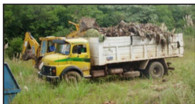
Mais de 13 toneladas foram removidas do antigo aterro sanitário de Garibaldi

Neste ano, a Secretaria prevê o plantio e replantio de árvores nativas no local, dando sequência ao contínuo monitoramento para a recuperação ambiental da área.