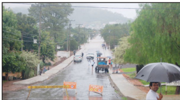
Várzea teve trânsito trancado por algumas horas na tarde de quinta-feira, por causa das águas do Arroio Harmonia