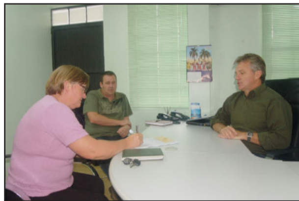
Administração repassou recursos ao STR pela semente Troca-Troca