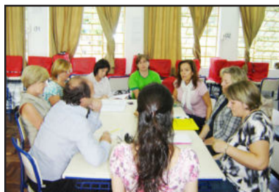
Encontro debateu melhores condições para a Educação

A reunião foi relevante, pois foram retomados assuntos pendentes, reafirmando-se o compromisso do Estado e Município na busca de condições adequadas para elevar os índices de aprendizagem dos educandos do Município.