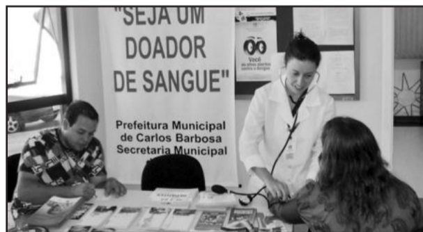
Dia da Saúde e de Combate ao Câncer enfocaram prevenção

Os usuários foram acolhidos pelo grupo, que realizava o cálculo do Índice de Massa Corporal (IMC), explicava como fazer o autoexame de mama, esclarecia dúvidas sobre a doença e como ter uma vida mais saudável. Neste dia também foram feitos encaminhamentos para exames de coleta de citopatológico.