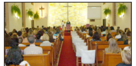
Mais de uma centena de pessoas participaram da celebração

Como o pensamento: “Celebrar a Vida é somar amigos, experiências e conquistas, atribuindo-lhes sempre algum significado”, o grupo refletiu sobre o verdadeiro significado da data.