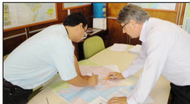
Marasca solicitou apoio do Daer para acesso do frigorífico