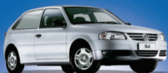
Gol G4 1.0 Totalflex, modelo 2012 A partir de