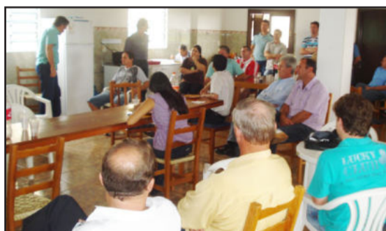
Reunião com empresários do Núcleo da Capitão Schneider em Canabarro definiu mudanças e melhorias (2)