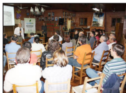
Saneamento de Garibaldi foi pauta de audiência pública realizada nesta semana

década. Em breve, deverá ser realizada nova audiência, a fim de dar continuidade à apresentação do planejamento e também para discutir o futuro do saneamento e da questão de captação de água na Terra do Champanha nos próximos anos.