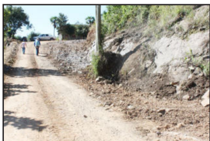
Antiga reivindicação da Linha Camargo foi atendida pela Administração Municipal

A Prefeitura de Garibaldi, através da Secretaria Municipal de Obras, Transporte e Trânsito, concluiu a obra de alargamento de um trecho da estrada na comunidade de Linha Camargo. Os trabalhos consistem na detonação de rochas em uma curva muito fechada. As melhorias vão facilitar o trânsito de caminhões e veículos pesados no local. A comunidade de Linha Camargo já havia solicitado a obra há muito tempo, estando inclusive na lista de demandas do Orçamento Participativo.