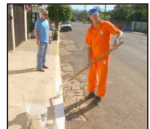
Pintura dos cordões das calçadas de passeio no Bairro Boa União

Esta semana, por exemplo, uma equipe está repintando os cordões das calçadas de passeio das ruas do bairro Boa União. Heiermann esteve na rua João Lino Braun, acompanhando o andamento dos trabalhos. “Nos próximos dias, vamos repintar os cordões das vias públicas do Centro também”, disse.