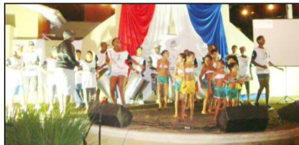
Escola de Samba Renascer do Samba