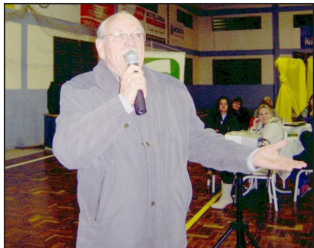
Hoerlle: é preciso persistir