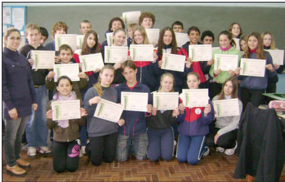
Alunos da oitava série A com a orientadora do projeto Empreender

Encerrou na semana passada o projeto Empreender é Conquistar, ministrado por orientadores treinados pela Júnior Achievement e pelo Sesi, na Escola Municipal Leopoldo Klepker. Participaram 49 alunos das turmas de oitava série. O projeto abordou diversos temas referentes à vida da pessoa, como valores, confiança, auto-