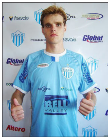
Karoki volta a NH hoje