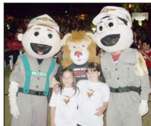
Proerd atua com crianças

O Programa Educacional de Resistência às Drogas (Proerd), desenvolvido pela Brigada Militar, tem se mostrado cada vez mais presente no dia-a-dia da comunidade. Nesta terça-feira, dia 14, os instrutores Proerd do Vale do Taquari reuniram-se na Câmara de Vereadores de Teutônia para analisar seus desempenhos no primeiro semestre deste ano e definir ações para aperfeiçoá-los no segundo semestre. Além disso, toda a equipe trocou experiências e assistiu a vídeos motivacionais, preparando-se para o início de novas turmas no mês de agosto.