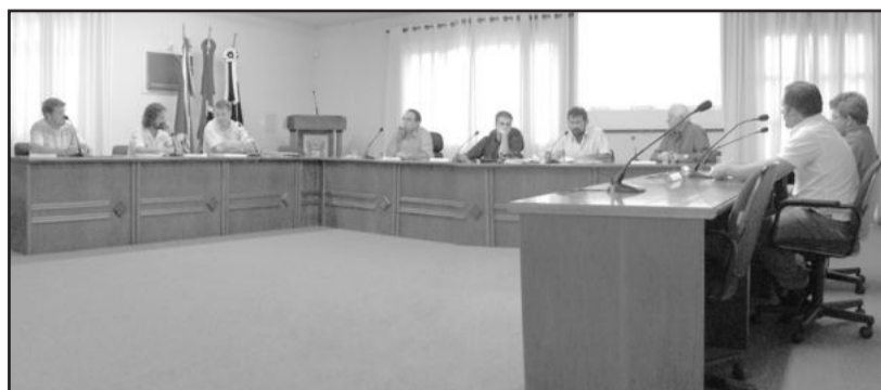
Vereadores autorizaram alteração na sessão de segunda-feira

A mudança mais substancial ocorrida com relação às secretarias foi a criação de novas pastas. O órgão responsável pelo desporto, que pertencia à Secretaria de Turismo, integrará a nova Secretaria dos Esportes, Lazer e Juventude. Também será criada a Secretaria Especial de Governo.