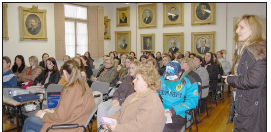
Escolas da rede municipal foram apresentadas aos representantes

“Cada um servirá como um elo das escolas para que levem para a Secretaria da Educação as necessidades senti-