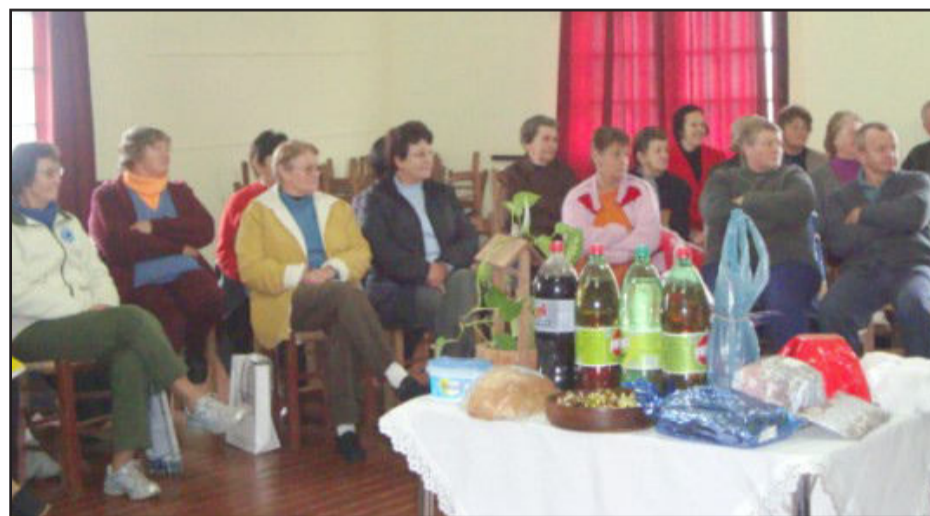
Idosos atentos e interessados no assunto