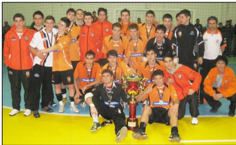
Equipe Juvenil da ACBF foi vice-campeã da Copa dos Campeões de Sapucaia do Sul

A equipe Juvenil (Sub-20) da Associação Carlos Barbosa de Futsal (ACBF) é vice-campeã na disputa da Copa dos Campeões, de Sapucaia do Sul. O time laranja foi derrotado pelo placar de 9x4 pela equipe do Flamengo, de Esteio, que conquistou o título inédito no torneio.