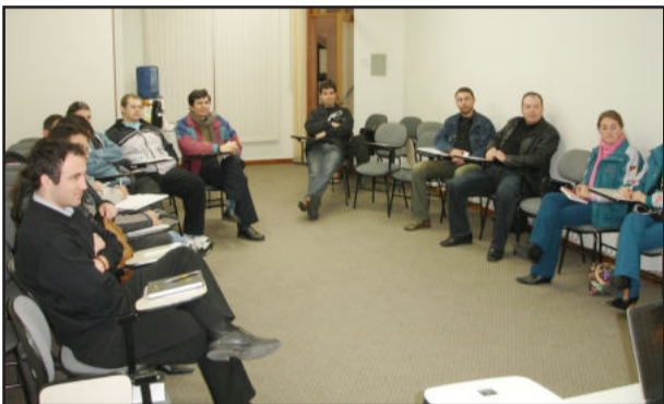
Grupo define ações dos próximos anos

O Grupo de Tecnologia da Informação e Comunicação de Garibaldi (GTIC) inicia hoje um importante momento de sua história: os integrantes do grupo, em parceria com o Sebrae, participarão de seis encontros para traçar o Planejamento Estratégico do GTIC para os próximos anos. É o processo de elaborar uma estratégia definindo a relação entre uma organização e seu ambiente. Compreende a tomada de decisões sobre qual o comportamento que a organização pretende seguir, produtos e serviços que deseja oferecer, mercados e clientes que