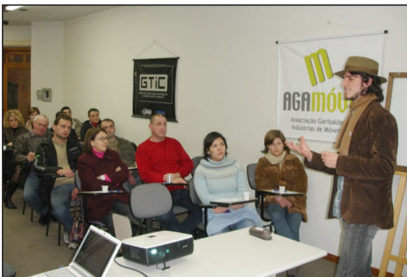
Romagna apresentou objetivos do Empretec

O Empretec é uma atividade em parceria entre Sebrae e Organização das Nações Unidas para o desenvolvimento do potencial empreendedor. Durante seis dias seguidos, empresários se reúnem e ficam totalmente focados em vivências, oficinas e entrevistas, as quais estimulam as mudanças no comportamento pessoal. "Os participantes do programa, que nós chamamos de empretecos, empreendem mais por oportunidade do que por necessidade. Além disso, possuem também um elevado grau de motivação e autoconfiança, o que facilita e oferece mais segurança na hora da tomada de decisões. Com esta visão, eles conseguem traçar um planejamento e obtêm melhores resultados", destacou