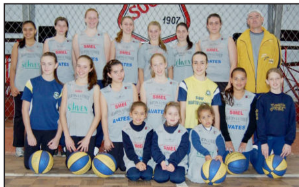
Algumas atletas do CML que disputaram a Copa Farroupilha