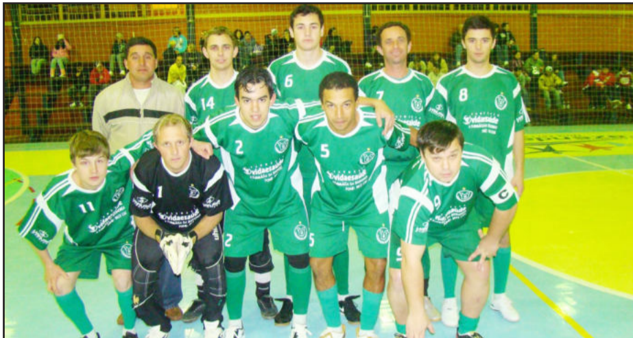
Equipe do Bairro Conceição

Os jogos que decidem os vencedores iniciam às 19h15 no ginásio do Parque Municipal. Após as disputas, serão entregues os troféus e as medalhas para os jogadores. O Interbairros de Fazenda Vilanova é uma promoção da Secretaria Municipal de Educação, Cultura e Desporto e conta com a organização da AlaSul.