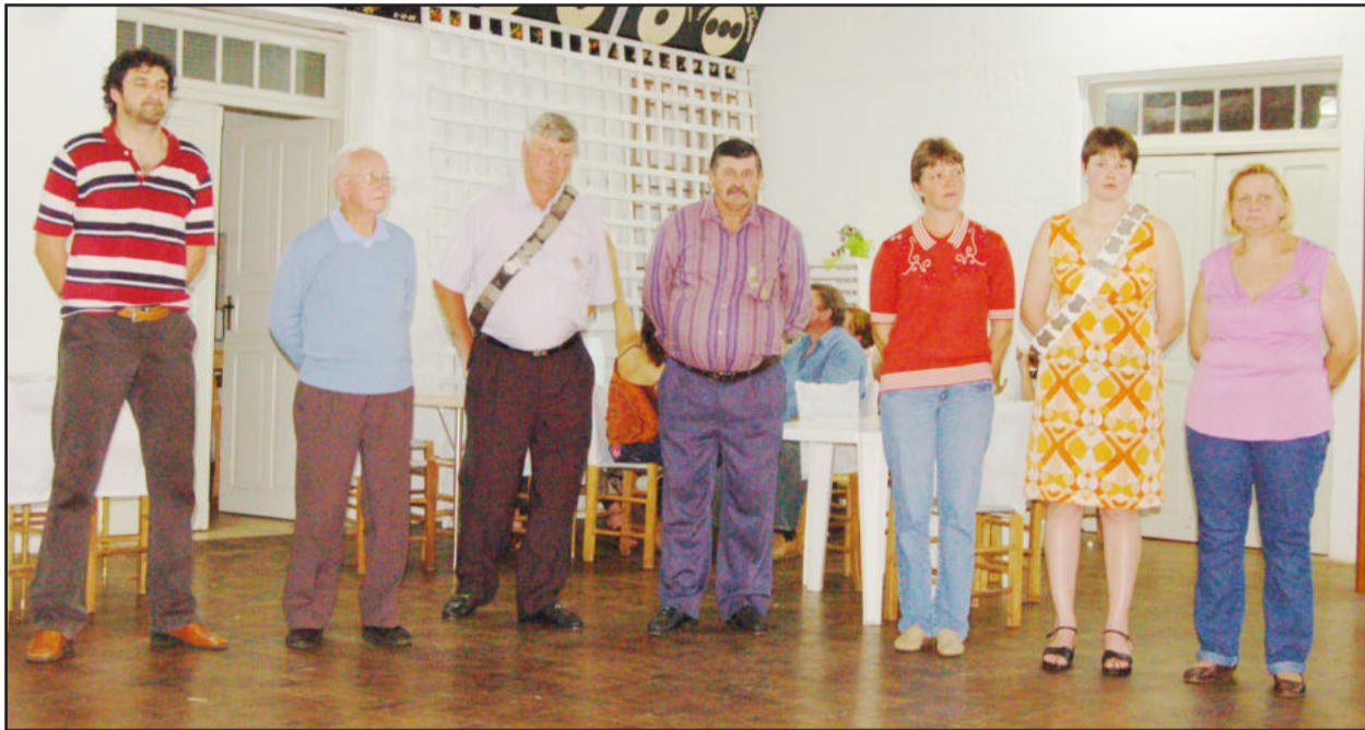
A atual corte do Tiro Rei de Linha Clara