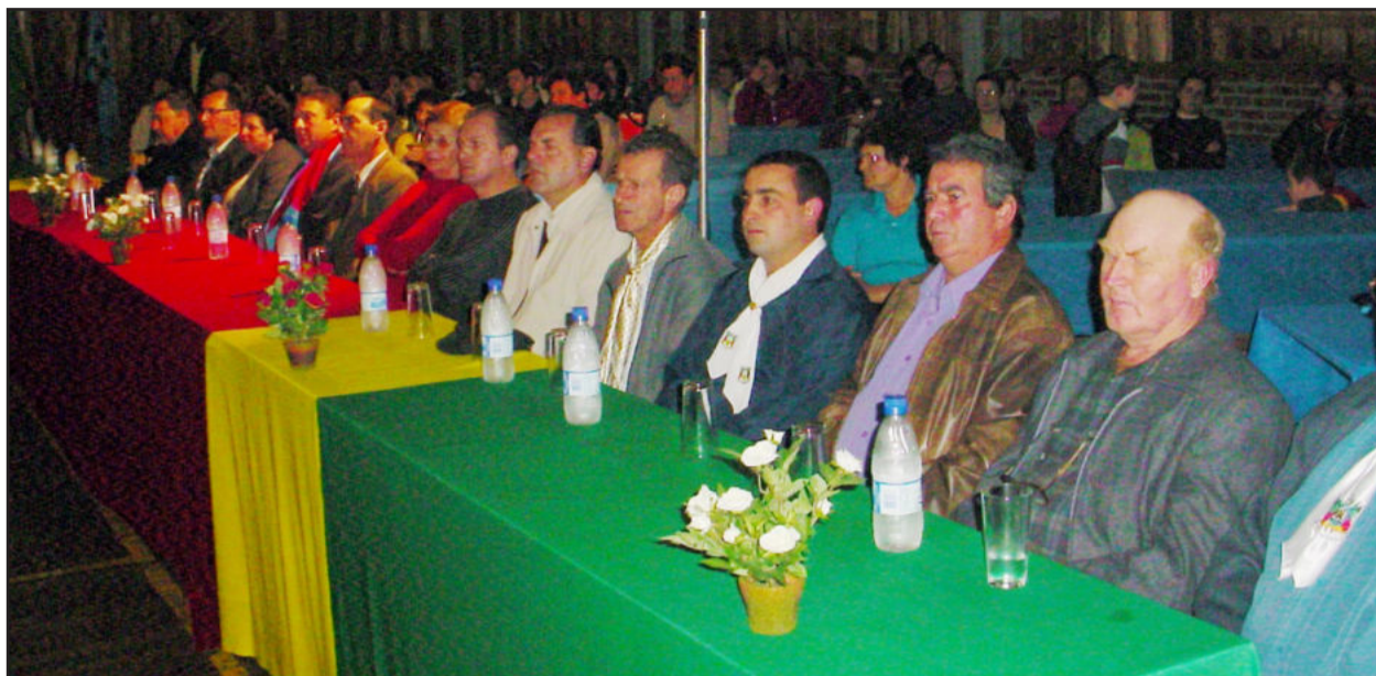
Ex-vereadores foram homenageados na sessão solene

O Legislativo de Fazenda Vilanova realizou sessão solene nesta segunda-feira, dia 13, tendo como local as dependências do CTG Pousada dos Tropeiros. A sessão solene serviu para o lançamento do site da Câmara, denominado de "Portal da Transparência", e também da nova Lei Orgânica do Município.