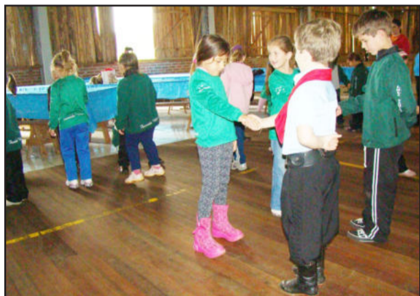
Alunos da Escola Rui Barbosa dançaram a tradicional "Dança do pezinho"