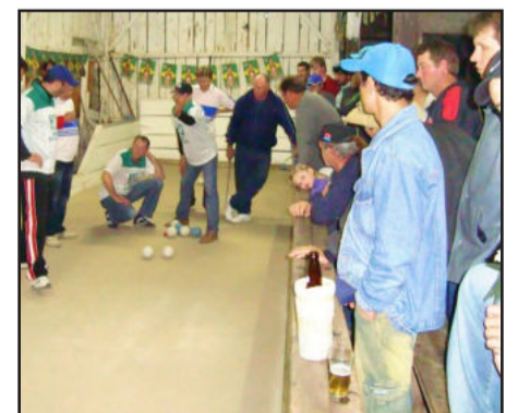
Decisão mobiliza as comunidades

O início dos jogos no sábado dia 18 será às 13h com a decisão do 3º e 4º lugar entre Bar do Gomes B e Bar e Mercado Minigus entre o trio seleção de cada equipe. Na sequência iniciam-se os jogos entre SER Juventude B e Restaurante Frozza.