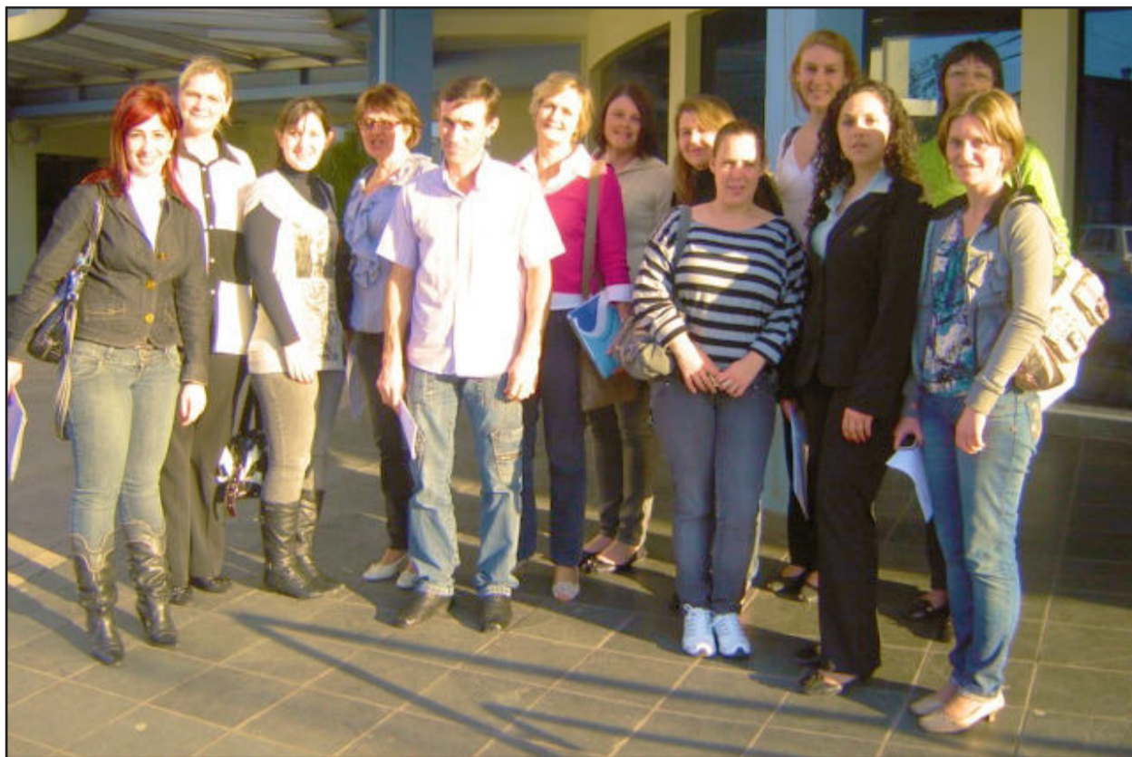
Grupo de Trabalho Humanizado do HOB, representado por 14 colaboradores, realizou visita de benchmarking

No dia 10 de setembro o Grupo de Humanização do Hospital Ouro Branco, de Teutônia, realizou visita de benchmarking ao Hospital Santa Cruz, de Santa Cruz do Sul, oportunidade em que puderam observar de perto o trabalho realizado pela casa de saúde do Vale do Rio Pardo. Além de conferir as ações de humanização, o grupo teutoniense visitou instalações.