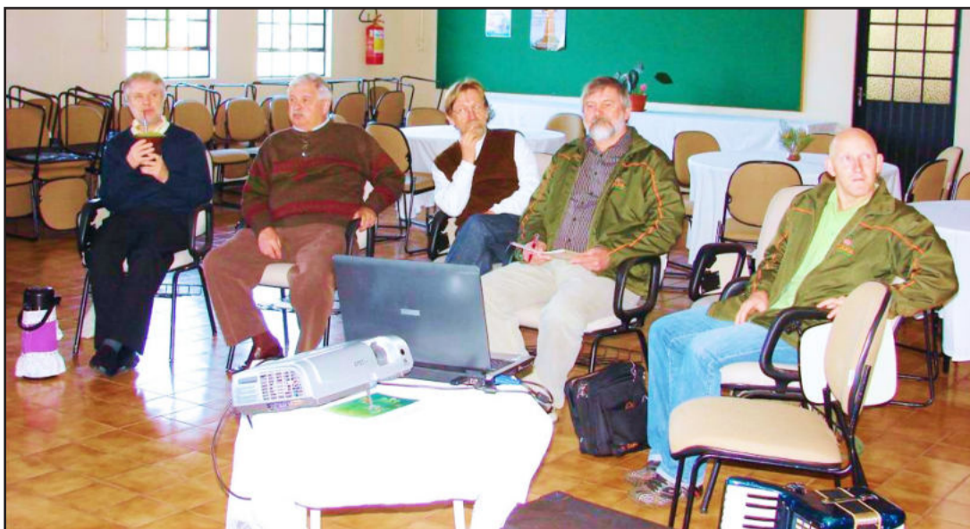
Pastoral Rural do Sínodo Vale do Taquari em parceria com o Capa promoveram o encontro

O Centro de Apoio ao Pequeno Agricultor é uma ONG organizada numa iniciativa da Igreja Evangélica de Confissão Luterana no Brasil (IECLB), presente nos três estados do Sul, onde atua há mais de 30 anos, tendo como meta principal a produção ecológica viável para a agricultura familiar. Atua também junto com os agricultores na área da comercialização dos produtos através das cooperativas. Ao lado da produção, o cuidado com uma alimentação saudável objetiva diretamente uma melhor qualidade de vida, zelando pela saúde e a prevenção de doenças, motivado especialmente pelo trabalho dos grupos de saúde comunitária.