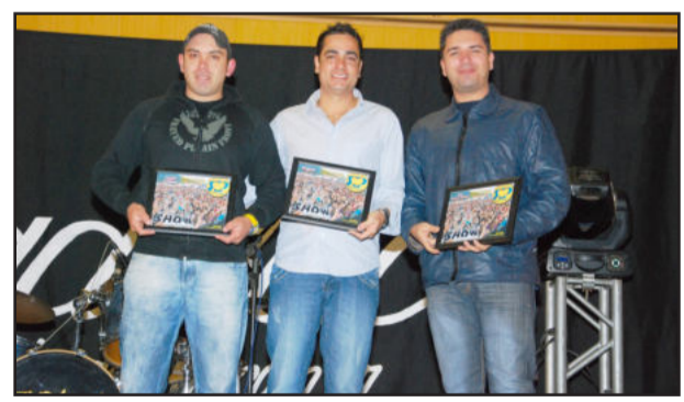
Homenagem aos divulgadores de bandas, duplas e grupos musicais