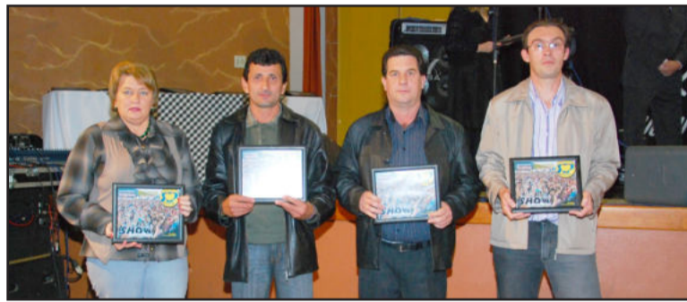
Homenagem às Câmaras de Vereadores