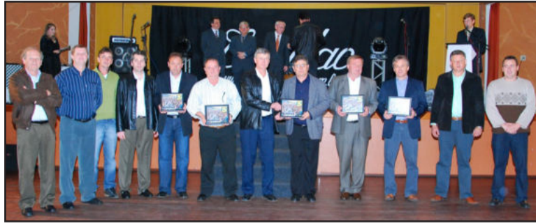
Homenagem às administrações municipais