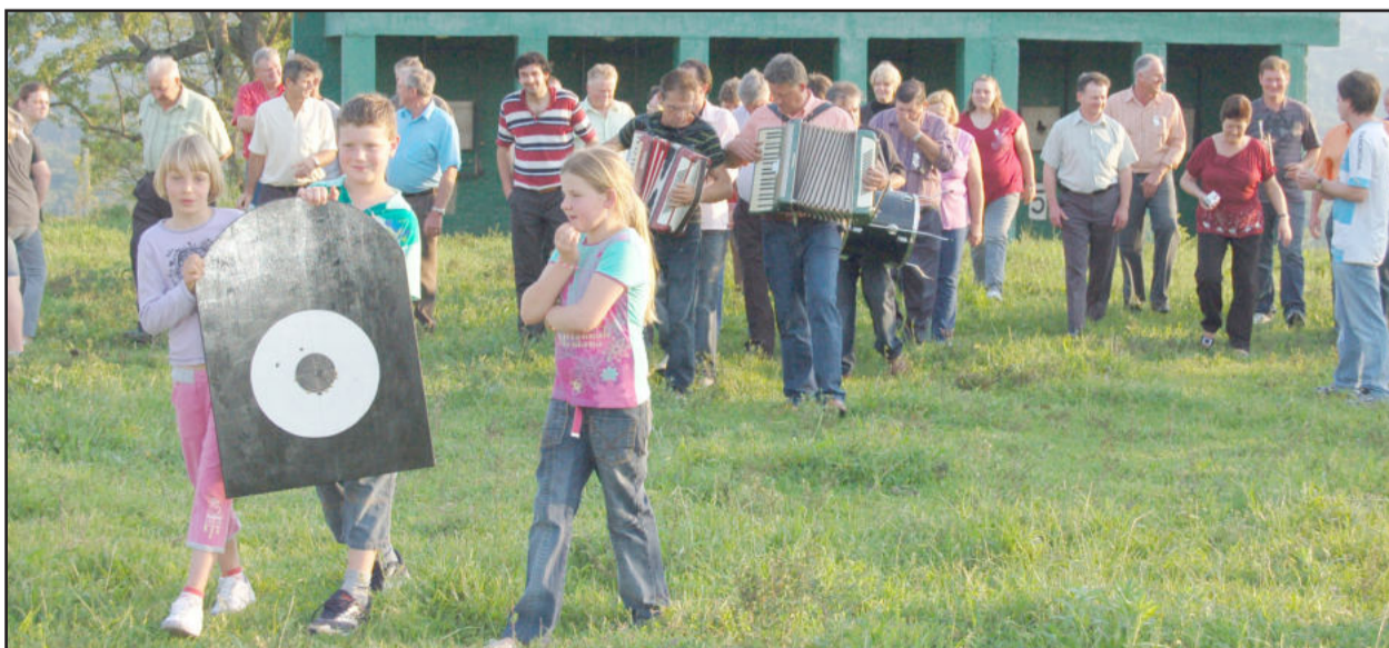
Após um dia de disputas, alvo é recolhido e vencedores são proclamados

> 17h - Coroação dos melhores atiradores e confraternização entre os participantes do Tiro-Rei.