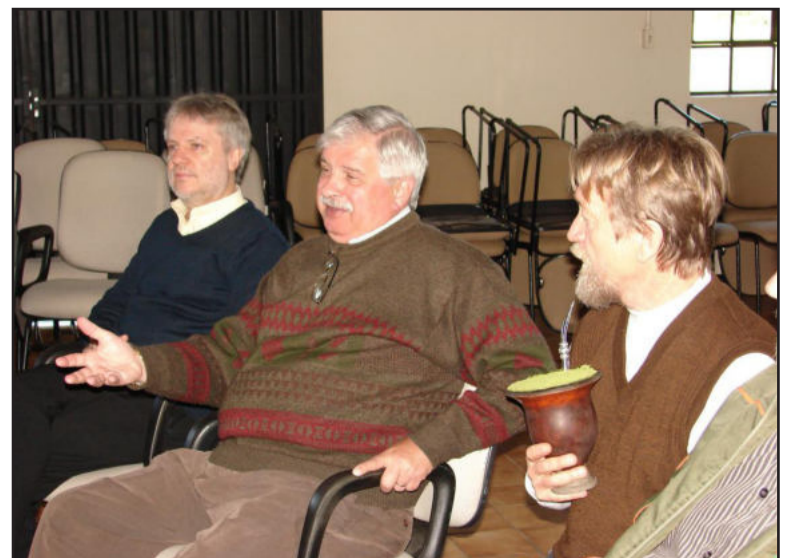
Lideranças religiosas também defendem a agroecologia como modelo sustentável