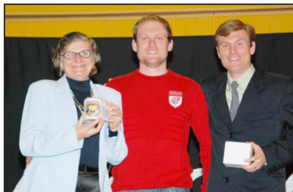
Homenagem à Nanci