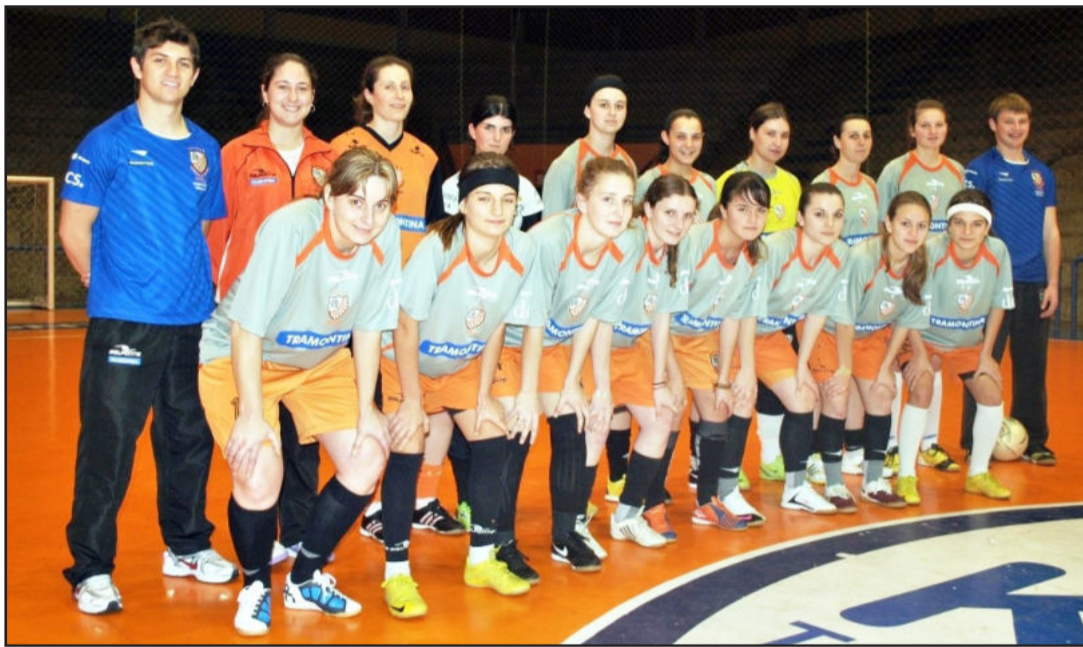
Equipe Feminina da ACBF estreou com vitória pelo Estadual 2010

Equipe feminina da ACBF estreou com vitória sobre a Ulbra