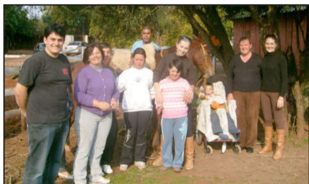
Momento da doação do cavalo para a Apae