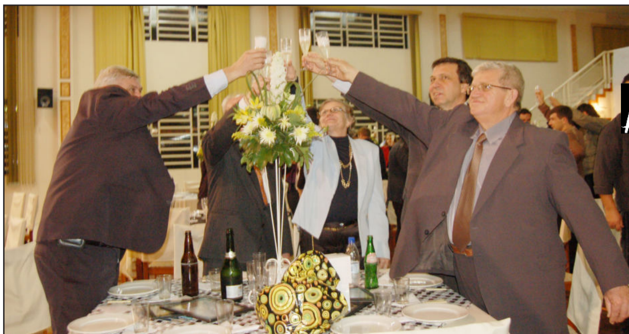
Direção da emissora brindou e agradeceu a todos que contribuíram nestas duas décadas de atividades. Páginas 4 e 5