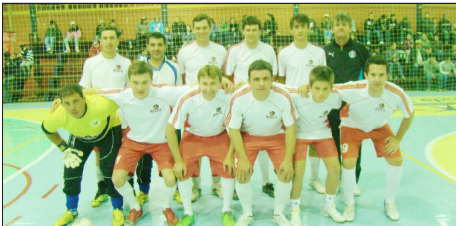
Equipe do Bairro Santana