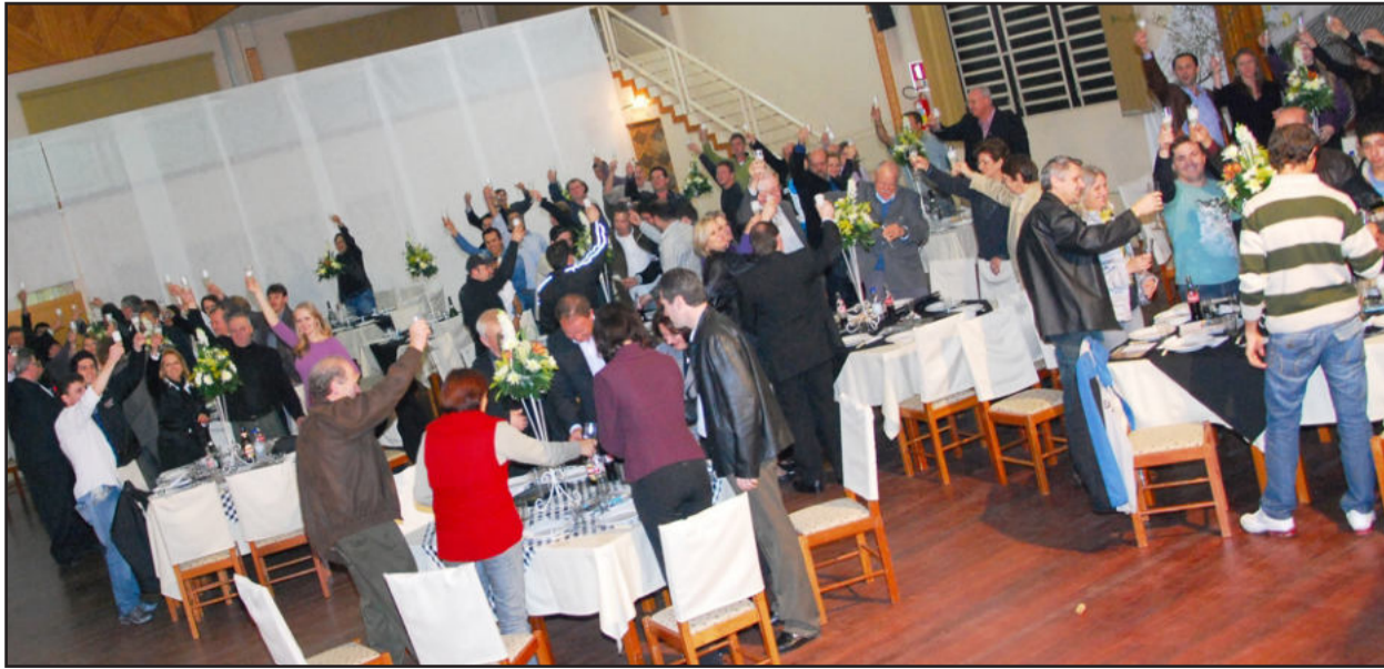
Convidados de várias cidades vieram receber a homenagem

A trajetória de 21 anos de serviços prestados às comunidades de toda a região não poderia passar em branco. A Rádio Popular FM realizou nesta terça-feira, dia 14 de setembro, uma noite de agradecimentos a diversos parceiros, de diferentes esferas da sociedade, que sempre contribuíram com o Grupo Popular de Comunicação, que também recebeu o reconhecimento merecido.