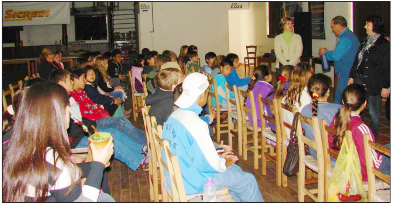
Alunos conheceram hábitos, costumes e tradições gaúchas