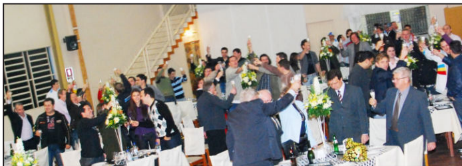
Brinde coletivo marcou o evento