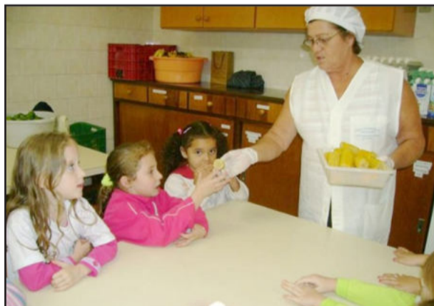
Crianças se alimentando com produtos naturais

Quem tiver, deve trazer também seu produto ecológico para o encontro.