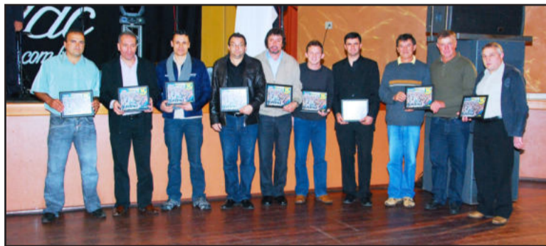
Homenagem a parceiros