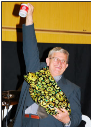
Homenagem ao Família

E, para fechar este momento especial com chave de ouro, foi feito um brinde coletivo com espumantes da Vinícola Garibaldi. Após as homenagens, o jantar foi servido pelo Restaurante do Fritz, seguido da apresentação da Banda Cadillac, que com seu vasto repertório animou a noite.