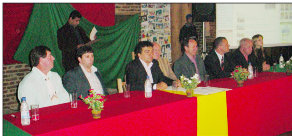
Mesa diretora da Câmara com autoridades

"O Portal da Transparência é uma coisa boa e muito importante. O tempo mostrará isso para a comunidade de