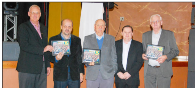
Homenagem às cooperativas