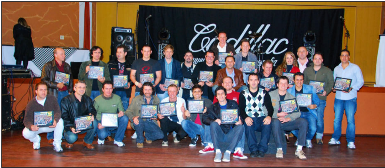
Homenagem aos músicos de diversas bandas e grupos