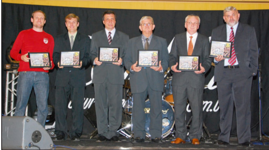
Homenagem aos diretores e comunicadores