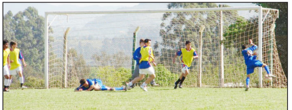
Sede esportiva do Sesi foi um dos locais que sediou os jogos

zendo que Teutônia recebe bem todos aqueles que desenvolvem atividades que visam promover qualidade de vida