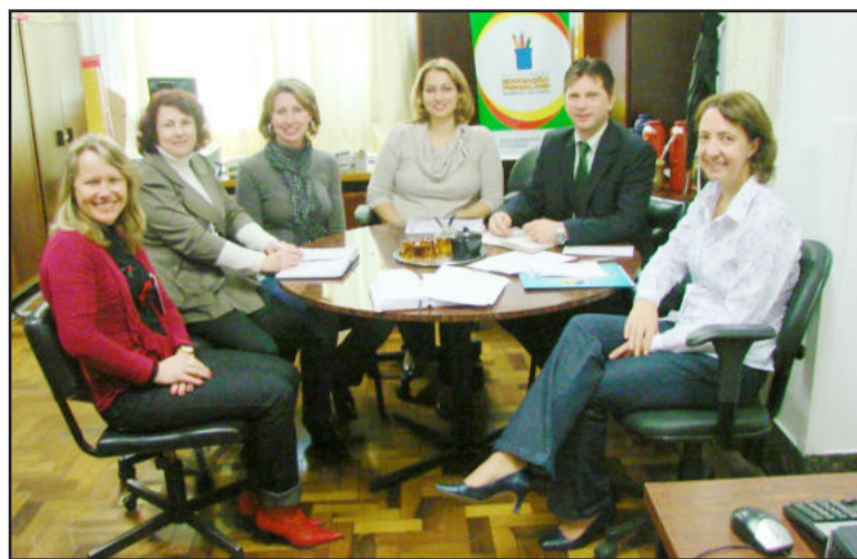
Grupo de Educação Fiscal de Teutônia visitou coordenação do programa no governo do Estado