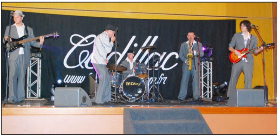
Banda Cadillac agitou a noite com rock do passado