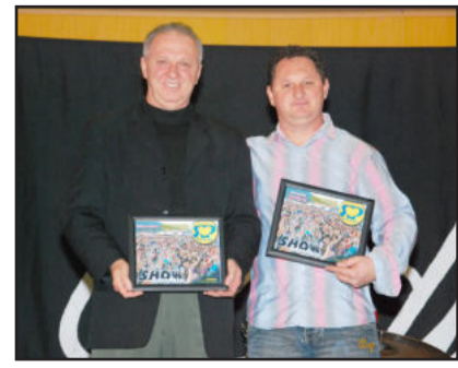
Homenagem aos representantes das gravadoras