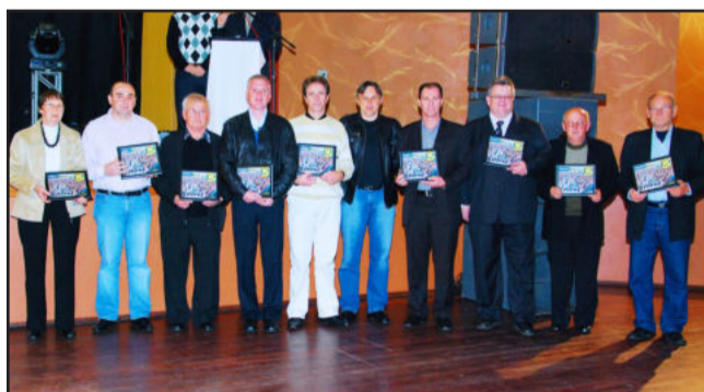
Homenagem a amigos, colaboradores e apoiadores