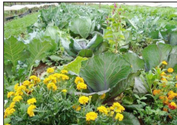
Horta cultivada em Colinas