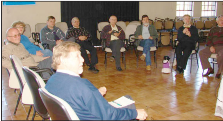
Agroecologia foi tema do encontro junto ao Sínodo Vale do Taquari

"O agricultor deve procurar produzir ao máximo alimentos orgânicos na sua propriedade, porque assim ele vai conseguir alimentos mais saudáveis, além de não precisar pagar impostos, embalagens, transporte nem usar agroquímicos. Esta é uma maneira mais barata e sadia