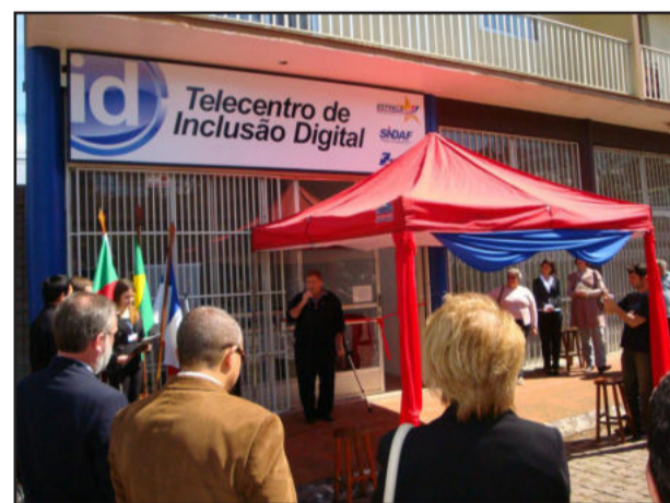
Telecentro de Inclusão Digital do Bairro Imigrantes

Em dezembro de 2007, foi implantado um telecentro na rua Chá-Chá Pereira, nº 218, no Centro. Já em março de 2009, iniciaram-se as atividades do telecentro do bairro Boa União.