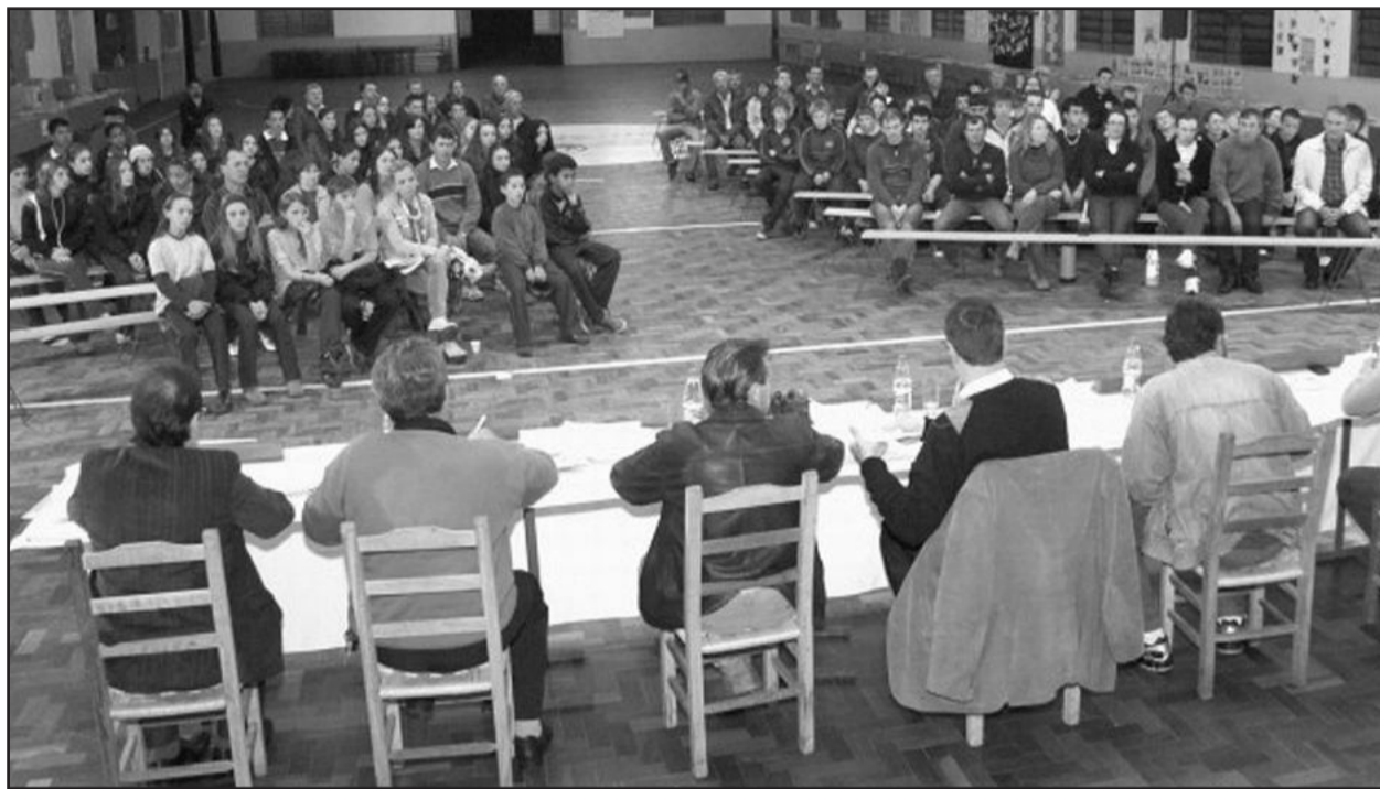
Comunidade presente na sessão ordinária da Câmara de Vereadores