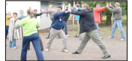
Desafio faz a população sair da rotina e exercitar-se

desafiante de Imigrante, 3.100 habitantes, será Campos Novos Paulista, do interior de São Paulo, e que possui 4.539 habitantes.