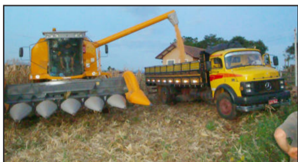
Sementes da safra 2011 e 2012 podem ser encomendadas

Por outro lado, a Secretaria de Agricultura lembra que o milho Safra e Safrinha do ano anterior tem vencimento até dia 31 de maio de 2011 e os produtores que retiraram Safrinha têm direito a desconto de 50%. Para tanto, devem se dirigir à Secretaria para solicitar este benefício.