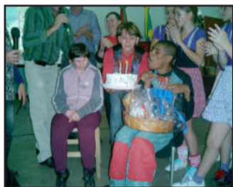
Homenagens pelo aniversário de dois alunos