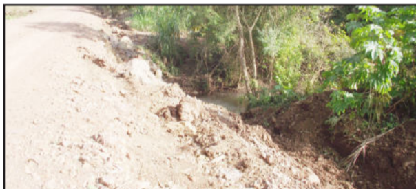
Ponte sofreu danos com a enxurrada