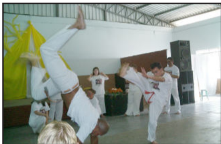
Capoeira da Apae de Teutônia