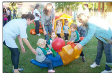
Muita integração e brincadeiras marcaram programação

Além de momentos prazerosos de convívio, todas as turmas do 1º ao 5º ano e Educação Infantil presentearam suas mães com uma bonita fronha pintada pelos próprios alunos, além de um lindo cartão também confeccionado pelos estudantes.