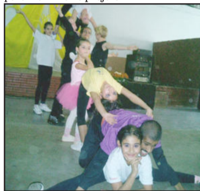
Street Dance mostrando sua performance