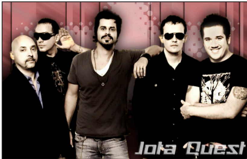
Jota Quest é atração nacional na sexta-feira à noite da Festa de Maio

Na sexta-feira, dia 27 de maio, não haverá expediente para o público nas repartições do Centro Administrativo, pois é de visitação aos estandes, a partir das 10 horas. A partir das 11 horas já haverá palco aberto para bandas locais. A partir das 13 horas