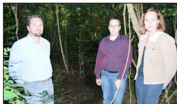
Visita à área verde do educandário