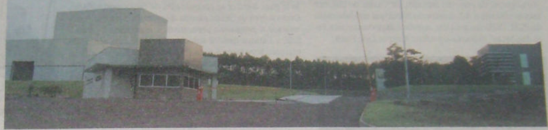
Unidade industrial da Nutrifarma está localizada no acesso à estrada de Linha Harmonia. Faturamento é projetado em mais de R$ 3 milhões por mês. Página 3