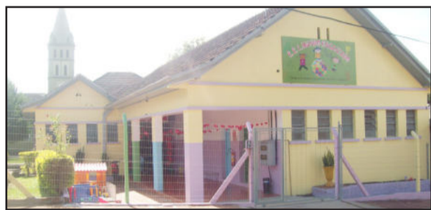
Novo prédio da Escola Infantil

A programação da noite foi finalizada com uma confraternização para homenagear as mães, com brincadeiras, apresentações dos alunos e um delicioso coquetel.