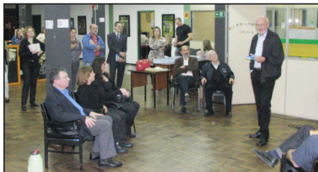
Autor lembrou passagens de sua vida

Juntamente com os livros, Meicke apresentou o CD “Maria Madalena – músicas para cantar e celebrar”, cujas letras são de sua autoria e que tem na produção o maestro da renomada Orquestra Municipal de Teutônia (OMT), Astor Dalferth. O CD está em fase de pré-lançamento e será oficialmente lançado no dia 12 de junho, durante o Dia Sinodal da Igreja do Sínodo Vale do Taquari, evento que será realizado no município de Imigrante.