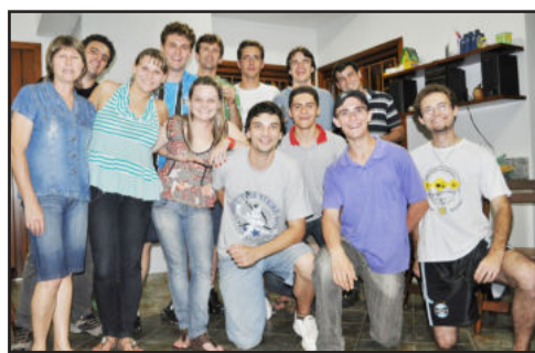
Estudantes de Santa Maria

O Projeto mantém uma parceria de vários anos com o jornal Folha Popular, através do qual são publicados artigos do setor da agricultura, a partir do conhecimento que os estudantes adquirem na universidade, buscando interagir com os produtores rurais da região. Em sua visita a Teutônia, os alunos aproveitaram para conferir, na noite de domingo, o espetáculo "Primeiro as Damas", promovido pela Rádio Popular Fm e Centro Cultural 25 de Julho.