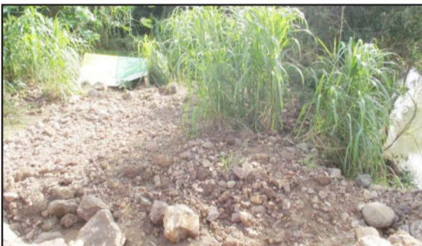
Parte do aterro foi levada pelas águas