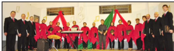
Encontro de Corais

Já no mês de junho, no dia 04, participarão do Encontro de Corais em Colinas, promovido pelo Coral Misto Louvor Cantai.