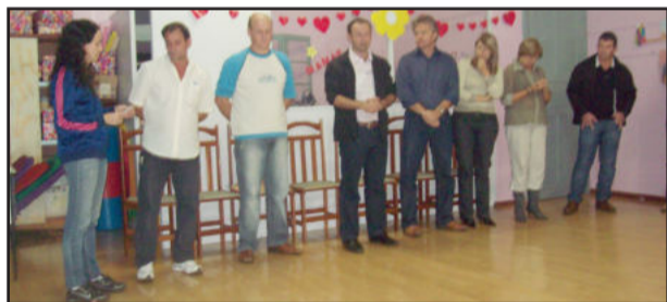
Posse da nova diretoria ocorreu durante a solenidade