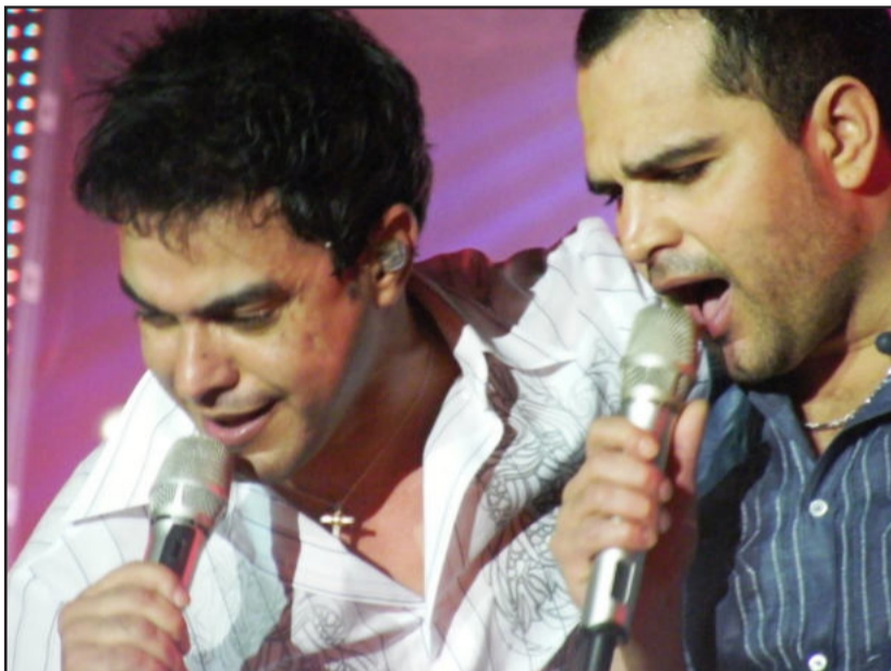
Dupla sertaneja Zezé di Camargo e Luciano fará grande show no sábado à noite

começa o Baile Municipal para a Terceira Idade, com a Banda La Paloma, no palco alternativo. Durante a tarde, a partir das 15h30min, realiza-se reunião das ACI's e CIC's do Vale do Taquari, tendo por local o auditório da CIC de Teutônia.