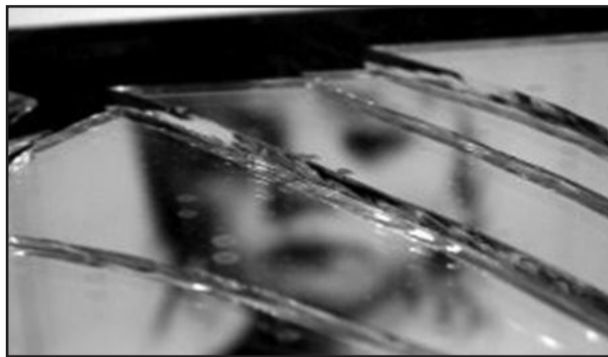
Ação para coibir abusos sexuais contra crianças

A Via del Vino, no Centro de Bento Gonçalves, será o cenário de uma ação da Rede de Atenção à Criança e ao Adolescente que integra a Campanha “Faça Bonito - Proteja nossas crianças e adolescentes”. O evento acontecerá amanhã, em Bento Gonçalves. Serão distribuídos materiais informativos, marcando a data de forma a sensibilizar a população para a importância de se comprometer com os direitos das crianças e adolescentes.