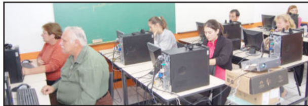
Inclusão Digital: novas turmas a partir de junho

A Secretaria Municipal de Educação de Imigrante está concluindo as inscrições de mais duas turmas para o curso de Inclusão Digital. São dez vagas para cada turma, sendo duas horas/aula por semana, num total de 10 horas, no turno da noite. A preferência é pa-