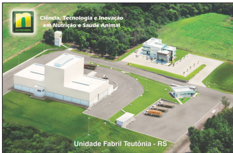
Unidade Fabril Teutônia - RS

Conta com uma unidade industrial instalada em Taió/SC e duas unidades em fase de implantação nas cidades de Maripá/PR e Teutônia/RS. A Nutrifarma está capacitada a produzir uma linha completa de suplementos vitamínicos minerais, rações completas e aditivos para suínos, bovinos de leite, bovinos de corte e aves. A empresa também conta com duas unidades na Argentina, resultado de parceria entre espanhóis e argentinos que originou a Vetifarma, ainda em 1996.