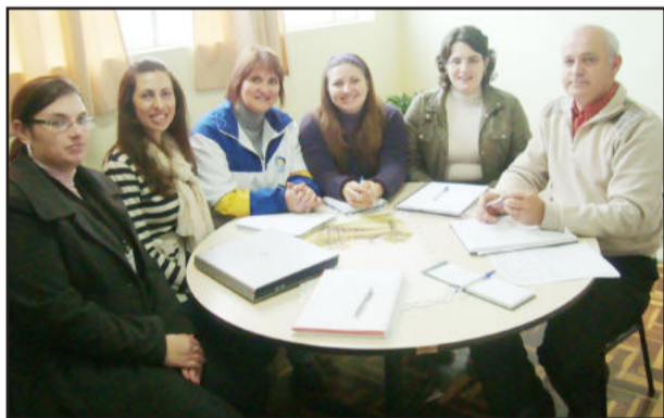
Ieceg definiu parceria com a Attitude para ampliar o marketing do instituto

Todas as ações buscarão valorizar cada vez mais o lado cidadão de cada estudante, destacando o aspecto humano da relação Instituto-alunos. Fortalecer esses laços através de ferramentas que a empresa irá apresentar é uma forma de mostrar o crescimento e a importância que o Ieceg dentro da comunidade. Buscar novos horizontes também demonstra que o Instituto está voltado ao futuro, afim de sempre promover em nossos alunos um sentimento de que sua escola está cada vez mais presente em suas vidas.