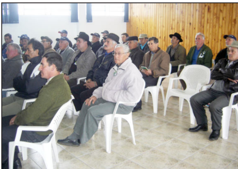
Líderes da região de Boqueirão do Leão