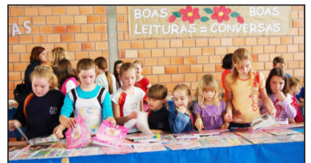
Imigrante realizará mais uma Feira do Livro

Às 9 horas, com a presença de autoridades e familiares de alunos, haverá a sessão cívico-cultural, alusiva à Independência do Brasil, com apresentações artísticas das escolas municipais Ciranda de Sonhos, Pequeno Mundo, Arco-Íris, Ernesto Alves e Santo Antônio, e a Escola Estadual 25 de Maio. Às 11 horas, um show da Orquestra Municipal de Imigrante encerra de forma oficial a programação.