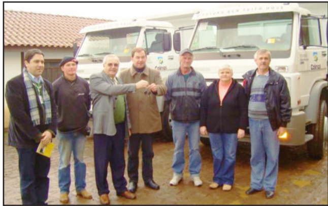
Entrega oficial das chaves dos caminhões

O Ministério da Agricultura repassou valor de R$ 195.000,00, fruto de duas emendas parlamentares, e o Município participou com R$ 183.000,00 de recursos próprios, totalizando um investimento de R$ 378.000,00.