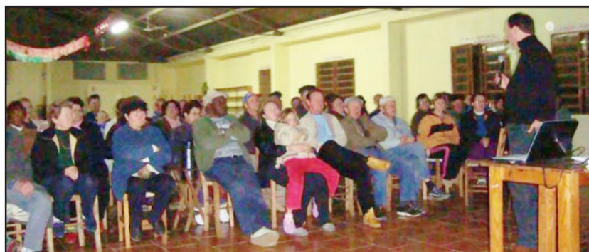
Encontros são realizados nas comunidades