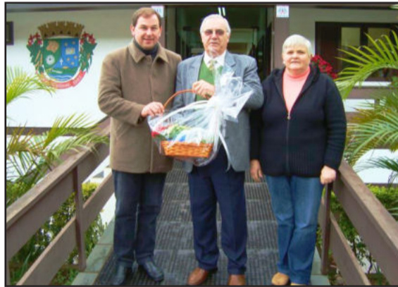
Visita do superintendente à administração de Colinas