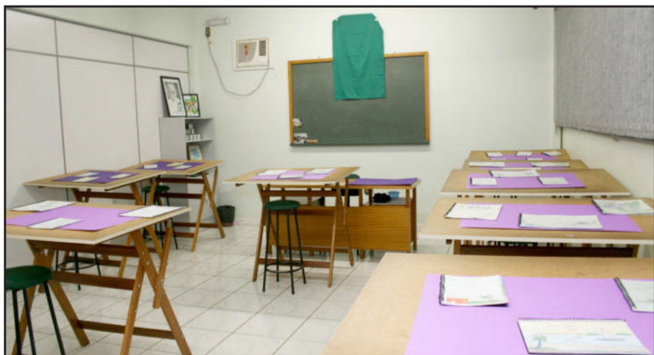
Sala de Desenho Artístico Luiz Carlos Feldens ocupa jovens e revela grandes talentos