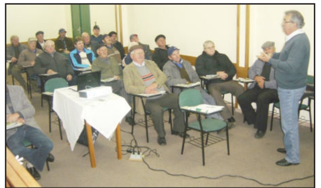
Hennemann (d) com os líderes de Salvador do Sul

Quanto ao provedor de Internet CertelNET, foi destacada a ampliação da área abrangida, que agora engloba 24 municípios, com mais de 10,4 mil assinantes.