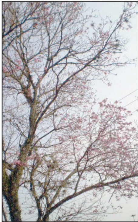
Ipê-roxo próximo ao Supermercado Imec, na Rua Júlio de Castilhos

O plantio de mudas da espécie, prática prevista no projeto, vem sendo realizado em vários locais que se ajustam às características da planta. Em uma das vias de acesso ao município, na Trans Santa Rita, por exemplo, já foram plantados mais de 600 exemplares do Ipê-roxo formando uma alameda, que no futuro proporcionará uma bela paisagem.