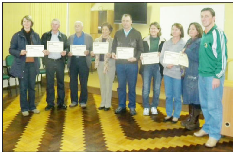
Alunos receberam certificados de conclusão do curso

A conclusão do estudo de viabilidade está prevista para dezembro. O material reunirá informações sobre custo de implantação, tipo de veículo a ser utilizado, frequência das viagens, destinos mais procurados e o modelo mais adequado para a administração da rota, podendo ser realizada pelo poder público, pelo setor privado ou público-privada. Com o resultado em mãos, começará a busca por recursos para a implantação.