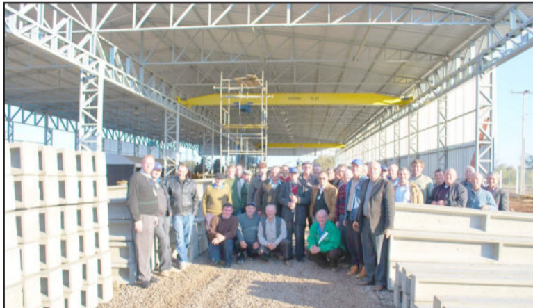
Líderes de Teutônia visitaram indústria de artefatos de cimento

O artigo 23 da Lei 9074/95, cuja legislação enquadrava a Certel Energia como Permissionária de Serviço Público de Distribuição de Energia Elétrica, também foi debatido nas reuniões. O contrato de Permissionária determina que, na prestação do serviço público, seja adotada tecnologia ade-