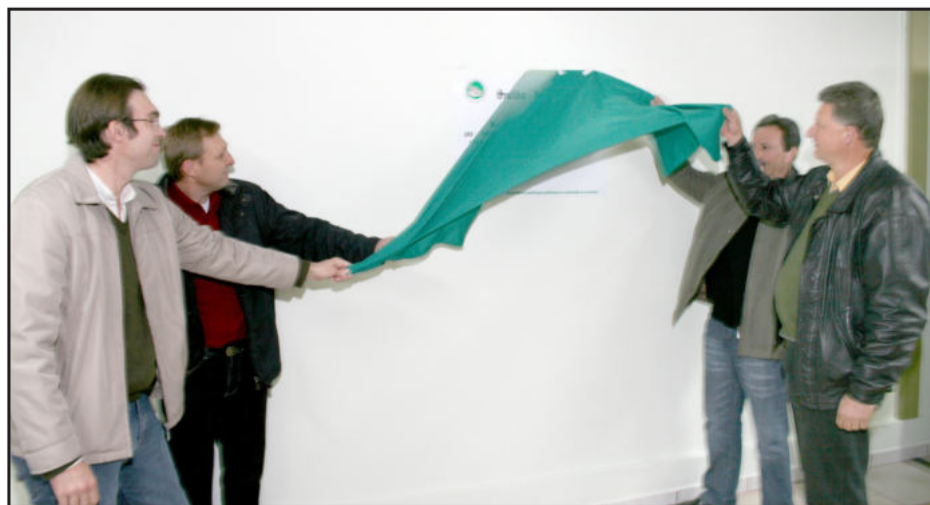
Siticalte inaugurou salão de festas para os associados