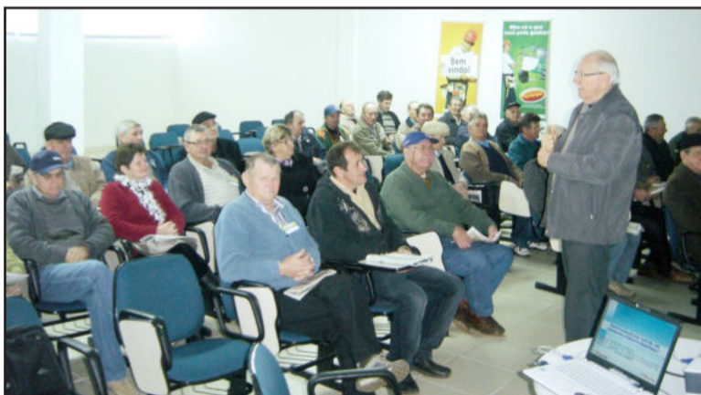
Hoerlle na reunião de Lajeado

Sobre as Lojas Certel, os encontros revelaram que, de março a junho, foram reinauguradas as filiais de Muçum, Progresso, Agudo e Carlos Barbosa, e inauguradas as de Estrela (materiais construção) e duas em Pelotas. Ainda serão inauguradas duas lojas em Rio Grande, uma em Santa Maria e outra em Camaquã.