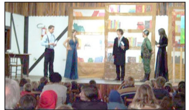
Teatro agradou pequenos e adultos