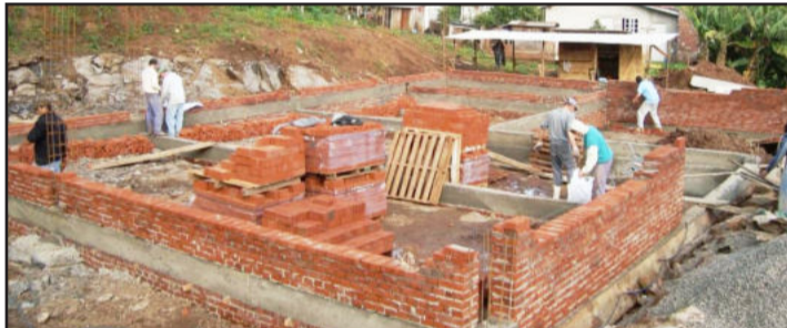
Ampliação do posto está em andamento

As obras de duplicação do Posto de Saúde estão acontecendo em ritmo acelerado. São 392,63 m 2 de construção, que iniciaram no começo de junho. No dia 6 de junho a empresa iniciou a montagem do esquadro. Antes, porém, foi realizada a dinamitação de uma rocha, necessária para a posterior ampliação.