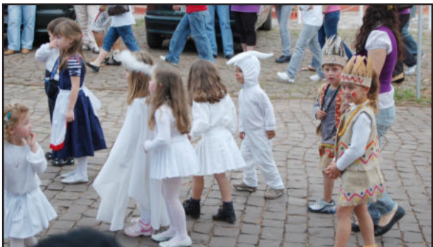
Crianças desfilaram caracterizadas

A Escola Municipal de Educação Infantil Criança Feliz, de Fazenda São José, aproveitou o desfile de 7 de setembro para apresentar temas como respeito, responsabilidade e comprometimento. Durante 15 dias que antecederam a data, bem como após o evento, foram realizadas várias atividades que envolviam os temas. O que marcou foram o empenho e a dedicação dos pais e familiares em auxiliar a escola na preparação de vestimentas que os filhos usaram no desfile, demonstrando interesse e valorização da escola que os acolhem todos os dias. Segundo muitos pais, o "Município está de parabéns por