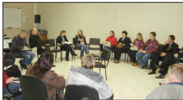
Reunião realizada na CIC

No dia 9 deste mês, a Câmara de Indústria e Comércio (CIC) reuniu empresários, contadores e representantes de empresas em seu auditório para tratar da Lei do Jovem Aprendiz. A mesma atende ao artigo 429 da Consolidação das Leis do Trabalho (CLT) no que se refere à obrigação da contratação de aprendizes por parte das empresas e entidades sem fins lucrativos com o objetivo de educação profissional, exceto micro e pequenas empresas.