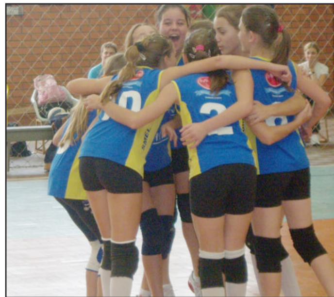
Equipes de várias categorias conquistaram vitórias neste final de semana