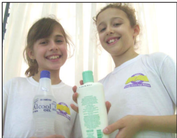
Alunos com os projetos que foram apresentados