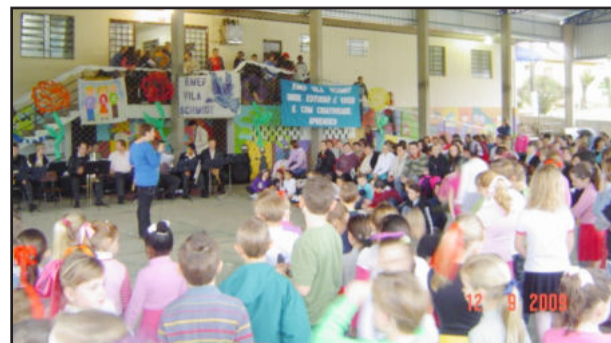
Evento teve bom público

No sábado, dia 13, na Escola Municipal de Ensino Fundamental Vila Schmidt, dezenas de pessoas participaram da III Mostra de Trabalhos, Dia da Família e da Solidariedade, programação que se estendeu todo o dia, com a participação de pais, alunos e autoridades. O evento começou às 9h30min com hora cívica, com a participação da Orquestra Municipal de Westfália, que executou o Hino Nacional, além de outras apresentações. No encontro estiveram presentes o prefeito Sérgio Marasca e o secretário da Educação Gustavo Sieben, além de representantes do Legislativo.