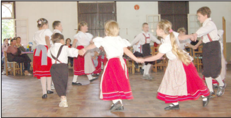
Alunos da Escola Guilherme Rottermund

“Na educação nada acontece por acaso ou isoladamente, mas é preciso o engajamento de vários ambientes: família, escola, comunidade. E os alunos foram nota 1.000, são muito talentosos ao mostrar o que sabem fazer e aprenderam o que foi ensinado pelos professores. Só há diferença e qualidade na escola porque a