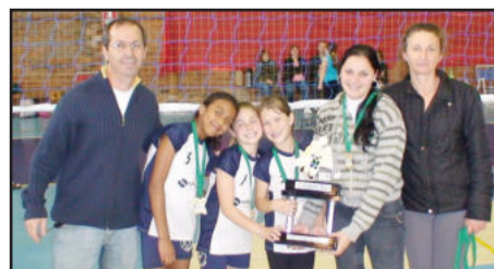
Equipe da Apacem Vôlei Lajeado, campeã pela Série Bronze do feminino