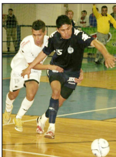
A exemplo do jogo diante de Santo Ângelo, partida frente a ASSAF será na Univates

anos, em 2006, com um amistoso entre as seleções de basquete do Brasil e do Uruguai. Em 2007, a ALAF disputou uma partida pela Série Bronze de Futsal, vencendo o América de Tapera pelo placar de 1 x 0. A equipe de Lajeado acabou conquistando o título daquela competição.