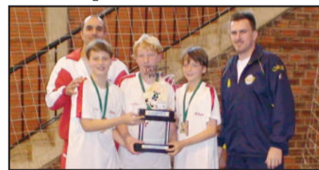
Equipe Mauá A de Santa Cruz do Sul venceu na Série Ouro do Masculino