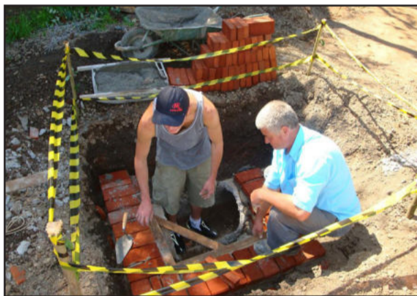
Antes da capa asfáltica, ruas recebem bocas-de-lobo

Também está sendo recuperada a rua Carlos Barbosa, trecho compreendido entre a avenida Rio Branco e a rua Germano Hasslocher, numa extensão de 225 metros.