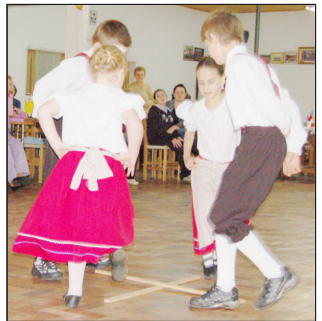
Apresentação de danças alemãs

O chefe do Executivo lembra que a educação vem de casa e a escola é responsável por um pequeno percentual do aprendizado. “É importante os pais darem limites e rumos para seus filhos, e isto percebemos nesta comunidade. As futuras gerações precisam compreender que podemos perder tudo - saúde, pessoas, emprego, dinheiro - mas o que não podemos perder jamais é o respeito e a educação; estes ficarão dentro de nós”, concluiu.