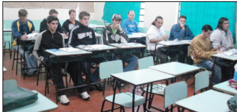
Alunos da segunda turma do curso