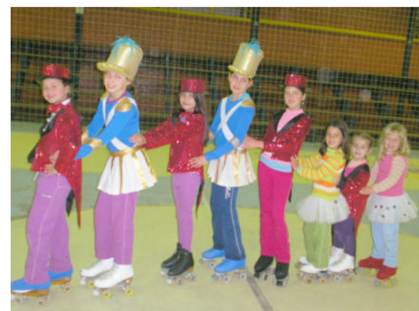
Meninas irão representar o Município em evento regional