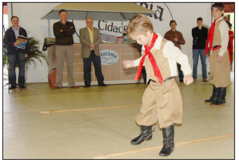
Jovens demonstram passos de chula