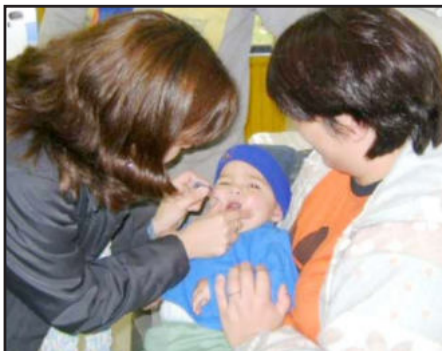
Meta é atingir 100%

Neste sábado, dia 19, acontece a segunda etapa da vacinação contra a paralisia infantil. Por isso, a equipe da Secretaria Municipal da Saúde e Assistência Social lembra que toda criança, menor de cinco anos, deve ser vacinada. O atendimento será das 8h às 17h, no Centro Municipal de Saúde, sem fechar ao meio-dia. Os pais devem apresentar a carteirinha de vacinação.