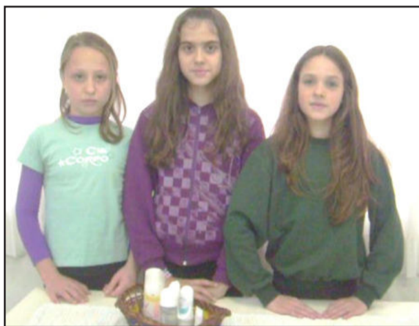
Jovens mostrando orgulhosos seu trabalho