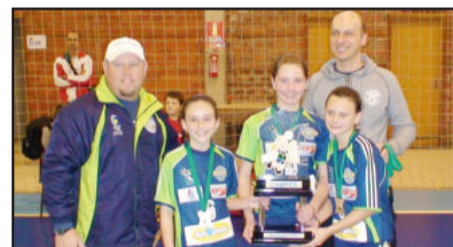
Equipe do CEAT Vôlei Lajeado venceu pela Série Ouro do Feminino