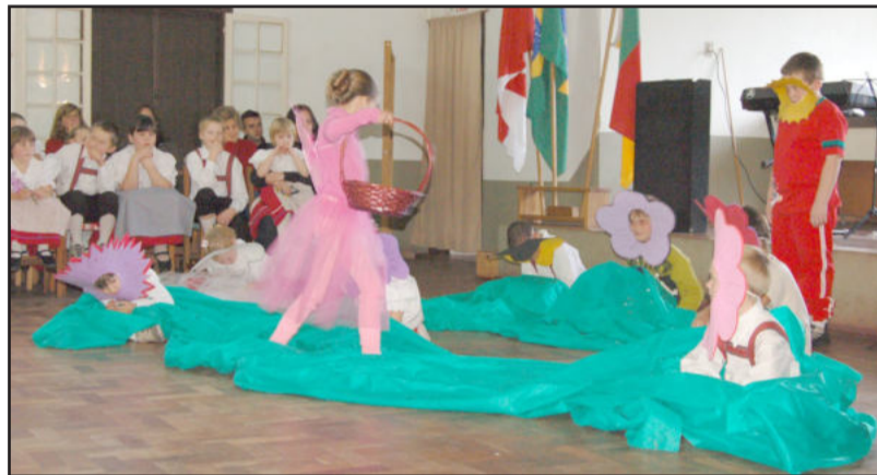
Alunos da Escola Getúlio Vargas