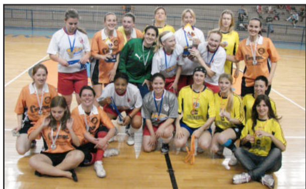
Todas as equipes confraternizaram, na hora da entrega das medalhas

As competições de futsal no naipe masculino seguem até amanhã, sexta-feira, quando será conhecida a equipe campeã. Já no dia 22 de setembro ocorrem os disputas de vôlei masculino e feminino. Antes, no dia 21, ocorre o jogo isolado entre as equipes "Carvalho" e "Ronaldo", que definirá o campeão no basquete masculino.