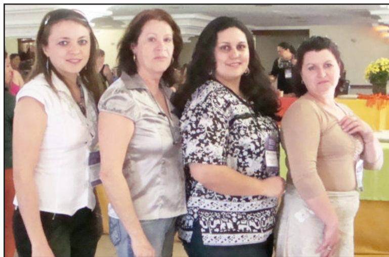
Representantes de Venâncio Aires, Taquari, Paverama e Bom Retiro do Sul

Durante o evento, além das discussões que envolveram