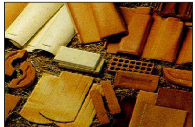
Banco da sucata propõe reaproveitamento de sobras de construções

Organização - O que enfeitar: Trevos de acesso aos bairros; quadrantes do Centro Administrativo; principais praças nos bairros; avenida que liga os bairros; entre outros a definir. Como enfeitar: Bolas de Natal, árvores de Natal, troncos pintados, guirlandas, coelhos da Páscoa, ninhos, ovos de Páscoa, entre outros. Onde fazer: Junto ao CRAS e no Centro Cultural