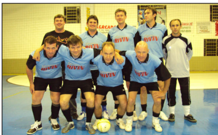
Dillin Informática/Car Box