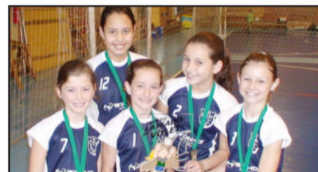
Equipe da Apacem Vôlei Lajeado foi campeã na Série Prata do feminino

Mais informações pelo telefone (51) 3982-1140.