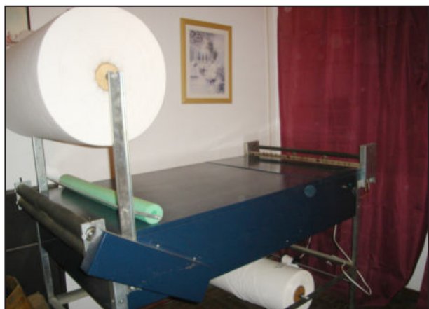
Máquina para fabricar fraldas está nos planos da equipe

Como funciona - Pessoas da comunidade, empresas e comércio fazem a doação de sobras de construção, material usado ou ponta de estoque de lojas, como: tijolos, telhas, areia, cascalho, tintas, portas, janelas, equipamentos sanitários,