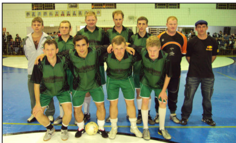
Morro do Alemão

O primeiro encontro da noite coloca frente a frente um dos líderes da Chave B do Força Livre, o Devirada, que encara o Universal Tintas, equipe que ainda não pontuou. Depois, no Veterano, Dillin e Bolamar buscam os primeiros pontos. Duas partidas sensacionais de Força Livre, ambas pela Chave C, fecham a noite de futsal.