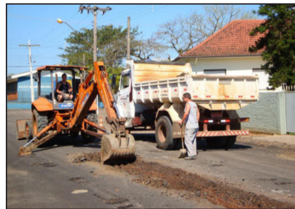
Germano Hasslocher receberá capa asfáltica