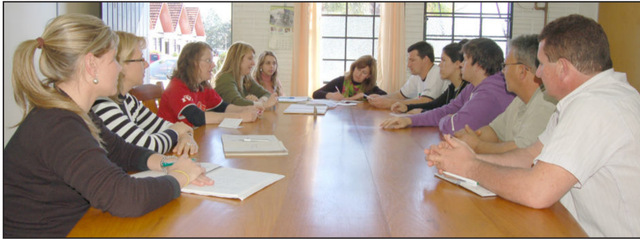
Grupo projeta ornamentação natalina especial com materiais recicláveis

Destaques ficam para o Banco da Sucata e para as Oficinas da Alegria