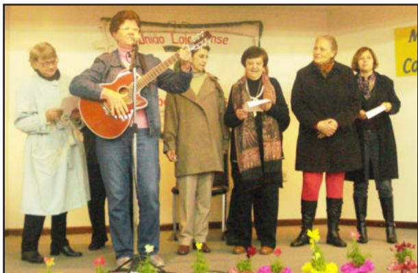
Mães apresentaram seus talentos musicais