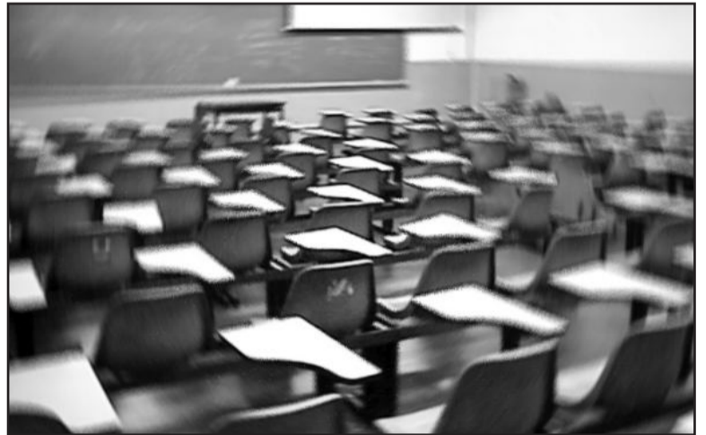
Algumas salas de aula podem ficar vazias

A 16ª CRE tem sede em Bento Gonçalves e abrange os municípios de André da Rocha, Bento Gonçalves, Boa Vista do Sul, Carlos Barbosa, Coro-