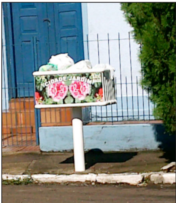
Lixeiras decoradas chamam atenção na cidade

A escolha de flores para enfeitar as lixeiras deve-se à tradição existente no Município, de valorizar os belos jardins. Na avaliação da administração municipal, são estes pequenos detalhes que fazem a diferença e ajudam, inclusive, a motivar a comunidade para continuar enfeitando duas casas e pátios, já que Colinas é reconhecida em nível estadual como Cidade-Jardim.