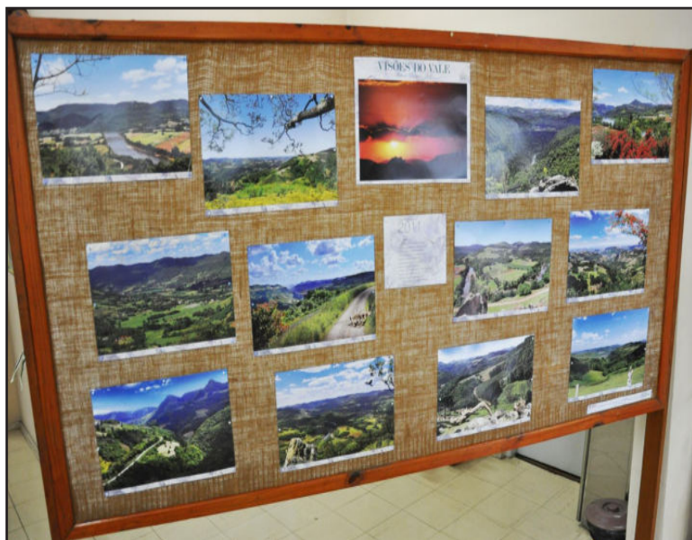
Exposição permanece na biblioteca até o fim de fevereiro