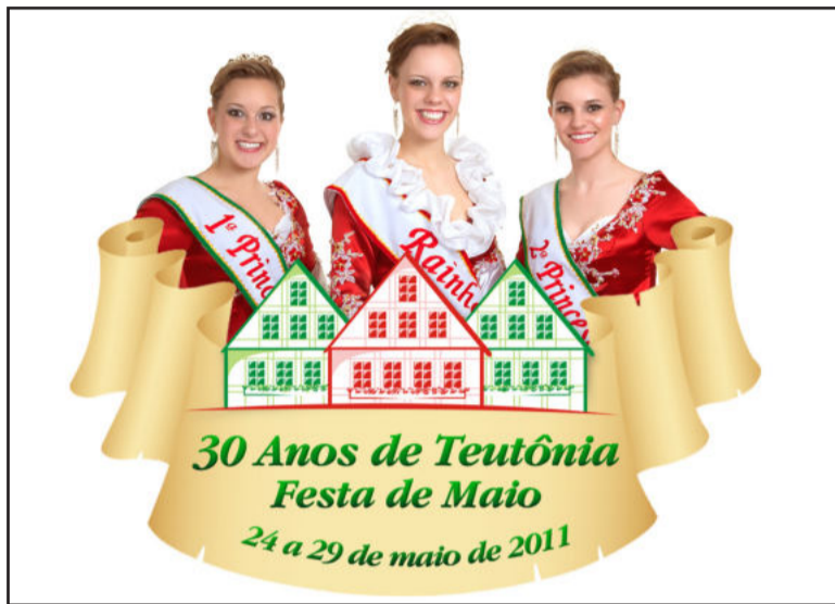
Logomarca da Festa de Maio de 2011

A procura por estandes para a exposição comercial, industrial e agropecuária é intensa e restam poucos espaços disponíveis. Os contatos podem ser feitos com a CIC Teutônia pelo telefone 3762-1233. A Festa de Maio 2011 é uma realização da administração municipal de Teutônia,