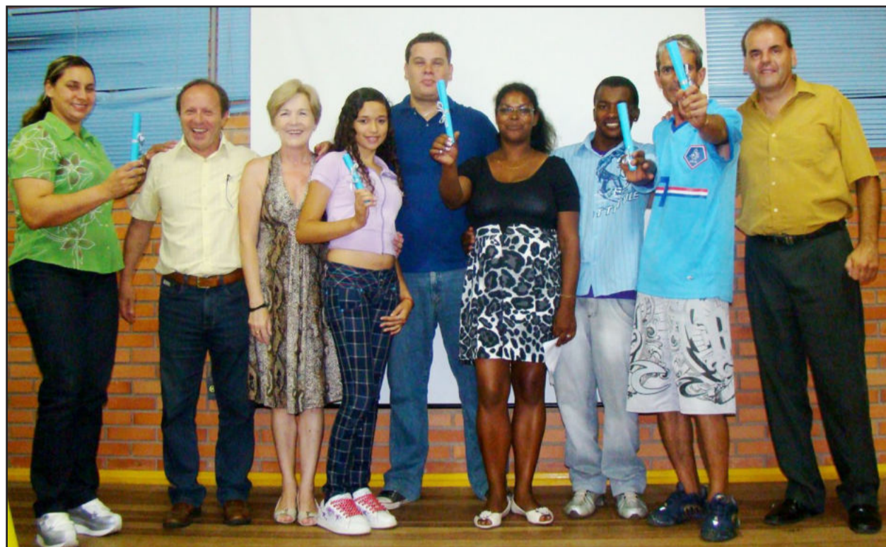
Primeira turma do EJA se formou em Fazenda Vilanova