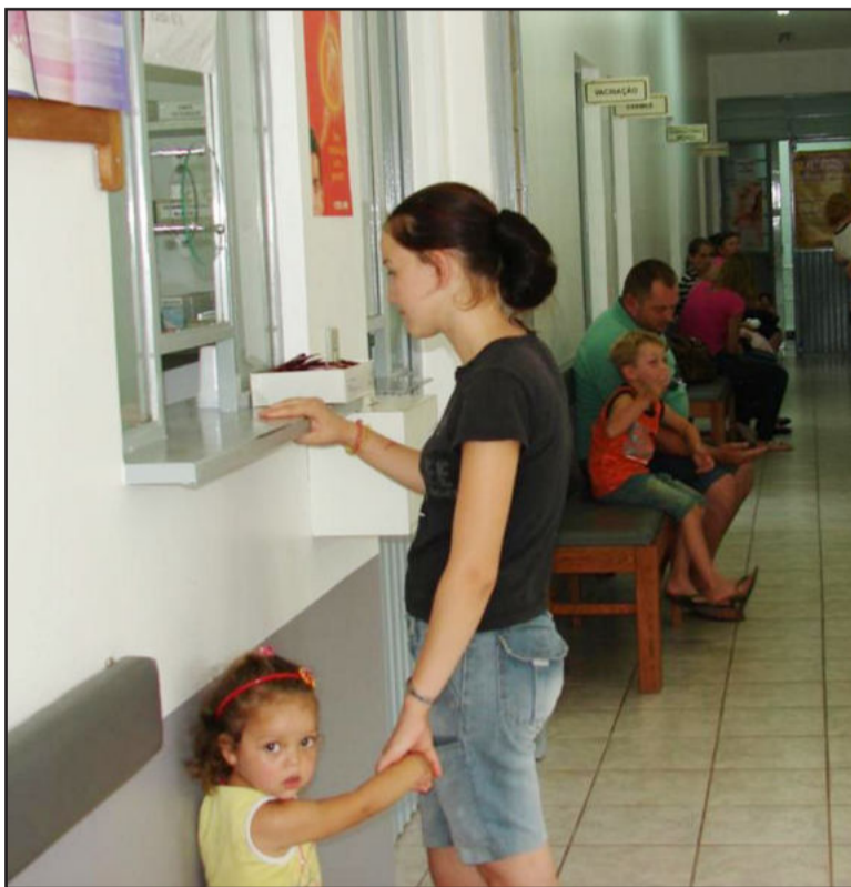
Atendimento no Posto de Saúde de Languiru é elogiado