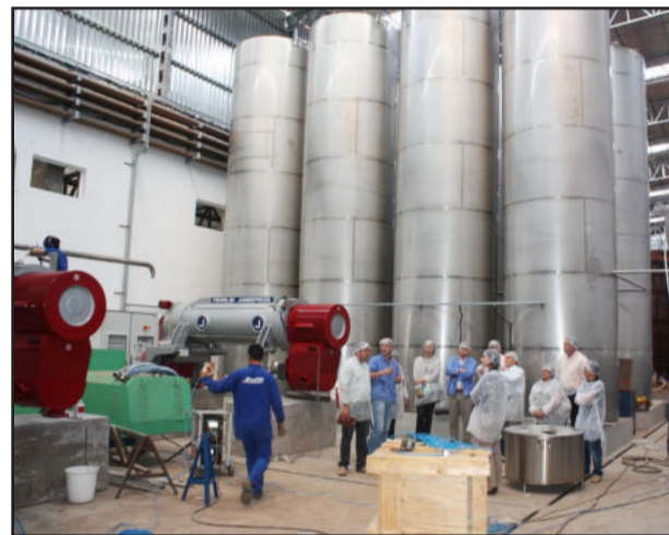
Apresentação dos novos equipamentos

Mais de 500 famílias serão beneficiadas com novos equipamentos para fabricação de suco