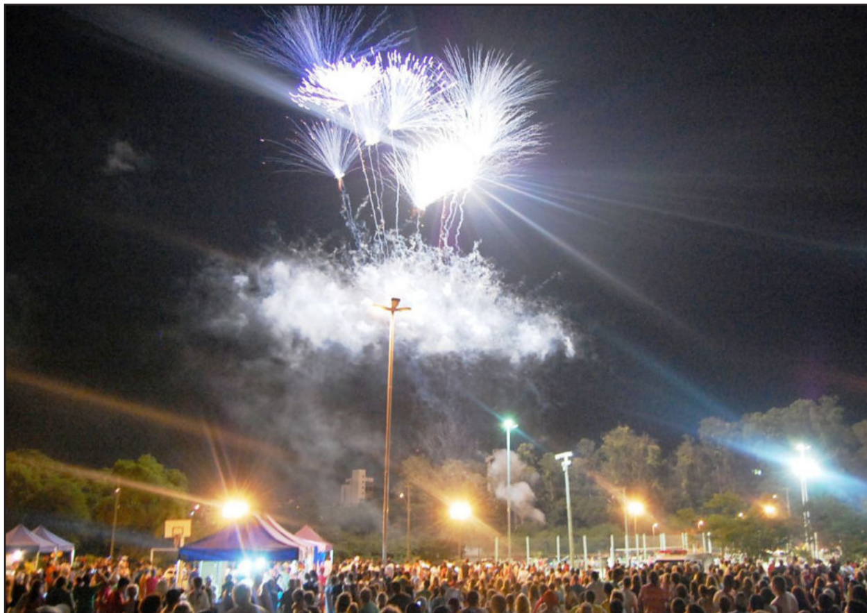
Concursos de beleza, shows musicais e fogos no lago dos Dick são as atrações