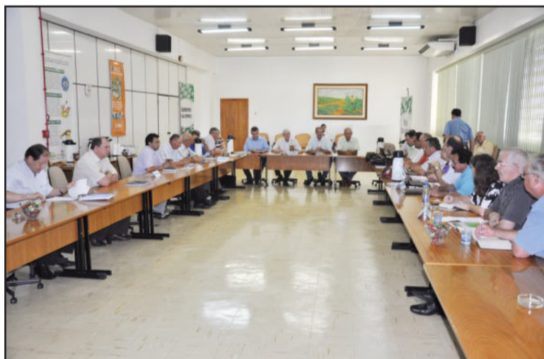
Reunião foi ontem na sede da Afubra

Em dezembro a comissão havia apresentado a proposta de 10,87%, que era uma estimativa do percentual do Índice Geral do Preço de Mercado (IGP-M), apurado pela Fundação Getúlio Vargas (FGV), no ano de 2010, sobre a tabela de preços praticada por cada empresa. “Com a apuração final deste índice em 11,32%, apresentamos este valor como reajuste da tabela