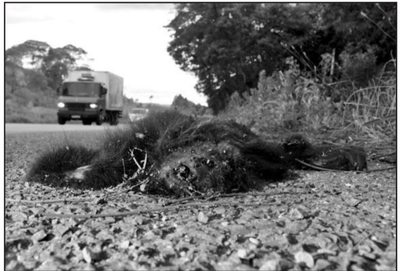
Animais: risco de morte por atropelamento

Para a maioria dos barbosenses e garibaldenses, por uma questão de hábito, a opção de chegar à praia continua sendo a Freeway, passando por Gravataí. Aos poucos a Rota do Sol deverá ser adotada por estes serranos e estes novos pardais poderão interferir em suas viagens de férias ao Litoral.