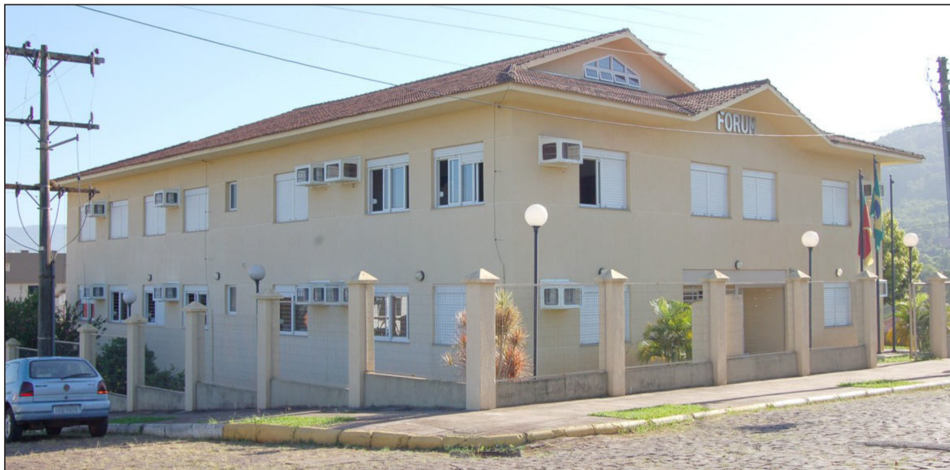
Às vésperas de completar um ano de instalação da Segunda Vara, Fórum de Teutônia demonstra celeridade no trâmite das ações. Página 2