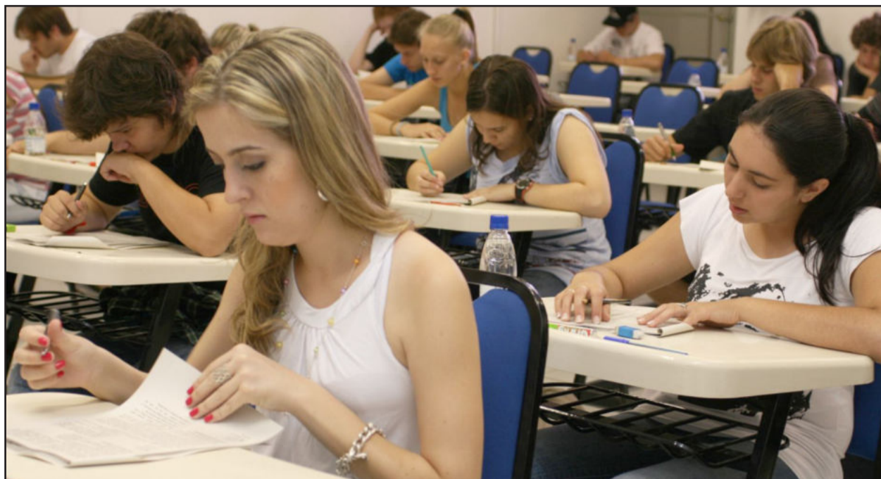
Prova consistirá de uma redação

Estão abertas, de 24 de janeiro a 14 de fevereiro, as inscrições para o Vestibular Complementar da Univates, que será realizado dia 20 de fevereiro. A prova consistirá de uma redação, que será aplicada das 8h30min às 11h30min, nos campi de Lajeado e de Encantado. Nesta edição, estão sendo oferecidas vagas em 34 cursos.