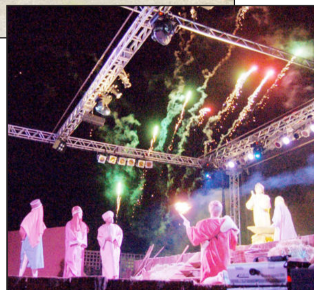
No ano passado, espetáculo encerrou com show de fogos

Em cada espetáculo "Janelas do Amor" haverá a participação e a apresentação da Orquestra Municipal de Teutônia, do Coral Municipal, do Coral da Certel, dos alunos das oficinas do Centro Cultural 25 de Julho, do grupo Danças e Ritmos e de alunos do Centro Municipal de Ensino Fundamental.