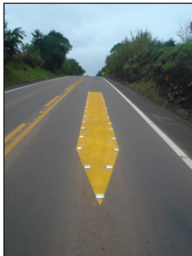
Ilhas virtuais alertam os motoristas na rodovia