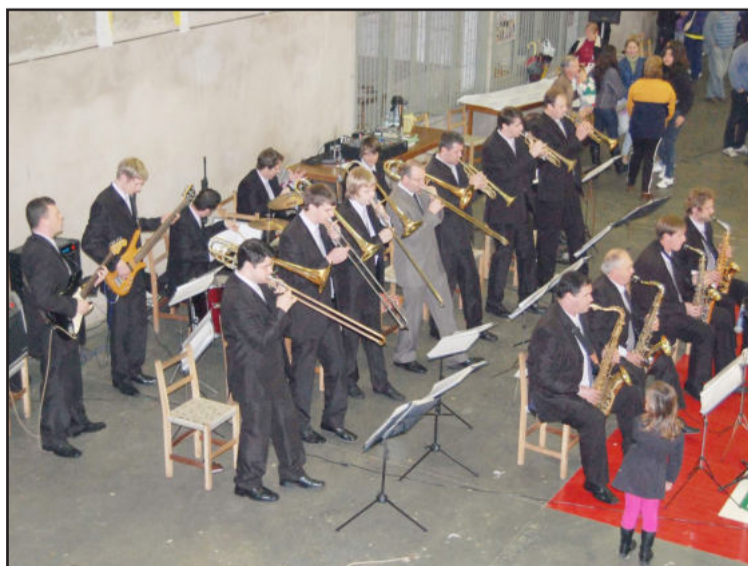
Orquestra Municipal de Imigrante

A Orquestra Municipal de Imigrante, com a regência do maestro Astor Dalferth, até o final do ano realizará diversas apresentações em eventos no Vale do Taquari. O projeto aprovado pelo Ministério da Cultura tem o apoio da Metalúrgica Hassmann.