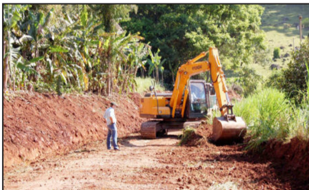
Estrada sendo recuperada em Linha Harmonia Alta

nas estradas: limpeza nas laterais, alargamento, patrolamento, colocação de saibro e brita. Em algumas localidades e de acordo com a necessidade, são recuperados ou reconstruídos bueiros danificados.