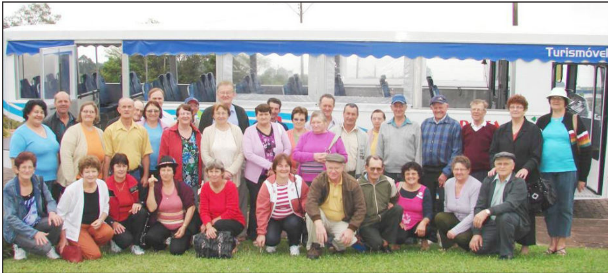
Grupo da Melhor Idade Alesgut fez tour com o Turismóvel

Cada vez mais fica evidenciada a ascensão do Turismo de Teutônia, que atrai visitantes dos mais variados lugares do Estado e País. Depois de um intenso trabalho da Secretaria de Cultura e Turismo, motivada em divulgar cada vez mais o Município, pouco a pouco Teutônia começa a despontar no cenário turístico, não apenas em âmbito regional, mas estadual e nacional.