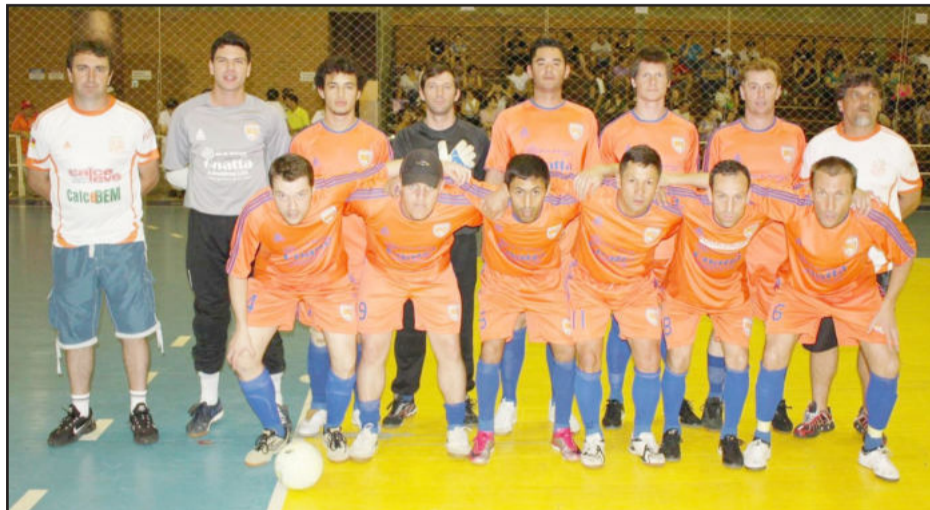
Gnatta/Tigres/Setor/Los Gringos também ganhou as duas semifinais e tem vantagem