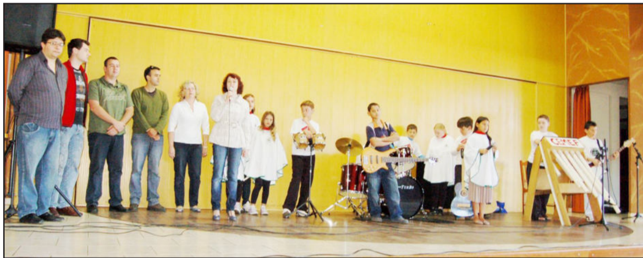
Inara (c) destacou a importância do projeto Dó Ré Mi e agradeceu apoio do Legislativo

A administração municipal de Teutônia, através a Secretaria de Educação, apresentou mais um importante e inovador projeto para incentivar atividades saudáveis para as crianças e jovens da cidade. Na manhã de sábado, dia 13, durante a Mostra Artístico-Cultural, houve o lançamento oficial do “Projeto Dó Ré Mi: tocando e transformando”. Esta é a vigésima-terceira ação do programa “Teutônia 29 Anos, 29 Ações”, desencadeado neste ano pelo governo municipal.