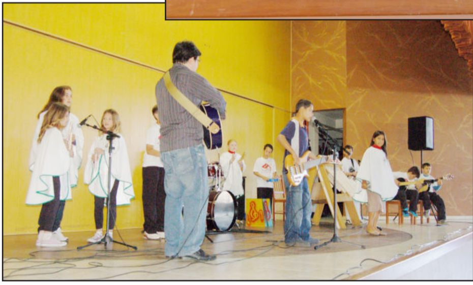
Orquestrinha do CEMEF fez a apresentação de abertura