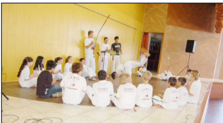
Grupo de Capoeira do CEMEF fechou as apresentações