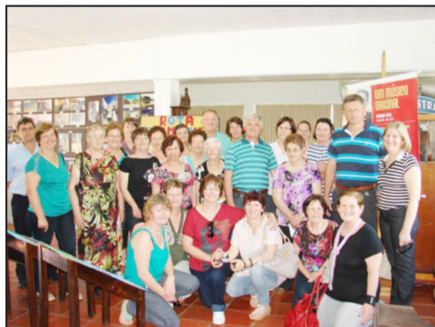
Comitiva do Município de Selbach foi recepcionada pelo secretário da Cultura e Turismo, Ariberto Magedanz

Grupos de estudantes e da terceira idade, bem como de cidades vizinhas diariamente fazem tour pelos bairros e pontos turísticos, a fim de desvendar um pouco do muito que Teutônia tem a oferecer aos seus visitantes.