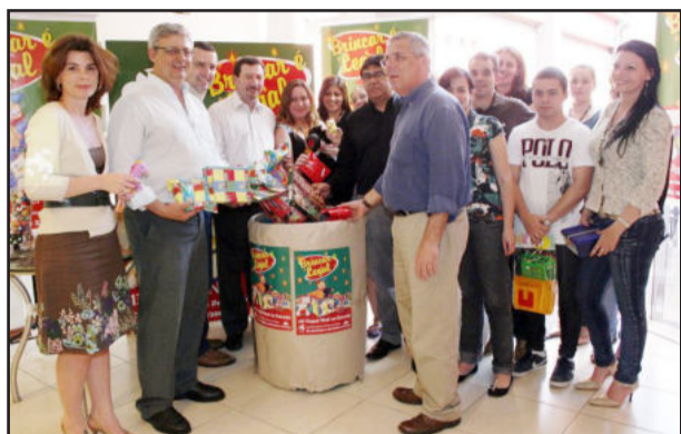
Lançamento da campanha

Tornar o Natal de milhares de crianças mais feliz. Com este objetivo o Consórcio Univias lançou, na sede da empresa, a 13ª edição da sua Campanha Papai Noel na Estrada.