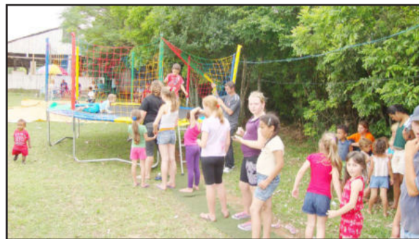
Criançada aproveitou as brincadeiras

A Empresa Corpe & Bittencourt - Eventos, de Paverama, realizou, nesta segunda-feira, dia 15, uma festa para as crianças. O evento aconteceu nas dependências do Esporte Clube Guaíba, na Cidade Baixa.