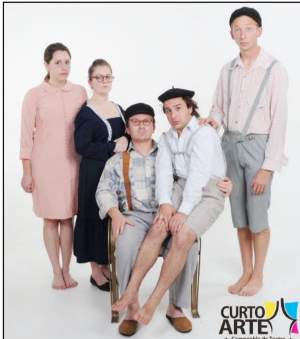
Elenco de Natal na Colônia

A Maestro Eventos traz para Teutônia a divertida e emocionante comédia "Natal na Colônia", uma peça teatral da Curto Arte Companhia de Teatro, da cidade de Dois Irmãos. A encenação será dia 5 de dezembro, domingo, às 19h, na Associação Pró-Desenvolvimento de Languiru (Sociedade de Água).