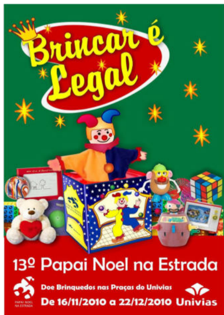
Cartaz divulga iniciativa

O Consórcio Univias foi criado em 1998 e é formado por três concessionárias - Sulvias (polo de Lajeado), Convias (polo de Caxias) e Metrovias (polo Metropolitano). Juntas, são responsáveis pela administração de 1.055 quilômetros da malha rodoviária concedida no Rio Grande do Sul.