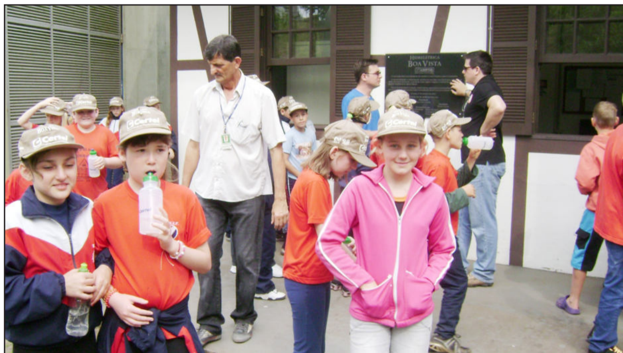
Alunos conheceram funcionamento da Hidrelétrica Boa Vista da Certel