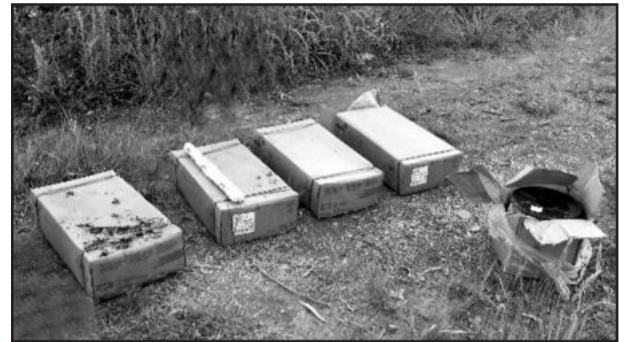
Caixas de dinamite encontradas em Garibaldi

A investida aconteceu por volta das 15 horas quando quatro