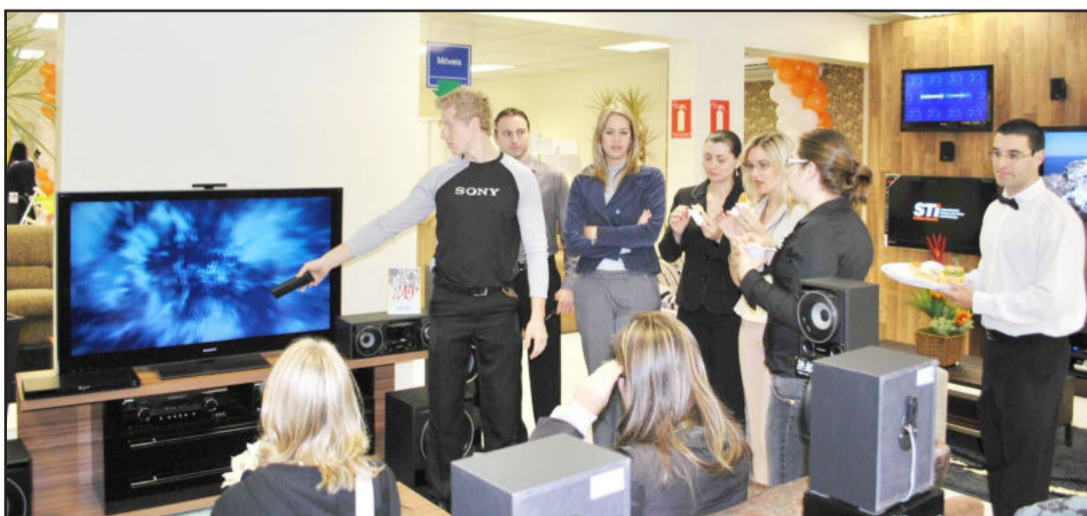
Clientes conheceram a TV em terceira dimensão