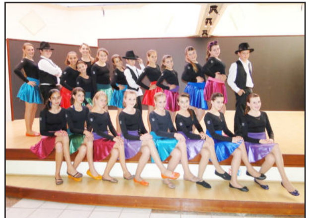
Grupo Argos categoria Júnior/Juvenil