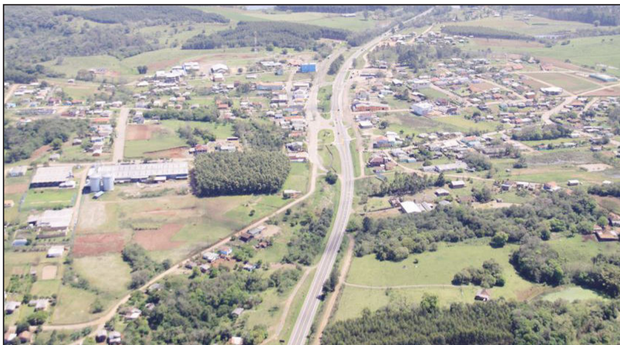
Município cresceu 30,5% em população nos últimos 10 anos

O Instituto Brasileiro de Geografia e Estatística (IBGE) encerrou oficialmente o Censo no Município de Fazenda Vilanova nesta sexta-feira, dia 12. Os resultados apresentados pelo instituto mostram um crescimento populacional de 30,5% em relação ao ano de 2000, quando a população era de 2.833 pessoas. Agora, Fazenda Vilanova possui 3.697 moradores e é o nono Município do Rio Grande do Sul que mais cresceu populacionalmente, em 10 anos.