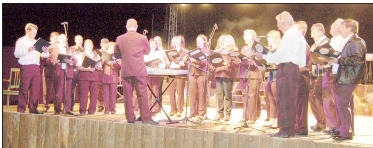
Coral Municipal também participa dos espetáculos de Natal

A promoção dos espetáculos natalinos "Janelas do Amor" e "Natal do Povo" é da administração municipal de Teutônia, com a realização do Centro Cultural 25 de Julho. Os eventos têm o apoio da Orquestra Municipal de Teutônia, do Coral Municipal, do Coral da Certel, do Cemef, do Grupo Danças e Ritmos e da Rádio Popular FM.