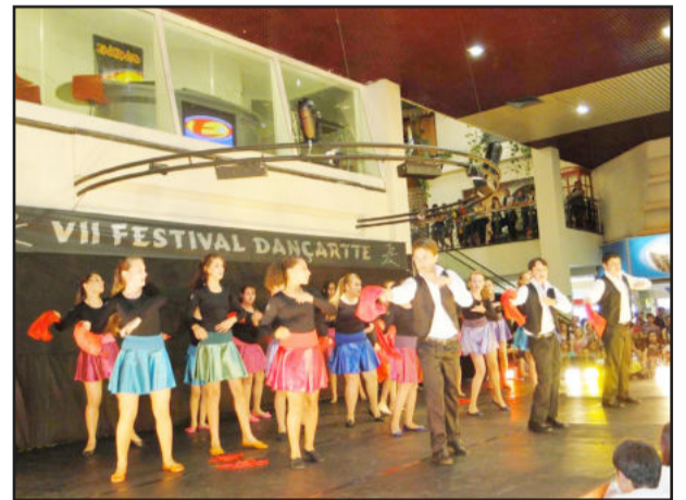
Grupo Argos em sua apresentação no Dançarte

O Grupo de Danças Argos, da Escola Municipal Teobaldo Closs participou, no dia 7, do 7º Dançarte, festival de dança organizado pela Arte Escola de Dança, reunindo 780 bailarinos de 17 cidades do Estado, representando 40 grupos, com mais de 100 coreografias. Para o Grupo Argos foi o primeiro festival de caráter competitivo. Em seu segundo ano de fundação, o grupo já acumula vasta experiência, tendo representado Teutônia em diversas mostras e exposições.