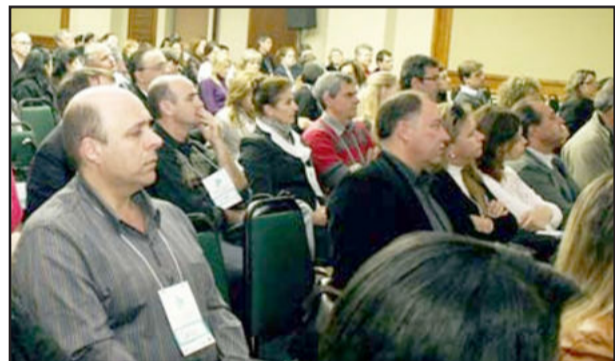
Kaplan (e) no Seminário da Saúde

O secretário ressaltou que o seminário foi positivo, "pois abordou diferentes formas de gestão da Saúde nos Municípios, os aspectos legais de atuação, assim como, a qualificação no atendimento aos usuários do Sistema Único de Saúde (SUS)". Lembrou ainda, que "os Municípios estão assumindo a Saúde no Brasil. Nós, por exemplo, em Imigrante, investimos entre 20 a 24% do orçamento municipal em Saúde, quando a