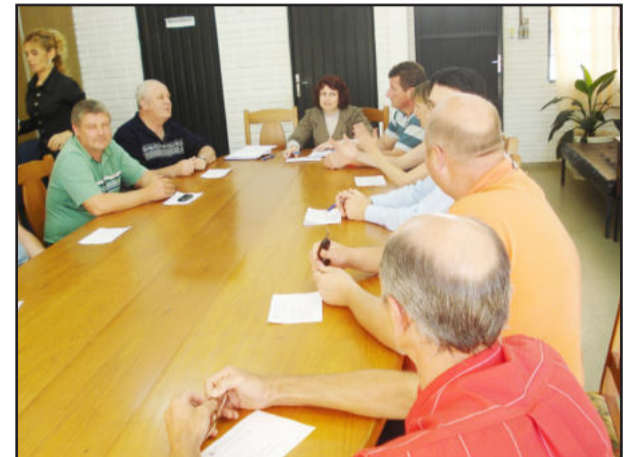
Reunião debateu aperfeiçoamentos no transporte escolar