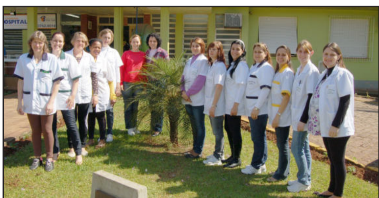
Equipe de profissionais tem novo uniforme