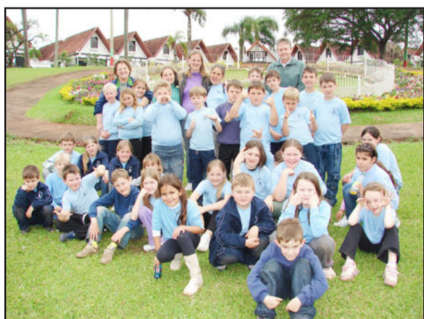
Alunos do primeiro ao quinto ano da escola Bento Gonçalves, de Boa Vista, visitaram Centro Administrativo

Na semana que passou, um Grupo da Pastoral do Município gaúcho de Selbach foi um dos que visitou Teutônia. Ao todo, 21 integrantes iniciaram o roteiro de visitas junto ao Museu Henrique Uebel e, posteriormente, em alguns pontos turísticos da Rota Germânica.