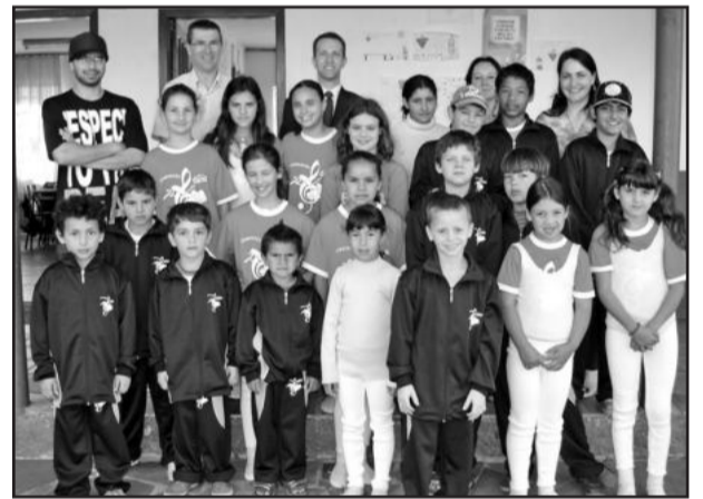
Crianças do Projeto Crescendo com a Dança ganharam uniformes

Através das aulas de dança, é possível desenvolver os aspectos motores, cognitivos e afetivo-sociais dos alunos, uti-