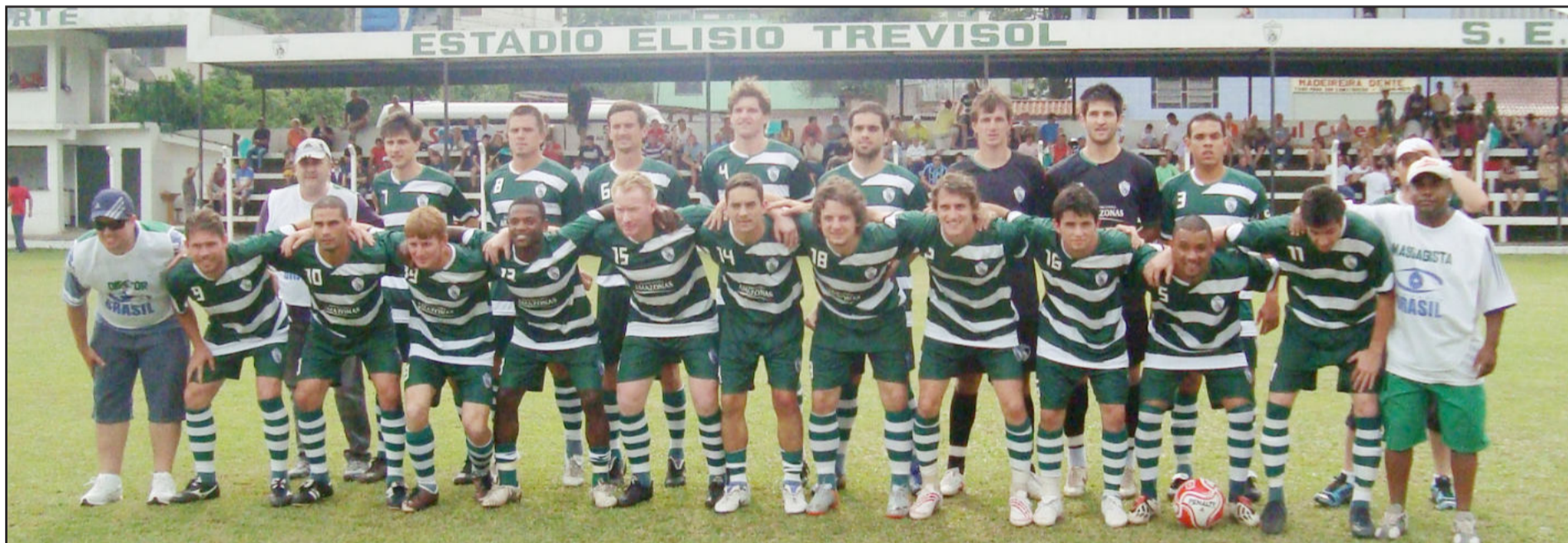
Regional Certel Aslivata - Série A