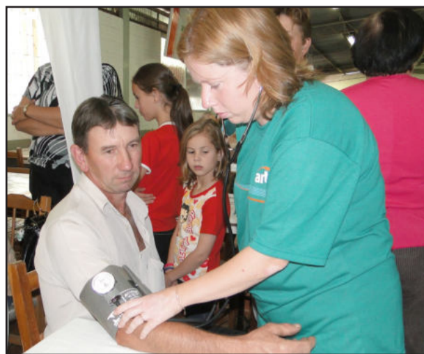
Medição de pressão arterial

O evento ainda teve participação da Famit, que ofereceu os serviços gratuitos de medição de pressão arterial e manicure. Ainda houveram dois shows de adestramento de cães da Pousada do Au Au, de Encantado, que são alimentados com Rações Languiru. A primeira apresentação foi de manhã, no pátio do Supermercado Languiru do Bairro Canabarro, e a segunda foi à tarde, no estacionamento lateral do Supermercado Languiru, do Bairro Languiru.