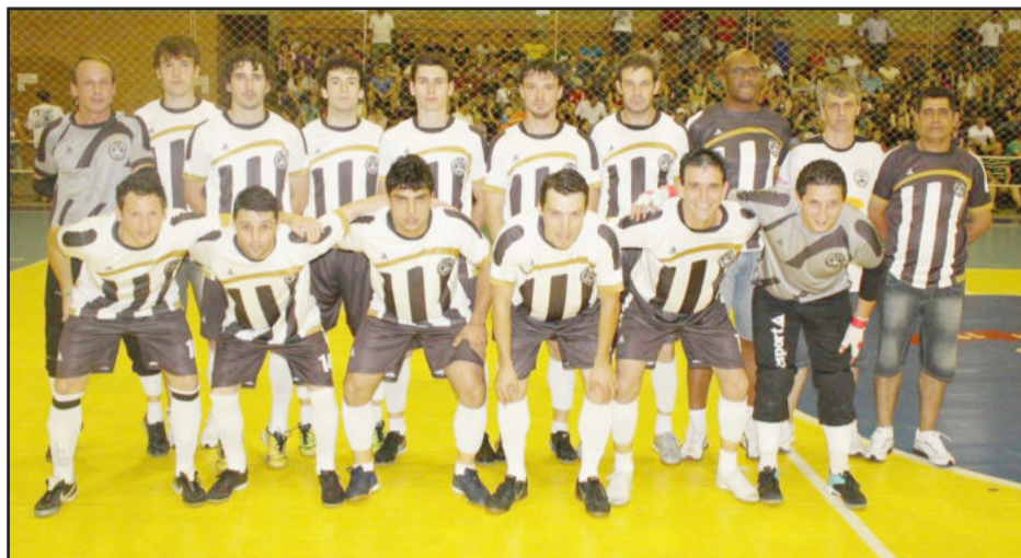
Udinese passou com tranquilidade pela semifinal