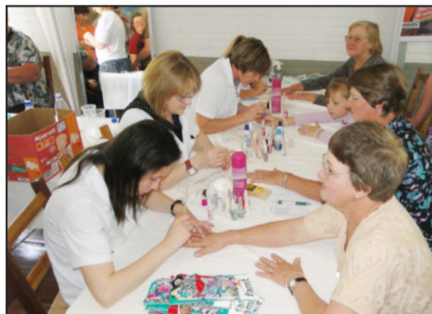
Manicure para as senhoras