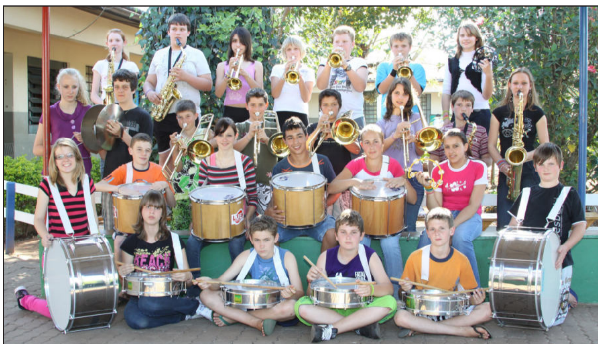
Alunos são contemplados com instrumentos musicais pelo Projeto Dó Ré Mi

Localizada na Rua Júlio de Castilhos, no Centro, a quinta Loja Certel na cidade tem foco em móveis e eletrodomésticos. Página 11