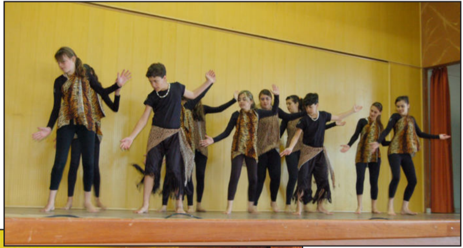
Grupo Argos da Escola Teobaldo Closs dançou o mundo em ritmo africano