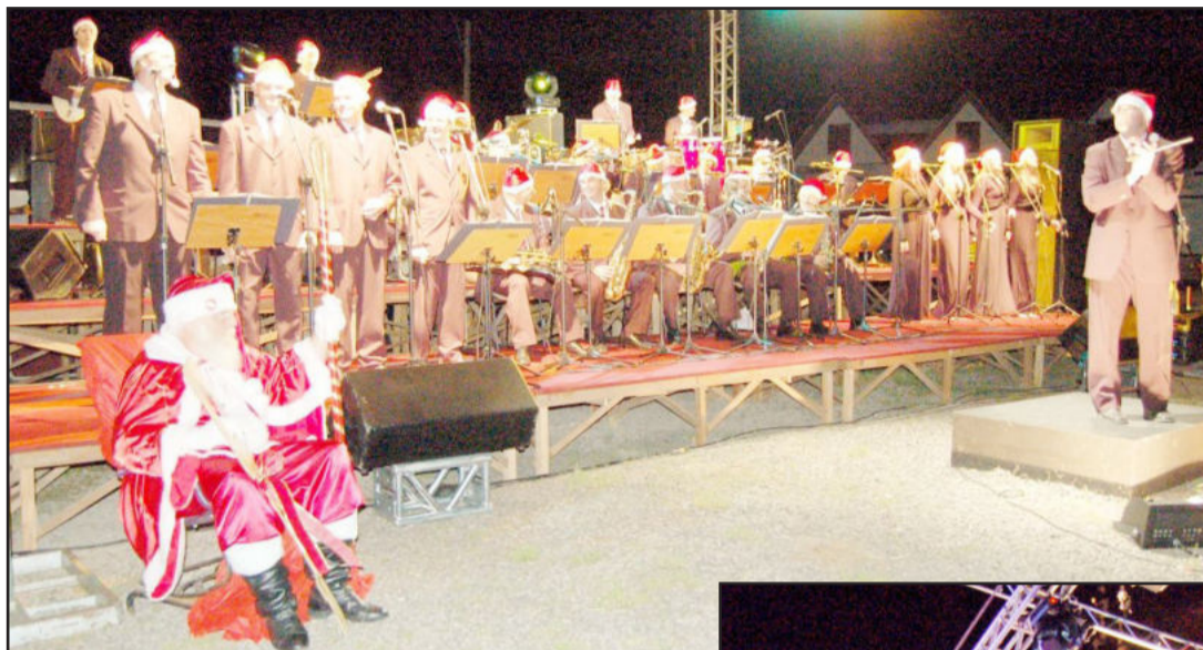
Orquestra Municipal de Teutônia participará dos espetáculos

A administração municipal de Teutônia organizou para o mês de dezembro uma sequência de seis eventos para preparar o espírito do Natal. A intenção é contemplar cada um dos seis bairros da cidade com uma atração especial, oportunizando às comunidades uma noite diferente, cheia de esperança, alegria, vida e fé. Serão cinco apresentações do projeto "Janelas do Amor" e mais o evento "Natal do Povo", todos desenvolvidos em parcerias com entidades e empresas da cidade.