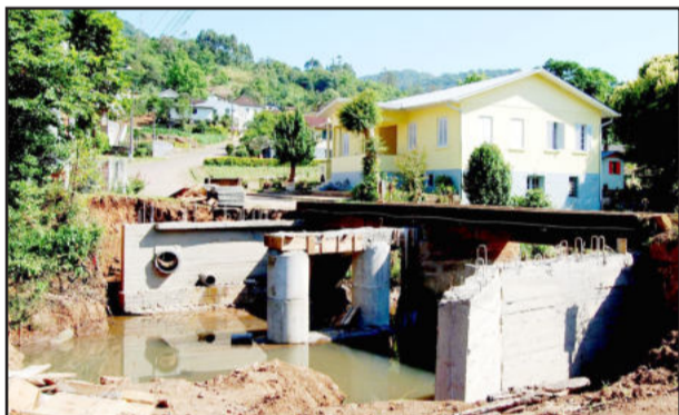
Recuperação de pontes no Bairro Daltro Filho

Entre outubro e novembro, cerca de 50 km de estradas foram recuperadas, nas seguintes localidades: Linha Progresso, acessos à Boa Vista 37 via Linha Rosenthal e Linha Imhoff, Linha Fassini, Linha Michels, Linha Imhoff, Linha Herval, Seca Baixa e Ernesto Alves. Atualmente os serviços estão concentrados na Harmonia Alta e as próximas localidades a serem contempladas serão Serrinha e Linha Rechts. Os principais serviços que são realizados