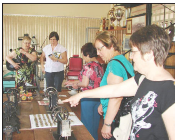
Peças do museu despertam curiosidade nos visitantes