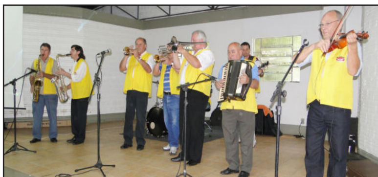
Musical MiMi animou o almoço

Independência, agilidade, conforto e economia estão em uma super promoção na Valecross!