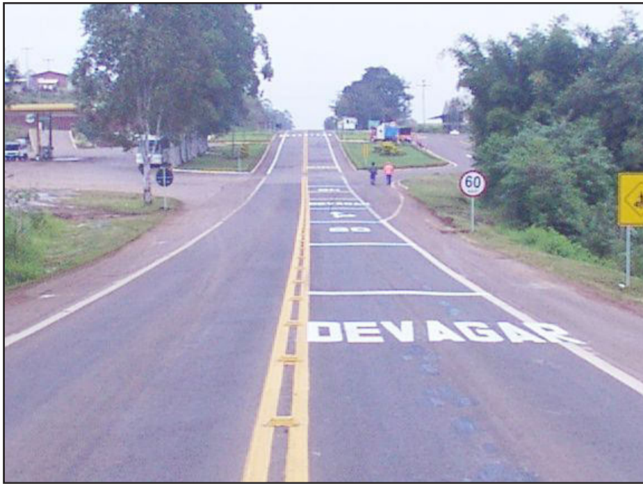
Sinalização realizada em Canabarro é estendida para novo trecho

A rodovia estadual RS-128 (Via Láctea), em Teutônia, já foi alvo de vários protestos e reivindicações por parte da população devido à periculosidade que apresenta. Pois, diversos acidentes são registrados constantemente, inclusive com vítimas fatais. O grande tráfego registrado no local, a imprudência dos motoristas e os problemas de sinalização são apontados como causadores da maioria destes acidentes. Responsável pela manutenção da estrada, o Consórcio Univas retomou as melhorias na sinalização.