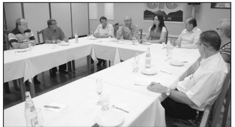
Encontro oficializou a nova entidade

Uma das primeiras iniciativas foi o registro de dois eventos: a Expogaribaldi e o Festival Gastronômico de Garibaldi. Além destas, uma das ações que podem ser desenvolvidas pela entidade é a Fenachamp. "Esta entidade pode