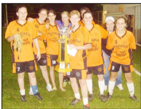
Arroio do Meio/Padaria Aurora, Vice-campeã