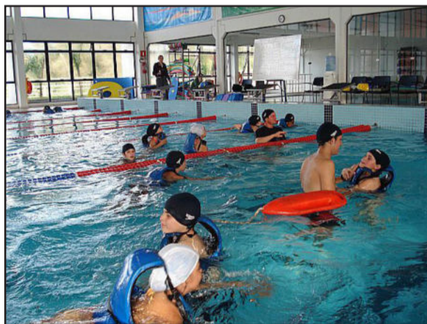
Atividades de defesa dentro da água