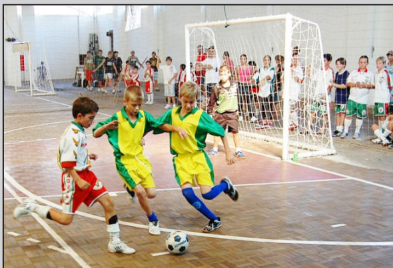
Em 2009 o Campeonato Piá teve 198 equipes participantes

A Prefeitura de Lajeado informa que seguem abertas as inscrições para o 22º Campeonato Piá de Futsal de Lajeado, promovido pelo Governo de Lajeado, sob a organização da Secretaria da Juventude, Esporte e Lazer (Sejel). As inscrições são gratuitas e podem ser feitas na sede da Sejel - Rua Bento Gonçalves, 524 -, ou pelo e-mail sejel@lajeado-rs.com.br , até o dia 23 de março.