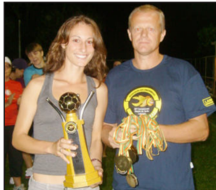
Flamengo, 4º Lugar