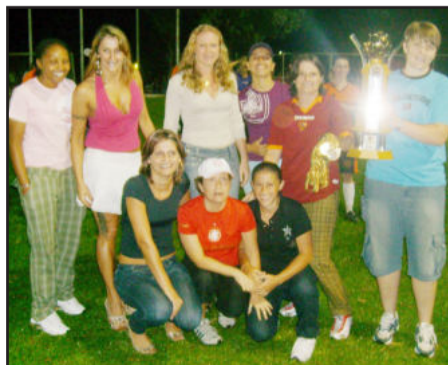
Academia Mega Sports, 3º Lugar