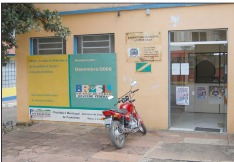
Cartório Eleitoral estará no prédio da Assistência Social no dia 25

O Setor de Identificação de Paverama comunica à população que a confecção de carteiras de identidade é feita somente uma vez por semana. Os interessados devem comparecer nas terças-feiras na parte da manhã, das 8h às 11h45, na Delegacia de Polícia. Nos demais dias da semana não há atendimento neste setor.