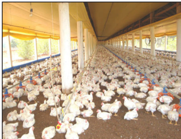
Setor é importante para a economia

A concessão do auxílio será oferecida por meio do Fundo de Desenvolvimento Rural (Funderal) e já foi aprovada