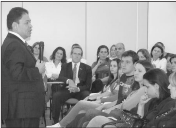
Furucho palestrou na Fisul

A Faculdade Fisul realizou na noite desta terça-feira, dia 16, o programa Fisul Personalidades, que contou com a participação do presidente do Grupo Record no Rio Grande do Sul, Natal Furucho. A palestra "O Profissional do Futuro" é um escopo do programa, que tem como objetivo aproximar os acadêmicos da Fisul das principais discussões contemporâneas, através de diferentes personalidades de renome regional, estadual e nacional, permitindo o contato com a diversidade de pensamentos e reflexões. O evento lotou o auditório da instituição e contou com a presença de alunos, professores, direção, autoridades e imprensa.