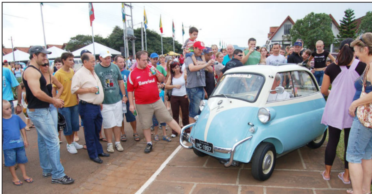
Veículos antigos e curiosos podem ser observados durante o encontro

Será realizado neste sábado e domingo o 6º Encontro Nacional de Veículos Antigos, que deverá reunir cerca de 700 carros do século passado, no Centro Administrativo de Teutônia, com previsão de público de 20 mil pessoas. Também haverá exposição de viaturas militares. No domingo será realizada a 2ª Subida de Montanha, competição de velocidade com automóveis antigos no asfalto de acesso à Lagoa da Harmonia. Página 8