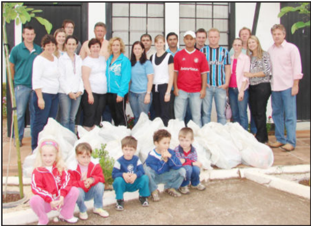
Entrega dos donativos arrecadados

O Departamento de Assistência Social de Teutônia registrou, com satisfação, o recebimento de mais de 300 quilos de alimentos, 100 litros de mantimentos e 25 pacotes de doações arrecadados como ingresso no 2º Gre-Nal da Amizade. O evento organizado pelos consulados gremista e colorado no Município ocorreu no domingo, dia 14, e repercutiu positivamente na comunidade, que aderiu à iniciativa e além de torcer pelos seus clubes deu um apoio significativo às entidades de Educação Infantil da cidade.