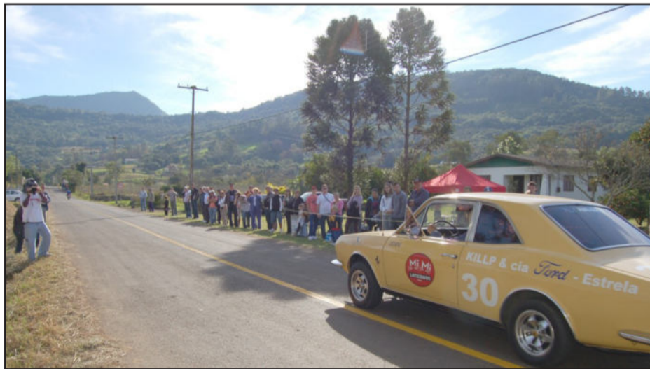
Em 2009, Décio Michel abriu a competição com um Corcel 72

Os pilotos largam nas imediações do campo do Fluminense e seguem por cerca de 2,5 quilômetros morro acima em velocidade. Aqueles que completarem o percurso em