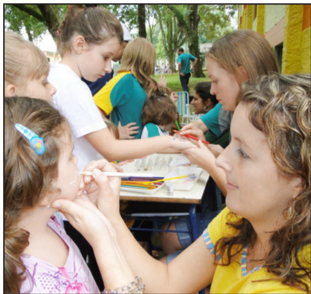
Professoras fizeram sucesso entre as crianças com suas pinturas