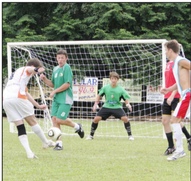
Jogos entre alunos e também com a participação dos professores foi uma das atrações do dia