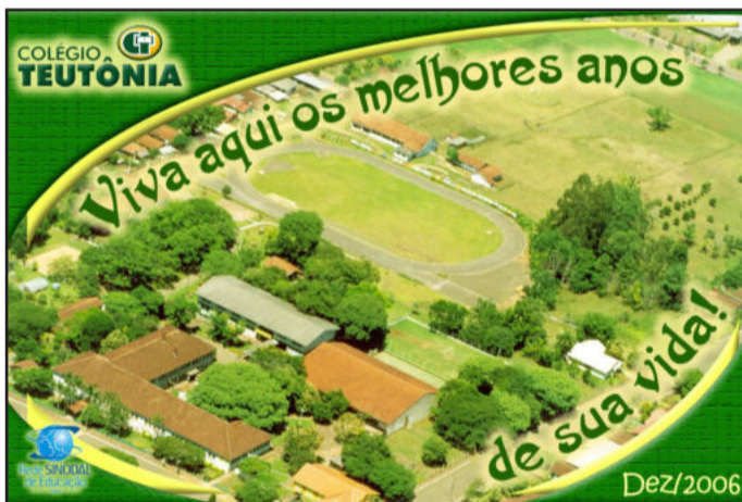
Foto Aérea do complexo educacional do Colégio Teutônia