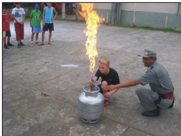
Atividades são desenvolvidas durante o ano com os alunos

O Projeto já formou mais de 150 bombeiros mirins durante os anos de 2008 e 2009 e formará mais 60 alunos neste ano.