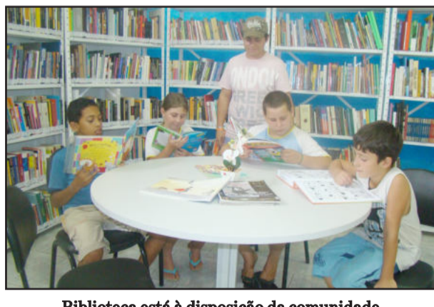
Biblioteca está à disposição da comunidade de segunda a sábado ao meio-dia

A Secretaria Municipal da Educação, Cultura e Desporto de Fazenda Vilanova disponibiliza gratuitamente à comunidade o Telecentro Comunitário e a Biblioteca Pública Professor Walter José das Chagas. O laboratório de informática está aberto de segunda à sexta-feira, das 15h às 19h e de terça-feira à sexta-feira, das 7h30 às 12h e das 13h30 às 19h. Estão abertas as inscrições para os cursos, com formação de turmas de todas as idades. Inscrições no Telecentro ou na Secretaria da Educação. Informações pelo telefone 3613 1116. A biblioteca atende de segunda à sexta-feira, das 8h às 18h, sem fechar ao meio-dia, e aos sábados