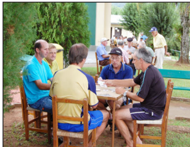
No reencontro de amigos "sombra e um bom carteadado"