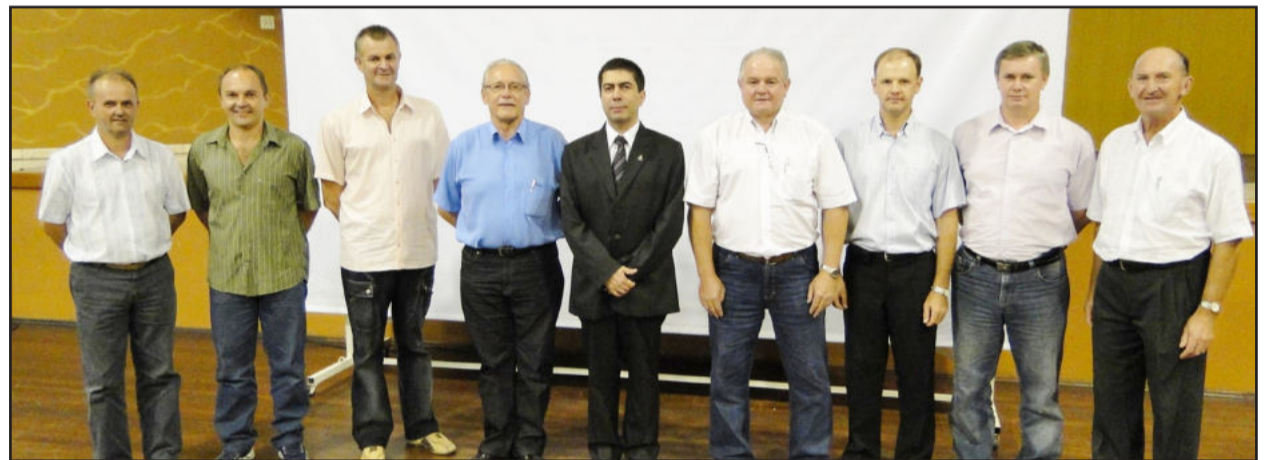
Integrantes da diretoria da ABOB para gestão 2010-2012

2009 foram beneficiadas 2.655 pessoas com internações hospitalares, sendo 76% destas pacientes do SUS. Na área de diagnóstico, foram realizados 113.498 exames. Em consultas, foram 27.711 atendimentos no Pronto Atendimento do HOB, enquanto que o Controle de Sinais e Aplicação de Injeções beneficiou 7,7 mil pessoas.