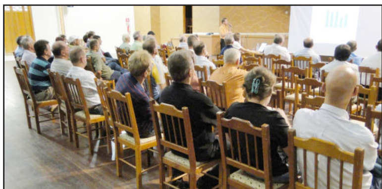
Assembleia ocorreu na Associação Pró-Desenvolvimento de Languiru

"Convém destacar que todas as ações realizadas estavam previstas em um Cronograma de Ações e Melhorias para 2009, com investimentos de R$ 2,7 milhões em recursos a serem captados. Como a ação de interdição não permitiu cumprir este cronograma, conforme ata de reunião da diretoria realizada em fevereiro de 2009, as ações foram realizadas com recursos próprios tendo em vista o restabelecimento dos diversos setores e serviços do hospital, não prejudicando a comunidade atendida. Assim, justifica-se o déficit contábil da entidade, que