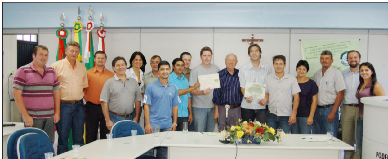
Entrega do Selo Carbono Neutro à Câmara de Vereadores de Teutônia

A Câmara de Vereadores de Teutônia foi agraciada, na tarde desta terça-feira, dia 16 de março, com o Selo Carbono Neutro, uma certificação conferida pela empresa MaxAmbiental, de São Paulo, que na região tem a participação da Certel. A distinção se deve às ações desenvolvidas para neutralizar as emissões de gases de efeito estufa.