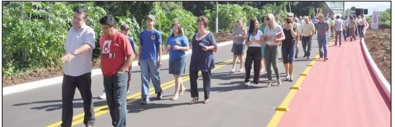
Caminhada inaugural realizada na pista asfaltada com ciclovia