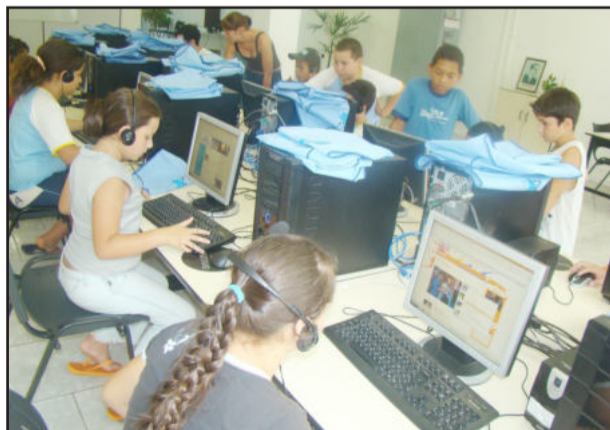
Telecentro abre inscrições para cursos de informática

A Secretaria Municipal da Educação, Cultura e Desporto de Fazenda Vilanova disponibiliza gratuitamente à comunidade o Telecentro Comunitário e a Biblioteca Pública Professor Walter José das Chagas. O laboratório de informática está aberto de segunda à sexta-feira, das 15h às 19h e de terça-feira à sexta-feira, das 7h30 às 12h e das 13h30 às 19h. Estão abertas as inscrições para os cursos, com formação de turmas de todas as idades. Inscrições no Telecentro ou na Secretaria da Educação. Informações pelo telefone 3613 1116. A biblioteca atende de segunda à sexta-feira, das 8h às 18h, sem fechar ao meio-dia, e aos sábados