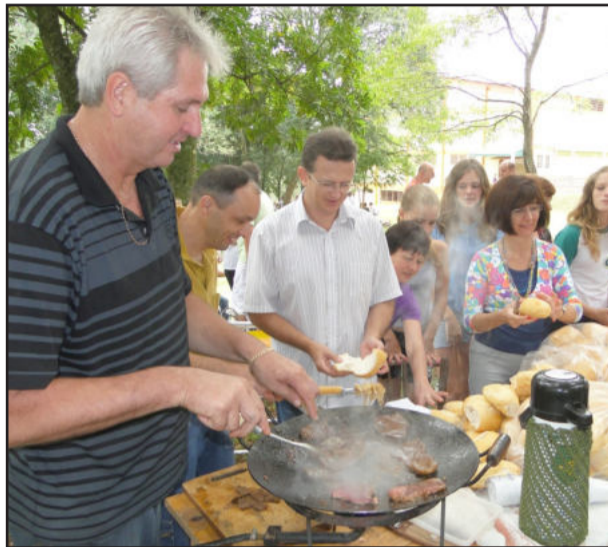
Almoço coletivo envolveu pais e alunos das diferentes turmas