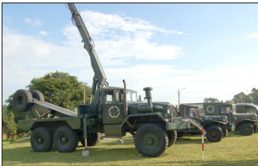
Viaturas militares já foram atração no ano passado e retornam em 2010