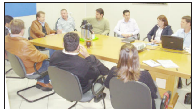
Grupo esteve reunido para tratar de detalhes do evento

No início do mês de maio a vice-presidência de Infraestrutura da Câmara de Indústria e Comércio (CIC) esteve reunida com representantes de revendas de automóveis do Município para tratar da realização da segunda edição do Feirão de Carros Seminovos. Na oportunidade foram apresentados os resultados da pesquisa de satisfação realizada com os expositores na edição de 2009 e a proposta para este ano. A estrutura para o evento, a ser realizado no Centro Administrativo Municipal no mês de junho, com data a ser confirmada, contará com espaço para as revendas participantes exporem seus veículos, praça de alimentação, brinquedos infláveis, ervateira e possibilidade de visita ao Museu Henrique Uebel.