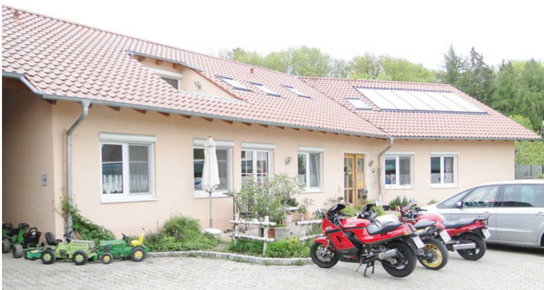
Alemanha: propriedades agrícolas agregam valor para sobreviver. Página 7