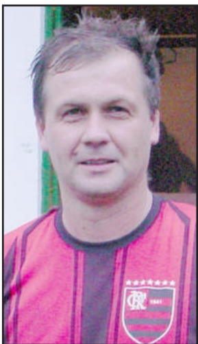
César marcou 2 gols

Na categoria feminino, no duelo entre Palmeiras e Flamengo, melhor para as meninas do Flamengo, que aplicaram uma goleada de 6 a 0. As "flamenguistas" irão enfrentar na final o vencedor na disputa entre Juventude e Palmeiras. O Juventude enfrentará o Flamengo, enquanto que o Palmeiras torcerá do lado de fora.