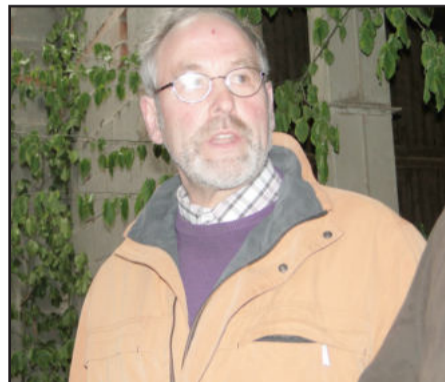
Schwab alterou foco das atividades