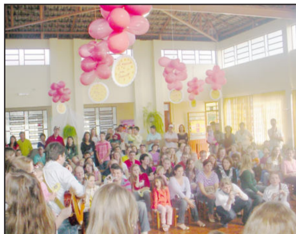
Mães vieram em grande número