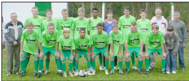
Sub-20 do Esperança perdeu de virada e está eliminado