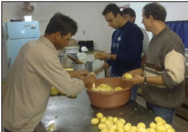
Eles descascaram as batatas para o almoço

Foi um dia em que a emoção, a alegria e descontração se evidenciaram. Às 11 horas foram realizadas diversas apresentações artísticas por alunos da escola. Ao meio-dia foi servido um delicioso almoço. Todo trabalho da cozinha ficou a cargo de alguns pais voluntários. As mães não precisaram colocar a mão na massa, desfrutando apenas do almoço. Apesar de alguns contratempos, o almoço foi muito elogiado pelas mães, inclusive a sobremesa, com leite a saçu, creme de leite, gelatina e sorvete.