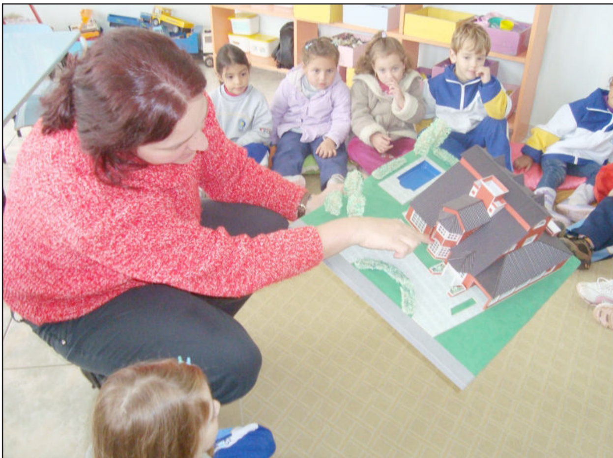
Profissionais falam de suas atividades para as crianças