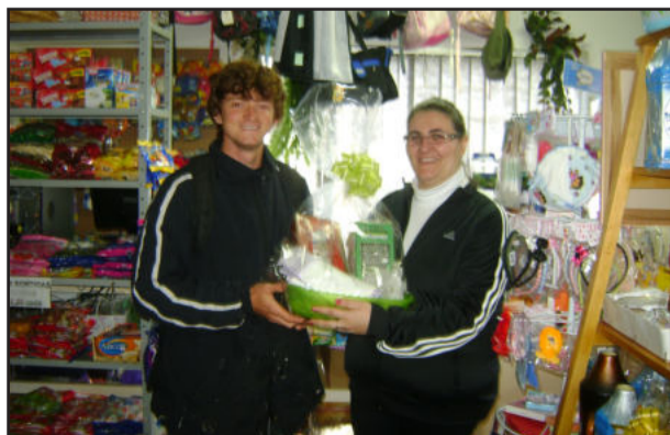
Entrega da cesta do dia das mães

O Sindicato dos Trabalhadores Rurais de Poço das Antas realizou, através da sua loja de produtos, uma promoção especial entre os clientes, alusivo ao dia das mães. Os clientes que compraram acima de R$ 20,00 na Loja do STR ganharam uma cautela para concorrer.