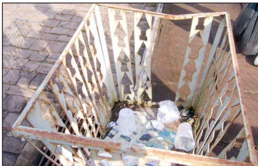
Restos de lixo remanescentes em lixeiras impróprias e mau estado de conservação

ção pôde ser comprovada através de resíduos como garrafas pet e copos plásticos, jogados em pátios de residências. As lixeiras abertas também revelam outro descuido, pois restos de lixo não são levados e ficam como “cartão de desvisita” aos turistas. A falta de poda em árvores e arbustos atrapalha o trânsito dos pedestres nas calçadas