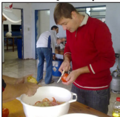
Saladas também ficaram a cargo deles