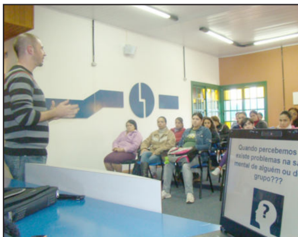
Palestra faz parte da Semana da Saúde Mental