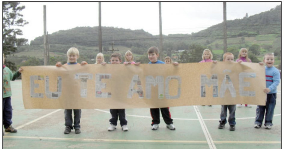
Homenagem dos alunos

Para alunos e professores este momento foi muito significativo, pois, além de ter a mãe na escola, os alunos também se divertiram, sentindo-se valorizados pela família.