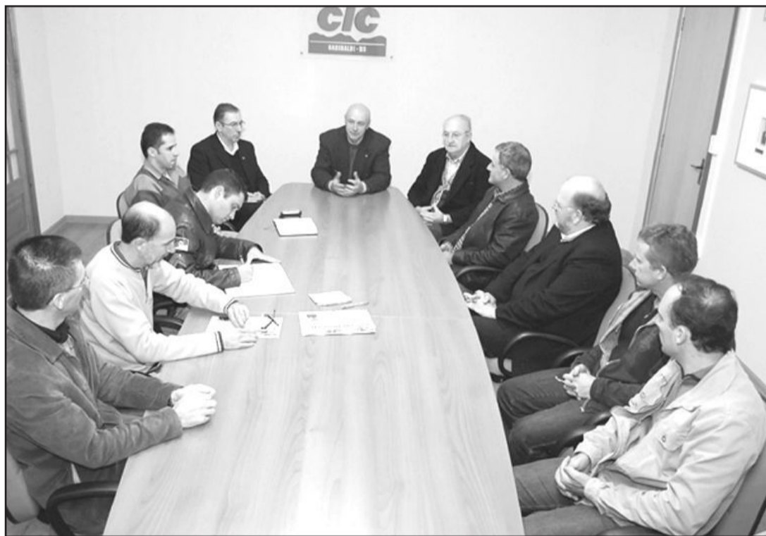
Reunião definiu a questão

O PPCI é obrigatório e, para facilitar o encaminhamento de seus associados e evitando a necessidade de deslocarem-se até Bento Gonçalves, a CIC colocou à disposição uma sala e equipamentos para que os Bombeiros daquela cidade (habilitados a fornecer o documento) atendessem em Garibaldi.