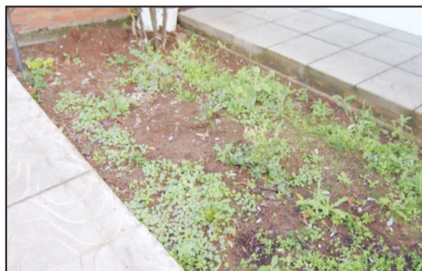
Fumantes jogam tocos de cigarro nos canteiros próximos à recepção do hospital