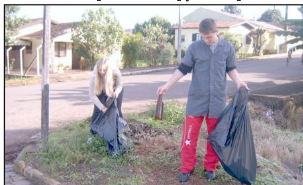
Todo tipo de lixo é encontrado em terrenos baldios