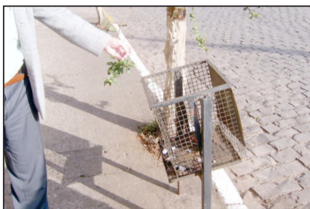
Lixeiras incompatíveis e em mau estado