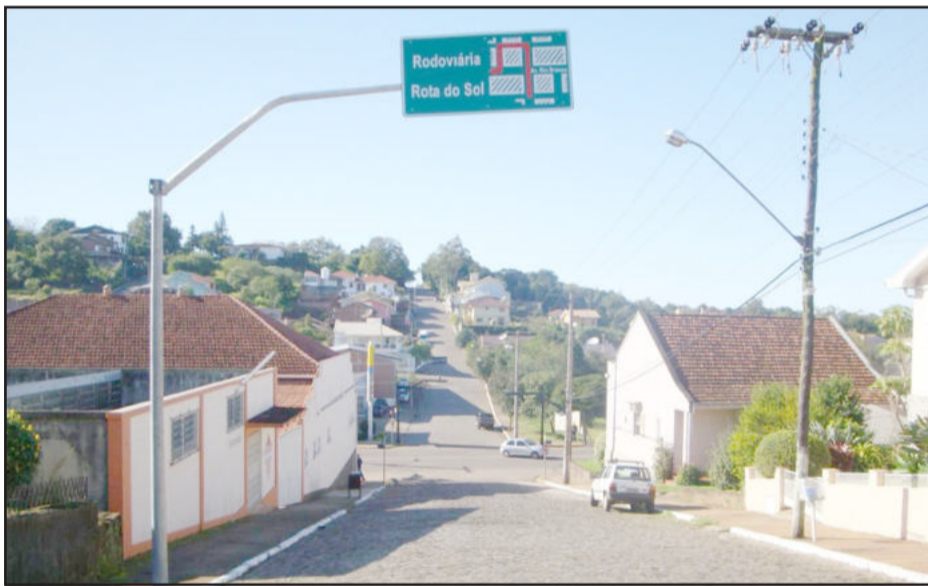
Placas indicativas de retorno já estão instaladas nas vias