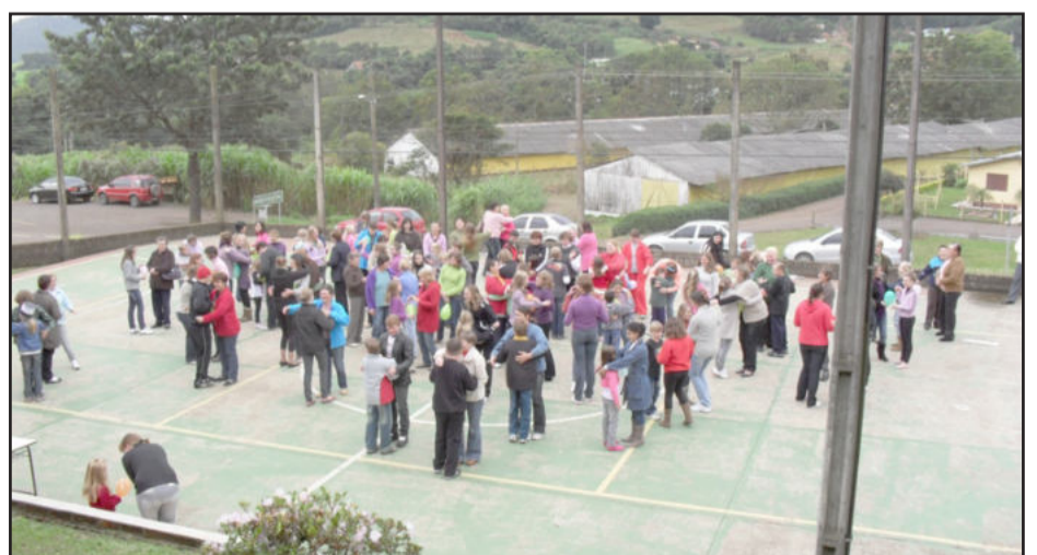
Integração entre alunos e mães