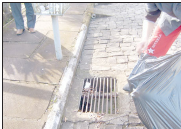
Lixo entope bueiros

“A população tem garganta para reclamar, mas não tem inteligência para fazer as coisas”, concluiu o grupo que atuou nesta ação relâmpaga diferenciada.