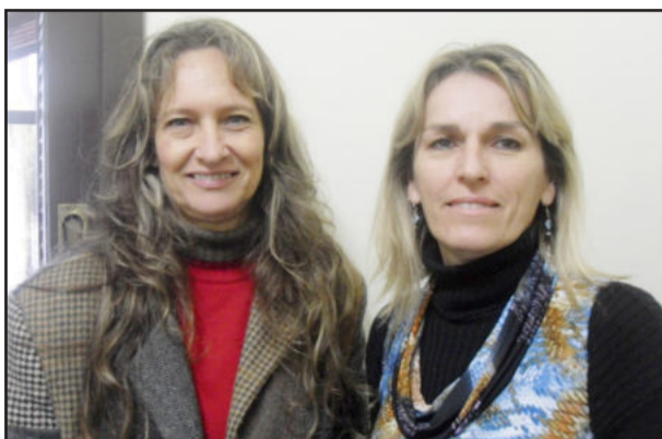
Profissionais coordenam os encontros

Ao longo da vida construímos nossa história alimentar, com alimentos que têm um significado emocional, familiar. É preciso negociar estes prazeres, associando-os a uma alimentação saudável, fundamental no processo de reeducação alimentar, pois hoje temos certeza da importância da boa nutrição no bem estar físico e emocional.