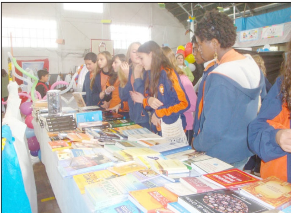
Literatura infantil foi a que mais atraiu leitores

A quarta edição da Feira do Livro de Estrela comercializou mais de 3,7 mil títulos. O encerramento do evento aconteceu no sábado, dia 15 e a literatura infantil foi a mais procurada pelos leitores. A Feira do Livro 2010 foi realizada nas dependências da Sociedade Ginástica (Soges), em Estrela.