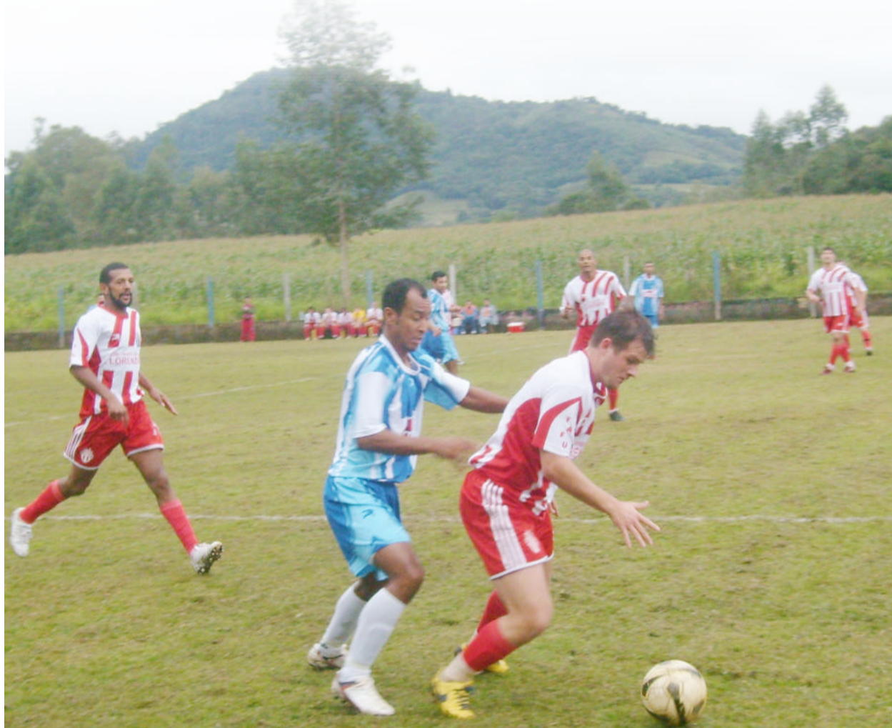
Juventude de Delei (azul) venceu a primeira final do Municipal de Teutônia por 3 a 2, com o gol da vitória marcado aos 48 min do segundo tempo, domingo, na Vila Cuba. Atlético Gaúcho de Leandrinho (com a bola) precisará de 2 vitórias no jogo da volta, dia 3 de junho, no Loteamento 8. Foi uma grande partida de futebol. Leia no Caderno de Esportes.