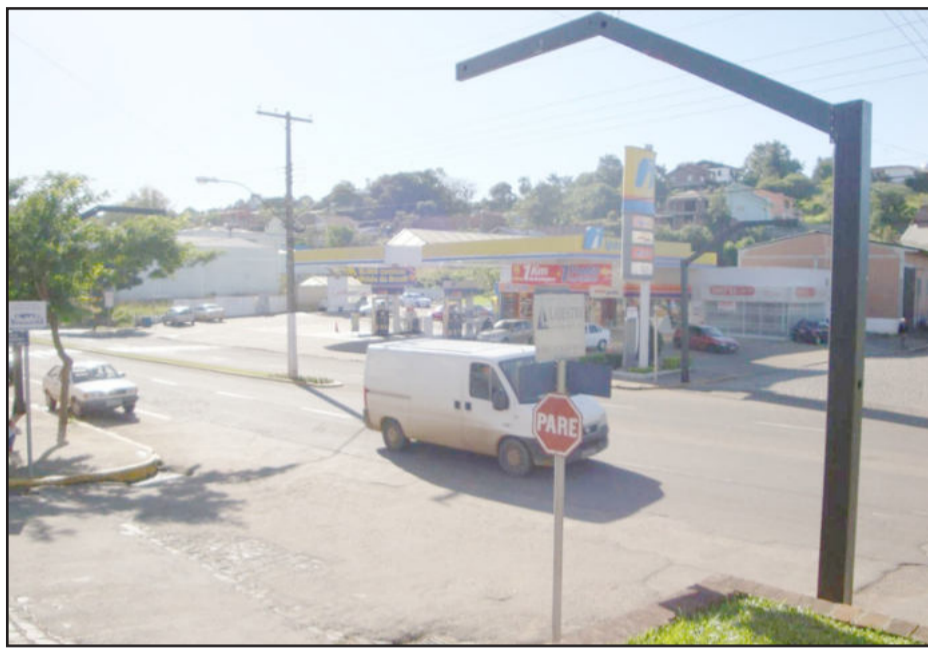
Sinaleiras na Avenida Rio Branco devem estar em funcionamento nos próximos dias

Com a instalação algumas mudanças no trânsito da avenida devem ocorrer para garantir a segurança dos pedestres e motoristas. Uma delas é o fechamento definitivo do vão no canteiro central em frente ao Móveis Ruschel e a do vão do canteiro próximo a Imec (Oriental), com os blocos de concreto, evitando o contorno e a travessia em ambos os pontos. Os motoristas que transitam na via devem observar a sinalização e as placas que já indicam como ficará para fazer os retornos e ingressar nos bairros.