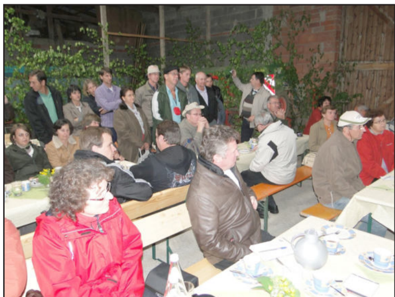
Grupo ouviu explicação sobre turismo rural

Hoje são nove apartamentos, com capacidade para alojar até 30 hóspedes, dos quais três foram adaptados para pessoas com necessidades especiais. Os hóspedes podem cozinhar nos seus apartamentos, desde que tragam os insumos para as suas refeições. Não é oferecido serviço de camareira, mas tem café da manhã para os que desejarem. Há também serviço de sauna e massagem, prestado por profissional que vem atender na propriedade. Além disso, os turistas podem usufruir de parque infantil, jardim, serviço de estética, trilha ecológica e aproveitar a estada para visitas à parte histórica e cultural de Herbsthausen, já que a propriedade localiza-se perto da cidade. A média de permanência dos hóspedes é três a quatro dias e uma diária, com café da manhã, custa 25 euros. Todo o serviço é executado pelo casal, com auxílio de familiares, que são remunerados por hora trabalhada.