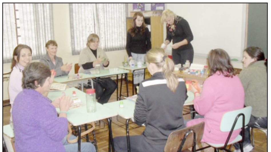
Oficina de artesanato