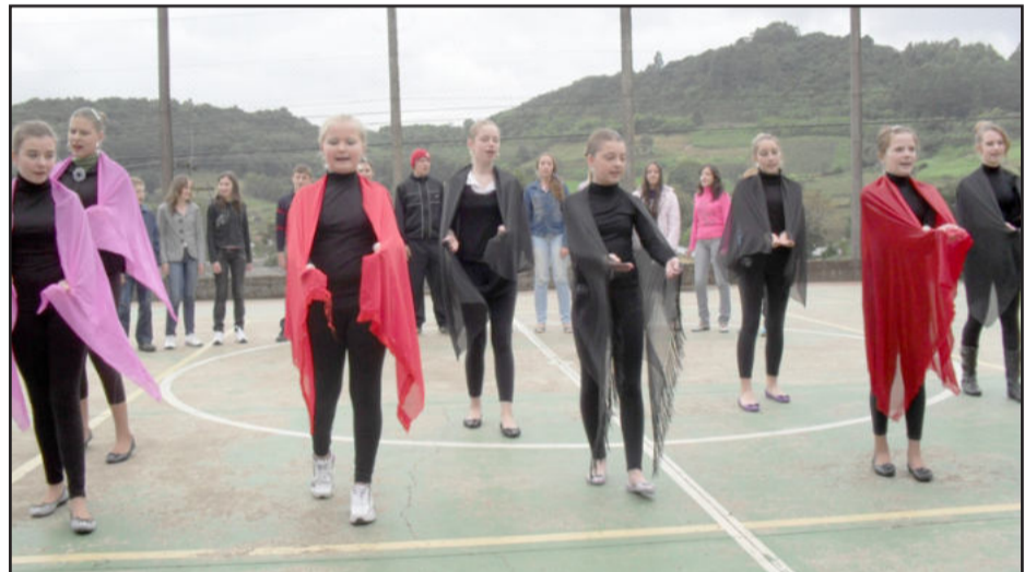
Apresentação em homenagem às mães