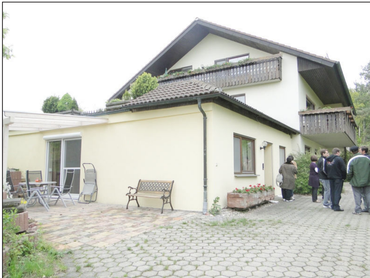
Propriedade recebe hóspedes da cidade