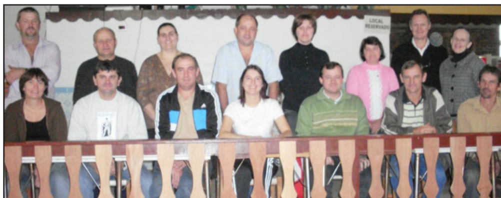
Nova diretoria da Sascpa

E m Assembleia Geral Extraordinária realizada na manhã de domingo, dia 16 de maio, a Sociedade de Assistência Social e Cultural Poço das Antas (Sascpa) escolheu e empossou sua nova diretoria. Uma nova equipe está disposta a encarar desafios e implantar inovações.