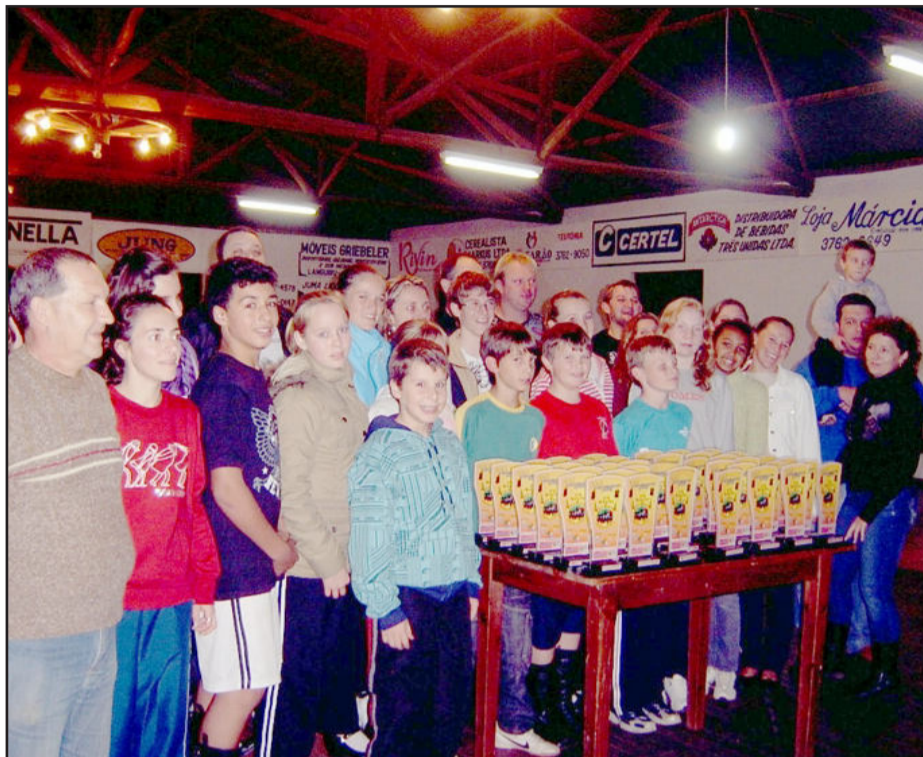
Invernada artística com os troféus

O grupo agora participará, no dia 30 de maio, do Rodeio de Muçum e também já se prepara para a grande festa com a participação da banda Os Serranos, no dia 10 de setembro. Conforme Roger, o grupo está à disposição de quem quiser participar de alguma das várias modalidades que envolvem o CTG.