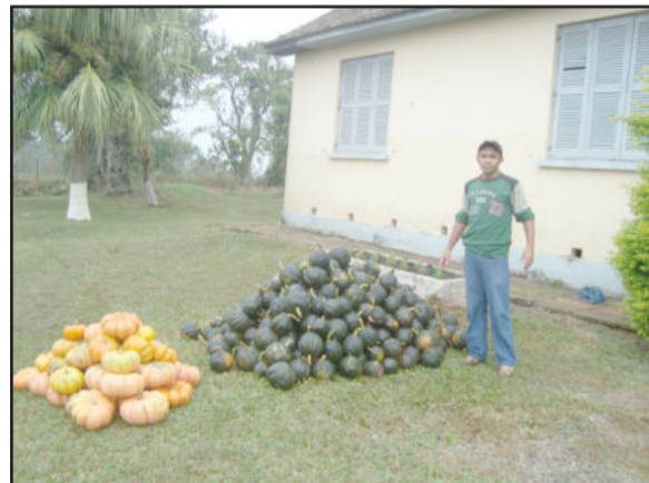
Técnico agropecuário coordena produção e fornece alimentos para as escolas municipais

A alimentação escolar dos mais de 600 alunos da rede municipal de ensino de Fazenda Vilanova é complementada com produtos orgânicos produzidos pela horta do projeto experimental agrícola da Prefeitura. A parceria entre as secretarias da Agricultura, através do setor técnico, e da Educação, representada pela coordenação da alimentação escolar, a administração abastece os refeitórios das escolas com verduras, frutas e legumes produzidos em área de propriedade do Município em Colônia Cardoso.