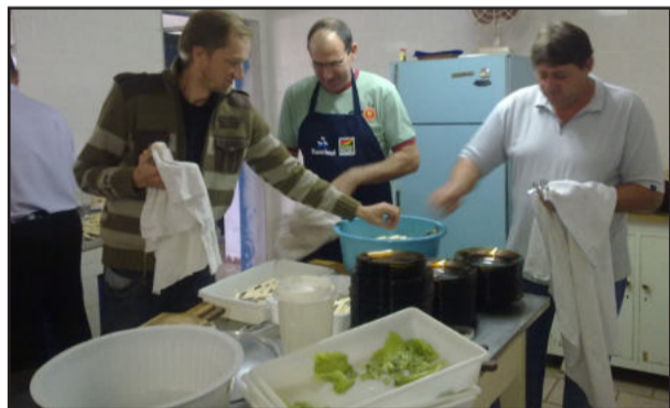
Lavar e secar a louça foi tarefa deles