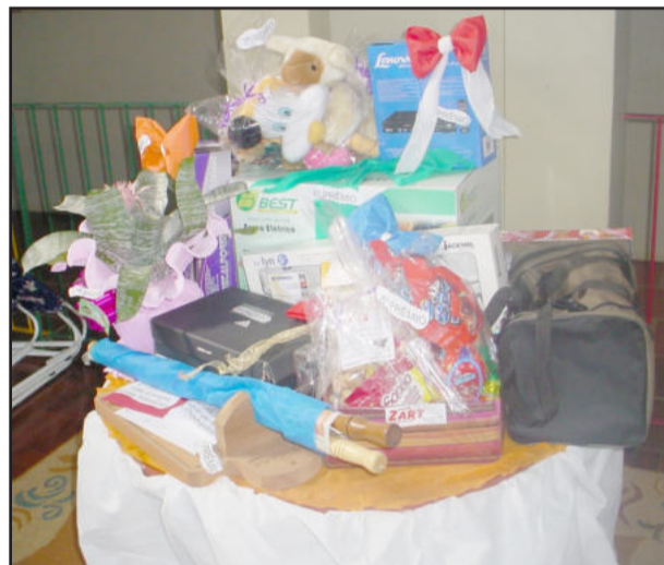
Sorteio de prêmios através de rifas