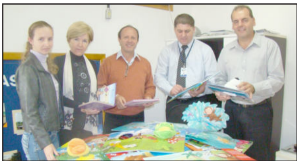
Mais 353 livros para os estudantes do Município

A administração de Fazenda Vilanova acrescentou 353 livros às bibliotecas infantis das escolas municipais. Na aquisição foram investidos R$ 3.496,00 para contribuir com a qualidade do ensino oferecido às crianças do Município. A aquisição dos livros faz parte do Programa Nacional de Assistência ao Ensino.