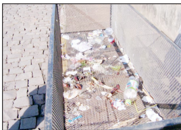
Restos de lixo ficam como “cartão de desvisita” aos turistas