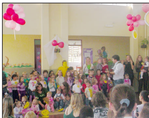
Apresentação dos alunos