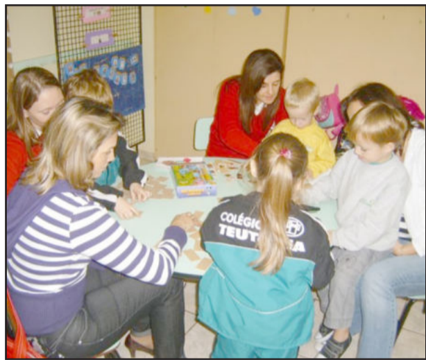
Mães e filhos foram alunos em atividades especiais nas salas de aula

O Colégio Teutônia realizou sua tradicional programação especial pelo Dia das Mães, eventos que integram o Projeto Mamãe na Escola e contaram com a participação dos alunos e suas mães. “Foram momentos de muito carinho e emoção para mães e filhos, com homenagens, apresentações artísticas e trabalhos artesanais como presente”, destacam as professoras envolvidas com a programação.