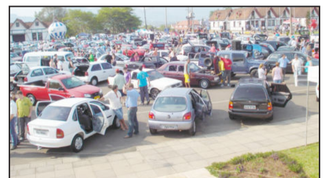
Evento iniciado em 2009 contou com a participação de sete revendas de automóveis do Município e gerou mais de R$ 1 milhão em negócios em um final de semana

Entre outros detalhes a serem apresentados nos próximos dias está a definição da financeira que irá participar do evento, bem como empresas do ramo de motocicletas, oficinas, auto-peças, acessórios e som automotivo. Mais informações podem ser obtidas junto à Secretaria da CIC, pelo telefone (51) 3762-1233 ou pelo e-mail ciceutonia@ciceutonia.com.br