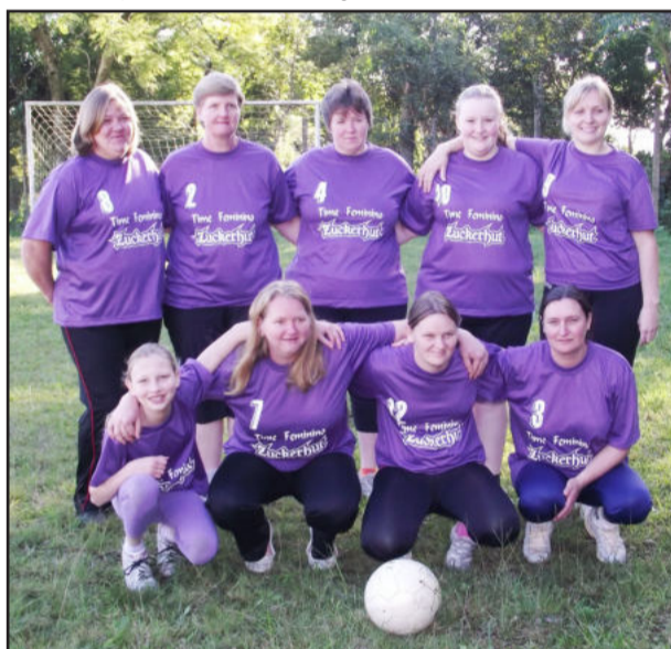
Equipe feminina de futebol de Linha Ano Bom Alto

Na localidade de Linha Ano Bom Alto elas seguiram a dica. As mulheres estão se divertindo com a bola nos pés. Todos os sábados à tarde, elas provam que o futebol não tem sexo nem idade, pois as atletas têm entre 10 a 45 anos. "É muito bom ver que mulheres têm interesse em correr e querer jogar, praticando uma atividade física, independente da idade", destaca o prefeito de Colinas, Gilberto Keller, apoiando a iniciativa. Para homenagear as origens, o nome da equipe não podia ser diferente. Elas escolheram Zuckerhut, nome pelo qual é conhecido um morro alto da localidade, cuja tradução popular significa "chapéu de açúcar".