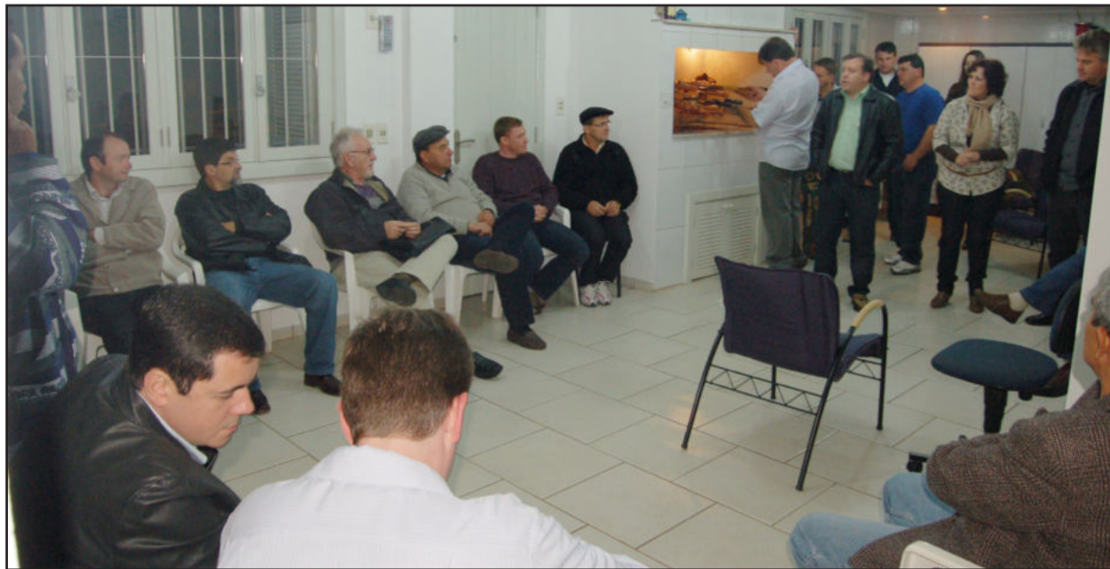
Em reunião na noite desta quinta-feira, PT anunciou adesão ao governo municipal de Teutônia

O diretório municipal do Partido dos Trabalhadores (PT) de Teutônia promoveu, na noite desta quinta-feira, dia 16 de junho, um encontro para anunciar sua adesão ao projeto do atual governo municipal, liderado pelo prefeito Renato Airton Altmann. O PT é o terceiro partido que se soma à situação desde o início do mandato, em 2009. Primeiro foi o Democratas (DEM), e no ano passado também emprestou seu apoio o Partido Socialista Brasileiro (PSB).