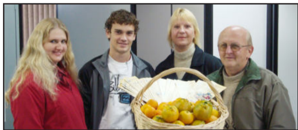
Equipe do Programa de Formação de Pomares com o cesto cheio de frutas referentes a colheita realizada neste ano

Plantas cultivadas em 2009 já geraram frutos