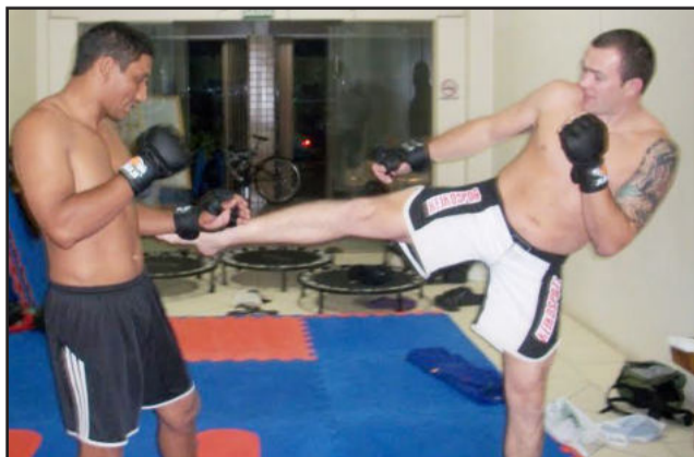
Treinos diários de cinco horas em véspera de luta