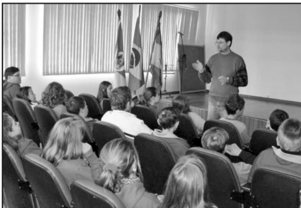
Alunos da Escola Duque de Caxias são levados a refletir sobre atitudes e ações ao Meio Ambiente