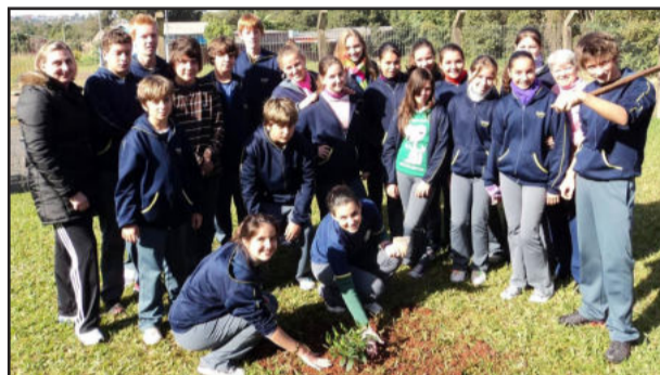
Turma 82, da 8ª série, doa e planta uma árvore na escola

e reflexões sobre o tema, tendo um grande envolvimento dos alunos. Na culminância desta data, ocorreu o plantio de uma muda de Manacá da Serra, doada pelos alunos da oitava série, turma 82.