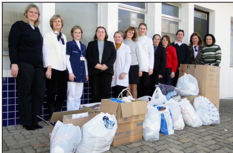
Campanha do HOB arrecadou mais de mil peças, que foram repassadas à Assistência Social de Teutônia