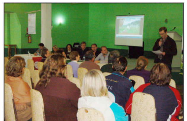
À noite foram apresentadas resoluções da tarde e aprofundado o debate sobre a saúde