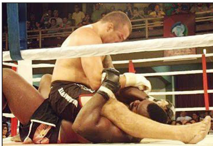
Mão de Pedra conseguiu "montar" Mondragon no final do segundo round