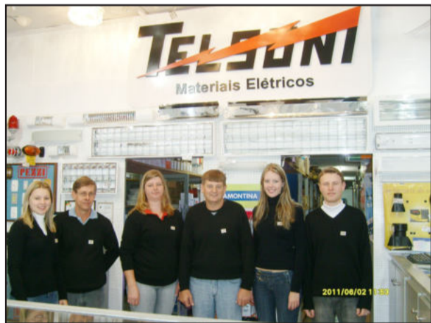
Equipe da Telsoni

A empresa está localizada na rua 3 de Outubro, 320, em Languiru. Contatos pelo fone (51)3762-1324 ou e-mail: telsoni@certelnet.com.br