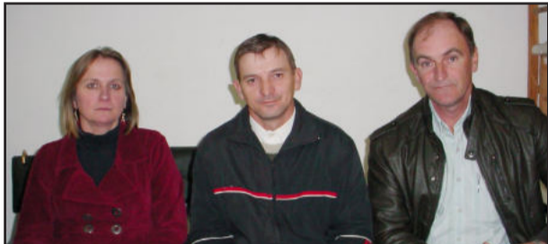
Vereadores de Westfália presentes à sessão

Após a sessão ordinária, os vereadores conversaram demoradamente, trocando ideias e experiências. Para finalizar, um jantar de integração foi servido aos visitantes. Os vereadores vilanovenses que estiveram no encontro prometeram retribuir a visita.