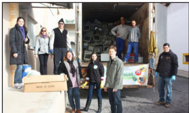
Campanha recolheu mais de seis toneladas de resíduos eletrônicos

Já em Garibaldi, a Secretaria de Meio Ambiente agradeceu a comunidade pelo sucesso da 3ª Campanha de Coleta de Resíduos Eletrônicos, realizada no sábado passado, dia 11, que totalizou 6 toneladas de eletrônicos coletados. Este resíduo foi destinado para empresa OTSER, especializada na destinação final correta deste tipo de material. Também foram recebidos aproximadamente 375 litros de óleo de cozinha usado e 400 lâmpadas fluorescentes.