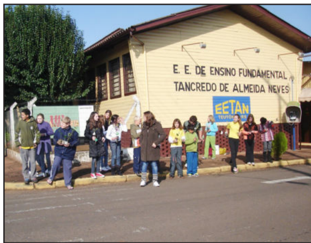
Alunos da Escola Tancredo Neves