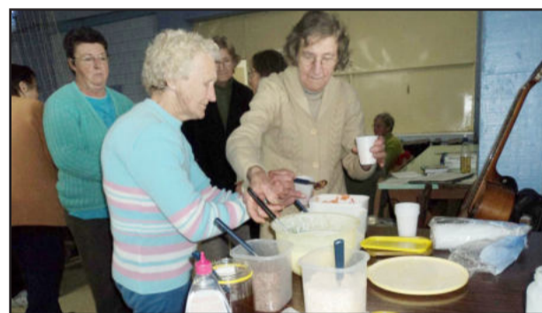
Oficina ensina como fazer iogurte natural caseiro