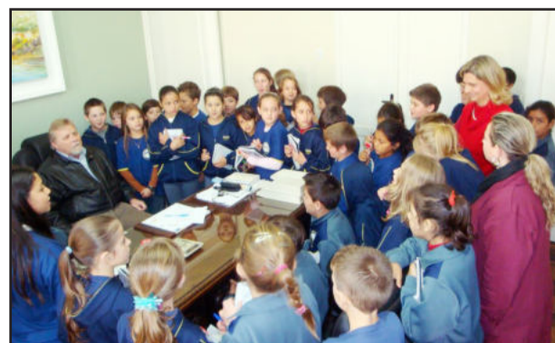
Estudantes conheceram as instalações da sede administrativa

Um dos objetivos da visita do grupo foi de conhecer a sede da Prefeitura, local que é responsável pela administração pública. Os alunos, que estão estudando sobre o Município, tiveram a oportunidade de questionar o prefeito sobre diversas situações do cotidiano e suas ações.