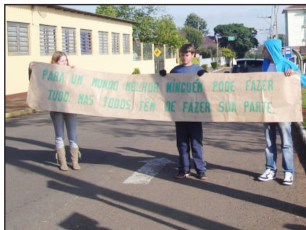
Mobilização foi realizada defronte à Escola

O Meio Ambiente é muito atraente E o arroio Boa Vista reveste a vista E a Escola Tancredo ensina a gente Vamos ajudar o Meio Ambiente porque sem ele a gente não segue em frente Essa cidade que canta e encanta muita gente As flores florescem seguindo a gente Vamos cuidar do Meio Ambiente.