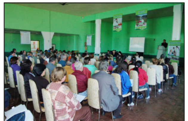
À tarde, conferência definiu resoluções e escolheu delegados