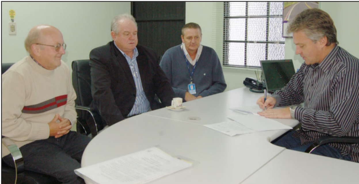
Certel e Administração Municipal celebraram contrato na manhã desta sexta-feira

N a manhã de ontem, sexta-feira, dia 17, a Administração Municipal de Teutônia celebrou contrato com a Cooperativa Certel, que através de sua Loja de Plantas, fornecerá as mudas frutíferas para a continuidade do Programa de Formação de Pomares, implantado em 2009 pelo atual governo, através da Secretaria de Agricul-