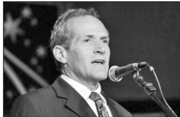
Prefeito Cirano Cisilotto

A Buarque de Macedo é uma das principais vias de Garibaldi, possuindo grande tráfego de veículos por ser um dos principais acessos da cidade. Sua história já anda esquecida e, considerando sua importância, comerciantes do local afirmam que o anúncio desta obra não deveria ser uma comemoração.