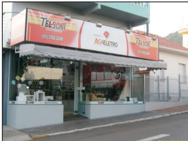
Empresa está situada em Languiru