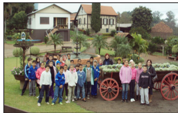
Visita ao Alambique Berwanger