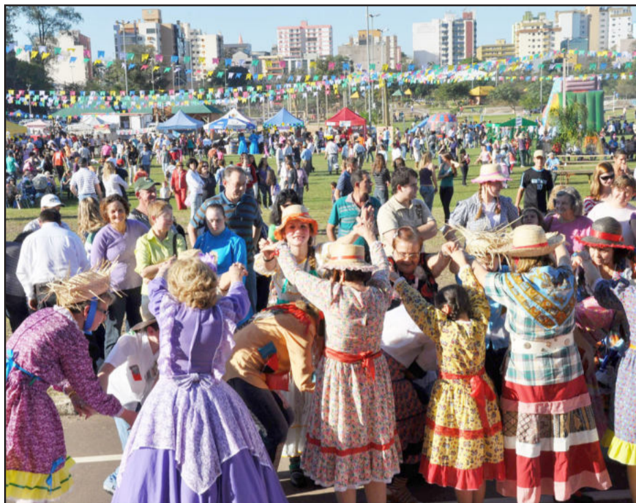
"São João no Parque" será realizado neste sábado, dia 18

O evento São João no Parque é uma promoção do Governo de Lajeado e o Grupo Independente, com o apoio da 24ª Região Tradicionalista, com os CTGs Tropilha Farrapa, Bento Gonçalves e Raízes; Bloco Carnavalesco dos Palhaços; Centro de Cultura Alemã; Societá Taliana Tutti Fratelli; Centro de Cultura Afro; Corpo de Bombeiros; Brigada Militar; Univates; colégios Ceat, Madre Bárbara e Mellinho; Sesi; Sesc; Ervateira Ximango; Associação de Artesãos; Apae; e Projetos Vida e Conviver.