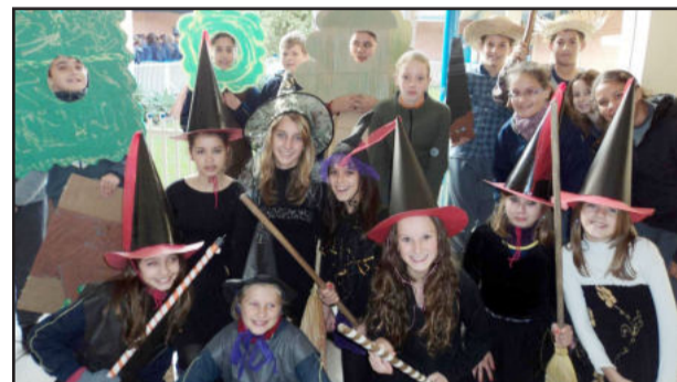
Teatro Herdeira das Bruxas