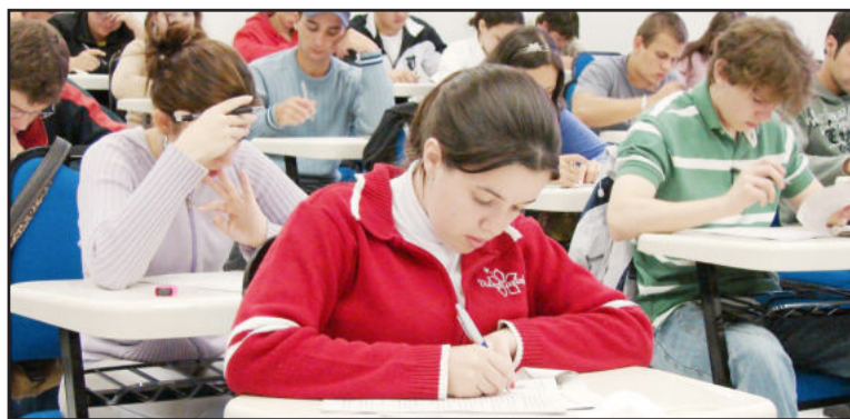
Prova ocorre dia 26 de junho, domingo

No momento da inscrição, o candidato pode escolher entre prestar o vestibular, concorrer a uma vaga com a nota obtida no Exame Nacional do Ensino Médio (Enem), ou com ambas, sendo considerada neste caso a nota mais alta. Mais informações podem ser obtidas ligando 0800 7 07 08 09.