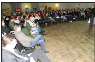
Evento foi sucesso de público nas quatro noites de palestras

Salvi também sugeriu que as pessoas tenham comprometimento com a empresa em que trabalham, “pois todo lugar em que trabalho é meu negócio, já que é de lá que tiro meu sustento”. Aliado a isso, o palestrante afirmou que todos devem fazer o melhor possível no cumprimento de suas tarefas, e não apenas o melhor que o próprio indivíduo pode fazer. “Se eu não consigo fazer da melhor forma, devo procurar uma maneira para alcançar este objetivo”, disse.