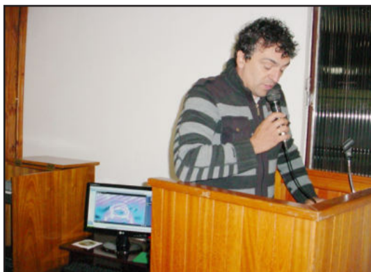
Léo comentando a gravação

A Câmara de Vereadores de Fazenda Vilanova esteve reunida em sessão ordinária na segunda-feira, dia 13 de junho. Outra vez os vereadores apresentaram denúncias e críticas. Os edis se mostram cada vez mais descontentes com a Administração Municipal.