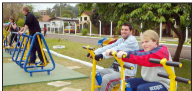
Pacientes fizeram atividades físicas orientadas

A academia ao ar livre é uma iniciativa da Prefeitura por meio da Secretaria Municipal de Esportes e Lazer (Smel), e está aberta ao público gratuitamente, sete dias por semana.