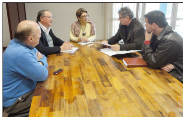
Em reunião nesta semana, lideranças de Westfália reforçam pedido para prédio à escola estadual