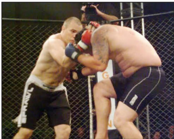
Força, agilidade, técnica e resistência são fundamentais no MMA