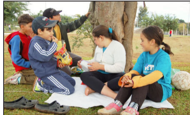
Diversas atividades de integração foram realizadas com as crianças