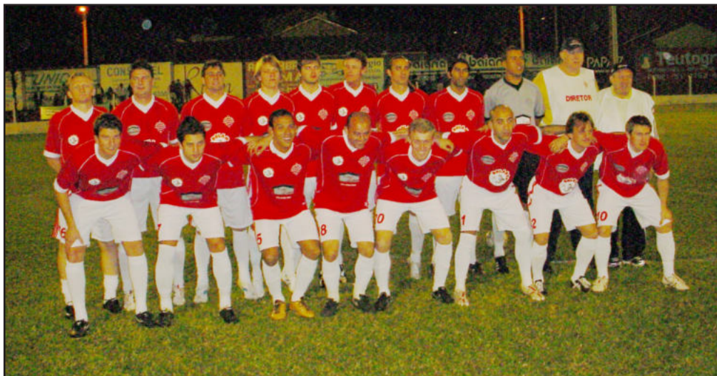
Equipe venceu ao ECAS por 2 a 0

A SER Gaúcho venceu na estreia do Regional Certel Aslivata da Série A. O jogo de abertura aconteceu na noite de sexta-feira, dia 14, na praça de esportes do Gaúcho, no Bairro Teutônia, diante do ECAS do Imigrante.