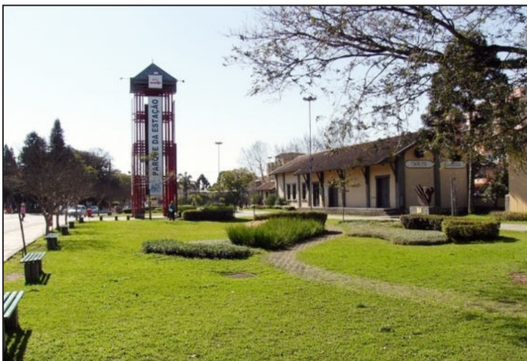
RFFSA vai ceder de forma oficial o Parque da Estação e a área da ciclovía para o Município