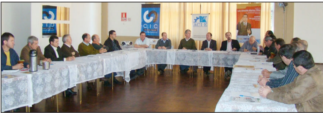
Representantes de nove municípios participaram da reunião em Encantado