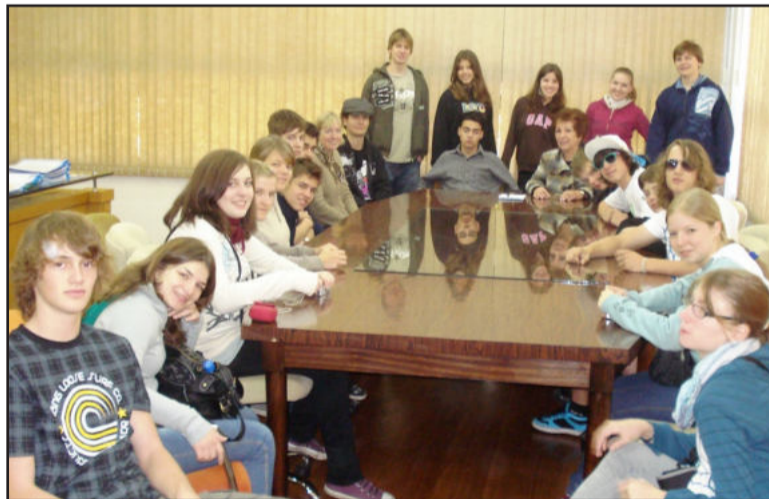
Intercambistas em visita à prefeita