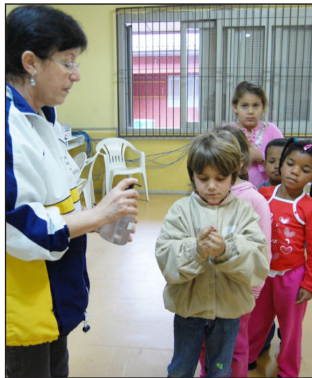
Alunos estão constantemente higienizando as mãos

As escolas municipais de Lajeado retomaram as atividades ontem, após recesso, tendo em vista a gripe A que se alastra pelo Estado. "Dos 5.027 alunos das 18 escolas do Ensino Fundamental, cerca de 90% compareceram, e dos 2.264 alunos das 22 escolas de Educação Infantil entre 70 e 80% estiveram presentes neste primeiro dia de volta às aulas", destacou a secretária de Educação de Lajeado, Rejane Ewald, lembrando ainda que os seis Projetos Vida também voltaram às suas atividades ontem.