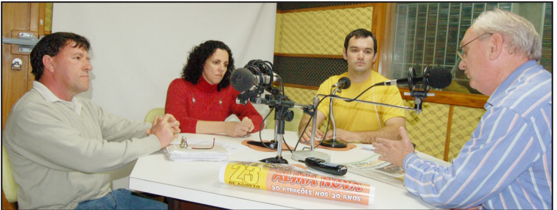
Decisão tomada em reunião, ontem à tarde, atende à recomendação dos órgãos de Saúde quanto a prevenção contra a gripe A. Página 5