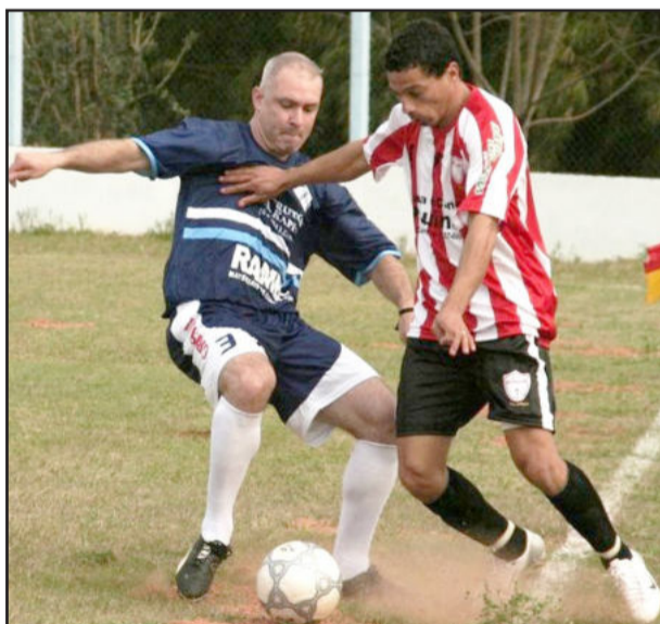
SER São Cristóvão derrotou Nacional

Pela Série B, a bola rolou no domingo e as quatro partidas realizadas tiveram vitoriosos. Montanha de Lajeado e Cruzeiro de Anta Gorda venceram jogando em casa. 7 de Setembro de Capitão e Estudantes de Lajeado surpreenderam seus adversários e ganharam fora de casa. As quatro equipes aparecem empatadas na liderança com 3 pontos.