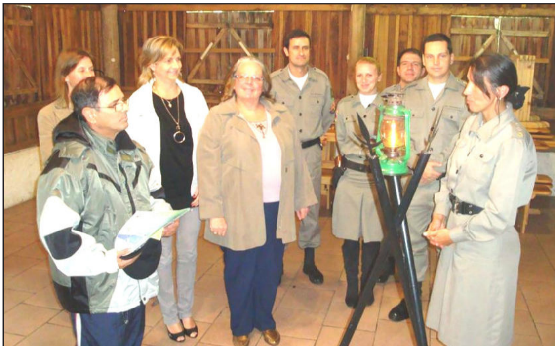
Fogo Simbólico da Pátria chegou na BM de Estrela

O Fogo Simbólico da Pátria foi recebido pelo 40º Batalhão da Brigada Militar de Estrela, na tarde desta segunda-feira, dia 17. Ele permanecerá na Brigada Militar até o dia 1º de setembro, quando será conduzido às escolas do Município.