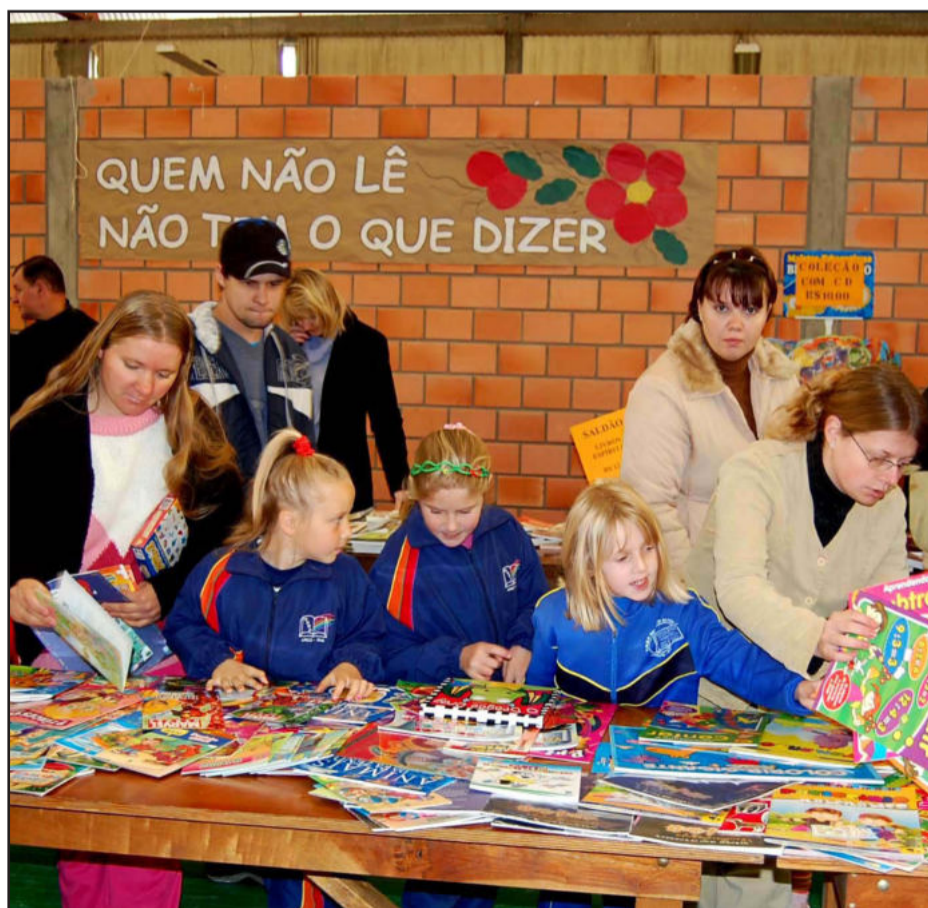
Feira do Livro para todas as idades

No dia 5, sábado, no turno da manhã, haverá apresentações artísticas de alunos das escolas, além de momento cívico lembrando o aniversário da Independência do Brasil.