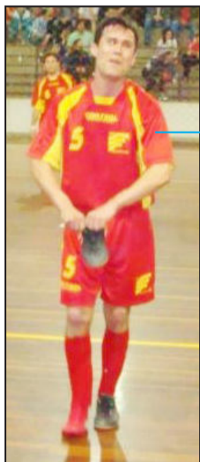
Comum (com a bola) entrou bem na partida contra a AFBEL