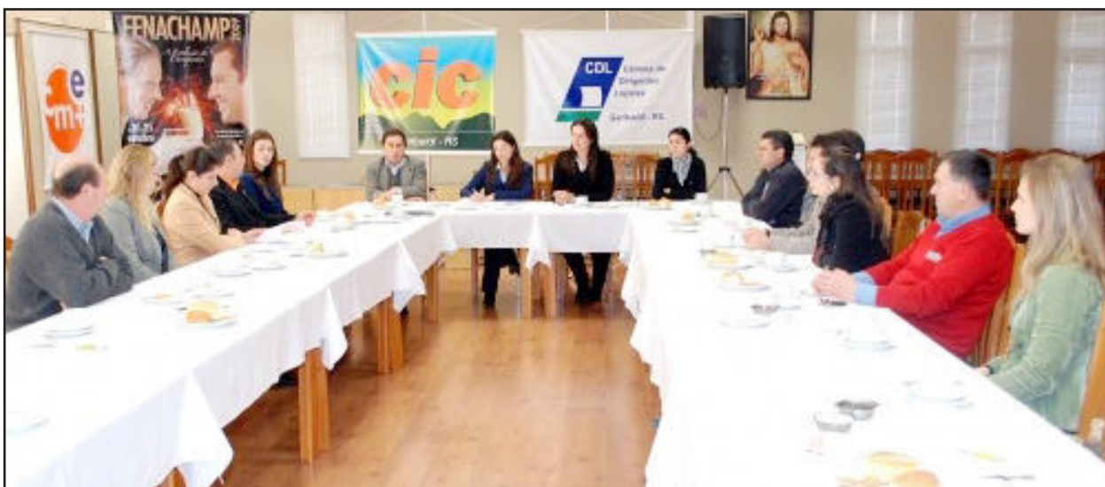
Reunião com a CDL debateu cumprimento da lei dos ambulantes