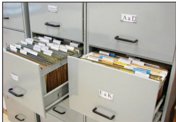
Univates ensinará a organizar e arquivar documentos

Estão abertas, até 5 de outubro, as inscrições para o curso de extensão "Como organizar e arquivar documentos", que será oferecido pela Univates. O público-alvo são secretários, assessores, recepcionistas, auxiliares administrativos, servidores públicos, profissionais liberais, estudantes das áreas de Secretariado Executivo, Administração, Ciências Contábeis, Direito, História, Comunicação Social, Pedagogia, Letras, Enfermagem, bem como demais interessados.