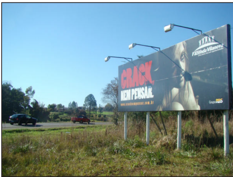
Painel da campanha "Crack Nem Pensar"

A Brigada Militar e a Polícia Civil também aumentaram as atenções para esta questão. "Estamos reforçando