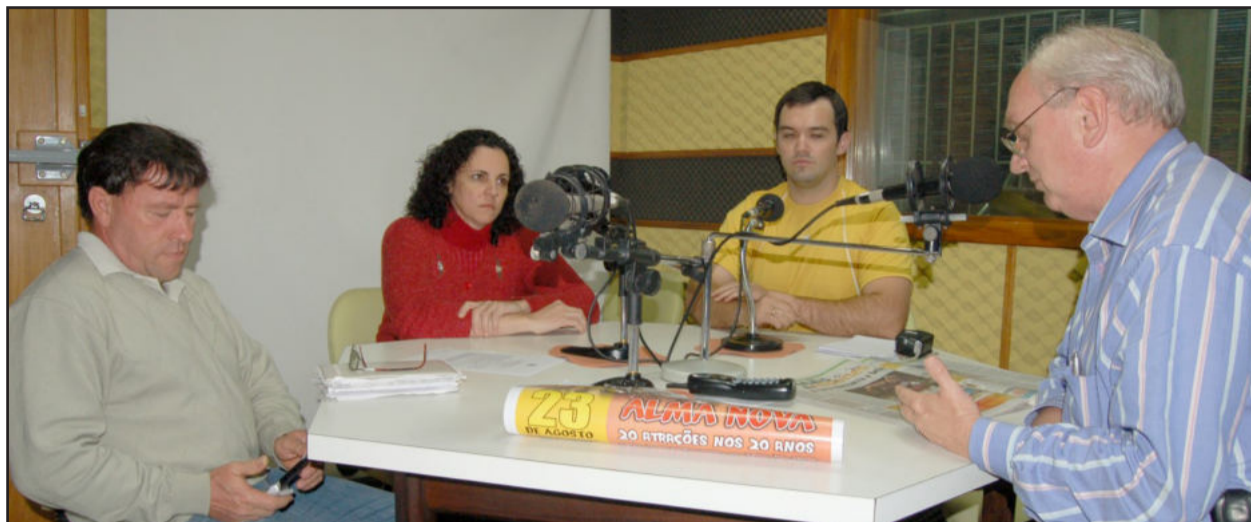
Reunião para transferir evento beneficente ao Alma Nova

A catando recomendações da Secretaria de Saúde, Habitação e Assistência Social e da Vigilância Sanitária de Teutônia em função da gripe A (H1N1), o Grupo Popular de Comunicação decidiu na tarde de ontem transferir o show beneficente em prol do grupo Alma Nova. O “Domingão Show” seria realizado no próximo dia 23 no ginásio da Associação dos Funcionários da Languiru, em Teutônia, e contaria com 20 atrações.