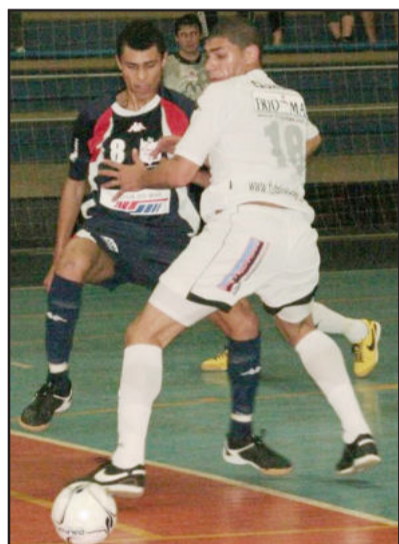
ALAF ficou no 1 x 1 diante da Noiva do Mar

ce mais polêmico e emblemático do jogo. Ainda no primeiro tempo, jogando adiantado, o goleiro perdeu a bola para Lingüiça, que partiu em direção ao gol sem nenhuma marcação. Brayer cometeu falta duríssima, e quando todos