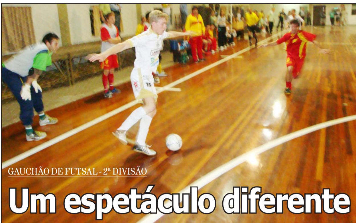
GAUCHÃO DE FUTSAL - 2ª DIVISÃO