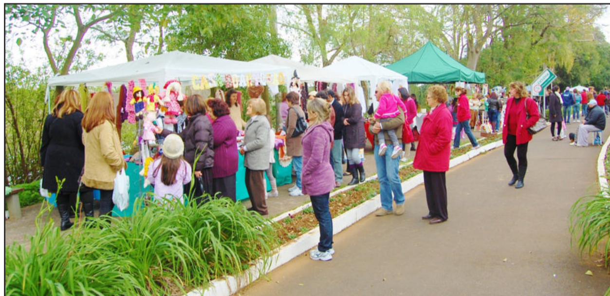
Primeira edição do Brique da Ciclovía teve mais de 30 artistas expositores

A Prefeitura de Lajeado informa que está aberta a inscrição para quem quiser participar do 2º Brique da Ciclovía, que acontece no dia 10 de outubro, das 14h às 17h, na Rua Oswaldo Aranha, às margens do Rio Taquari. Podem participar, gratuitamente, artesãos, artistas, colecionadores, músicos, palhaços, mímicos e outros talentos lajeadenses. A inscrição deve ser feita até dia 30 de setembro, na Secretaria de Cultura e Turismo (Secultur), junto à Casa de Cultura (Rua Borges de Medeiros, 285), das 8h às 11h30min e 13h30min às 15h30min de segunda a quinta-feira, ou das 8h às 13h45min em sextas-feiras.