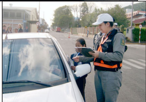
Brigada Militar e alunos em ação