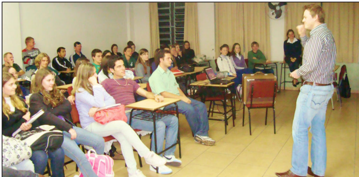
Foram nove palestras para os alunos dos cursos técnicos

Nesta quinta-feira, o Instituto de Educação Cenequista General Canabarro (Ieceg), através da Coordenadoria de Cursos Técnicos, realizou uma noite de palestras, onde a interação e a prática ganharam contornos ainda mais importantes dentro da grade curricular de cada curso. Alunos dos cursos técnicos em Vendas, Administração, Contabilidade, Informática, Secretariado e Recursos Humanos compareceram às aulas e tiveram uma demonstração de como deverá ser suas atividades depois de formados.