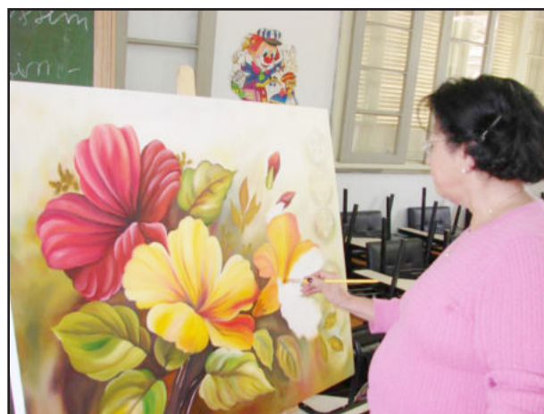
Flores são uma das fontes de inspiração pintadas em telas

A Administração Municipal de Teutônia repassa subvenções mensais ao Centro Cultural 25 de Julho para que este desenvolva estas oficinas junto à comunidade. Também é mantida uma parceria com o Sindicato dos Trabalhadores nas Indústrias Calçadistas de Teutônia (Siticalte), disponibilizando oficinas no Bairro Canabarro. Mais de 450 alunos já frequentam estas atividades ocupacionais.