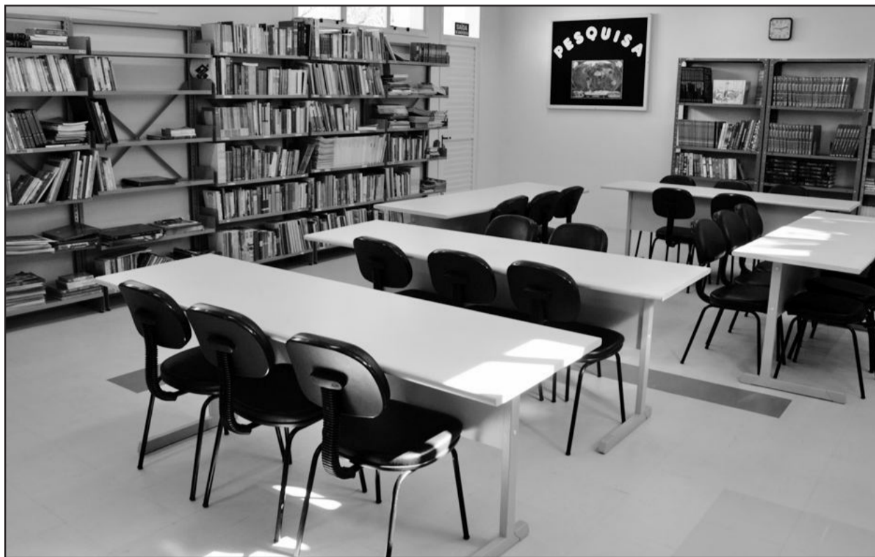
Nova biblioteca pública Carlos Barbosa

A Biblioteca Pública Padre Arlindo Marcon já funciona em novo espaço. O prédio localizado na Rua Assis Brasil, compreende o acervo da biblioteca, acervos específicos, biblioteca infantil, salas de pesquisa, telecentro comunitário e a Fundação de Cultura e Arte (Proarte). Em um local novo e