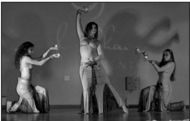
Evento teve dança do ventre

A Apeme Mulher, departamento feminino da Associação de Pequenas e Médias Empresas de Garibaldi, realizou na noite de 15 de setembro, a palestra-show motivacional "Intensificando o Poder Feminino". O evento, comemorativo aos cinco anos de fundação da Apeme Mulher, foi realizado no Centro de Eventos Família Giovanazzi e reuniu cerca de 400 mulheres.