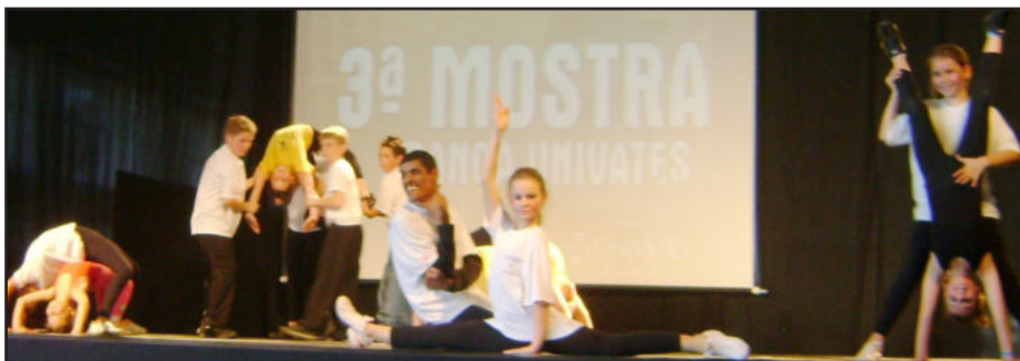
Street Dance do Cemef