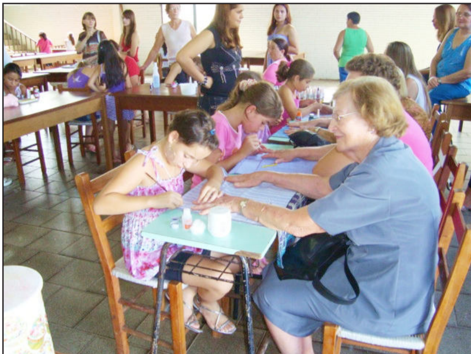
Meninas aprendem profissão de manicure através de projetos sociais