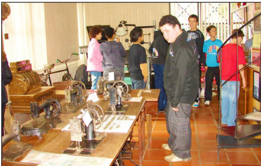
Museu Henrique Üebel fez parte do roteiro de visitas