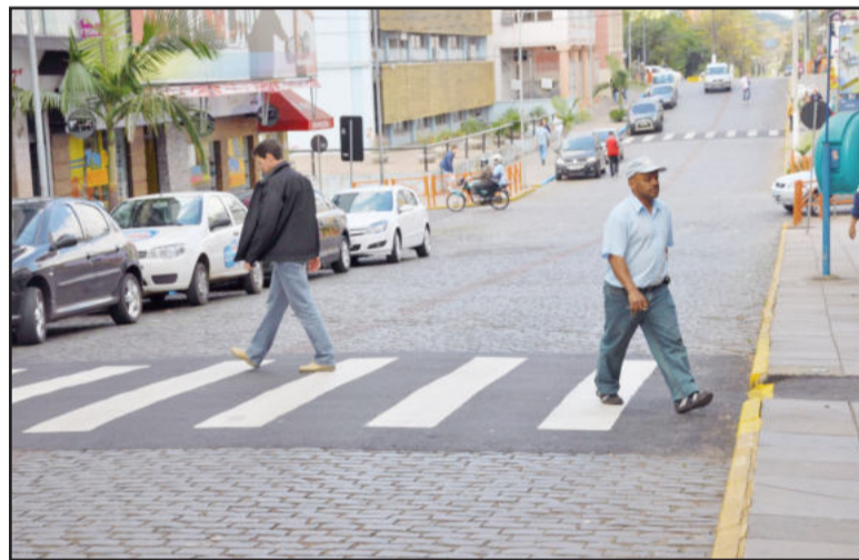
Faixas de pedestres na Júlio agora são todas pelo meio da quadra