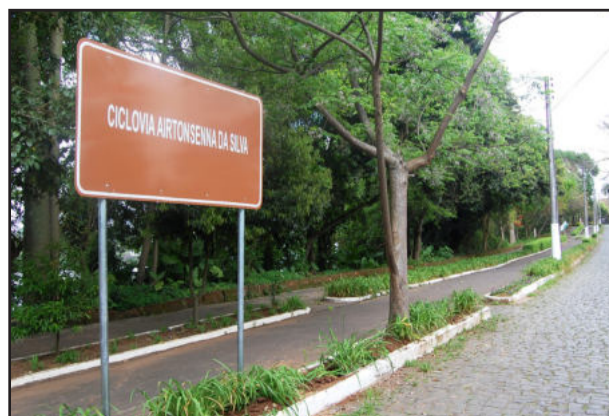
Placa Ciclovía Airton Senna da Silva