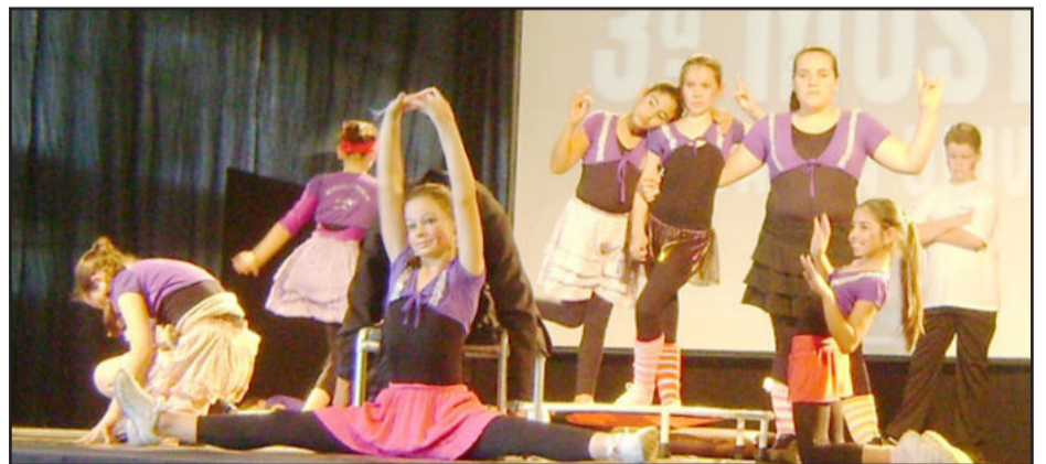
Jump Dance Os Bonecos do Cemef