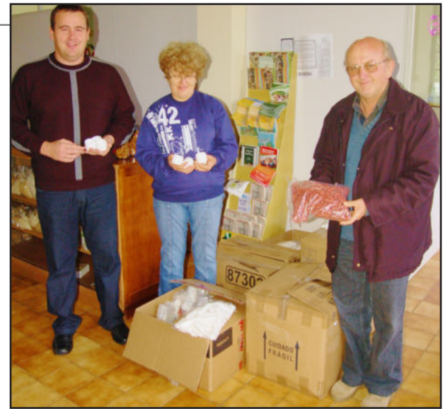
Aquisição de frascos para acondicionar produtos dos grupos de Saúde Comunitária