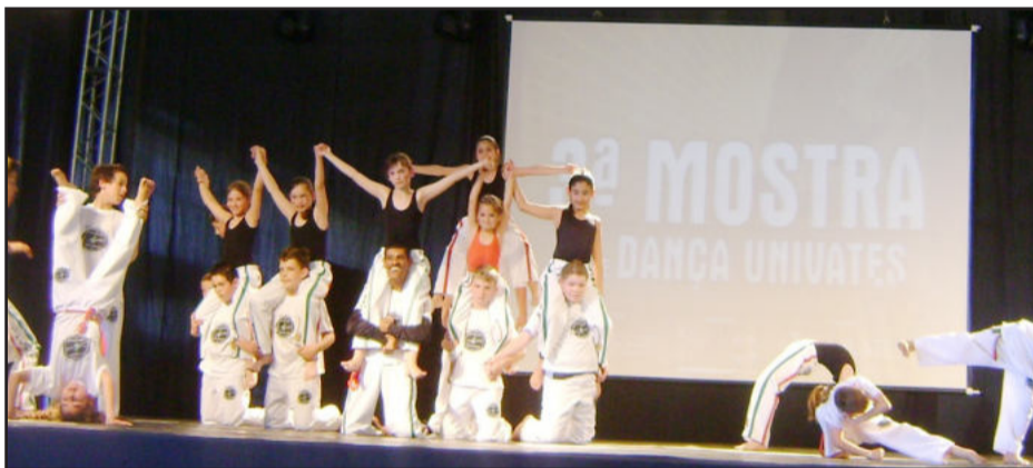
Capoeira do Cemef