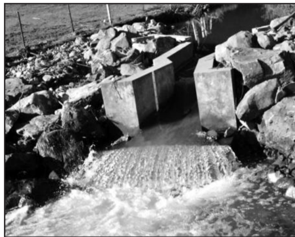
Região da Serra unida contra o borrachudo