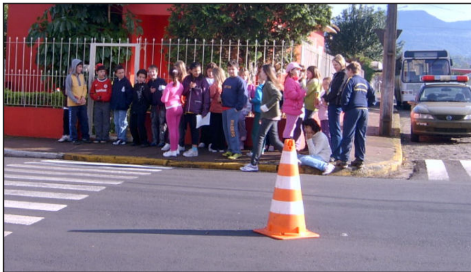
Atividades orientam alunos sobre conduta de pedestre e uso da faixa de segurança