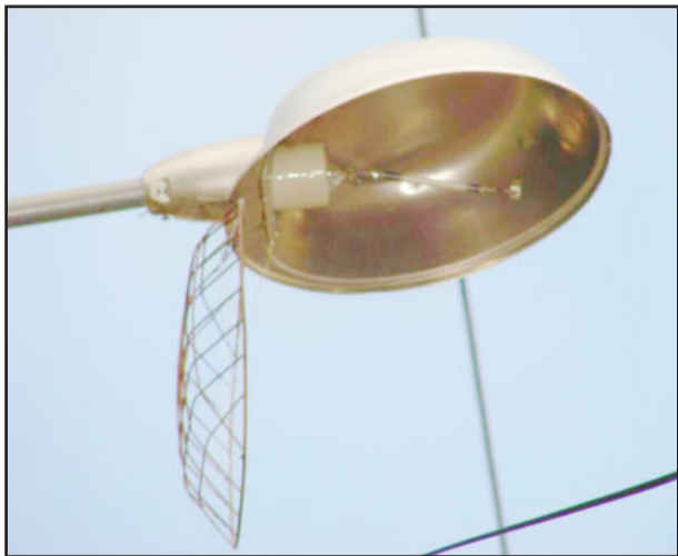
Vândalos apedrejaram luminárias junto à Rua Dois Norte

Os funcionários do Departamento de Iluminação Pública, ligado à Secretaria Municipal de Obras, constataram atos de vandalismo ao patrimônio público nos últimos dias. Na Rua 2 Norte, nas imediações do Centro Administrativo, vândalos destruíram uma lâmpada da iluminação pública com pedras. Os cacos de vidro e as pedras usadas ficaram próximos ao poste, demonstrando que foi um ato de vandalismo.