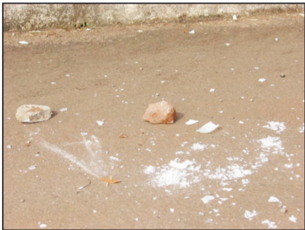
Pedras e vidro quebrado denunciam o ato de vandalismo

A Administração Municipal repudia e lamenta fatos deste gênero, pois é dinheiro público desperdiçado por munícipes, que não percebem que ajudam a pagar estes prejuízos através de impostos em compras de roupas, alimentos, serviços e outros bens consumidos.