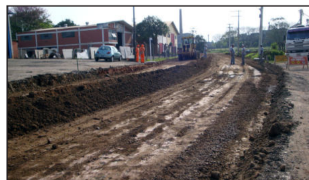
Obra está sendo concluída