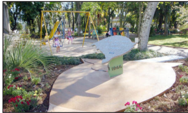
Monumento recebeu melhorias e será inaugurado