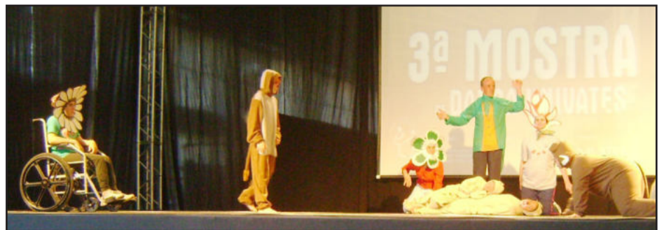
Apae de Teutônia: Os Leões