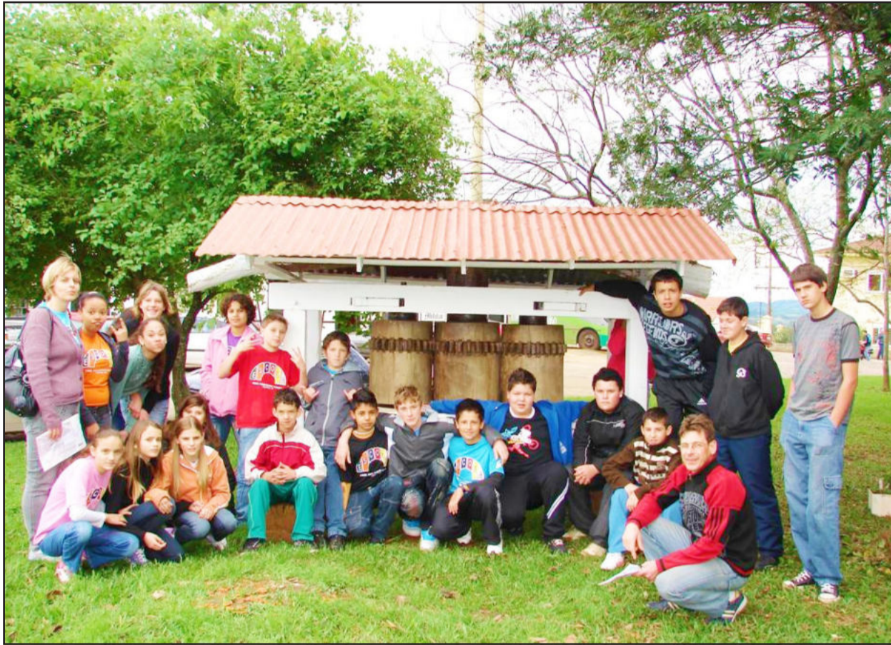
Alunos posaram para a foto defronte a moenda de cana localizada num dos quadrantes do Centro Administrativo

Na tarde desta terça-feira, dia 14, alunos da sexta série da Escola Municipal Guilherme Sommer, da Vila Popular, visitaram o Centro Administrativo de Teutônia e conferiram de perto o funcionamento dos órgãos públicos do Município. O Museu Henrique Üebel, o gabinete do prefeito, a Câmara de Vereadores, o Cartório, o Fórum, a Promotoria e a Brigada Militar fizeram parte do roteiro. Por fim, o grupo foi até o Engenho Quatro Ventos, na Linha São Jacó, que faz parte da Rota Germânica.