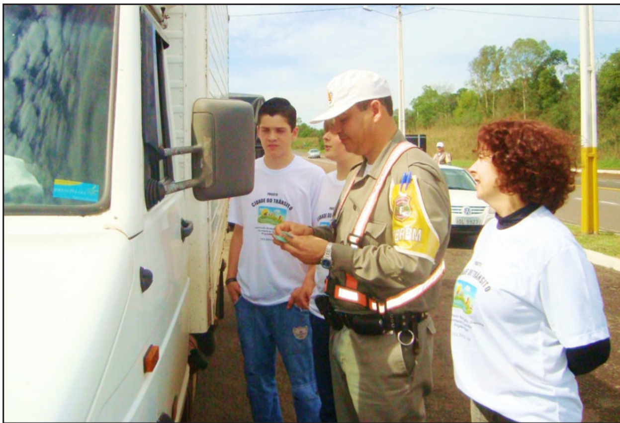
Em 2009, mini blitz orientou motoristas