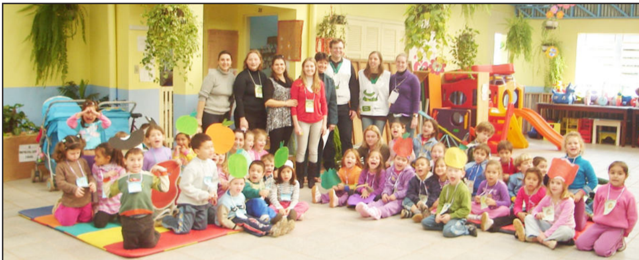
Professores e alunos participantes da gincana

A Escola de Educação Infantil Cirandinha, do Bairro Canabarro, fez o fechamento de sua gincana "Respirando Saúde!" no fim de agosto. O tema teve por objetivo sanar um grave problema na área da saúde: as doenças respiratórias, das quais 90% são consequência de dificuldades respiratórias bucais devido ao mau posicionamento dos dentes.