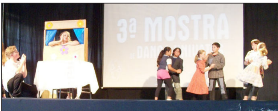
Forró Esperando na Janela: Escola Alfredo Schneider