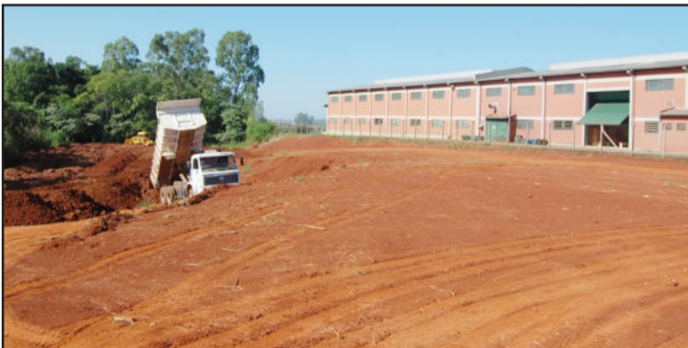
Na Movesco, obras no aterro ao lado da fábrica para ampliar indústria

tacionamento será ampliado devido à demanda de circulação de veículos, tanto dos novos para comercialização, como dos usados, que são encaminhados para consertos. Já a Movesco está recebendo auxílio da Prefeitura para proceder o nivelamento do terreno situado ao lado da sede atual da indústria, onde a empresa irá construir um novo prédio de quatro mil metros, ampliando a fábrica.