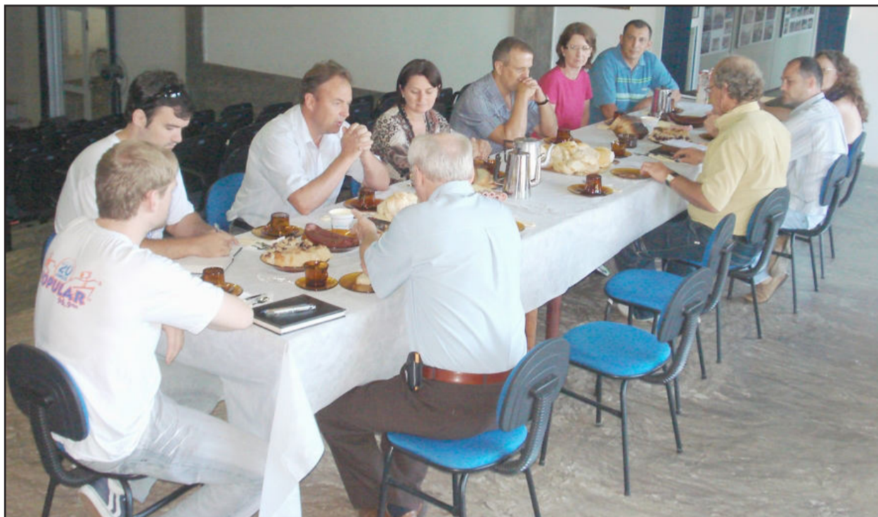
Reunião foi realizada na Prefeitura de Poço das Antas