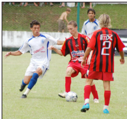
Guarani de Venâncio Aires foi mais eficiente e levantou o título na sub-17 anos