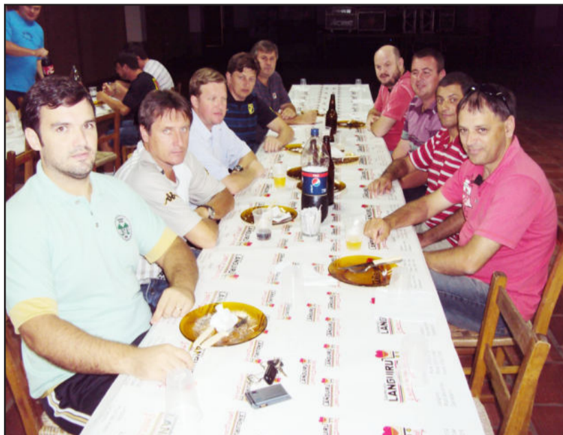
Reunião preparatória em Teutônia

As quatro equipes se enfrentam, em turno único, e as duas melhores decidem o título, enquanto que as outras duas fazem um jogo para apurar o terceiro colocado. Como critérios de desempate na primeira fase, em caso de igualdade em pontos, ficou estabelecida a seguinte ordem: 1º) Confronto (duas equipes); 2º) Número de vitórias; 3º) Maior número de gols marcados; 4º) Saldo de gols; 5º) Disci-