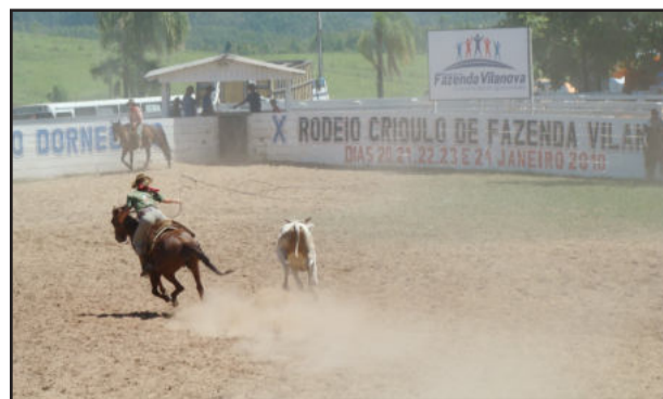
Provas femininas são muito disputadas

Antecedendo a programação do Rodeio Crioulo, o CTG João Dornelles e a administração municipal de Fazenda Vilanova promovem um torneio de futebol sete, dentro da arena do rodeio, nesta terça-feira, dia 19, com participação de onze equipes, compostas por representantes de prefeituras, empresas e entidades da região. O início será a partir das 17h.