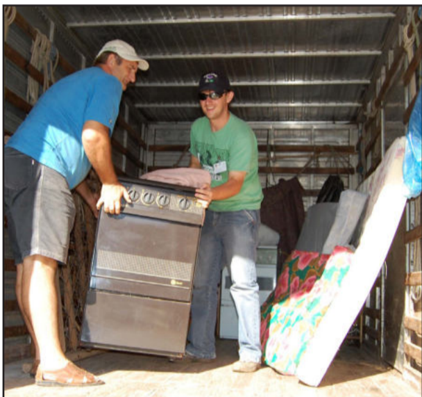
Doações foram enviadas para Marques de Souza