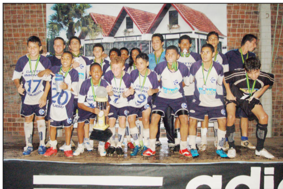
São José B de Porto Alegre, campeão da categoria sub-14 anos