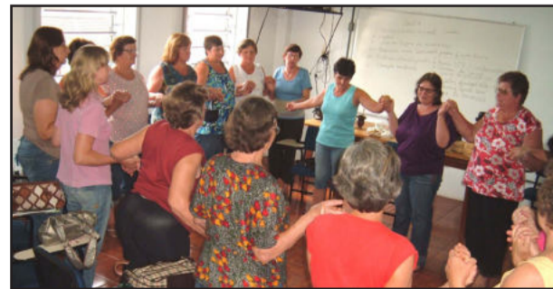
Clubes de mães estão unidos em Imigrante

Ao final, de mãos dadas, as mulheres firmaram posição quanto à continuidade de socialização de conhecimentos e mútua ajuda que é prática nos grupos.