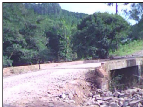
Ponte que divide Progresso e Boqueirão

Duas semanas após a enchente que causou problemas para muitas pessoas no Vale do Taquari, as estradas que dão acesso a diversos municípios ainda estão em condições precárias. É o caso da estrada que liga os municípios de Boqueirão do Leão e Progresso, na qual os buracos tomaram conta. Para fazer este trajeto, de apenas 18 quilômetros, é necessário quase uma hora de viagem. As prefeituras estão priorizando os casos de maior urgência, e enquanto isto as pessoas que precisam vão ter que enfrentar as estradas do jeito que estão.