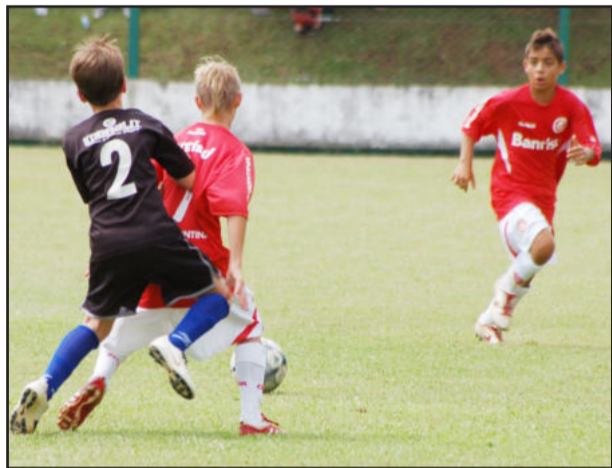
Internacional não deu chances ao CFM e goleou por 7 a 0 na final da sub-12 anos