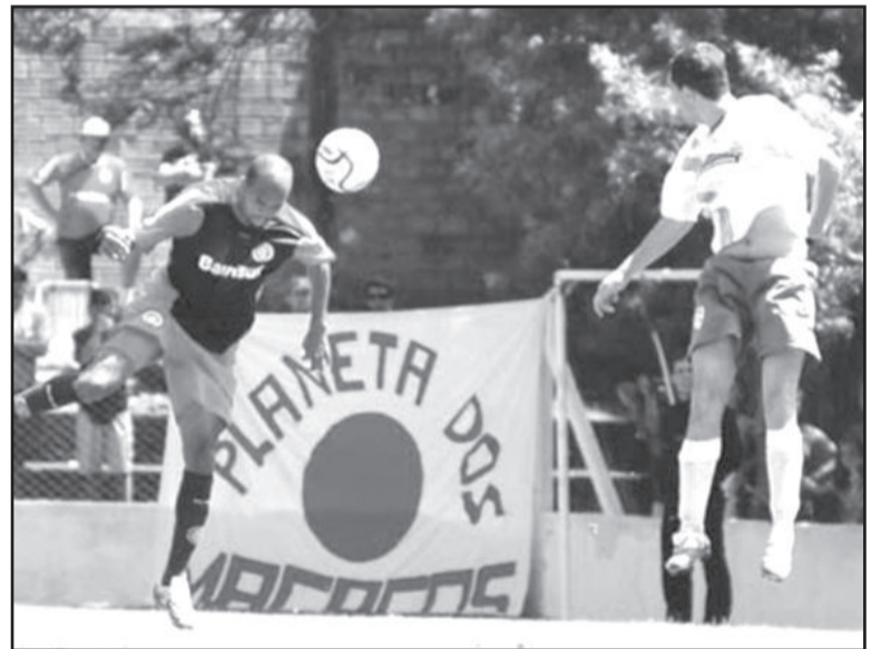
Inter de Alecsandro insistiu nas jogadas aéreas no primeiro tempo