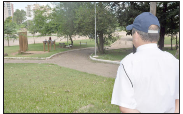
Parque dos Dick tem dois vigilantes das 17h às 21h

A Prefeitura de Lajeado implantou o serviço de vigilância no Parque Professor Theobaldo Dick com a destinação de dois vigias, que começaram a trabalhar na área. Diariamente eles estão no parque das 17h às 21h, por ser este o horário em que é maior o número de pessoas que aproveitam o fim do dia para fazer caminhadas e se reunir com a família para tomar chimarrão. "É uma iniciativa experimental que tem o objetivo de proporcionar maior segurança aos frequentadores do parque", diz o prefeito em exercício, Sédinei Zen, destacando que com esta medida o governo municipal atende a uma antiga reivindicação da comunidade.