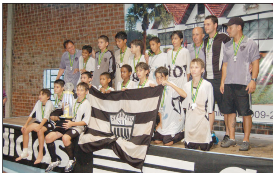
Sporting Sul de Porto Alegre, campeão da sub-13 anos