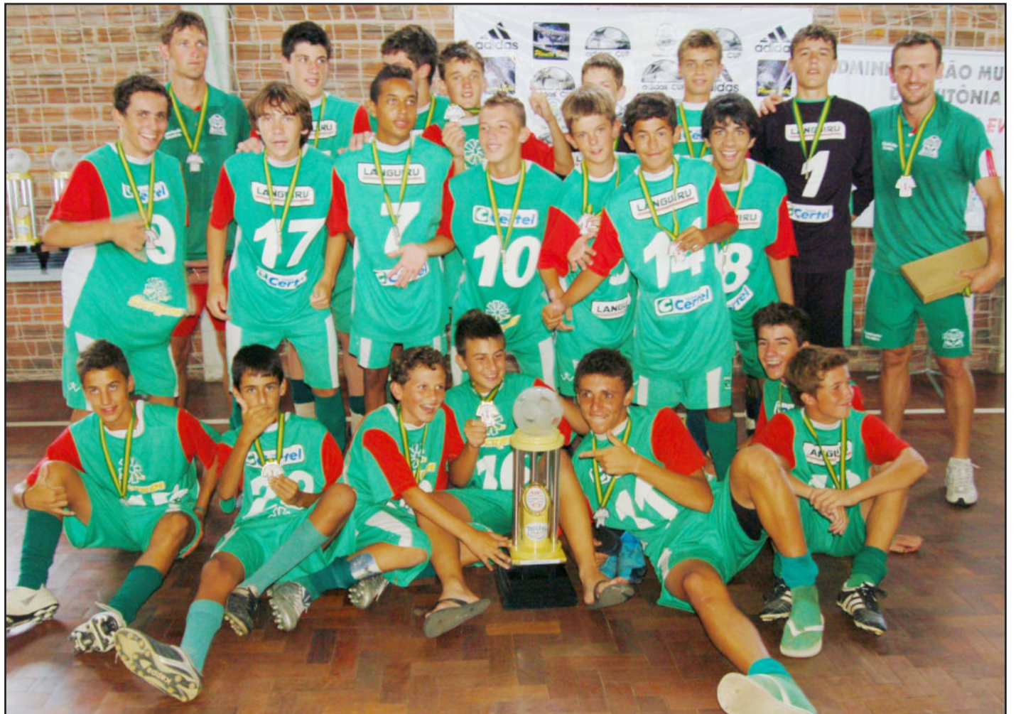
Equipe Sub-15 da Juventus empatou com o Avenida de Agudo, mas conquistou o título nos pênaltis. Leia mais na contracapa