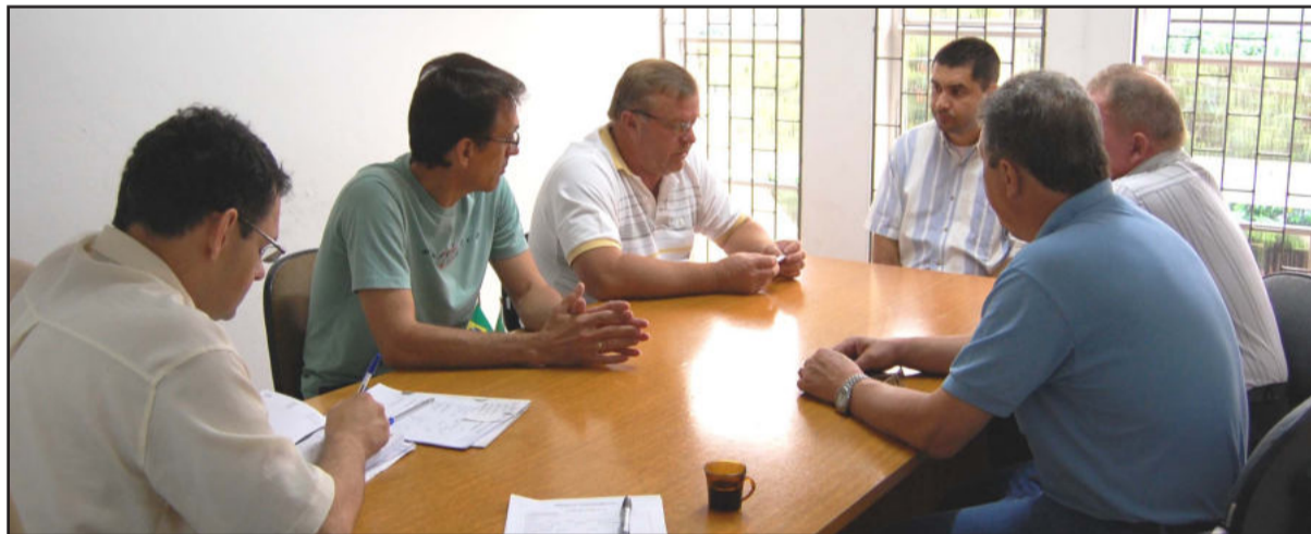
Reunião definiu plano de ação

- No interior do município: Linha Boa Vista 37, Linha Castro Alves, Linha Ernesto Alves, Linha Imhoff, Linha 11 de Novembro, Linha Rosenthal, Linha Arroio da Seca Baixa, Linha Herval, Linha Wilsmann, Linha Michels, Linha Fassini, Linha Vale da Harmonia, Linha Rechts, Linha Harmonia Alta e Linha Garibaldi.