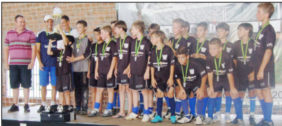
CFM Centro Esportivo de Encantado, vice-campeão da categoria sub-12 anos