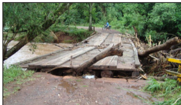
A força da chuva danificou pontes no interior

A elaboração do plano visa à recuperação das estradas municipais não pavimentadas, cujos prejuízos alcançaram cerca de um milhão de reais, totalizando 86 km danificados, entre destruição de bueiros, pontes, pontilhões, redes