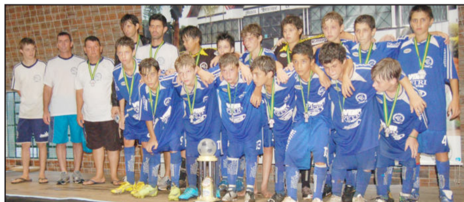
Academia Avante Genoma, vice-campeão da categoria sub-13 anos

A última decisão do dia, também sob chuva, colocou em campo os garotos da categoria sub-13 anos (1997) de Sporting Sul de Porto Alegre e da Academia Avante Genoma de Tuparendi. O título foi decidido na segunda etapa, quando o Sporting Sul fez o gol da vitória por 1 a 0 e comemorou a conquista.