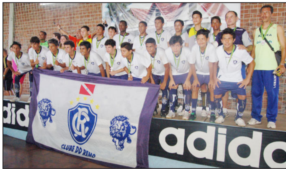
Clube do Remo veio de Belém do Pará para ser campeão na sub-16 anos