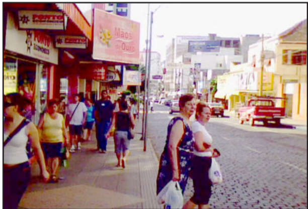
Comércio registra bom começo de ano comparado com 2009

O movimento normal nas ruas de Lajeado deve iniciar mais cedo este ano, na metade de fevereiro, uma vez que as aulas também começam com antecedência..