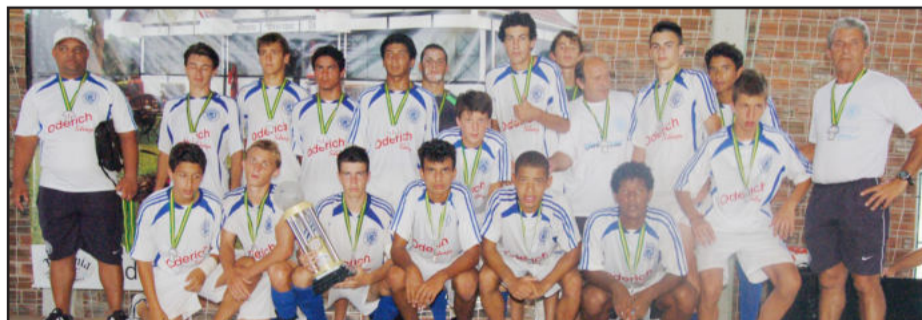
Guarani de São Sebastião do Caí ficou vice-campeão na categoria sub-17 anos