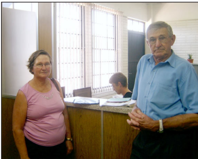
Apresentação é feita na Prefeitura

O produtor que não apresentar o seu talão terá sua inscrição baixada de ofício e também não poderá participar dos programas de incentivos da Secretaria Municipal da Agricultura em 2010. O setor de ICMS solicita especial atenção para comparecer conforme o roteiro pré-estabelecido: