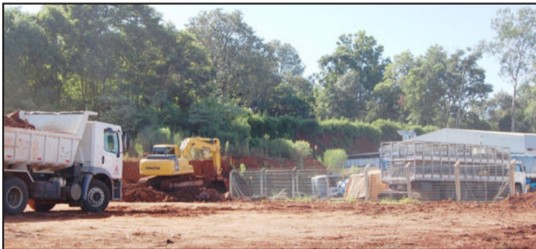
Na Dipesul, escavadeira remove terra para ampliar pátio

A Dipesul irá ampliar o pátio de estacionamento em cerca de 700 metros quadrados, uma vez que a oficina central da região está localizada na empresa de Lajeado e necessita de um maior espaço. O es-