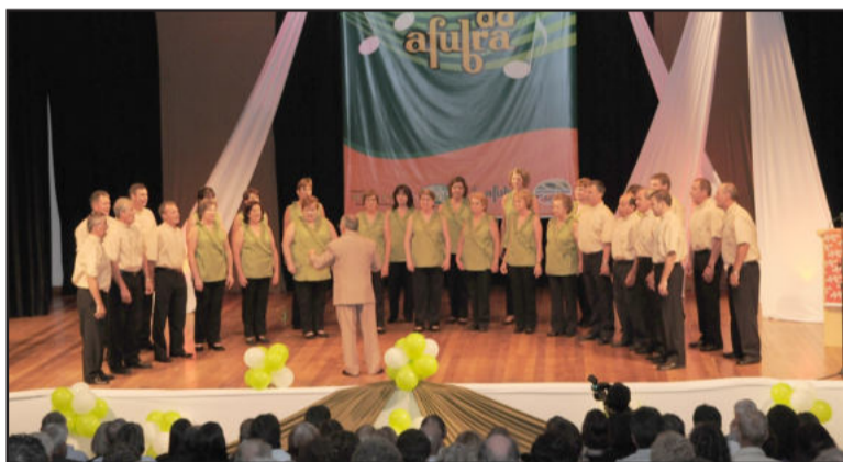
Coral da Afubra realizou apresentação especial pelos seus 15 anos