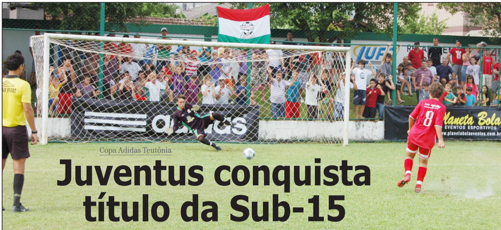
Copa Adidas Teutônia