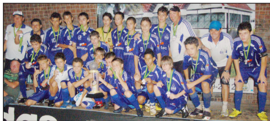
Americano de Novo Hamburgo, vice-campeão da sub-14 anos