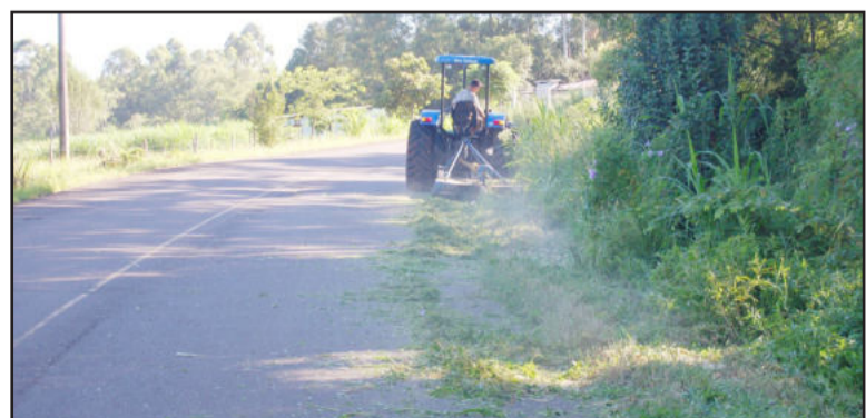
Roçada às margens da rodovia RS-419

O Departamento Autônomo de Estradas e Rodagem (Daer), responsável pela manutenção da estrada, autorizou a Prefeitura de Teutônia a promover a melhoria, que beneficia motoristas e demais usuários.