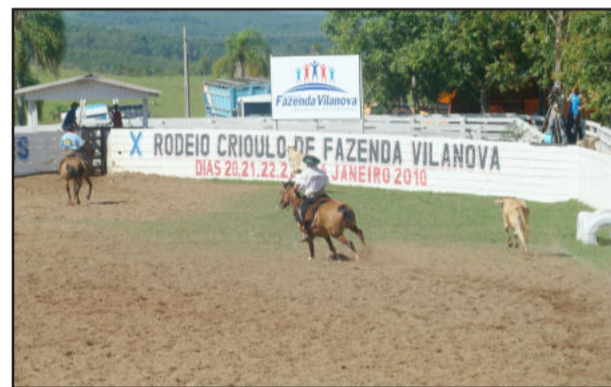
O laço vai se abrir em Fazenda Vilanova

O Centro de Tradições Gaúchas (CTG) João Dornelles realiza, entre os dias 20 e 24 de janeiro, a décima edição do Rodeio Crioulo de Fazenda Vilanova, um dos maiores do Estado. Serão distribuídos R$ 60 mil em prêmios, na prova campeira, sendo que a dupla campeã levará um carro zero quilômetro. Haverá também quatro motocicletas zero quilômetro para os demais vencedores das provas de tiro-de-laço das outras categorias. O rodeio acontece no Parque de Rodeios em Alto Pinheiral, interior do Município, e conta com participação de laçadores e laçadoras de todo o Rio Grande do Sul e de outros estados. As inscrições e informações pelos telefones (51) 3766 1440 ou 9983 3428, com patrão Gilnei. Programação e regulamento estão no site www.ctgjoaodornelles.com.br