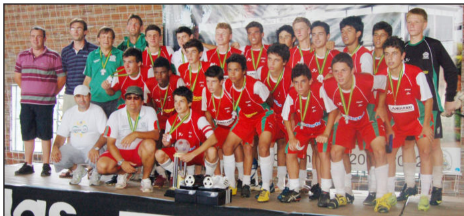
Juventus, vice-campeã da categoria sub-16 anos