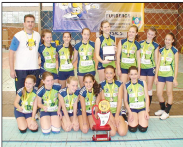
Wessel/Ceat/Lajeado campeão mirim