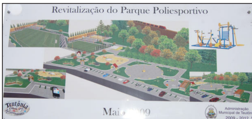
Projeto de revitalização do Parque Poliesportivo

Conforme o edital de licitação, a galeria deverá ser construída em concreto pré-moldado, com 43,81 metros de comprimento por 3,60 metros de