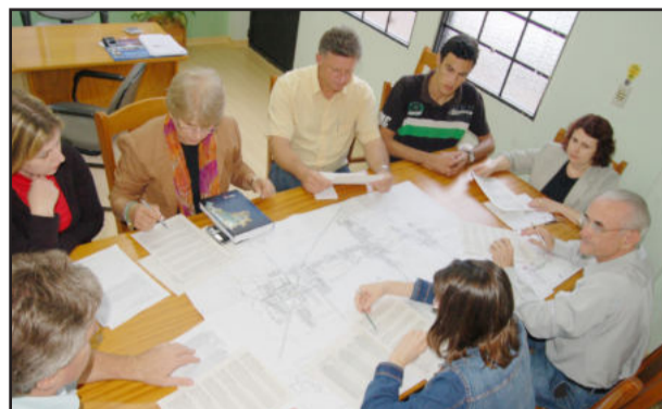
Reunião de planejamento das linhas de ônibus urbano

A administração municipal de Teutônia licitou a elaboração de um projeto para reformular e legalizar o transporte coletivo urbano na cidade. A empresa RS Arquitetura, Planejamento Urbano e Assessoramento em Trânsito Ltda apresentou a melhor proposta e já está realizando a atividade. A empresa deve elaborar um plano operacional e o cálculo tarifário do transporte coletivo, além de assessorar a preparação da licitação do sistema.