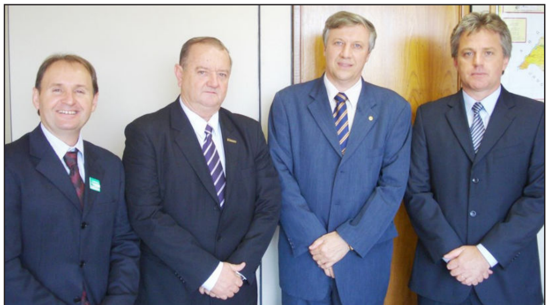
Prefeitos de Travesseiro (e), Paverama e Teutônia (d) com deputado federal Renato Molling

Deputados federais estão encaminhando emendas ao orçamento da União para obter verbas federais para os municípios. Página 6