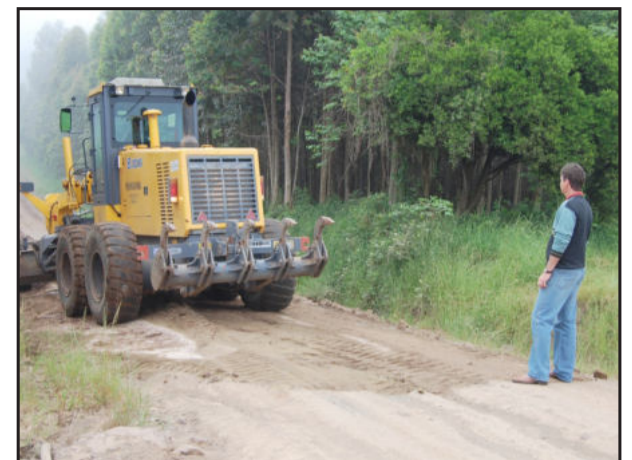
Estradas de Morro Azul

O excesso de chuvas no mês de setembro provocou alagamentos e destruição em muitas cidades do Vale do Taquari. Foram muitas as estradas afetadas, sendo mais de 500 quilômetros só em Paverama. Mas, com alguns dias de tempo seco no mês de outubro e começo de novembro, a administração municipal iniciou uma série de obras, entre elas a recuperação de estradas do interior.