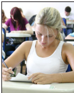
Provas serão dia 20 de dezembro

Os novos cursos oferecidos são Engenharia Mecânica, Ciências Biológicas - bacharelado, Tecnologia em Gestão de Recursos Humanos, Tecnologia em Marketing, Tecnologia em Jogos Digitais, Tecnologia em Redes de Computadores e Tecnologia em Sistemas para a Internet. Mais informações pelo 0800 707 0809 ou e-mail para vestibular@univates.br .