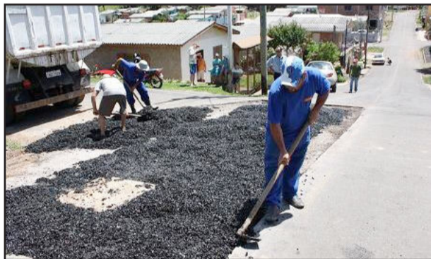
Trabalhos são em várias ruas

A Secretaria Municipal de Obras, Transporte e Trânsito está realizando uma operação tapa-buracos em diversas áreas do Município. No Bairro Bela Vista II vários trechos de asfalto das ruas foram removidos e uma nova camada foi colocada. Na Avenida Independência o último trecho da repavimentação está sendo feito, compreendendo um espaço entre o Varejo da Cooperativa Garibaldi até a Cooperativa Cairú, no sentido Centro-Bairro. Outra obra que está sendo realizada é o fechamento de uma boca de lobo, com repavimentação, na Rua Vicente Dal Bó, próximo ao acesso ao Bairro São Francisco.