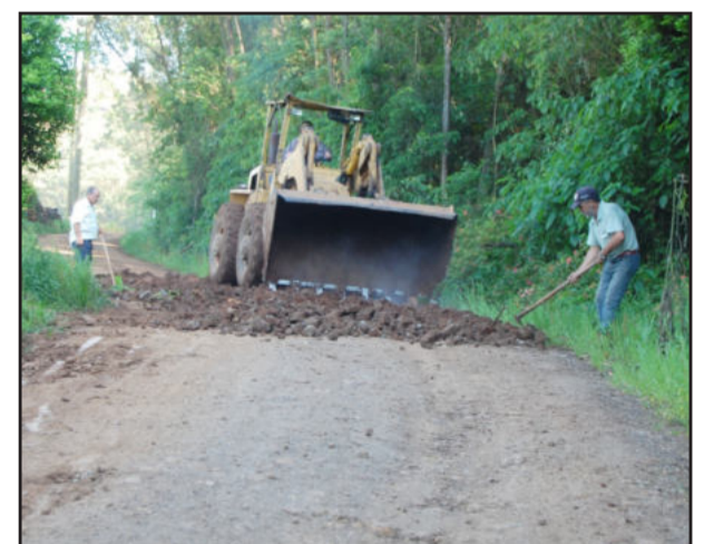
Estradas de Santa Manoela