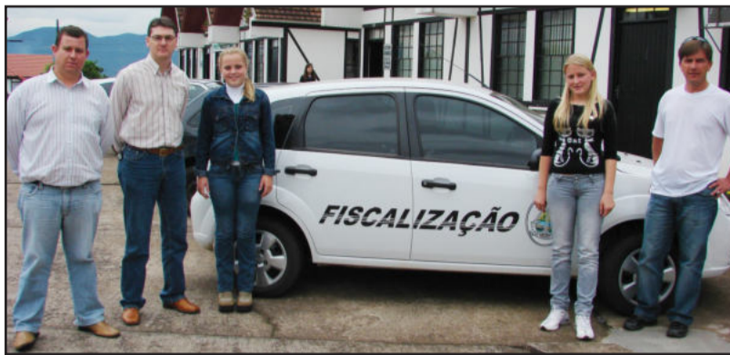
Equipe realizou recadastramento de imóveis

No total, o levantamento apontou que mais de 125 mil metros quadrados (12,5 hectares) que estavam fora do sistema, e conseqüentemente, não pa-