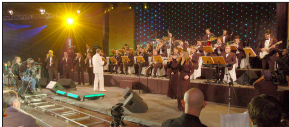
DVD foi gravado durante show em Teutônia