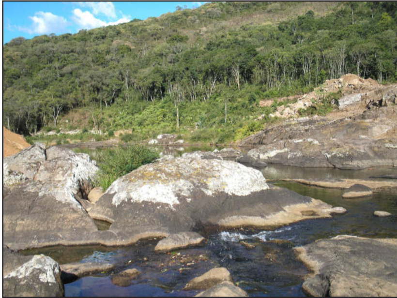
Local da futura usina de Rastro de Auto

O mix de produtos terá como base a fabricação de pavimentos e blocos de concreto, postes para instalação