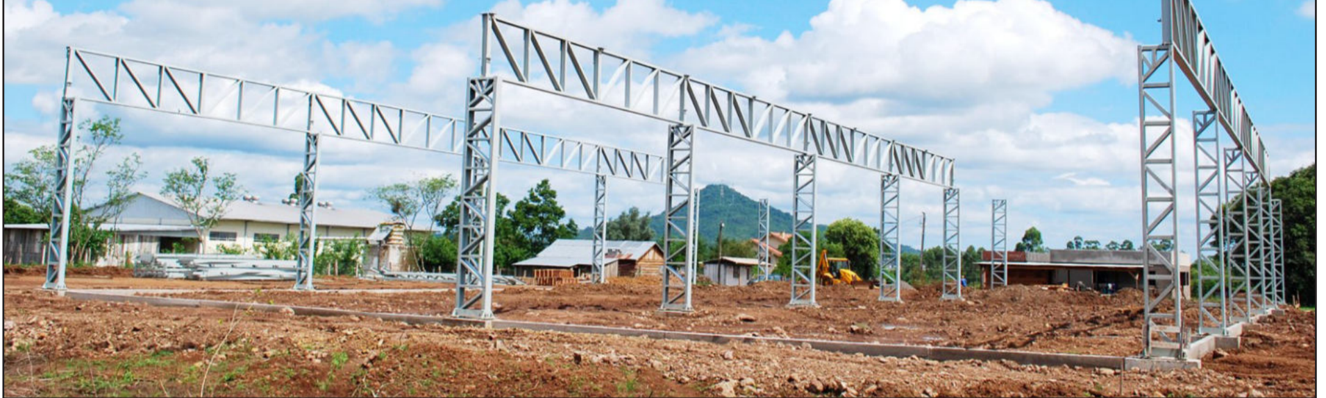
A Certel anuncia a construção de sua terceira hidrelétrica e uma nova fábrica de artefatos de cimento (foto). O evento será hoje à noite, em Teutônia. Página 7