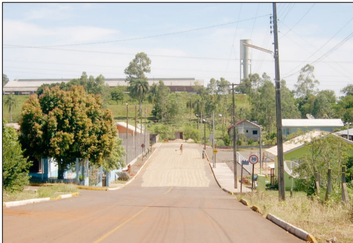
Casca de arroz na rua para secar

Moradores do Loteamento Arco Íris, do Bairro Canabarro, em Teutônia, entraram em contato com a reportagem da Folha Popular nesta terça-feira, dia 17, para relatar sua insatisfação com uma situação que estava ocorrendo no local. Um produtor havia ocupado a rua em frente à área de lazer da Associação de Moradores para a secagem de casca de arroz.