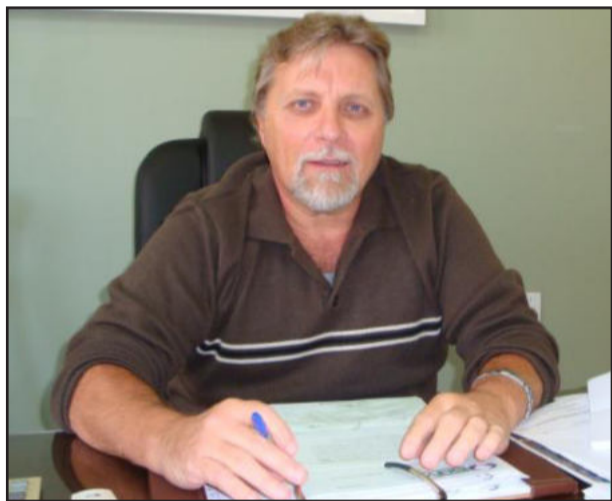
Prefeito Celso Brönstrup

Celso Brönstrup observou, também, sua preocupação em sempre valorizar o funcionalismo público. “Estou estudando uma forma de contemplar os servidores que exerçam suas funções com qualidade, rendimento e, principalmente, sem faltas. Temos que premiar pela assiduidade quem não faltar serviço, não sendo por motivo de licença maternidade”, comentou o prefeito.