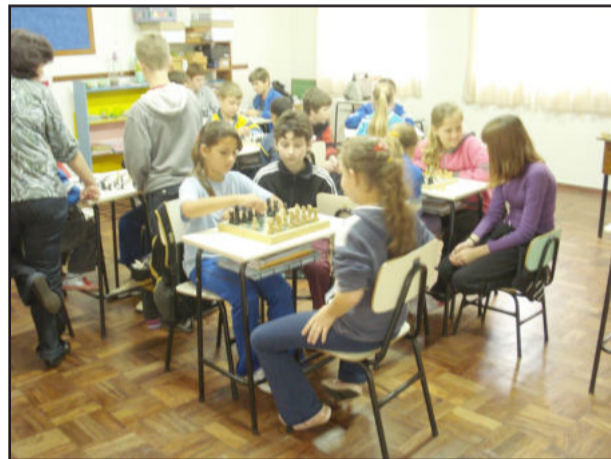
Xadrez integra alunos de duas escolas de Estrela

O objetivo foi integrar as escolas e estimular a prática do jogo de Xadrez. Foi uma manhã bastante proveitosa, onde alunos e professores estiveram atentos às regras e no desenvolvimento do jogo. Todos gostaram da experiência e esperam que momentos com este sejam repetidos.