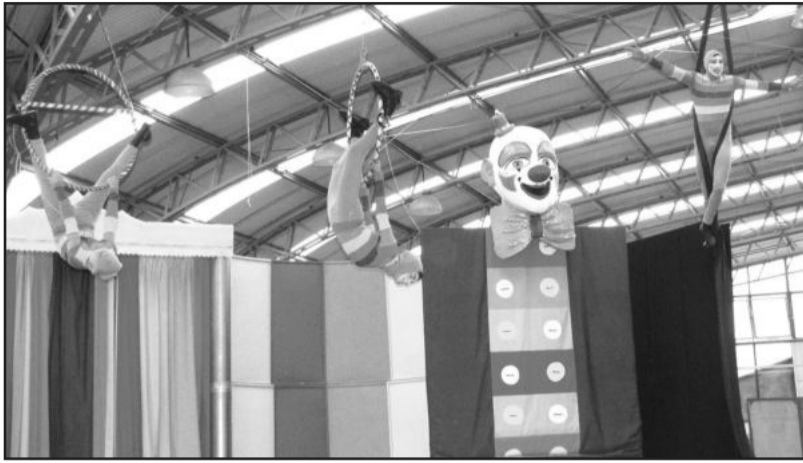
Festival Estadual Nossa Arte em Garibaldi

Na quarta-feira, dia 25, é a vez das artes cênicas, com início às 8h30min e