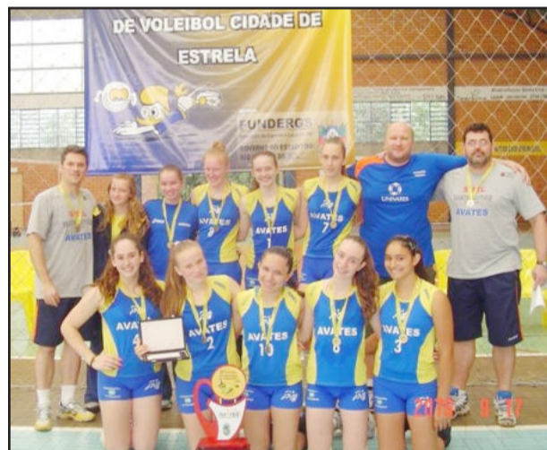
Languiru/Martin Luther/Avates campeão infantil

No infantil, na estreia da categoria na competição (até então era somente disputada no mirim e no infanto-