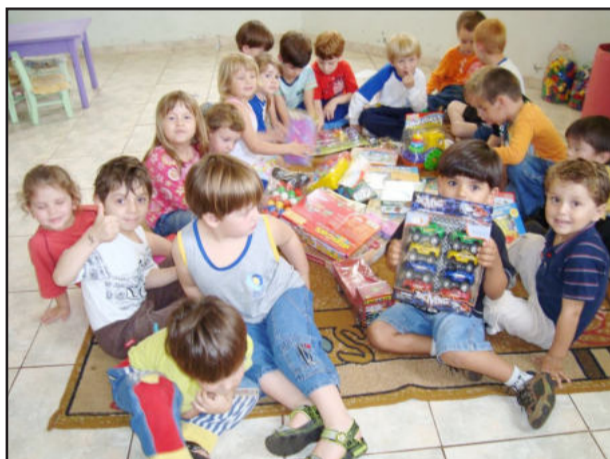
Alunos aproveitam os brinquedos

Dentre os novos brinquedos adquiridos destacam-se jogos pedagógicos, quebra-cabeças, carrinhos, bonecas dentre outros, que agora passam a fazer parte do aprendizado e diversão dos alunos do Icege. A direção do Icege, mais uma vez, agradece a todos os pais, alunos e comunidade que naquela ocasião colaboraram com a promoção do instituto.