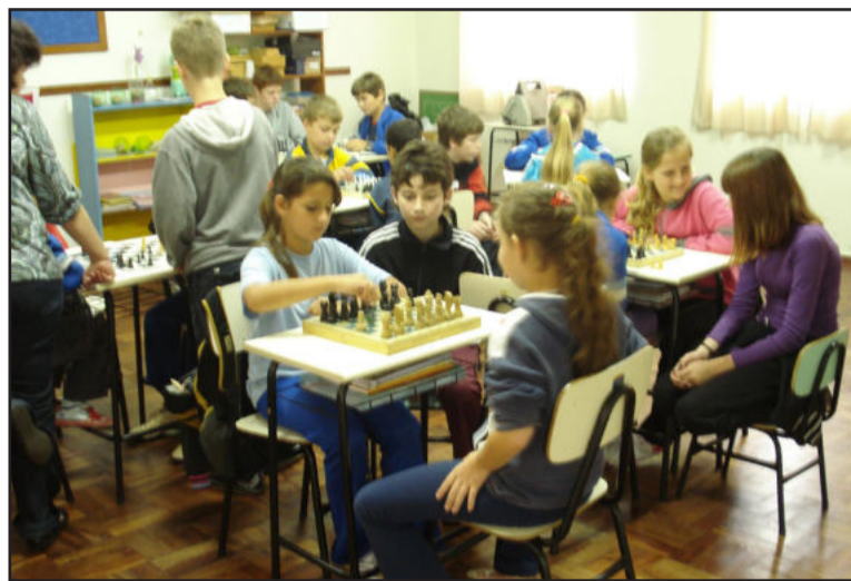
Atividade diferenciada integra alunos

O objetivo foi integrar as escolas e estimular a prática do jogo de xadrez. Foi uma manhã bastante proveitosa, onde alunos e professores estiveram atentos às regras e no desenvolvimento do jogo. Todos gostaram da experiência e esperam que momentos com este sejam repetidos.