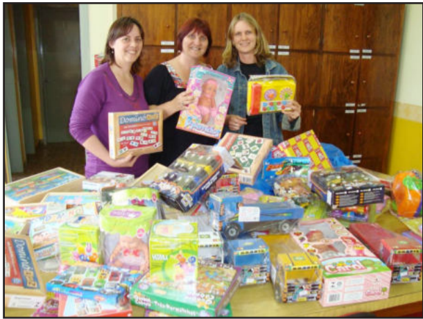
Professores mostram os novos jogos

Nesta segunda-feira, dia 16, as crianças da Educação Infantil, turnos inverso, níveis A e B do Instituto de Educação Cenequista General Canabarro (Icege) tiveram uma grata surpresa. Os pequeninos receberam vários brinquedos novos que foram adquiridos com o lucro proveniente da venda do meio galeto, no dia 3 de outubro. Naquela manhã de sábado junto, com a promoção do meio galeto, as crianças do Icege tiveram uma programação especial no pátio do educandário, alusiva ao Dia da Criança.