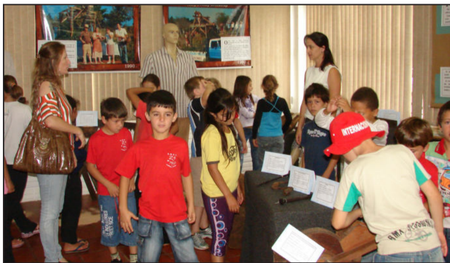
Alunos visitam a exposição temática