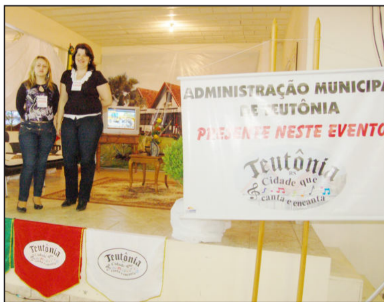
Prefeitura divulgou ações na Expowink

O prefeito de Teutônia, Renato Airton Altmann, elogiou o trabalho desenvolvido pela comunidade. “Além de todos os negócios que fechados na Expowink, dos resultados financeiros, o espírito comunitário é o que permanece e prevalece”, salientou. Também enalteceu as ações do município mãe de Teutônia, Estrela. “Os exemplos bons são para serem copiados e melhorados. E, com certeza, nos espelhamos em muitas iniciativas da administração de Estrela”, apontou Renato.