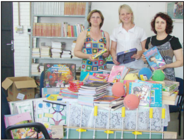
Material beneficiará escolas