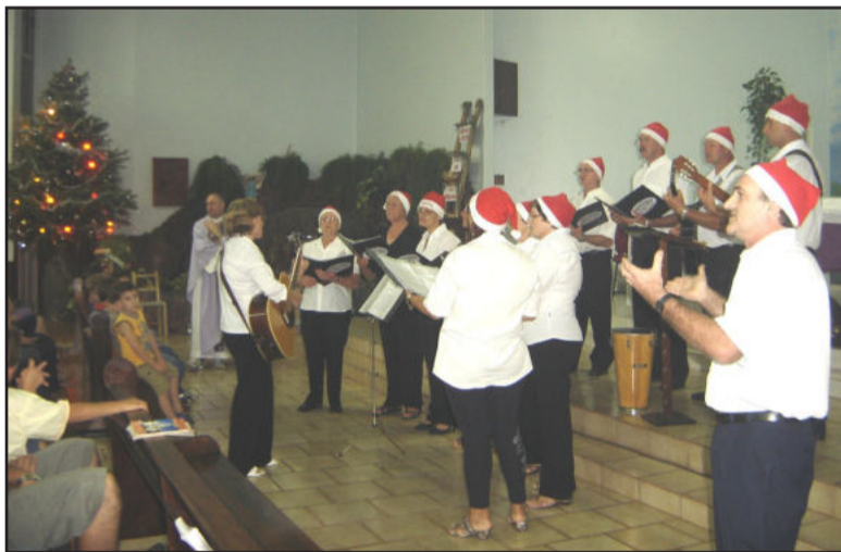
Coral local trouxe canções natalinas