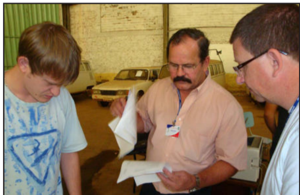
Leilão foi conduzido pela Secretaria da Fazenda