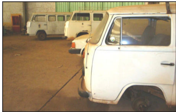
Três kombis foram arrematadas