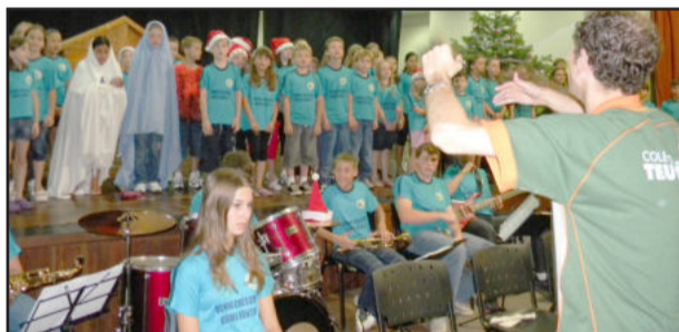
Alunos de diferentes idades apresentaram músicas natalinas