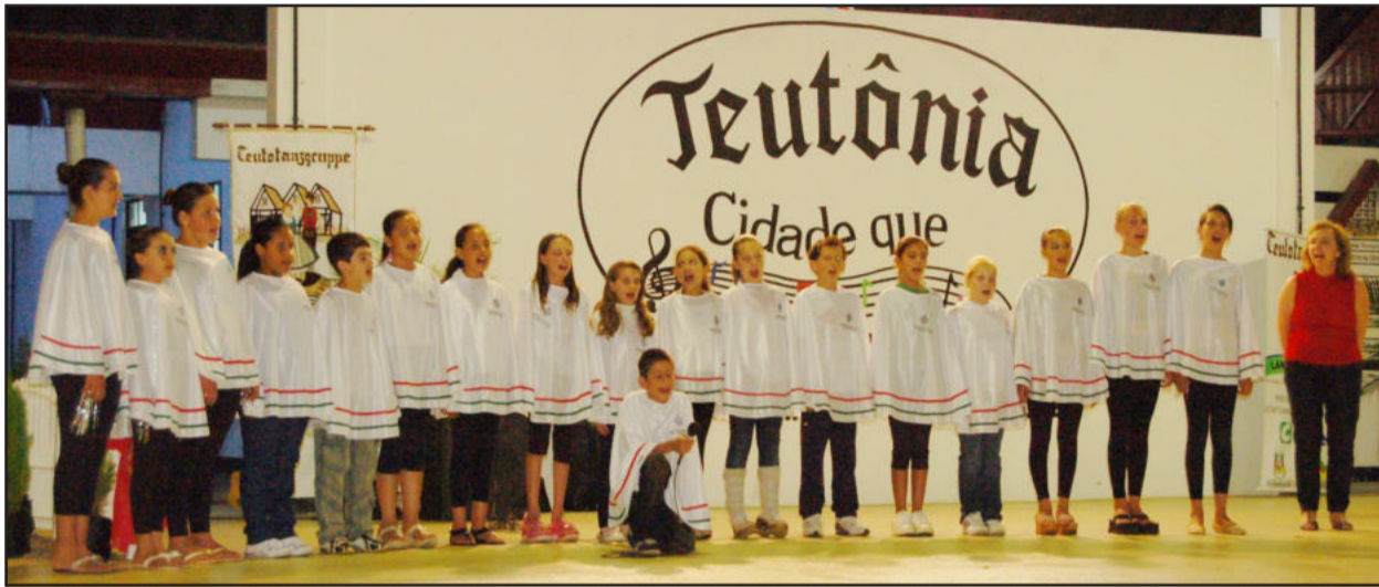
Pequenos Brilhantes da Teobaldo Closs cantaram hinos de Natal

Na noite desta quarta-feira, dia 16, foi realizada a última edição deste ano do "Natal no Centro Administrativo", evento que marcou oficialmente o encerramento dos festejos natalinos por parte da administração municipal. A programação iniciou com um passeio do Turismóvel pelas ruas dos bairros. Depois, no Centro Cívico, ocorreram as apresentações dos talentos locais.