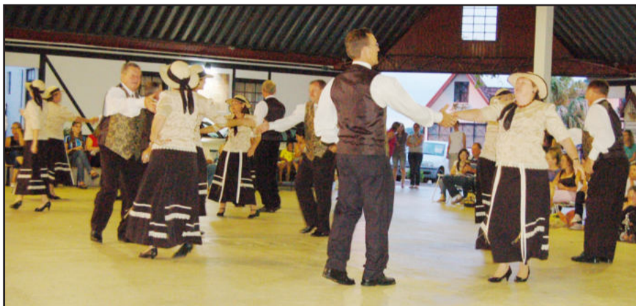
Teutotanzgruppe de Languiru apresentou o folclore alemão

A abertura ocorreu com o Teutotanzgruppe, do Bairro Languiru, que apresentou danças folclóricas alemãs. Os casais mostraram muita disposição e sincronia. Depois foi a vez do Coral dos Pequenos Brilhantes da Escola Municipal Teobaldo Closs, do Bairro Canabarro. Para finalizar, o palco recebeu o Grupo de Danças da Escola Teobaldo Closs. Também houve a sessão de fotos com o Papai Noel e a feira de artesanato.