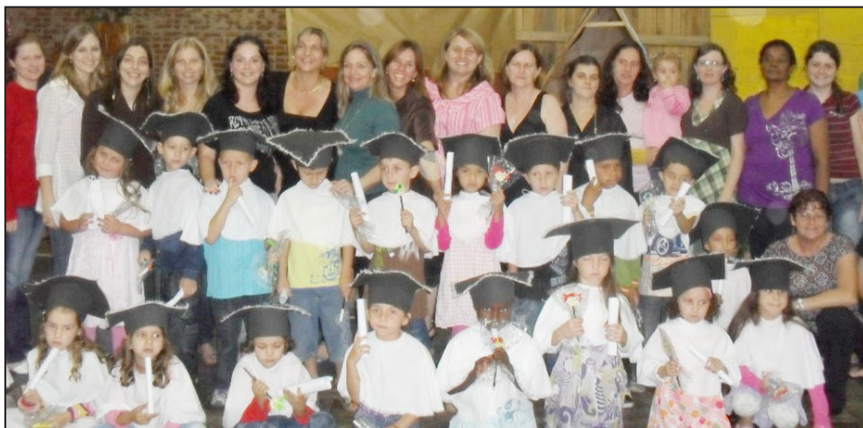
Primeira turma de formandos dos Jardins

Neste ano de 2009 a Escola Municipal de Ensino Fundamental Professora Ruth Markus Huber, localizada no Loteamento Popular IV, completou seus dez anos, desde a data da sua inauguração em 18 de dezembro de 1999.