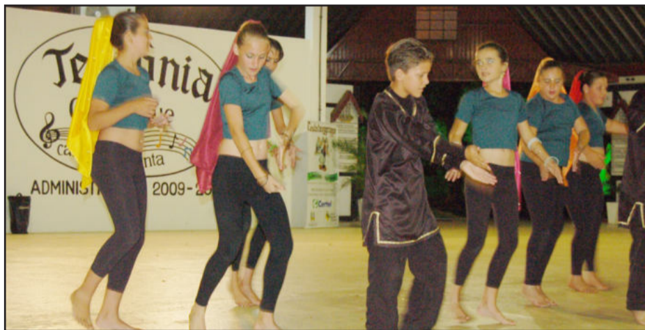
Grupo de Danças da Escola Municipal Teobaldo Closs também se apresentou