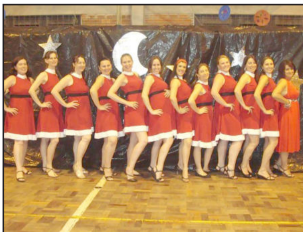
Professoras vestidas de Mamãe Noel

O espetáculo proporcionou aplausos e lágrimas de pais, professores, funcionários, autoridades e comunidade em geral, que saíram desta noite mais felizes, iluminados e acreditando que o Natal é o momento de recomeçar, de voltar atrás e de comemorar o nascimento de Jesus nos corações da humanidade. O Papai Noel veio para encerrar a noite e alegrar os pequenos artistas.