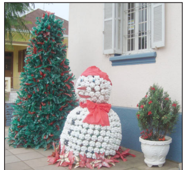
Decoração na Prefeitura