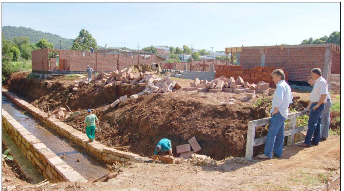
Bairro Canabarro: obras da Escola Infantil Mundo Encantado (fundo) e da galeria para drenagem de córrego