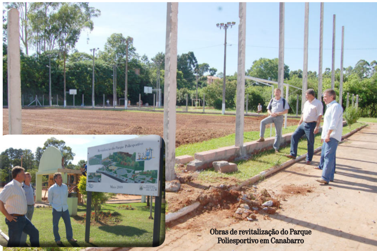
Obras de revitalização do Parque Poliesportivo em Canabarro