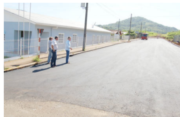
Pavimentação de ruas na Vila Popular

rante o projeto “Teutônia 28 Anos, 28 Ações”. Naquela oportunidade, a administração municipal instalou aparelhos de ginástica ao ar livre, que são bastante utilizados pela população. Agora, vem a segunda etapa, mais ampla e completa, a ser executada pela empresa vencedora da licitação.