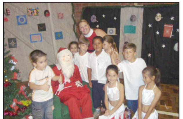
Presença do Papai Noel

emoção e os fogos de artifício explodiram ao ver o anjo Gabriel descer de rapel para anunciar as boas novas.