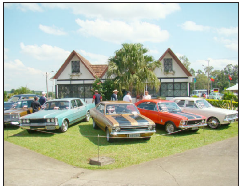
Exposição de veículos é uma das maiores do RS