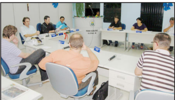
Vereadores elegeram mesa diretora com voto aberto