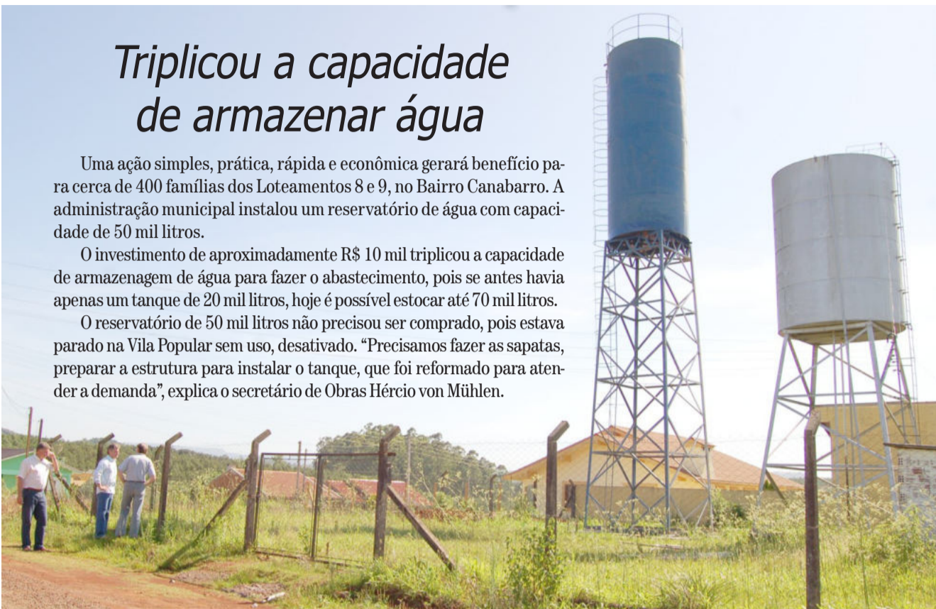
Implantação de caixa de água no Loteamento 8