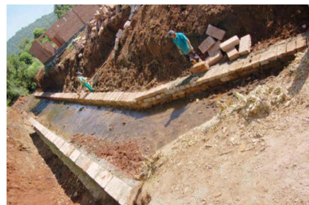
Obras da galeria em Canabarro

Conforme o edital de licitação, a galeria terá 43,81 metros de comprimento por 3,60 metros de largura e 2 metros de altura, totalizando 157,72 metros quadrados. A obra está sendo executada na Rua Edmundo Carlos Bervig, lote 186, no Bairro Canabarro, para canalizar um córrego que passa próximo à creche em edificação. A empresa FRM Construtora Ltda, de Teutônia, apresentou a melhor proposta para realizar a obra da galeria, ao valor de R$ 29.999,56.