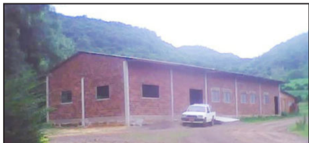
Ampliação foi realizada

A Comunidade de Linha Rosenthal realizará um baile de Natal, no qual será inaugurada a ampliação do pavilhão. O evento será no dia 24 de dezembro, a partir das 23 horas e animação do Musical Integração de Arroio do Meio. A diretoria convida a todos para prestigiar a comemoração, agora com espaço mais amplo para a diversão de todos.