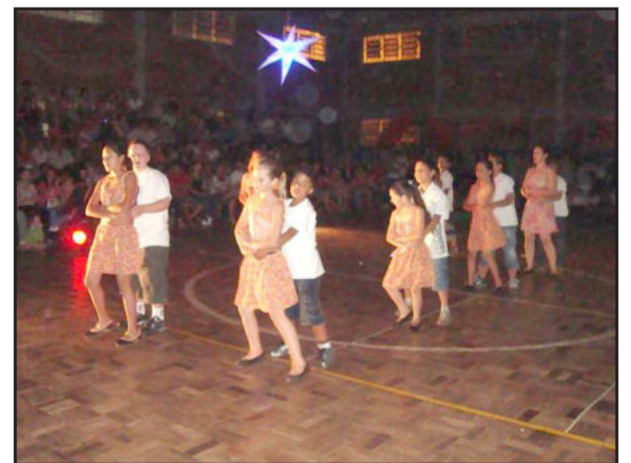
Estrela anunciou a boa-nova