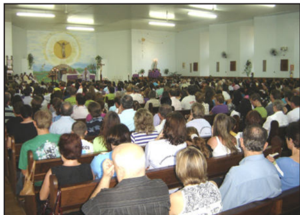
Público lotou a Igreja de Canabarro