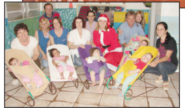
Entrega de pacotinhos às crianças