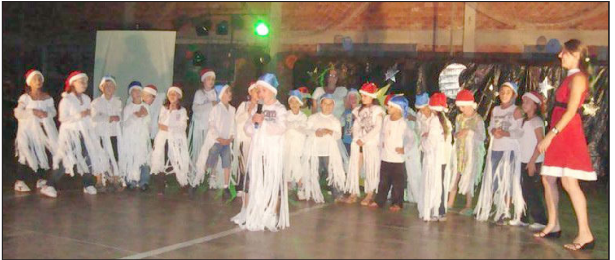
Escola Guilherme Sommer proporcionou noite mágica de Natal para a comunidade da Vila Popular

Quando o sol começou a se esconder e as primeiras estrelas no céu apareceram, a Vila Popular sentia no ar que aquela noite do dia 3 de dezembro seria mais do que especial. Famílias inteiras se direcionaram para o ginásio da Escola Municipal Guilherme Sommer, entusiasmadas e curiosas para entender o porquê de tanta empolgação de seus filhos nas semanas que antecediam o espetáculo. Na chegada, todos já se admiravam com a recepção calorosa das professoras, que aguardavam vestidas de Mamãe Noel.