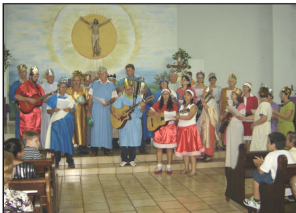
Coral Cristo Rei trouxe o Terno de Reis para o evento