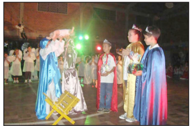
Encenação do nascimento de Jesus

Para encerrar como um grande espetáculo, todos os alunos das séries iniciais dançaram numa sincronia única e ajoelharam para aguardar a entrada do presépio. A estrela no céu do ginásio brilhou e a entrada do menino Jesus foi anunciada pelo coro dos anjos. Mas, a emoção não terminava por aí, nem mesmo a plateia conseguia se recuperar da