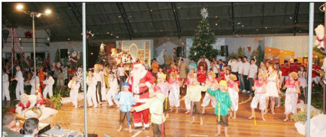
Encenação com apresentação de diversas entidades, grupos e escolas

No último domingo, aconteceu um dos mais belos espetáculos natalinos da região, "O Natal Luz e Vida de Colinas". O ginásio municipal lotou com o público de Colinas e da região, que assistiram atores colinenses encenando, dançando e cantando. A organização foi da Administração Municipal de Colinas.