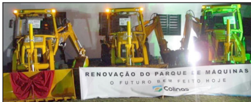
Renovação do parque de máquinas foi exposta