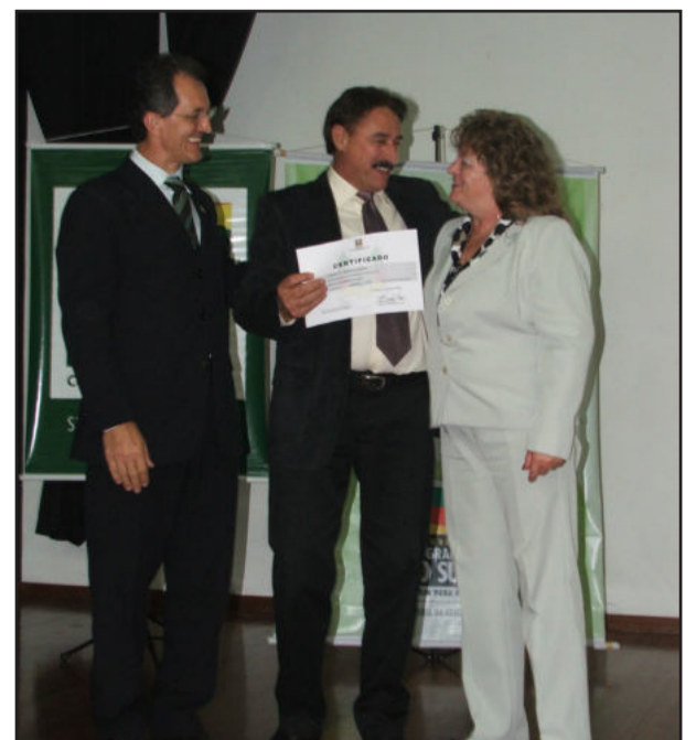
Entrega simbólica das diretoras da 3ª CRE

Os novos diretores, eleitos em outubro desse ano, exercerão um mandato de 2010 a 2012.