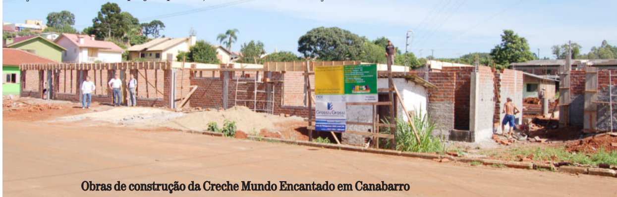
Obras de construção da Creche Mundo Encantado em Canabarro

A estimativa era iniciar a obra mais cedo neste ano, porém o orçamento original da obra ficou totalmente defasado e ultrapassado. No novo levantamento realizado pelo setor de engenharia, o valor subiu bastante e exigiria uma contrapartida elevada do Município, porque a parte federal inicial era de R$ 700 mil. A equipe técnica da administração levou a situação à esfera federal e foram liberados mais R$ 250 mil, o que viabilizou a execução da obra.