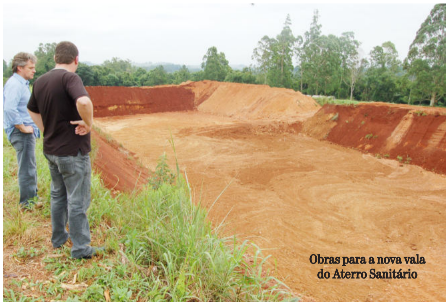
Obras para a nova vala do Aterro Sanitário

Além da nova vala, no Aterro Sanitário já foram promovidas, ao longo de 2009, uma série de melhorias para retomar o correto funcionamento.