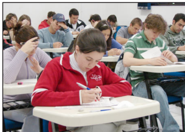
Prova única será das 8h às 13h