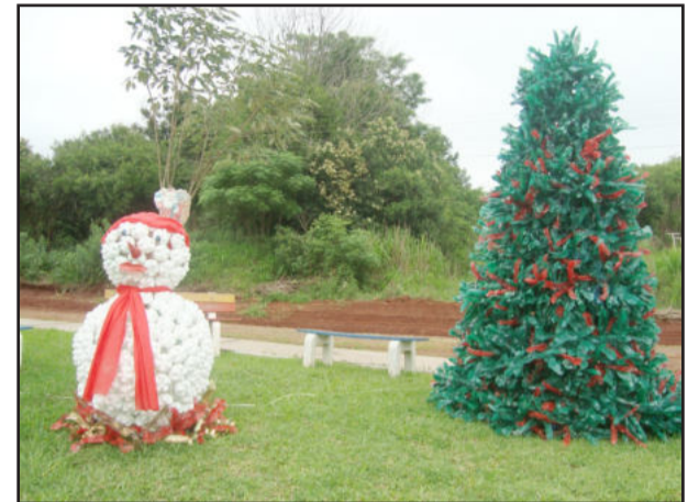
Decoração na Praça Flor de Maio

Quem transita durante a noite pela cidade de Paverama pode desfrutar de uma visão bela e um tanto quanto curiosa. Curiosa, pelo fato de que esta beleza foi proporcionada pelo esforço de alguns moradores da cidade. Em um projeto que contou com a participação de muitos voluntários e voluntárias, foram montados três pinheiros com aproximadamente três mil garrafas pet, sendo que a confecção destes pinheiros ocorreu da seguinte maneira: as garrafas foram cortadas, queimadas e pintadas na cor verde e vermelho.